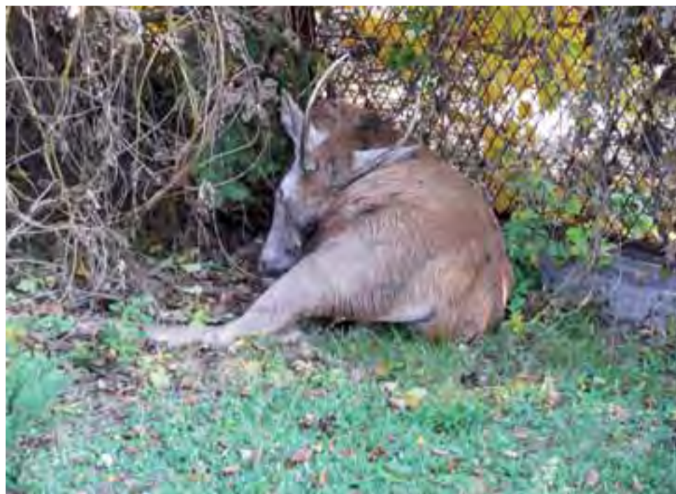
Jeleń po uwolnieniu go z ogrodzenia, na które się nadział, leżał w cieniu krzaków, zanim został uśpiony.

Prawdopodobnie później jeleni skręcił w ul. Browarną, w kierunku ul. Podrzecznej. Tam zestresowane zwierzę chciało najprawdopodobniej uniknąć spotkania z samochodem i podjęło próbę przeskoczenia ogrodzenia zielonego terenu należącego do Zgromadzenia Sióstr od Wspólnej Pracy od Niepokalanej Maryi. – Prawie mu się udało, ale tylna część ciała zahaczyła o ostro zakończone pręty, którymi zwieńczone jest ogrodzenie.