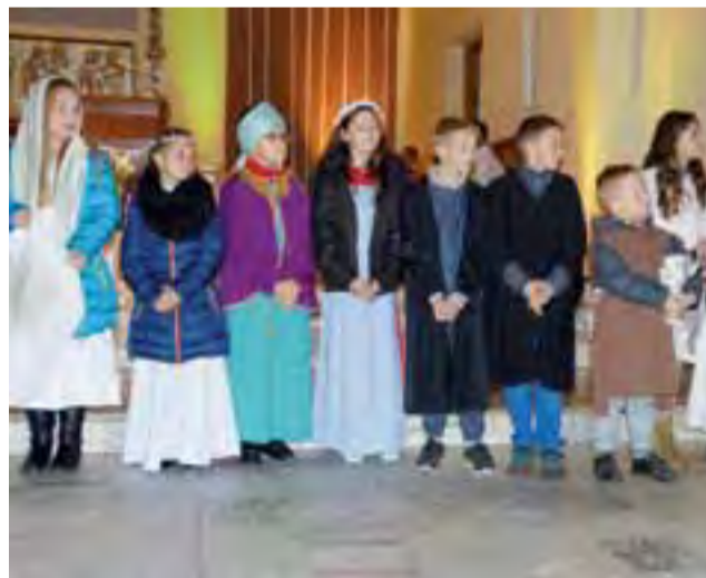
Wiele dzieci z parafii zdecydowało się przebrać za świętych.