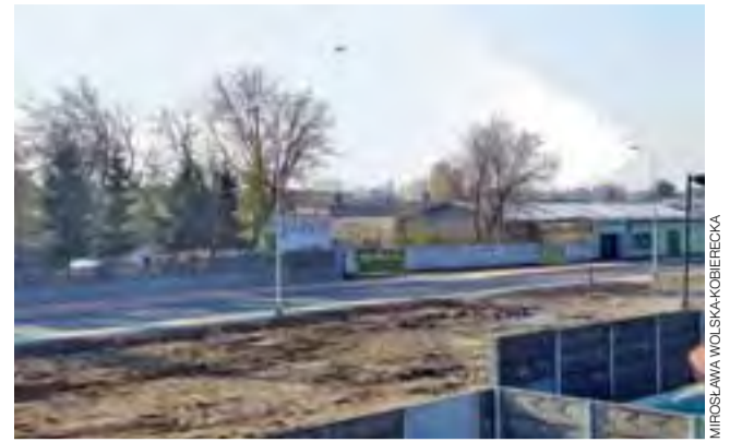
Teren, na którym powstanie nowy zakład położony jest przy nowo powstałej ulicy Piłsudskiego. Tak to wygląda od strony stadionu KS Pelikan.