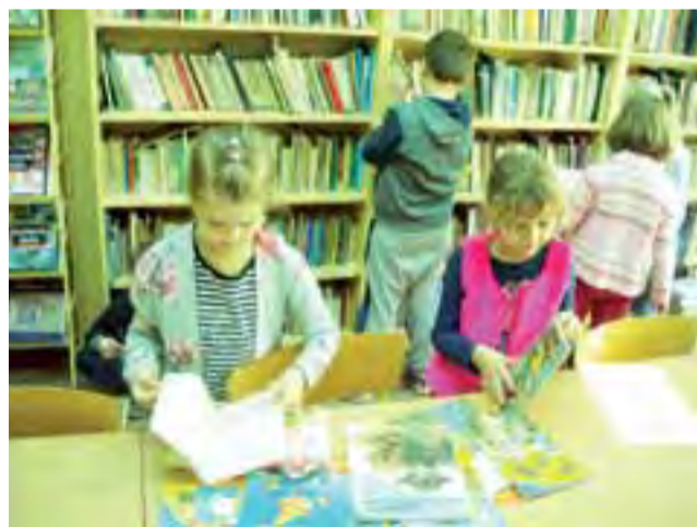
Duży wybór. Uczniowie buszują w zbiorach szkolnej biblioteki.

Mieszkańcy zapowiadają, że złożą do burmistrza Grzegorza Janeczka pismo z prośbą o zajęcie się tą sprawą. kl