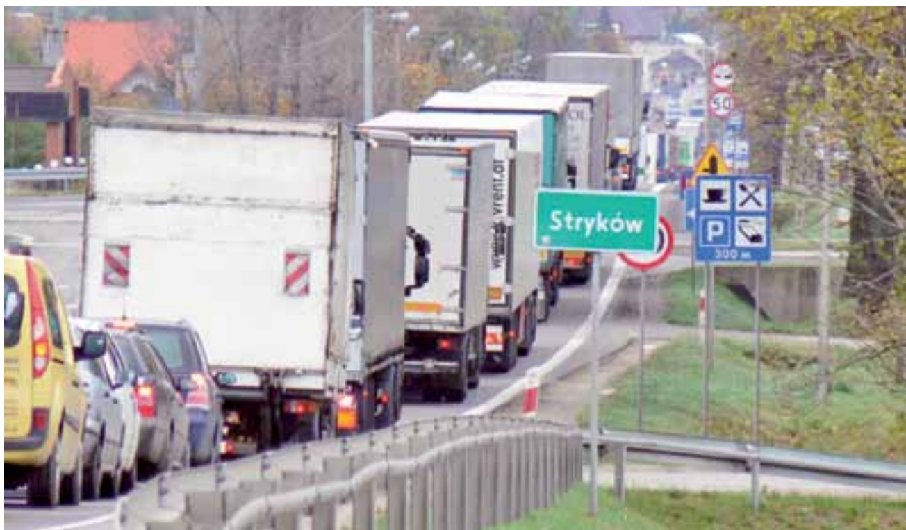
Krajowa czternastka dziś już nie przypuszcza szturmu tirów, tak jak to było przed budową autostrad, co nie zmienia faktu, że emituje do atmosfery najwięcej dwutlenku węgla spośród wszystkich dróg przecinających gminę Stryków.

Bardzo dokładnie przejrzałem ten dokument i jestem przerażony. To nie jest nasza wina, ale prawda o tym małym Eldorado jest taka, że jednej strony napływa do nas dużo pieniędzy z podatków napędzanych przez korzystny układ komunikacyjny, ale z drugiej – jak się okazuje – naszym przekleństwem staje się emisja spalin. Dane mówią same za siebie. To, co wydobywa się z naszych kominów, nie stanowi nawet jednej czwartej tego, co emitują paliwa transportowe. Czternastka jest największym producentem zanieczyszczeń, które wdychamy, więc jakże ważne jest, żeby coś z tą drogą w końcu zrobić. Nie zrobią tego sami mieszkańcy, radni czy burmistrz, ale jako gmina mamy kolejny, mocny argument w rozmowach z GDDKiA. Chyba nikt nie ma wątpliwości, jak bardzo potrzebna jest planowana od dawna obwodnica Strykowa.