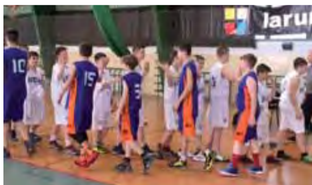
Po końcowym gwizdku koszykarze obu drużyn dziękowali sobie za grę.

■ Następna, 3. kolejka odbędzie się w sobotę, 7 listopada: GTK Głowno – AZS PWSZ II Skierniewice, ŁKS Szkoła Gortata II Łódź – UMKS Książek Łowicz, MKS Ósemka Skierniewice – PKK 99 Pabianice, Start Łódź – Esbank Junak II Radomsko.