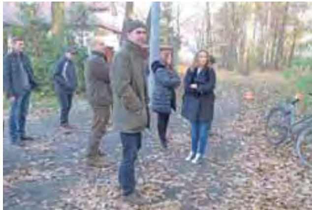
Spotkanie mieszkańców z przedstawicielami Lasów Państwowych.

Przyjazd rozdrabniarki byłyby kilka razy droższy niż uzysk, jaki nadleśnictwo mogłoby mieć ze sprzedanego drewna.