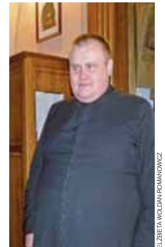
Pomysłodawca katechez biblijnych w katedrze.

To, czy teraz w parafii znajdzie się potencjał do zawiązania takiej grupy, okaże się po zakończeniu rozpoczętego cyklu 25-minutowych konferencji. Będą się one odbywały w kolejne niedziele przed mszą świętą o godzinie 9.00.