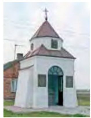
Kapliczka w Julianowie – to przy niej odbędą się uroczystości niepodległościowe w sobotę.

Po uroczystości przy kapliczce spotkanie będzie kontynuowane w nieborowskiej szkole. Placówce tuż przed wybuchem II wojny światowej nadano imię 5 PPL. Tam KGW w Nieborowa i Julianowa poczęstuje grochówką, będzie można usłyszeć także historię potyczki, która miała miejsce w Julianowie i obejrzeć