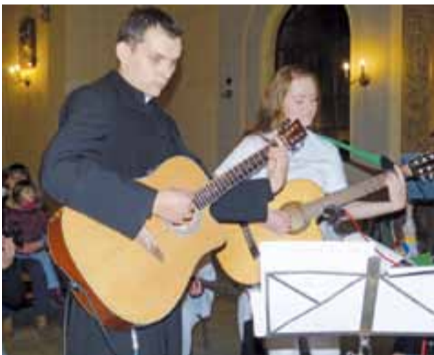
Gitarowe dźwięki w wykonaniu chóru zachęcały do uwielbienia Boga.

Dzieci z parafii licznie odpowiedziały na apel, aby przebrać się za wybranych świętych. Najpopularniejsze okazały się stroje św. Józefa i Maryi, ale i aniołów, św. Wiktorii, Agaty, św. Franciszka i Jerzego. Pojawił się też św. Mikołaj.