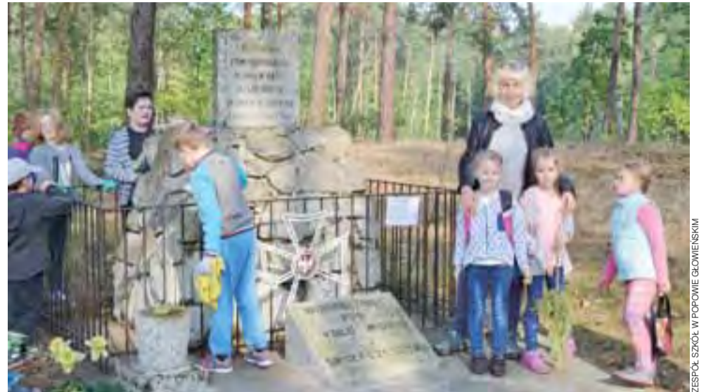
Porządki przy pomniku. Uczniowie wzięli na siebie obowiązek dbania o porządek w tym miejscu, by uczcić pamięć zamordowanych w 1944 r. mieszkańców miasta i gminy Głowno.