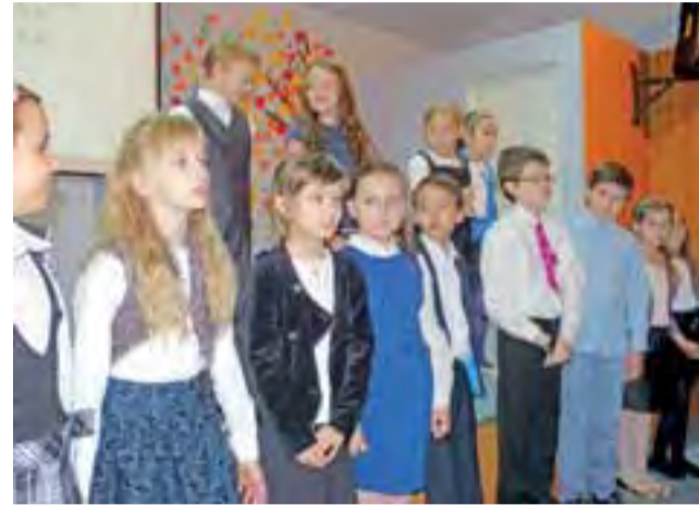
Tegoroczne pierwszaki jeszcze przed koncertem, podczas ślubowania.

– Musisz przyrzec, że bez przerwy będziesz dbał o pani nerwy, będziesz uczył się starannie, zachowywał nienagannie. Gdy umowa taka stanie, to jest właśnie, to