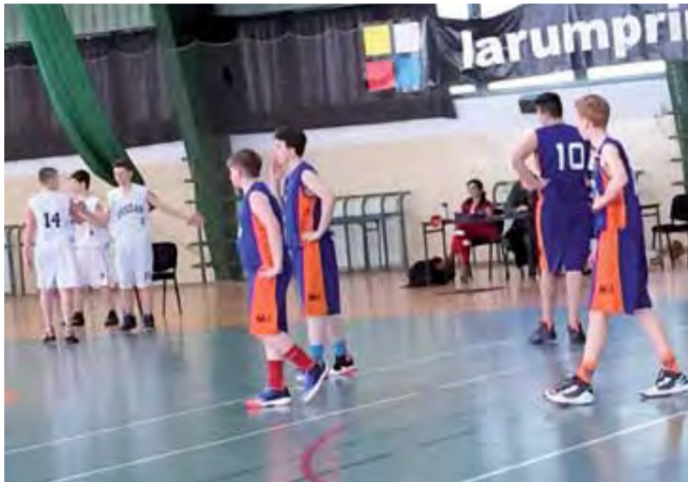
Koszykarze GTK Głowno (granatowo-pomarańczowe stroje) nie byli w stanie zatrzymać rówieśników z Łowicza, choć żadnemu z głównian nie można odmówić woli walki i zaangażowania.

■ 1. kolejka: Start Łódź – UMKS Książek Łowicz 61:92, AZS PWSZ II Skierniewice – Esbank Junak II Radomsko 89:21, MKS Ósemka Skierniewice – ŁKS Szkoła Gortata II Łódź 42:76, GTK Głowno – PKK 99 Pabianice 16:100.