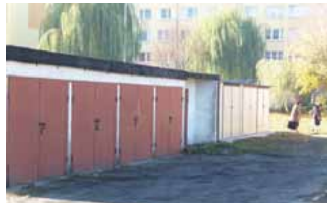
Na podjęciu uchwały skorzystać będą mogli m.in. dzierżawcy garaży.

Urzednicy dokonali więc podziału nieruchomości przy ul. Kopernika 21 na mniejsze działki, określili również granice służebności gruntowych, zapewniających zabudowanym działkom dostęp do dróg publicznych – ulic Słowackiego i Kopernika. Nieruchomości będzie można nabyć w trybie bezprzetargowym. Zainteresowani kupnem będą musieli