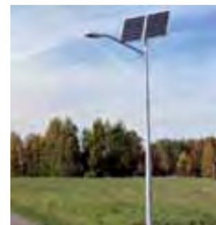
Pierwsza latarnia słoneczna w Bielawach.

Po tym pełnym atrakcji dniu dzieci z pewnością dowiedziały się więcej o ziemniaku i cebuli. ■