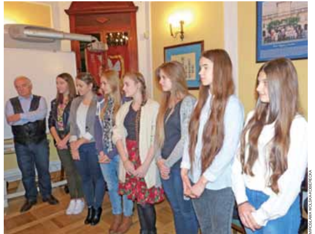
Uroczyste podziękowanie dla najstarszych tancerek zespołu.