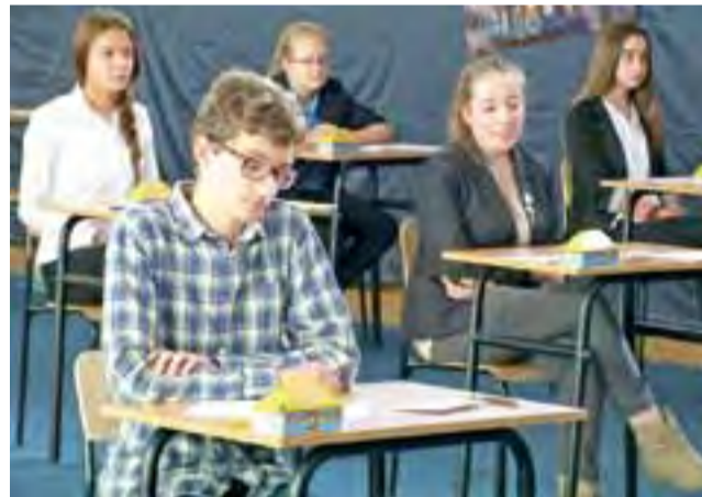
Ostatnie minuty przed rozpoczęciem pisania finałowych arkuszy. Ci, którym poszło dobrze, mogą teraz niecierpliwie czekać na wyniki.

Ogłoszenie wyników konkursu i wręczenie nagród nastąpi 20 listopada w nowym gmachu Wydziału Filologicznego UŁ przy ul. Pomorskiej w Łodzi. Nagrodą za I miejsce będzie laptop, a za drugie tablet. tm