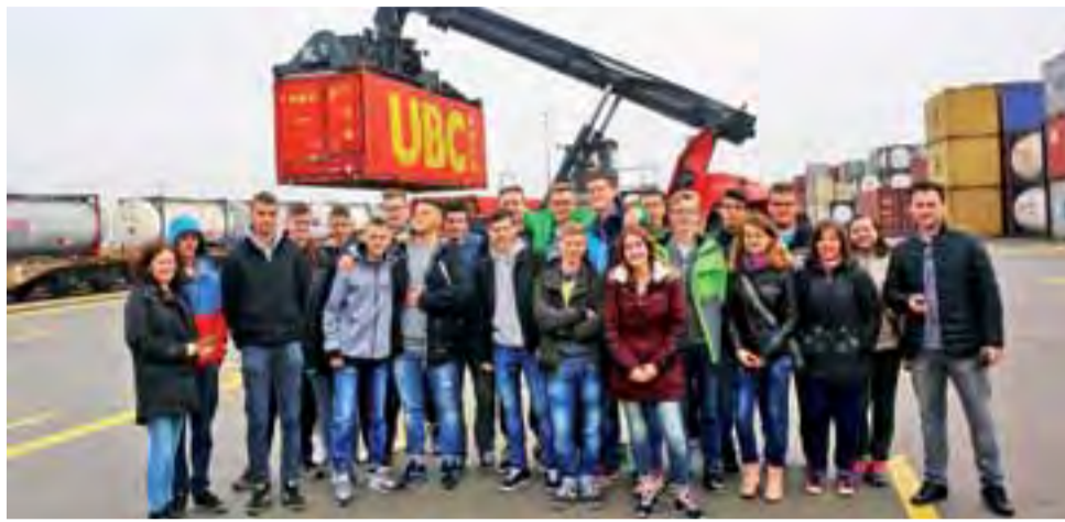
Uczniowie zwiedzili terminal kontenerowy oraz centrum logistyczne firmy Nijhof-Wassink w Kutnie.

Przyszli spedytorzy zostali zapoznani z organizacją pracy terminala kontenerowego. Zobaczyli strefy przeładunków kolejowych, pracy suwnic bramowych, składowania kontenerów (w tym także