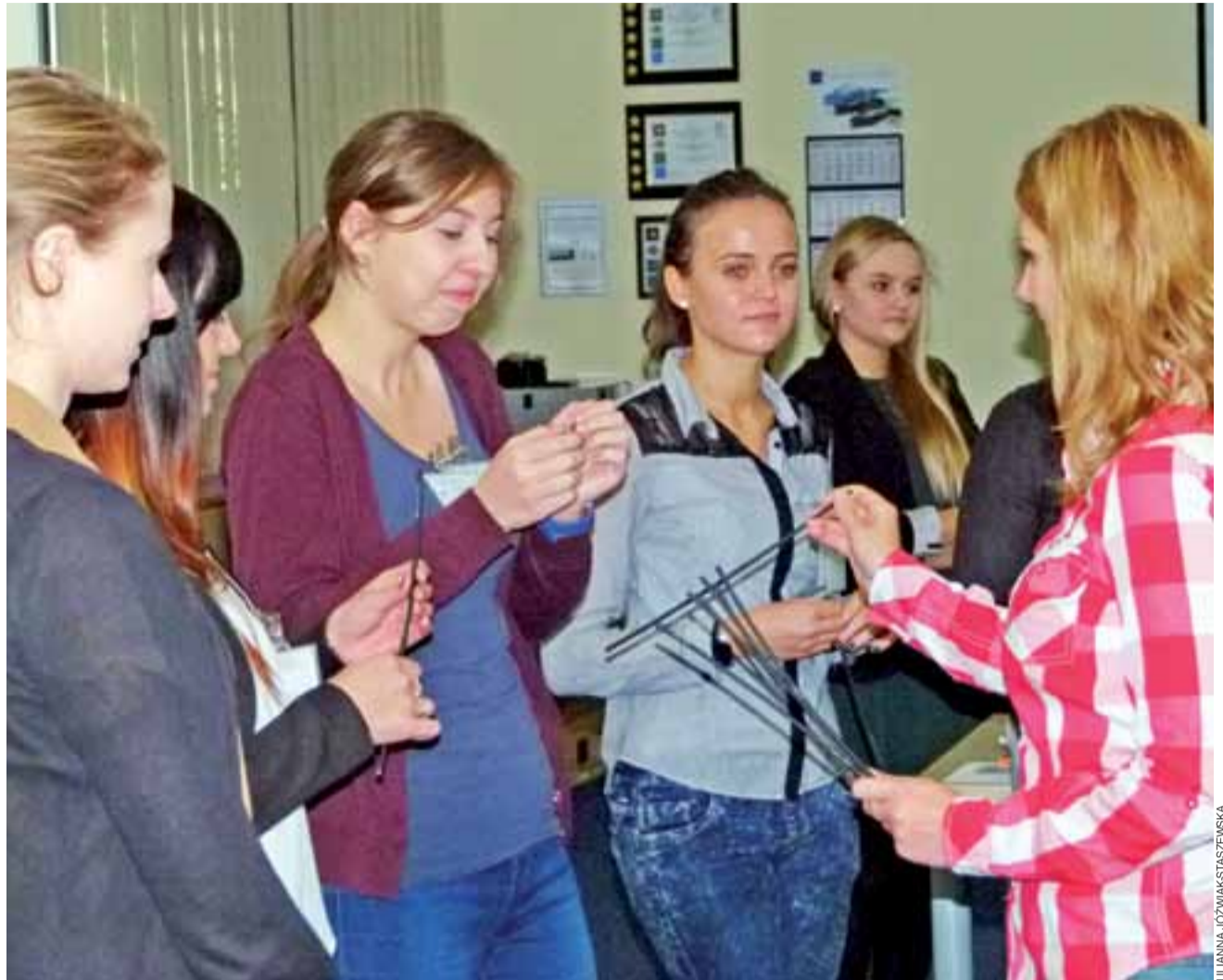
Zadaniem przyszłych inżynierek było rozplątanie się z węzła stworzonego poprzez połączenie ich rąk niewielkimi odcinkami kabla.

– Takie zadania są zawsze bardzo wartościowe, bo w ich trak-