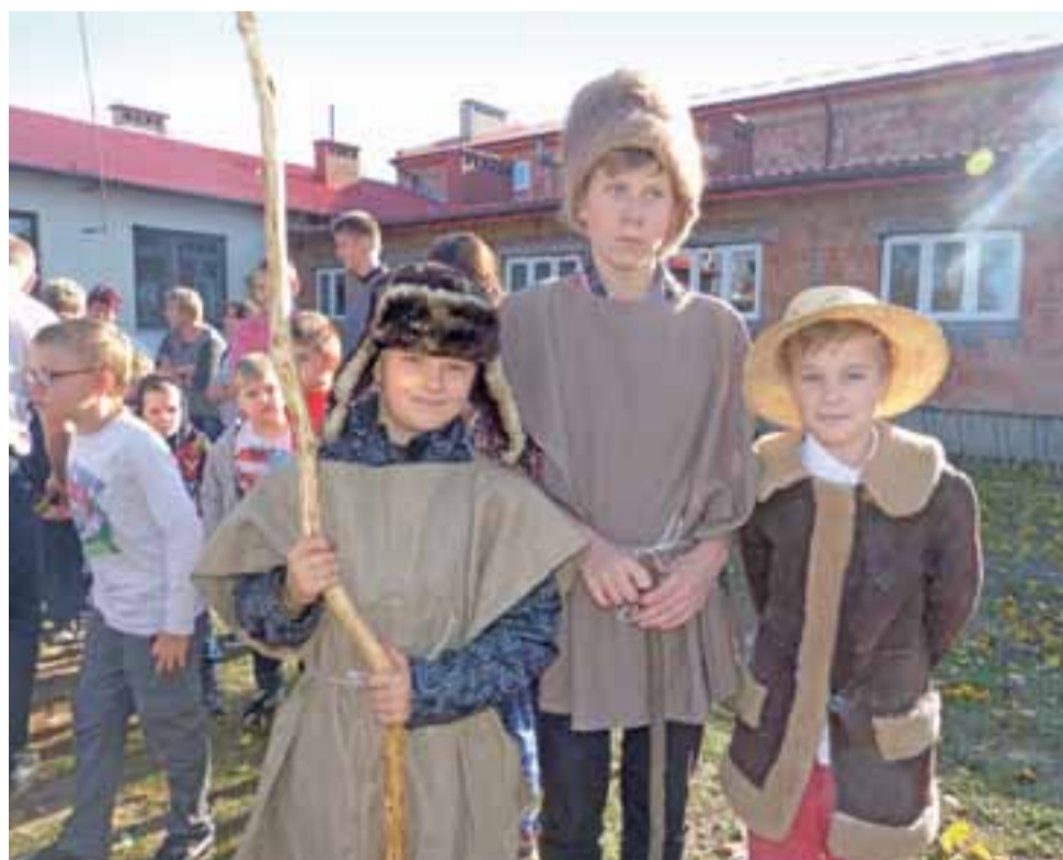
Uczniowie wcielający się w rolę chłopów zaprosili do kosztowania pieczonych ziemniaków z ogniska.

Wiele emocji wywołał konkurs wiedzy, w którym wzięli udział gospodarze i uczniowie zaproszonych szkół. Quiz składał się z 44 pytań, na które odpowiedzi udzielały 3-osobowe zespoły. W jakim rejonie Polski na ziemniaki mówi się grule, skąd najprawdopodobniej pochodzi cebula, jak głęboko sięga system korzeniowy cebuli – to tylko przykładowe z nich. Jak widać,