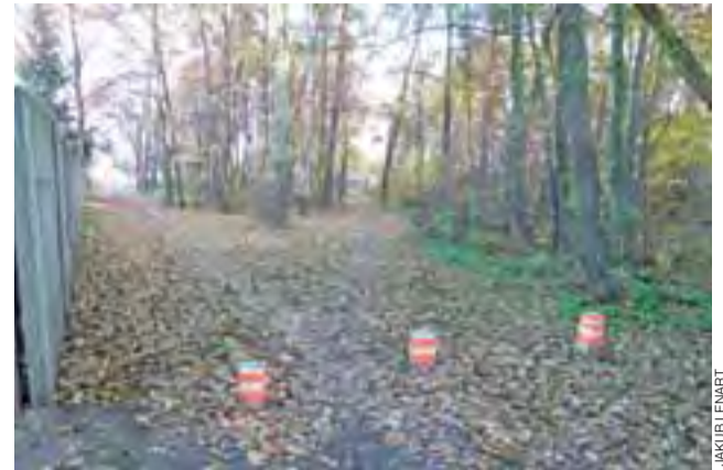
Mieszkańcom nie podoba się postawienie słupków.

Drugą z kwestii podejmowanych przez mieszkańców było zablokowanie słupkami wjazdu na drogę łączącą ulicę 18 Stycznia z Zabrzeżniańską. Kilku dziesięciometrowy odcinek od lat był wykorzystywany przez mieszkające tu osoby jako skrót umożliwiający zaoszczędzenie sporej ilości czasu i drogi. Obecni na spotkaniu podkreślali także, że na tym odcinku pojawia się również policja, która mogła np. sprawdzać i sprawdzała, czy np. nikt nie pije alkoholu za pobliskim sklepem.