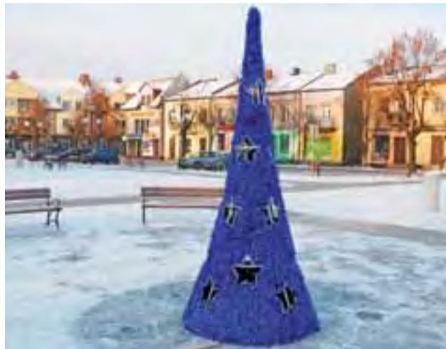
Niebieska choinka w tym roku ma zostać zastąpiona bombką.

Charakterystyczna metalowa konstrukcja w kształcie choinki pokryta niebieskim sreberkiem pojawiła się po raz pierwszy na Placu Wolności w grudniu 2012 roku. Choć nie była może imponująca, to z włączonym oświetleniem wyglądała