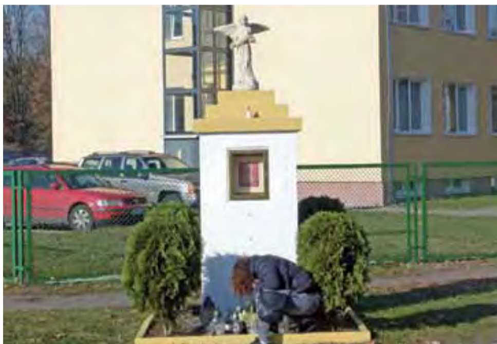
Tak prezentuje się kapliczka po odnowieniu.