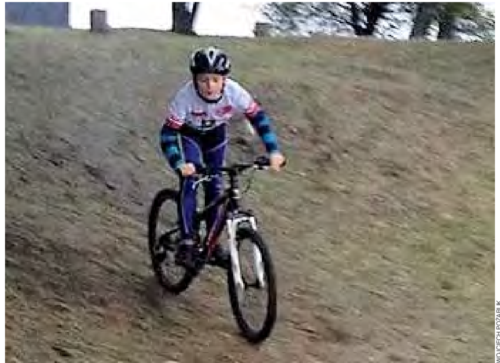
Młodzi zawodnicy ze Szkółki Kolarskiej Strykowa także planują na sportowo uczcić Dzień Niepodległości.