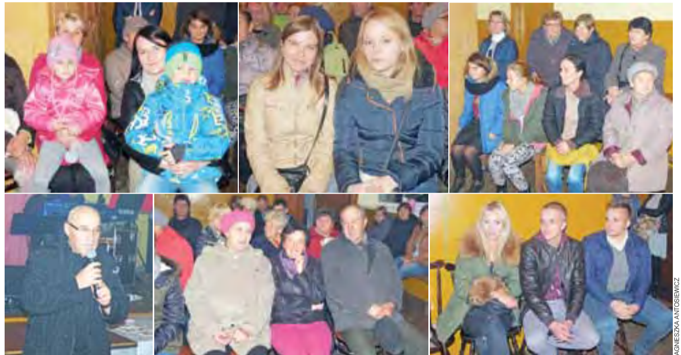
Wiele osób: przyjaciół, znajomych i mieszkańców okolicznych miejscowości przybyło na koncert w Domu Ludowym w Kadzielinie.