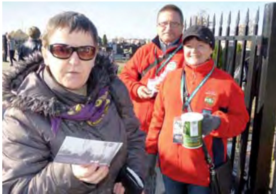
Osoby, które zechciały wesprzeć akcję, wrzucając choćby niewielką sumę do puszek, otrzymywały od kwestarzy pocztówkę z informacją o akcji PTTK.

Akcja cieszyła się sporym zainteresowaniem przechodniów. – Co roku wspieramy ratowanie zabytkowych grobów. Już kiedy wybieramy się na cmentarz, przy-