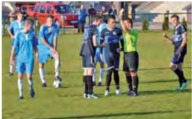
W meczu Stali z Polonią sędzia często musiał sięgać do kieszonki. W całym spotkaniu arbiter w sumie pokazał aż 15 kartek.

Był to jedyny moment, w którym goście mieli powody do radości, bowiem później na boisku cieszyli się już tylko głownianie.