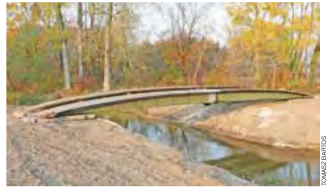
W czasie umacniania skarpy Skierniewki starą kładkę dla pieszych i rowerzystów zdemontowano i zastąpiono mobilnym wojskowym mostem.

W czasie demontażu kładki okazała się w bardzo złym stanie technicznym, nie dającym szans na jej ponowne zamontowanie. Dlatego przedsiębiorstwo znalazło inne rozwiązanie w postaci wojskowego tymczasowego mostu przeprawowego BLG 67, który przewożony był na podwoziu czołgu T-55A. Kwasigroch powiedział nam, że dwa przęsła mostu, które już łączą brzoziński park, zostaną tam na dłużej. Pomiedzy nimi zostanie położona nawierzchnia z desek, zamontowane zostaną także barierki oraz bramki gwarantujące, że nikt nie wejdzie na przeprawę samochodem. tb