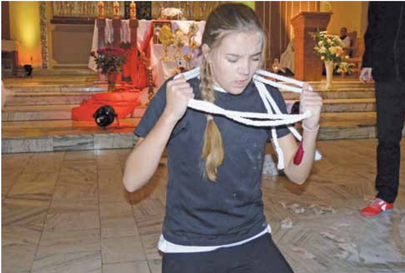
W pantomimie członkowie wspólnoty Emmanuel zaprezentowali walkę sił dobra i zła o duszę człowieka. W tle można zobaczyć relikwiarze ustawione w sercu świątyni, czyli tuż przed ołtarzem.

Modlitwne czuwanie w kościele na Bratkowicach odby-