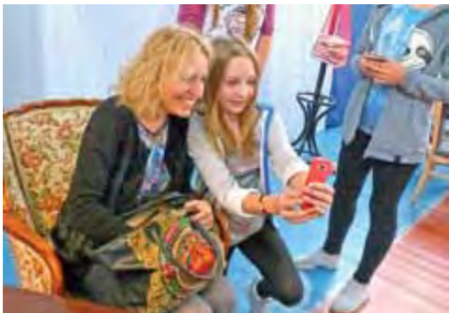
Uczniowie i uczennice bardzo chętnie robili sobie selfie z pisarką.

Pisarka spotkała się z uczniami, by opowiedzieć o swojej pracy, która jednocześnie jest największą pasją, o owocach tej pracy, jakimi są książki, które wydaje od 1997 roku, ale też aby porozmawiać na wiele innych tematów, nie tylko związanych bezpośrednio z literaturą. Nie było to zresztą typowe spotkanie autorskie, gdzie tylko publiczność zadaje autorce pytania, a raczej rozmowa, w której te role momentami się odwracały – pisarka też zaskakiwała uczniów pytaniami, na przykład o ich ulubionych youtuberów. Co ciekawe,