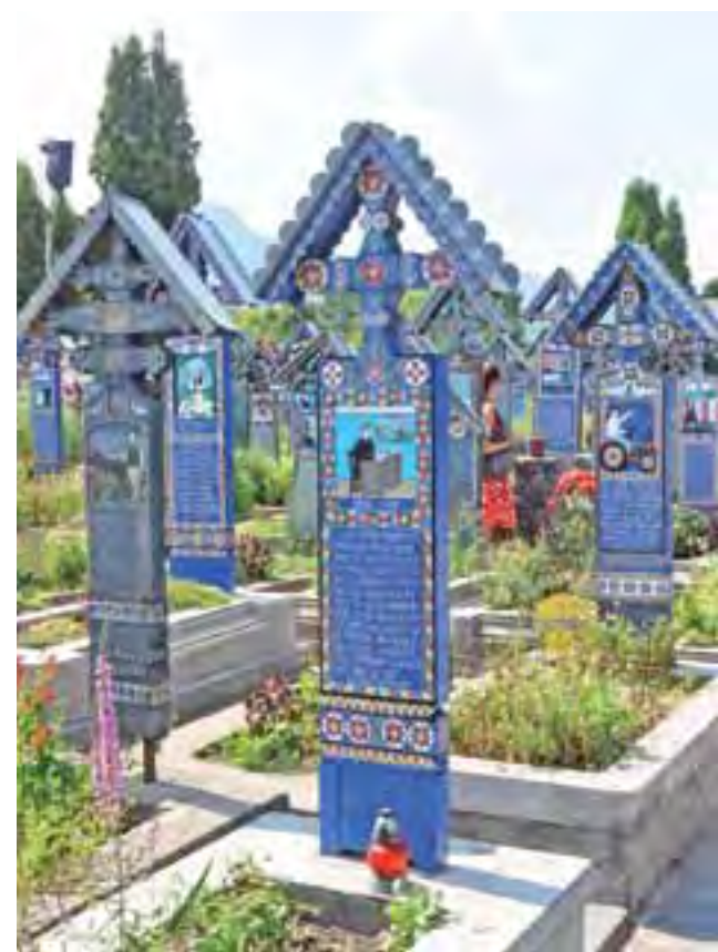
Wesoły Cmentarz w Rumunii.