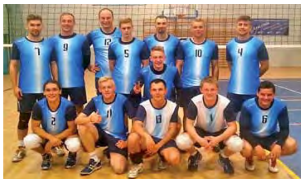
Siatkarze BKS Bratoszewice z roku na rok stają się coraz silniejszą drużyną, ale wciąż szukają wzmocnień.

W pierwszym secie walka była dość wyrównana, ale przewagę mieli bratoszewiczanie. BKS wygrał do 22 i chyba zbyt szybko pomyślał, że teraz będzie tylko łatwiej. W dwóch kolejnych partiach to Gostynin dyktował warunki gry i wyszedł na prowadzenie 2:1. W czwartym se-