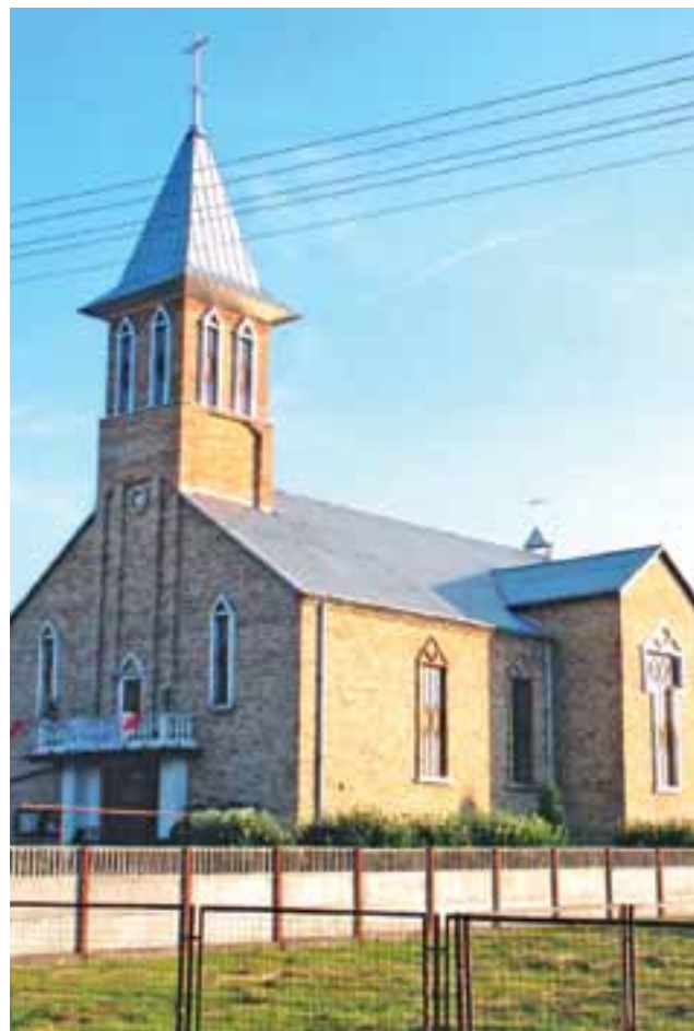
Kościół św. Stanisława Męczennika Parafii Stachlew pod wezwaniem Matki Bożej Jasnogórskiej, rok 1999.