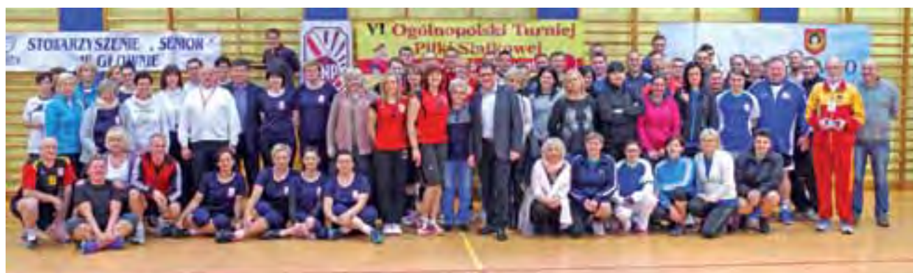
Szczęśliwe twarze uczestników VI Turnieju Oświaty w Głownie.

Turniej w każdej z kategorii odbywał się systemem każdy z każdym. Na starcie pojawiło się 6 zespołów damskich i 4 męskie z województw łódzkiego i mazowieckiego. Na parkietach głowieńskiej hali podczas sobotniej rywalizacji przebywało w sumie