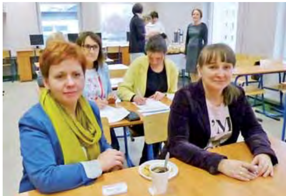
Przed rozpoczęciem zajęć, uczestnicy mogli posilić się kawą i przekąskami, gwarantowanymi przez organizatorów.