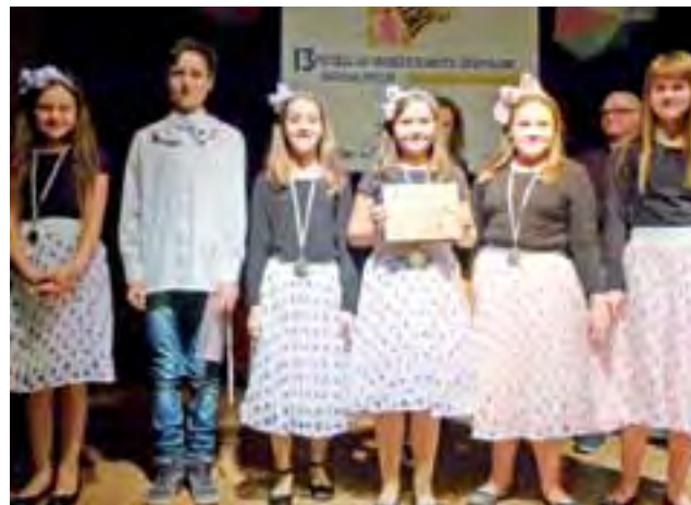
Zespół Sposób na Nudę ze Zgierza.