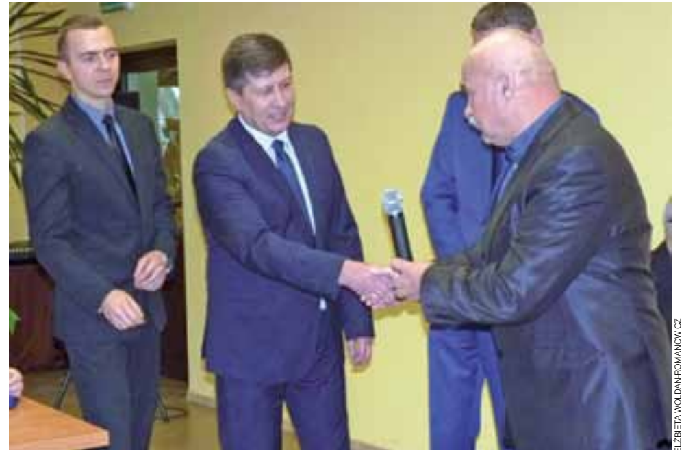
Podziękowanie za schetynówkę. Ten gest był powodem niezapowiedzianej, lecz miłej wizyty wójty Głowna na sesji Rady Gminy Głowno w Bronisławowie 19 listopada.

Dzięki tej inwestycji, miasto wzbogaciło się w tym roku o nowe chodniki wzdłuż powiatowych ulic Zgierskiej i Swobody oraz nową nawierzchnię jezdni i nowe chodniki na Zabrzeźniańskiej i Łowickiej. Zadanie realizowała gmina Głowno w poro-