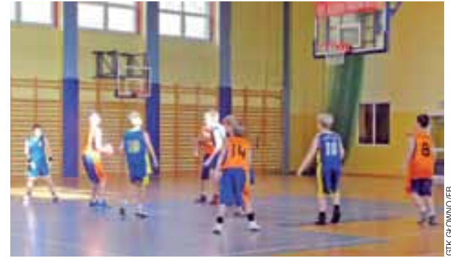
Młodzi GTK Głowno (pomarańczowe koszulki) atakują kosz rywali.

Niedzielny pojedynek, 22 listopada mógł być dla koszykarzy z Głowna przełomowy. GTK do tej pory nie wygrało żadnego