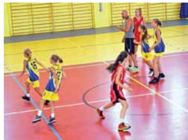
Młode koszykarki TK Basket Stryków (żółto-niebieskie stroje) zbierają doświadczenie na arenach wojewódzkich.

Po sześciu kolejkach TK Basket Stryków zajmuje ostatnie miejsce w tabeli, ale ma tyle samo punktów, co czwarty UKS Orlik.