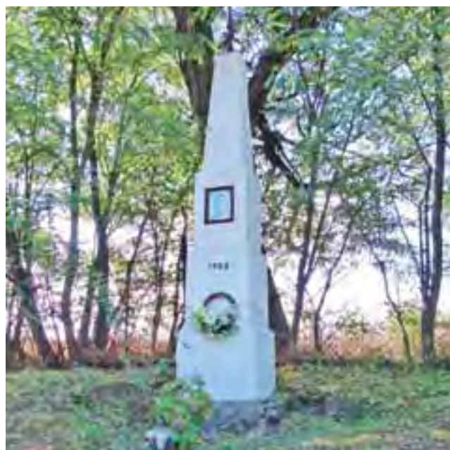
Skromna kapliczka w Osinach liczy sobie już 107 lat.