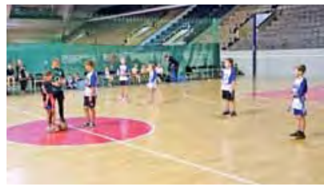
Drużyna Bratoszewic (biało-niebieskie stroje) tuż przed gwizdkiem.

wic zaprezentowali się wspaniale i po ambitnej walce zajęli wysokie 3. miejsce wśród klas IV-tych. Warto przy tym dodać,