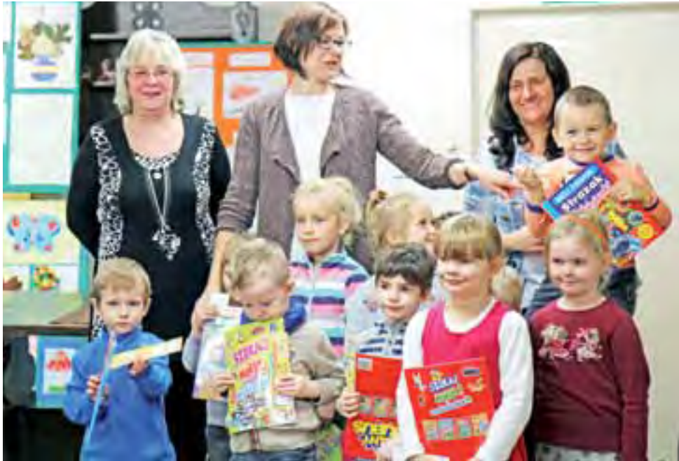
Z nagród w przeglądzie najbardziej cieszyli się najmłodsi uczestnicy.

Na gminny przegląd wpłynęło łącznie 146 prac wykonanych przez 139 dzieci i młodzieży z gminy Kiernozia. Komisja postanowiła przyznać wspomniane 50 nagród i wyróżnień w pięciu kategoriach wiekowych: grupa przedszkolna, klasy I-II, klasy III-IV, klasy V-VI i klasy gimnazjal-