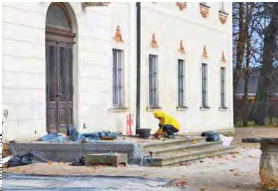
Południowy taras pałacu nieborowskiego po remoncie będzie ponownie służył turystom i gościom muzeum.