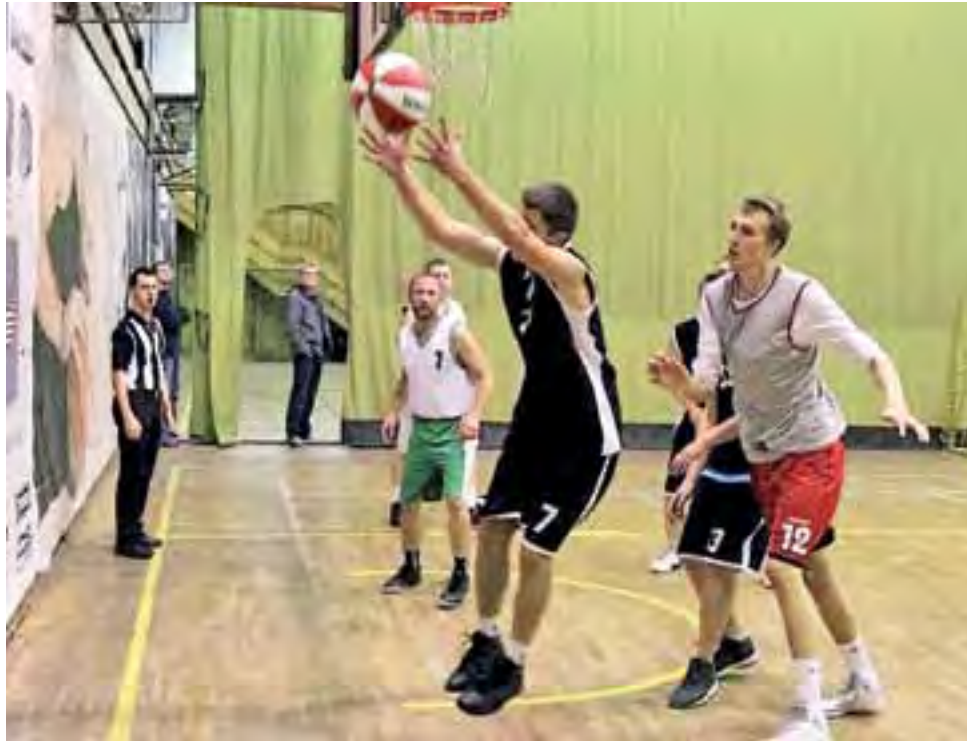
Drużyna BKS Lalalilo (czarne stroje) tym razem bez zwycięstwa.

Początek spotkania należał do BKS. Widać było dużą jakość w grze koszykarzy Bratoszewic, którzy nie przez przypadek nie przegrali jeszcze żadnego meczu i byli kilka pozycji wyżej od Dipol.tv. Gracze Lalalilo rzucali z odpowiednią dla siebie skutecznością, ale co najważniejsze skutecznie powstrzymywali rywali