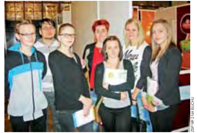
Uczniowie Blichu w czasie spaceru po stoiskach targów w PKiN.

Podczas zwiedzania młodzież obejrzała bardzo ciekawe dekoracje potraw, które powstały z udziałem produktów mleczarskich, a także zbierała ulotki, przepisy gastronomiczne i broszury. – Zgromadzone materiały stanowią cenne pomoce dydaktyczne, które zostaną wykorzystane na zajęciach z gastronomii, technologii kierunkowych, zajęciach praktycznych – mówi Sumiński. tb