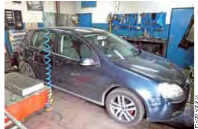
BMW w oczekiwaniu na badanie techniczne w V-Tec Tuning.