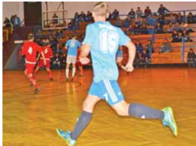
Drużyna Błękitnych Dmosin (czerwone koszulki) była bardzo blisko pokonania łowickich graczy Zatorza ZU-AN.

Niestety Błękitni nie utrzymali korzystnego rezultatu do końca, mimo że na 2 min. przed