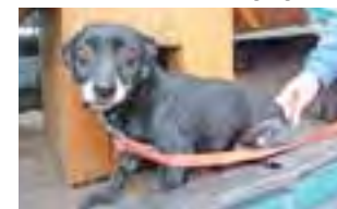
Ostatnia z bud, podarowanych podczas poprzedniej akcji, trafiła do Polesia. Jej mieszkańcem został pies o imieniu Kruczek.