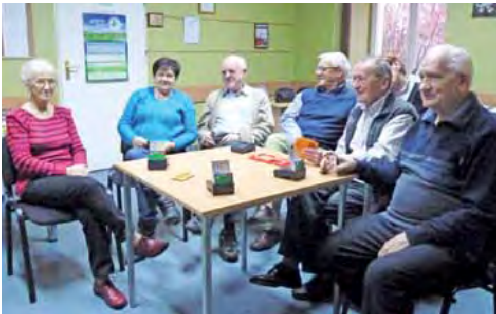
Członkowie kółka brydżowego przed rozpoczęciem gry.