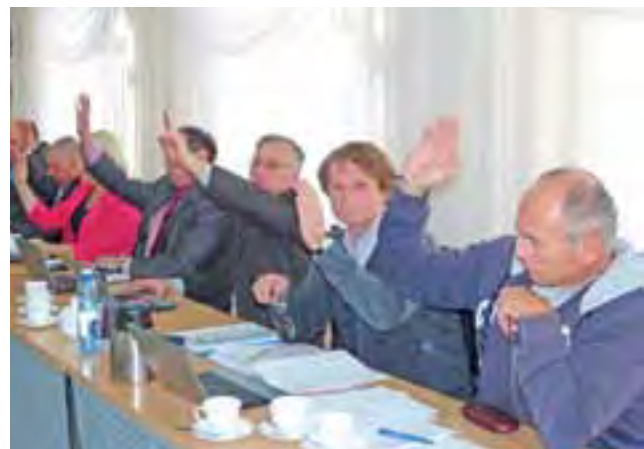
Większość nowych stawek podatków przeszła jednogłośnie, bo też nie było o co się spierać. Rewolucyjnych podwyżek nie będzie.