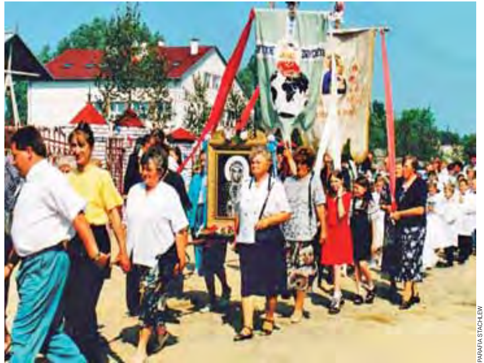
Procesja Bożego Ciała do nowo wybudowanej świątyni, rok 1997.

Parafia Stachlew | O historii młodego kościoła i parafii pisze Darek Barto