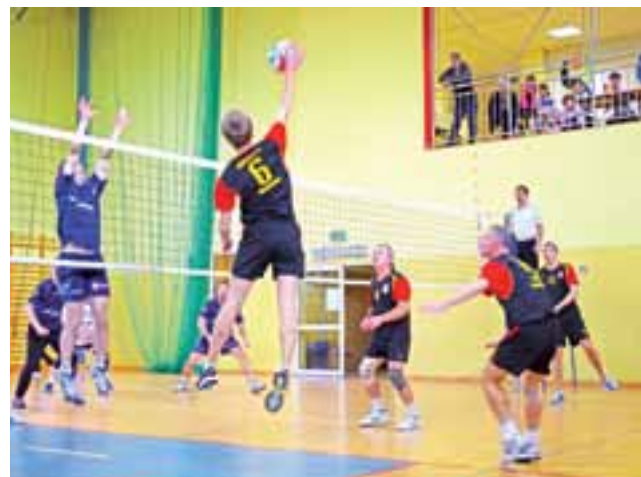
Siatkarze ekipy Głowno II atakują w meczu przeciwko graczom Ozorkowa. Niestety gospodarze przegrali.