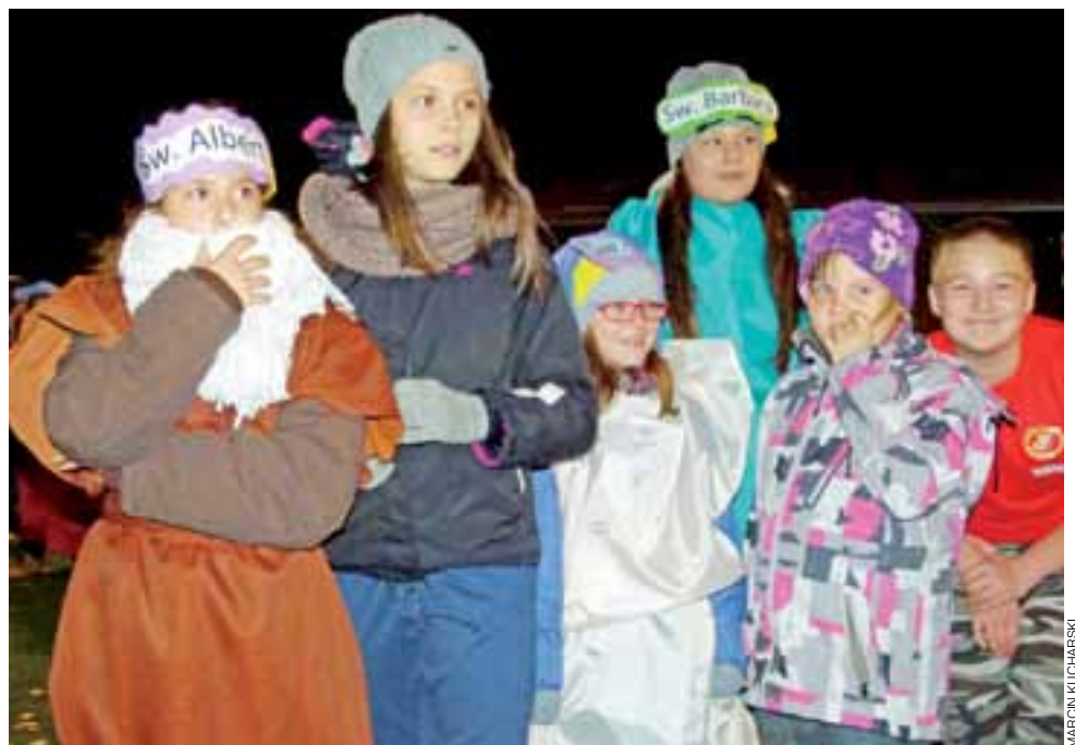
„Święci”, choć zmarznięci, bywają też uśmiechnięci.