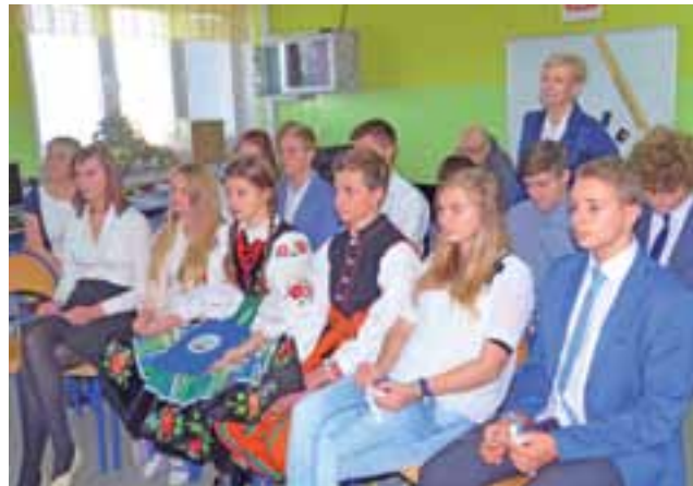
Białe koszule, marynarki i stroje folkowe. Młodzież z Popowa na rozmowę z ambasadorem ubrała się tak, jak na ważną uroczystość.