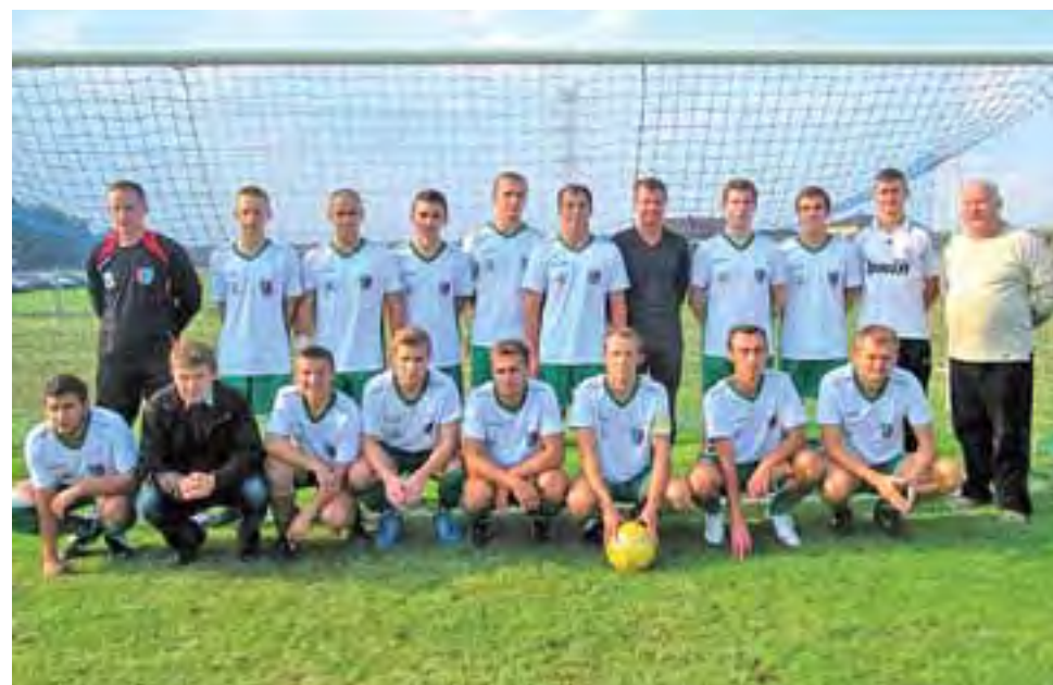
Drużyna Błękitnych Dmosin mierzy w tym sezonie bardzo wysoko. Celem jest awans do klasy okręgowej.

Wiosna w gr. II A-klasy zapowiada się zatem pasjonująco, bowiem do walki włączają się zapewne także Zjednoczeni II Stryków, którzy zajmują w tabeli 5.