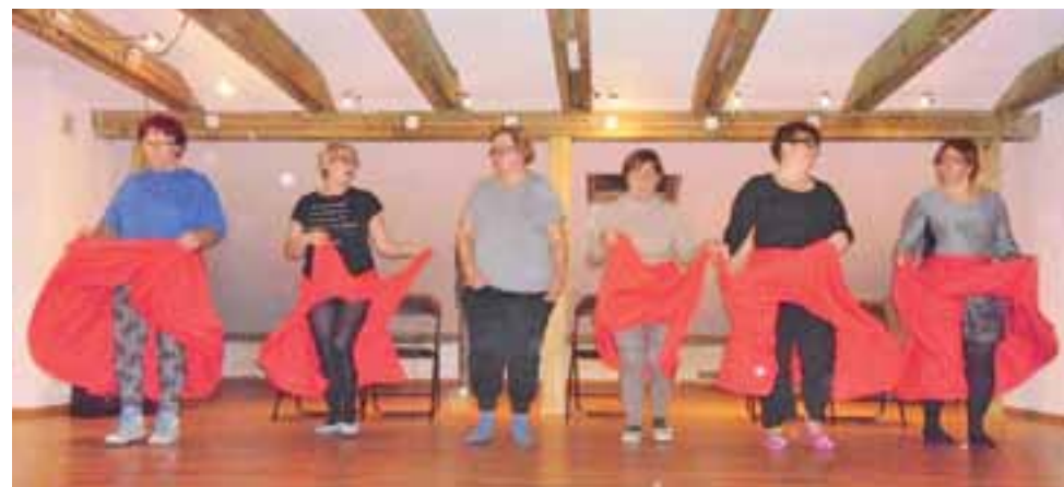
Próby przed spektaklem tanecznym seniorów.

Choreografię na potrzeby tańczących senierek przygotowały