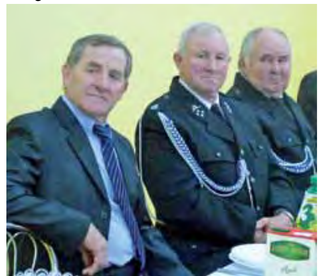
Druhowie przy stole. Dzień Strażaka Seniora to okazja do spotkaniu z dawno niewidzianymi znajomymi z braci strażackiej.

Niespodzianką dla strażaków przygotowały „Fajne babki”, czyli