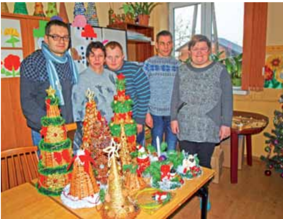
Uczestnicy WTZ w Parmie przy świątecznych artykułach, które jeszcze zostały po kiermaszach.

Zapraszamy do obejrzenia galerii zdjęć na stronie www.lowiczanie.info