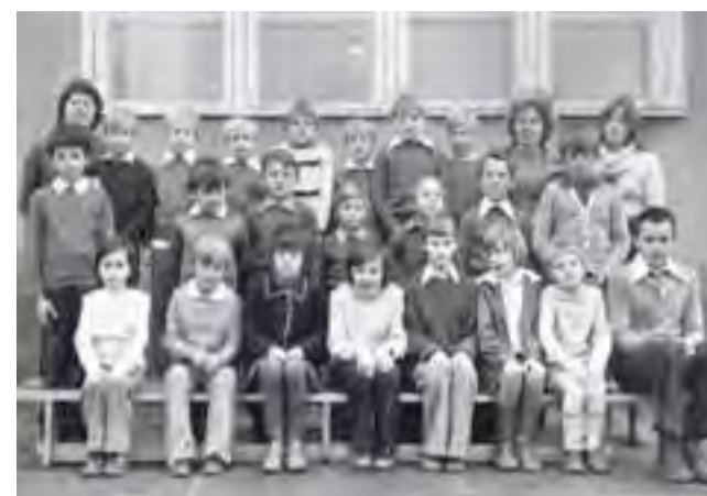
Pierwsza grupa wychowanków SOSW (wiosna 1976 r.).

Po dwóch latach w placówce odbywa się kolejna reorganizacja: nie są już przyjmowane dzieci z gimnazjum i placówka zostaje tylko przy II etapie edukacji – klasach IV–VI szkoły podstawowej. Zmiana ustawy o systemie oświaty powoduje, że we wrześniu 2006 roku placówka, uchwałą Rady Powiatu Łowickiego, zostaje przekształcona w Młodzieżowy Ośrodek Socjoterapii. Do Kiernozi trafiają dzieci zagrożone niedostosowaniem społecznym, w dalszym ciągu na podstawie postanowie-