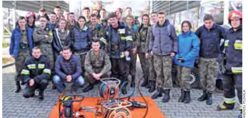
Uczniowie i strażacy na wspólnym zdjęciu , a przed nimi sprzęt, z którego działaniem klasa mundurowa zapoznała się podczas wyjazdu do Sieradza.

Możliwości szkoleniowe sieradzkiego ośrodka licealiści poznali m.in. w komorze dymowej i komorze rozgorzeniowej. Ta pierwsza to labirynt przejść, ciasnych przesmyków, włazów czy zasuw, które należy znaleźć i otworzyć, aby móc iść dalej. Uczniowie pokonali ją w środowisku bezdymnym, ale za to w zupełnych ciemnościach. Druga z komór pozwala przekonać się na własne oczy, jak rozprzestrzenia się pożar w mieszkaniu, obejmując jego poszczególne pomieszczenia oraz wyposażenie. W sieradzkim ośrodku klasa mundurowa zobaczyła również pokaz ratownictwa drogowego i poruszania się w pomieszczeniu przy palącym się suficie. Szkole-