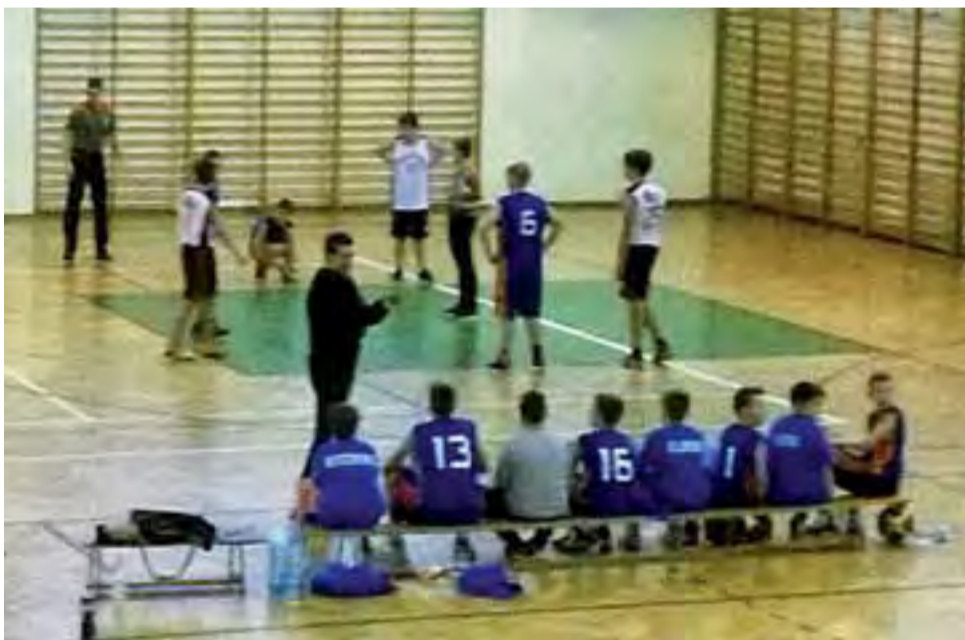
Koszykarze GTK Głowno (niebieskie stroje) w paszczy lwa. Drużyna MKS Ósemki ze Skierniewic to mistrz województwa łódzkiego U-12 w sezonie 2014/2015.

Mimo porażki koszykarze GTK mogą być z siebie zadowoleni, w końcu zwycięstwo było