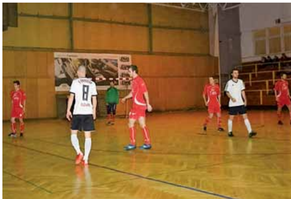
Gracze Fantazji Głowno (białe koszulki) zadziwiająco łatwo poradzi sobie z piłkarzami Błękitnych Dmosin.

Do przerwy jeszcze jedno trafienie dołożył Michał Gamla i Fantazja prowadziła już 3:0, w zasadzie kończąc marzenia Błękitnych o korzystnym wyniku w derbowym pojedynku. W dru-