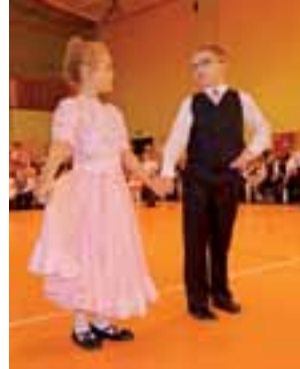
Grunt do dobre wejście na parkiet , wiedzą o tym nawet najmłodszy tancerze.

wych jest bardzo silna. W Anilanie mamy grupę dorosłą składającą się z aż 47 osób, skompletowaną