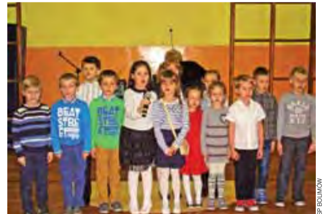
W czasie pikniku bożonarodzeniowego program artystyczny zaprezentowali uczniowie bolimowskiej szkoły.

Piknikowi towarzyszył też kiermasz rękodzieła uczniów szkoły. Biorący udział w impre-