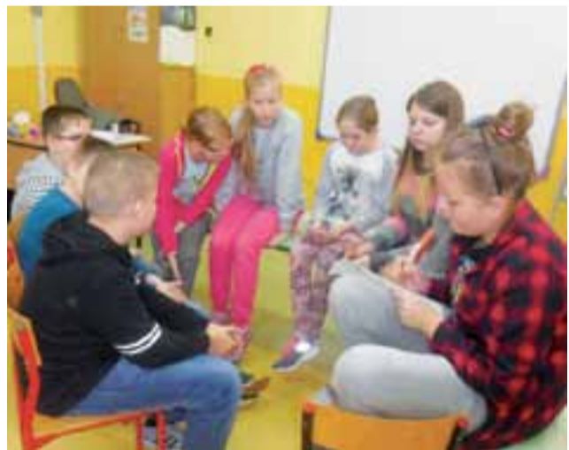
W warsztatach poświęconym zjawiskom agresji i przemocy szkolnej uczestniczyli uczniowie klas V i VI. Zajęcia trwały blisko 2 godziny.

Wcześniej, w listopadzie, odbyły się warsztaty na temat współczesnych zagrożeń, m.in. dopalaczy, nie tylko dla uczniów, ale również dla rodziców. Finansowanie obydwu wzięły na siebie gmina oraz Gminna Komisja Rozwiązywania Problemów Alkoholowych. ljs