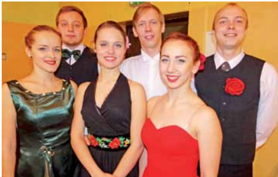
Reprezentacja łódzkiego Zespołu Pieśni i Tańca Anilana wystartowała w najstarszej kategorii wiekowej.

Od kujawiaka do krakowiaka Zawodnicy prezentowali się w 5 kategoriach wiekowych, od 5 do 30 lat, tańcząc żywawego krakowiaka, powolnego kujawiaka, najszybszego z możliwych oberka i siarczystego mazura, a najmłodszy – również polkę, która nie należy do polskich tańców narodowych. Poczucie rytmu, estetyka wykonania wszystkich figur, strój, dobór kroków i figur do umiejętności oraz wieku, w końcu ogólny wyraz artystyczny – to elementy, od których oceny zależało, kto wyjedzie z turnieju z medalem i pucharem.