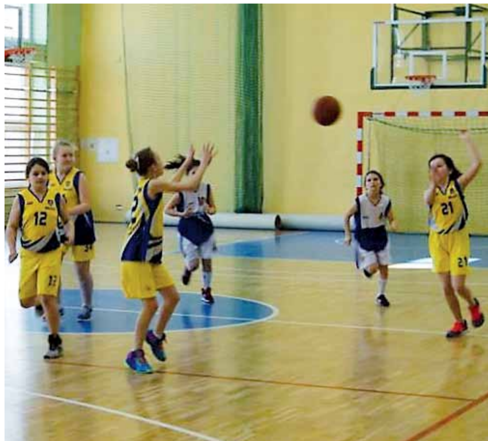
Koszykarki TK Basket Stryków (żółto-niebieskie stroje) musiały mocno pracować, by wyżej notowany zespół z Pabianic nie miał w meczu zbyt lekko.

■ Następna, 10. kolejka odbędzie się w niedzielę, 20 grudnia: TK Basket Stryków – Alles Basket Głowno, UKS II Basket Aleksandrów Ł. – Grot II Pabianice, KKS Pro-Basket Kutno – UKS Orlik Ujazd, Ósemka Skierniewice – pauza.