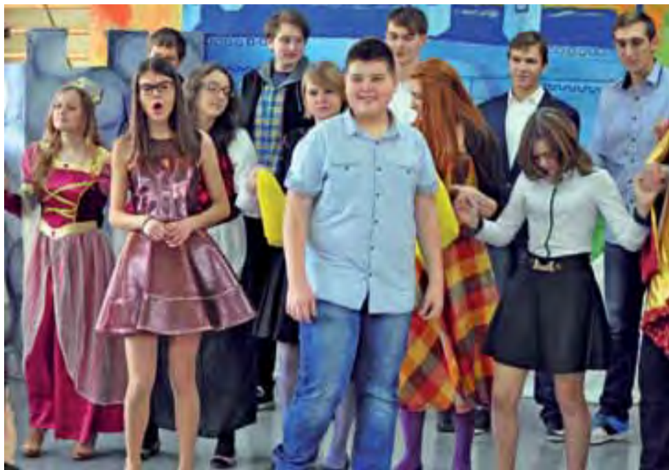
Uczniowie klasy III A z Kiernozi przygotowali świetne przedstawienie.