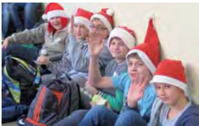
ZESPÓŁ SZKÓŁ W LUBIANKOWIE

To był dzień bez odpytywania. Już w piątek, 4 grudnia, uczniów Zespołu Szkół w Lubiankowie odwiedził Mikołaj w asyście uroczych pomocniczek. Goście zajrzeli do każdej klasy, rozdając słodkie upominki przedszkolakom, uczniom szkoły podstawowej oraz gimnazjalistom. Tego dnia nikt nie odpytywał uczniów, nie było kartkówki ani sprawdzianów. oprac. ewr