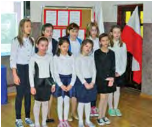
Uczniowie z Mastek jak co roku oddali hołd patronowi, który w tej miejscowości został rozstrzelany przez hitlerowców za walkę o wyzwolenie ojczyzny.