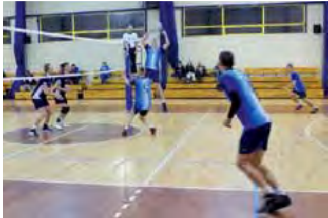
Siatkarze BKS Bratoszewice tym razem nie byli tak skuteczni w ataku.

Drużyna Bratoszewickiego Klubu Sportowego nie odstawała znacznie od rywali. Momentami wydawało się nawet, że to siatkarze Bratoszewic prowadzą grę, a rywale starają się dostosować poziomem. Niestety w końcówkach dwóch pierwszych setów ekipa Bzury wykazywała się większą konsekwencją, co dało jej prowadzenie 2:0. W trzecim secie rywale grali już na większym luzie, a siatkarze Bratoszewic dali chyba za wygraną, przegrywając ostatecznie do 20 i całe spotkanie 0:3. Mimo porażki BKS utrzymał 3. miejsce w tabeli I Ligi KALS, ale ma już dużą stratę do poprzedzających GKS Góra i Gladiatora Parzęczew. Warto dodać, że z rozgrywek wycofał się Gostynin Team, a do końca sezonu drużyny dotrzeć muszą w mniejszym składzie. Kolejne spotkanie siatkarzy Bratoszewic zaplanowano dopiero na przyszły rok. W niedzielę, 10 stycznia BKS zmierzy się z wiceliderem z Parzęczewa, a ten