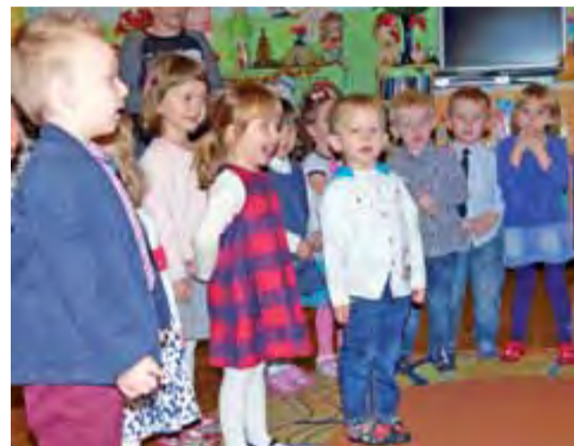
„Mam trzy latka, trzy i pół...” Dzieci z najmłodszej grupy Miejskiego Przedszkola Nr 3 w Głownie recytują wiersz.