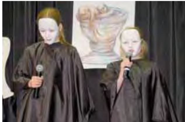
Dzieci ze SP w Bąkowie wystąpiły w czarnych pelerynach i białych maskach. Tak odebrały ofiary alkoholu.