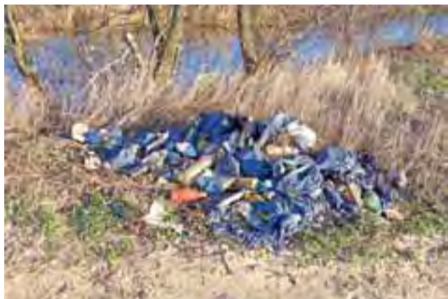
Śmieci pozostawione w okolicach mostu w Klewkwie to przede wszystkim butelki: plastikowe i szklane.

Po jasełkach odbędzie się kiermasz świąteczny ozdób bożonarodzeniowych przygotowanych przez uczniów. mak