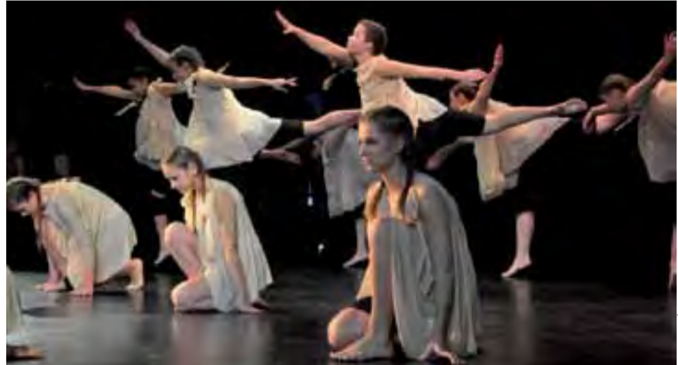
Tancerki Zespołu Agat ze Strykowa po raz kolejny udowodniły, że są jednymi z najlepszych w kraju w swojej dziedzinie.

Doskonała praca instruktorki tańca w strykowskim Agacie doceniona została w pełni w naj-