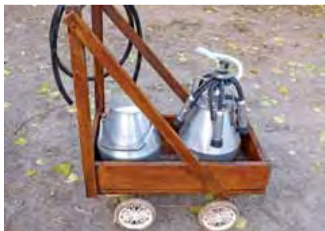
Konkursowe zdjęcie Michała Budzenia przedstawiające wózek do przewożenia baniek z mlekiem.