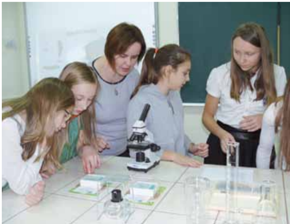
W czasie otwarcia ekopracowni w nieborowskiej szkole duże zainteresowanie wzbudziły mikroskopy i możliwość obejrzenia w powiększeniu przygotowanych preparatów.

Zapowiedzieli, że pracownia i jej wyposażenie będzie przez nich wykorzystywana do tego, aby lepiej poznawać otaczającą ich przyrodę, a także oceniać i dokumentować zagrożenia wynikające z działalności człowieka.