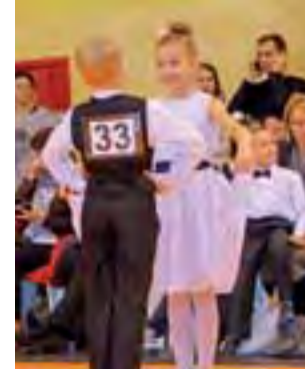
Na parkiecie w Dmosinie pojawiło się 55 par , większość stanowiły dzieci w wieku szkolnym.

jeszcze przez założyciela Leszka Woszczyńskiego, ale w tym roku powstała nowa, dobrze zapowia-