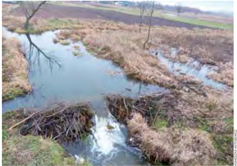
Tama bobrowa spowodowała zalanie okolicznych łąk.

Postanowiliśmy zapytać urzędników gminy Łowicz, czy często pojawiają się podobne interwencje: – Szczerze powiedziawszy, to dopiero drugi taki przypadek w tym roku, o którym nam wia-