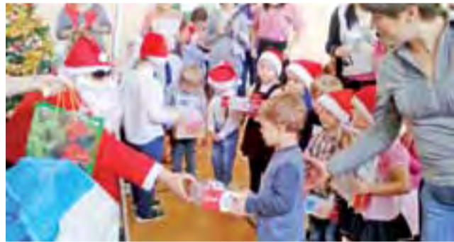
Dzieci odebrały prezenty z rąk świętego Mikołaja.

Po tej krótkiej przemowie na sali pojawili się rzeźbieni: Mikołaj