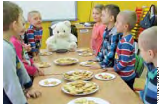
A tutaj bohater dnia – pluszowy miś – z przedszkolakami przy wspólnym stole.

śniej. W 1902 roku prezydent Stanów Zjednoczonych Teodor Roosevelt, wybrał się na polowanie. Po kilku godzinach bezskutecznych łowów, jeden z towarzyszy prezydenta postrzelił małego niedźwiadka i zaprowadził go do Roosevelta. Prezydent ujrzał przerażone zwierzątko, kazał je natychmiast uwolnić. Jeden ze świadków tego zdarzenia uwiecznił historię niedźwiadka na rysunku w waszyngtońskiej gazecie, którą czytał producent zabawek. Od tego momentu zaczęto wy-