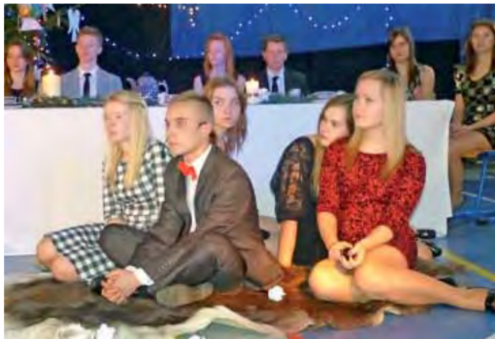
Młodzi wykonawcy świątecznego spektaklu. Widać też stół, który był ważnym elementem scenografii.