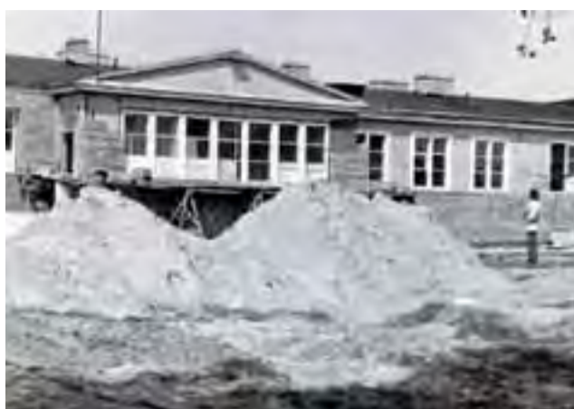
Takie były początki. Rok 1975, remont dawnej jednostki wojskowej, w której obecnie znajduje się MOS w Kiernozi.

W tym czasie zmieniła się nazwa placówki na Specjalny Ośro-