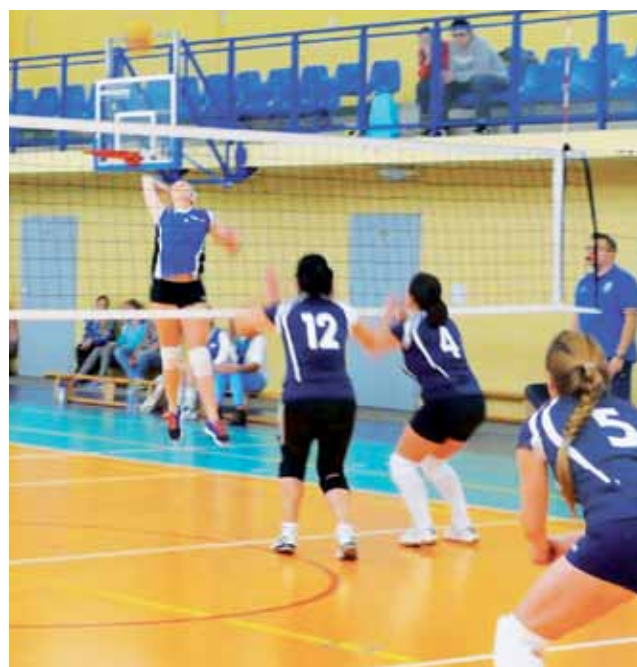
Drużyna ZS Żychlin w szlagierowym meczu z Gaju Team Łęczycza.