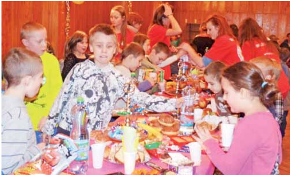
Zmęczone zabawą dzieci mogły posilić się słodyczami i owocami.