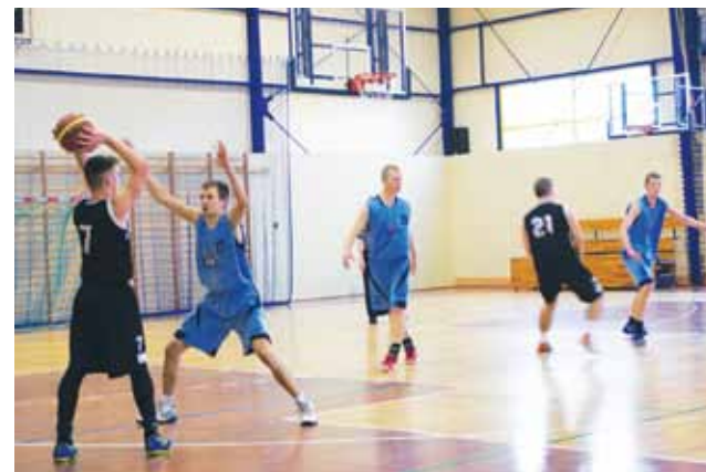
Dobra obrona w wykonaniu koszykarzy UKS Żychlin podczas meczu z zespołem UMKS Piotrcovia.

Piłka koszykowa | Wojewódzka Liga Juniora U-18