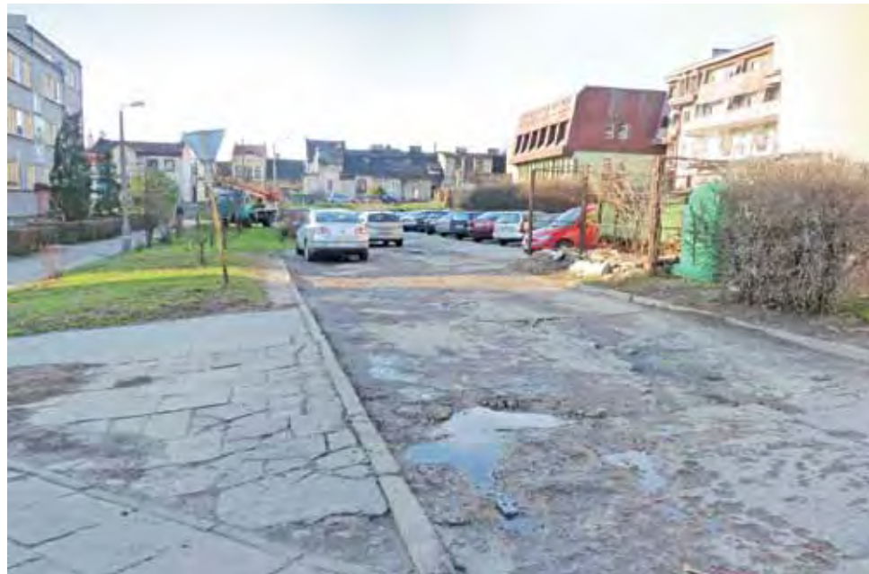
Czy będzie remont parkingu pomiędzy blokami Traugutta 12 i 16? Proszą zawitości właścicielskie, ale kasy w budżecie na 2015 rok na razie brak.

Warunkiem przejęcia od Spółdzielni Mieszkaniowej w Żychlinie parkingu przed blokiem Traugutta 12 było wydzielenie działki będącej w wieczystym użytkowaniu Samorządowej Spółdzielni Mieszkaniowej, dzięki której to parking będzie miał bezpośredni dostęp do drogi wojewódzkiej – informuje Łukasz Prośniewski, kierownik referatu Rolnictwa, Gospodarki Gruntami i Ochrony Środowiska w Urzędzie Gminy Żychlin. – Podział