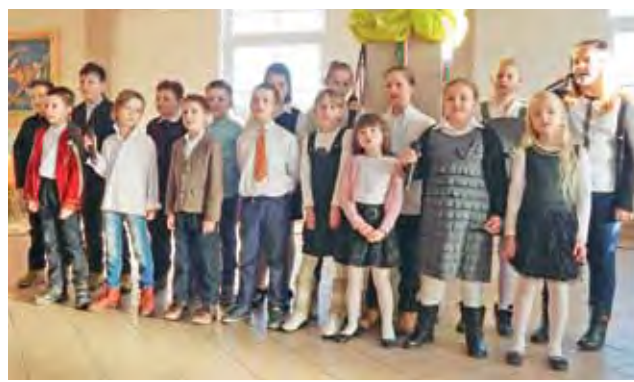
Koncert kolęd. Uczniowie Szkoły Podstawowej w Sobocie swoim występem uświetnili noworoczne spotkanie kół gospodyń wiejskich.