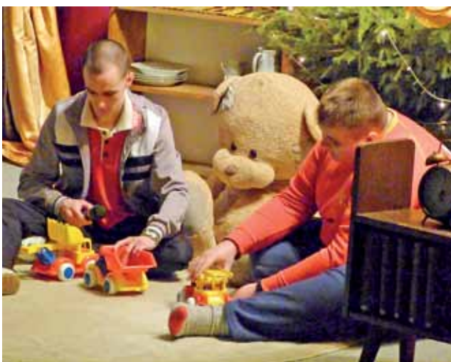
Scena powrotu Maksa do dzieciństwa.