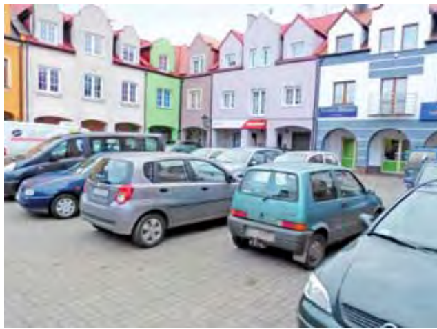
Czy obiecywane przez burmistrza oznaczenia poziome rozwiążą problemy z parkowaniem?