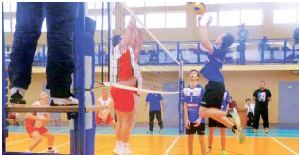
Drużyna młodzieżowa Volley Team Żychlin podczas wygranego meczu z ekipą Agropol Kutno 2:1.