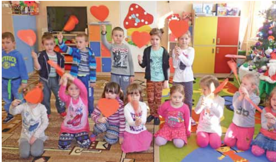
Przedszkolaki ze Szczycy podczas prób do przedstawienia dla babć i dziadków.