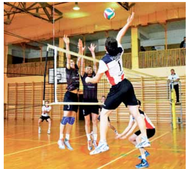
Spotkanie 8. kolejki III Ligi Mężczyzn pomiędzy GKS Kamieńsk a Volley Team Żychlin, zakończone przegraną VTŻ 3:0.

Teraz próbuje swoich sił w VI lidze niemieckiej. Kleszczowianie mają za sobą także sparing – przegrali 1:4 z PGE GKS Bełchatów. Ponadto w meczach kontrolnych Świt Nowy Dwór Mazowiecki ograł 2:0 Hutnik Warszawa, a Broń Radom przegrała 0:1 z Lechią Tomaszów Mazowiecki.