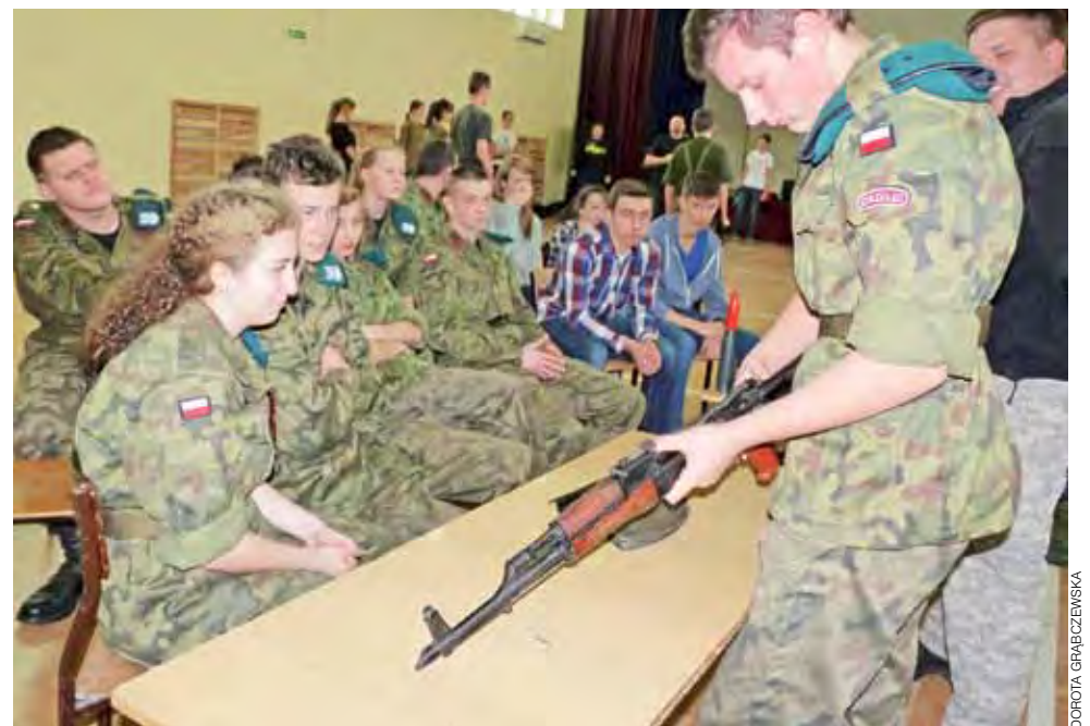
Grupa mundurowa z ZS nr 1 w Żychlinie podczas zajęć obronnych prowadzonych przez Specjalną Jednostkę Szkolenia Militarne z Myszkowa.

Zawody otwarte w strzelaniu poprzedzi szkolny konkurs strzelania w ZS, który odbędzie się 22 stycznia. Z każdej klasy może w zawodach startować po 5 zawodników. W klasyfikacji klasowej podliczane będą wyniki trzech najlepszych zawodników. dag