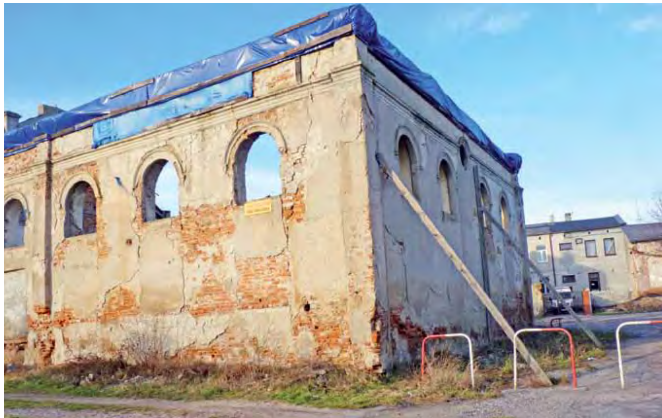
Z sześciu drewnianych podpór z jednego szczytu synagogi zostały tylko dwie. Ostatnia zginęła 5 stycznia, w biały dzień. Mury pozbawione należytego wsparcia stanowią teraz zagrożenie, gdyż mogą się przewrócić.

Zakup drewnianych podpór to dla urzędu dodatkowy, nie-