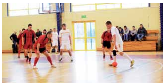
Zacięty mecz ŻHLPN pomiędzy Aa chmm Na pewno a Jurnym Buhajem, zakończony wygraną Jurnego 3:4.