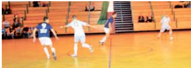
Szkiewka-Dżajf (granatowe stroje) wygrały z Orłami Sonoco 3:1.

minuty później strzelił swojego drugiego gola i zapewnił Bezedurze cenne zwycięstwo. Niespodzianką można nazwać porażkę Stefana z KS Ostrowiec.