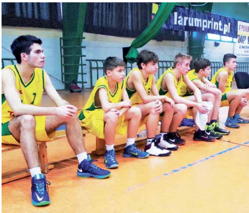
Księżacy nie mieli powodów do zadowolenia w meczu z Trójką Sieradz.