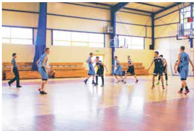
Jedna z akcji koszykarzy UKS Żychlin, które przyniosły zwycięstwo nad rywalem z Piotrkowa.