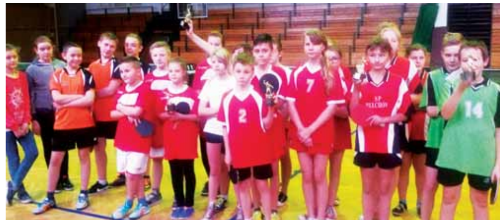
Najlepsi tenisistki stołowe powiatu łowickiego.