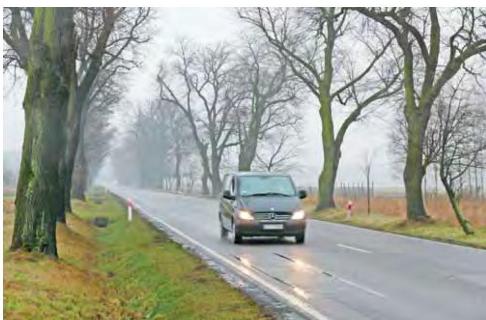
Droga krajowa nr 70 pomiędzy Arkadią a Nieborowem przebiega w cieniu zabytkowej lipowej alei, jeśli miałyby powstać wzdłuż niej ścieżka rowerowa, to raczej od strony pól, ponieważ między drzewami a jezdnią nie ma już miejsca.

Dlaczego wniosek pojawił się właśnie teraz? Urbanek tłumaczy, że przede wszystkim z potrzeby. Poruszanie się drogą nr 70 rowerem stało się bardzo niebezpieczne po uruchomieniu