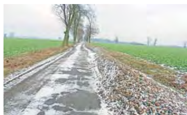
Przywieziony przed świętami kamienny tłuczeń zamrzł usypany w przyzmach wzdłuż drogi. Jak drogowcy nie zdążą go rozszpać przed zimą, będzie kłopot.

Z 700 ton kruszywa, jakie miało trafić na drogę, ok. połowy, tj. 350 ton, przywiózł SKR swoimi pojazdami, drugą połowę miało dowieźć już swoim transportem starostwo. Przed świętami kamień usypano w przyzmach wzdłuż drogi. Niestety, zmienna aura zatrzymała prace. Kruszywo zmoczone przez padający deszcz szybko zamrzło przy kilkustopniowym mrozie. Próba rozplantowania kamieni na drodze nie powiodła się i ciężki sprzęt wysłany przez starostwo musiał zawrócić. W piątek, 9 stycznia, przyzma kamieni wciąż leżała.