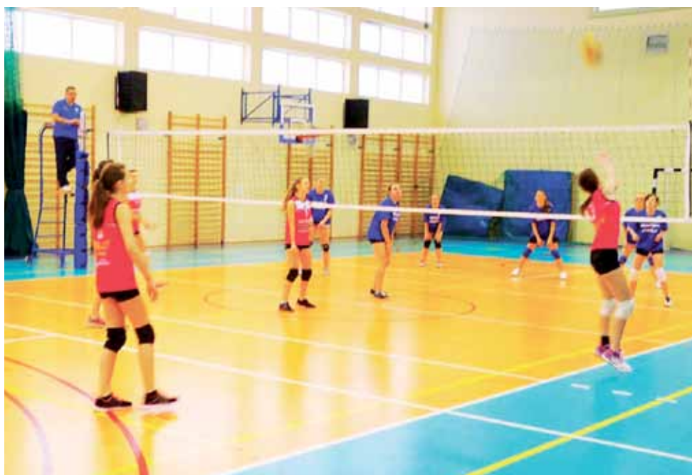
Siatkarki Volley Team Żychlin w wygranym 2:0 spotkaniu 8. kolejki KALS Kobiet z drużyną UKS Strzelce.