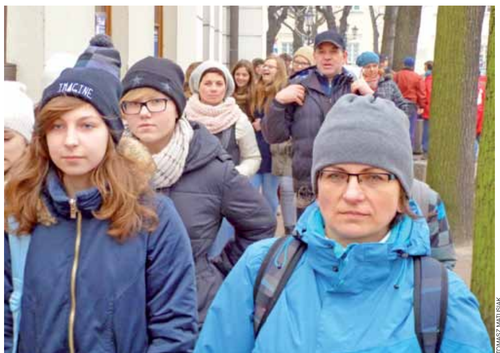
Uczestnicy spaceru na samym początku trasy – idą ulicą Podrzeczną.

Stamtąd wszyscy przeszli przez ok. 5 km do Łasku Miejskiego. Uczczono tam jeszcze jedną, ważną dla Łowicza rocznicę, odwiedzając pamiątkową mogiłę trzech bojowników PPS-Frakcji Rewolucyjnej, zamordowanych przez władze carskie 17 stycznia 1907 roku, w czasie