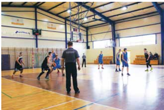
Zwycięski mecz koszykarzy UKS Żychlin z zawodnikami UMKS Piotrcovia, zakończony wynikiem 64:54.