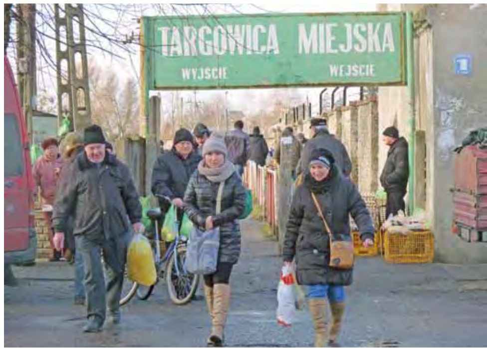
Targowisko w Żychlinie należy do jednych z największych w regionie. Cieszy się dużym zainteresowaniem kupujących i sprzedających.