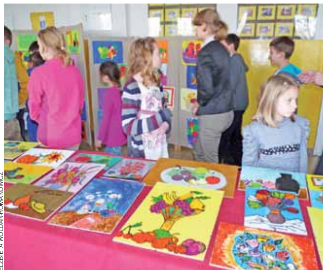
Na szkle malowane 2014. W ubiegłym roku tematem konkursu była martwa natura.