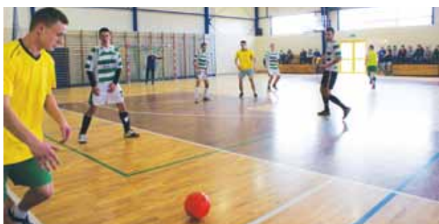
Pierwsze spotkanie 2. kolejki ŻHLPN: Olimpia Oporów kontra Gladiatory z Miasta Noży II, zakończone wynikiem 1:2