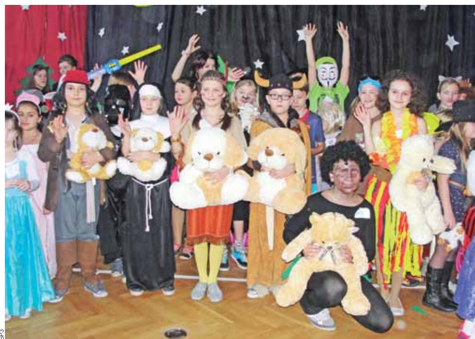
Wielu uczniów zespołu szkół na Korabce przyszło na bal w przebraniach. Uczniów najlepiej przebranych nagrodzono pluszakami. sp3