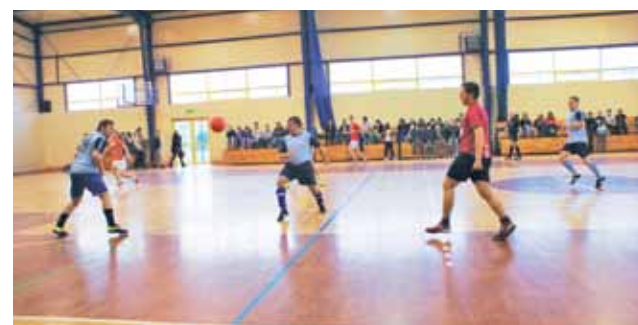
Wysoka wygrana drużyny Shaolin w meczu ze Żwawymi Kozami, gdzie niebiescy rozprawiają się 6:0.

Piłka nożna | Żychlińska Halowa Liga Piłki Nożnej 2015