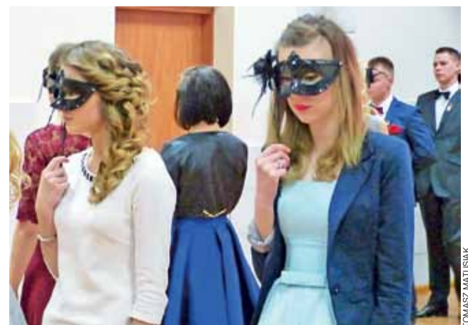
Nawet jeśli oczekiwanie na poloneza było nerwowe, to już po pierwszych taktach widać było, że uczniowie mają ten tradycyjny taniec opanowany po wielu szkolnych próbach. Zdjęcie ze studniówki II LO.