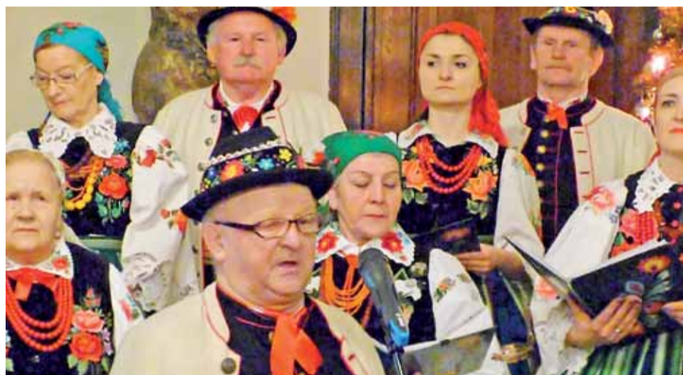
Śluchając „Ksinzoków” można odnieść wrażenie, że koledy powstały specjalnie po to, żeby śpiewać je w gwarze łowickiej.

Dzieci otrzymały nagrody rzeczowe a Trzypotrzy dodatkowo statuetkę. Ponadto obejrzały w ramach festiwalu spektakl „Szata z żurawich piór” w wykonaniu aktorów Teatru Królewskiego Muzeum Pałacu Króla Jana III w Wilanowie. mak