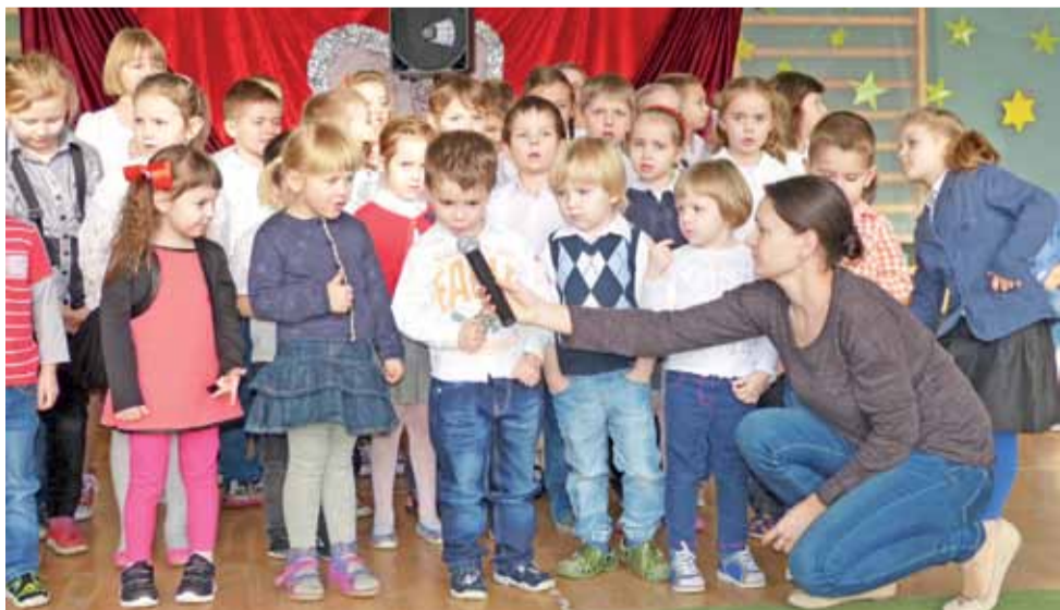
Najmłodszy wychowankowie szkoły w Łaguszewie, nieco stremowani i nieśmiali deklamowali wierszyki dla swoich kochanych babć i dziadków.

czystość ze względu na wnuczkę, ale z przyjemnością obejrzała przedstawienie. – Te dzieci naprawdę dużo musiały się nauczyć. Efekt był bardzo fajny.