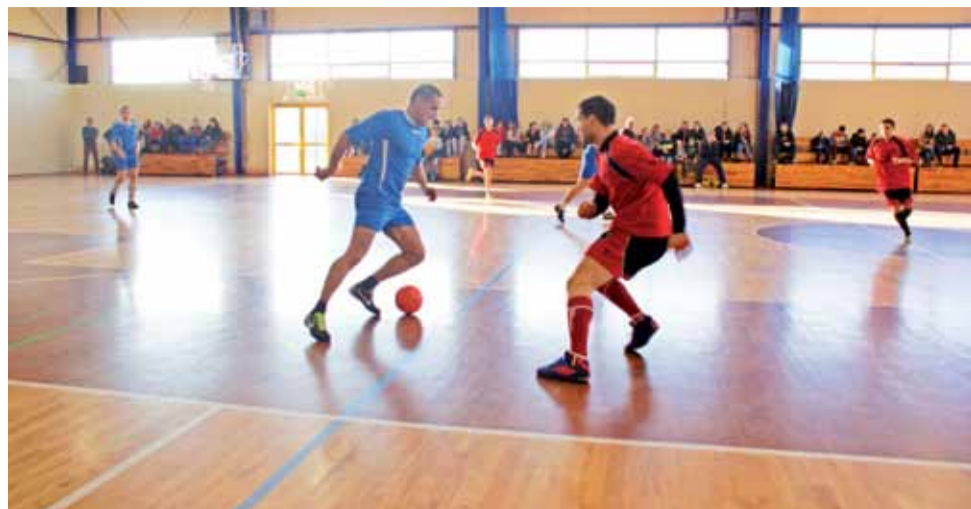
Mecz ŻHLPN pomiędzy Delta Śleszyn a Jurnym Buhajem, zakończony wygraną Jurnego 4:0.

Piłka nożna | Żychlińska Halowa Liga Piłki Nożnej 2015