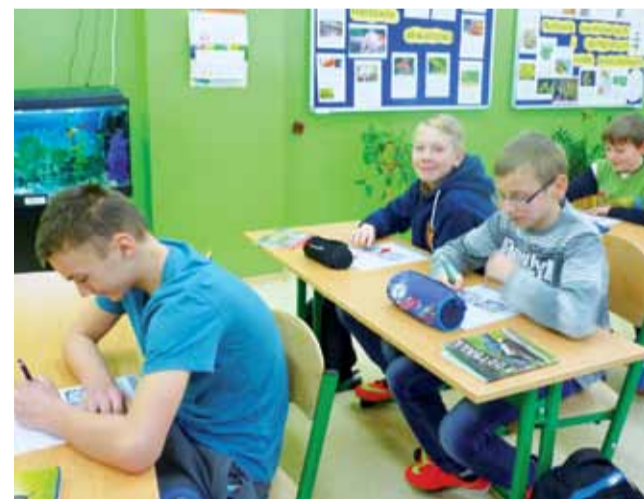
Uczniowie SP w Żeronicach od 25 listopada uczą się w nowej, doskonale wyposażonej pracowni przyrodniczej. Było to możliwe dzięki dotacji z WFOŚiGW w Łodzi w wysokości 27.544 zł.

Cały projekt kosztował 29.544 zł. Wkład własny szkoły to 2 tys. zł. Za środki własne zakupiono panele podłogowe do zaplecza pracowni oraz wykonano nową instalację elektryczną. Za dotację z funduszu zakupiono: meble do klasy, żaluzje na okna, mikroskopy, aparat fotograficzny, dyktafon, lornetkę, wizualizer, laptop i tablicę interaktywną. W szkole, do której chodzi 74 dzieci (wraz z przed-