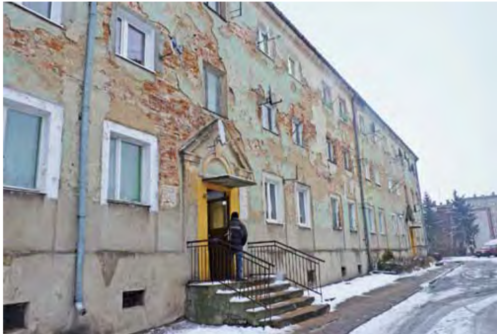
W tym roku zostanie rozpoczęta naprawa elewacji na budynku przy ul. Narutowicza 75.

Spółdzielnia planuje też montaż nowego węzła ciepłego w bloku Marchlewskiego 2. Prace już częściowo zostały wykonane. W planach jest montaż