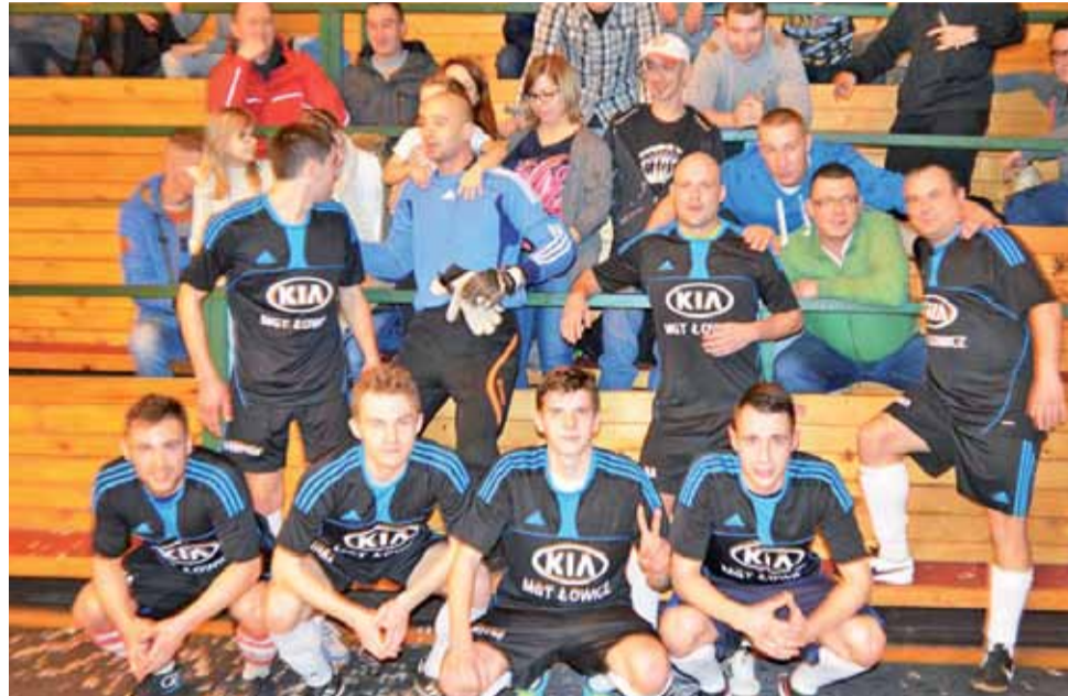
Gracze Drużyny KIA Łowickiej świętowali zwycięstwo w lidze ze swoimi licznie zgromadzonymi kibicami.

HYDRO-SPAW s.c. Gutenów – FANTAZJA Głowno 2:5 (0:2); br.: Łukasz Skierski 12', Łukasz Papu-