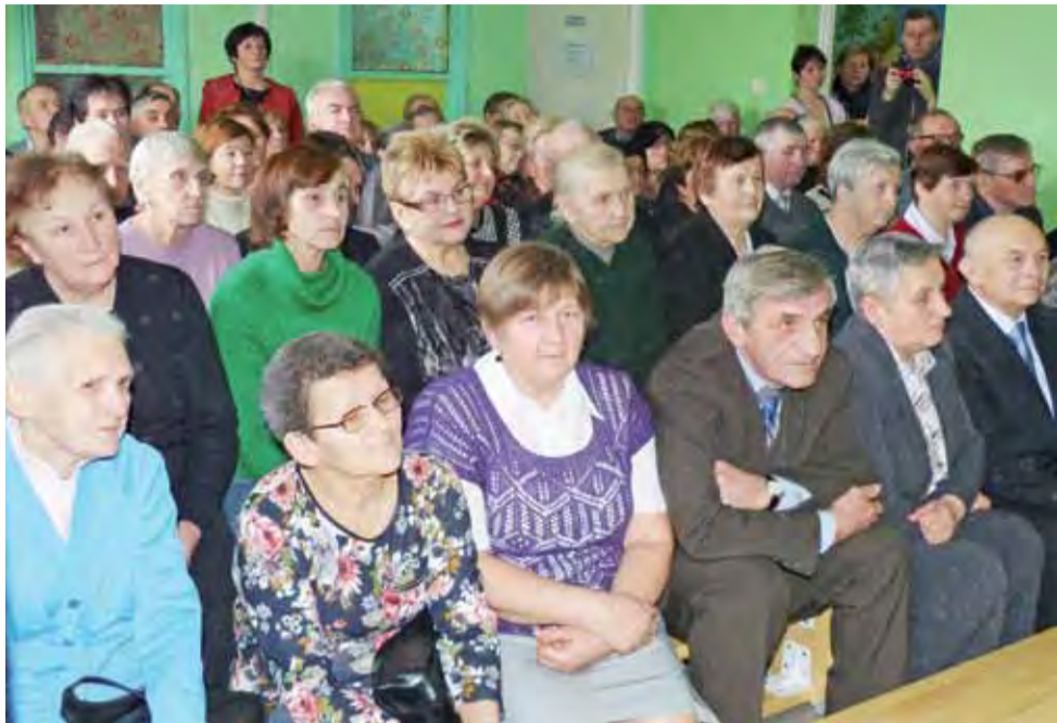
Publiczność nie zawiodła. Mała sala gimnastyczna szkoły w Łaguszewie z ledwością pomieściła przybyłych seniorów.