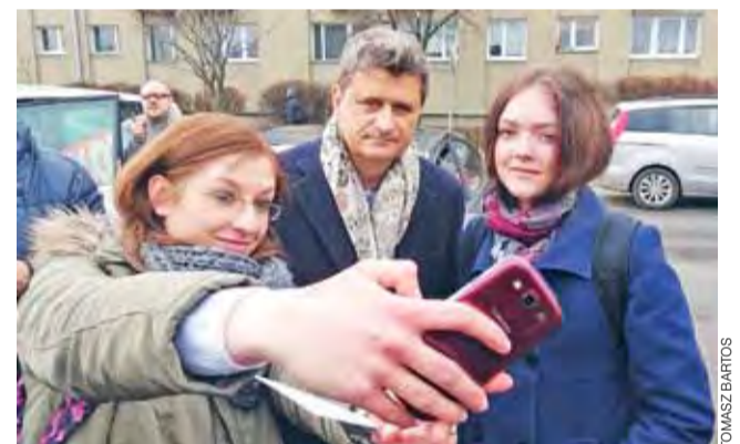
Janusz Palkot, kandydujący na urząd Prezydenta RP zawiązał w piątek 30 stycznia do Łowicza. Pojawił się na miejskim targowisku, gdzie przemawiał i odpowiadał na pytania. Budził spore zainteresowanie – i skrajne komentarze.