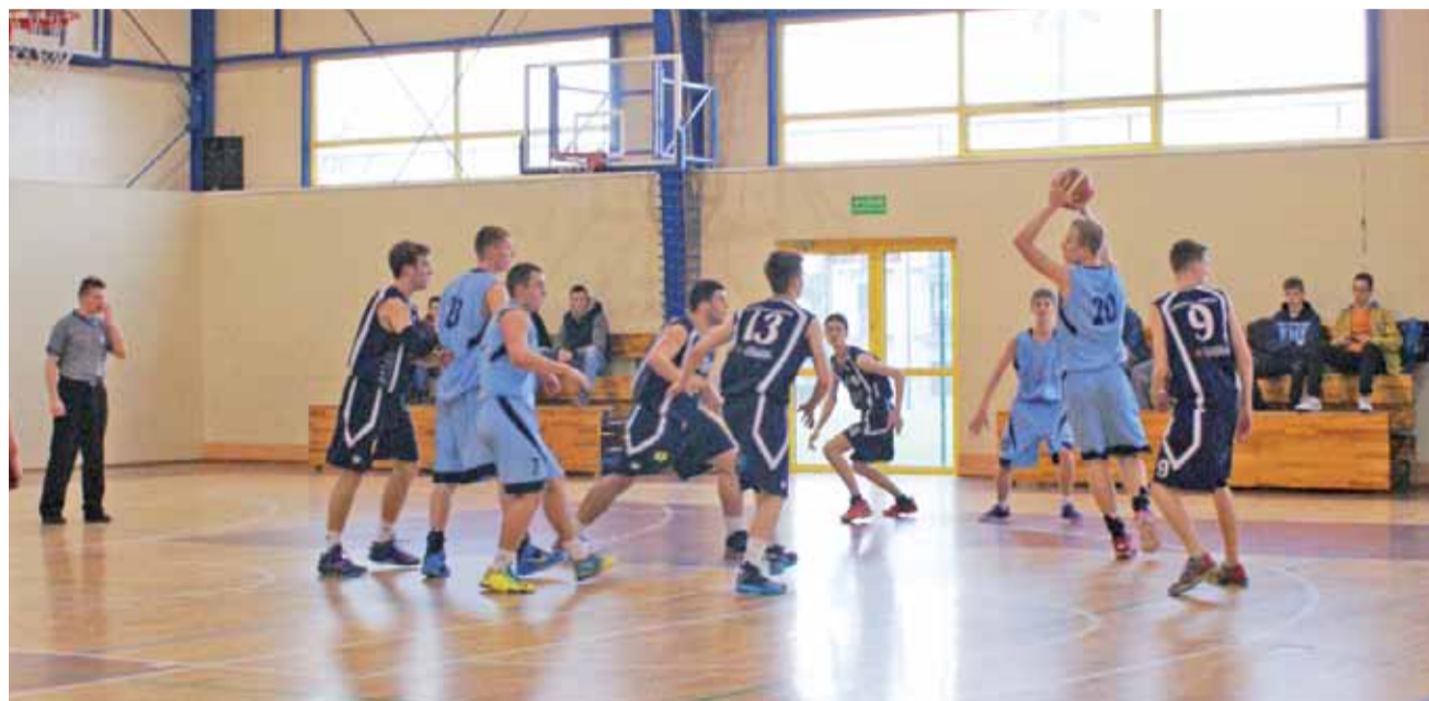
Mecz koszykarzy UKS Żychlin z zawodnikami UMKS Książak zakończył się zwycięstwem żychlinian 71:43.

■ UKS M-G SZS Żychlin - UMKS KSIĘŻAK Łowicz 71:43 (18:9, 16:9, 13:13, 24:12)