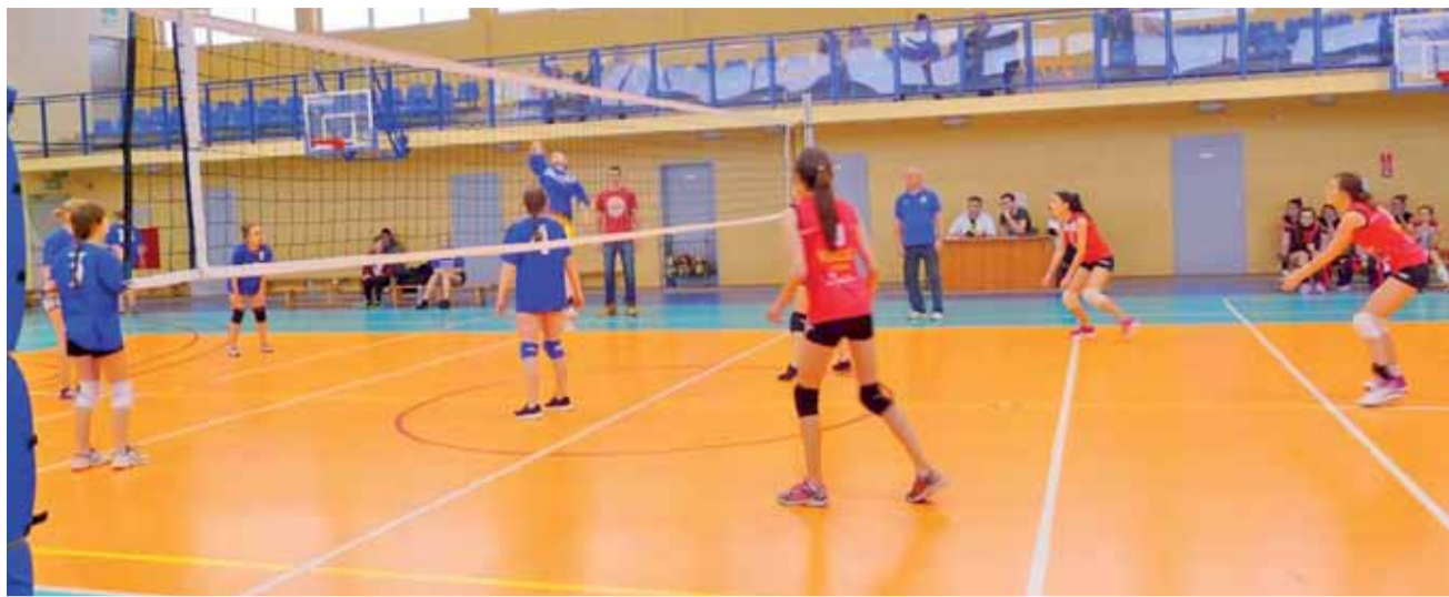
Sobotnie spotkanie siatkarek Volley Team Żychlin z UKS Strzelce podczas 10. kolejki KALS Kobiet, zakończone wygraną VTŻ 2:0.

Piłka siatkowa | Kutnowska Amatorska Liga Siatkówki Kobiet