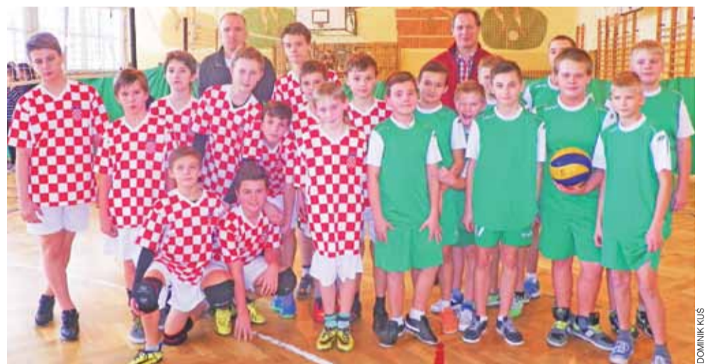
Ekipy SP 1 Łowicz i SP 7 Łowicz zagrają w mistrzostwach powiatu.

Sport Szkolny | MIMS w mini siatkówce chłopców