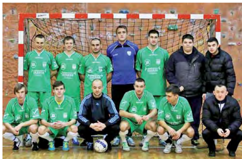
Gracze UM-OSiR Łowicz podczas turnieju w Warszawie.