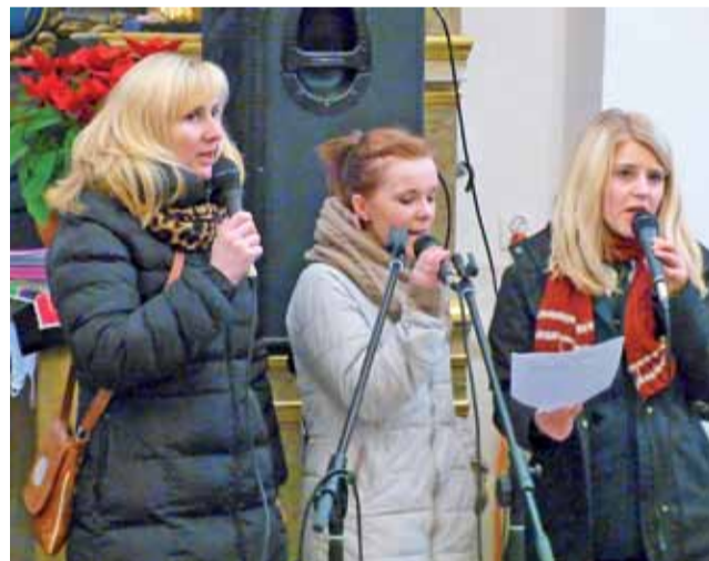
Tradycyjne kolędy w nieco uwspółcześnionym brzmieniu zaprezentował Zespół „Radość Boża” z Bełchowa.