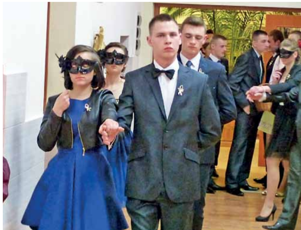
Próba generalna przed polonezem w Zduńskiej Dąbrowie.

Powiat łowicki | Ostatnie w tym roku studniówki