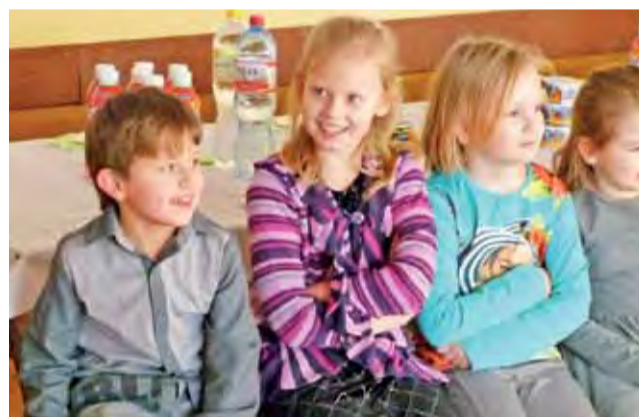
Chwila odpoczynku pomiędzy szalonymi zabawami.

Zwierzchniem choinki była wizyta św. Mikołaja, który każdemu dziecku wręczył paczkę z prezentami. – Fajnie, że coś takiego się