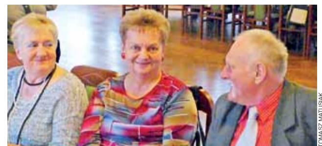
Seniorzy z Bratkowic w doskonałym nastroju przybyli na spotkanie w siedzibie OSP.

Ten krótki, pięciogodzinny kurs, poprowadzą instruktorzy pływalni. Zapisywać się można bezpłatnie przez telefon lub w kasie basenu. 4 lutego, w momencie zamykania tego wydania NŁ, było jeszcze 10 wolnych miejsc. tm