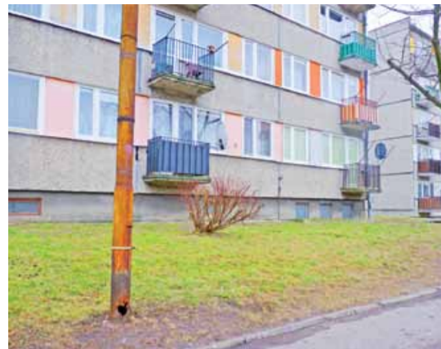
Przerzedziały słup oświetleniowy czeka na wymianę. Teraz stwarza zagrożenie. Słup ma wymienić samorząd.

Przypadek z Balikowa jest jednym z pierwszych w naszym regionie, w którym doszło do skutecznej interwencji odpowiednich organów. Na wsiach nie raz można spotkać zwierzęta uwiązane na krótkich łańcuchach przez całą dobę. Takie zwierzę zdane jest wyłącznie na opiekę właściciela, nie ma nawet szansy, by samodzielnie znaleźć sobie choćby wodę do picia, nie wspominając o braku możliwości ruchu. Niedozwolone psy to, niestety, częsty widok. I wraca pytanie: dlaczego niektórzy ludzie trzymają czasami nawet po kilka psów, skoro nie dają im jeść jak należy? Karmienie psów zbożową srużką to częste praktyki wśród wiejskich gospodarzy! A przecież pies to nie świnia... dag