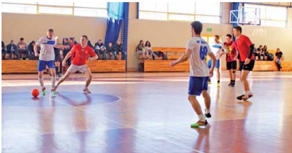
Drugie spotkanie 4. kolejki ŻHLPN: mecz pomiędzy drużyną Żwawe Kozy a MC Zduny zakończony wynikiem remisowym 2:2.