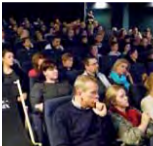
Widzowie XVI „Och! Film Festiwalu” w oczekiwaniu na „Dzikie historie”.

Na seansie „Dzikich historii” – argentyńsko-hiszpańskiej czarnej komedii, która będzie walczyć o najwyższe nagro-