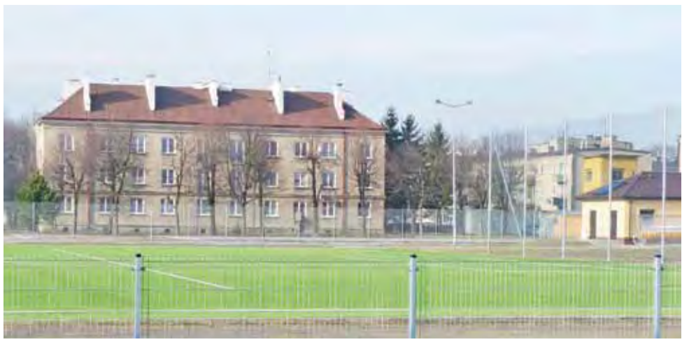
Regulamin korzystania ze stadionu miejskiego uchwalony. Teraz burmistrz ustali wysokość opłat.

Żychlin | Burmistrz będzie dysponentem obiektu