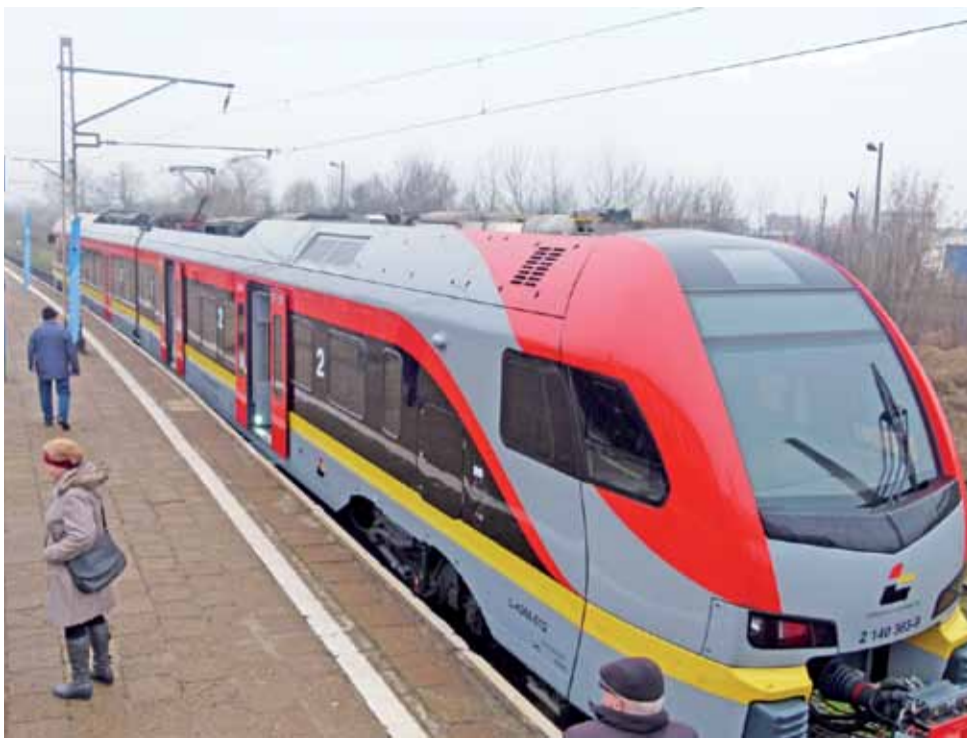
Pociąg Stadler Flirt 3 na łowickim peronie. Może zabrać 120 osób na miejscach siedzących.

– Pytanie brzmi, czy ludzie, którzy rządzą Łódzką Koleją Aglomeracyjną, są w stanie dostosować się do tych planów. Bo ten projekt jest niewygodny dla realizującego przewoźcy.