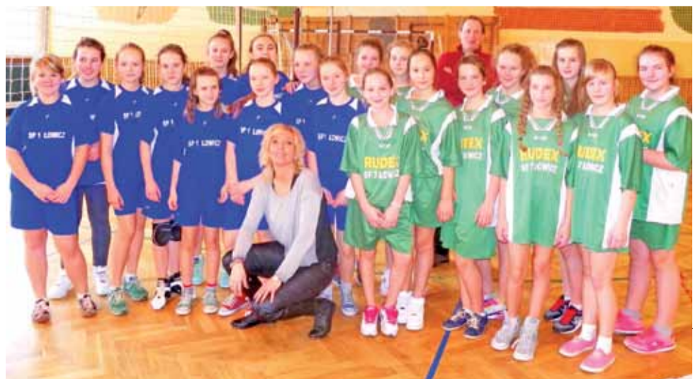
Siatkarki Jedynki i Siódemki wywalczyły awans na zawody powiatowe.