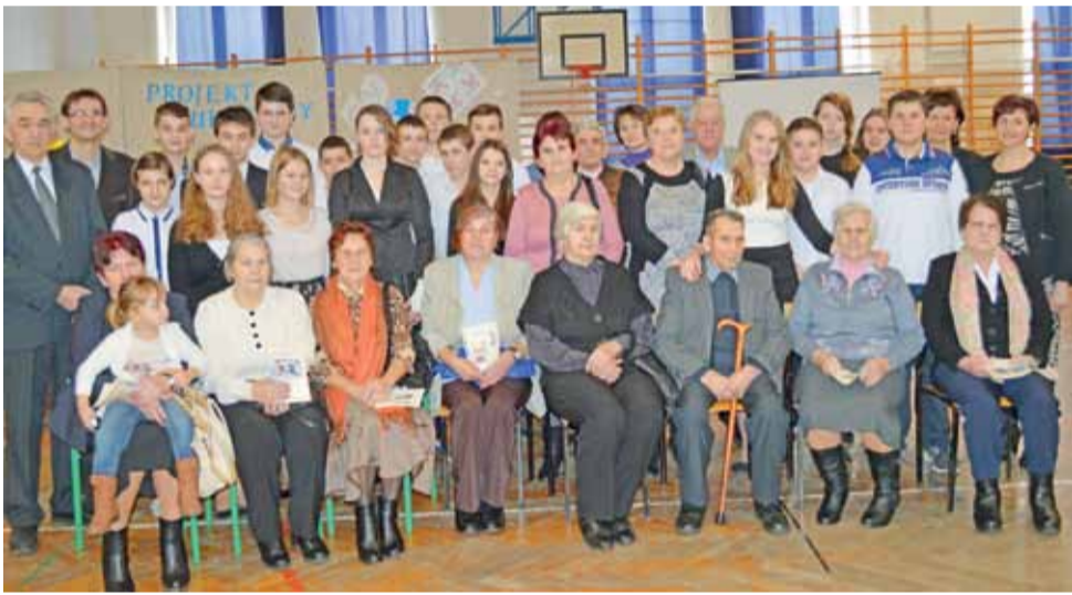
Gimnazjaliści i ich dziadkowie. Uczniowie klasy II b Gimnazjum im. Józefa Chełmońskiego w Bielawach uczcili Dzień Babci i Dzień Dziadka.

7.050.999 zł, przy czym może być ono mniejsze o 2.500.969 zł, jeśli w tym roku wpłynie na konto gminy dotacja na oczyszczalnię z PROW. mwk