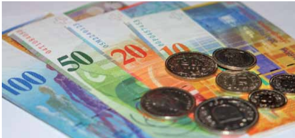
Każdy doradzał nam kredyt we frankach, bo to taka pewna waluta, niski kurs, więc nawet nie rozważaliśmy złotówek.

– Jak słyszę tych ekonomistów, którzy radzą kredytobiorcom np. upadłość konsumencką, to mi się nóż w kieszeni otwiera.