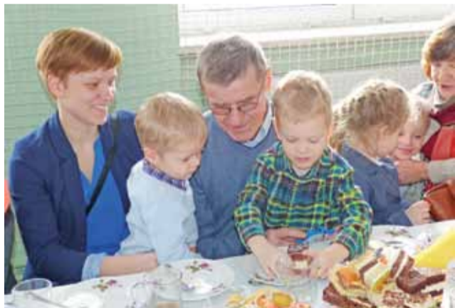
Na Dniu Seniora było rodzinie i sympatycznie. Goście – starsi i młodszy – w murach szkoły czuli się jak u siebie w domu.

Na uroczystości w Łaguszewie obok siebie usiadły babcie