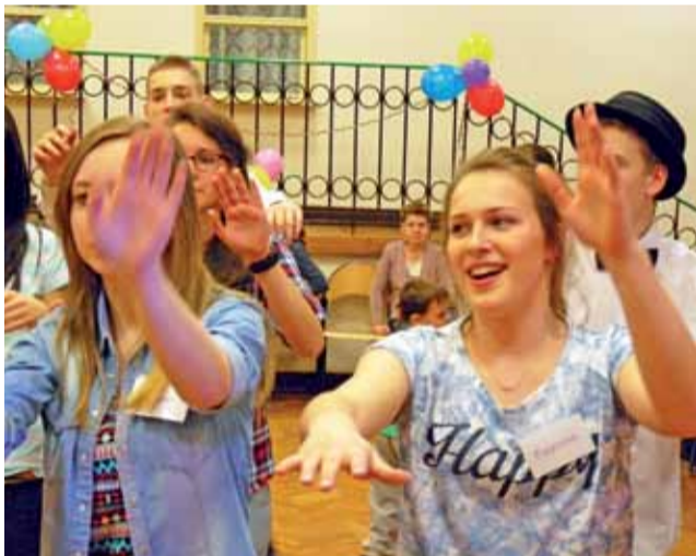
Na zabawie choinkowej bawili się nie tylko małe dzieci. Na zdjęciu tańczą uczniowie II LO.

Przygotowania do choinki rozpoczęły się jeszcze przed świętami Bożego Narodzenia. PCK przeprowadził wówczas kwestę uliczną, w której zebrano 1700 zł. Dzięki temu udało się skompletować 53 paczki z zabawkami i słodyczami (tym, którzy nie stawili się na imprezie, zostaną one dostarczone w inny sposób). Pomogli też sponsorzy, którzy opłacili po-