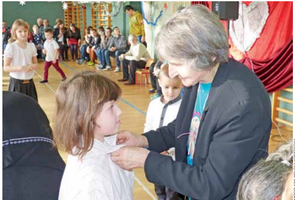
Konkurencja ubierania wnuczki w koszulę nie była trudna dla doświadczonych babć. Ale zrobić to bez okularów i na czas – to już nieco trudniejsza sztuka.