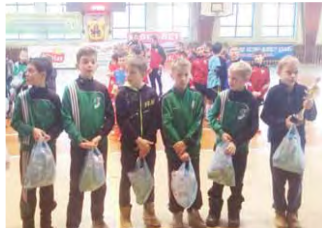
Gracze Pelikana I odebrali Puchar za czwarte miejsce w turnieju.

W ostatnim meczu w grupie nasz zespół pokonał 2:0 Borutę Zgierz i ostatecznie zajął trzecie miejsce w swojej grupie i czekał na pojedynk o miejsce piąte. Pierwszy zespół Pelikana rywalizował natomiast w półfinale z Mazovią Tomaszów. Niestety po bardzo wyrównanym spotkaniu