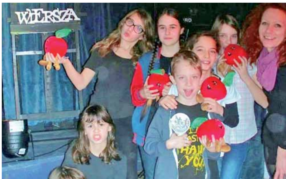
Grupa Trzypotrzy podczas festiwalu w Skierniewicach.

Załamany król zostaje sam. Wtedy do królestwa przybywa oddział muchomorów i pomaga królowi zgłodzić muchę. Po bitwie król z nowymi poddanymi opuszcza scenę. – To taka historia, której towarzyszy muzyka m.in. Mozarta, Griega, Straussa,