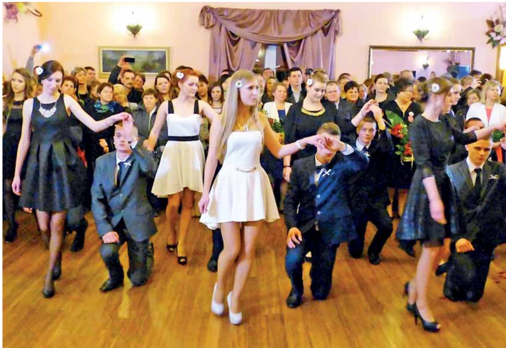
Jeden z wariantów poloneza zaprezentowanych przez uczniów ZSP nr 3 w Łowiczu.