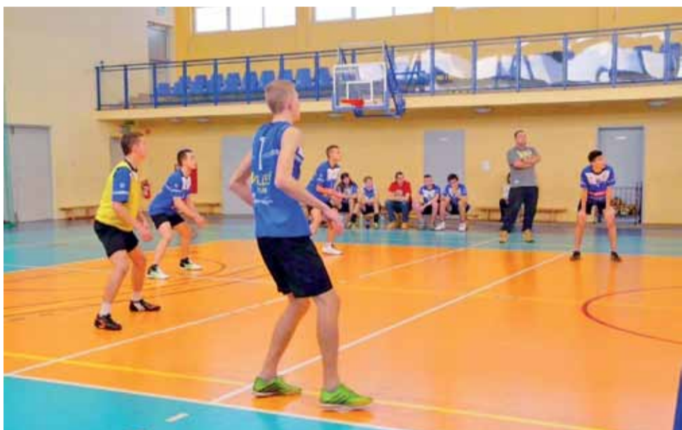
Spotkanie Volley Team Żychlin kontra LZS Kaszewy, zakończone wygraną drużyny z Kaszew 2:1.

Piłka siatkowa | Amatorska II Liga Siatkówki mężczyzn