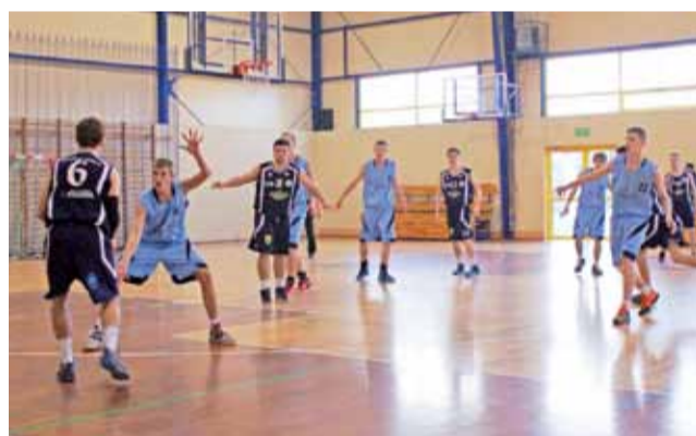
Zwycięstwo nad drużyną Książak Łowicz przypieczętowało udział UKS Żychlin w turnieju strefowym.