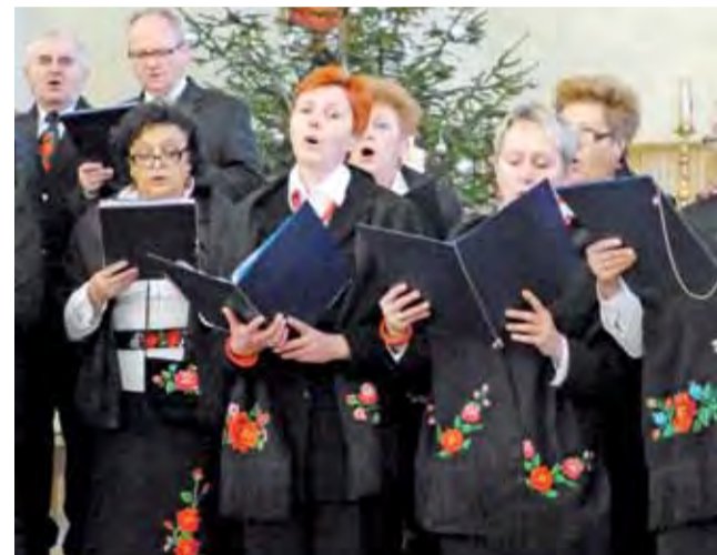
Chór „Lutnia” podczas występu po mszy świętej w Stachlewie.

W bazylice katedralnej w Łowiczu poranną mszę świętą wzbogacił swoim występem zespół Radość Boża z Bełchowa, który zaprezentował znane kolędy w stylu muzyki rozrywkowej. W kościele św. Wawrzyńca w Ko-