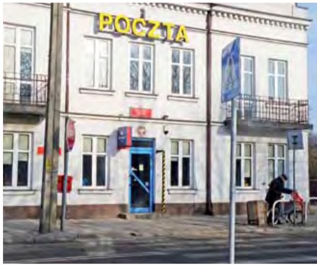
Pracownicy Poczty Polskiej w Żychlinie wołają o pomoc przed centralizacją usług pocztowych i zwolnieniami.

Na Poczcie w Żychlinie pracuje ok. 30 osób. Wszyscy drżą z niepokoju o miejsca pracy, gdyż do końca nikt nie wie, jaki czeka ich los. Tymczasem konkurencja już ostro wchodzi w teren. Od kilku miesięcy w Żychlinie jest już oddział In Postu.