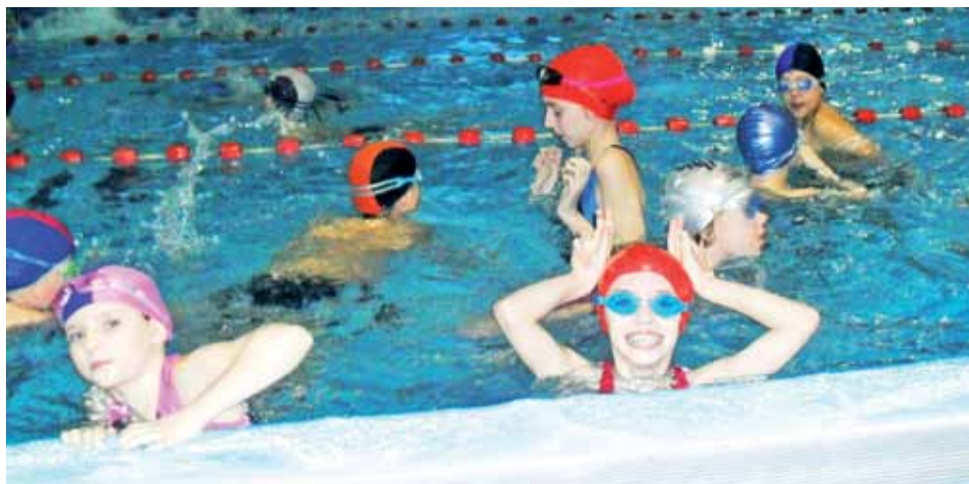
W przerwach humory młodym pływakom dopisywały.