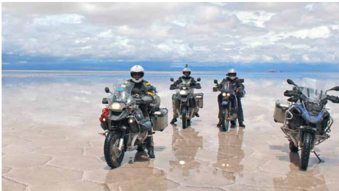
Polscy motocykliści w czasie postoju na tafli słonego jeziora Salar. Tafel soli pokrywa cienka warstwa wody, w której odbijają się chmury i krajobraz.

Dziś wiem, że gdybym zrezygnował, bardzo bym żałował.