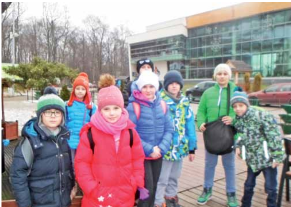
Dzieci ze Spółdzielni Mieszkaniowej w Żychlinie przed termami w Uniejowie.