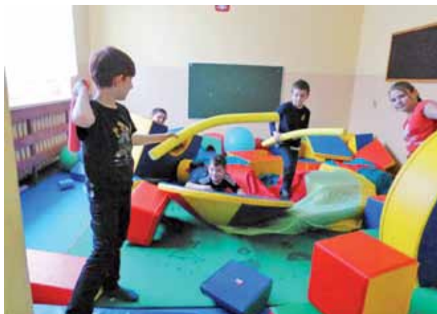
Sala zabaw w SP nr 4 stwarzała dużo możliwości do bezpiecznego rozładowania energii.