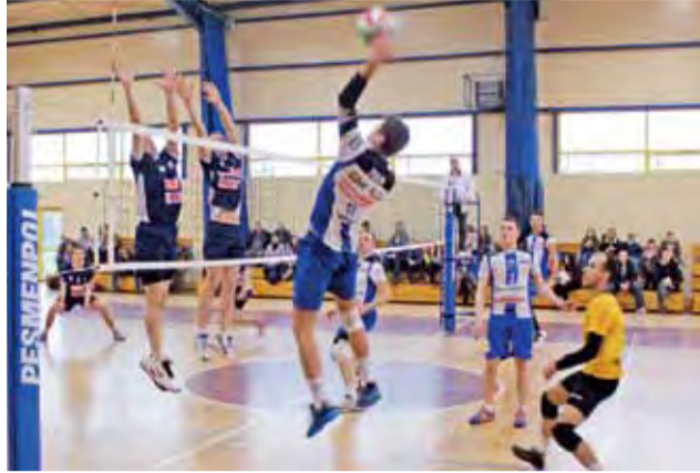
Spotkanie Volley Team Żychlin kontra Gladiator Parzęczew podczas turnieju siatkówki w żychlińskiej hali sportowej.