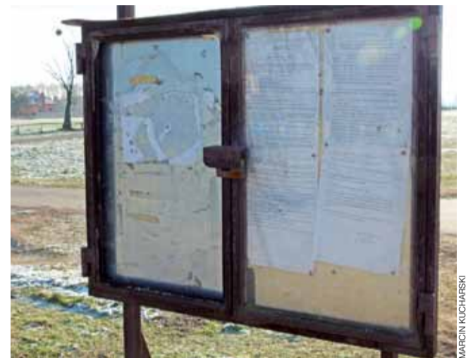
Tablica przy targowisku w Kiernozi jest wykorzystywana głównie w kampanii wyborczej.