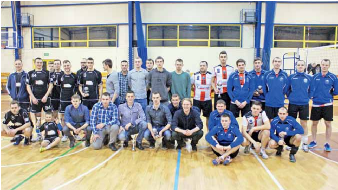
Drużyny biorące udział w sobotnim turnieju piłki siatkowej w Żychlinie.