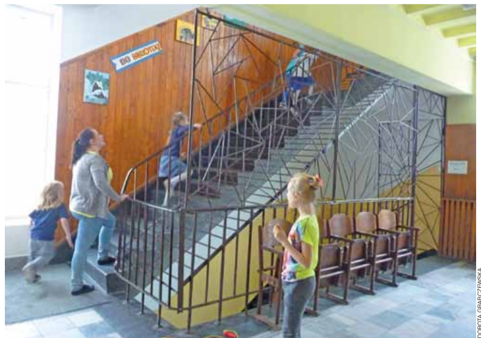
Po feriach zniknie metalowa krata w Żychlińskim Domu Kultury. Znikną też panele nad klatką schodową.