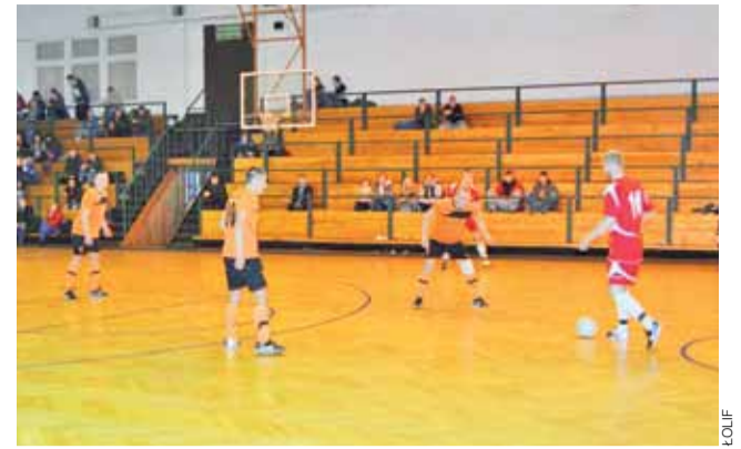
Victoria Zabostów (pomarańczowe stroje) prowadziła już z Baumitem 3:1, by ulec tej drużynie 3:4.