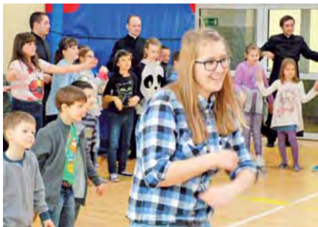
Wiele zabaw w Szkołach Pijarskich prowadzili jako animatorzy uczniowie tej szkoły.