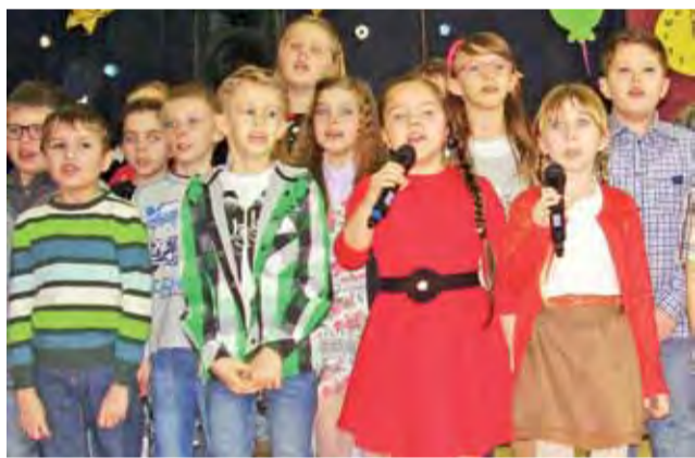
W czasie choinki w Bolimowie, zanim zaczęła się zabawa taneczna, uczniowie każdej z klas zaprezentowali program artystyczny.

Uczniowie klasy II wykonali wiązankę piosenek dla dzieci. Klasa III wykonała piosenki „A w karnawale” oraz „Laleczka z saskiej porcelany”. Uczniowie klasy IV przypomnieli o cudownej mocy baśni, dlatego zaprezentowali piosenkę Sylwii Grzeszczak „Księżniczka”. Jeden z uczniów