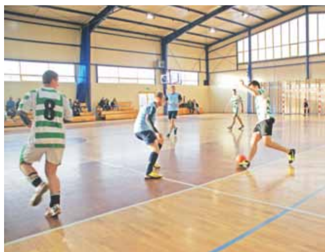
Ostatnie spotkanie niedzielnej 5. kolejki ŻHLPN: mecz pomiędzy drużyną Gladiatorzy z Miasta Noży II a Shaolin zakończony wynikiem 3:4.

W drugim meczu 5 kolejki grały ze sobą drużyny: Sztynwna Ekipa i AA Chmm Na Pewno. Szybki mecz, podczas którego bramki zdobywali zawodnicy Sztynwnej Ekipy. Ich przewaga w pierwszej połowie była dość duża. Wynik do przerwy to 3:0. Od samego początku drugiej połowy drużyna Sztynwna Ekipa coraz bardziej uciekała z ilością zdobytych goli swoim przeciwnikom.