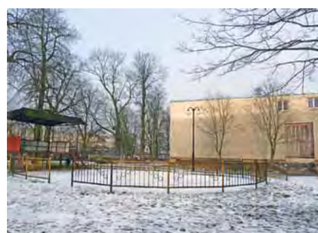
Samorządowcy poszukują miejsca, w którym można by było organizować imprezy masowe. Coraz śmieiej mówi się o terenie wokół domu kultury, w miejscu, gdzie znajduje się dawna scena.