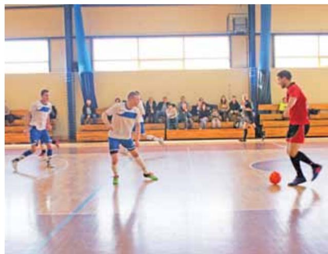
Mecz szlagierowy 5. kolejki ŻHLPN pomiędzy Jurny Buhaj kontra MC Zduny, zakończony wynikiem 0:2.

Czwartym meczem z kolei było spotkanie drużyn: Gladiatorzy z Miasta Noży I i Delta Śleszyn. Ekipa Dety przeważała na parkiecie przez większą część pierwszej połowy, już w 5 min. wyszli na prowadzenie. Gladiatorzy I w 8 min. odpowiedzieli golem na 1:1. Po chwili stracili jednak dwa gole. Wynik do przerwy to 3:1 dla Shaolin. Po przerwie drużyna Gladiatorów II rzuciła się do odrabiania strat. Stworzyli kilka sytuacji pod bramką przeciwnika, niestety brakowało skuteczności i odrobiny szczęścia. Mecz zakończył się wynikiem 4:3 dla Shaolin. Dobry mecz w drużynie Gladiatorów II roz-