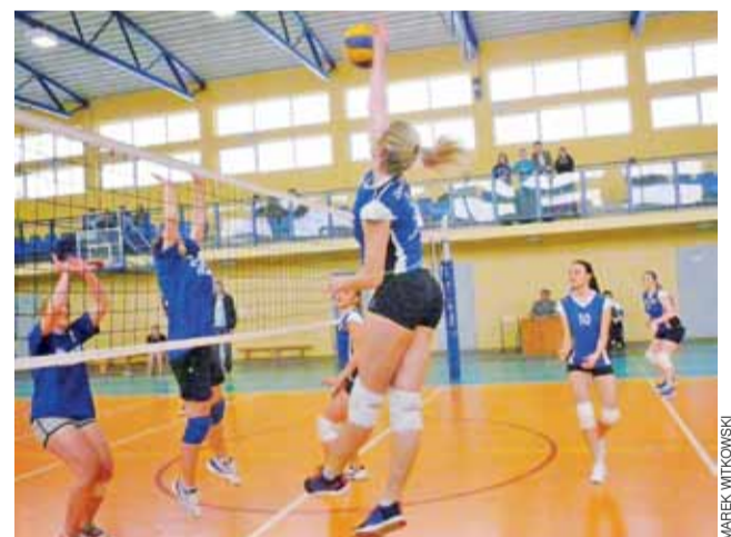
Sobotnie spotkanie siatkarek Zespołu Szkół Żychlin z UKS Strzelce podczas 11. kolejki KALS Kobiet, zakończone wygraną ZS Żychlin 2:0.

■ Zespół Szkół Żychlin – UKS Strzelce 2:0 (25:15, 25:13) ■ Hurt Pap-Ars Vita Kutno – Zespół Szkół Żychlin 2:0 (25:23,