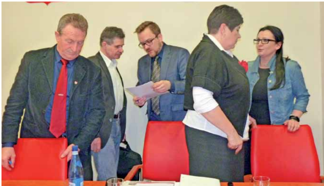
Radni miejscy z Żychlina uchwalili budżet na 2015 rok. W tym roku będzie opracowywana strategia rozwoju gminy na lata następne. Pomysły na inwestycje będą przyjmowane i poddawane konsultacji społecznej.

Podobnie oszczędności będą na budowie chodnika w ulicy Jabłonkowej, choć tu procedury przetar-