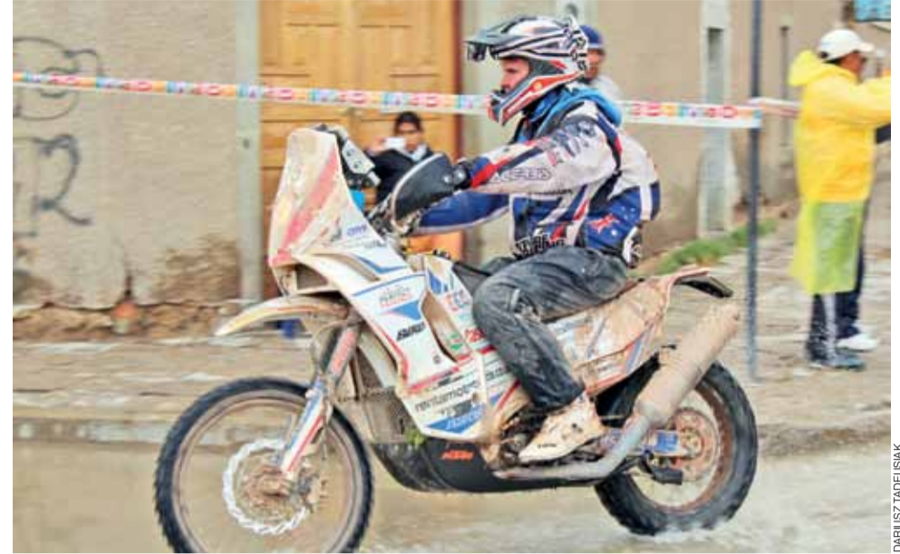
Tak wyglądał wyjazd zawodników Dakaru do miasta Uyuni w Boliwii, towarzyszył im deszcz.

Dla łowiczana sukcesem jest to, że mimo iż dotknęły go problemy z motocyklem, to udało mu się przejechać całą wyznaczoną trasę.