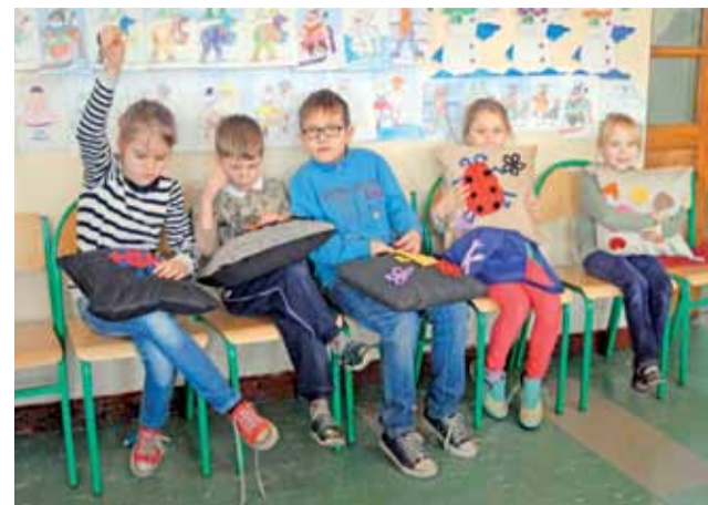
Dzieci z Zespołu Szkół przy ulicy Grunwaldzkiej wyszywają poduszki.

Łowicz | Jak wyglądały półkolonie w szkołach – tym razem aż w trzech