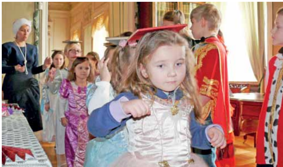
Zanim w czasie niedzielnych zajęć w Muzeum w Nieborowie, dzieci zaczęły uczyć się tańca dworskiego, musiały m.in. nauczyć się prosto chodzić. Pomocną okazała się wizyta w pałacowej bibliotece, gdzie trenowały z książkami na głowach.

Dopiero po takim przygotowaniu uczestnicy zajęć spotkali się ponownie w Sali Białej, gdzie odbyły się warsztaty ta-