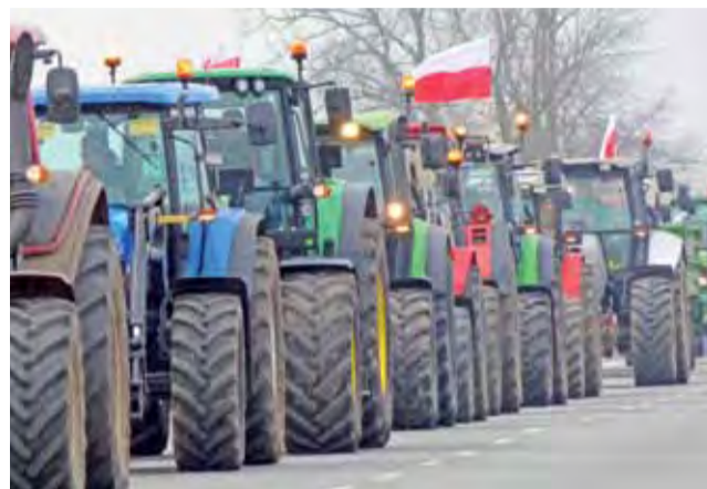
Ciągniki są własnością banku – takie hasło rolnicy wywieszali na szybach wielu swych maszyn.

– Pomyśl był przedwzrostem i udało nam się zorganizować tyle ludzi. Rolnik jak chce, to potrafi. Jak będzie trzeba, to będziemy organizować ko-