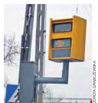
Fotoradary w Bednie i Wojszycach zostały pomalowane przez wandalów. Obydwa są już sprawne.

W 2014 roku fotoradary zrobiły 1,5 mln zdjęć, wystawiono 427 tys. mandatów, podczas gdy w 2013 roku wystawiono ich 262 tys. sztuk. Należy przypomnieć, że kilkanaście dni temu w życie weszły nowe przepisy o ruchu drogowym. W myśl naszych zapisów, przekroczenie prędkości o przynajmniej 50 km/h w terenie zabudowanym będzie skutkowało 3-miesięcznym pozbawieniem prawa jazdy. W przypadku