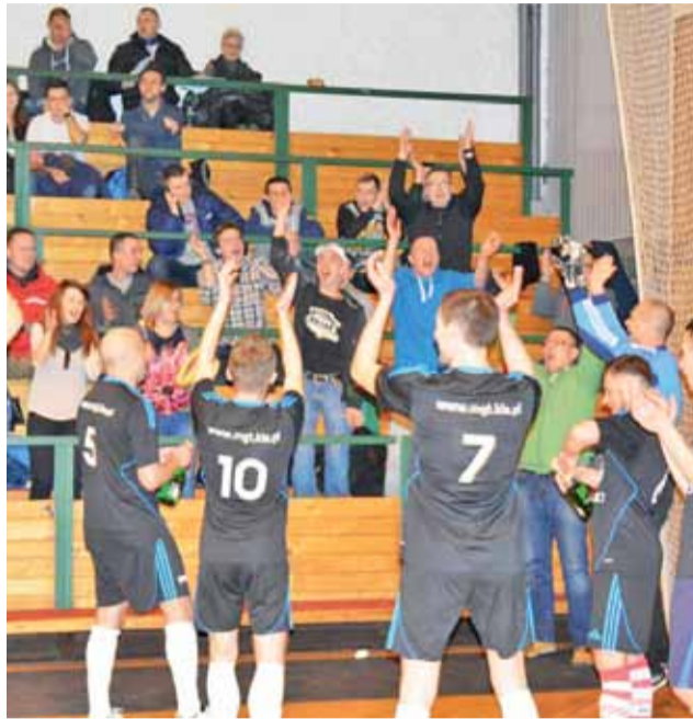
Tak świętowali tytuł ze swoimi fanami gracze Drużyny KIA Łowickiej.

Tak dobrych występów Korony Wejście chyba nikt się nie spodziewał. Zespół który miał walczyć o utrzymanie zajął piąte miejsce i był postrachem dla czołówki tabeli. Korona pokonała przeciż Chińską i Imadła, zaś Mistrzowie z Drużyny KIA wygrali z tym ze-