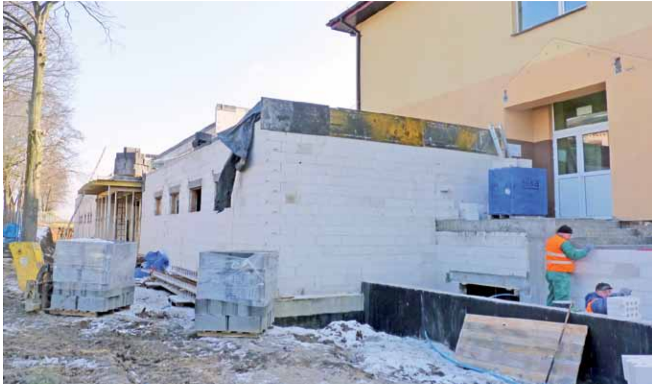
Najważniejszą inwestycją w gminie Oporów jest dokończenie budowy sali gimnastycznej przy Zespole Szkół w Oporowie, na co gmina pozyskała 1.250.000 zł. Inwestycja ma być zakończona do 1 września 2015 roku.

Samorządowcy liczą także na to, że otrzymają dofinansowanie wysokości kilkudziesięciu tysięcy złotych, które będzie można przeznaczyć na modernizację kolejnych dróg.