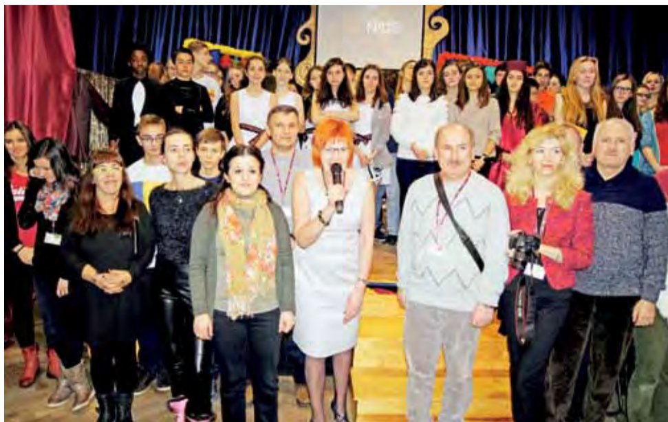
Finał projektu na scenie Gimnazjum nr 2.

Łowicz | Międzynarodowy projekt w Gimnazjum nr 2