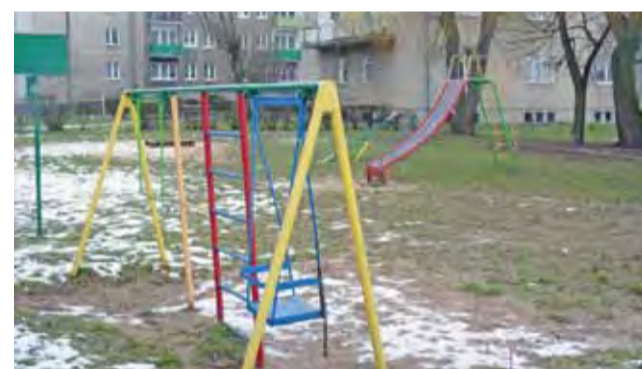
Póki co, na osiedlu Wyzwolenia są tylko takie miniplace z kilkoma urządzeniami, jak ten przy ulicy Waryńskiego. Na wiosnę na pewno będą uzupełnienia. Na zdjęciu widać, że brakuje jednej huśtawki.

– Została opracowana wstępna koncepcja placu zabaw, który byłby ogrodzony, bez dostępu dla czworonogów, z ławeczkami dla rodziców – informuje pre-