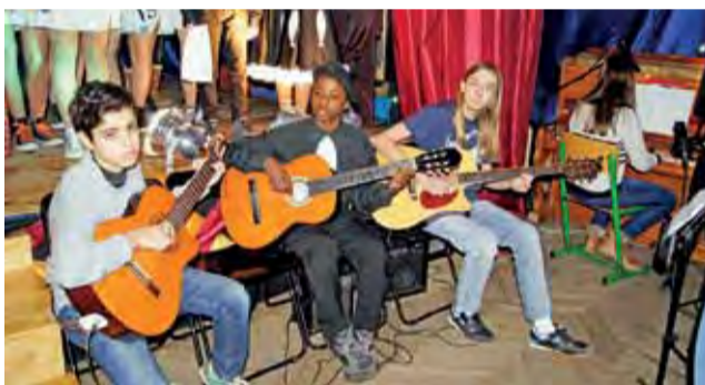
Uczniowie z krajów biorących udział w projekcie wykonują „Ode do radości”.

gielskim, uzupełniał je taniec, a jednym z najbardziej widowiskowych elementów programu, była katalońska Castellers, czyli wieża z ludzi – akrobacyjna kombinacja, symbolizująca przyjaźń, lojalność i zaufanie.