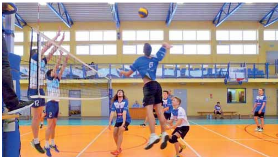
Spotkanie Volley Team Żychlin kontra Chem Pak Kutno, zakończone wynikiem 0:2.

W kolejnym meczu siatkarki z Bedna zmierzli się z LZS Kaszewy. Spotkanie skończyło się szybko, GKS bez większych