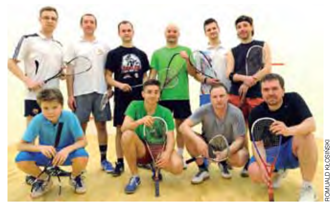
Uczestnicy 3. turnieju na kortie przy Łyszkowickiej.