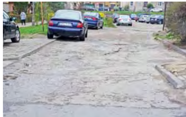
Na remont parkingu przy ulicy Traugutta 12 trzeba poczekać, aż gmina znajdzie pieniądze.

W jakim stanie jest parking przy ulicy Traugutta 12, wiedzą wszyscy mieszkańcy miasta. Dziurawy jak ser szwajcarski, ze studzienkami niebezpiecznie wystającymi. Mieszkańcy liczyli, że skoro po