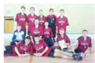
Chłopcy z Nowych Zdun zdobyli brązowe medale w mistrzostwach województwa łódzkiego.

Zdun wygrali z gospodarzami turnieju 1:0. Kolejny mecz w grupie był dużo bardziej wymagający. Po pierwszej połowie spotkania uczniowie ze Zdun wygrywali 2:0. Po ambitnym pościgu, niestety dla ekipy z powiatu łowickiego, drużyna z Łubnic wygrała mecz 3:2, strzelając ostatnią bramkę 14 sekund przed zakończeniem spotkania. Dodajmy, iż remis w tym meczu gwarantował zdunskiemu gimnazjum pierwsze miejsce w grupie i grę w finale imprezy. Uczniowie z Łubnic zrewanżowali się tym samym, za mecz z poprzedniego roku, gdzie to właśnie ekipa ze Zdun przegrywała po pierwszej połowie 2:0, by ostatecznie odnieść zwycięstwo 2:4. Jedno wygrane i przegrane spotkanie oznaczały drugie miejsce w grupie i grę o trzecie