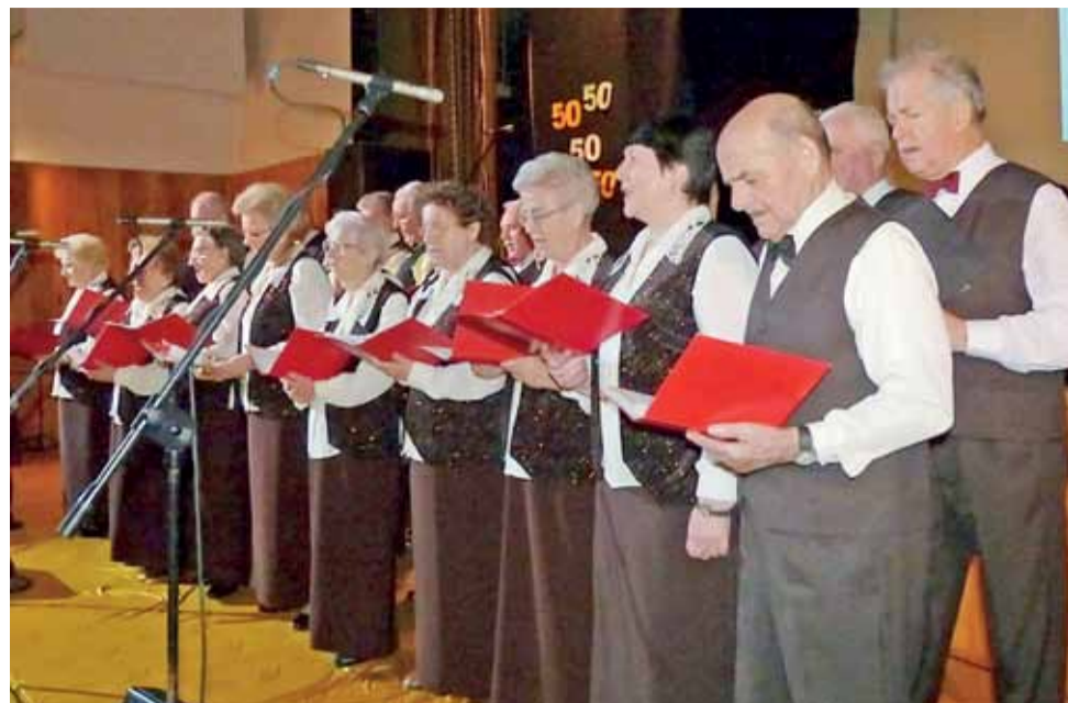
Chór „Melodia” powstał w ramach Klubu Seniora Radość. Nie mogło go zabraknąć na jubileuszowej imprezie.

Żychlin | 50 lat Żychlińskiego Domu Kultury: dużo miłych wspomnień i nie tylko