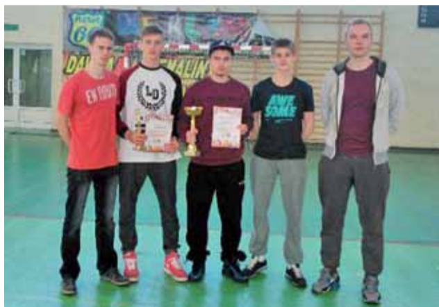
Skład drużyny UKS Żychlin podczas Międzymiastowego Turnieju Piłki Koszykowej Mężczyzn Gostynin 2015.