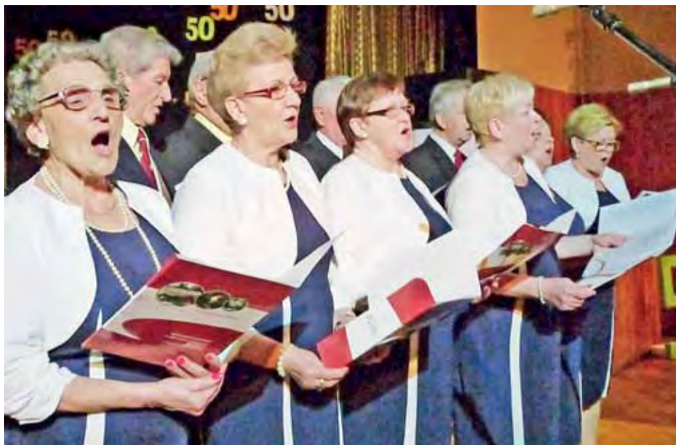
Chór Uniwersytetu III Wieku wykonał bardzo trudny utwór „Kwiaty polskie”.