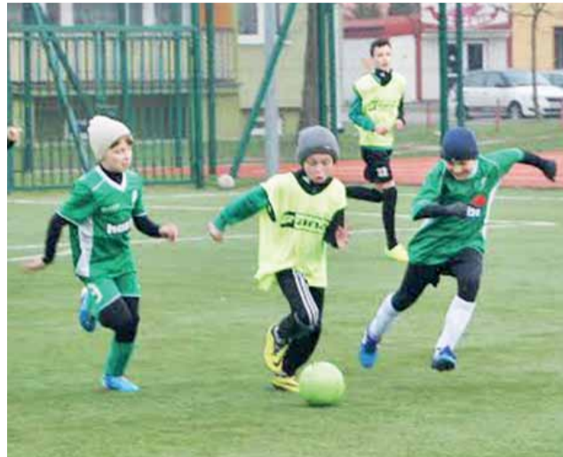
W meczu roczników 2003 i 2004 lepsi okazali się „młodszy”.