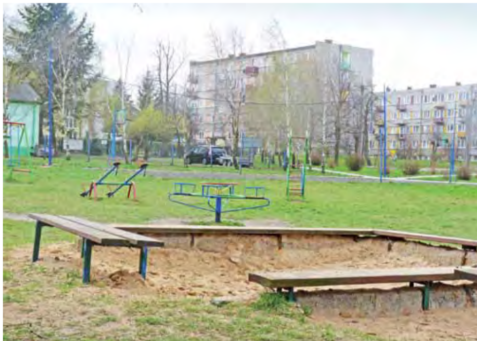
Spółdzielnia Mieszkaniowa Emit ma przy ul. Żeromskiego plac zabaw. Wprawdzie nie jest on najnowocześniejszy, ale jest i służy dzieciom.

Jako pierwsi wywiesiliśmy swoje plakaty i rozdaliśmy 800 ulotek. Ale nasz pomysł podchwycili inni i nagle na koniec marca zgłoszono 2 następne lokalizacje.