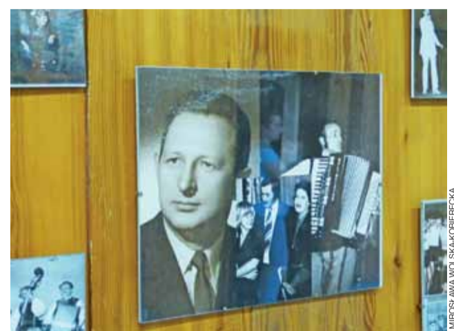
Wspomnień czar. Wystawa zdjęć z archiwum ŻDK była gratką zwłaszcza dla tych, którzy te czasy pamiętają.