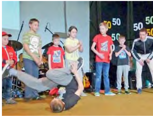
Pokaz grupy ćwiczącej break dance był pełny ewolucji w powietrzu, ale także na podłodze sceny.