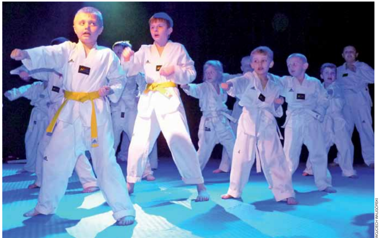
„Od przedszkolaka do olimpijczyka”. Taki program z najmłodszymi dziećmi prowadzi ŁAS. Już widać, ile dzieci umieją.