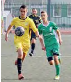
Pelikan 1999 zremisował na własnym boisku z Orłem Łódź 1:1.