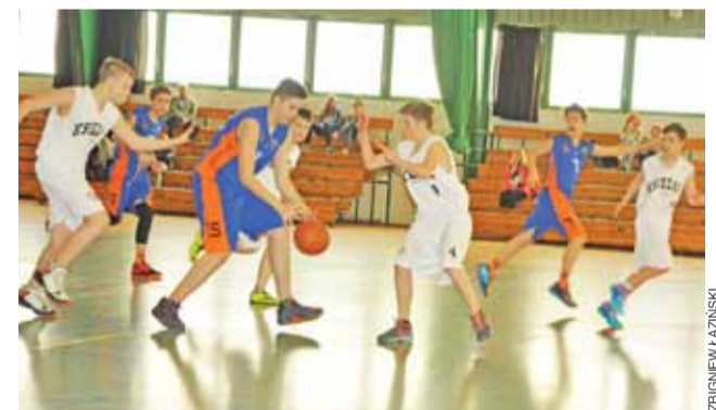
Koszykarze Księżaka w sobotę zakończą ligowe zmagania.

■ Klasyfikacja końcowa: 1. GP Nowe Zduny; 2. GP Radomsko; 3. GP Parzęczew; 4. GP Tomawa; 5. GP Uniejów; 6. GP Sędziejowice