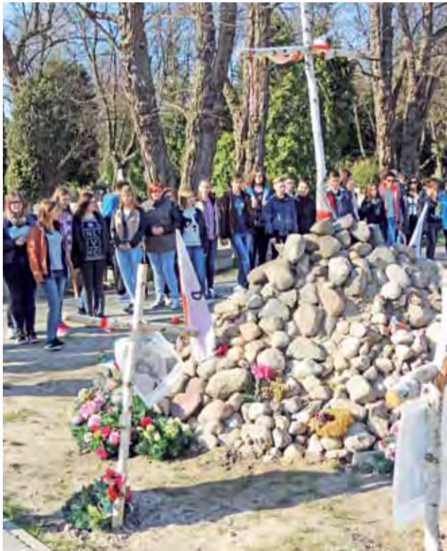
Uczniowie ZS Żychlin na tzw. Łączę, gdzie odnajdują się szczątki Żołnierzy Wyklętych pomordowanych przez UB po wojnie

Po zwiedzaniu Belwederu był czas na spacer i zwiedzanie Łazienek, chwile zadumy przy tzw. ławeczkach Chopina, z których płynie muzyka jednego z największych kompozytorów. Młodzież zwiedziła także Pałac na wodzie, zatrzymała się w miej-