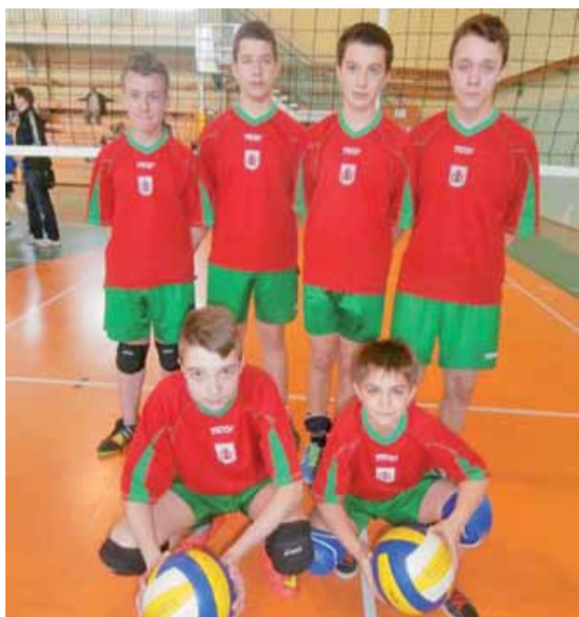
Reprezentacja klas VI SP Nr 2 w Żychlinie podczas Mistrzostw Województwa w Mini siatkówce Kinder+Sport.