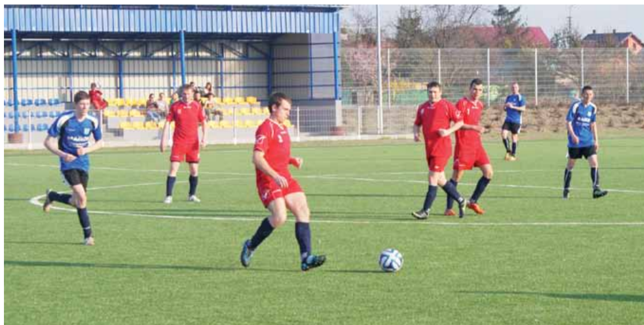
Spotkanie 13. kolejki łódzkiej klasy B grupy III pomiędzy Delta Śleszyn a GKS Byszew, zakończony wygraną Delty 5:0.

Drugą drużyną grającą w tej samej klasie jest Olimpia Oporów. Zmierzyli się oni z zespołem Kanarki Małachowice. Kibice zobaczyli w tym spotkaniu aż 12 bramek. Niestety drużyna z Oporowa przegrała tą rywalizację 4:8. W następnej kolejce