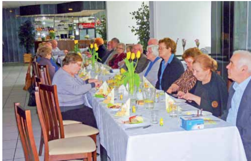
Diabetycy podczas spotkania na Kaliskiej.