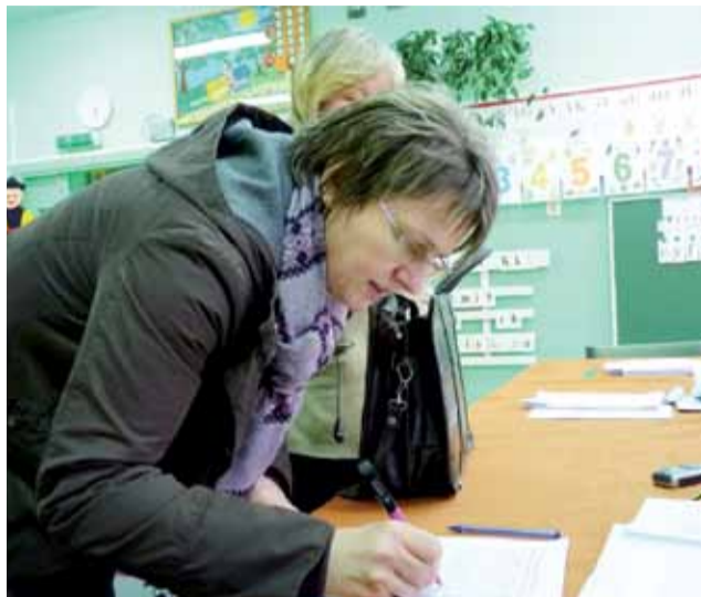
Tak głosowano w czasie konsultacji społecznych w 2012 roku.

kiej z terenów zabudowy usługowej kultu religijnego na cele zabudowy usługowej i innej użyteczności publicznej.