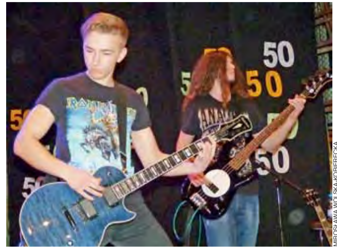
Muzycy z zespołu Unnamed sami określają siebie jako kapelę, która eksperymentuje z szerzej pojętym rock and rollem.