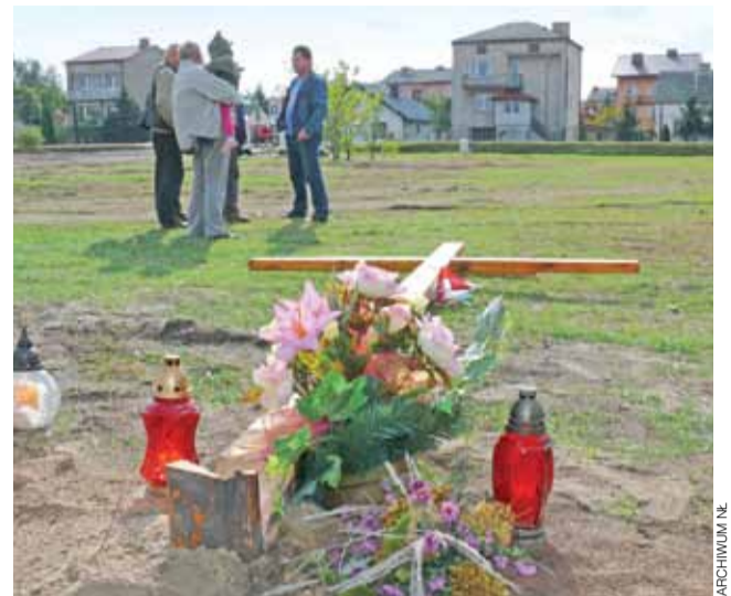
A tak wyglądał postawiony kilka dni wcześniej, a potem obalony krzyż.