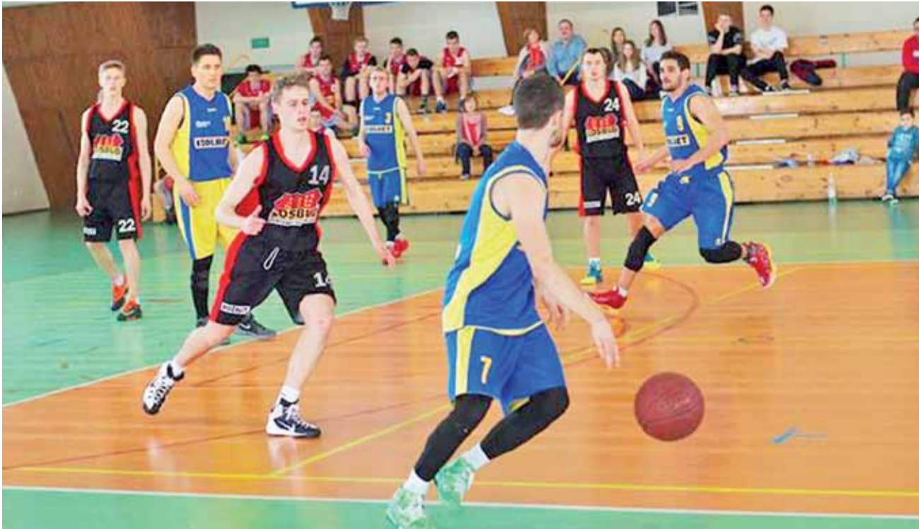
Koszykarze UKS Żychlin podczas finałowego meczu z drużyną Izolbet Basket Gostynin.

Piłka koszykowa | Międzymiastowy Turniej Piłki Koszykowej