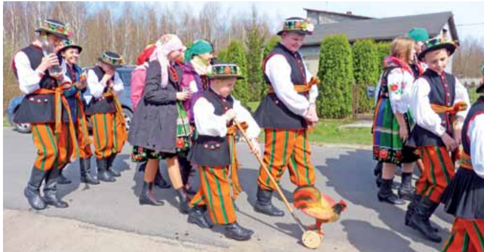
Chodzenie z gaikiem i kogucikiem dzieci rozpoczęły o godz. 13, od tzw. traktu.