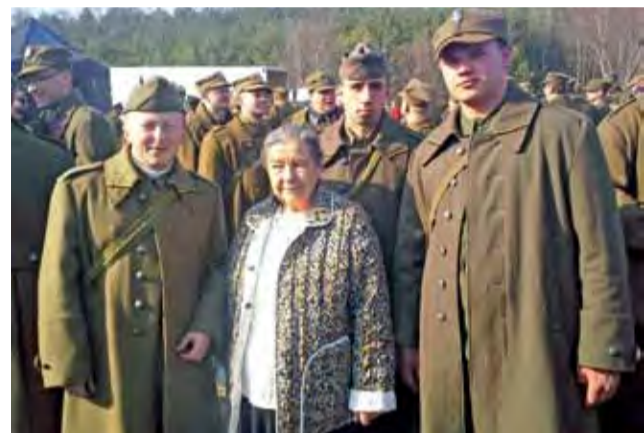
Członkowie łowickiego Stowarzyszenia Historycznego im. 10 Pułku Piechoty

mieli okazję 11 kwietnia wziąć udział pod Warszawą w zdjęciach do filmu Smoleńsk w reżyserii Antoniego Krauze. Film opowiadać będzie historię dziennikarki, która prowadzi własne śledztwo w sprawie katastrofy smoleńskiej sprzed 5 lat. W filmie znajdują się także obrazy z 1940 roku, gdy polscy oficerowie byli mordowani w Katyniu, stąd obecność na planie grup rekonstrukcji historycznej. Dziesiątka zrobiła sobie pamiątkowe zdjęcie z aktorką Katarzyną Łaniewską, która zagrała rolę Anny Walentynowicz. tb