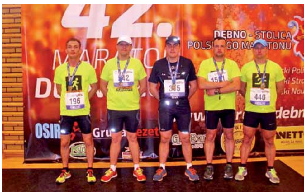
Grupa „Rozbiegani - Żychlin” podczas 42. Maratonu Dębno 2015.