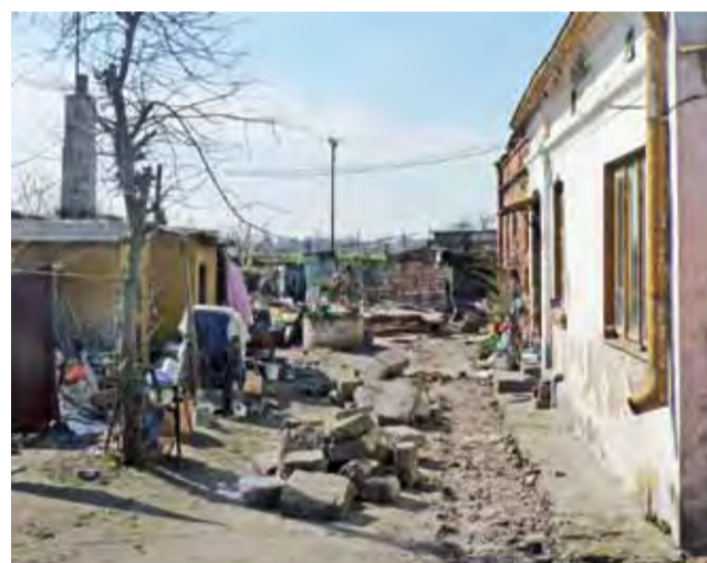
Po śmierci starszego pana bałagan na terenie posesji Narutowicza 36 ma w ciągu kilku tygodni zniknąć. Okoliczni mieszkańcy liczą, że wreszcie będzie koniec z fetorem i szczurami.

Liderzy rankingu internetowego (stan na wtorek) to: Żyrardów – 21.770 głosów, Ostrowiec Świętokrzyski – 18.761 głosów, Marki – 18.388 głosów. dag