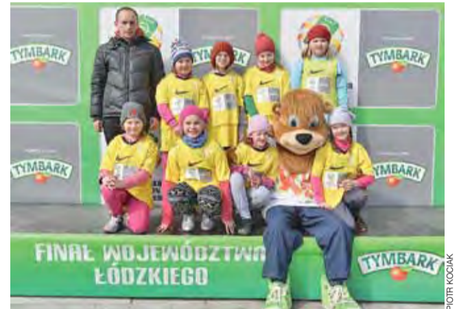
Dziewczęta z klas III z SP Bielawy zdobyły brązowe medale.