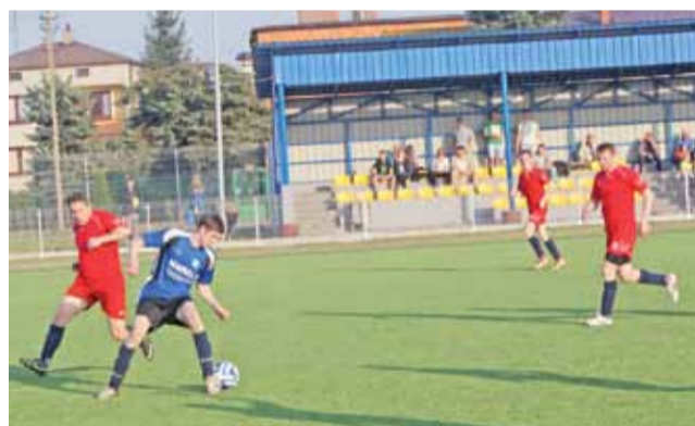
Obroncy Delty Śleszyn nie dali sobie strzelić ani jednego gola.

rozgrywek łódzkiej klasy B grupy III: w sobotę – 18 kwietnia Delta Śleszyn zmierzy się na