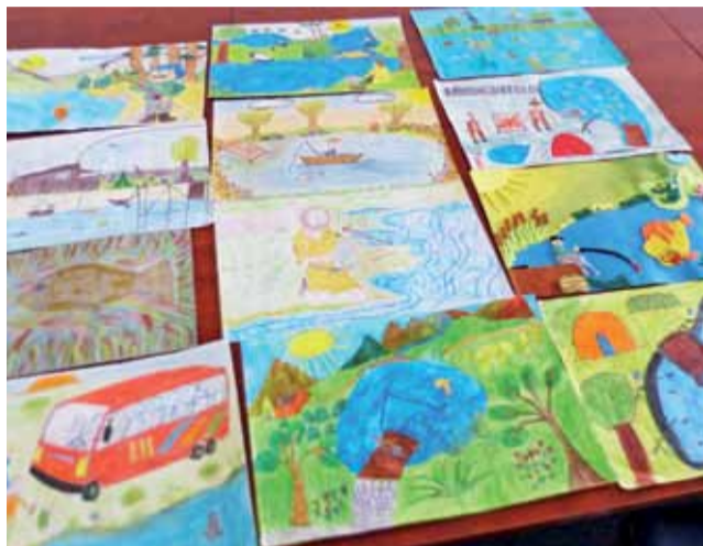
To tylko niewielka część spośród 457 prac zgłoszonych do konkursu.