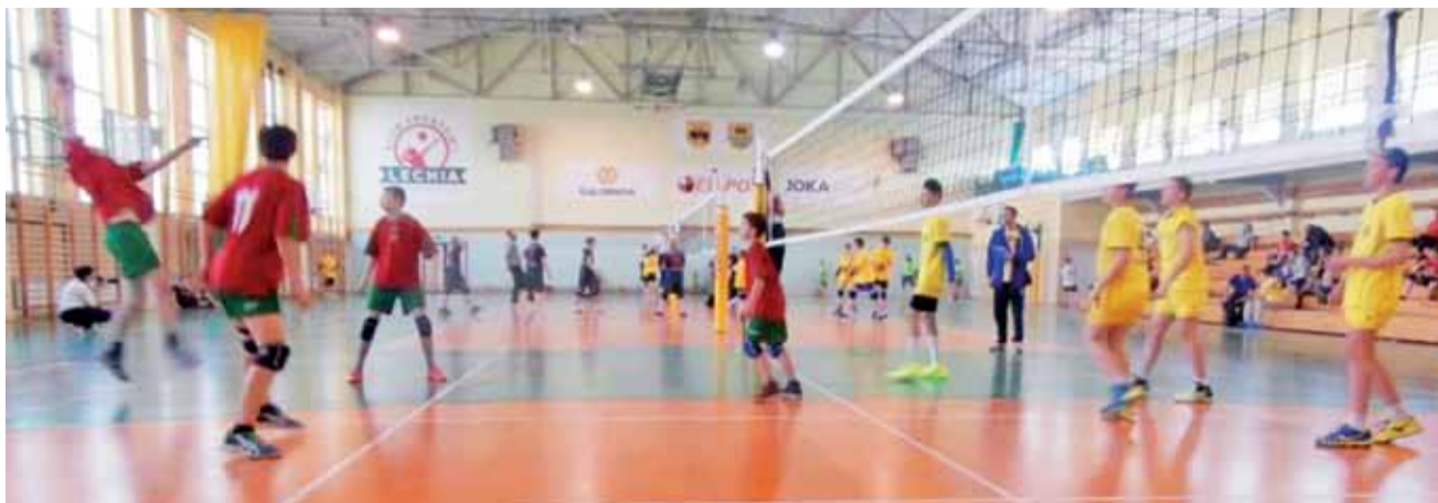
Jedno ze spotkań siatkarskich Kinder+sport.