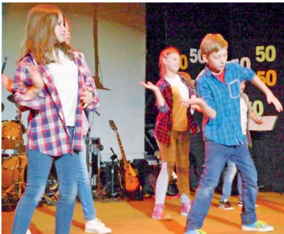
Młodzież z grupy Step UP tańczyła w strojach sportowych: koszulach w kratkę i jeansach.

Wszyscy goście zostali poczęstowani wielkim tortem czekoladowym, zamówionym w cukierni braci Miś w Łodzi. Jak się dowiedzieliśmy, ważył on 25 kg. W czasie trwania imprezy w hallu były eksponowane zdjęcia pokazujące działalność placówki w minionych dekadach, a na sali obok przygotowano wystawę prac wykonywanych obecnie na spotkaniach sekcji plastycznej oraz Uniwersytetu Trzeciego Wieku. mwk