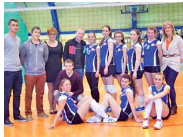
Reprezentacja Zespołu Szkół Żychlin podczas Rejonowego Finału w Piłce Siatkowej Dziewcząt.