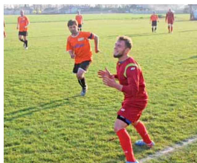
Przegrana drużyny GKS Bedno na własnym boisku z liderem KS Kutno 1:4.