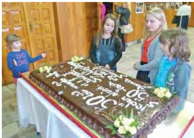
Tort jubileuszowy ważył 25 kg. Zanim trafił na salę koncertową, bacznie obserwowany był przez najmłodszych bywalców ośrodka.