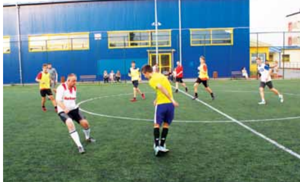
Mecz pomiędzy drużynami: The Naturat kontra Sztynna Ekipa, który zakończył się wygraną Ekipy 10:3.