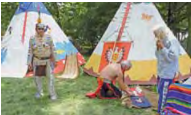
Obok żołnierzy byli też Indianie. Do Kutna zawitali w sobotę, choć w niedzielę w Białymstoku odbywał się ogólnopolski zlot Indian.

– W tym roku gościliśmy około stu grup rekonstrukcyjnych z całej Polski, w skład których weszło około tysiąca rekonstruktorów. Odwiedziło nas kilkanaście tysięcy ludzi – mówi