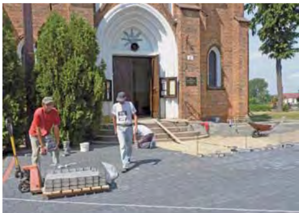
Trwa układanie kostki oraz budowa podjazdu dla niepełnosprawnych przed kościołem w Pacynie.

System monitoringu ma być wyposażony w akumulatory i zasilacze, które zapewniąby nieprzerwaną pracę monitoringu nawet w przypadku braku prądu. Zamawiający żąda od oferenta co najmniej 24-miesięcznej gwarancji. W przypadku awarii wykonawca ma usunąć usterkę w ciągu 21 dni. Oferent ma też przeszkolić dwie osoby do obsługi monitoringu. Oferenci mają składać oferty do 31 lipca, a zadanie ma być wykonane do końca września. dag