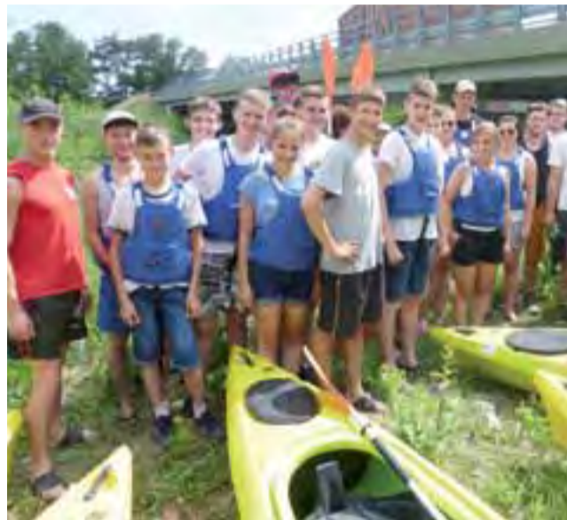
Uczestnicy spływu tuż przed wyruszeniem ze Strugienic do Łowicza.

Po krótkim odpoczynku wszyscy wyruszyli w dalszą drogę do Łowicza. Nad całością wyprawy