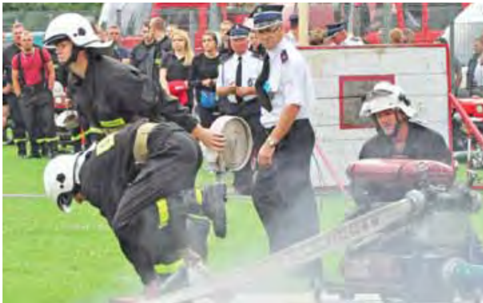
Zawody pod czujnym okiem kilku sędziów (na zdjęciu to strażak w białej koszuli), którzy z bliska przyglądali się, czy druhowie nie popełniają błędów regulaminowych. Ćwiczenie bojowe rozpoczynają druhowie z Kompiny.

Podczas zawodów w pierwszej kolejności wystartowały w sztafecie młodzieżowe drużyny pożarnicze. Do zawodów zgłosiły się 3 drużyny. Pierwsi wystartowali młodzi strażacy z OSP w Bedna-