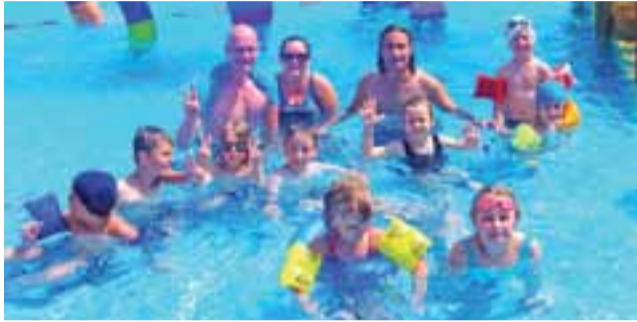
Półkoloniści z Żychlina odwiedzili też termy w Uniejowie.

Uczestnicy II turnusu byli na wycieczce w Termach Uniejów. Po trzech godzinach zabawy w ciepłych wodach termalnych na dzieci czekał obiad i kolejna atrakcja – wizyta w wiosce indiańskiej TATANKA. W tym niezwykłym miejscu uczestnicy poczuli i zobaczyli, jak wyglądało życie codzienne Indian Ameryki Północnej, obejrzeli bogatą kolekcję indiańskiego rękodziela. Po-