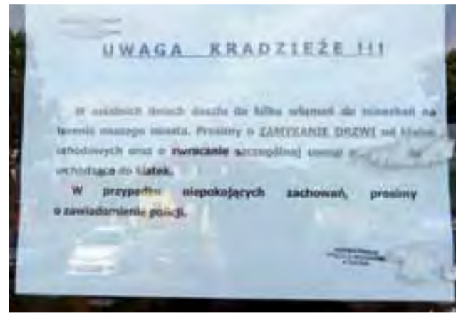
Spółdzielnia Mieszkaniowa w Żychlinie w blokach na osiedlu Traugutta wywiesiła ostrzeżenia dla swoich mieszkańców, by zachowali czujność.

Ludzie, zwłaszcza starsi, czasami są łatwowierni i wpuszczają do domów różne obce osoby, które np. mają do zaoferowania różne produkty w super cenach. Te proszą o szklankę wody, a gdy starsza kobieta pokuściła po wodę, w tym czasie dokonują lustracji kredensów, bielizny, gdyż jak się okazuje, tam najczęściej ludzie chowają pieniądze i biżuterię. Bywa, że inni oszukują na wnuczka, o czym wiele razy mówi się w mediach. A wystarczy telefon do wnuczka czy kogoś z rodziny, aby dowiedzieć się, czy rzeczy-