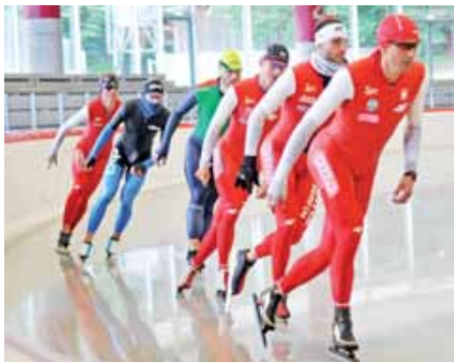
Trening na lodzie. Przed lipcem trenowano tylko poza kadrą.

Inzell to miejscowość położona w południowo-wschodniej Bawarii, tuż przy granicy z Austrią. Ze względu na swe położenie jest to ulubione miejsce do trenowania dla wielu naszych panczenistów.