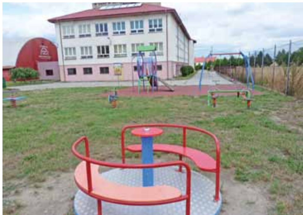
Dotychczasowe urządzenia na placu zabaw zakupiono w 2013 roku.

Pozostała kwota dofinansowania w wysokości 84.683 zł zostanie przeznaczona na doposażenie oddziałów przedszkolnych. Zostaną zakupione m.in. nowe ławki, krzeselka, szafki, pufy. Zmodernizowane zostaną toalety, które będą przystosowane dla małych dzieci. Zmodernizowana zostanie szatnia. Zakupione będą pomoce dydaktyczne oraz dwa radiodtwarzacze, drukarka i aparat fotograficzny. dag