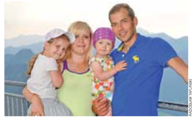
Zbigniew Bródka z rodziną na tle alpejskich szczytów.

Dlaczego to tak ważne? Otóż w okresie wiosenno-letnim łyżwiarze szybcy przygotowują do zbliżającego się sezonu, jeżdżąc głównie na rolkach i rowerze, ćwicząc na siłowni oraz wykonując różne ćwiczenia imitujące jazdę na łyżwach. Dopiero od lipca panczeniści zaczynają treningi na lodzie, które mają za zadanie wy-