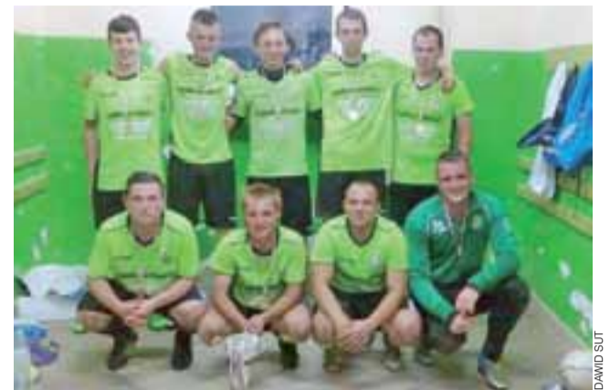
SMS Dąbkowice zwyciężył w Bielskiej Lidze Szóstek.

■ Team Drogusza – PP OSP Chruslin 0:5 (wo); zespół Team Drogusza nie stawia się na meczu