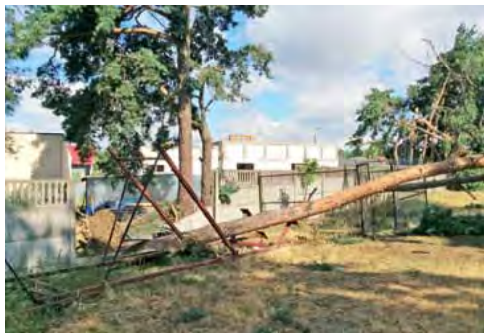
Nawałnica uszkodziła aż 5 drzew przy kościele na Korabce. Na szczęście nikomu nic się nie stało.

parków, ale gałęzi i konarów jest tak dużo, że ich pocięcie i wywiezienie potrwa nawet 2 tygodnie – powiedziała nam Monika Antczak. – Najbardziej jednak smuci nas to, że w wyniku burzy straciłmy kilkanaście drzew. W Nieborowie np. przewrócił się modrzew, który liczył 130 lat, upadając pociągnął za sobą jedną z lip rosnących w osi widokowej pałacu (po południowej stronie – przyp. red). W sumie w tym parku złamanych lub przewróconych zostało 10 startych drzew (m.in. akacje, wiąz), jedno z nich – kasztanowiec – o mało nie upadł na pawilon stojący obok pałacu – powiedziała nam. Podkreśliła przy tym, że szczęśliwie żadne z drzew ani też odłamany konar nie upadł na ścieżkę zabytkowych budowli. W parku w Arkadii wiatr „położył” 4 drzewa w pasie pomiędzy zbiornikiem wodnym a rzeką Skierniewką, wśród nich był ponad 100-letni wiąz. ■