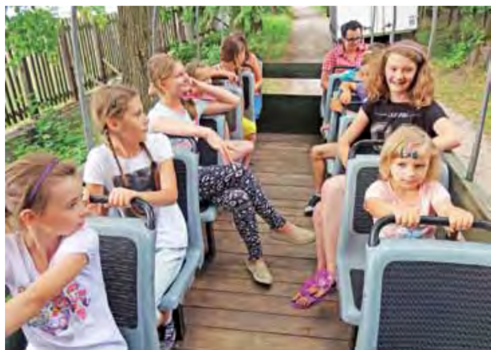
Atrakcją była też przejażdżka wozem konnym.

Elektrownia wiatrowa w Śleszynie będzie mieć moc do 2,5 MW. Wirnik będzie mieć średnicę od 50 do 100 m, zaś wirnik będzie zawieszony na wysokości od 70 m do 135 m. Całkowita wysokość elektrowni wiatrowej to 185 m. Maksymalna ilość obrotów śmigieł – 25 na minutę. Fundament pod ten większy wiatrak też będzie większy – 600 m 2 . Droga wewnętrzna zostanie wzmocniona kruszywem wapiennym. Na etapie budowy do wieży zostanie doprowadzona droga dojazdowa o szerokości 4 m. Trwale z użytkowania rolniczego zostanie wyłączonych 2862 m 2 . Najbliższa zabudowa znajduje się w odległości 447 metrów. str. 6