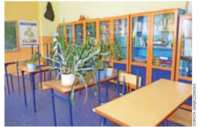
W tej klasie w SP w Pniewie za trzy miesiące będzie super nowoczesna pracownia przyrodnicza z nowymi meblami i pomocami dydaktycznymi.