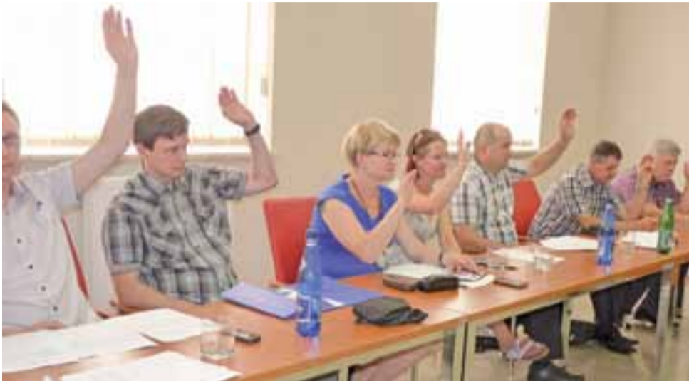
Radni dokonali zmian w budżecie. Zabezpieczyli pieniądze na zakup służbowego auta oraz na opracowanie uproszczonej dokumentacji na remont dróg gminnych.

Czarny PR bronią w walce o zdobycie ucznia str. 6