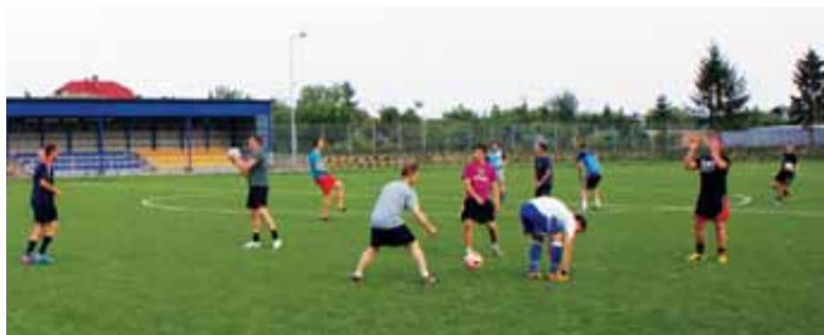
Duża frekwencja piłkarzy na pierwszym treningu KS Żychlin na Stadionie Miejskim w Żychlinie.