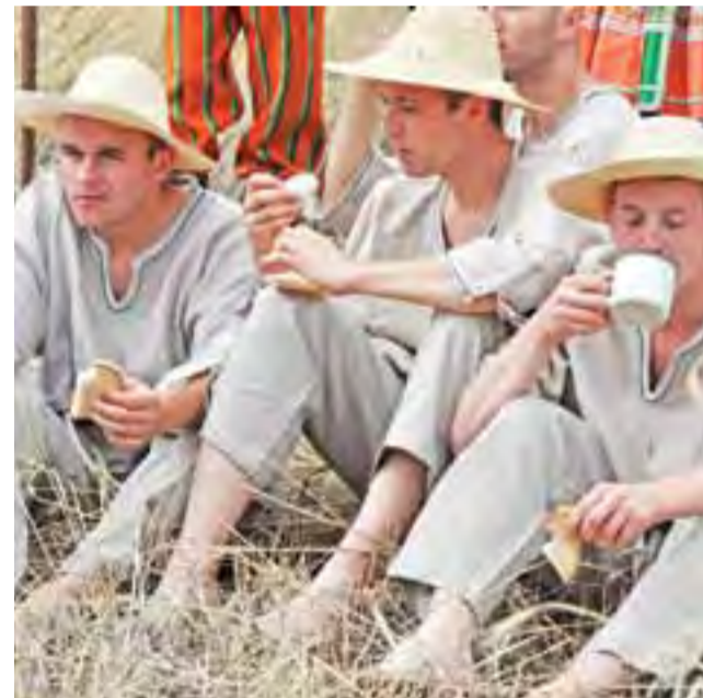
Posiłek żniwiarzy: chleb, mleko i gotowane jajka.

Zapraszamy do obejrzenia obszernej galerii zdjęć z Maurzyc na stronie www.lowiczain.info