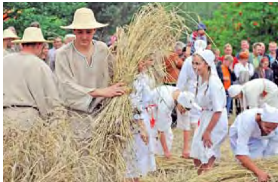
Żniwiarze, czyli członkowie zespołu Boczki Chełmońskie, na oczach publiczności kosili zboże, układali je w snopki i później zwieźli do zagrody.