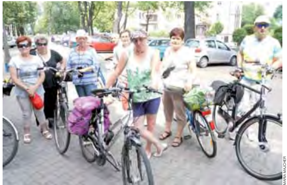
To tylko część grupy. Łącznie jechały aż 22 osoby.

Wyjazd proboszcz podsumował słowami: – Myślę, że było to dla wszystkich piękne przeżycie. Nieczęsto doświadczymy takiej bliskości z naturą – a jednocześnie z Bogiem. Wielu uczestników wyjazdu było zaskoczonych tym, że nie wiedzieli, że tak blisko Łowicza są tak zapierające dech w piersiach krajobrazy. mm