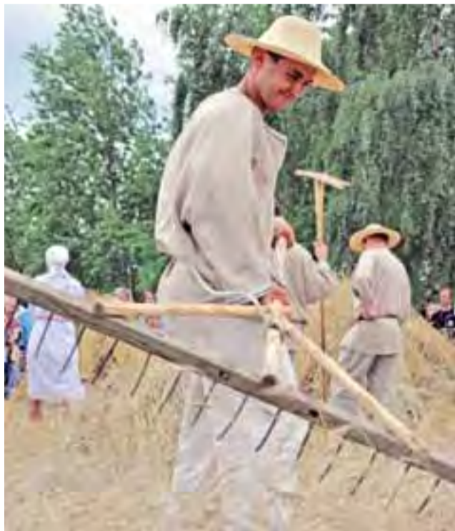
W taki sposób należało po ścięciu zboża zagrabić ściernisko. Grabie do ścierniska w części były zabytkowe, należało tylko dorobić trzonek.