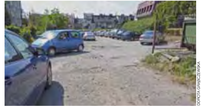
Radni miejsca podjęli uchwały o przejęciu terenu parkingowego od spółdzielni. To pozwoli na jego remont.

Według naszych ekspertów wystarczy zrobić nowe obrzeża i wyrównać całość parkingu.