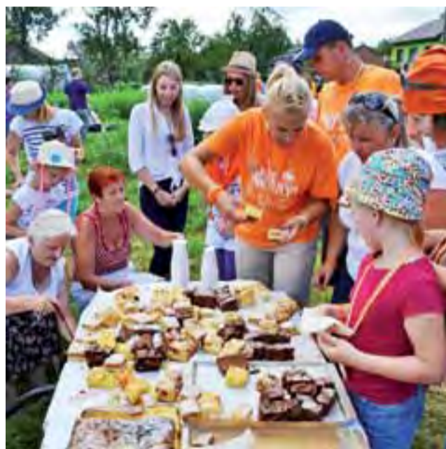
Poczęstunek w drodze to okazja do regeneracji sił.