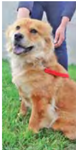
Urząd Gminy w Żychlinie szuka nowego domu dla rudej suczki ze schroniska. dag

ki, szlifierki i inne urządzenia, które czerpią prąd. Jeśli ktoś chce mieć wtyczkę, wtedy musi zamontować podlicznik energii, a instalację zrobić zgodnie z wymogami przeciwpożarowymi. To dla bezpieczeństwa w bloku. Po zakończeniu przeprowadzek lokatorów budynek stojący obok stadionu, pełniący funkcję piwnic dla lokatorów Narutowicza 83, który w poprzednich miesiącach płonął kilka razy – zostanie rozebrany. dag