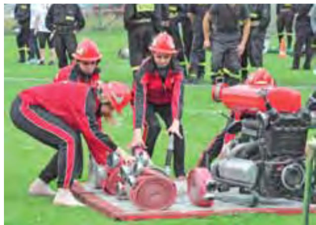
Dziewczęta z OSP w Nieborowie w tym roku zajęły w zawodach, w grupie „C” – drugie miejsce. W ubiegłym roku były trzecie.

rach i po uzyskaniu czasu 60,1 sek (bez punktów karnych, które są przyznawane za nieregularne wykonanie zadania, np. przekroczenie linii przekazania prądnicy itp) widać było, że ich konkurenci nie będą mieli łatwego zadania. W ćwiczeniu bojowym również byli najlepsi – czyli najszybsi. W ostatecznej klasyfikacji I miejsce zajęła młodzieżowa drużyna pożarnicza z Bednar (łącznie czas sztafety i „bojówki” – 94,7 s), II miejsce – MDP OSP z Dzierzgowa (czas 107,9 s), III miejsce – MDP OSP Bobrowniki (czas 110,4 s).