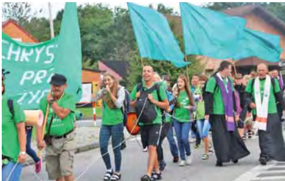
Zielona Grupa na pątnicznym szlaku na XIX pielgrzymce na Jasną Górę.