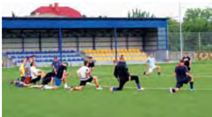
Ćwiczenia rozciągające podczas pierwszego treningu zawodników.