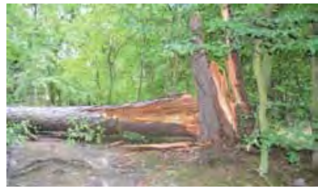
Przewrócony 130-letni modrzew przy głównej osi widokowej parku w Nieborowie – to jedno z 10 drzew, które przegrało walkę z silnym wiatrem w niedzielę, 19 lipca.

Strażacy nie odpoczywali długo po nawałnicy, gdyż kolejna, ale znacznie mniej dotkliwa w skutkach, przyszła szybciej niż się spodziewali – 25 lipca. ■