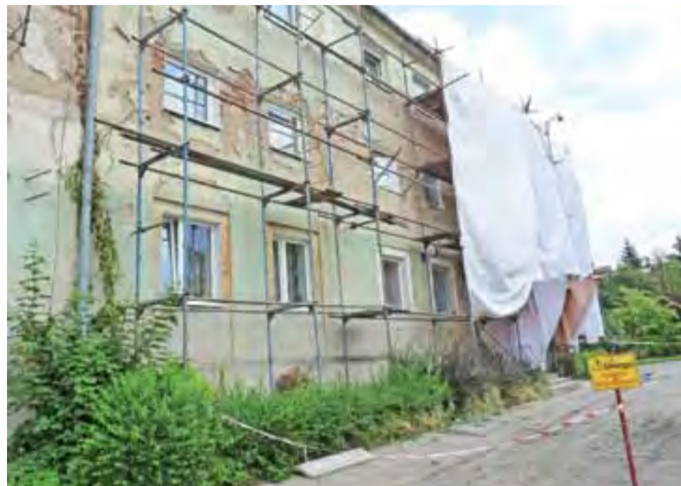
Mieszkańcy bloku Narutowicza 75 na osiedlu Wyzwolenia doczekali się wreszcie remontu elewacji swojego najstarszego bloku w Spółdzielni Mieszkaniowej Wspólny Dom, który został wybudowany w 1875 roku.

– Gdyby mieszkańcy wykazali więcej zrozumienia dla zakresu wykonywanych prac i zdjęli na czas prac satelitarne czasze, prace postępowałyby sprawniej – podkreśla prezes Rosiński. – Wprawdzie te elementy są zabezpieczone, ale zawsze istnieje ryzyko uszkodzenia, a roboty spowalniające. Stąd prośba i apel do następnych mieszkańców, gdzie prace będą prowadzone, aby zdejmowa-