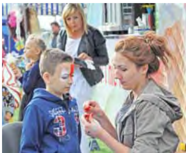
Malowanie twarzy, dmuchane zamki i koncerty były atrakcjami VII Pikniku Rodzinnego w Lwówku.

Odbyła się również ceremonia wręczenia pucharu i medali za awans drużyny juniorów Lwówianki Lwówek do I ligi okręgowej juniorów starszych U-19. Na scenie rozstawionej na boisku można było też obejrzeć występ cheerleaderek ze Szczawina