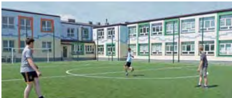
Osiem kamer będzie obserwować boiska przy Zespole Szkół Ogólnokształcących już we wrześniu.

Zamontowanych zostanie 8 zewnętrznych kamer z promiennikami podczerwieni regulowanym obiektywem o kolorowym obrazie. Szacuje się, że konieczne będzie ułożenie ok. 700 metrów