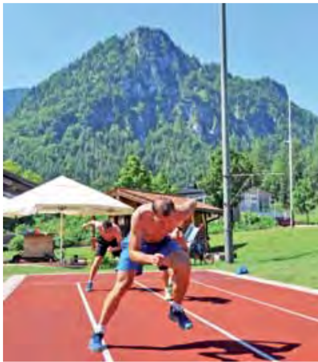
Trening przed halą lodową w Inzell – skoki imitujące jazdę na lodzie.

Większość torów łyżwiarskich znajduje się w dużych miastach, po których jazda rowerem nie jest zbyt przyjemna i bezpieczna. W Inzell już po przejechaniu kilkuset metrów znajdujemy się poza obszarami zabudowanymi, wśród rozległych łąk, lasów, jezior oraz gór. Są to idealne warunki do jazdy na rowerze czy rolkach.