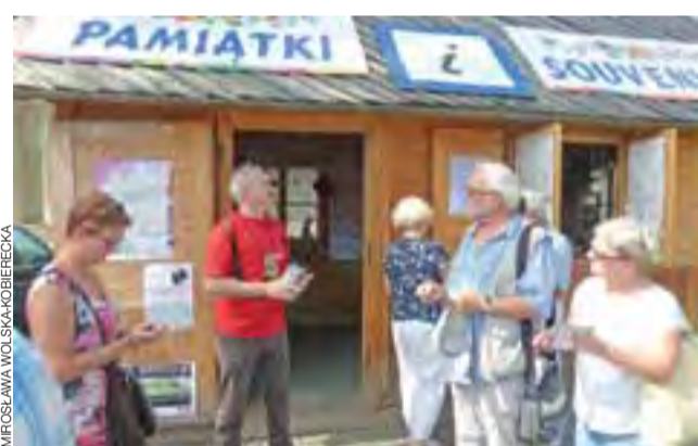
Każdy spacer rozpoczął się przy drewnianej chatce.

Organizatorzy już teraz zapowiadają, że seanse plenerowe będą kontynuowane również za rok. Pojawił się pomysł zorganizowania kina objazdowego pod hasłem „Fenix on tour”. Wówczas projekcje odbywałyby się w wybranych miejscach na różnych osiedlach. aa