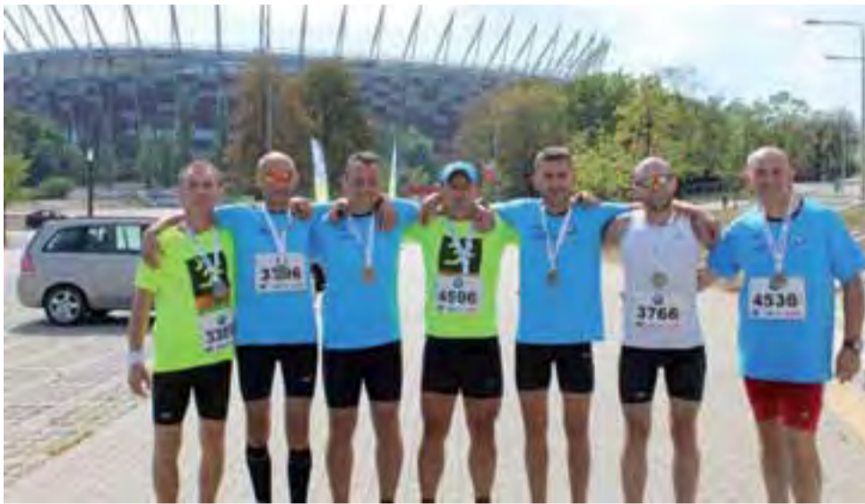
Uczestnicy drugiej edycji Półmaratonu Praskiego – grupa „Rozbiegani Żychlin”.