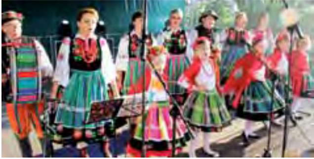
Zespół Kiernożanie z kapelą podczas występów w parku w Kiernozi.