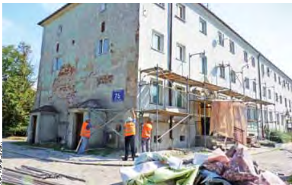
Do końca tygodnia zostanie zakończona układanie nowej elewacji na szczycie budynku Narutowicza 75, następnie budowlańcy przejdą na osiedle Traugutta, by remontować balkony.

W gminie Oporów suszą objęto dodatkowo kukurydzę na kiszonkę, ziemniaki, rośliny strączkowe i krzewy owocowe rosące na glebach IVb i słabszych, ziemniaki nawet na kl. IIIb. dag