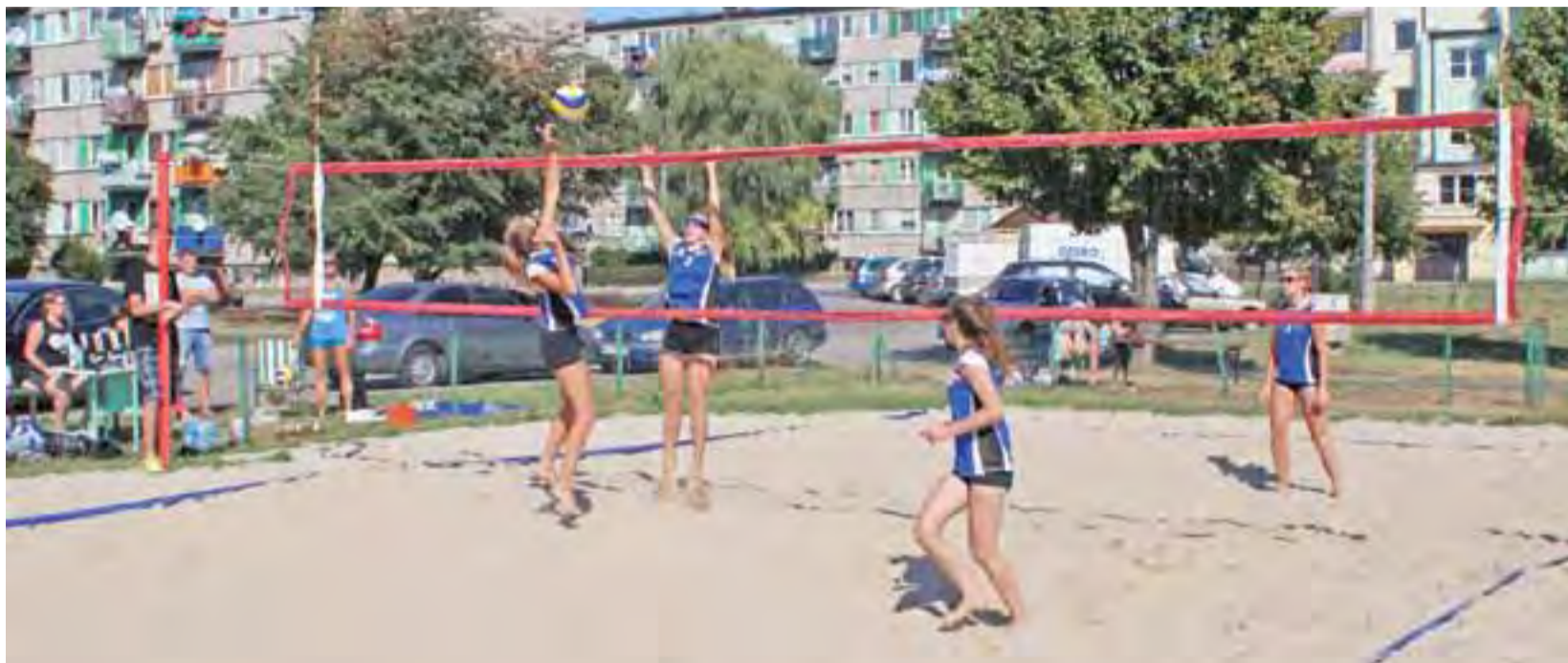
Jeden z meczów eliminacyjnych podczas sobotniego Turnieju Siatkówki Piłkowej Kobiet w Żychlinie.

Piłka siatkowa | Turniej Piłki Piłkowej Kobiet 2015