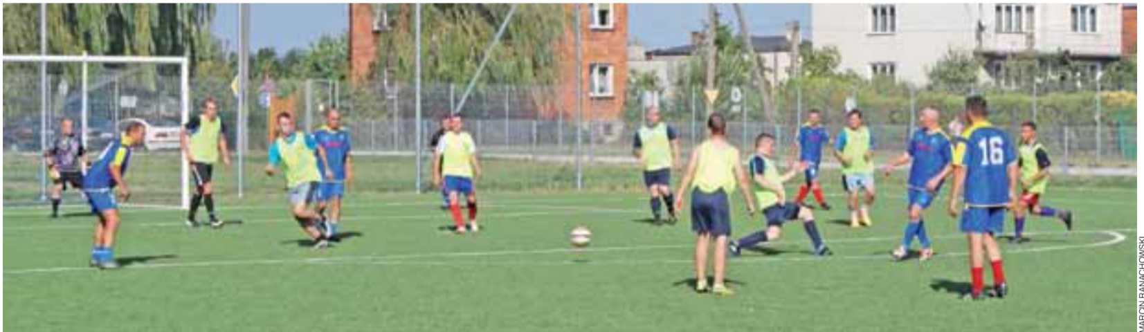
Nie udał się rewanż piłkarzy KS Żychlin, którzy przegrali z drużyną Oldboje Kutno 4:5

Zamiast planowanego spotkania, żychlinianie zaprosili na mecz sparingowy zespół Oldboje Kutno. Miał to być rewanż za