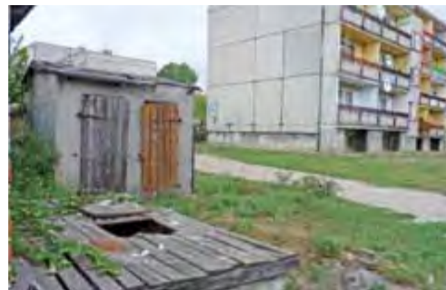
Fetor z otwartej kloaki w centrum miasta, przy Narutowicza 55 i 53, utrudnia od lat normalne funkcjonowanie mieszkańcom pobliskich bloków.