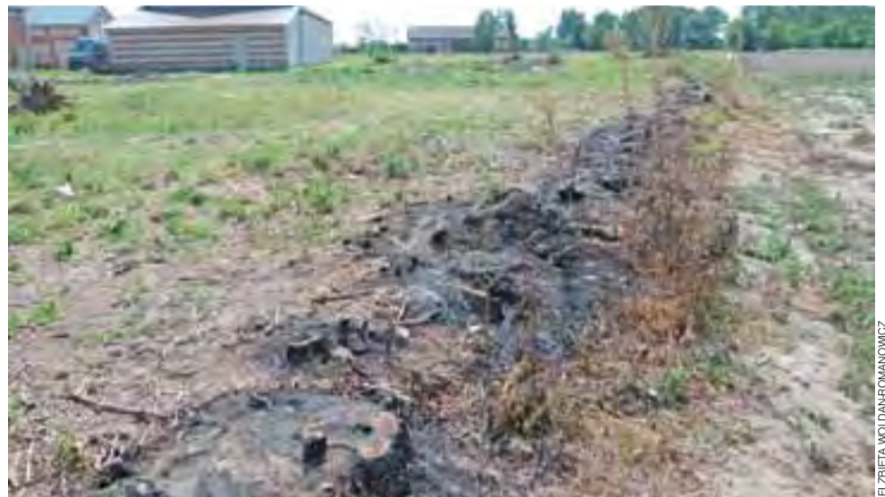
Interwencja z pogranicza Borówka i Borowa. Ślady po wycince i wypalaniu pni, stan na 26 sierpnia.