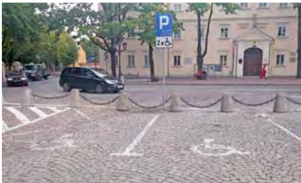
Z zaparkowaniem na kopertach w Łowiczu nie ma obecnie problemu. Liczba tych miejsc wydaje się wystarczająca.

I to w dużej mierze się udało, nie tylko w Łowiczu. W Łodzi liczba kart parkingowych przed zmianami wynosiła 27 tys., nowych wydano 4,4 tys. zł. Jednak na pewno są jeszcze niepełnosprawni, którzy przegapili termin, więc powinni jak najszybciej zadbać o wydanie nowej karty. ■