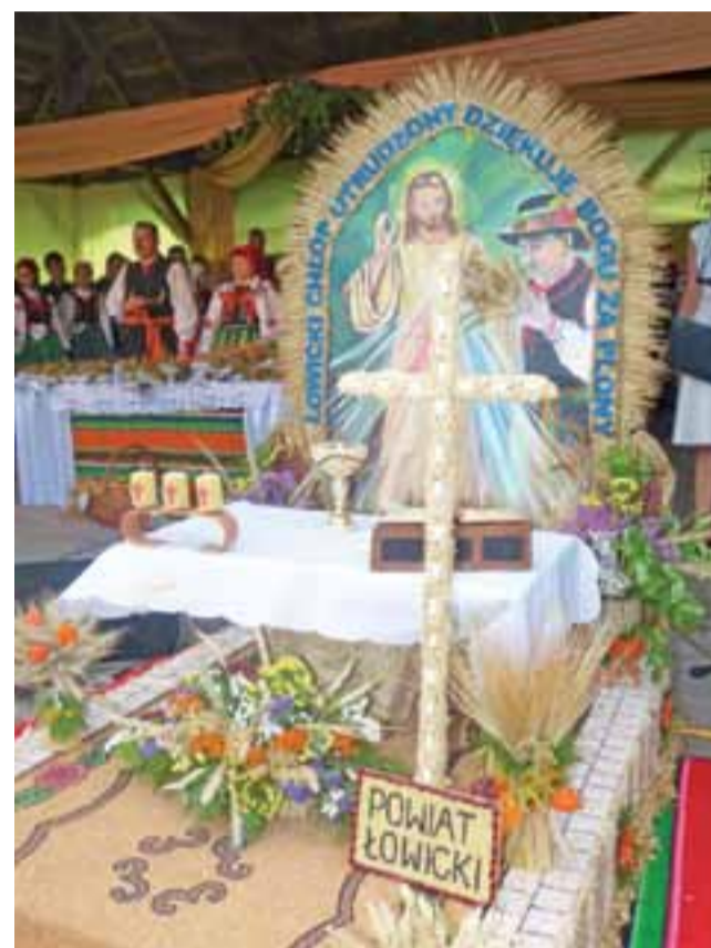
Wieńiec w kształcie ołtarza, od powiatu łowickiego, wykonali mieszkańcy Jackowic w gm. Zduny. Praca przy nim trwała cały miesiąc.