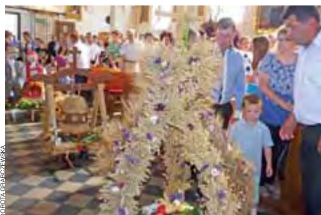
Wszystkie wieńce dożynkowe wymagały ogromnego zaangażowania wielu osób. Stały się pośrodku kościoła, by można je było podziwiać. W kościele zostaną do 8 września.