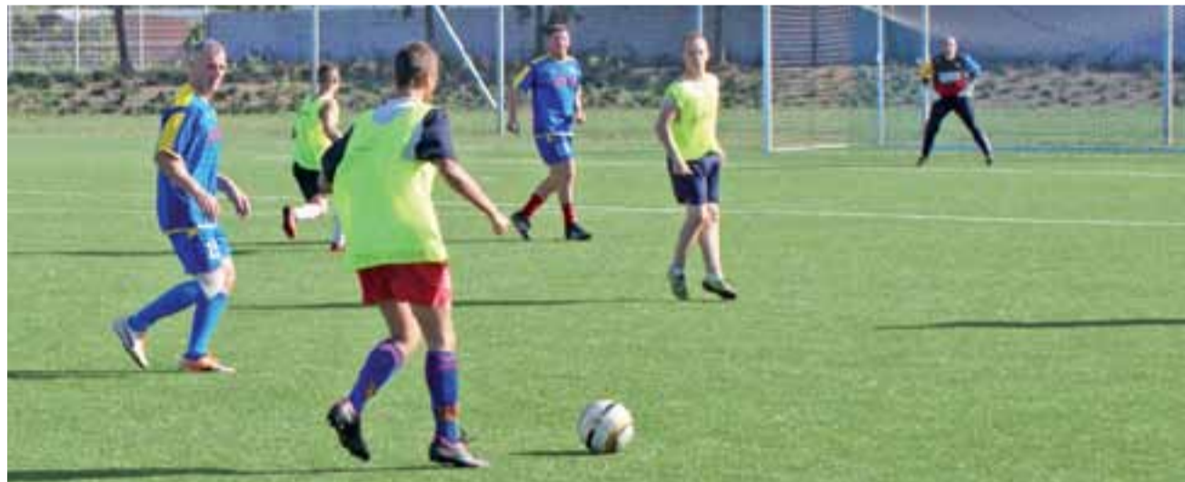
Jeden z ataków drużyny KS Żychlin na bramkę przeciwnika w niedzielnym spotkaniu KS Żychlin - Oldboje Kutno.

pierwsze spotkanie, które odbyło się 7 sierpnia. Wówczas drużyna z Żychlina przegrała 1:2.