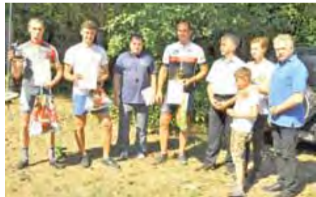
Najlepsi w klasyfikacji generalnej crossu kończącego wakacje.