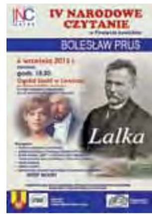
Plakat promujący Narodowe Czytanie w Powiecie Łowickim.