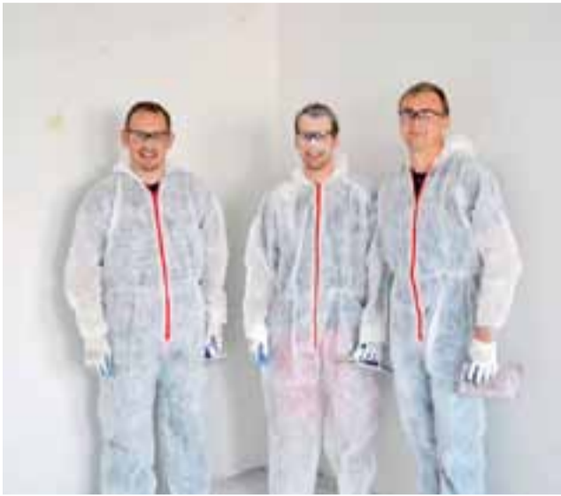
Projekt Cargill Cares – ekipa Cargill Dobrzelin podczas remontu w Mickiewiczu.

Rodzice sami układali chodnik w Szewcach Nadolnych str. 7