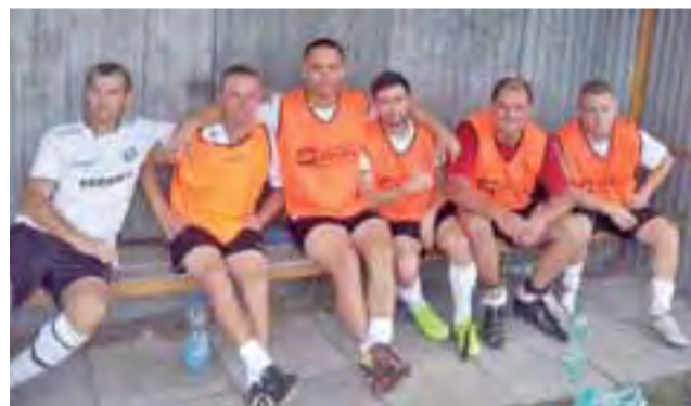
Drużyna Olimpii dysponuje szeroką kadrą rezerwowych.

Niestety w tym sezonie bez punktów pozostaje wciąż drużyna Daru Placencja, która tym razem uległa na własnym boisku Manchatanowi Nowy Kawęczyn 1:2. – Mecz wyrównany, długo utrzymywał się wynik remisowy, dążyliśmy do zwycięstwa, mając w drugiej połowie co najmniej 6 doskonałych sytuacji do strzelenia bramki, Niestety w myśl starego piłkarskiego porzekadła – niewykorzystane sytuacje się mszczą, czego przykładem była bramka dla przeciwnika w 85 minucie.