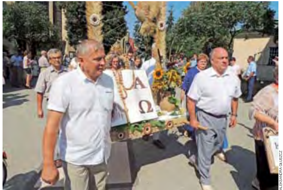
Wieniec wykonany przez Koła Żywego Różańca żychlińskiej parafii.

– Przyniesione do świątyni każde ziarno to pochylenie się nad matką ziemią, która wydała owoce; pamiętam czas żniwowania, kiedy nie mówiło się o produkcji żywności; mówiło się, że rośnie chleb – powiedział w cza-