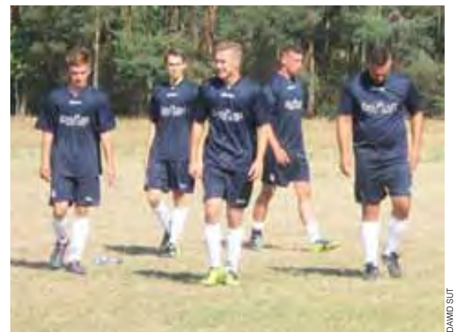
Reaktywowany po 17 latach Meteor zremisował z Jamnem 1:1.