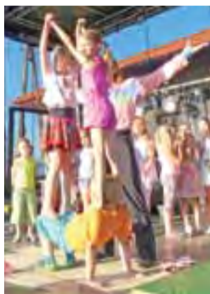
Dzieci pokazały m.in. zbudowaną przez siebie figurę akrobatyczną.

Po jego występach na scenie prezentowały się dzieci, które bra-