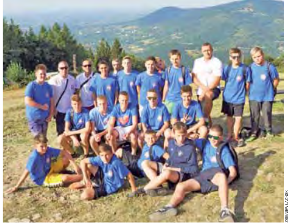
Koszykarze Książka na szczycie góry Czantorja.

Koszykówka | Przygotowania UMKS Książka do sezonu 2015/16