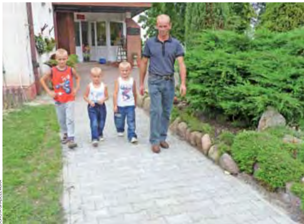
Pod koniec wakacji rodzice I klasy zrobili nowy, równy chodnik przy SP w Szewcach Nadolnych.

Starosta przyznaje, że przy produkcji mleka czasu wolnego za dużo nie ma. Teraz, gdy w gospodarstwie są młodzi, łatwiej jest pojechać w gości, do znajomych czy pizzerii – ale pracy i tak jest bardzo dużo. dag