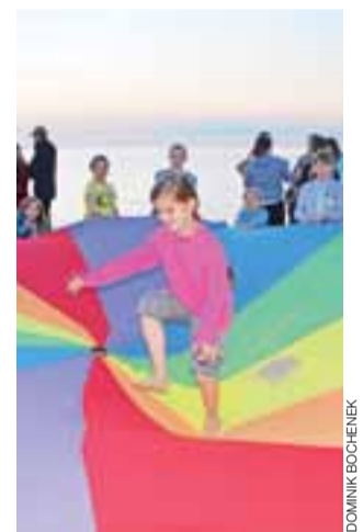
Zabawy integracyjne podczas wyjazdu do Milkoszewa.