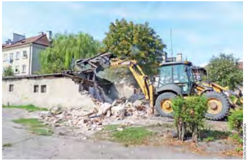
Z krajobrazu Żychlina zniknęły murowane komórki przy stadionie miejskim.

Koszt rozbiórki to ok. 4 tys. zł. W miejscu po komórkach teren ma być wyrównany. Prezes spółdzielni zapowiada, że powstanie zatoka parkingowa na samochody oraz utwardzone i ogrodzone miejsce na odpady komunalne. dag