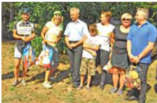
Najlepsze kobiety w crossie w Lasku Miejskim.

W crossie rowerowym udział wzięli także liczni znajomi po-