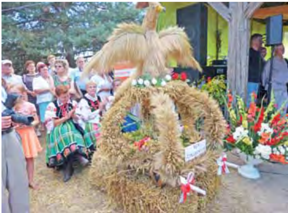
Na wieńcu z Zielkowic uwagę uczestników dożynek zwracał podrywający się do lotu orzeł w koronie.

Ponownie pełna muszla na koncercie orkiestry Sonus. str. 24