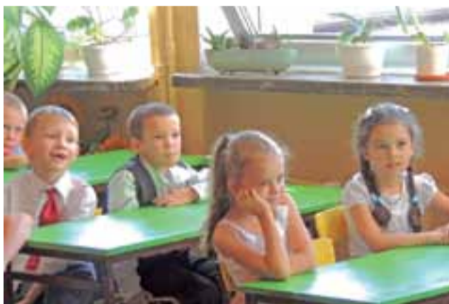
Uczniowie klas pierwszych zasiedli po raz pierwszy w ławkach szkolnych. Po raz pierwszy do klas obowiązkowo poszły dzieci sześciolatki. Ciekawość i oczekiwanie to uczucia, które przezweńczyły niepokój. Na zdjęciu uczniowie klasy Ia SP im. Jana Pawła II w Żychlinie. ag