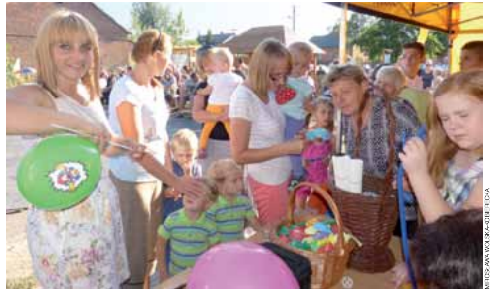
Jedną z atrakcji festynu, poza występami na scenie, był namiot organizatorów, w którym rozdawano dzieciom balony. Nie brakowało na nie chętnych.

Ostatnie dwa punkty imprezy to wokalny występ „Nieborowianek” oraz zabawa taneczna przy muzyce granej na żywo przez zespół Fantom. Zabawa trwała do godz. 23.00. Organizatorzy, dziękując mieszkańcom za przybycie, zapraszali ich na kolejny festyn, za... rok.