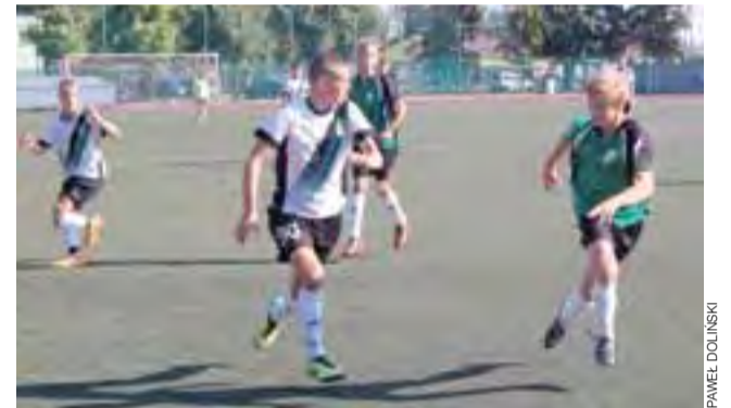
Pelikan 2001 dostał lekcję futbolu od GKS.