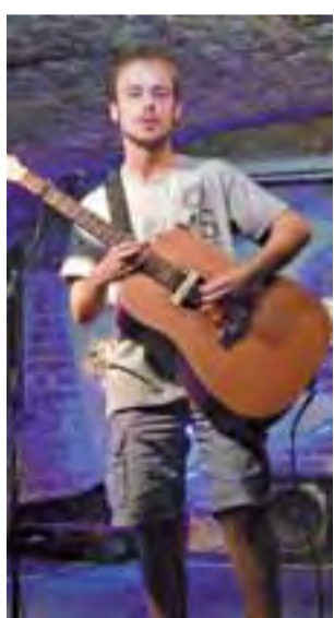
Druga część należała do Nocej Lampki.