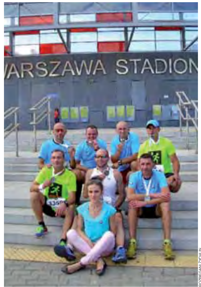
„Rozbiegani Żychlin” prezentują medale po biegu w II Półmaratonie.