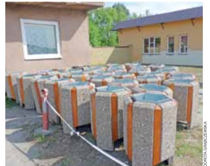
Wkrótce 34 kosze na śmieci pojawią się na ulicach miasta.