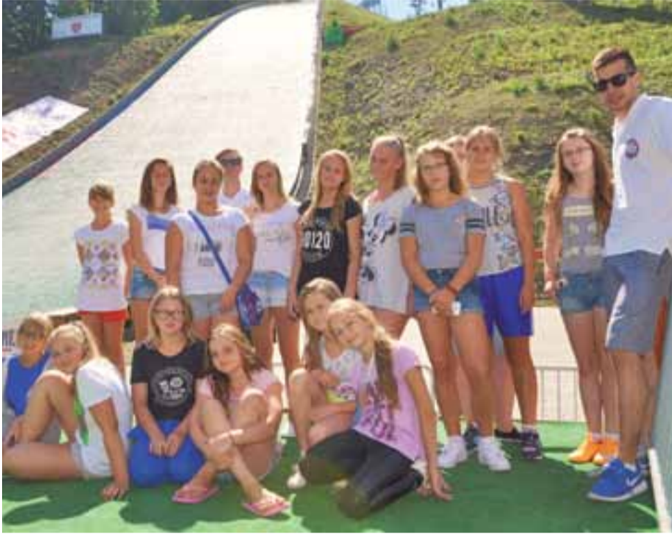
Koszykarki Książka odwiedziły skocznnię Adama Małysza w Wiśle.