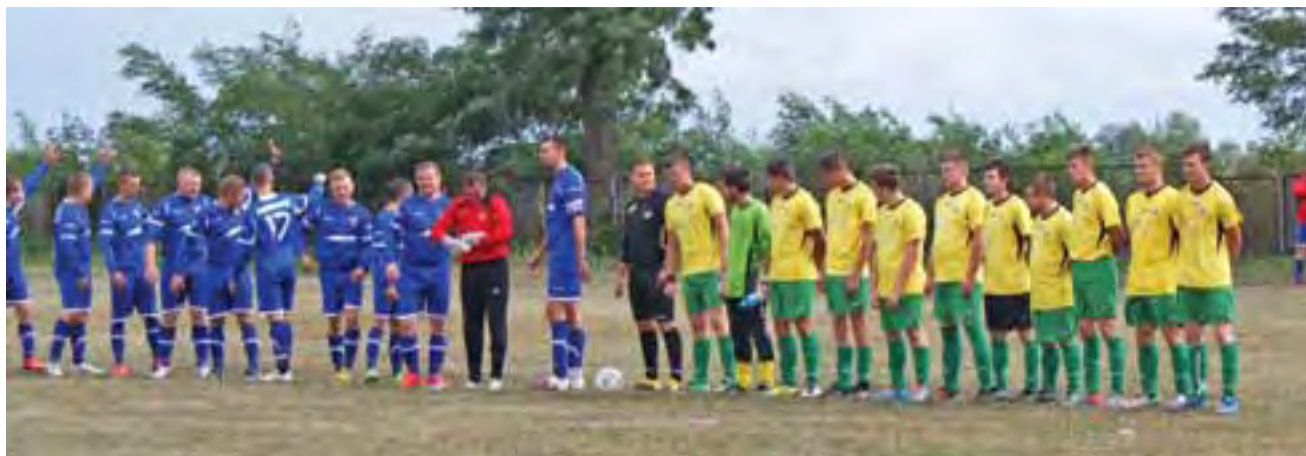
Drużyna Olimpii Oporów wygrała spotkanie z Witonią Witonianka II 4:1.