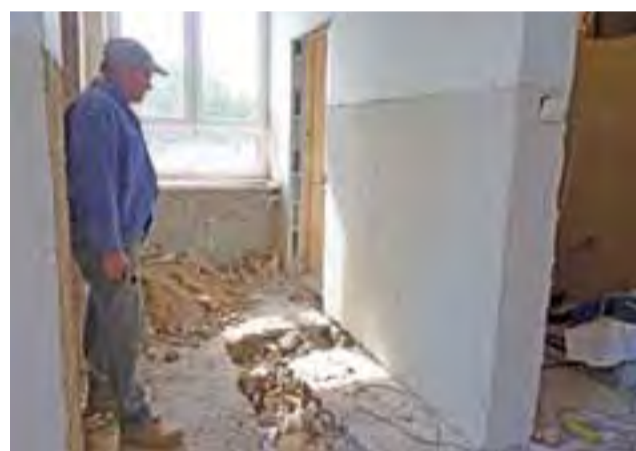
Na skutek awarii kanalizacji w budynku dawnej szkoły w Skrzyszewach konieczne są dodatkowe prace.

– Podczas skuwania płytek w łazience okazało się, że pia-