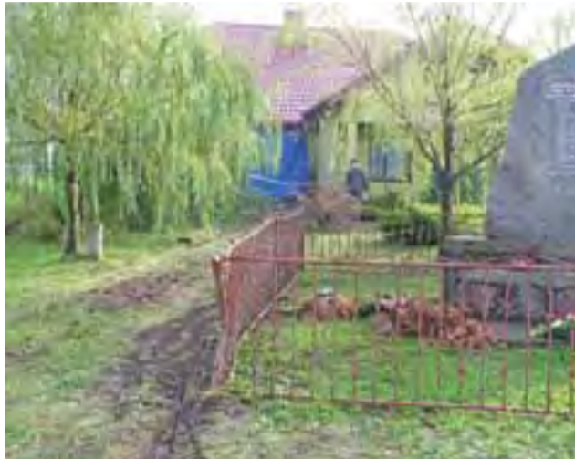
Kierowca zjechał na pobocze i pojechał prosto, mijając znajdujący się obok znak drogowy i wjechał pomiędzy obelisk a drzewa.

Wiadomo też, że ewentualne koszty naprawy pokryje firma ubezpieczeniowa z OC sprawy wypadku. Policjny protokół na pewno usprawni dochodzenie o odpowiedzialność. Póki co, już w nocy