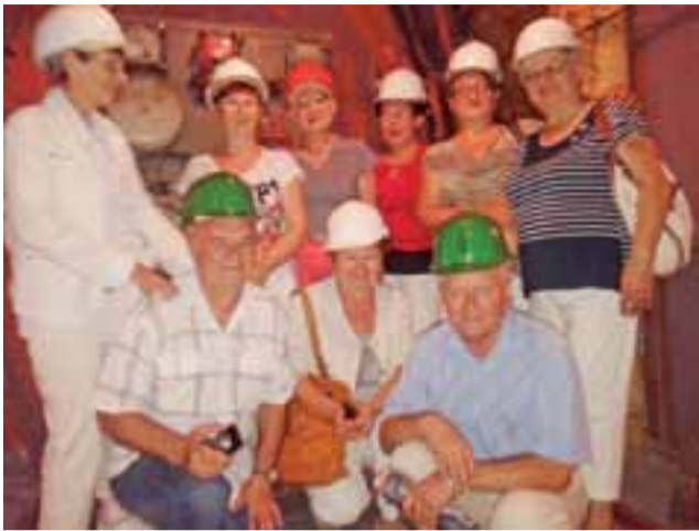
Członkowie Klubu Aktywnego Seniora w kopalni soli w Inowrocławiu.