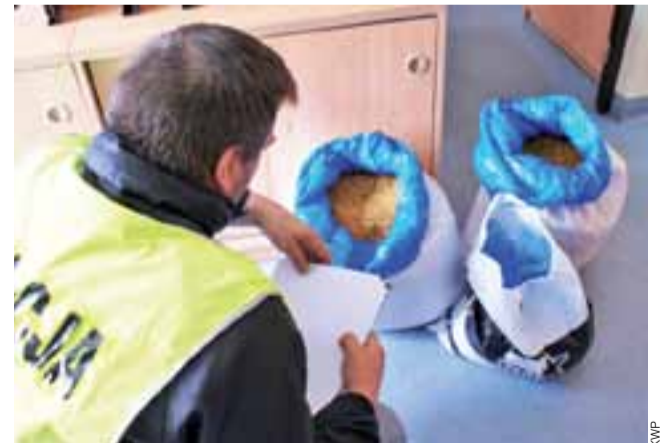
Funkcjonariusze policji z Kutna zatrzymali mieszkańca Łodzi, który przewoził 7,36 g amfetaminy i 30 kg tytoniu bez znaków akcyzy. Przemysł został zarekwirowany.

Policjanci sprawdzili wnętrze samochodu. Podczas przeszuka-