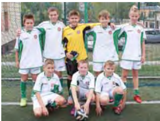
Reprezentacja chłopców Szkoły Podstawowej Nr 2 w Żychlinie podczas Turnieju o Puchar Premiera RP.