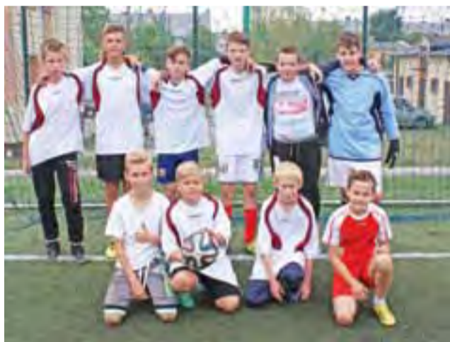
Reprezentacja chłopców Gimnazjum Oporów, biorący udział w Turnieju Orlika o Puchar Premiera RP.