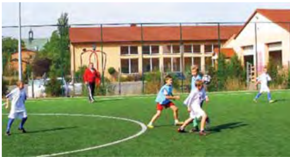
Mecz na żychlińskim orliku rozegrany pomiędzy drużynami Gimnazjum Oporów a Szkołą Podstawową Nr 1.

W tym dniu pogoda dopisała, tak więc wszyscy uczestnicy turnieju czerpali wielką satysfakcję z udziału w rozgrywkach i rywalizacji sportowej. Wszyscy otrzymali z rąk organizatora pamiątkowe dyplomy i nagrody postaci piłek dla drużyny. Zwycięzcami zawodów została drużyna Gimnazjum Żychlin, która będzie repre-