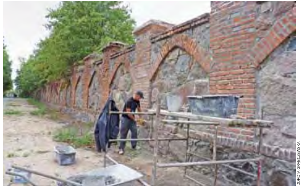
Renowacja parkanu wokół Domku Ogrodnika najprawdopodobniej zakończy się jeszcze w tym roku.

Prace wykonywane w ramach środków budżetowych muzeum. Wygląda na to, że na ten rok prace zostaną zakończone. Do zrobienia pozostanie pozostała część ogrodzenia. Jednak naprawa będzie wymagać najpierw przycięcia wielu drzew rosnących za parkanem, których gałęzie wystają ponad murem. To sprawia, że w tej części parkan zacieniony i bardziej narażony na wilgoć jest