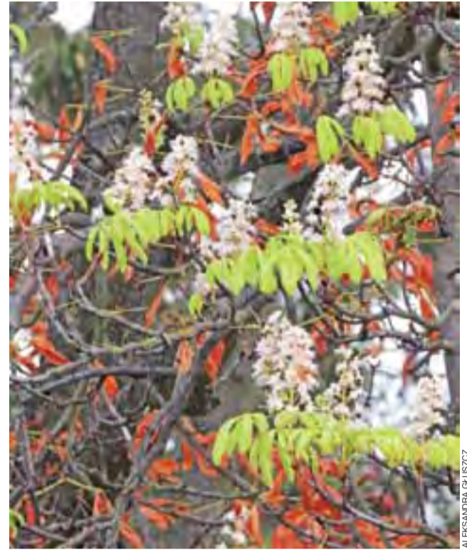
Na оголоconych z liści kasztanach teraz wyrosły pędy kwiatowe.

W Żychlinie wprawdzie liście są zgrabiane i wywożone, ale nie są już palone, co sprawia, że uskrzydłony pasożyt znów przelatuje na kasztanowce i je atakuje. Jeszcze kilka lat, a z krajobrazu zniknie kasztanowa aleja. ■