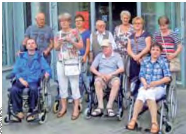
Uczestnicy wyjazdu przed wejściem do Muzeum Męczeństwa Bł. Ks. Jerzego Popiełuszki.

Tegoroczny rajd, mimo iż pierwotnie miał się odbyć w trzech formach: pieszej, rowerowej i kajakowej – wyruszył tylko w dwóch pierwszych formach, w których udział wzięło ponad 100 cyklistów i około 30 piechurów. Spływ kajakowy został odwołany z uwagi na niski poziom Bzurą. aa