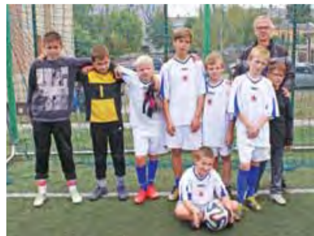
Reprezentacja chłopców ze Szkoły Podstawowej Nr 1 w Żychlinie, którzy zajęli trzecie miejsce w Turnieju Orlika o Puchar Premiera RP.

Piłka nożna | VI Turniej Orlika o Puchar Premiera RP