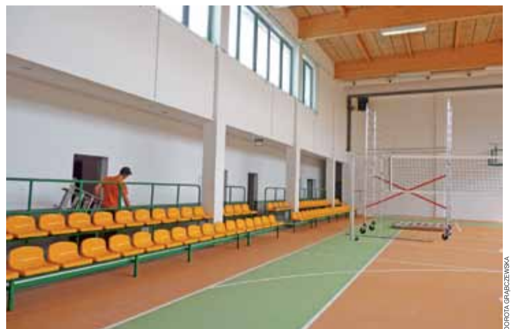
Sala gimnastyczna przy ZS w Oporowie jest gotowa. W środę rozpoczęły się odbiory techniczne. Wkrótce uroczyste otwarcie.

Sportowa część sali wyłożona jest specjalną sportową wykładziną, która w całej swojej strukturze o grubości 4 mm jest jednakowa, co będzie sprawiać, że w przypadku nawet starcia wierzchniej warstwy, wygląd nawierzchni się nie zmieni. Sala ma posiadać dobrą akustykę, dzięki nowoczesnemu wygłuszeniu sufitu. Na szkolną młodzież czekają cztery szatnie wraz z sanitariatami i prysznicami. Dziewczęta mają szatnie