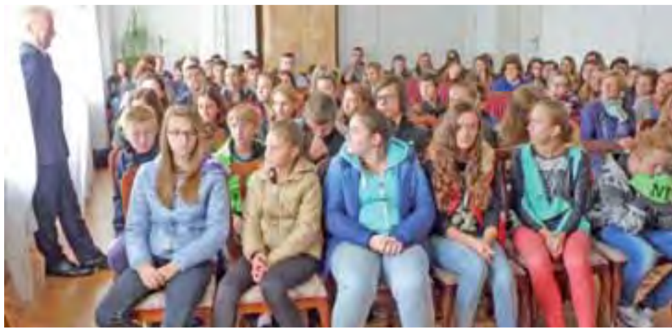
Młodzież zasłuchana w opowieści o walkach we wrześniu 1939.