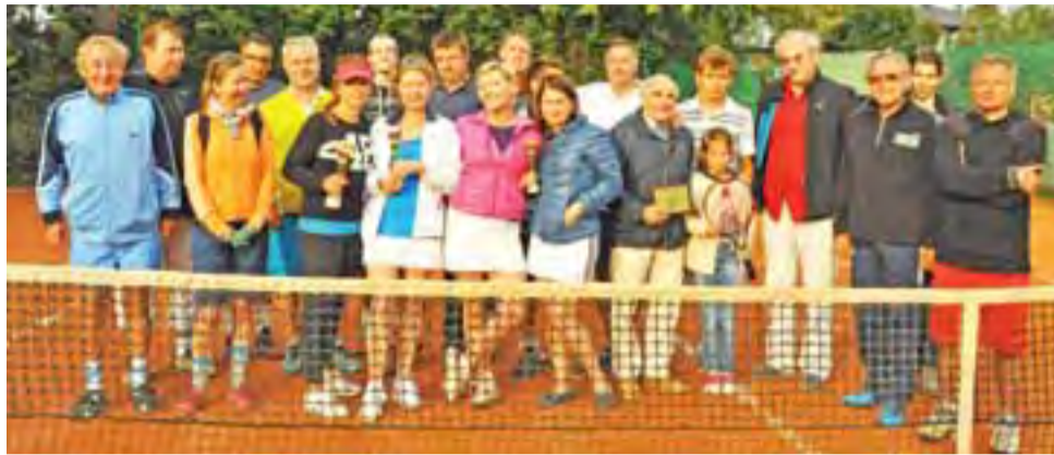
Uczestnicy turnieju tenisowego w Łowiczu.

Rywalizacja tenisistów była momentami bardzo wyrównana i zacięta. Zawodnicy podzieleni zostali na cztery grupy i tylko mistrzowie grup awansowali do półfinałów. Turniej pokazał, że tenis to sport wielopokoleniowy. W grupach rywalizowali młodzi zawodnicy z dużo starszymi gra-