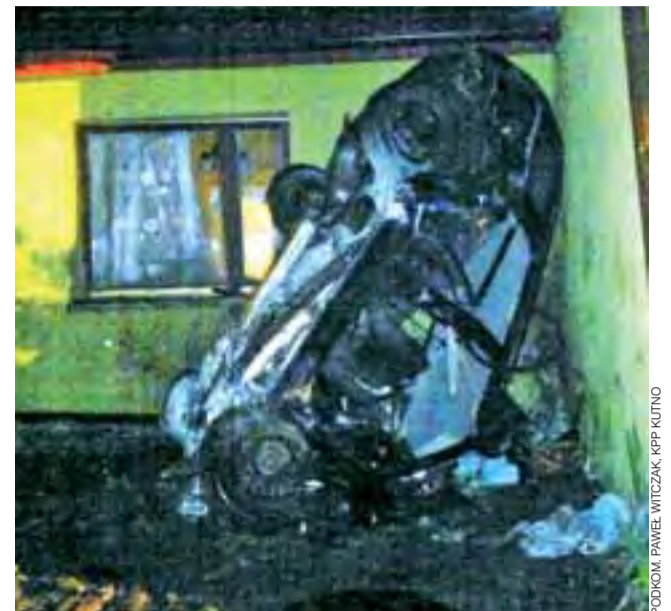
Siła uderzenia była tak duża, że samochód stanął pionowo, opierając się o ścianę.

nie było barier energochłonnych, nieraz bywało, że auta zjeżdżały do rowu znajdującego się tuż obok ich domu. Zatrzymywały się jednak na rosnących w pobliżu