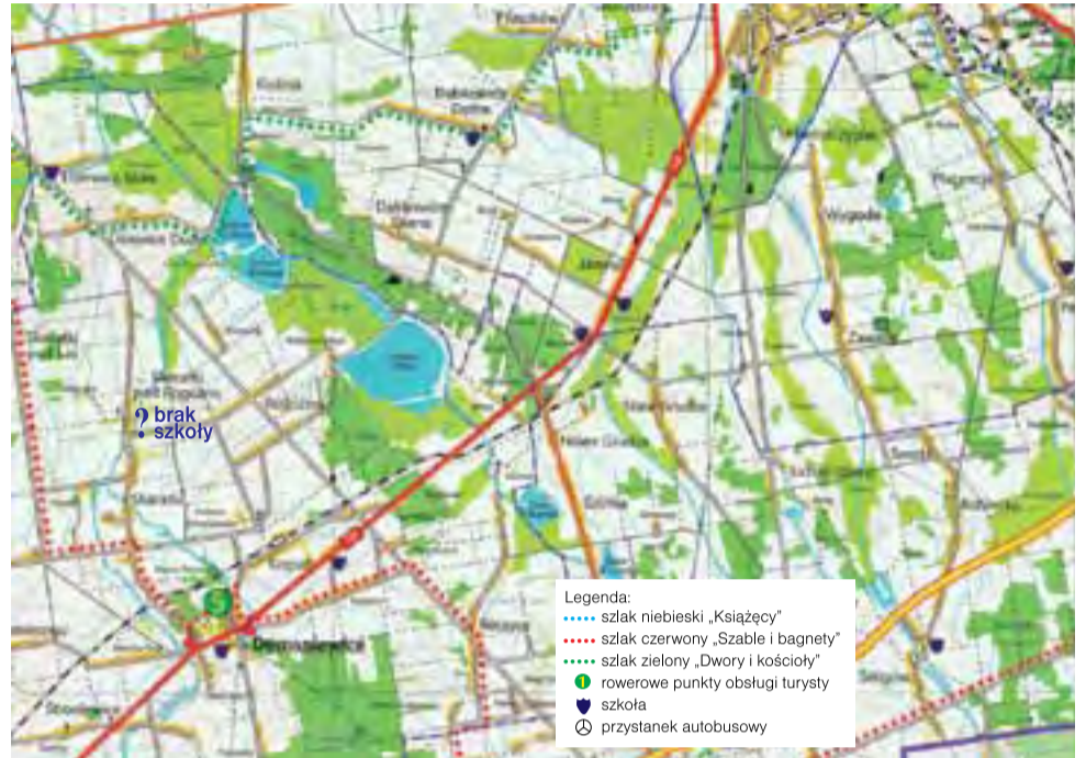
Fragment mapy: tylko jeden przystanek kolejowy w Domaniewiczach, żadnego w Grudzach, za to dwie szkoły w Jamnie i jedna w Krepie.

– W opisie mapy, w ważnym, bo wstępnym fragmencie zachęcającym do zwiedzania, nie ma ani słowa o tym, że istniało coś takiego jak Księstwo Łowickie, a więc