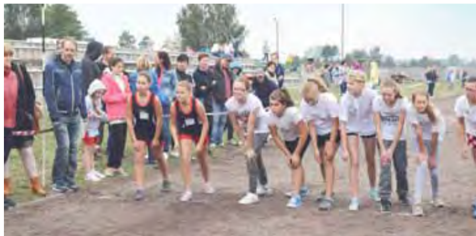
Na starcie. Dziewczeta z klas VI szkoły podstawowej gotowe do biegu.

12 września goście wzięli udział w biegach i innych atrakcjach Dnia Patrona, po południu zwiedzili Nieborów, noc spędzili w placówce, a w niedzielę uczestniczyli w uroczystościach patriotycznych w Walewicach.