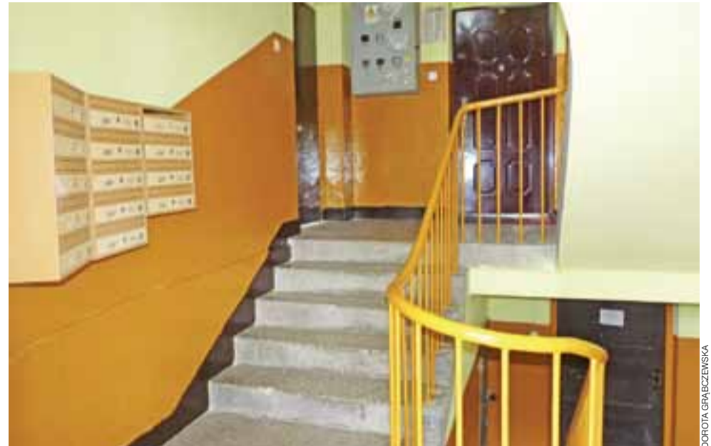
Zakończono remont klatki schodowej w balkonowcu, czyli w bloku Narutowicza 85. Teraz klatka lśni czystością. Wszystko zrobiono z gustem, nawet schody zostały doczyszczony z brudu.

W ciągu ostatnich 3 lat blok bardzo zyskał na estetyce. Prace zaczęto od naprawy balkonów, z których odpadały połacie betonu, stwarzając zagrożenie. Nie dość, że balkony wyremontowano, to pomalowano je na słoneczny kolor i od razu zrobiło się przyjemniej. Gdy zrobiono klatkę schodową i wymieniono stare niedomykające się drzwi na nowe, blaszane, budynek zyskał na estetyce podwójnie. Teraz najważniejsze, by lokatorzy sami dbali o porządek i czystość, gdyż następne malowanie klatki