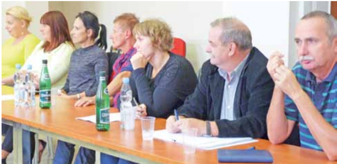
Na spotkanie konsultacyjne na temat strategii rozwoju gminy Żychlin przybyli m.in. prezesi obu największych spółdzielni mieszkaniowych w Żychlinie oraz przedstawiciele Stowarzyszenia Skakanka.

– W strategii nie znalazłam nic, co by dotyczyło służby zdrowia.