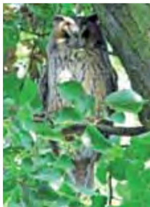
Na drzewach przy szkole zadomowiło się 8 sów uszatyż.

Sowy to ptaki niezwykle – drapieżcy o ostrych dziobach i szponach, żywiący się owadami i drobnymi zwierzętami jak np. myszy. Prowadzą nocny tryb życia, dzięki specyficznej budowie piór, poruszają się bezszelestnie. Sowy mają bardzo duże gałki oczne typu te-