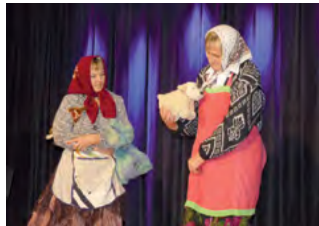
Bogoria Górna przerobiła piosenkę biesiadną „Miała baba koguta”.