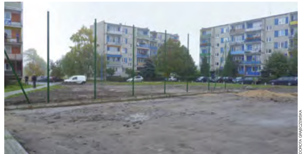
Prace przy budowie boiska do piłki plażowej przerwano, gdyż najpierw musi być wykonany plac zabaw, który ma być gotowy do połowy listopada.