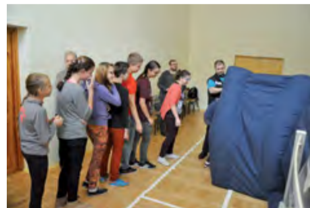
Piknik astronomiczny w Mickiewiczu.

się z „prześwietlonymi” budowlami bądź budynkami, albo krążą wokół nich dopóki nie zaczną opadać z wycieńczenia. Nocne oświetlenie zakłóca również relację między drapieżnikami polującymi po zmroku a ich ofiarami. Według ekologów oświetlenie niektórych budowli w celu poprawy walorów estetycznych miast to bezsensowne marnowanie energii, zwiększona emisja gazów i większe wydatki prywatnych czy miejskich budżetów. ag