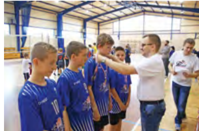
Drużyna chłopców, która zajęła 3. miejsce w Turnieju Piłki Siatkowej Szkół Podstawowych o Puchar Żychlińskiej Akademii Siatkówki Volley Team.

■ ASVT Żychlin II – Bzura Ozorków I 0:1 (6:15)