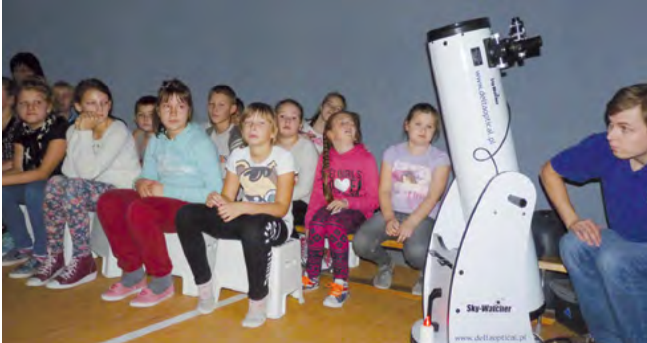
W namiocie wirtualnego Obserwatorium Ciemnego Nieba, rozstawionego w sali ZS w Oporowie, dzieci z klas IV-VI ze Szczytu obserwowały przez teleskop gwiazdy na niebie.

Warsztaty „Piknik z astronomią” prowadzą członkowie Stowarzyszenia Polaris, którzy wspólnie ze Związkiem Gmin Regionu Kutnowskiego realizują projekt dofinansowany ze środków Wojewódzkiego Funduszu Ochrony Środowiska i Gospodarki Wodnej w Łodzi. Głównym tematem, umiejętnie przekazany, w zależności od wieku uczestników, jest uświadomienie coraz bardziej nasilającego się problemu związanego z zanieczyszczeniem sztucznym światłem. Efekt tego „zaśmiecenia” widać szczególnie w dużych miastach. Poprzez