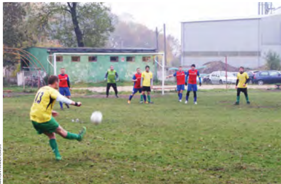
Derbowe spotkanie Olimpii Oporów kontra KS Żychlin zakończyło się wygraną 5:1 dla Żychlinian.