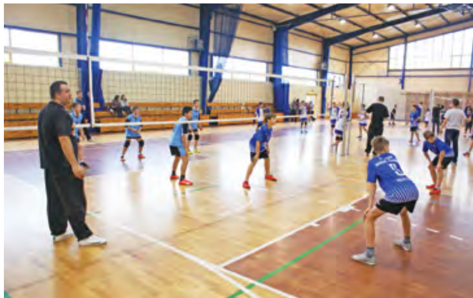
Mecze piłki siatkowej rozgrywane w sobotę w hali sportowej w Żychlinie.

Piłka siatkowa | Turniej Piłki Siatkowej Szkół Podstawowych o Puchar Żychlińskiej Akademii Siatkówki Volley Team