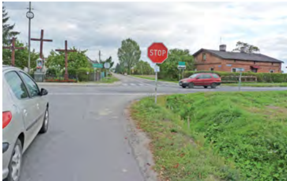
Jednym z najniebezpieczniejszych skrzyżowań jest to przy Trzech Krzyżach. Montaż pulsacyjnego światła oraz przebudowa skrzyżowania, by zrobić cztery przejścia dla pieszych, powinny poprawić bezpieczeństwo.

Jednocześnie burmistrz wskazywał, że najwięcej pracy będzie ze skrzyżowaniem przy Trzech Krzyżach, gdyż tam konieczna będzie przebudowa skrzyżowania. – Teraz mamy dwa przejścia dla pieszych, zaś docelowo powin-