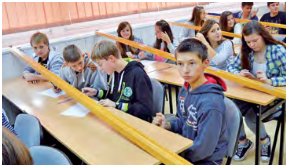
Uczniowie Gimnazjum w Popowie mogli poczuć się jak prawdziwi studenci.