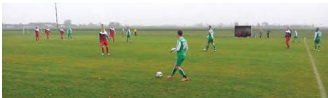
Szlagier w spotkaniu dziewiątej kolejki łódzkiej klasy A grupy III – wygrana GKS Bedno 3:0 nad Bzurą Młogoszyn.

W drugiej części drużyna z Bedna stworzyła kilka akcji do strzelenia gola, i po jednej z nich, w 68 minucie podwyższa rezultat na 2:0. W 70 minucie sędzia dyktuje „jedenastkę” po faulu w polu karnym dla gospodarzy. Piłkarz Bzury Młogoszyn otrzymał czerwoną kartkę, po chwili kolejny zawodnik Bzury otrzymuje czerwoną kartkę. Tak więc na 20 minut przed końcem spotkania drużyna z Młogoszyna grała w dziewięciosobowym składzie. Gospodarzom nie udało się wykorzystać przyna-