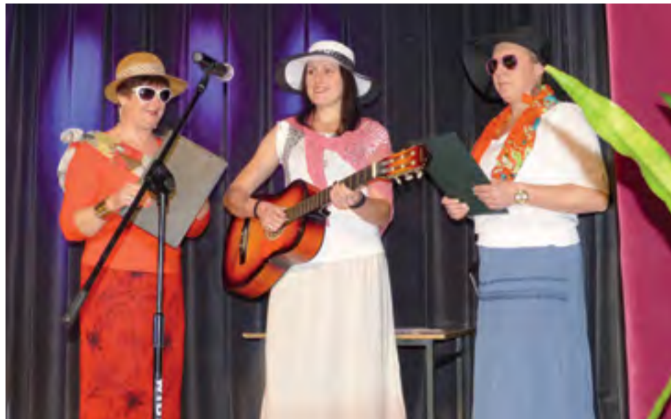
Gospodynie z Urzecza odegrały teledysk do piosenki Maryli Rodowicz „Ech, mała”.