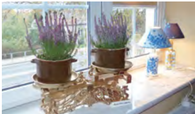
„Stare po nowemu”, czyli waga i garnki gliniane jako kwietnik.