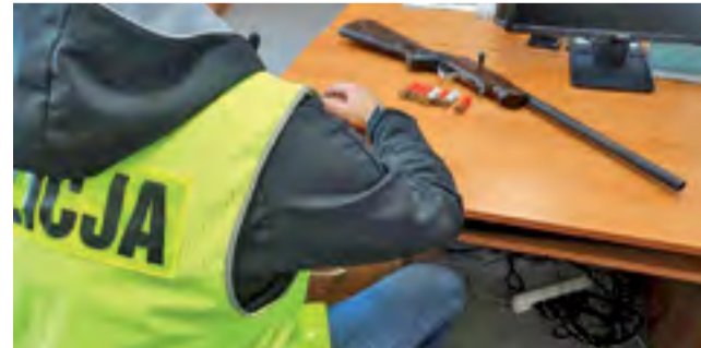
Nielegalna broń palna domowej roboty wykonana przez 26-letniego mieszkańca gminy Szczawin Kościelny.

– Informacje o nielegalnej broni funkcjonariusze posiadali z działań operacyjnych – mówi sierż. szt. Dorota Słomkowska, rzecznik Komendy Powiatowej Policji w Goścyninie. – Kryminalni w mieszkaniu 26-latk, mieszkańca gminy Szczawin Kościelny, znaleźli broń palną i kilka sztuk broni myśliwskiej. Okazało się, że broń wykonał sam z kilku elementów. Policjanci znaleźli strzelbę za szafą ubrania-