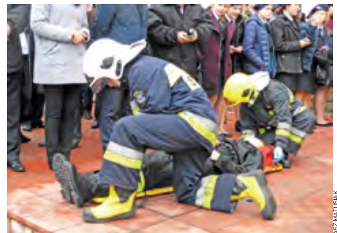
Pierwsza pomoc. Udzielanie jej ćwiczą druhowie z OSP Łowicz.