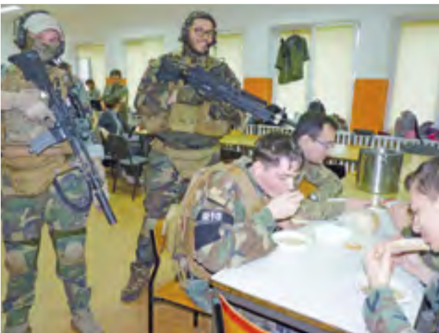
Wędrownicy na trasie rajdu spotkali uzbrojonych po zęby żołnierzy z grupy rekonstrukcyjnej GRSRANGER z Kutna.

Pierwszym zadaniem było zbudowanie szałasów. Do dyspozycji mieli 2 płaszcze, gałęzie w lesie i własną wyobraźnię. str. 9