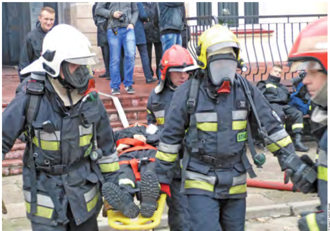
Strażacy na noszach ewakuują „poszkodowanych” z budynku szkoły.