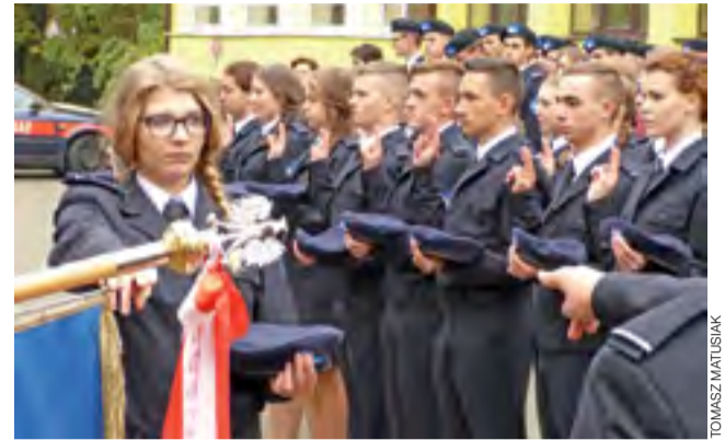
„Ślubujemy kształcić w sobie cechy, które posiadał nasz patron!” – fragment tekstu ślubowania w II LO w Łowiczu.