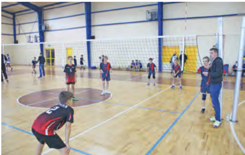
Jedno z sobotnich spotkań siatkówki chłopców w kategorii "trójek" (rocznik 2004).