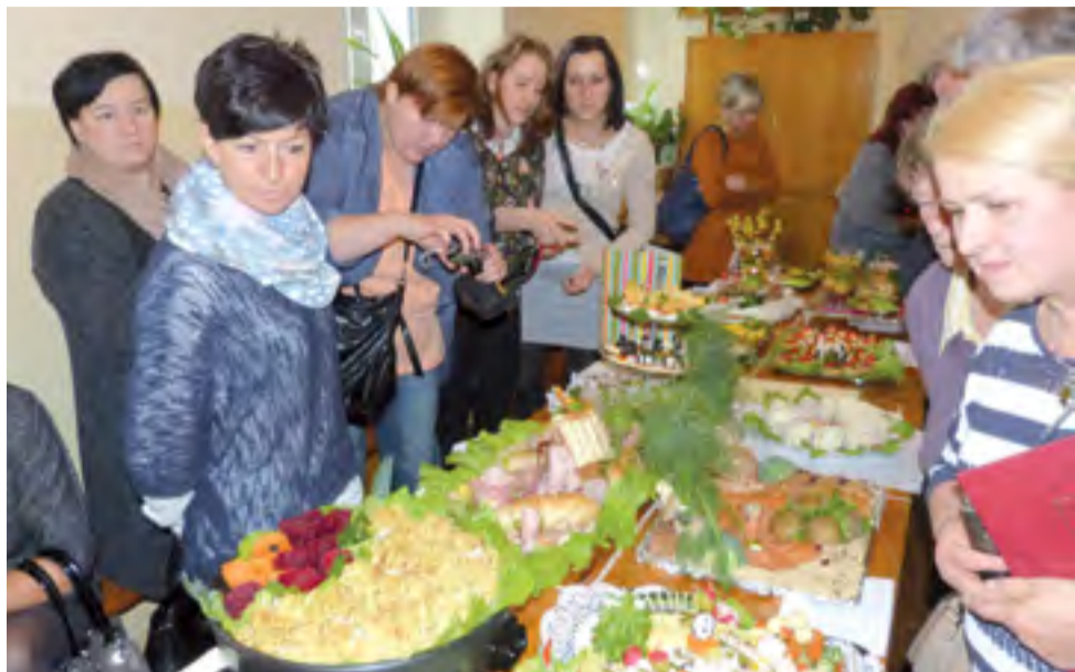
Panie oglądają przekąski, aby dokonać oceny tego, co przygotowały wszystkie koła.