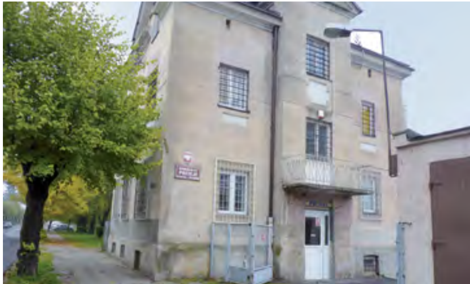
Trzy gminy: Żychlin, Bedno i Oporów przekazują dotację, by wyremontować elewację na komisariacie.

Przypominamy, że w 2014 roku trzy gminy też wspierały policję w zakupie nowego radiowozu do Komisariatu Policji w Żychlinie.