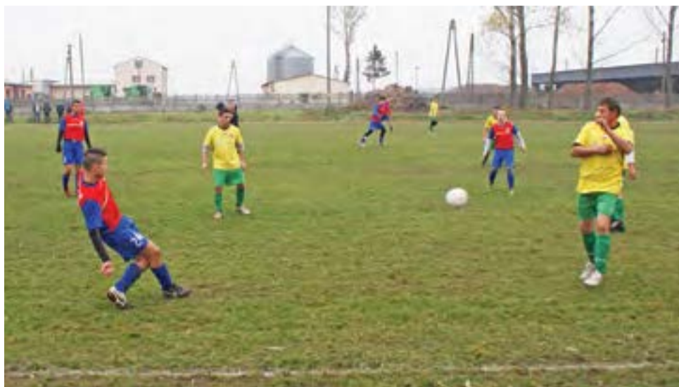
Niedzielny mecz 8. kolejki łódzkiej klasy B grupy III rozegrany na boisku w Oporowie pomiędzy Olimpią Oporów a KS Żychlin.

Piłkarze z Żychlina po zmianie stron kontrolowali przebieg rywalizacji. Olimpia Oporów próbowała w miarę możliwo-