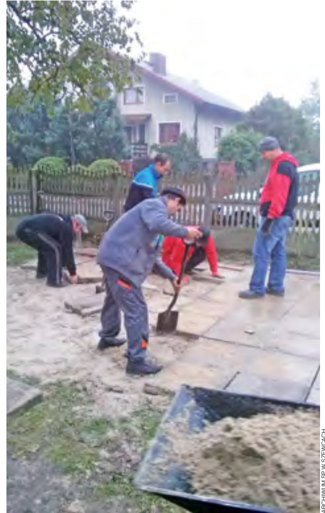
Rodzice uczniów klasy I z SP w Szewcach Nadolnych przygotowali teren, na którym staną stojaki na rowery.

– Zebrane znicze zostaną podzielone na trzy cmentarze, a wytypowane dzieci w dniu Święta Zmarłych zapalą je na grobach, na które nikt nie przyjechał – dodaje dyrektor. – W ten sposób na wielu grobach zaplonie znicz od dzieci z naszej szkoły. dag