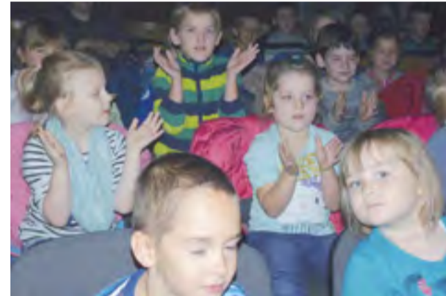
Najmłodszy widowiec żywo reagował na wydarzenia na scenie.

Ponieważ agencja teatralna z Łodzi współpracuje z Towarzystwem Osób Niepełnosprawnych, dzieci zostały zaproszone do wspólnego tańca, by od każdej osoby tańczącej odprowadzić złotówkę na potrzeby chorych i niepełnosprawnych. Tak więc 160 zł ze spektaklu trafi do niepełnosprawnych. Poza tym na koniec widowiska na małych widzów czekała kolejna atrakcja. Wśród sprzedanych biletów rozlosowano nagrody: pendrive'a, MP 3, plecaki, maskotki i piłki. dag