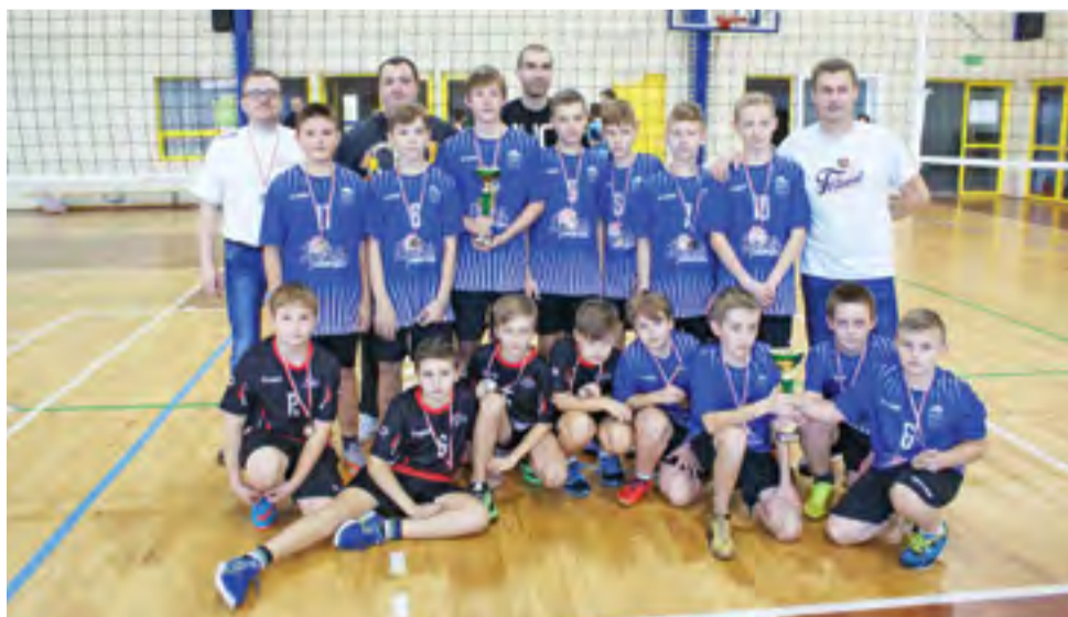
Uczestnicy Turnieju Piłki Siatkowej Szkół Podstawowych o Puchar Żychlińskiej Akademii Siatkówki Volley Team.

Żychlińską Akademię Siatkówki Volley Team – rocznik 2003 reprezentowali: ASVT Żychlin I: