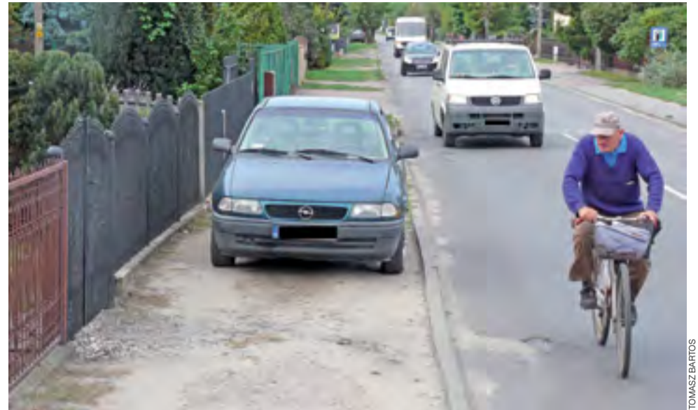
Parkujący samochód pomiędzy krawężnikiem a ogrodzeniem pokazuje, jak mało jest miejsca na ścieżkę rowerową przy ul. Klickiego.