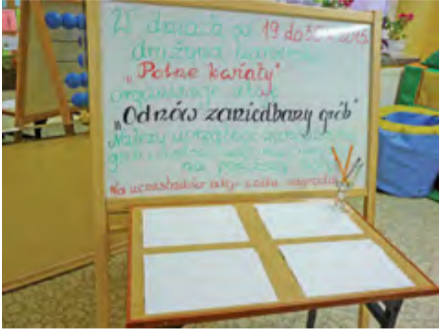
Dzieci z SP w Szewcach Nadolnych, które uporządkują zaniedbany grób, będą wpisywać się na przygotowaną w szkole listę.