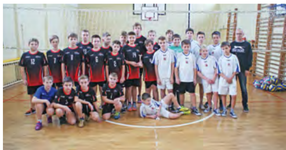
Drużyny chłopców biorące udział w Gminnym Turnieju Mini – Siatkówki w Żychlinie.