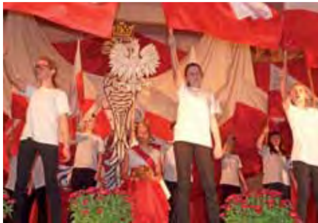
Szkolni aktorzy z Pacyny przedstawiali biało-czerwoną królową Polski i naród Polski w euforii z odzyskania niepodległości.

Chwilę później zmiana nastroju z podniosłego na nostalgiczny i znów na radosny. Takich zwrotów akcji było kilka, co dodawało uroku widowisku. Wiązanka