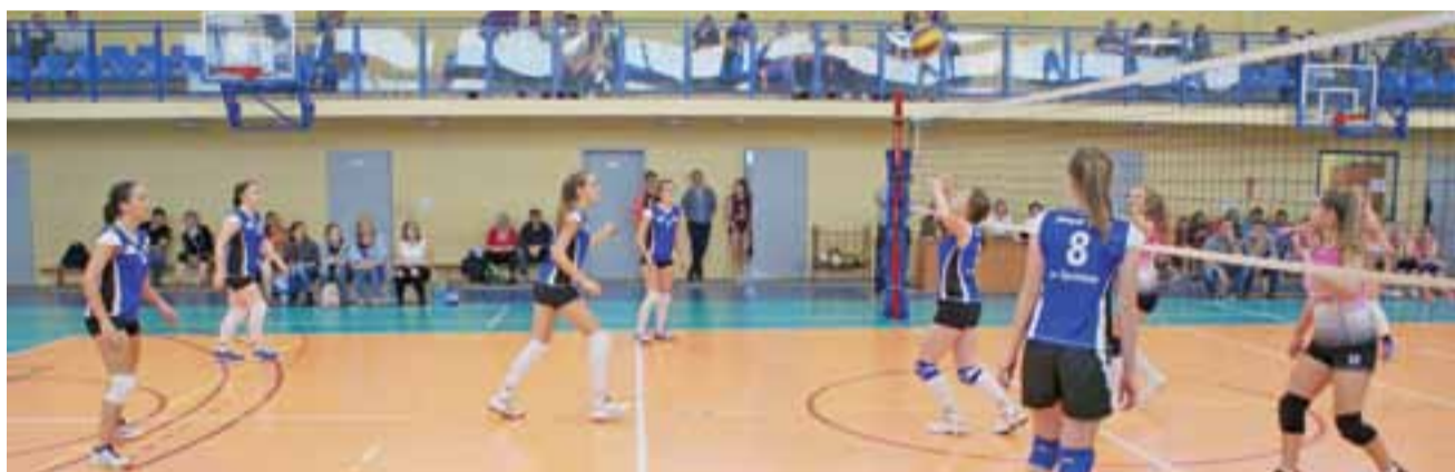
Jedno ze spotkań podczas VIII Powiatowego Turnieju Siatkówki Dziewcząt z Okazji Narodowego Święta Niepodległości o Puchar Starosty Kutnowskiego.