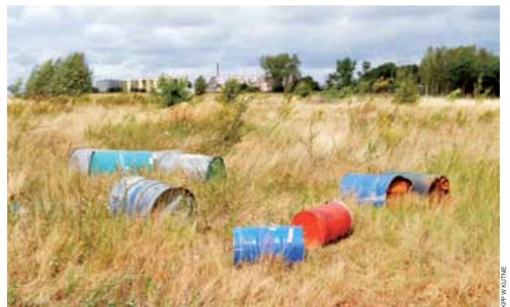
Odpady chemiczne z jednej z firm na terenie powiatu gostynińskiego w metalowych beczkach i plastikowych pojemnikach były podrzucone w lasach, na polach, na nieużytkach.