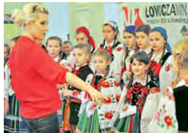
Dla seniorów wystąpił również zespół Koderki.