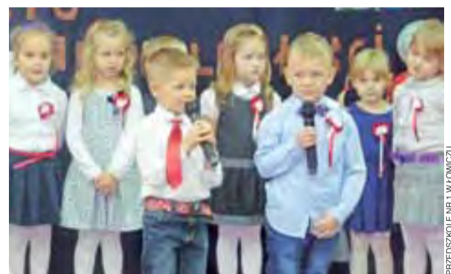
Przedszkolaki zaprezentowały wiersze i piosenki. PRZEDSZKOLE NR 1 W ŁOWICZU

Młodzi artyści otrzymali gromkie brawa, a w nagrodę mogli przynieść do przedszkola swoje ulubione zabawki. aa