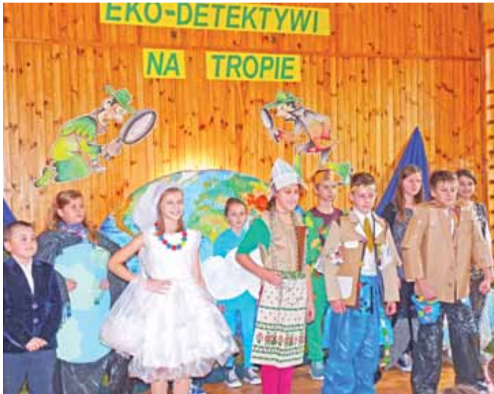
Uczniowie z SP w Pleckiej Dąbrowie z okazji otwarcia ekopracowni zaprezentowali widowisko o chorej Ziemi, która wymaga lekarstwa.

Gmina Bedno | Otwarcie ekopracowni w Pleckiej Dąbrowie