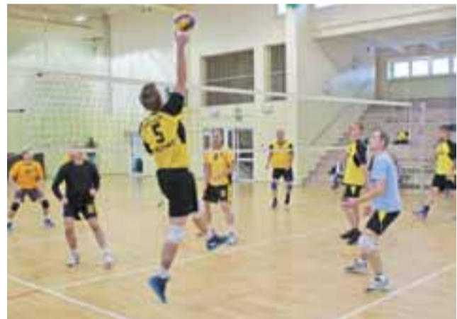
Spotkanie finałowe pomiędzy Walecznymi Pumami a AZS Oldboys.

PROGNOZA POGODY | 19.11.2015 – 25.11.2015