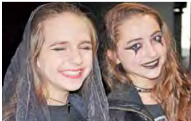
Za kulisami, kilka sekund przed początkiem przedstawienia. Na twarzach dziewcząt nie ma śladu tremy.

Opiekunka już dzisiaj wie, że nie będzie to łatwe, przede wszystkim dlatego, że w trzeciej klasie gimnazjalistów czeka jeszcze więcej nauki i przygotowań do koń-