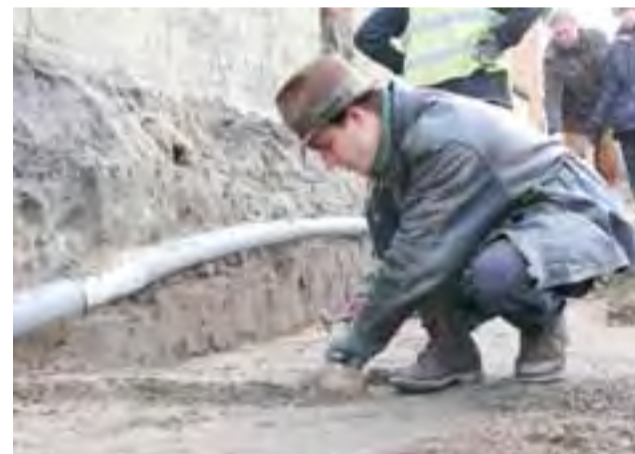
Wykopaliska to żmudna praca. Na zdjęciu jeden z archeologów.

– Wszystkie szczątki, które wydobywamy w czasie prac, przenosimy do kościoła, gdzie