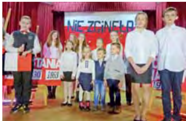
O historii polskich walk o niepodległość opowiedzieli uczniowie Szkoły Podstawowej w Skaratkach.

Po krótkiej technicznej przerwie przyszedł czas na główny punkt artystyczny wieczoru. Ponad godzinny występ dali w Domaniewicach członkowie dwóch grup wiekowych (średniej i najstarszej) Zespołu Pieśni i Tańca „Boruta” ze Zgierzka. Zespół zaprezentował