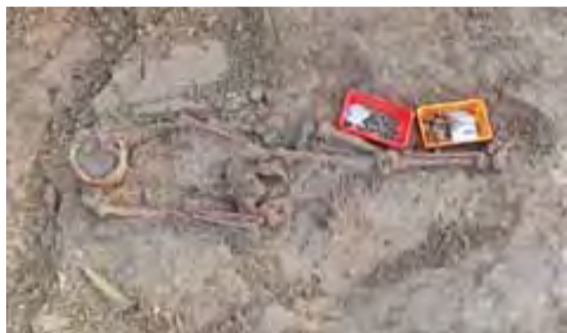
Jeden z odkopanych przy kościele szkieletów.