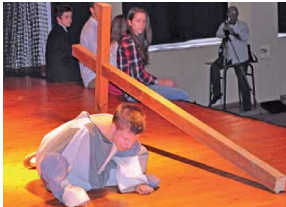
Grupa z Krakowa wystawiła spektakl „Czy chciałbyś ze mną dźwigać ten krzyż?”.

W rozmowach w przerwach pomiędzy przedstawieniami, kulturalnych oraz bazując na własnych