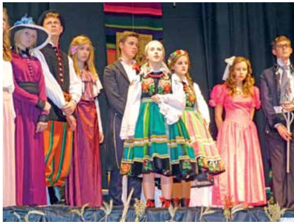
Spektakl obfitował w barwne kostiumy i rekwizyty.

Panie wyznały, że pomysł wystawienia sztuki pojawił się już rok temu, a następnie powoli dojrzewał, aż w końcu wkroczył w etap realizacji. Zaczęło się od studiowania „Wesela” w pierwotnej wersji, poprzez wykreślanie niektórych fragmentów i osadzanie scen we współczesnych realiach. Nowoczesny był też taniec nocnych mar w wykonaniu dziewcząt z grupy tanecznej pod kierunkiem Bożeny