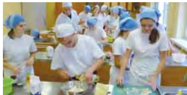
Uczniowie Technikum Żywności w ZSP nr 3 i Gimnazjum w Błędowie łączą siły, aby przygotować przepyszną, włoską pizzę.

Nie były to pierwsze wspólne zajęcia ZSP w Błędowie i ZSP nr 3 w Łowiczu. Nauczycielki obu grup zapewniły nas, że ta współpraca będzie kontynuowana. Planowane jest w tym roku jeszcze kilka podobnych zajęć, nie tylko w dziedzinie gastronomii, ale też w innych zawodach, w jakich specjalizuje się szkoła przy ul. Powstańców 1863 r. tm