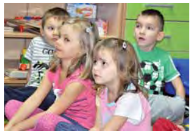
Dzieci ze szkoły w Popowie z zainteresowaniem słuchały funkcjonariuszy SOK.

Funkcjonariusze i kolejarze odwiedzili w poniedziałek, 9 listopada szkołę w Popowie w ramach akcji Bezpieczny przejazd. Najpierw, by ośmielić dzieci, SOK-iści opowiadali o swojej pracy, a nawet... pozwalały przymierzać służbowe kajdanki. Później dzieci obejrzały dostosowany do ich wieku film na temat bezpieczeństwa na przejazdach kolejowych. – Od najmłodszego wieku staramy się wpajać zasady bezpieczeństwa na drogach i przy przejazdach. Zdarza się, że dzieci opowiadają nam później, że zwracały uwagę rodzicom, którzy na przykład nie zatrzy-