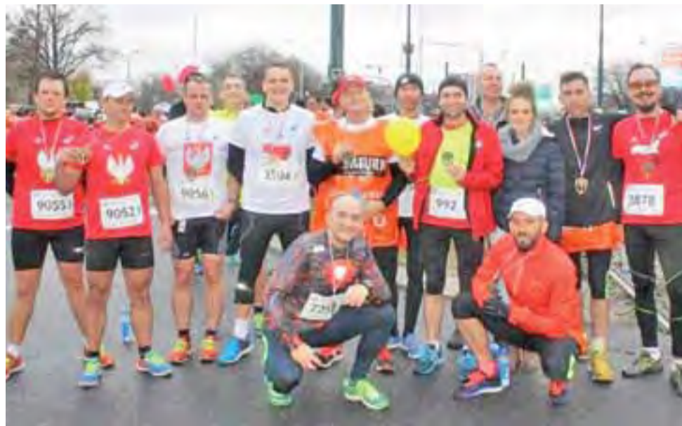
Grupa Rozbieganych Żychlin biorących udział w 27. Biegu Niepodległości w Warszawie.

Bieg Niepodległości był ostatnim i zarazem największym biegiem cyklu Warszawskiej Triady Biegowej „Zabiegaj o Pamięć”. Zawodnicy ustawili się na starcie w dwóch kolumnach – koszulce białej i czerwonej – tworząc najdłuższą flagę Polski. Celem biegu było upamiętnienie 97. Rocznicy Odzyskania Niepodległości, upowszechnianie biegania jako naj-