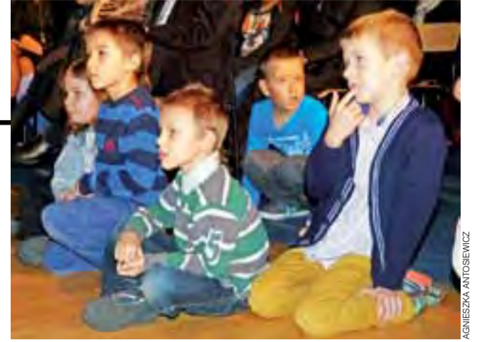
Spektakl z zaciekawieniem oglądali nawet najmłodszy widzowie.

Lowicz | Spektakl teatralny w szkole pijarskiej przy pełnej sali