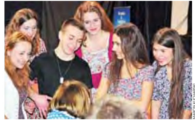
Młodzi aktorzy z pijarskiego LO w Poznaniu chwilę po własnym występie. Na twarzach nie ma śladu po tremie.

czących edukację na tym szczeblu egzaminów. – To elitarnie gimnazjum i podziwiam naszych aktorów za to, że mimo ogromu nauki znajdują jeszcze czas na teatr, że im się jeszcze chce – mówiła o swoich podopiecznych.