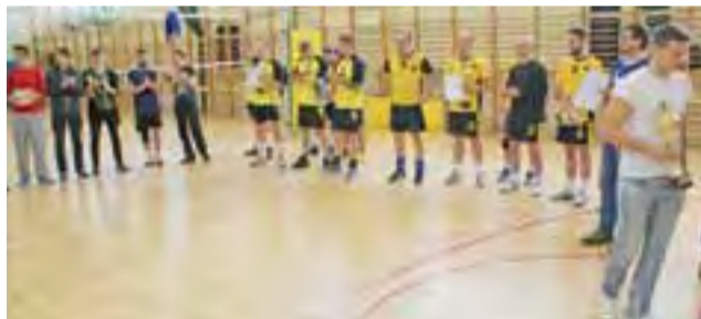
Uczestnicy I Memoriału Mieczysława Gałusy w Kutnie.

W latach poprzednich był on pomysłodawcą i organizatorem