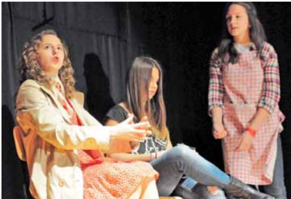
Gimnazjaliści z Poznania przedstawili współczesną wersję Romea i Julii.