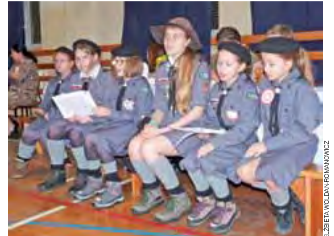
Rozśpiewane harcerki. Na patriotyczny wieczór do Bielaw przyjechał harcerze ZHR z Głowna.

Każdy, kto zdecydował się przyjść na wydarzenie, otrzymał publikację naszej poetki ludowej nieodpłatnie.