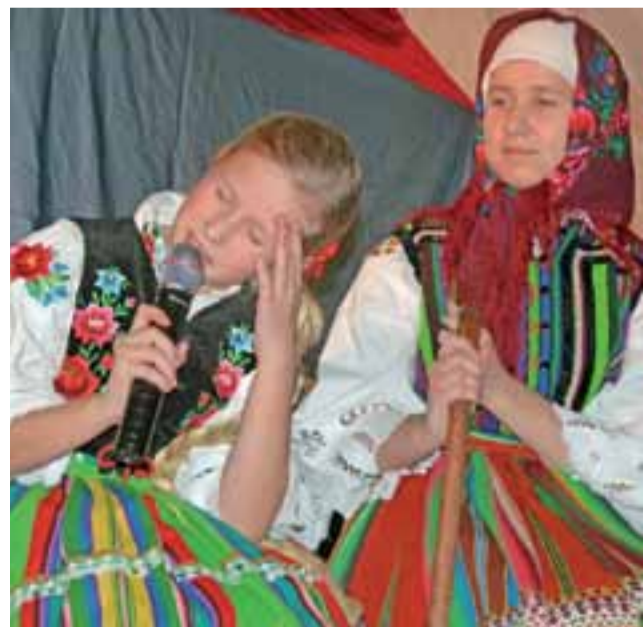
Tradycja pacyńskich widowisk patriotycznych z okazji odzyskania niepodległości jest pokazywanie tradycji ludowych. W tym roku prezentowano zwyczaj swatania, którego uczniowie nawet nie znają z opowiadań.

Z wielu oczu popłynęły łzy wzruszenia, ale była też radość, i uśmiech, że w gminie Pacyna są tak zdolne, mądre i otwarte na świat i ludzi dzieci. str. 8