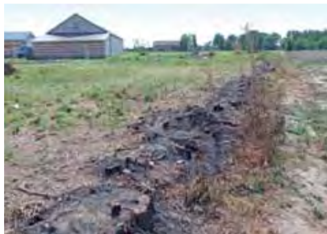
Pogranicze Borówka i Borowa. Ślady po wycince i wypalaniu pni, stan na 26 sierpnia.

Kilka dni później Urząd Gminy Bielawy zawiadomił też Prokuraturę Rejonową w Łowiczu o podejrzeniu popełnienia przestępstwa, polegającego na wycięciu drzew bez zezwolenia. Żadnego stanowiska prokuratury w tej sprawie jeszcze nie otrzymał. Sporna granica między działkami