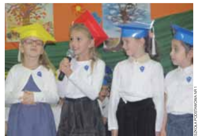
Dzieci uśmiechy na uroczystym ślubowaniu.