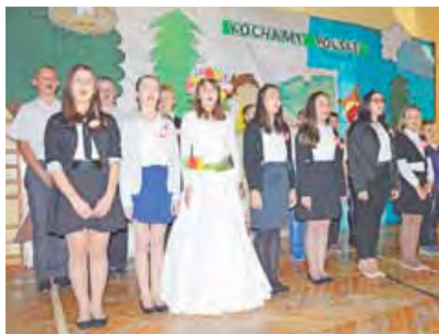
Pieśni patriotyczne rozbrzmiewały na szkolnej uroczystości.