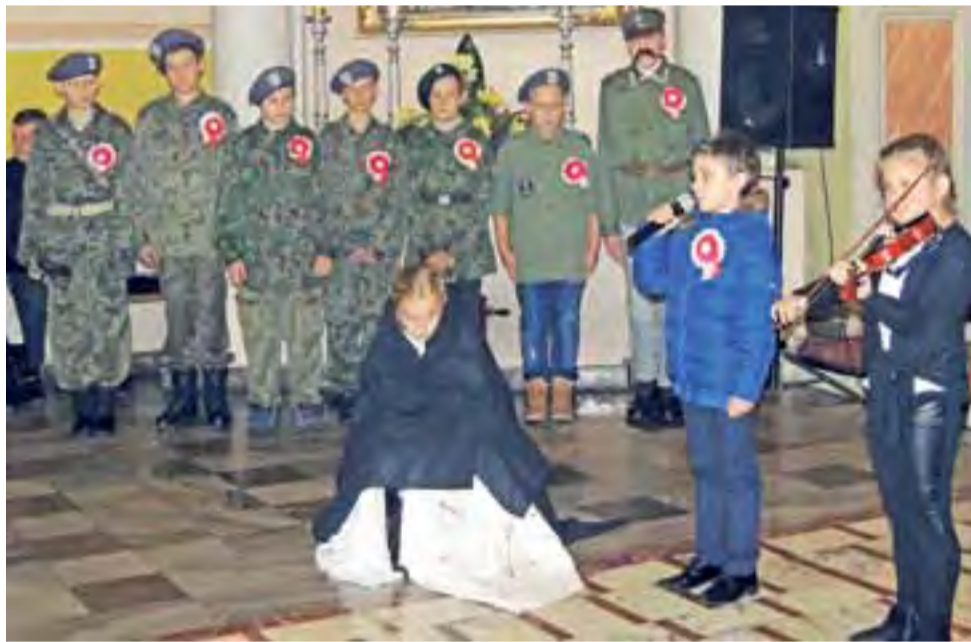
Występ uczniów SP nr 2 w Żychlinie z okazji Dnia Niepodległości.

Historyczna podróż do czasów odzyskania niepodległości przeżywana była przepięknym wykonaniem patriotycznych pieśni, po ciuchu podśpiewywanych głównie przez starsze pokolenie mieszkańców. Ich marszowy rytm