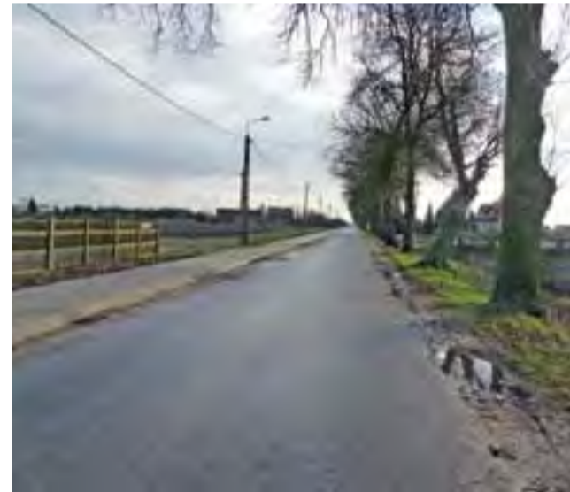
Ciężki transport buraków cukrowych niszczy pobocza ulicy Jabłonkowej. Radni wnioskujeją, by Starostwo Powiatowe w Kutnie ustawiło znaki ograniczające tonaż samochodów jadących tą ulicą.

Na razie nie zrobiono nic. Dlatego samorządowcy chcą jeszcze raz interweniować u zarządcy drogi. dag