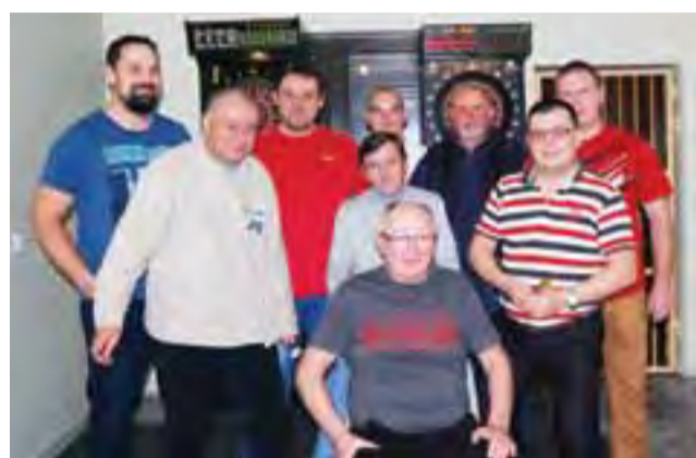
Kolejne spotkanie odbędzie się w piątek, 27 listopada o. 19. Gogo