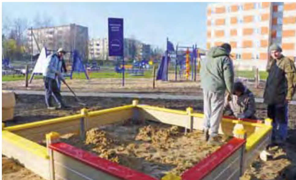
Zakończono montaż dodatkowej piaskownicy, obok placu zabaw Nivea. Sam plac ogrodzony drutem, by do czasu ukorzenia się trawy nikt na teren placu nie wchodził.

Niestety, okazało się, że taśmy zabezpieczające nowo postawiony plac Nivea nie wystarczają, gdyż dzieci kuszone pięknymi zabawkami i tak wchodziły na teren placu. Tymczasem plac jest wyłączony na razie z użytkowania, by rozłożona z rolek trawa dobrze się ukorzeniła. Dlatego teraz cały plac jest ogrodzony siatką zamocowaną na drewnianych słupkach. Plac zostanie udostępniony dzieciom na wiosnę. dag