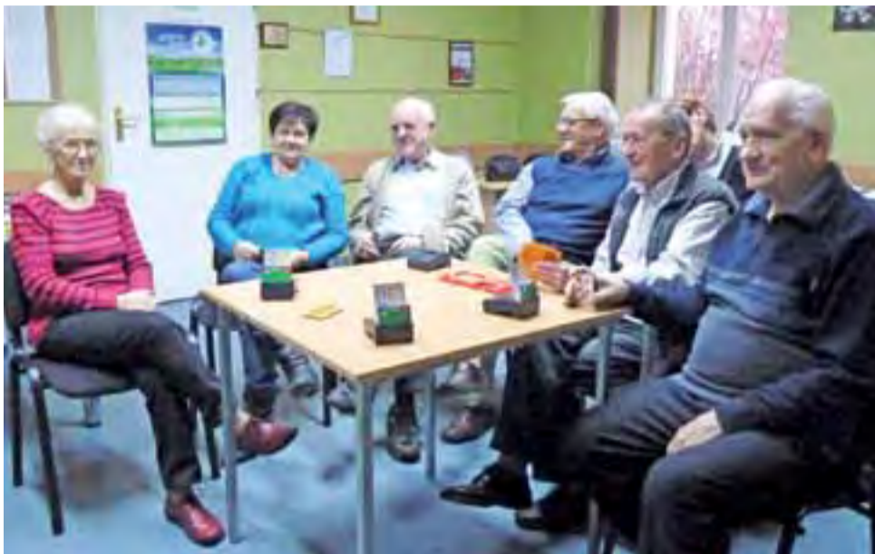
Członkowie kółka brydżowego przed rozpoczęciem gry.