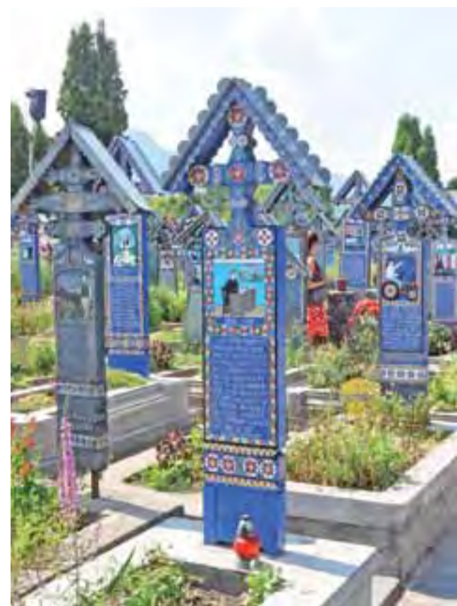
Wesoły Cmentarz w Rumunii.