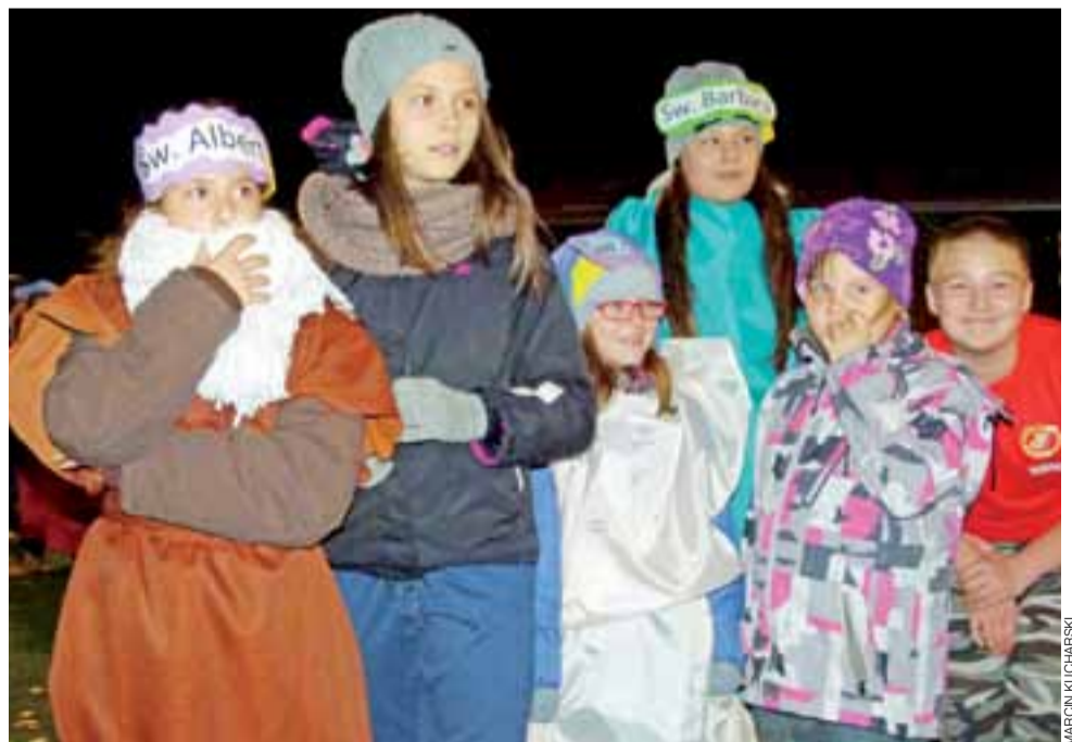
„Święci”, choć zmarznięci, bywają też uśmiechnięci.