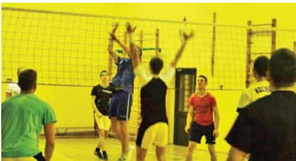
W Kocierzewie rywalizuje w sumie 10 zespołów.

zjum Łaguszew – Korona Wejsce 2:0 (25:4, 25:19), FC Popcorn Kropka – Klub Szalonych Dziewic 0:2 (12:25, 14:25), Pauza: Mocno Rozgrzani.