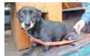
Ostatnia z bud, podarowanych podczas poprzedniej akcji, trafiła do Polesia. Jej mieszkańcem został pies o imieniu Kruczek.