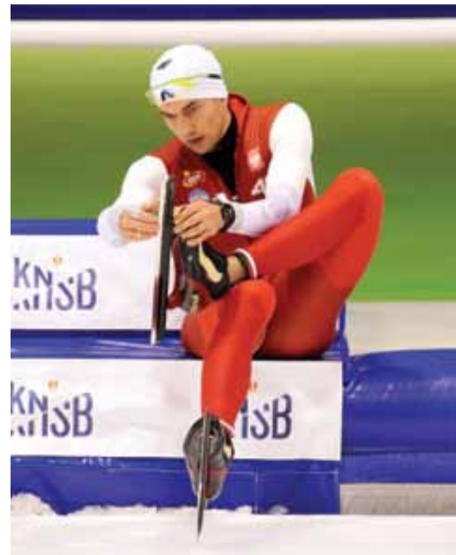
Zbigniew Bródka podczas Mistrzostw Świata w 2015 r.