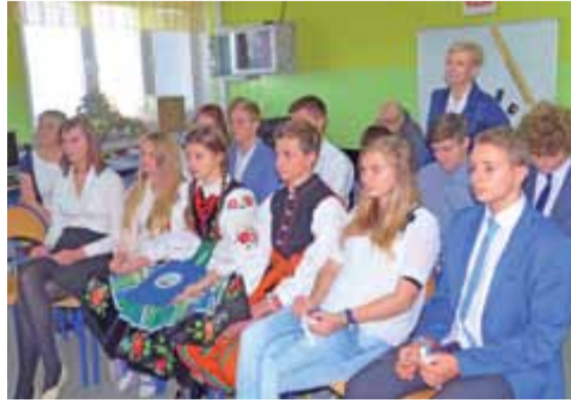
Białe koszule, marynarki i stroje folkowe. Młodzież z Popowa na rozmowę z ambasadorem ubrała się tak, jak na ważną uroczystość.