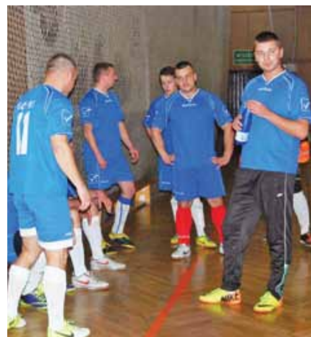
Górki przegrały z Szkiełkami 3:1.

2. kolejka III ligi ŁoLiF – sobota-niedziela, 28-29 listopada (s), godz. 20.00: Toreliusz Łowicz – Merc-OSP Karsznice; (n), godz. 13.00: Laktoza Łyszkowice – Baumit Łowicz; (n), godz. 13.30: KS Stefan Łowicz – Victoria Zabostów; (n), godz. 14.30: Victoria Bielawy – Bang Bang Łowicz; (n), godz. 15.00: Gutenów Łowicz – Subiekt Nieborów; (n), godz. 15.30: Alcatraz-Przedmieście Łowicz – Dąbro Łowicz; (n), godz. 16.00: Fenix Boczek – Start Złaków Borowy