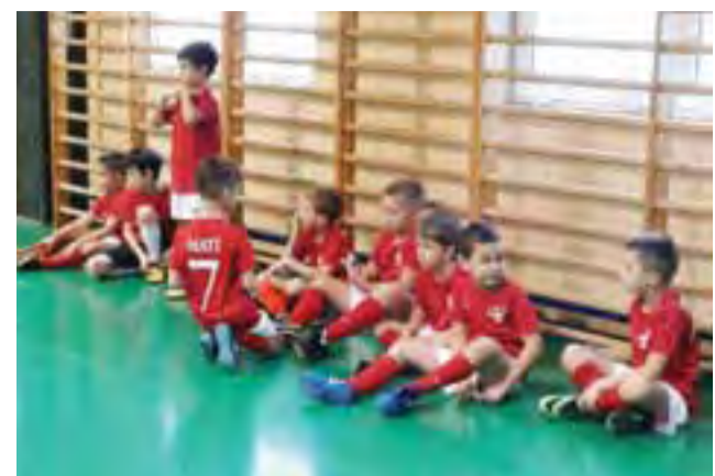
Najmłodsi zawodnicy Akademii Piłkarskiej z Łowicza