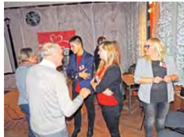
Happening Szlachetnej Paczki w Żychlińskim Domu Kultury.

Wolontariusze, którzy biorą udział w akcji, po raz kolejny wspominali sytuację, gdy w jednej z rodzin w tym roku chłopiec