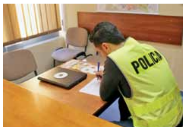
Dzięki współpracy z funkcjonariuszami z Interpolu, policjanci z Kutna zatrzymali 30-letniego mężczyznę, który posiadał filmy z pornografią dziecięcą. Zabezpieczono komputer i wiele płyt CD z nagraniami.