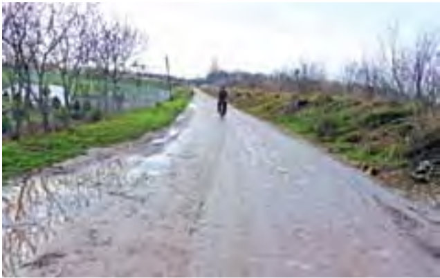
Po deszczu ulica Dobrzelińska pokryta jest warstwą rudej mazi.

Uczniowie z Zespołu Szkół powitali gości z Europy. str. 9