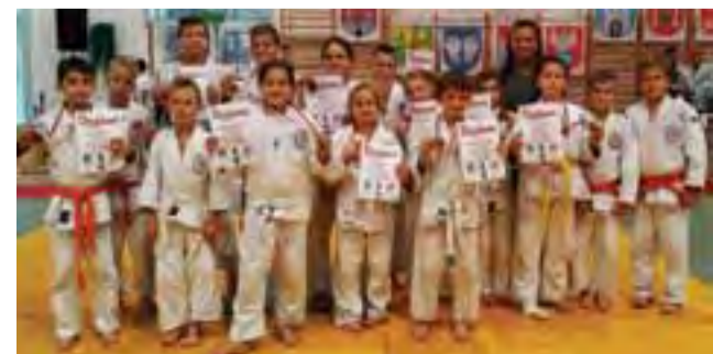
Zadowolony łowiccy judocy z medalami.