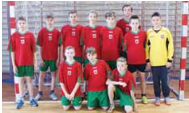
Reprezentacja chłopców Szkoły Podstawowej Nr 2 w Żychlinie podczas Finału Powiatowego Szkół Podstawowych w Mini Piłce Ręcznej.