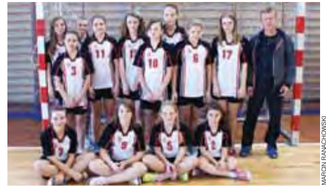
Reprezentacja dziewcząt Szkoły Podstawowej w Grabowie podczas Finału Powiatowego Szkół Podstawowych w Mini Piłce Ręcznej.

Sport szkolny | Finał Powiatowy w Dziewcząt i Chłopców