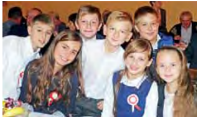
Dzieci ze Szkoły Podstawowej im. Marii Konopnickiej w Zielkowicach.

W przypadku indywidualnych lekcji, warto wcześniej zarezerwować dziecku miejsce przy jednym z komputerów. Na miejscu będzie też możliwość uzyskania pomocy od jednej z bibliotekarek, ale tylko w zakresie obsługi komputera i programu, dziecko będzie samo odpowiadało na pytania i wykonywało zadania. Placówka będzie chciała w najbliższych dniach zachęcić do udziału w kursie 5-6 letnie dzieci z przedszkola w Bolimowie, które mogłyby odwiedzać bibliotekę w czasie swoich zajęć w placówce. Kurs jest nieodpłatny, biblioteka ma dostęp do platformy go oferującej do października 2016 roku. tb