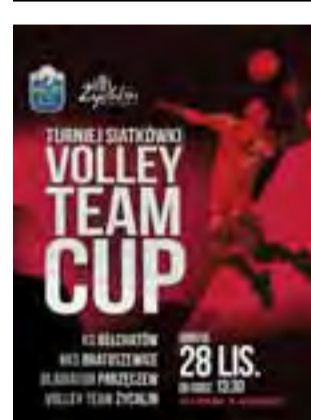
Plakat informujący o turnieju siatkarzy w Żychlinie.

NIEDZIELA, 22 LISTOPADA: ■ 12.45 - Szkoła Podstawowa Nr 6 w Kutnie (ul. Łąkoszyńska 9); 3. kolejka Kutnowskiej Amatorskiej I Ligi Siatkówki Mężczyzn; GKS Bedno - AZS WSGK Kutno; ■ 16.15 - Szkoła Podstawowa Nr 6 w Kutnie (ul. Łąkoszyńska 9); Kutnowska Amatorska II Liga Siatkówki Mężczyzn; Volley Team Żychlin (Juniorzy) - Husaria Daszyna.