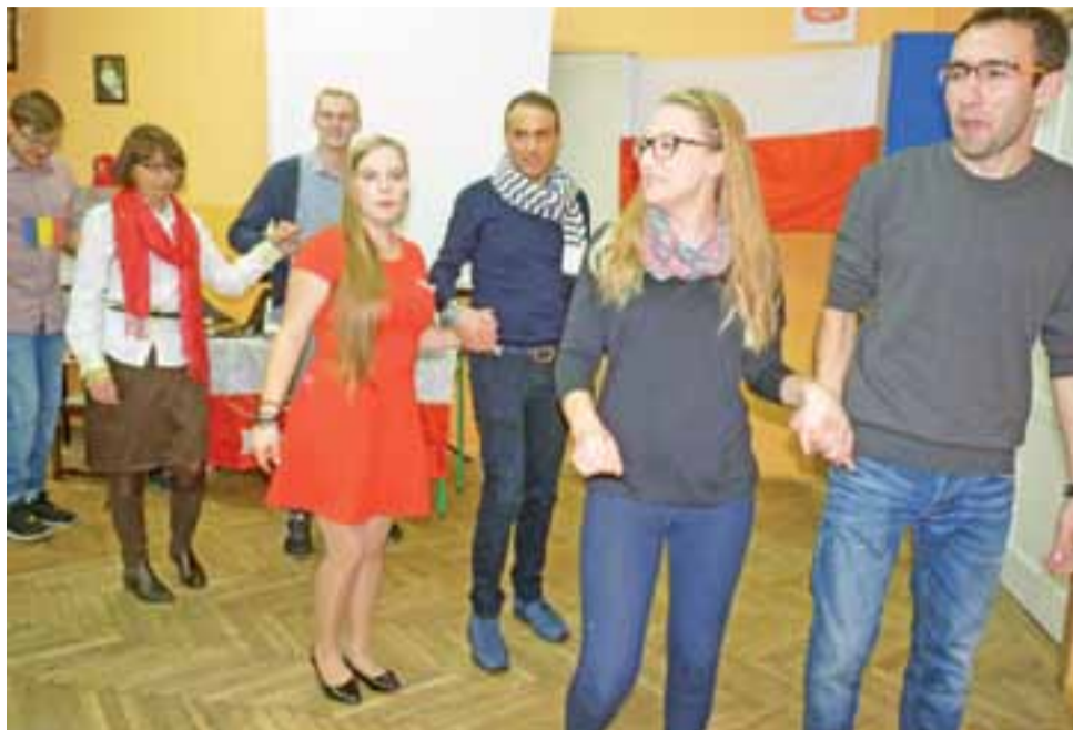
12 nauczycieli z Rumunii, Bułgarii, Włoch i Turcji, którzy gościli w Żychlinie w ramach programu Erasmus+ wspólnie tańczyli „belgijską”.

Po tej prezentacji żychlińscy uczniowie ku zaskoczeniu gości zaśpiewali wiązankę piosenek z krajów partnerskich. Wtedy od razu uśmiech zagościł na twarzach gości. Był też taniec belgijski, której uczniowie z ZS nauczyli się podczas jed-