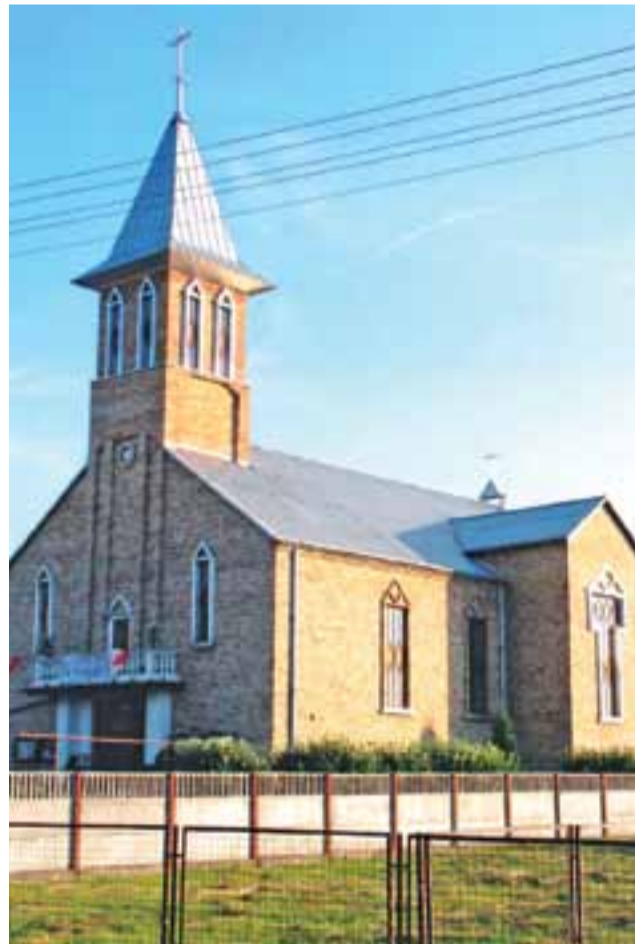
Kościół św. Stanisława Męczennika Parafii Stachlew pod wezwaniem Matki Bożej Jasnogórskiej, rok 1999.