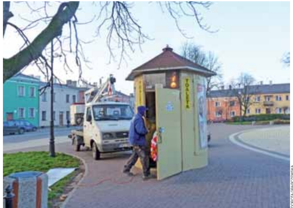
Przed zimą naprawiano jedyny miejski sanitariat znajdujący się koło fontanny.

Toaletę w centrum Żychlina ustawiono przy okazji modernizacji placu starówki. Bliskość kanalizacji ściekowej sprawiła, że ścieki są odprowadzane bezpośrednio. W toalecie jest też umywalka,