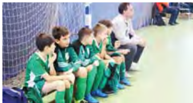
Pelikan 2004 w Zgierzu przegrał trzy mecze.