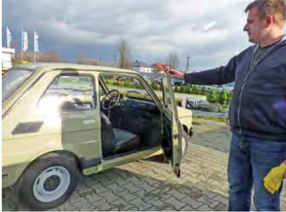
W poprzednim roku szkolnym uczniowie I klasy technikum samochodowego całkowicie wyremontowali „malucha”. Mogą być dumni ze swojej pracy.

Jak mówi właściciel, prace nad przygotowaniem pomieszczeń do praktycznej nauki zawodu trwają od 3 tygodni, wykonują je pracownicy firmy. Od 1 grudnia zajęcia będą odbywać się w nowych