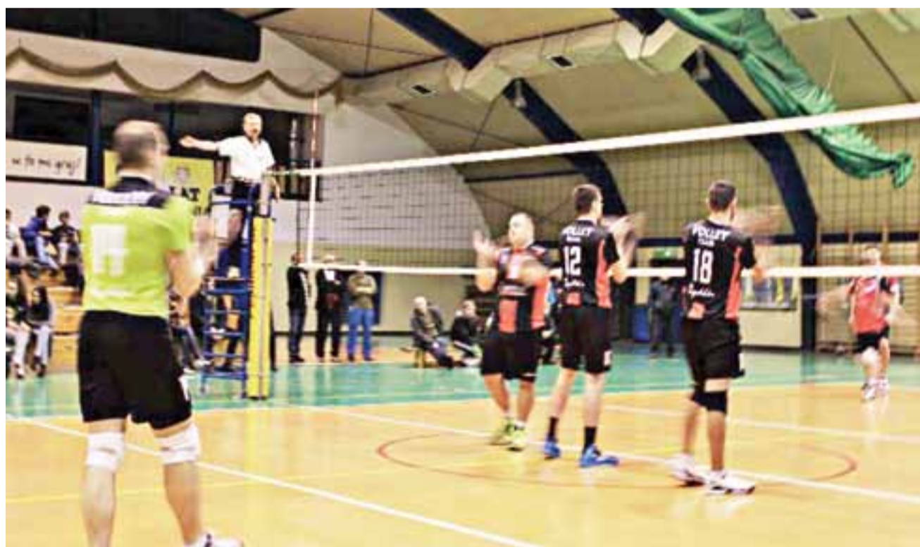
Spotkanie wyjazdowe Volley Team Żychlin kontra Juvenia Rawa Mazowiecka w rozgrywkach łódzkiej III ligi mężczyzn.