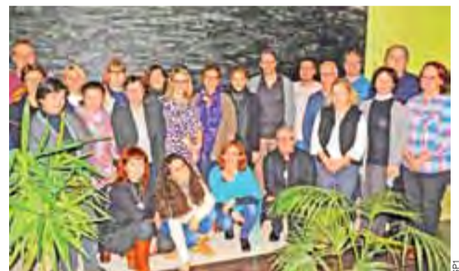
Uczestnicy z 9 krajów partnerskich podczas pierwszej wizyty w Estonii. Nauczyciele ustalali strategię realizacji projektu Erasmus+.

W pierwszym roku działania projektowe będą się skupiać na szkoleniu nauczycieli w zakresie integracji uczniów niepełnosprawnych, z trudnościami edukacyjnymi oraz ze środowisk migracyjnych. Wspólnie zostaną wypracowane metody, które pozwolą wprowadzić muzykę jako jedno z narzędzi edukacyjnych do nauczania wszystkich przedmiotów podstawowych takich jak np. matematyka, przyroda, język polski, język angielski itp.