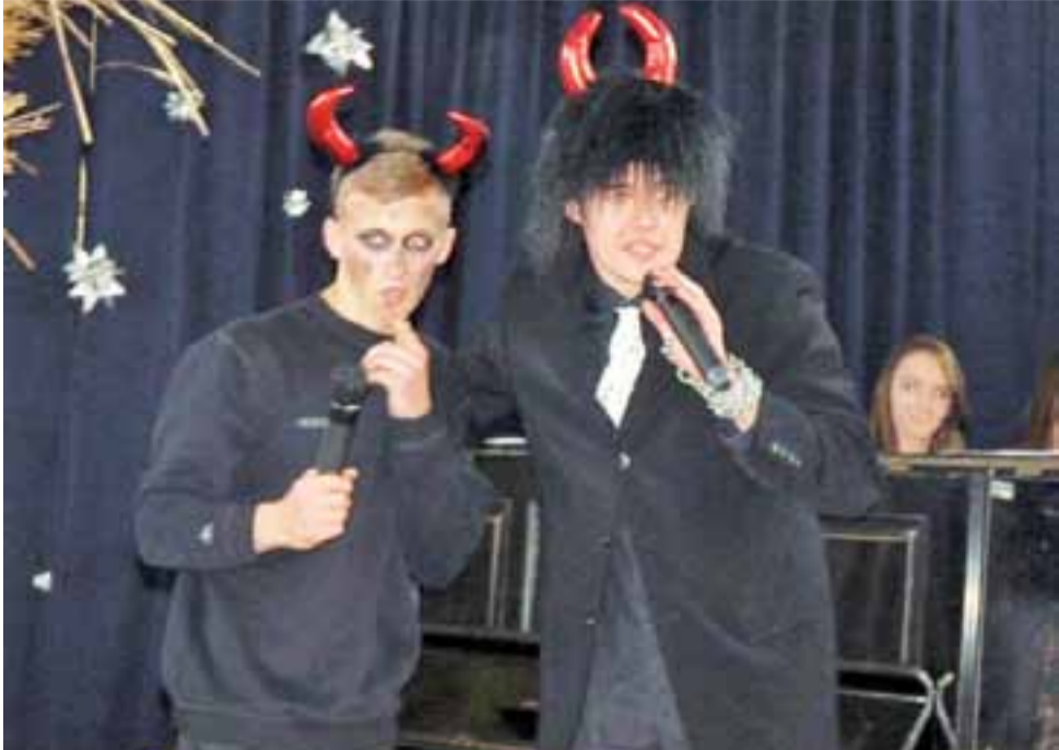
Lucyfer i jego diabły knują, jak nie dopuścić do narodzenia Jezusa.