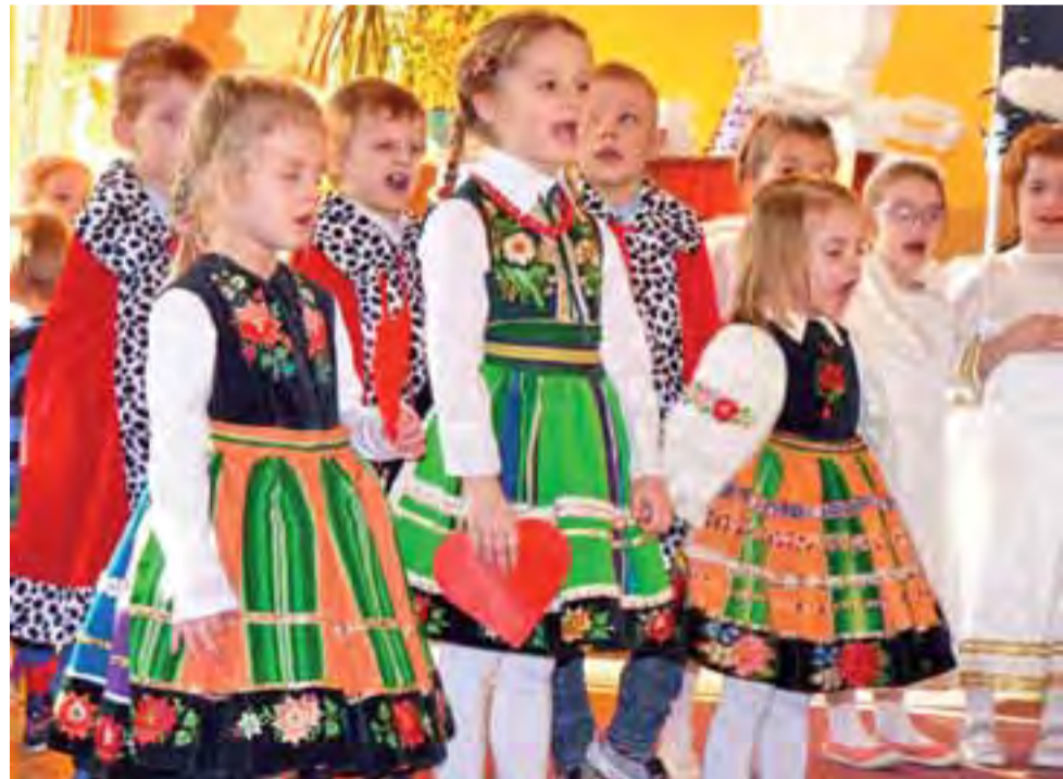
Do żłóbka przybyły też dzieci – przedszkolaki w łowickich strojach, które wyrecytowały przygotowane wierszyki.