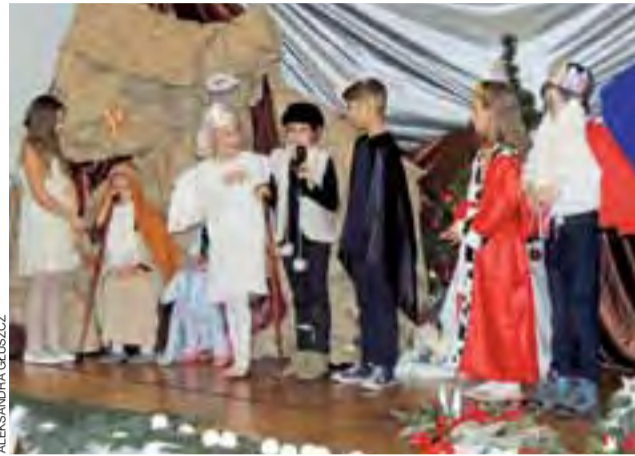
Uczniowie Szkoły Podstawowej nr 1 w Żychlinie.

W poprzednich latach powitanie Nowego Roku było połączone z wydarzeniem kulturalnym. Najczęściej był to koncert jakiejś gwiazdy lub występ zawodowych tancerzy, którzy prezentowali swoje umiejętności. Trwał zwykle do godz. 1-2 w nocy. Taka forma była bardziej swobodna, była alternatywą spędzenia ostatniego wieczoru w roku, nawet dla singli. Tegoroczna forma z DJ-em jakoś nie przeżyła wielu żychlinian. dag