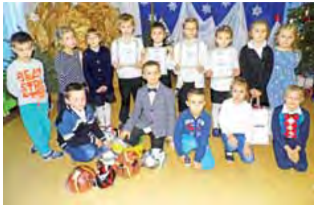
Uczniowie klasy I z SP w Żeronicach byli najlepsi w zbieraniu surowców wtórnych. W znaczący sposób przyczynili się do sukcesu szkoły.

Drugie miejsce wywalczyła SP Żeronice, gmina Bedlno. 74 uczniów zebralo 2.431 sztuk,