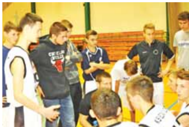
W Łodzi łowiczanie zagraли w mocno rezerwowym składzie.

Piłka nożna | Podsumowanie występów Pelikana 1999