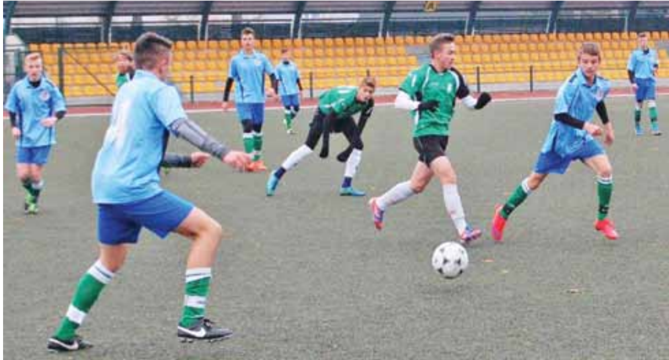
Pelikan 2001 po walce przegrał z UKS SMS Łódź 2:4 w meczu rozegranym w Łowiczu.

Pelikan wyprzedził Mazowiec Tomaszów Mazowiecki, Widzew Łódź oraz Mechanik Ra-