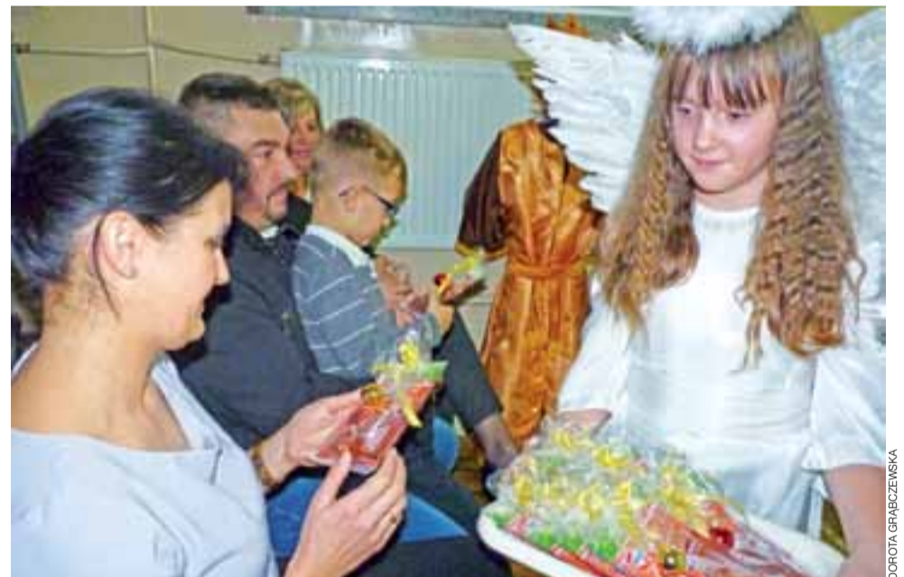
Anioły rozdawały rodzicom świąteczne upominki.

Był czerwony barszczyk, krokiety z kapustą i grzybami, ryba, śledź i surówki na liczne sposoby. Wigilijna kolacja była też okazją, by rodzice wzajemnie lepiej się poznali i porozmawiali. To później ma swoje przełożenie na większą integrację i organizację rodziców w licznych przedsięwzięciach realizowanych na rzecz szkoły. Po kilku latach są jak jedna wielka rodzina. dag