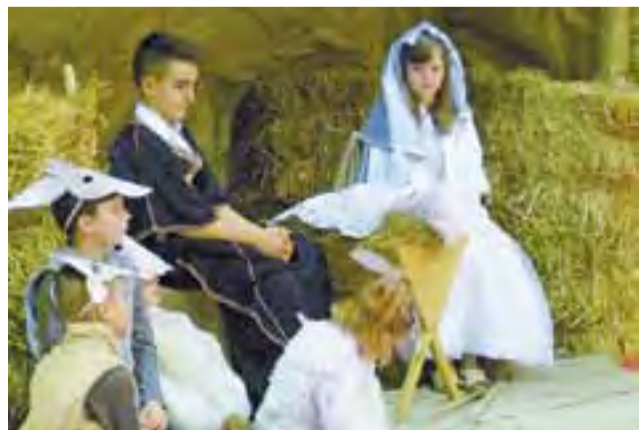
Pastuszkowie czuwają przy grobie Jezusa.

Po przedstawieniu jasełkowym wystąpił również miejscowy zespół Kuzyny, który zaprezentował krótki koncert koled. tm