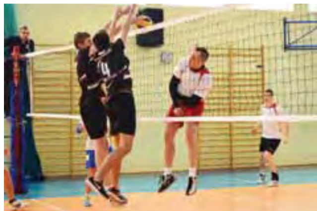
Blok w wykonaniu zawodników juniorskiej drużyny Volley Team Żychlin w przegranej 0:2 meczu ze Świt Staroźreby.