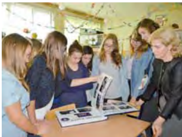
W ramach miesiąca bibliotek uczniowie Gimnazjum nr 2 odwiedzili m.in. bibliotekę w Gimnazjum nr 1 im. Henryka Sienkiewicza.

Kolejnym działaniem było odwiedzenie bibliotek w Szkole Podstawowej nr 4 oraz Gimnazjum nr 1, w celu poznania ich. Natomiast w swoim gimnazjum młodzież przeprowadziła ankietę na temat działalności biblioteki i jej wynik wypadł bardzo optymistycznie, bo ankietowani zauważają działania biblioteki i doceniają je. Właśnie w tej ankiecie twierdząco odpowiedzieli też na pytanie: Czy prawdą jest, że biblioteki