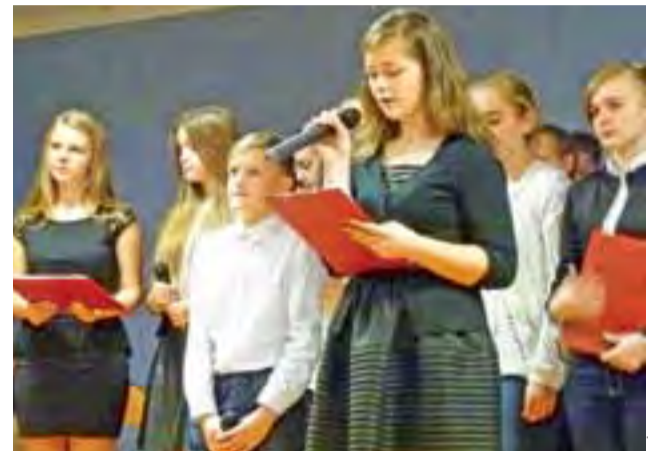
Samorządowy opłatek w Bielawach. Na scenie gimnazjaliści z Soboty.