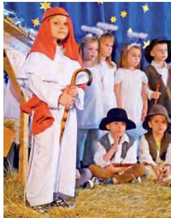
Jasełka pod hasłem „Idziemy do Jezusa” zaprezentowały 15 grudnia dzieci z najstarszej grupy Przedszkola nr 2 „Pod tęczą” w Łowiczu. Oprócz tradycyjnych jasełkowych postaci – św. Józefa, Maryi z dzieciątkiem i pastuszków, pojawiła się też cała plejada odwiedzających żłóbek postaci znanych z najpopularniejszych bajek, takich jak: Sierotka Marysia, Calineczka, Dziewczynka z zapałkami, Jaś i Małgosia, Pinokio czy grupka Smerfów. Nie zabrakło przy tym śpiewanych z wielką werwą kołęd i pastorałek. tm