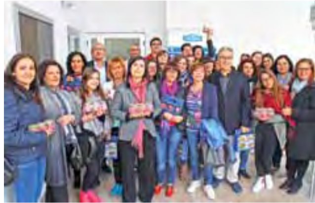
Dyrektorzy szkół i nauczyciele z Włoch, Polski, Turcji, Portugalii, Grecji, Słowacji i Chorwacji podczas wizyty studyjnej we Włoszech.