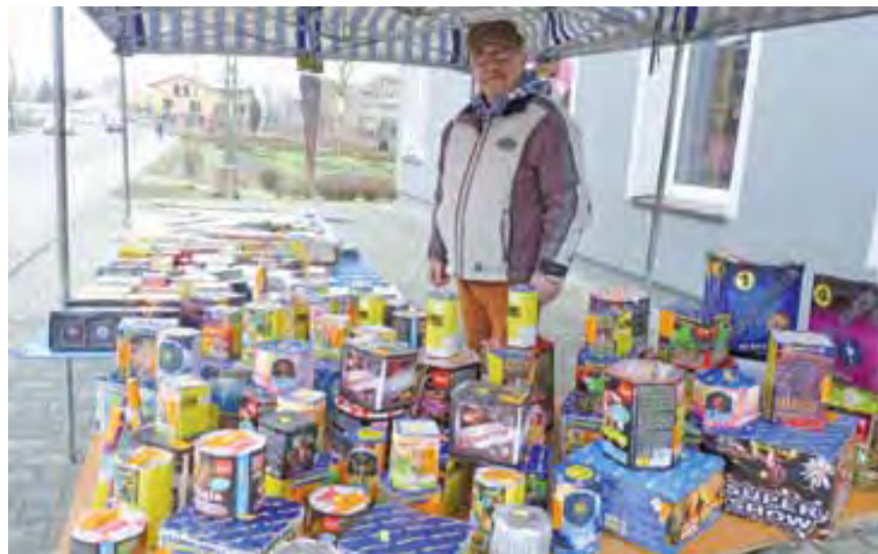
Na stoisku fajerwerków za rzeką, przy ulicy Narutowicza, wybór materiałów pirotechnicznych jest bardzo bogaty, o bardzo zróżnicowanej cenie, na każdą kieszeń.

Na wszelki wypadek najlepiej stać w odległości 15 m od miejsca odpalenia petard. dag