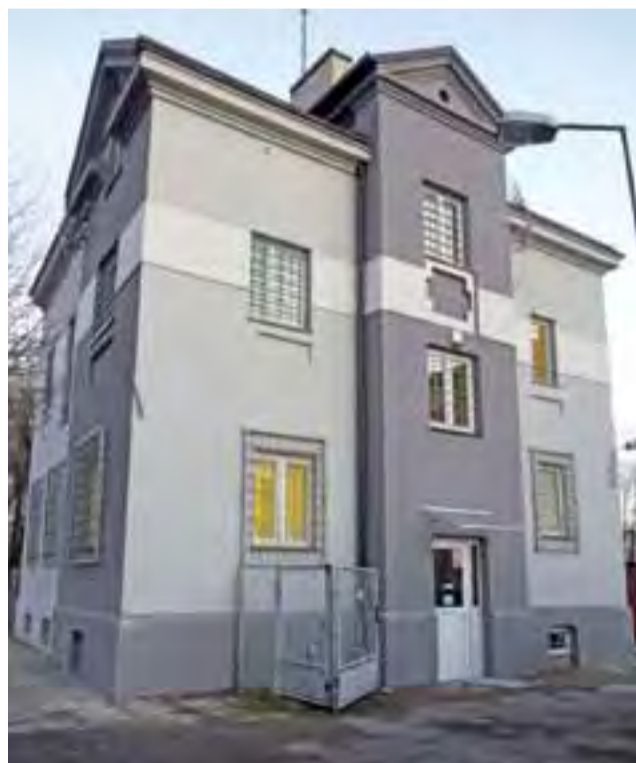
Przed świętami zakończono remont elewacji budynku Komisariatu Policji w Żychlinie. Brakuje tylko tablic informacyjnych i znaku policji.

Remont elewacji był możliwy dzięki finansowemu wsparciu trzech gmin: Żychlin, Bedlno i Oporów, które przekazały łącznie 31.000 zł. Gmina Żychlin przekazała 25.000 zł już 28 maja,