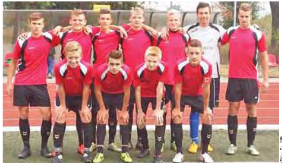
Pelikan 1999 zagra w I lidze wojewódzkiej.

Pelikan 1999 w kolejnej rundzie rywalizował będzie w I lidze wojewódzkiej z takimi zespołami jak wspomniana Omega czy też ŁKS Łódź, Ceramika Opoczno, GKS Belchatów, Widzew Łódź.