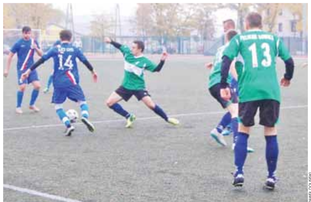
W rewanżu Pelikan 1997/98 pokonał AKS SMS Łódź 2:0.

– Generalnie ten zespół stał nawet na wygranie tej ligi chociaż Ceramika Opoczno jest zdecydowanie najlepszym zespołem. Uważam, że sama liga jest przeciętna. Jestem zadowolony z zespołu, druga runda była w naszym wykonaniu dużo lepsza. Zespół uwierzył w siebie, zobaczył że można rywalizować z każdym rywalem. Potrzeba