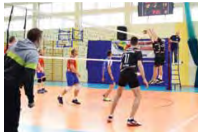
Spotkanie pomiędzy Volley Team Żychlin (Junior) a Witoniam, zakończone wynikiem 0:2.