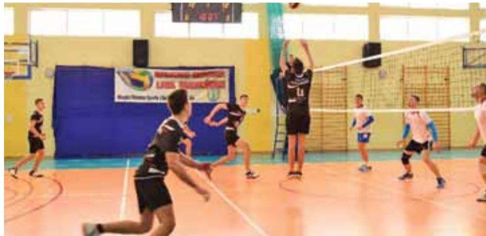
Juniorowska drużyna Volley Team Żychlin nie pokonała ekipy Świt Staroźreby podczas 7. kolejki.