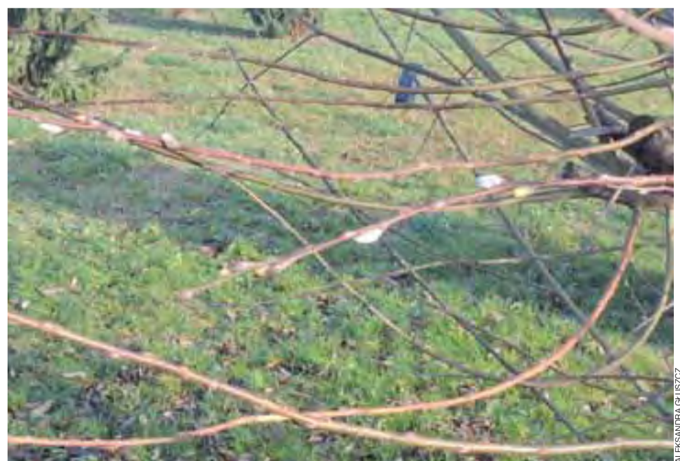
Na ul. Orłowskiego zakwitły baze. Zdjęcie zrobione w Wigilię Bożego Narodzenia – natomiast aura jak na Wielkanoc, więc i przyroda zachowuje się jak na wiosnę. ag