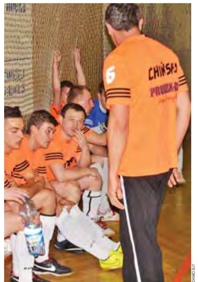
„Chirńscy” zagrają w niedzielę z nieobliczalnymi Blokeraami.