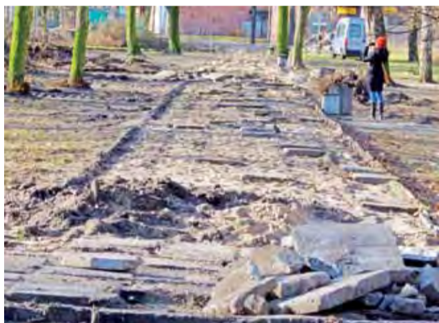
Świeżo zerwany chodnik w parku. Od dawna był nierówny.

Projekt zakłada zupełną zmianę wizerunku parku, który był zaniedbany zarówno pod względem ciągów pieszych, jak i drzewostanu. Chodniki w parku były od kilku już lat nierówne, pozapadane w jednych miejscach i wybrzuszone przez korzenie drzew w innych. Drzewa były zaniedbane i przerośnięte. Wiele z nich było chorych i nie brakowało też tzw. samosiewek. Zostać mają drzewa w pełni zdrowe oraz cenniejsze gatunki, np. klon srebrzysty rosnący od strony placu zabaw przy ul. Mickiewicza. – Wiele osób uważa, że w parku powinno być bardzo dużo drzew, ale park powinien być też jasny