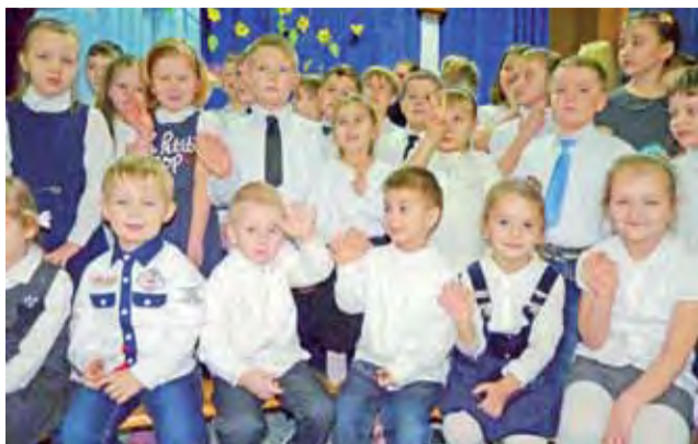
Najmłodsi uczniowie Szkoły Podstawowej w Wygodzie witają przybyłych gości.