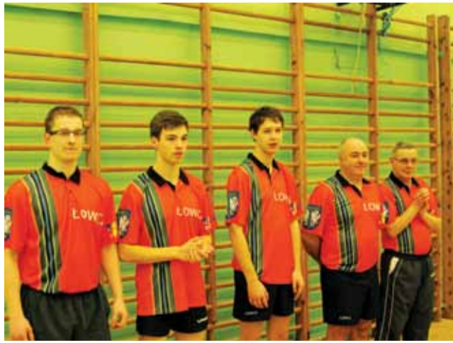
Drużyna drugoligowego Książka Łowicz.

11. kolejka II ligi tenisa stołowego mężczyzn: UKS Fungis Maków - UMKS Książek Łowicz 8:2 , PKS Polonia Białogon Kielce - LTSR Buczek 0:10, UKS Orleża Błocza - Energetyk AMŁ Działiny