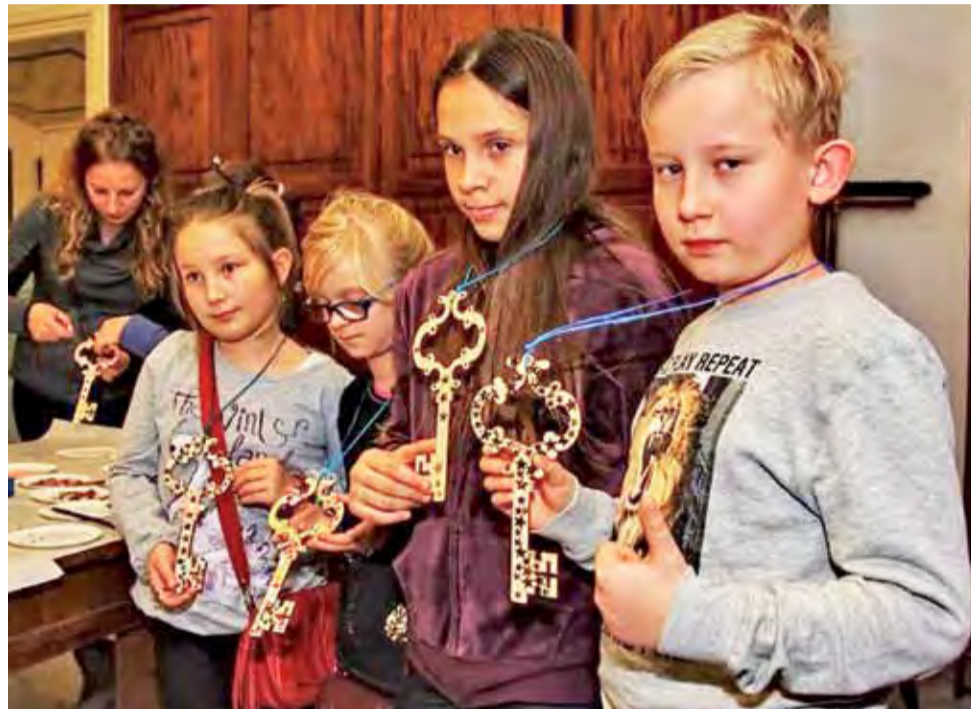
We wnętrzach muzeum i okalającym go parku odbywa się wiele ciekawych zajęć. Na zdjęciu dzieci w czasie wróżb andrzejkowych z 2014 roku.

Większość turystów odwiedzających Nieborów i Arkadię pochodzi ze stolicy.