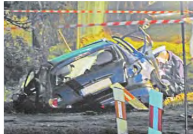
Działania policyjne na miejscu wypadku.

Siła uderzenia może świadczyć o nadmiernej prędkości.