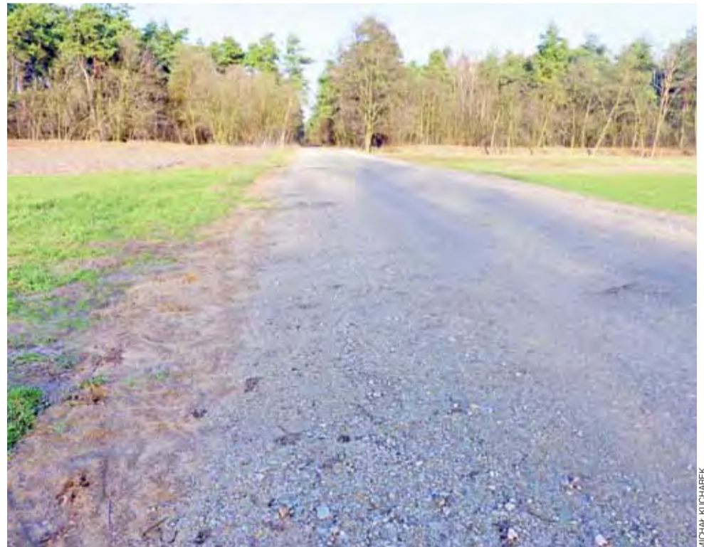
Już w niedługim czasie tak będzie wyglądała cała droga pomiędzy Laskiem Miejskim a Uchaniem.

Jednak skrócenie, nawet o kilka kilometrów, codziennej drogi, jaką muszą pokonywać mieszkańcy sąsiednich miejscowości, jest dla nich bardzo istotne. Ludzie szukają oszczędności wszędzie, również w kosztach paliwa. Analogiczna sytuacja występuje we wsi Zawady. Jej mieszkańcy wolą korzystać z nieutwardzonej drogi prowadzącej do Bobrownik niż kierować się na asfalt, który jest kilka kilometrów dalej, w Serokach. ■