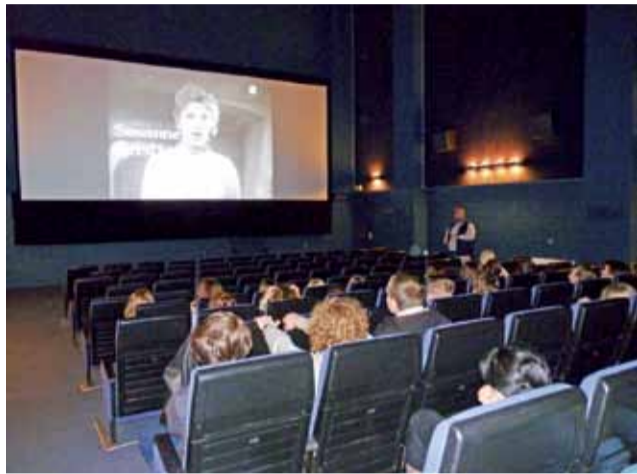
Uczniowie I LO podczas sceny kończącej film „Ścieżki Chwały”, w której to młoda Niemka śpiewa ze łzami w oczach do francuskich żołnierzy.

„Full Metal Jacket” można przetłumaczyć jako „Uzbrojony po zęby”, jednak tytuł ten nie oddaje w pełni ładunku emocjonalnego, który obraz ze sobą niesie. To opowieść o grupie amerykańskich żołnierzy, która zostaje wysłana na wojnę w Wietnamie. Bohaterowie wcześniej musieli przejść morderczy trening fizyczny i psychiczny, by mogli stać się maszynami do zabijania. W jednej ze scen dziennikarz rozmawia ze strzelcem ciężkiego karabinu maszynowego, umiejscowionego na helikopterze. Strzelec pyta dziennikarza, czy może o nim by nie napisał artykułu, gdyż „je-