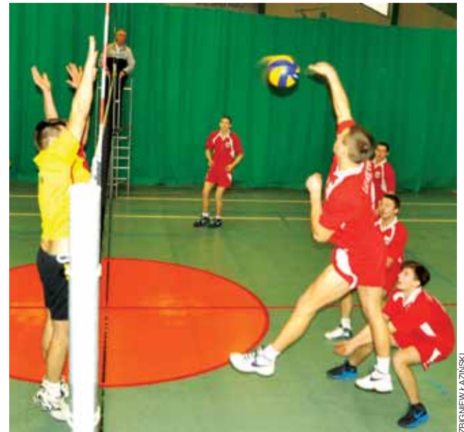
Karasuno Skierniewice zaskakująco łatwo ograło LKS Retki.

■ Karasuno Skierniewice - LKS Retki 3:0 (25:22, 25:20, 25:19)