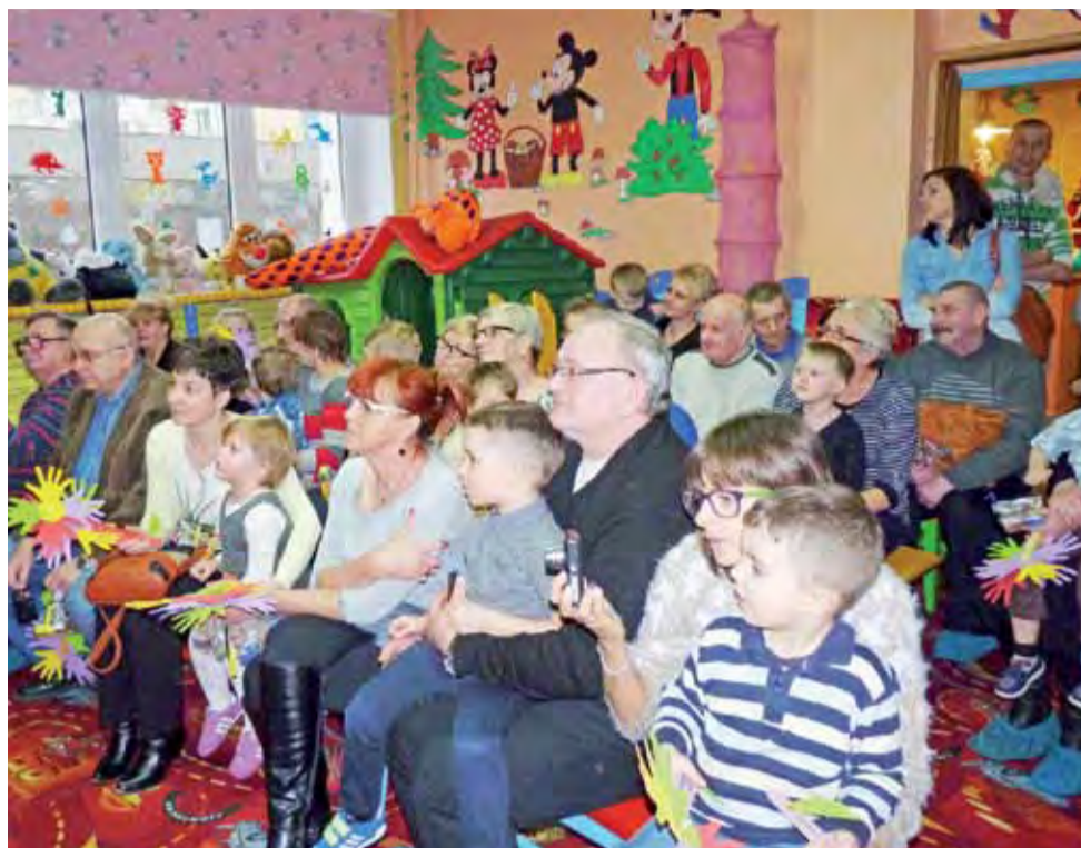
W przedszkolu prywatnym „Bajkoland” 20 stycznia przedszkolaki świętowały Dzień Babci i Dziadka. Na zdjęciu oglądają, wspólnie z dziadkami i rodzicami, przedstawienie przygotowane przez animatorów z teatru „Pinokio”. Wcześniej same zaśpiewały piosenkę o tym, jak bardzo kochają swoich dziadków. mą

RZUT OKIEM | DZIEŃ BABCI I DZIADKA W BAJKOLANDZIE