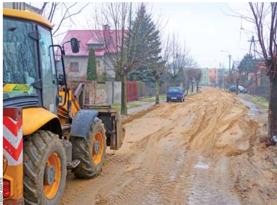
Ulica Cicha w Łowiczu po budowie kanalizacji sanitarnej i deszczowej wygląda niemal jak gruntowa.

Obecnie gmina Bolimów, po poprawieniu specyfikacji przetargowej, czeka na nowe oferty, które mają być złożone w urzędzie do 23 stycznia. Wyłoniony wykonawca będzie miał czas na realizację zadania do 3 czerwca tego roku. tb