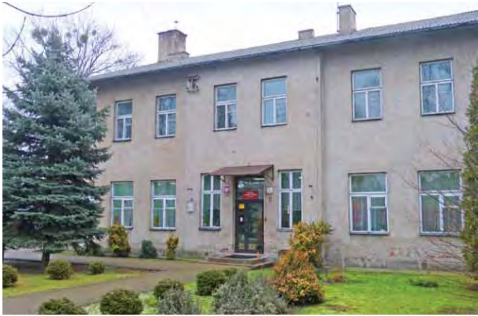
Jednym z budynków, który powiat będzie remontował, jest siedziba Poradni Psychologiczno-Pedagogicznej przy Armii Krajowej w Łowiczu.

Łowicz | Przetarg na termomodernizację sześciu budynków