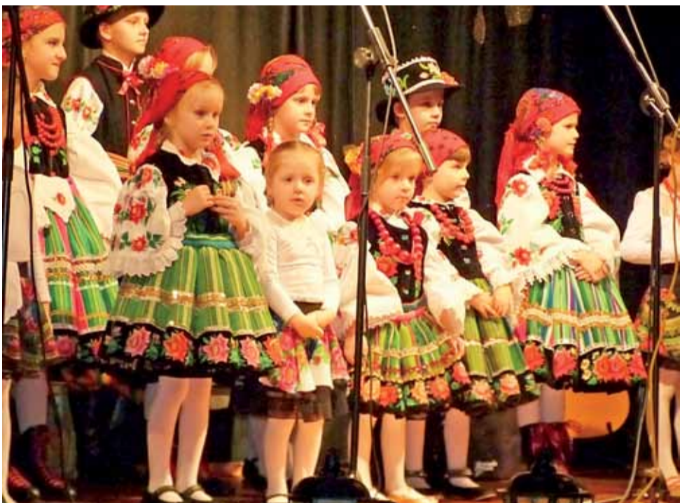
Występ Zespołu Integracyjnego „Furkotki”. Podczas koncertów w ramach projektu „Muzyka Łączy Ludzi” zbierane są środki na działalność tego zespołu.