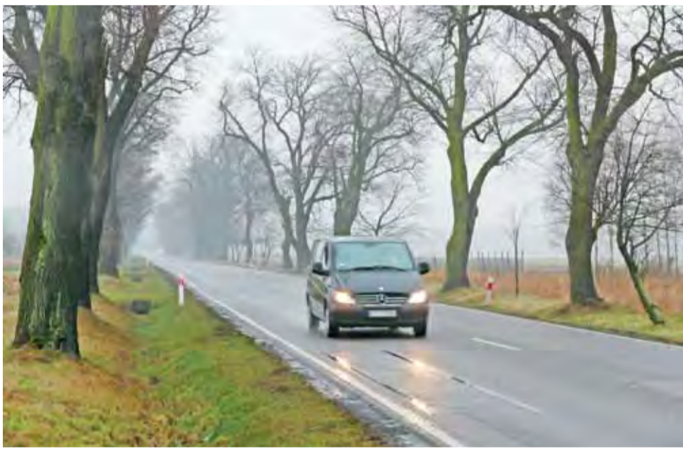
Droga krajowa nr 70 pomiędzy Arkadią a Nieborowem przebiega w cieniu zabytkowej lipowej alei, jeśli miałyby powstać wzdłuż niej ścieżka rowerowa, to raczej od strony pól, ponieważ między drzewami a jezdnią nie ma już miejsca.

Dlaczego wniosek pojawił się właśnie teraz? Urbanek tłumaczy, że przede wszystkim z potrzeby. Poruszanie się drogą nr 70 rowerem stało się bardzo niebezpieczne po uruchomieniu