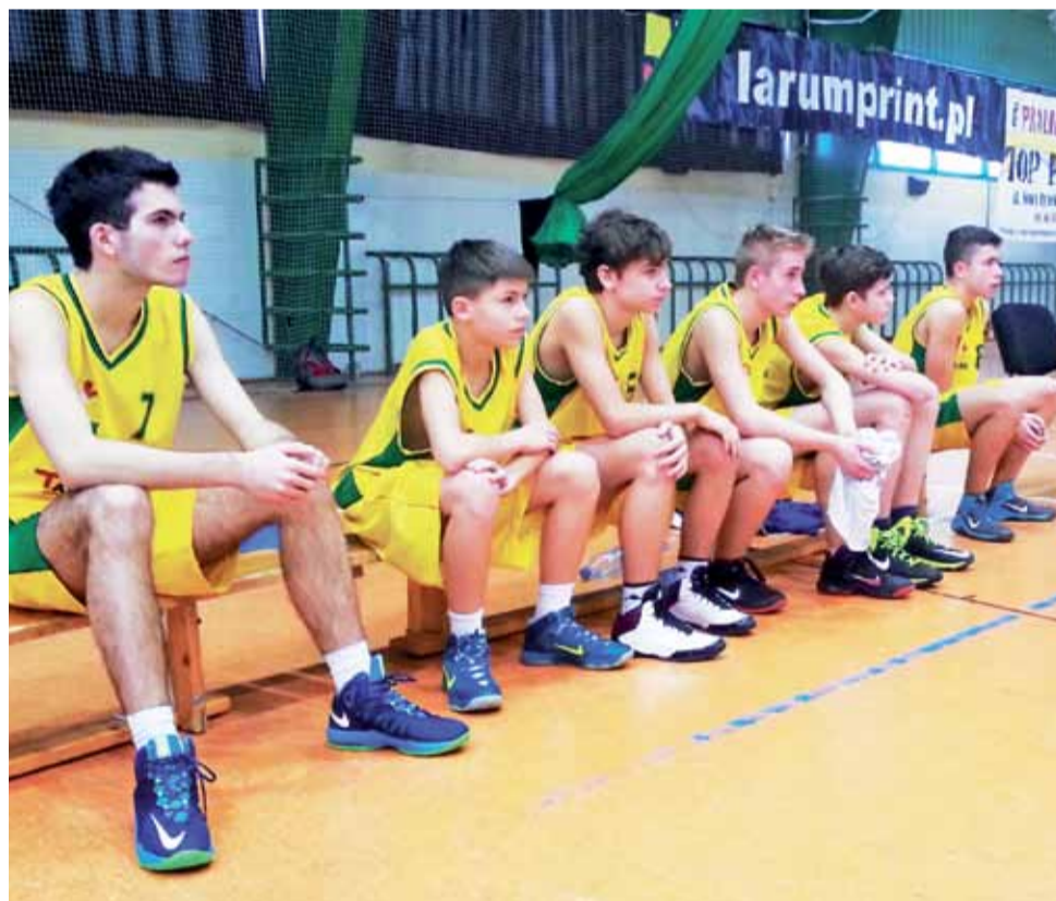
Księżacy nie mieli powodów do zadowolenia w meczu z Trójką Sieradz.