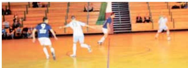
Szkietka-Dżajf (granatowe stroje) wygrały z Orłami Sonoco 3:1.

minuty później strzelił swojego drugiego gola i zapewnił Bezedurze cenne zwycięstwo. Niespodzianką można nazwać porażkę Stefana z KS Ostrowiec.