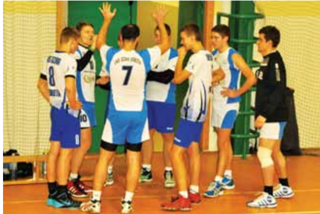
UKS Bzura Sobota pokonało lidera 3:0.

Kolejne zmagania siatkarszy amatorów już w sobotę w hali OSiR nr 2 o godzinie 13:00 24 stycznia 2015 roku. zł