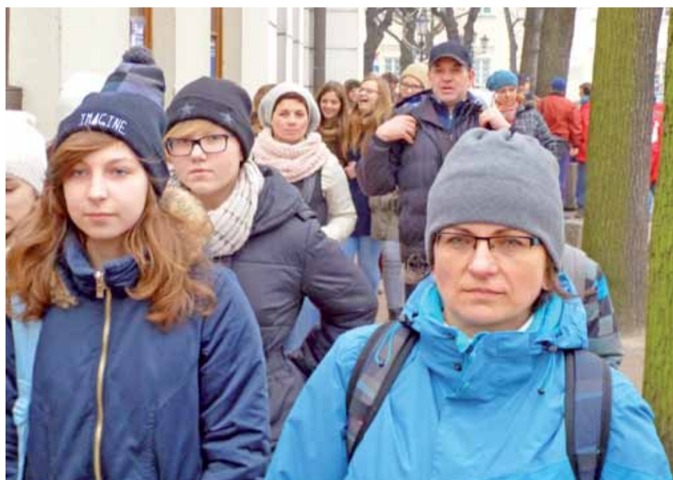
Uczestnicy spaceru na samym początku trasy – idą ulicą Podrzeczną.

Stamtąd wszyscy przeszli przez ok. 5 km do Łasku Miejskiego. Uczczono tam jeszcze jedną, ważną dla Łowicza rocznicę, odwiedzając pamiątkową mogiłę trzech bojowników PPS-Frakcji Rewolucyjnej, zamordowanych przez władze carskie 17 stycznia 1907 roku, w czasie