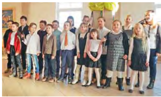
Koncert kolęd. Uczniowie Szkoły Podstawowej w Sobocie swoim występem uświetnili noworoczne spotkanie kół gospodyń wiejskich.