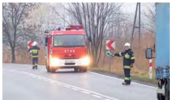
Strażacy jednostki OSP w Łowiczu w trakcie usuwania plamy oleju.

Niestety, wszystkie dotychczasowe wypadki na odcinku drogi krajowej nr 70 w Arkadii są efektem rażącego łamania przepisów ruchu drogowego przez kierowców. Odcinek ten przebiega przez teren zabudowany, a zatem obowiązuje tam ograniczenie prędkości do 50 km/h, poza tym jest tam podwójna linia ciągła. Jeśli ktoś nie respektuje tak podstawowych przepisów ruchu drogowego, to żadnym rozwiązaniem komunikacyjnym nie da się mu zapewnić bezpieczeństwa. GDDKiA nie planuje żadnych rewolucyjnych zmian na tym odcinku. Warto dodać, że od kiedy otwarta została autostrada A2, ruch na drodze krajowej nr 70, wbrew początkowym obawom, zmalał. Być może w jakiś sposób zwiększyłby bezpieczeństwo fotoradar, ale to powinien rozpatrzyć Inspektorat Ruchu Drogowego, bo GDDKiA nie ma już uprawnień w tym zakresie.