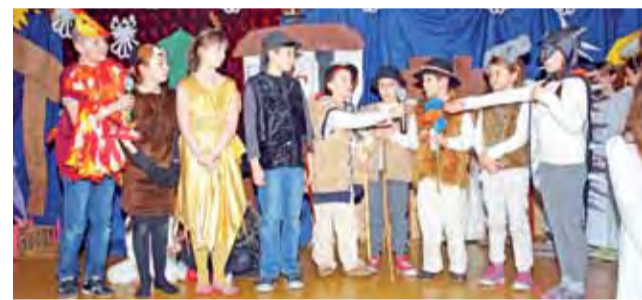
Przed gospodyniami wystąpiły dzieci ze Szkoły Podstawowej w Nowych Zdunach, które przedstawiły jasełka pt. „Pójdźmy wszyscy do stajenki”.

Noworoczne spotkanie gospodynie zaliczyły jako wyjątkowo udane. Snuły na nim też plany balu karnawałowego, który ma się odbyć 7 lutego.