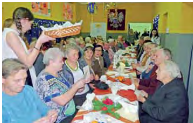
Spotkanie połączone było z opłatkiem wigilijnym, którym podzielono się po występach teatralnych uczniów.

Gmina Łowicz | Dzień Seniora w SP Wygoda