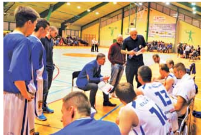
Łowicki Księżak powoli kończy pierwszą rundę walki o I ligę.