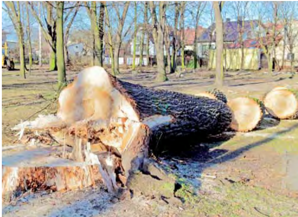
W Parku Mickiewicza wycięto łącznie około 60 drzew, w tym największe topole.

Ratusz wyłonił firmę, która zajmie się rewitalizacją 19 listopada, dwa tygodnie po otwarciu ofert. Przetarg rozstrzygnięto po tak długim okresie z uwagi na ilość złożonych ofert – aż 10 – i konieczność przeanalizowania każdej z nich.