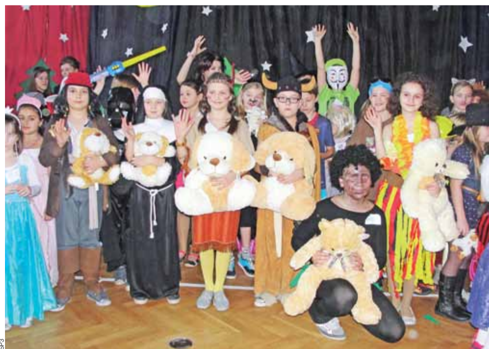
Wielu uczniów zespołu szkół na Korabce przyszło na bal w przebraniach. Uczniów najlepiej przebranych nagrodzono pluszakami. sp3