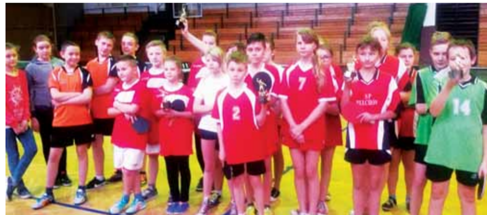
Najlepsi tenisistki stołowe powiatu łowickiego.

Puchar za trzecie miejsce wywalczyły zawodniczki ze Szkoły Podstawowej w Sobocie (nauczyciel w-f Wojciech Szczesniak). W składzie zwycięskiej ekipy SP Bobrowniki, któ-