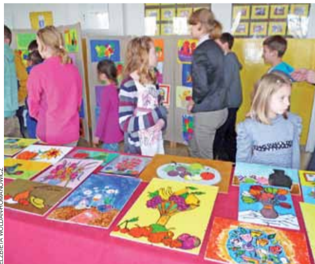
Na szkle malowane 2014. W ubiegłym roku tematem konkursu była martwa natura.