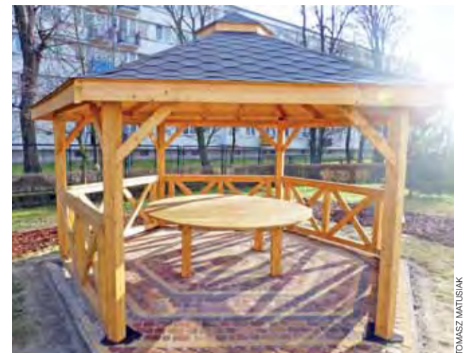
Altana w ogródku dydaktycznym Przedszkola nr 2 w Łowiczu.

Projekt parku nawiązuje do jego przedwojennego wyglądu. Współczesny przygotowała architekt krajobrazu Magdalena Lisowska. O tym, jak park ma wyglądać, pisaliśmy już w NŁ. Przypomnijmy, że do parku prowadzić mają bramy, a całość ma być otoczona żywopłotem, powstaną ścieżki spacerowe tworzące okrąg i linie przecinające go na osi południe-północ. Zamontowane będą stylowe lampy. W centralnym miejscu powstanie plac, całość zostanie uzupełniona o rabaty kwiatowe, które mają ożywić przestrzeń. mak