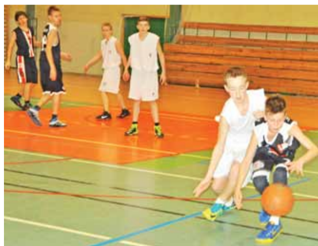
Młodzicy dostali lekcję basketu od ŁKS-u

W drugim meczu fazy finałowej nasi młodzicy zagrają jutro (28 stycznia) w Piotrkowie Trybunalskim z 4. w tabeli Piotrcovia.