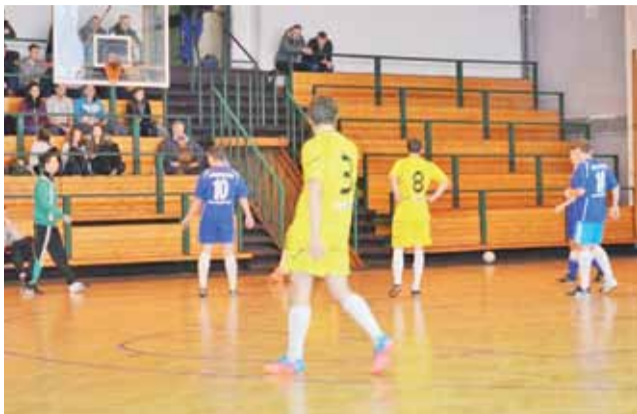
Laktoza sprawiła sporą niespodziankę remisując z faworyzowaną Korabką.