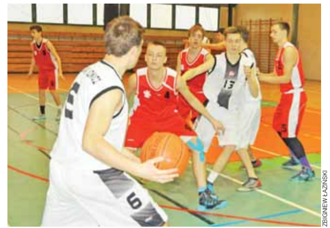
Juniorzy, mimo osłabień, powalczyli z liderem z Łodzi.