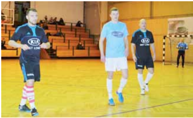
Gracze Drużyny KIA pokonali Zatorze 2:1, strzelając gola na 27 sekund przed końcem meczu.

Nie było niespodzianki w meczu innego kandydata do tytułu –