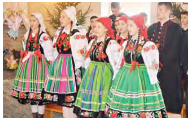
Blichowiacy zapewnił wyjątkową oprawę mszy świętej w kaplicy w Chąśnie przy remizie.

Galeria zdjęć do obejrzenia na www.lowiczanie.info. mak