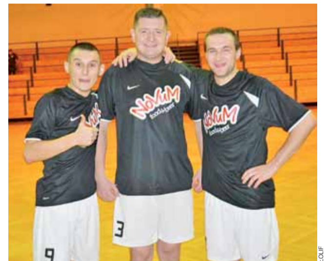
Zawodnicy Pędzących Imadła byli w dobrych humorach po meczu z Gutenowem.