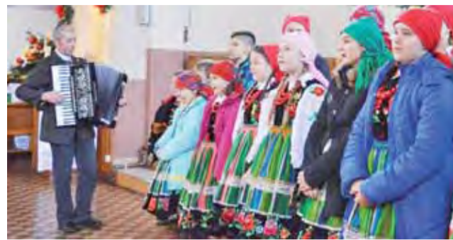
Zespół Krzewina występujący w kościele w Bobrownikach, zaśpiewał kolędy i pastorałki w czasie jednej z mszy świętych.

Były to dobrze znane kolędy, m.in. „Cicha noc”, „Przybieżeli do Betlejem” oraz „Gore gwiazda Jezusowi” czy „Idzie wiarus stary”. – Chcieliśmy wystąpić w kościele, aby dzieci mogli zobaczyć nie tylko rodzice, ale też parafianie, pomysł się sprawdził,