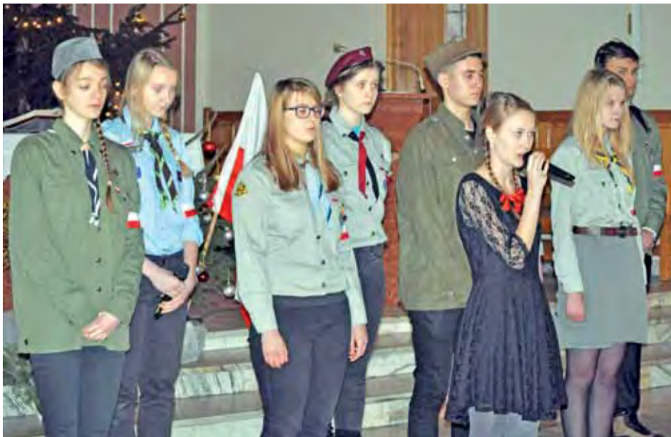
Uczniowie szkół pijarskich wystąpili z białoczerwonymi opaskami na ramionach.

Uczniowie śpiewali piosenki o powstaniu, recytowali wiersze oraz opowiadali o życiu podczas powstania i bohaterskiej postawie dzieci. Każdy z uczniów, prócz śpiewających solistów, miał białoczerwoną opaskę na ramieniu, ubrani byli w stroje przypominające harcerskie. Na ścianie po lewej stronie ołtarza wyświetlane były archiwalne, czarno-białe slajdy z powstania.