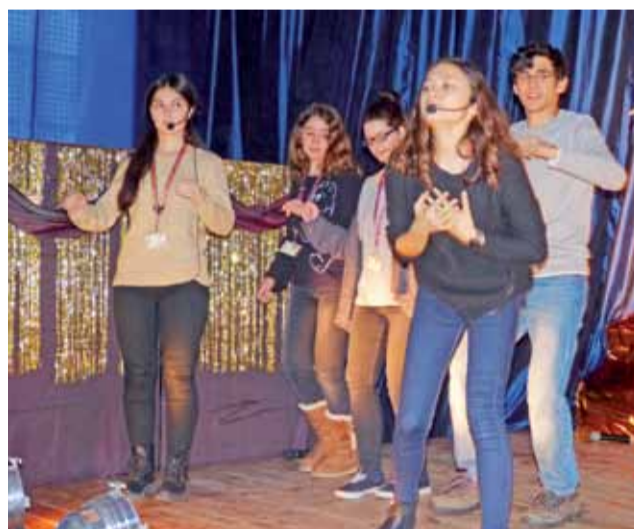
Młodzież z Turcji podczas próby swojej części musicalu „Wśród przyjaciół” tańczyła na scenie Gimnazjum nr 2.

W poniedziałek wieczorem, w szkole przy ul. Mickiewicza, każdy z zagranicznych uczniów przedstawił się i przywitał z osobą, u której będzie mieszkał. Powitania były wylewne i spontaniczne, ponieważ młodzi ludzie znają się z wcześniejszych wyjazdów. Łowiccy uczniowie wręczyli gościom identyfikatory, a od dyrekcji szkoły każdy z gości otrzymał upominek, na który składały się łowickie lalki, cukierki krówki łowickie oraz inne gadżety reklamowe.