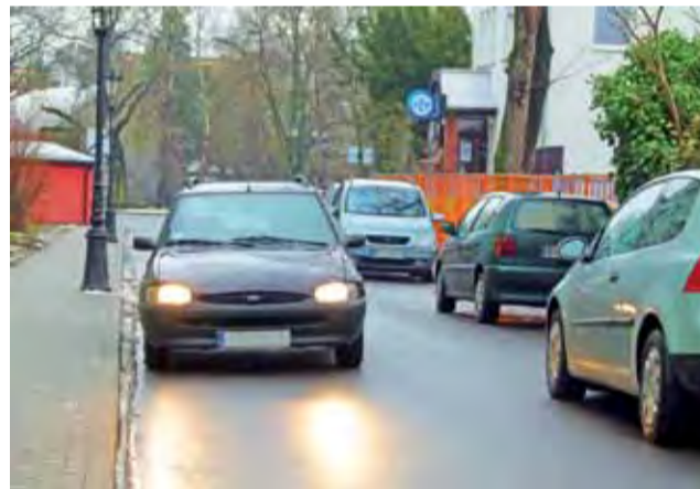
Ulica Ciemna jest zbyt wąska by minęły się na niej dwa samochody jeśli wzdłuż ogrodzenia placu zabaw parkują inne samochody.