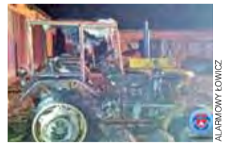
Z Ursusa C-330 niewiele zostało.

Straż pożarna otrzymała zgłoszenie o pożarze w gospodarstwie kilka minut po godzinie