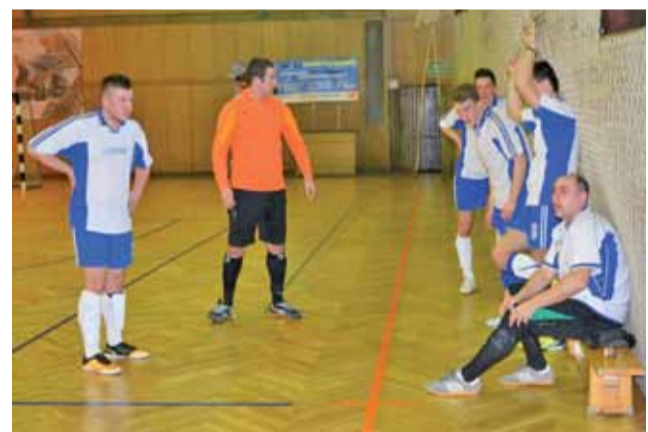
Gracze Zatorza III nie utrzymali prowadzenia i przegrali z Dąbro Łowicz.

W 9. kolejce, niedzielę 1 lutego zagrają: Bezbłędni – KS Ostrowiec (12:00), Ha Ha Ha – Chińska II (12:30), Szkiełka-Akacja (13:00), Bang Bang – Stefan (13:30), Zatorze III – FC CzaQu (14:00), Toreliusz – Orły (14:30), Bezedura – Dąbro (15:00).