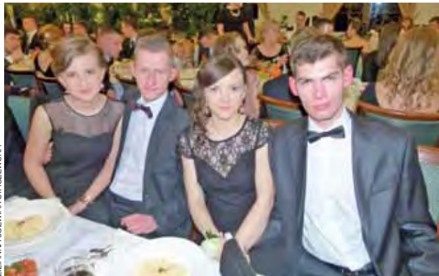
Studniówka ZSP nr 4 odbywała się w Dworze Soplicowo.

Zapraszamy do obejrzenia galerii zdjęć z tej i innych studniówek na naszym portalu Lowiczanie.info .