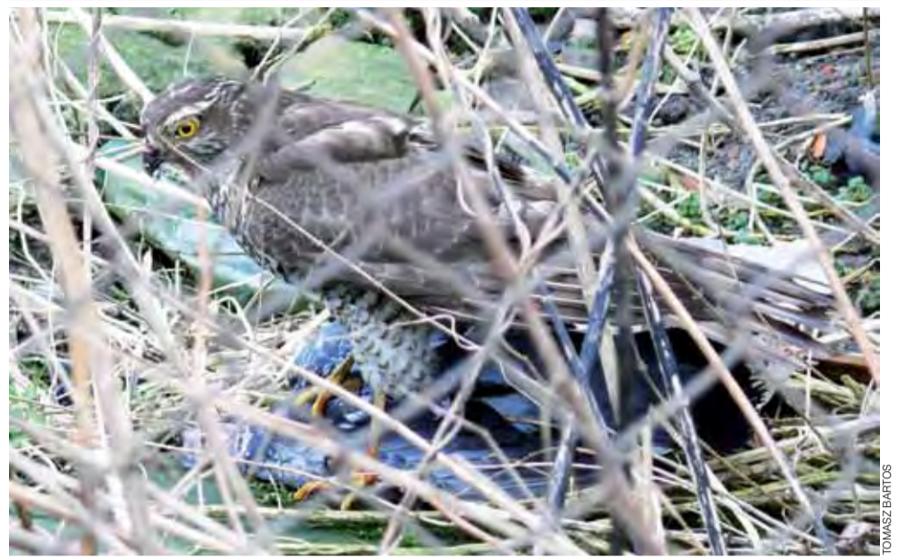
Samica krogulca widoczna na zdjęciu została przez nas sfotografowana na tyłach jednej z kamienic przy ul. 11 listopada (od strony ul. Wegnera). Drapieżnik, gdy został przez nas zauważony, właśnie obskubywał swoją ofiarę – gołębia. Skubiąc cały czas na nas patrzył, próbował uciec, ale nie chciał pozostawić swojej ofiary, a niestety z nią w szponach nie był w stanie się unieść. Po chwili pozostawiliśmy go, aby w spokoju dokończył posiłek. Krogulec to bliski kuzyn jastrzębia, obok sokoła pustułka jest on dość często spotykany w miastach, zwłaszcza zimą. tb

RZUT OKIEM | POLUJĄCY KROGULEC W CENTRUM MIASTA