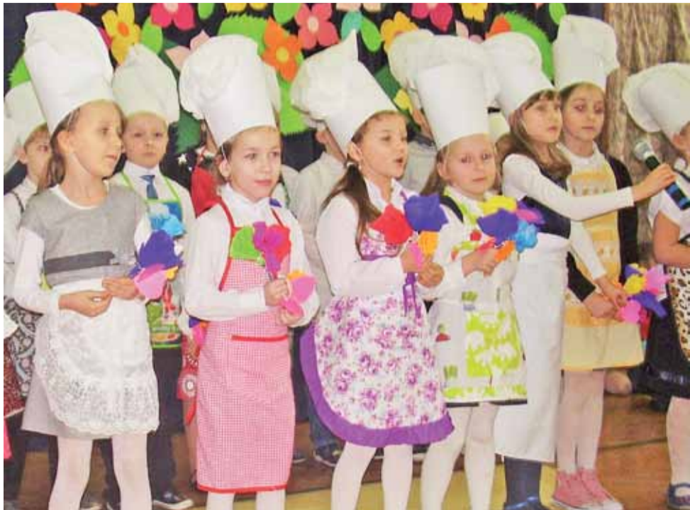
Dzieci śpiewały i recytowały. Zadbaly również o swój sceniczny image. Na zdjęciu grupa dzieci z klasy Ib.