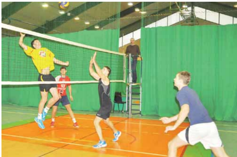
Ekipa Karasuno pokonała Rawkę Bolimów 3:1