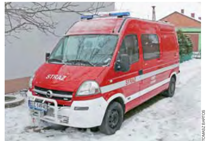
Nowy samochód strażaków z Zawad – Opel Movero zastąpi prawie 20-letniego Żuka.

Ratusz zarezerwował w budżecie 4,6 mln. zł na przeprowadzenie prac, kolejne 3 mln. zł to pieniądze pochodzące z dotacji na budowę drogi z programu Przebudowy Dróg Lokalnych. Do inwestycji kwotą 200 tys. zł dołożył się powiat łowicki. Ratusz planuje wystąpić o wsparcie inwestycji w jej części obejmującej budowę kanalizacji sanitarnej do Wojewódzkiego Funduszu Ochrony Środowiska w Łodzi. tb