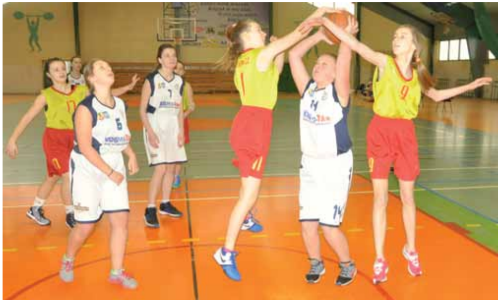
Młodziczki Księżaka wygrały po dobrym meczu z liderem z Sieradza.

Koszykówka | 9. kolejka Wojewódzkiej Ligi U-14 – grupa B