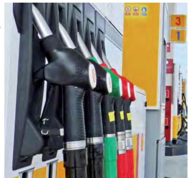
Klienci stacji benzynowych chwytają po nalewak do paliwa, nie zawsze za nie płacąc.

KPP w Łowiczu, w którego rejonie działania są z kolei stacje benzynowe BP przy MOP Parma/Polesie, w ubiegłym roku prowadziła 4 postępowania w sprawie kradzieży paliwa, które zostały zakwalifikowane jako przestępstwa. W jednym przypadku postępowanie jest nadal prowadzone, a w pozostałych zostały umorzone ze względu na niewykrycie sprawcy. Znacznie więcej, bo aż 90 przyjętych zawiadomień o kradzieży pali-