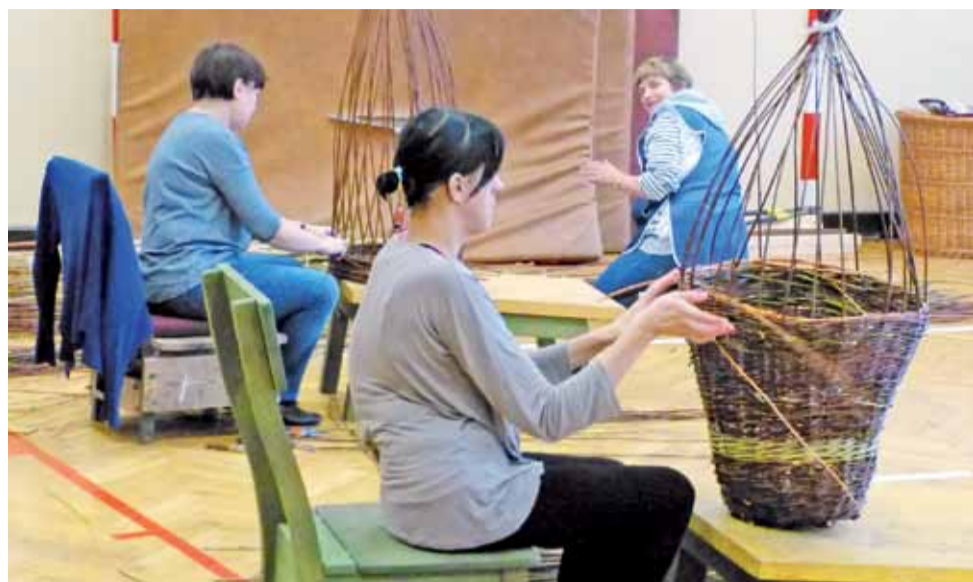
Podczas ostatnich zajęć uczestnicy kursu uczyli się wyrobu dużych koszyków.

Naukę plecionkarstwa uczestnicy kursu rozpoczęli od wykonania osłonek na doniczki. Do tej pory nauczyli się też wyrabiać małe kosze do ziemniaków, kosze na grzyby, a także rzeczy gabarytowe, takie jak kosze na bieliznę. Na kolejnych zajęciach poznają techniki wyrobu mebli i form ogrodowych. Większość opiera się na rzemiośle ręcznym, ale są też wspomagające pracę maszyny, służące na przykład do obrób-