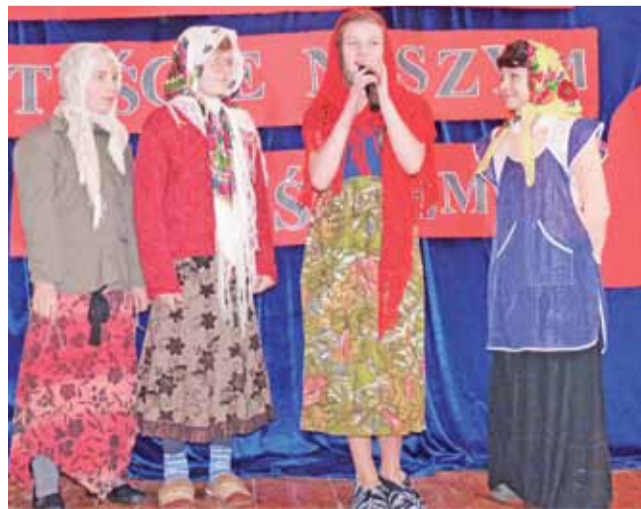
Dzień Babci i Dziadka w wykonaniu uczniów szkoły podstawowej.

– tak brzmiało hasło imprezy zorganizowanej 20 stycznia w grupie III Przedszkola Słoneczko z okazji Dnia Babci i Dziadka. Przedszkolaki najpierw zaśpiewały kilka piosenek i zaprezentowały się przed seniorami. Późniejsza zabawa była wyśmienita. Nie zabrakło skocznej muzyki, słodkiego poczęstunku oraz własnoręcznie wykonanych dyplomów. mak