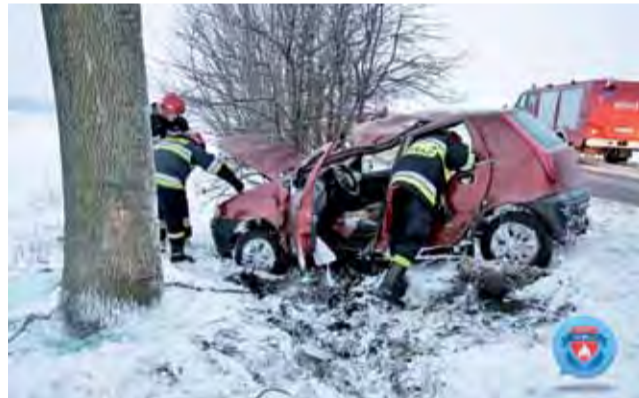
Zdarzenie wyglądało bardzo groźnie , samochód był poważnie zniszczony, ale kierowca i pasażerowie wyszli z niego bez większego szwanku.

Uczestnicy wypadku opuścili samochód o własnych siłach, ale ratownicy Zespołu Ratownictwa Medycznego postanowili dwie osoby w wieku 18 lat