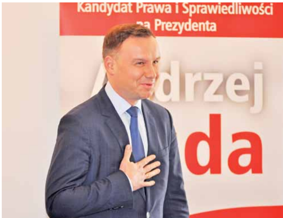
Andrzej Duda został ciepło przyjęty na spotkaniu w Łowiczu.

– Spotkanie zostało zorganizowane „na szybko”, z około tygodniowym wyprzedzeniem, dlatego wybraliśmy niedużą salę – powiedział nam szef powiatow-