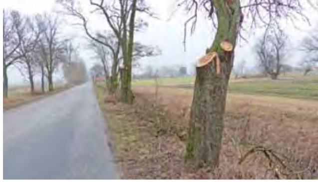
Przy drodze Zduny – Złaków pozostały gałęzie po przycince drzew. Dyrektor PZDiT w Łowiczu deklaruje, że na pewno zostaną one wkrótce sprzątnięte.

Jak dowiedzieliśmy się w Powiatowym Zarządzie Dróg