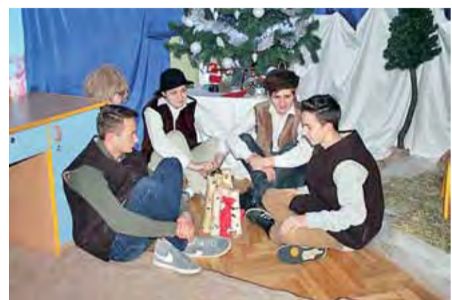
Uczniowie „Ekonomika” jako pasterze podczas występu dla przedszkolaków.

Zapraszamy do obejrzenia galerii zdjęć z otwarcia wystawy oraz relacji filmowej na stronie www.lowiczanie.info mak