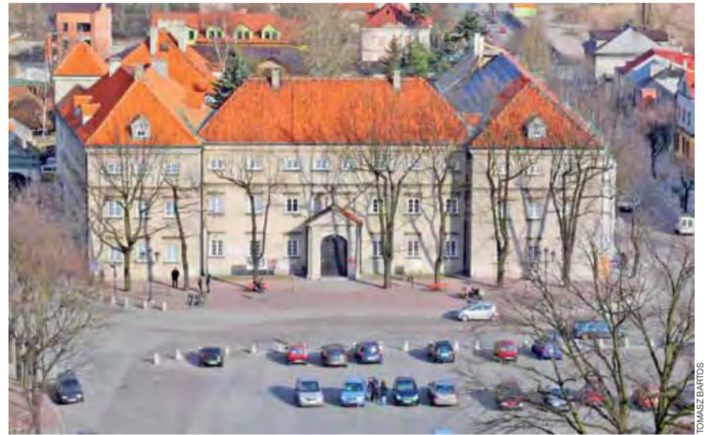
Fragment Starego Rynku widziany z wieży katedry. Pewne jest jedno w przyszłości zniknąć mają z niego parkujące samochody.

Zwrócił też uwagę, że w budżecie gminy nie zostały uwzględnione wydatki na przyłącza odbiorców do kanalizacji sanitarnej. Gmina będzie składała wniosek do Wojewódzkiego Funduszu Ochrony Środowiska i Gospodarki Wodnej w Łodzi o dotację na ten cel, która wynieść może 50% kosztów, maksymalnie 3 tys. zł do jednego przyłącza. Pozostały jego koszt będą płacić mieszkańcy, przy czym jego wysokość znana będzie dopiero po przeprowadzeniu przetargu. mwk