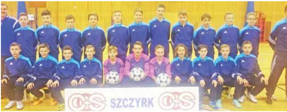
Klasa sportowa na zgrupowaniu w Szczyrku

Piłka nożna | Gimnazjalny Ośrodek Szkolenia Sportowego