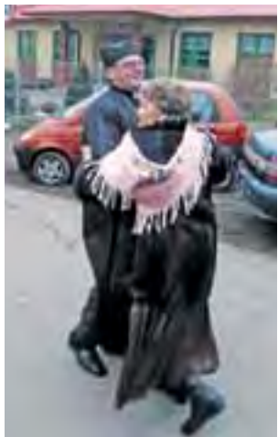
Niektórzy nawet zaczęli tańczyć.