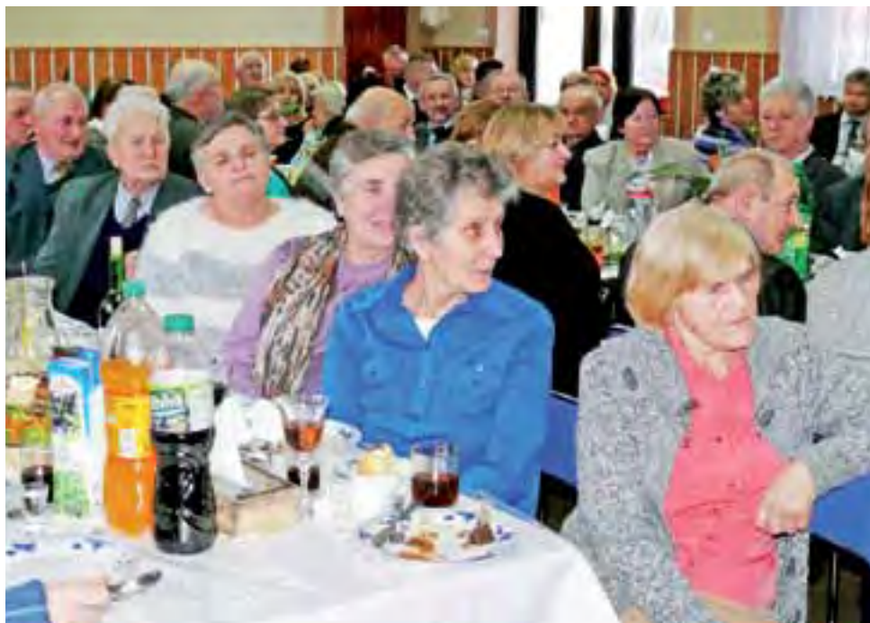
Seniorzy z Bednar Kolonii przysłuchujący się występowi młodzieży z Gimnazjum w Kompinie.

li na spotkanie, dziękowali im za owocne życie.