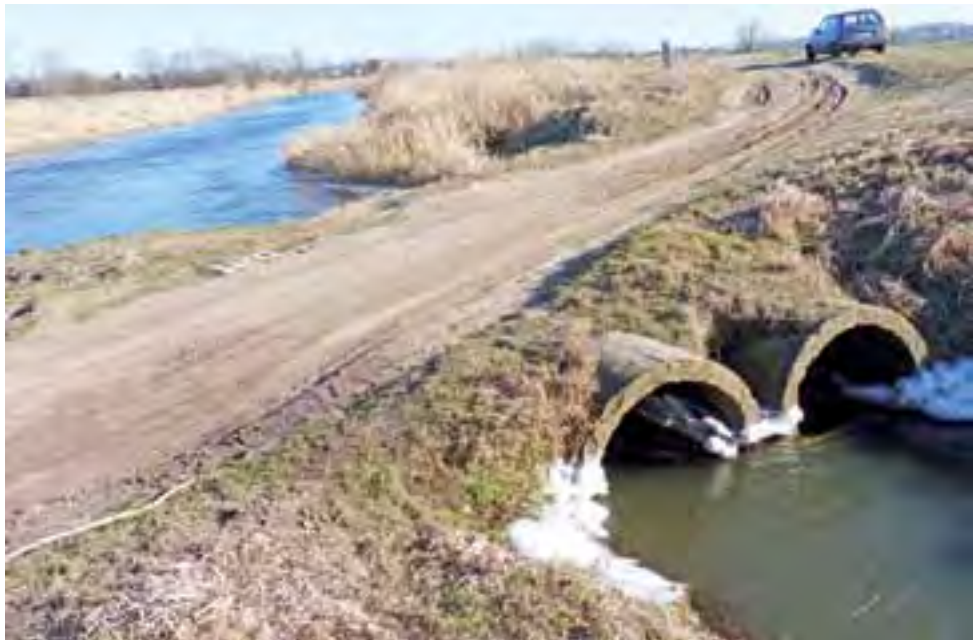
Prowizoryczny mostek na Bobrówce.