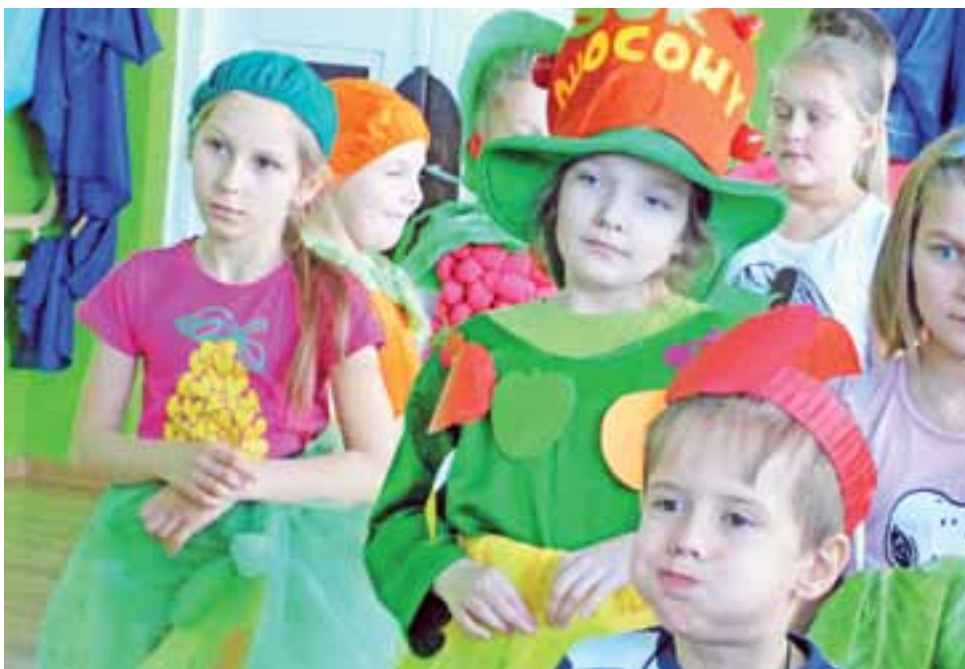
Dzieci z Błędowa przekonują do żywności bogatej w witaminy.

Bal został przygotowany przez szkolne szkoła PCK. Szczególnie zaangażowana była grupa gimnazjalistów z trzecich klas, którzy współorganizowali zdrowe bale od czterech lat, zaczynając jeszcze jako uczniowie podstawówki. tm