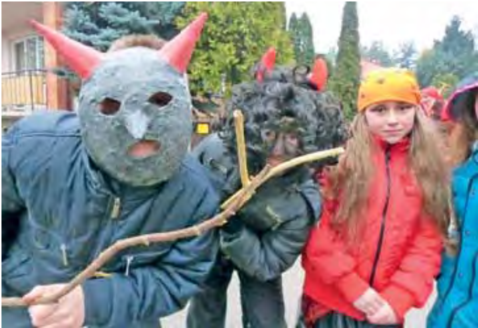
Obiektw naszego aparatu zainteresował miejscowe diabłki.

O cyber-pułapkach w bibliotece, o hafcie w muzeum. str. 23 i 24