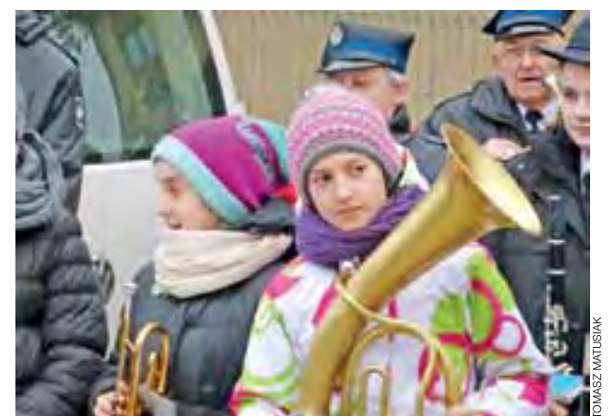
Z bełchowską orkiestrą strażacką gra też młodzież.