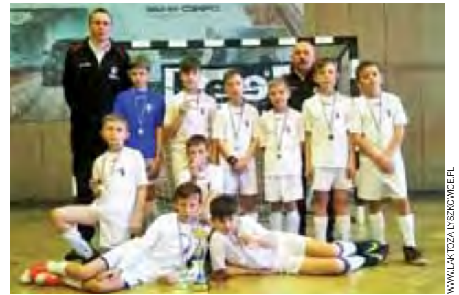
Ekipa Laktozy 2004 okazała się najlepsza na turnieju Laktoza CUP,