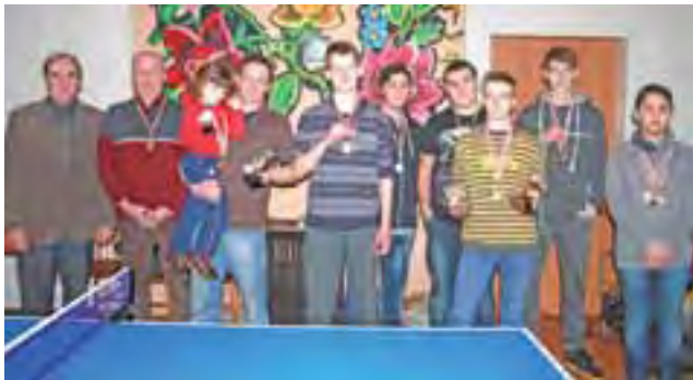
Uczestnicy feryjnego turnieju w Jackowicach.

W kategorii seniorów we wszystkich trzech turniejach bez-