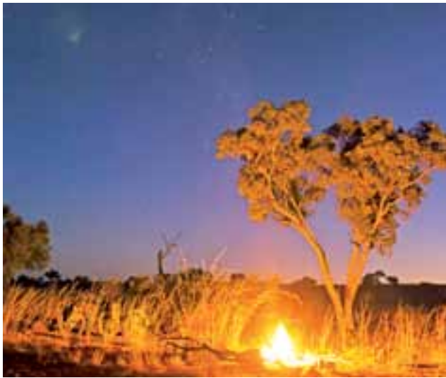
Jak w takie miejsce dojechać rowerem – będzie można dowiedzieć się podczas spotkania z podróżnikami.

Przypomnijmy, że rajd upamiętnia bitwę stoczoną przez oddział powstańców styczniowych pod dowództwem Włodzimierza Strojnowskiego z kozakami w okolicy Mogił. tb