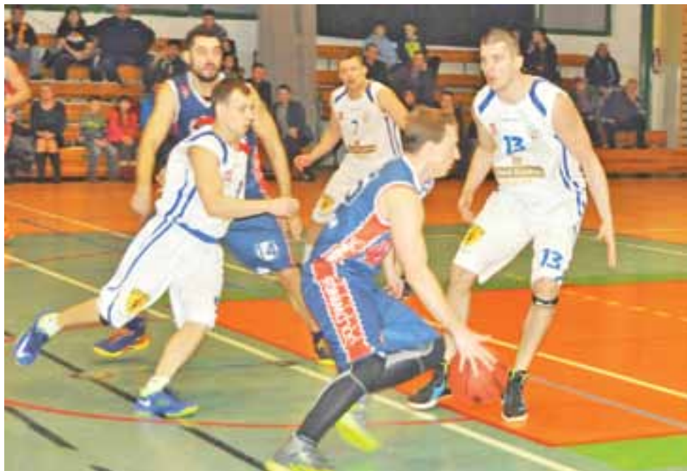
Kluczem do zwycięstwa w meczu z Politechniką Gdańską okazała się dobra obrona.

Świetne wyniki lekoatletów w Warszawie. str. 37