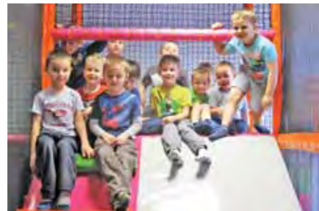
Najmłodszy zawodnicy Akademii Piłkarskiej w sali zabaw.