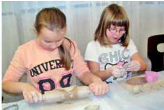
Dziewczynki z Kiernozi lepią małe dzieła sztuki.

niu stworzone wcześniej przedmioty zostały ozdobione farbami podszkliwymi. Wykonane prace dwukrotnie wypalono w piecu ceramicznym. Po wystawie, którą obecnie można oglądać w GOK, wykonawcy będą mogli zabrać swoje dzieło do domu. mm