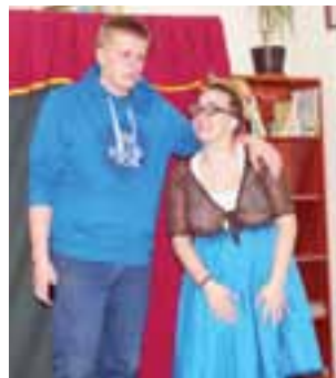
Marika z Maksymem nie mieli wspólnych tematów do rozmowy.

– Ja nie siedzę dużo przy komputerze, tylko czasami oglądam bajki – powiedziała nam 8-letnia