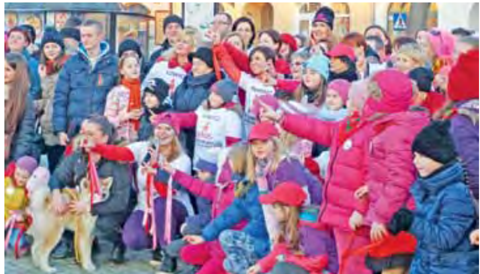
Gestem łączącym uczestników akcji „One Billion Rising”, był wzniesiony do góry wskazujący palec.

Akcję wsparło kilka lokalnych instytucji i organizacji. Byli przedstawiciele Stowarzyszenia Zespół Integryjny „Furkotki”, Klubu Amazonki, Europejskiej Unii Ko-