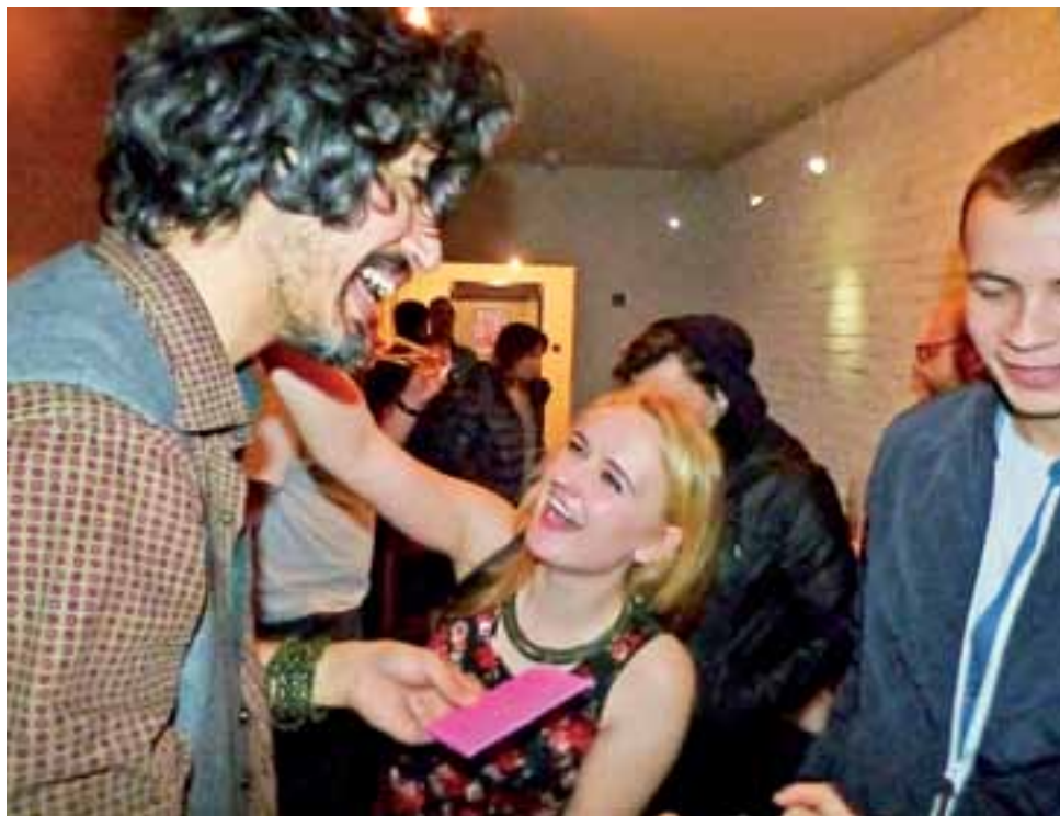
Po koncercie muzyk chętnie rozmawiał ze słuchaczami i rozdawał im autografy.

15 lutego okazał się w tym roku datą pechową dla Łowickiego Ośrodka Kultury. Naj-