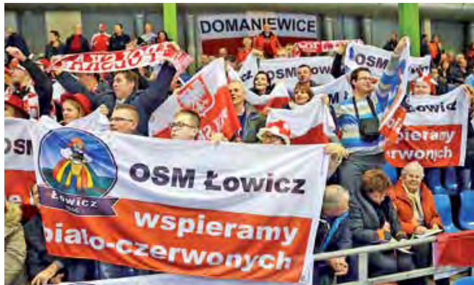
Polska, Domaniewice, OSM Łowicz - takie napisy widoczne były podczas zawodów w Heerenveen.

Łyżwiarstwo szybkie | Mistrzostwa Świata w Heerenveen