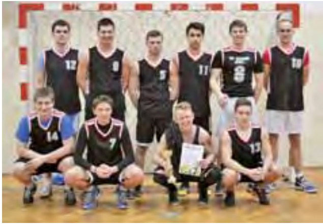
Wśród mężczyzn najlepiej spisała się ekipa Nieprzećiętni.

– Zacytuję cytat z filmu „Glory Road”: Czy rozumiesz, jakie to