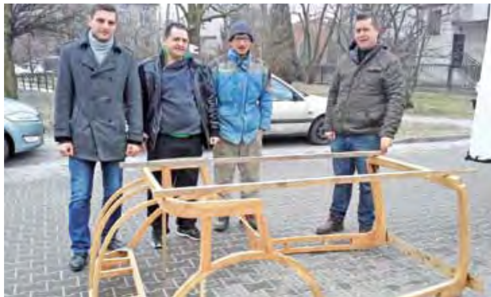
Członkowie Stowarzyszenia Historycznego im. 10 Pułku Piechoty przed drewnianym stelażem odbudowywanego przez nich łazika.

Każdy może pomóc w odbudowie łazika. Wystarczy wpłacić