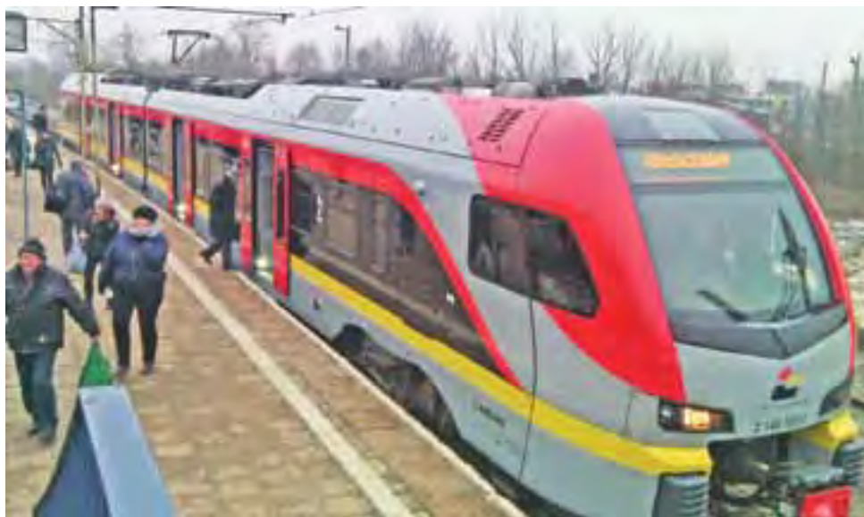
Dworzec Łowicz Główny. Łódzka Kolej Aglomeracyjna.

Ponad to atrakcyjne ceny biletów to nie do końca nowość. Podobne ulgi oferowały Przewozy Regionalne w ramach oferty „Połączenie w dobrej cenie”.