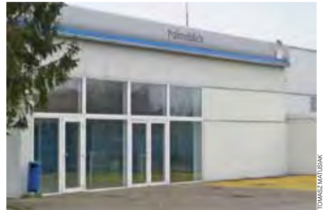
Czy to koniec Polmoblichu, czy tylko zmiana w jego działaniu? Przedstawiciel spółki w rozmowie z nami niczego nie wykluczył.

Działka po salonie została sprzedana w prywatne ręce. Nowa