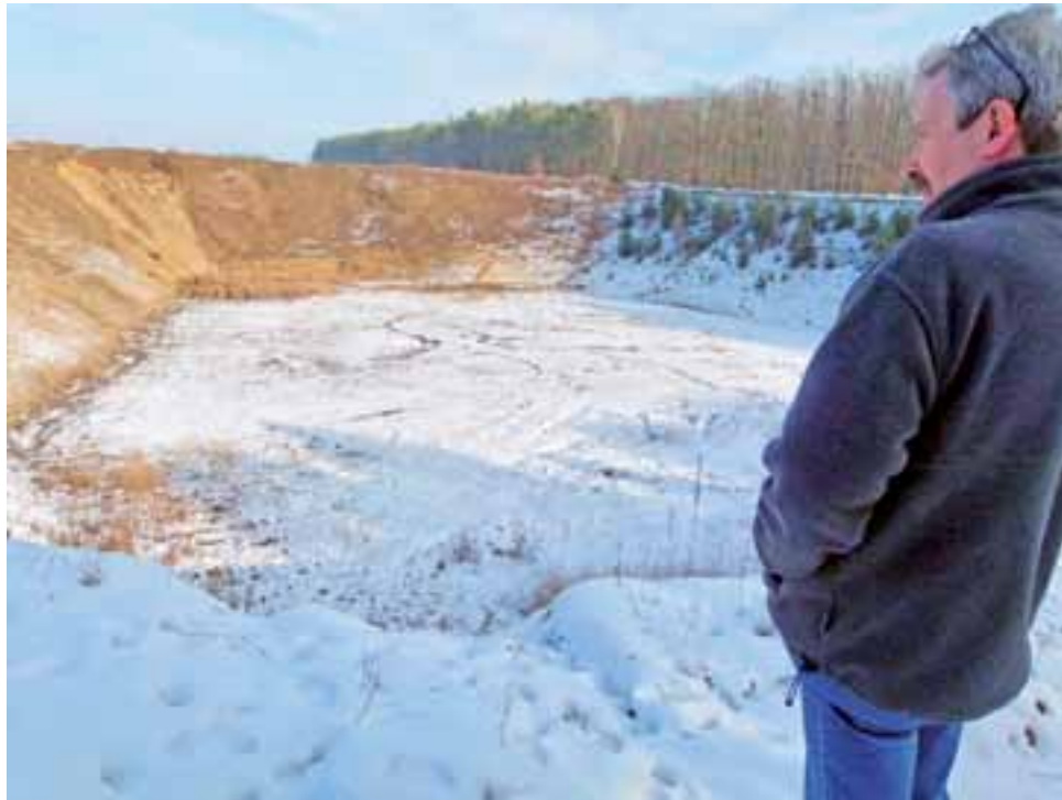
Wyrobisko po złożu Barcik Nowy III mogłoby przyjąć kilkadziesiąt metrów sześciennych odpadów.

Miejsce, w którym miałyby zostać zlokalizowane składowisko, znajduje się na terenie kopalni żwiru Barcik Nowy III, tuż przy asfaltowej drodze prowadzącej do Barcika. Jest to głębokie na kilkanaście metrów zadole nie o stromo opadających w dół zboczach. Powierzchnia wyrobiska wynosi ponad 8,5 tysiąca m 2 . Według dokumentacji kwarta pomieścić może nawet około 62 tys. m 3 odpadów.