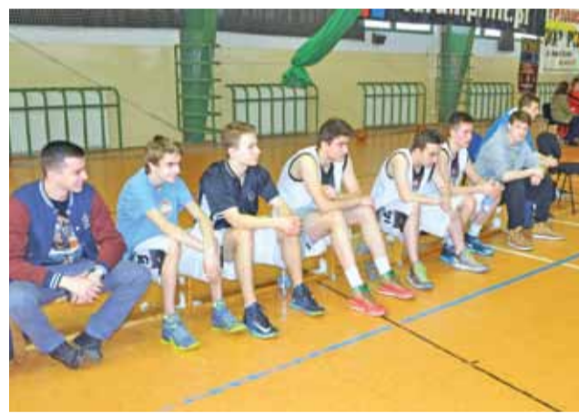
Juniorzy w tym sezonie nie mieli powodów do radości.

W ostatnim meczu nasi juniorzy zmierzyli się z Piotrcovią w ich hali. Do przerwy nasz zespół grał ambitnie i przegrywał tylko 29:32. Jednak po zmianie stron łowiczanie mieli przestój w trzeciej odsłonie, którą przegrali