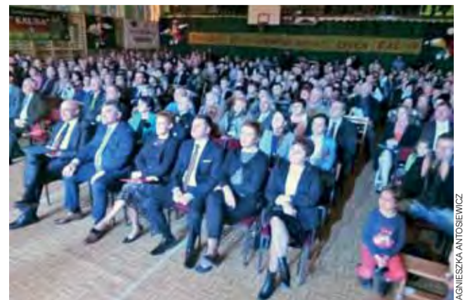
25-lecie zespołu zgromadziło w sali kilkaset osób.

Domaniewice | 25-lecie Zespołu Pieśni i Tańca „Kalina”