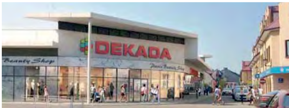
Wizualizacja budynku planowanej galerii, widok od ul. Podrzecznej. Po prawej istniejące budynki.

To drugie już podejście do próby zmiany planu zagospodarowania przestrzennego w tym miejscu na wniosek właściciela terenu i potencjalnego inwestora. Dodajmy, że inwestor nie stara się o dopuszczenie możliwości wybudowania w tym miejscu galerii handlowej z pomieszczeniami pod wynajem – bo taką możliwość już ma – ale o zmniejszenie liczby kondygnacji planowanego budynku. Obecnie obowiązuje plan pozwalający na wybudowanie w tym miejscu budowli