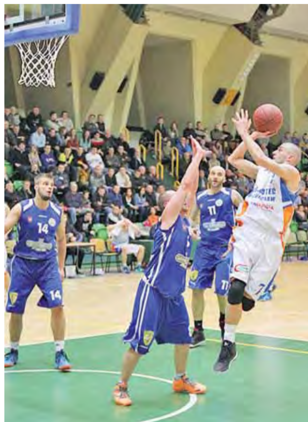
Dobra obrona w meczu z liderem z Inowrocławia była kluczem do zwycięstwa.