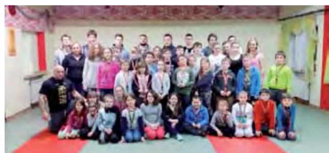
Kolektywne zdjęcie zespołu judo z Łowicza z zaprzyjaźnioną grupą łódzkich judoków.