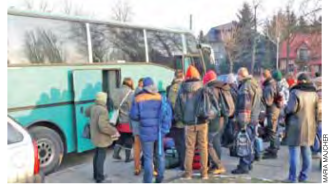
Wychowankowie SOS-W w Łowiczu wsiadają do autokaru, który zawiezie ich na kurs komputerowy do Spały.

Oplata za wprowadzenie psa na teren ogrodów – 8 zł (w ramach opłaty właściciel otrzymuje szufelkę i torebkę na nieczystości). tb