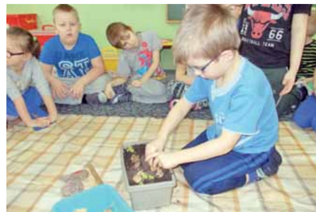
Przedszkolakom najbardziej podobała się praktyczna część zajęć, kiedy np. sadzili pietruszkę.