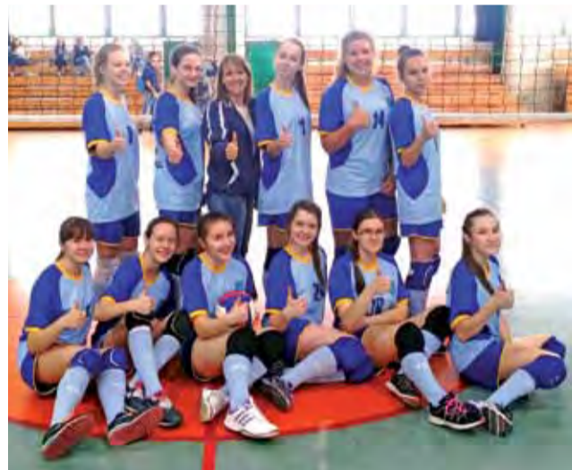
Dziewczyny z Pijarskiej po raz pierwszy wygrały mistrzostwa Łowicza.