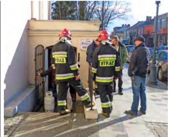
Okazało się że zapach pochodził z lokalu w piwnicy, a nie z biblioteki.

Nie może też doczekać się uprawomocnienia się wyroku i zapowiada, że sprawa będzie miała ciąg dalszy. – Mam zamiar na podstawie poniesionych wszelkich krzywd i strat dochodzić swoich praw, czyli zadośćuczynienia przed sądem – deklaruje. mak