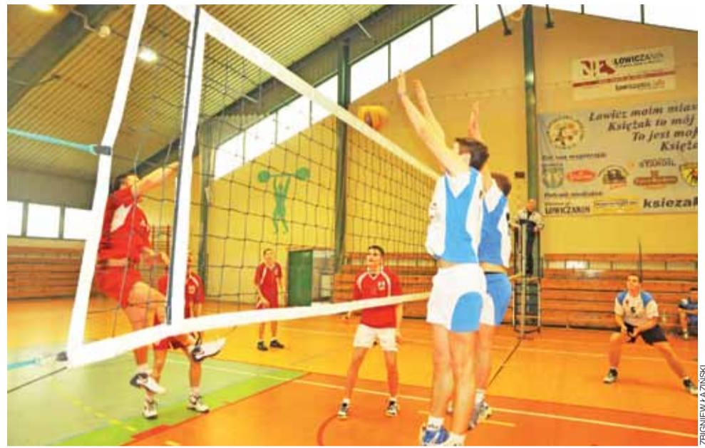
W ostatniej kolejce AMŁ LKS Retki pokonał 3:2 UKS Bzura Sobota.