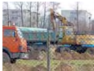
Plac budowy nowej Biedronki.

2 marca rozpoczęły się prace nad kolejnym, czwartym już w Łowiczu marketem sieci Biedronka. Powstanie on przy ulicy Powstańców 1863 r., w miejscu, gdzie dawniej mieścił się zakład firmy Kodan.