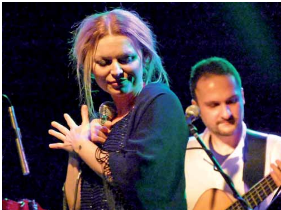
Anna Maria Jopek dała koncert bardzo różnorodnej muzyki – jak sama określiła „od Sasa do lasa”. Dużo improwizowała, a na sobie miała haftowaną łowicką chustę, którą dostała w Łowiczu po poprzednim występie.

Rekordowa była nie tylko widownia, ale też ilość sprzedanych karnetów – 95.