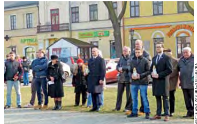
Przed pomnikiem Synów Ziemi Łowickiej zgromadziła się grupa łowiczanie w różnych wiekach, którzy chcieli oddać hołd Żołnierzy Wyklętych.