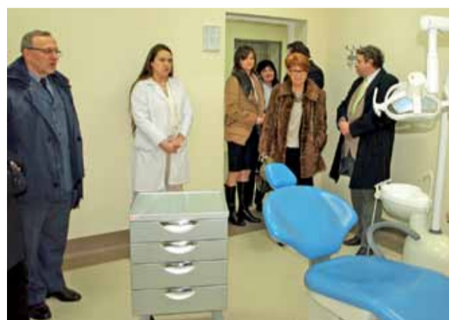
Otwarcie ambulatorium. Na pierwszy rzut oka nie widać, że to pomieszczenie więzienne.

tym kompleksie o powierzchni 300 m 2 . Są to trzy zupełnie nowe izby chorych, w których można umieścić osiem osób jednocześnie. Są też dwa gabinety lekarskie, gabinet stomatologiczny, gabinet do zabiegów specjalistycznych, magazyn leków, dwie poczekalnie, dyżurka oddziałowa z sanitariatem, toalety i cztery pomieszczenia gospodarcze.