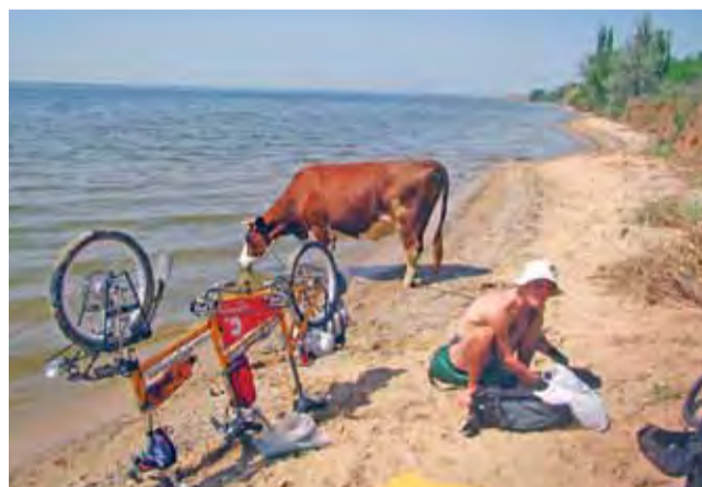
Chwila wytchnienia w podróży na południe. Upał męczył i ludzi, i spotykane w drodze zwierzęta.

Mieliście kiedyś okazję przejechać się na tandemie? A gdyby tak na tandemie ruszyć w dalszą podróż? Za miasto, za granicę, poza europejski kontynent? Gdyby na tandemie skierować się na wschód, a za cel obrać sobie odległy o (bagatela!) 22 000 km Singapur? To co? Myślicie, że by się udało?