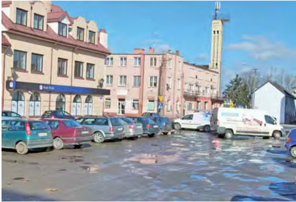
W miejscu, gdzie może stanąć Galeria Dekada, obecnie jest błotnisty parking.