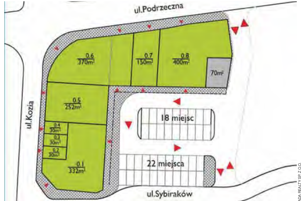
Plan sytuacyjny miejsca, w którym może powstać Galeria Dekada.

Łowicz | Galeria handlowa zamiast błotnistej parkingu?