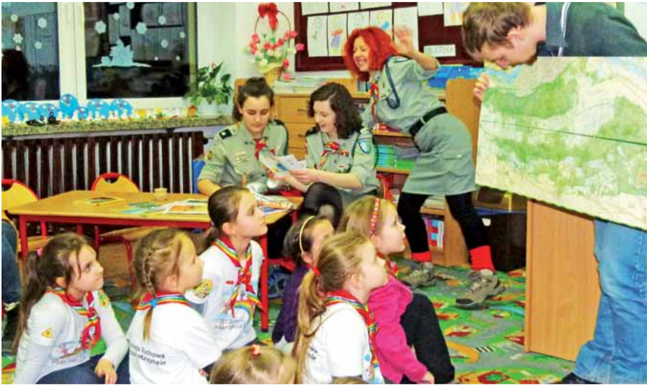
Zuchy uczyły się m.in. korzystania z kompasów i określania kierunków na mapie.

Bednary | Biwak szczeru „BLIH” z okazji Dnia Myśli Braterskiej