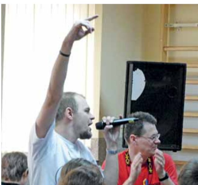
Członkowie radomskiej Szkoły Nowej Ewangelizacji podczas „Balu świętych”.

– Chcemy przemawiać do młodych ludzi w ich języku – mówił nam przedstawiciel wspólnoty