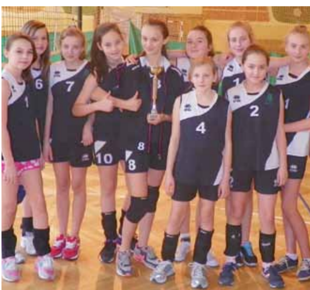
Uczennice z SP Domaniewice obroniły mistrzowski tytuł.