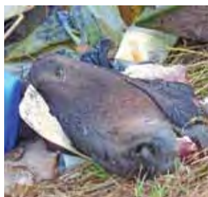
Tak to wyglądało.

Jak się dowiedzieliśmy, informacja o szczątkach zwierząt została przekazana do Urzędu Gminy w Zdunach, Powiatowego Inspektoratu Weterynaryjnego w Łowiczu oraz Komendy Powiatowej Policji w Łowiczu. Weterynaria zawiadomiła o zdarzeniu Inspekcję Ochrony Środowiska w Katowicach oraz zobowiązała władze gminy do podjęcia natychmiastowych działań w celu usu-