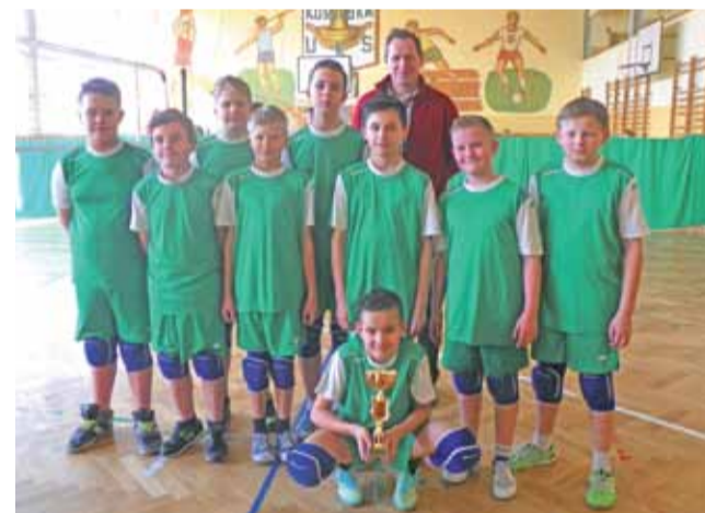
Siatkarze z SP 7 reprezentować będą powiat w zawodach rejonowych.

Po rozegraniu 8 spotkań o mistrzowski tytuł zdecydował mecz finałowy. Okazało się, że w tie-breaku wygrali uczniowie SP 7 w Łowiczu, którzy pokonali ekipę SP Mysłaków (nauczyciel w-f Ewa Patos) 2:1. Warto dodać, że w najważniejszych meczach w zespole Siódemki swoje sety wygrywali uczniowie z klasy piątej, którzy w rywalizacji ze starszymi kolegami poradzili sobie rewelacyjnie. Na trzecim miejscu zawody zakończyli siatkarze z SP Łaguszew (nauczyciel w-f Cezary Dolowicz). Najlepsze zespoły dostały pamiątkowe puchary.