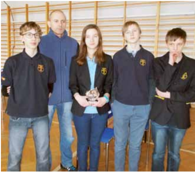
Szachiści z Piąrkowic obronili mistrzowski tytuł.

Maciej Wyszogrodzki nie wyklucza powrotu w barwy Pelikana. str. 37