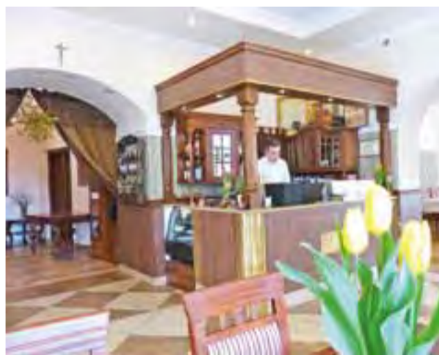
Sala główna, z kontuarem.