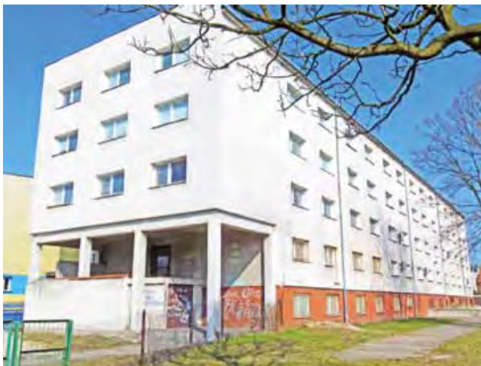
W budynku przy Kaliskiej mieścić się m.in. Sąd Rejonowy oraz hotel i restauracja Zacisze.

Prawnych „Samopomoc Chłopska” w Warszawie) zapłacono 500 tys. zł, w 2015 roku miasto zapłaci 1,5 mln zł, w 2016 i 2017 r. po 700 tys. zł, a w 2018 roku – 600 tys. zł.