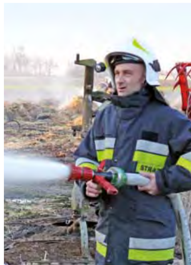
Jeden ze strażaków ochotników polewających tłącą się słomę. W akcji w Świerzyżu stanowili oni zdecydowaną większość.