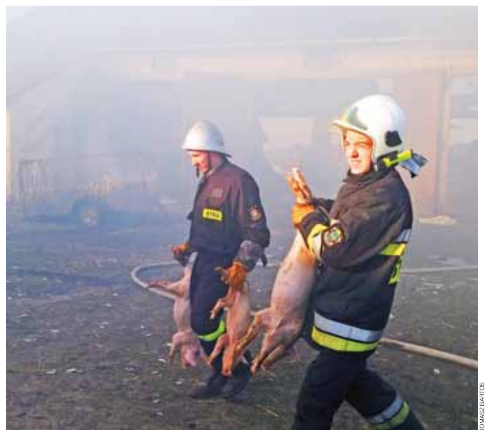
W Świeryżu Pierwszym wybuchł w ubiegłą środę, 18 marca, pożar. Spaliła się część budynku inwentarsko-składowego. Na pomoc właścicielowi ruszyli strażacy i mieszkańcy. Dzięki ich pomocy udało się uratować 200 prosiąt i 10 macior. Niestety, spłonęła część dachu i ponad 100 balotów słomy. Okoliczni rolnicy zaoferowali poszkodowanemu pomoc. Więcej na ten temat – na stronach 24 i 25. tb

RZUT OKIEM | NIE TYLKO STRAŻACY POMAGALI