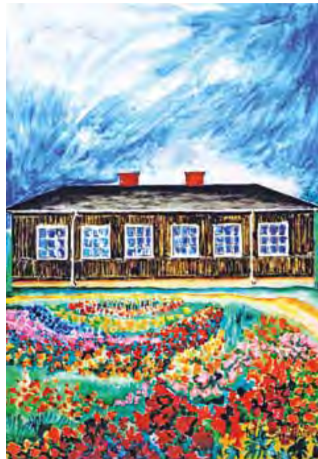
Budynek szkoły w Bednarach wzniesiony w 1934 roku.

Na początku lat trzydziestych ubiegłego wieku mieszkańcy wsi podjęli starania o budowę