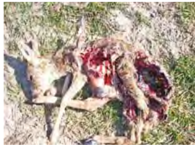
Martwa sarna znaleziona w tym tygodniu na polu pod Retkami.

Sarny mają dwa okresy w roku, gdy są łatwym zdobyczem: w zimie, gdy śnieg zalegający na polach zostanie związany