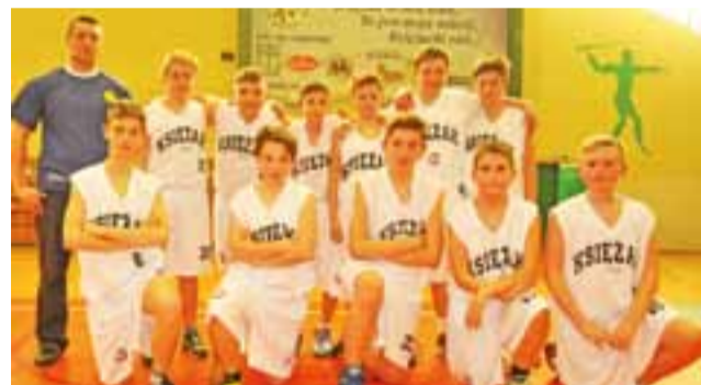
Mimo porażek drugi zespół młodzików nie poddaje się.