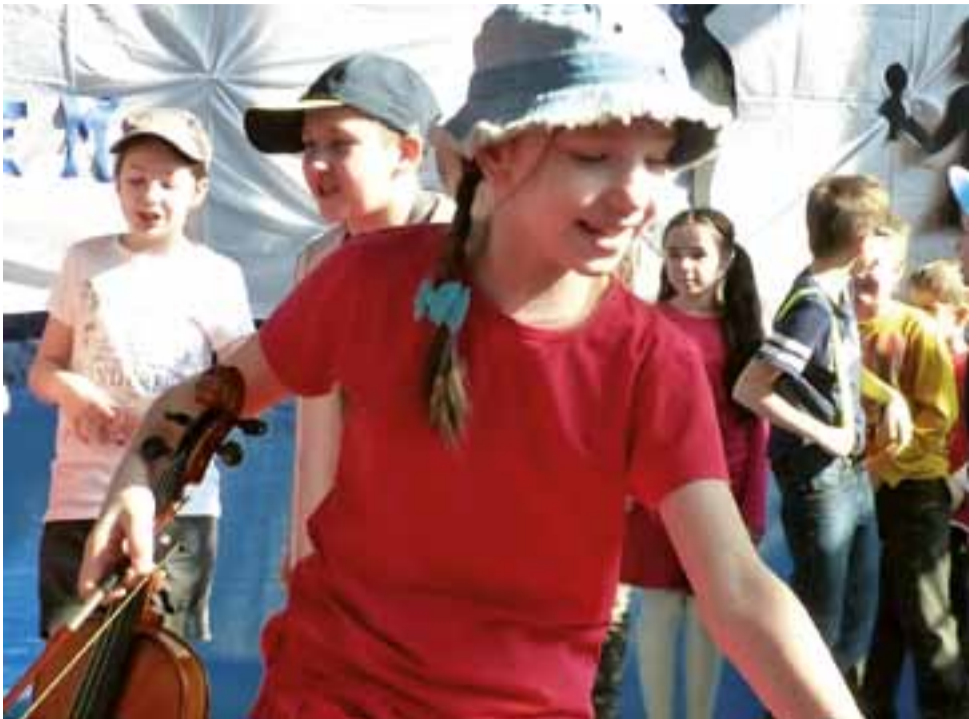
„Ananasy z trzeciej klasy” i szalona „Bałkanica” w ich wykonaniu.