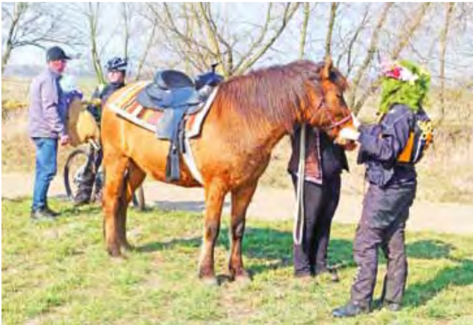
Grupa konna rajdu.