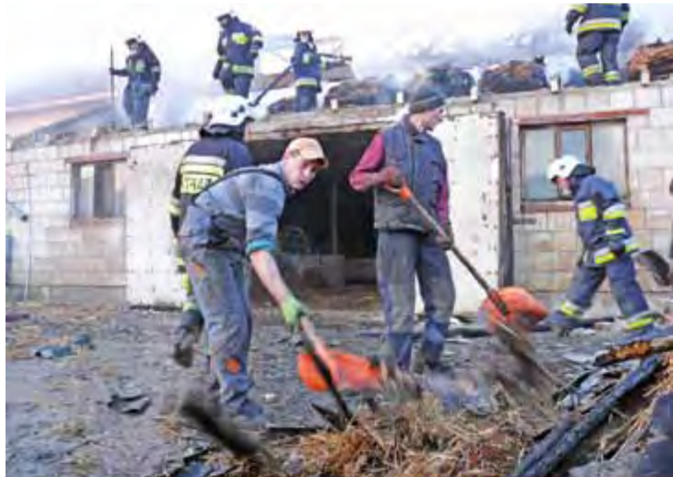
Gdy na dole trwa sprzątkanie, na stropie chlewni strażacy przygotowują się do zrzucania balotów słomy.