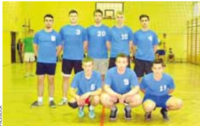
Drużyna Remis Reczyca jak na razie plasuje się na 4. miejscu.