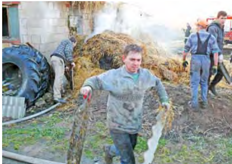
Oprócz strażaków dużą grupę pomagających w akcji gaśniczej stanowili mieszkańcy Świerz.