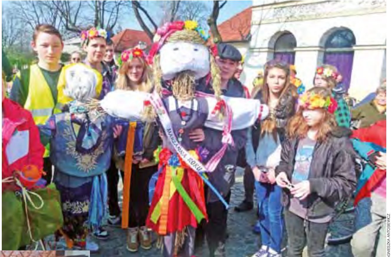
Zwycięska kukielka udekorowana szarfą.

Rajd organizujemy od 2007 roku, ale pierwszy raz udało się utworzyć cztery różne rajdowe grupy.