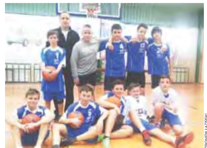
Koszykarze z SP 1 Łowicz zostali mistrzami Łowicza

Najbardziej zacięty był mecz pomiędzy Jedyńką i Czwórką, gdzie po regulaminowym czasie (4x5 minut) był remis 16:16. W dogrywce lepsza okazała się jednak SP 1, wygrywając mecz 20:16. Na turnieju powiatowym