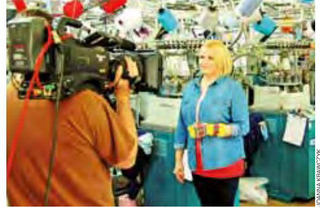
Część zdjęć do programu kręcono na hali produkcyjnej.

Emisja odcinka planowana jest za około dwa miesiące. Prawdopodobnie będzie to dzień 17 maja, ale data ta może jeszcze ulec zmianie. Będziemy informować o dacie i godzinie emisji programu. mak