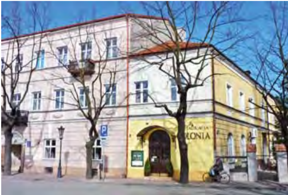
Wejście od strony Starego Rynku nareszcie ożyło – po latach.