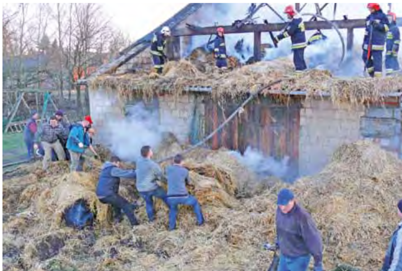
Na pomoc ruszyli sąsiedzi. Spod sterty słomy wyciągają wąż strażacki, aby nie został uszkodzony w czasie odbierania jej przez ładowacze ciągników rolniczych.