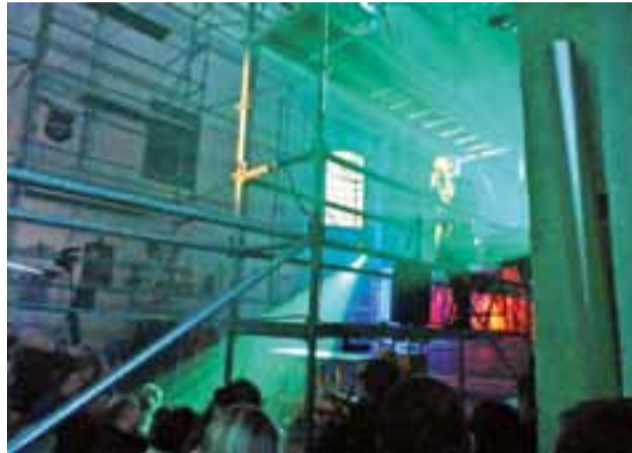
Ważna była nie tylko muzyka i treść pieśni, ale również gra świateł.