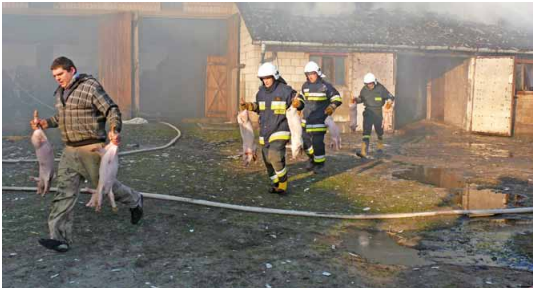
Dzięki strażakom i sąsiadom z chlewni udało się uratować 200 prosiąt, które trzeba było szybko, w kłębach dymu, przenieść do innego pomieszczenia.