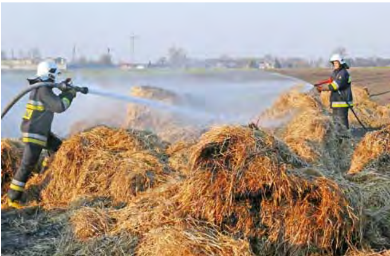
Słoma wywieziona ze stodoły i poddasza chlewni musiała być dokładnie przelana wodą, aby ponownie się nie zapaliła.

Zapotrzebowanie na wodę było tak duże, że strażacy nie mogli polegać na hydrantach, dlatego co chwila samochody musiały jeździć w inne miejsce, aby napełnić zbiorniki.