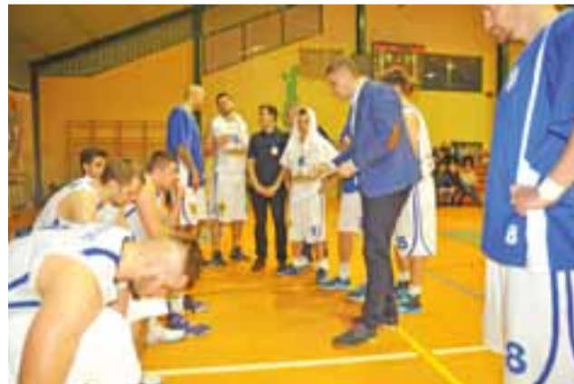
Czy koszykarze Księżaka „wstaną z kolan” w sobotnim meczu w Łowiczu?

W pozostałych spotkaniach 7. kolejki ciekawie może być w Inowrocławiu. Noteć podejmuje Stalmę Lublin i może zrobić kolejny krok do zaplecza ekstraklasy. Nasi rywale w walce o 2. miejsce mają