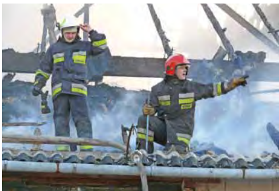
Strażacy w trakcie akcji na poddaszu chlewni, za nimi widać spaloną słomę.