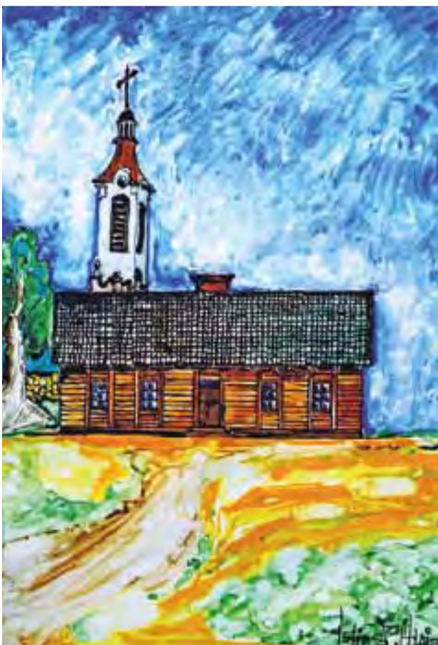
Budynek szkoły w Bednarach pochodzący 1866 roku.