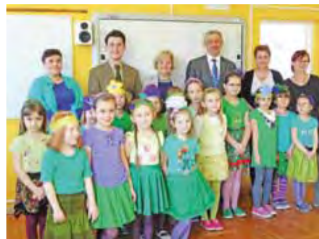
Uczestnicy spotkania w Dzierżgówku z dziećmi, które wystąpiły w przedstawieniu o ochronie przyrody.