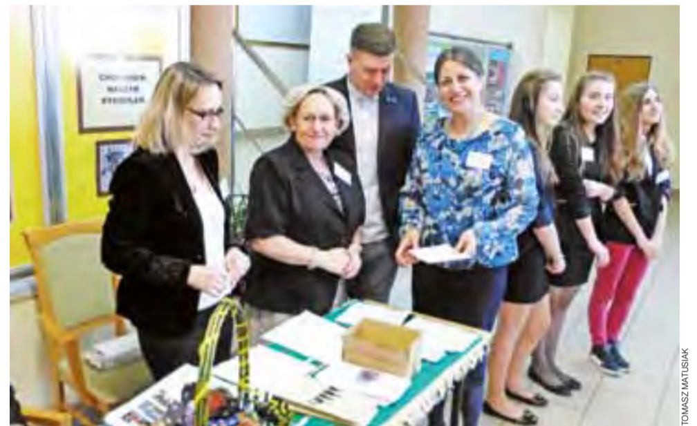
Nauczyciele i uczennice witają gości przy wejściu do szkoły.