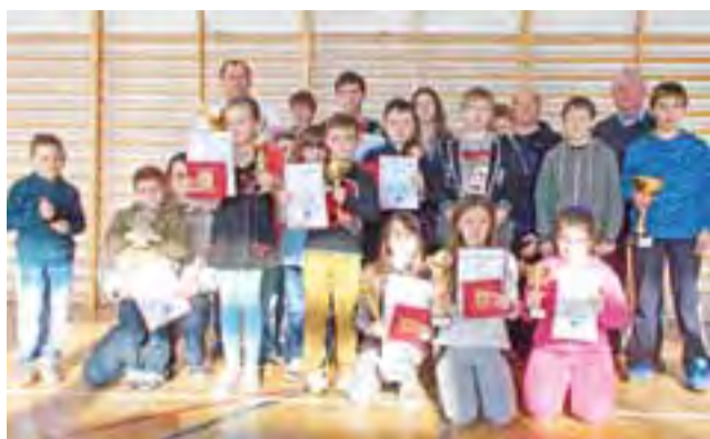
„Szachowa rodzina” po turnieju w Nieborowie.