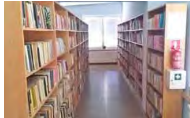
Nowa biblioteka w przededniu otwarcia.

W bibliotece zgromadzonych jest 17 tys. woluminów, część z nich jest dostępna w księgozbiornym podręcznym. Został wydzielony kącik czytelniczy. Funkcjonuje w niej też kawiarenka internetowa z dobrej jako-