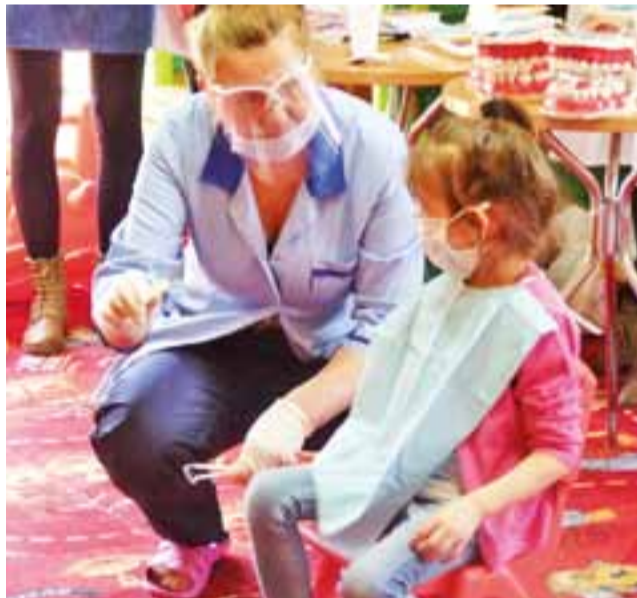
Przyszła higienistka stomatologiczna pokazuje uczniom przedszkola Bajkoland przyrządy stomatologiczne.

Oprócz tego dzieci ćwiczyły na specjalistycznych modelach technikę poprawnego mycia zębów. Na zakończenie uczennice szkoły policealnej poprowadziły krótkie zabawy logopedyczne, a następnie rozdały dzieciom symboliczne upominki ze spotkania. mm