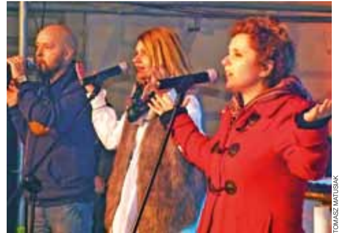
Mocni w Duchu pokazali, że potrafią docierać do serc słuchaczy.