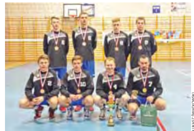
Siatkarze Bzury Sobota z brązowymi medalami.

Najlepszymi zawodnikami w poszczególnych kategoriach zostali: najlepszy rozgrywający: