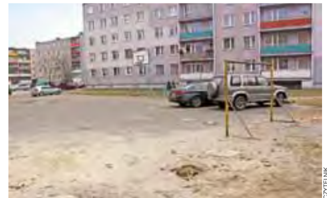
Zaniedbane boisko pomiędzy blokami coraz częściej służyło za parking dla samochodów.

Boisko w tym miejscu istniało od dawna, ale też od dawna było w złym stanie. Do gry w koszykówkę nie nadawała się stara i dziurawa nawierzchnia asfaltowa. Spółdzielnia nie poprawiała też starych koszy. W bezpośrednim sąsiedztwie nieogrodzonego boiska parkowały też samochody. Zdarzało się, że kierowcy nie