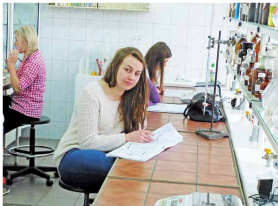
Zajęcia w pracowni farmaceutycznej ŁCKU.

Kończąc naukę w ŁCKU mogą zdawać egzaminy zawodowe na miejscu, a zdobyte przez nich uprawnienia są respektowane, bez konieczności dodatkowego uzupełniania, w większości państw Unii Europejskiej. tm