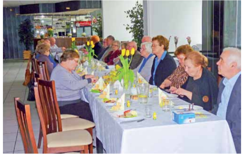
Diabetycy podczas spotkania na Kaliskiej.