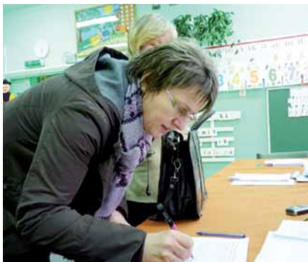
Tak głosowano w czasie konsultacji społecznych w 2012 roku.

kiej z terenów zabudowy usługowej kultu religijnego na cele zabudowy usługowej i innej użyteczności publicznej.