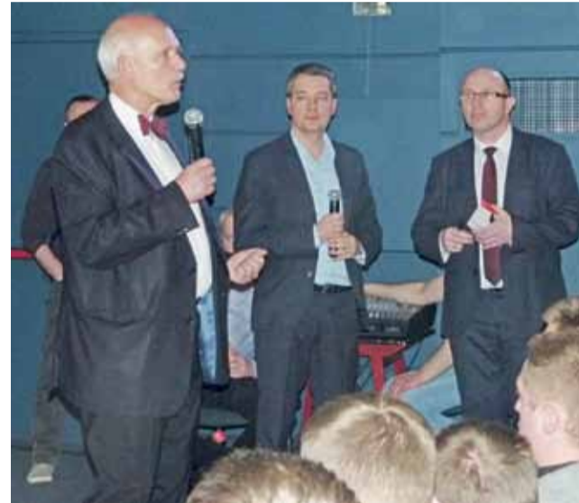
Janusz Korwin-Mikke podczas spotkania z wyborcami.

– Kto głosuje na pana Dudę albo na pana Komorowskiego, głosuje za radykalnym zwiększeniem szans na III wojnę światową – wygłosił tezę JKM pod-