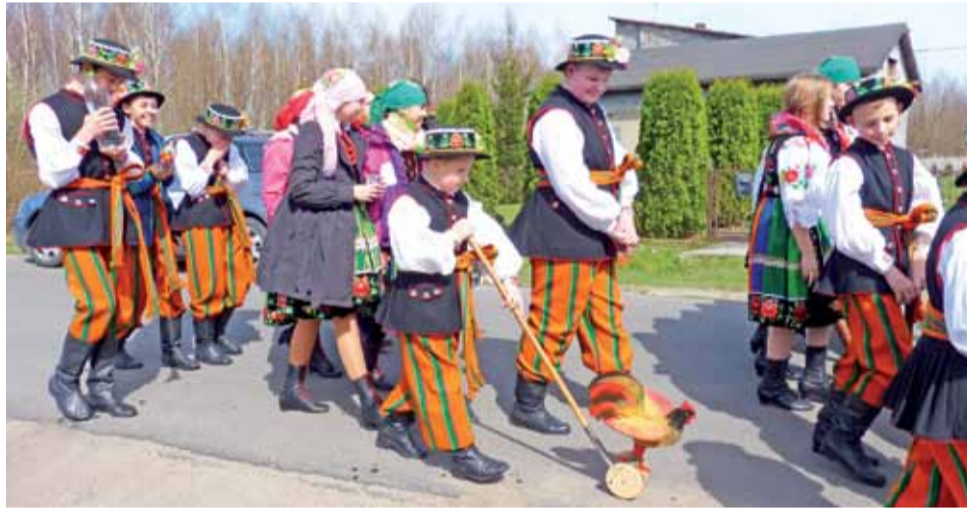
Chodzenie z gaikiem i kogucikiem dzieci rozpoczęły o godz. 13, od tzw. traktu.