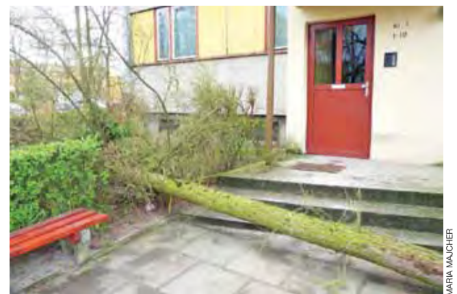
Drzewo upadło tuż przy wejściu na klatkę schodową.

Co ciekawe, często zdarza się, że te drzewa, które stanowią niebezpieczeństwo, są zasadzone przez mieszkańców, bo to w większości oni, ale też i pracownicy, dokonywali nasadzeń od samego