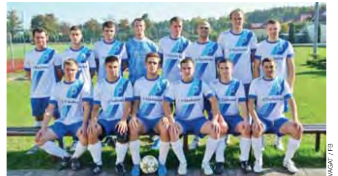
Vagat przegrał w Domaniewicach z Orłętami 0:2.