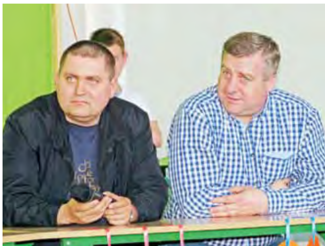
Panowie, którzy zasiedli w szkolnych ławkach, musieli odpowiadać na pytania w konkursie „1 z 10” dotyczące świąt wielkanocnych.