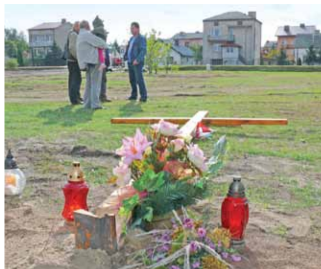
A tak wyglądał postawiony kilka dni wcześniej, a potem obalony krzyż.