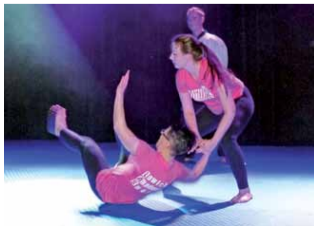
Sekcja „Bezpieczna kobieta” – demonstracja umiejętności.