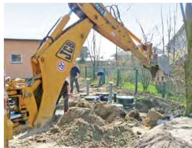
Ostatni dzień prac nad oczyszczalnią przy budynku Urzędu Gminy.

Wykonawcą zlecenia jest firma Ekokord z Rzekunia (powiat ostrołęcki). Kolejnym etapem inwestycji związanej z usprawnieniem gospodarki wodno-ściekowej gminy będą prace w stacji uzdatniania wody w Skowrodzie Południowej, obejmujące wymianę hydroforów oraz montaż