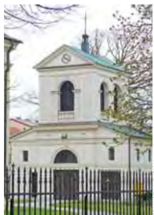
Dzwonnica, już z nowymi wskazówkami zegara.