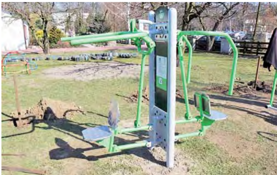
Urządzenia do treningu są już zamontowane i można na nich ćwiczyć.