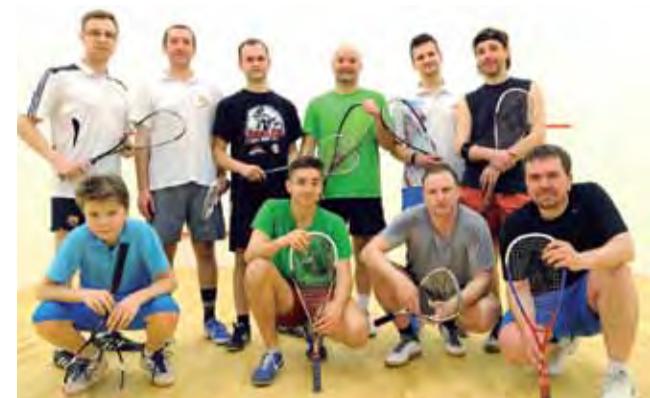
Uczestnicy 3. turnieju na korcie przy Łyszkowickiej.