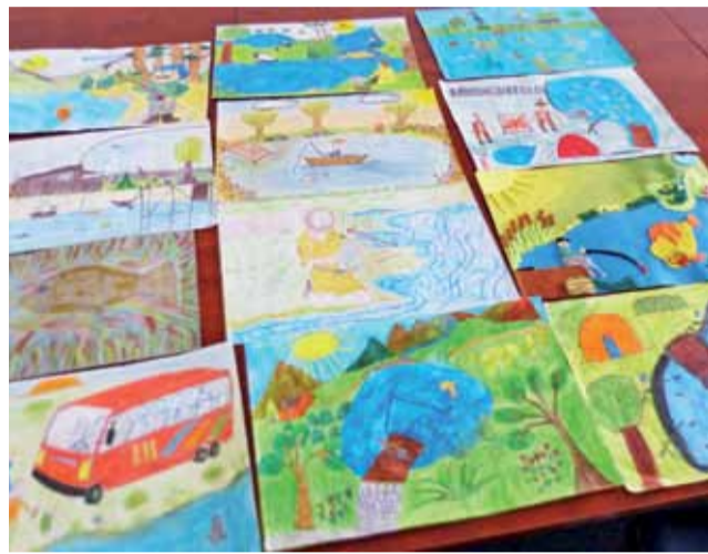
To tylko niewielka część spośród 457 prac zgłoszonych do konkursu.