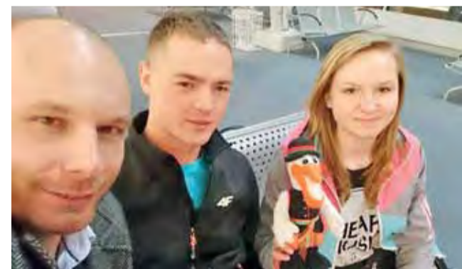
Załoga ŁAS wróciła w dobrym nastroju z Belgii.