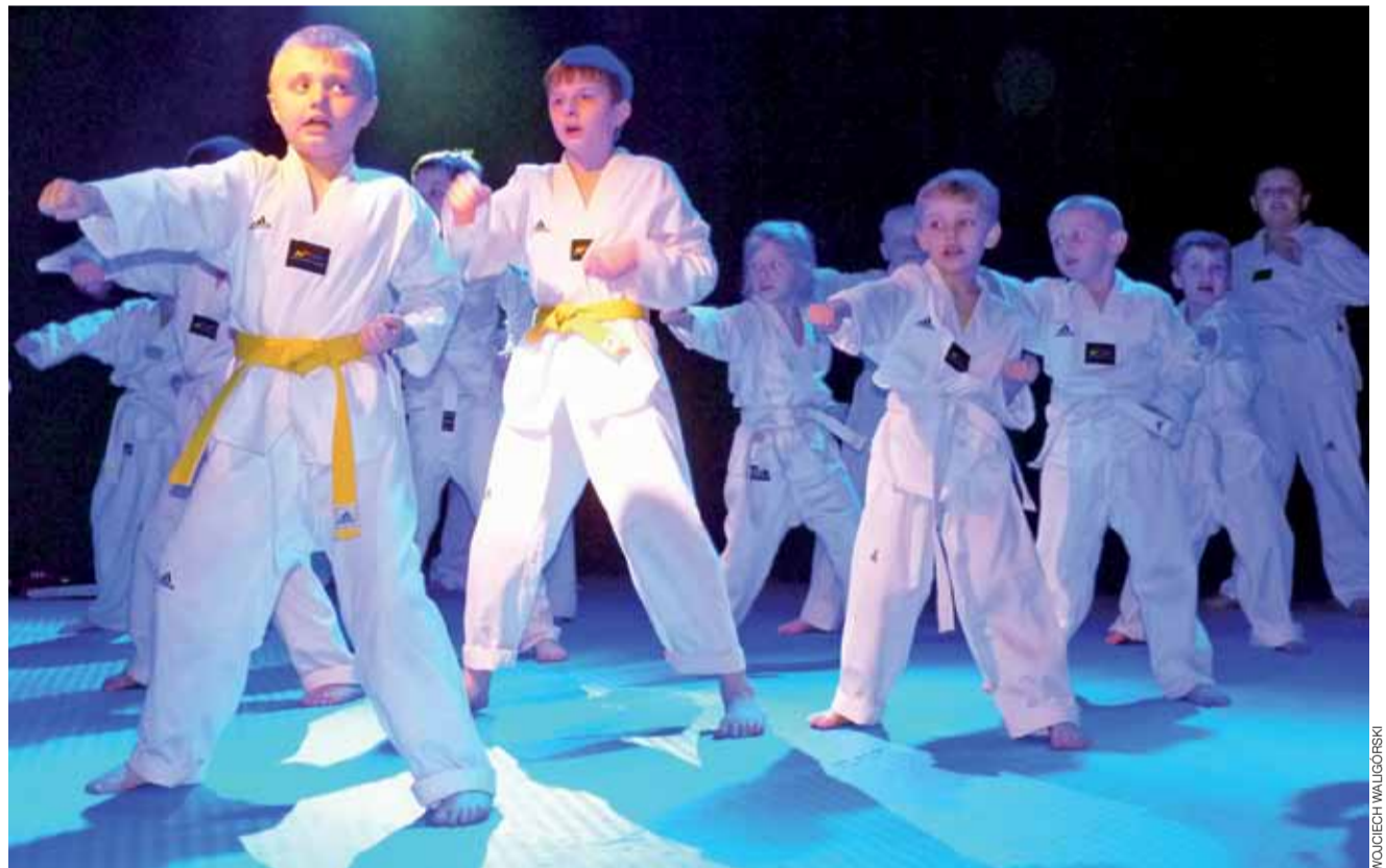
„Od przedszkolaka do olimpijczyka”. Taki program z najmłodszymi dziećmi prowadzi ŁAS. Już widać, ile dzieci umieją.