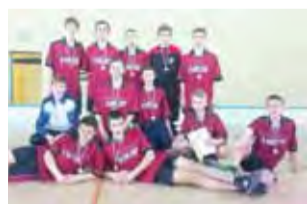
Chłopcy z Nowych Zduń zdobyli brązowe medale w mistrzostwach województwa łódzkiego.

Zduń wygrali z gospodarzami turnieju 1:0. Kolejny mecz w grupie był dużo bardziej wymagający. Po pierwszej połowie spotkania uczniowie ze Zduń wygrali 2:0. Po ambitnym pościgu, niestety dla ekipy z powiatu łowickiego, drużyna z Łubnic wygrała mecz 3:2, strzelając ostatnią bramkę 14 sekund przed zakończeniem spotkania. Dodajmy, iż remis w tym meczu gwarantował zduniemu gimnazjum pierwsze miejsce w grupie i grę w finale imprezy. Uczniowie z Łubnic zrewanżowali się tym samym, za mecz z poprzedniego roku, gdzie to właśnie ekipa ze Zduń przegrała po pierwszej połowie 2:0, by ostatecznie odnieść zwycięstwo 2:4. Jedno wygrane i przegrane spotkanie oznaczały drugie miejsce w grupie i grę o trzecie