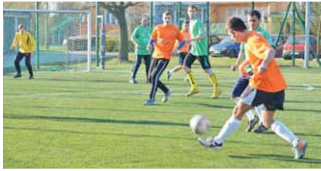
W najciekawszym meczu kolejki Chińska (zielone stroje) okazała się lepsza od Eko-Plastu.

Niespodzianką zakończyło się starcie pomiędzy Bo Dachem,