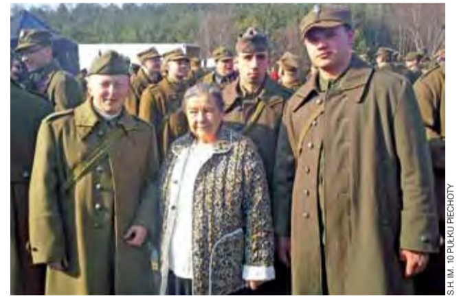
Członkowie łowickiego Stowarzyszenia Historycznego im. 10 Pułku Piechoty

mieli okazję 11 kwietnia wziąć udział pod Warszawą w zdjęciach do filmu Smoleńsk w reżyserii Antoniego Krauze. Film opowiadać będzie historię dziennikarki, która prowadzi własne śledztwo w sprawie katastrofy smoleńskiej sprzed 5 lat. W filmie znajdują się także obrazy z 1940 roku, gdy polscy oficerowie byli mordowani w Katyniu, stąd obecność na planie grup rekonstrukcji historycznej. Dziesiątka zrobiła sobie pamiątkowe zdjęcie z aktorką Katarzyną Łaniewską, która zagrała rolę Anny Walentynowicz. tb