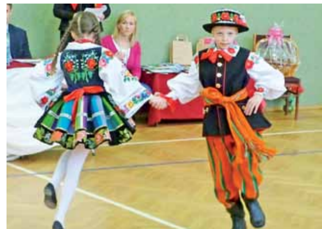
Szczególnie zacięta była rywalizacja w dogrywkach.