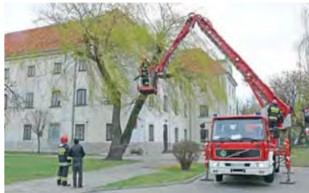
Strażacy z łowickiej PSP w ponad godzinę uporali się ze starą wierzbą, której pnie nie wytrzymały poniedziałkowego wiatru.

Strażacy, którzy na miejsce przybyli przed godziną 10.00, podjęli decyzję o usunięciu całego drzewa, ponieważ pień pękł pionowo około 1,5 metra nad ziemią poniżej rozwidlenia, z którego wyrastały dwa pnie.