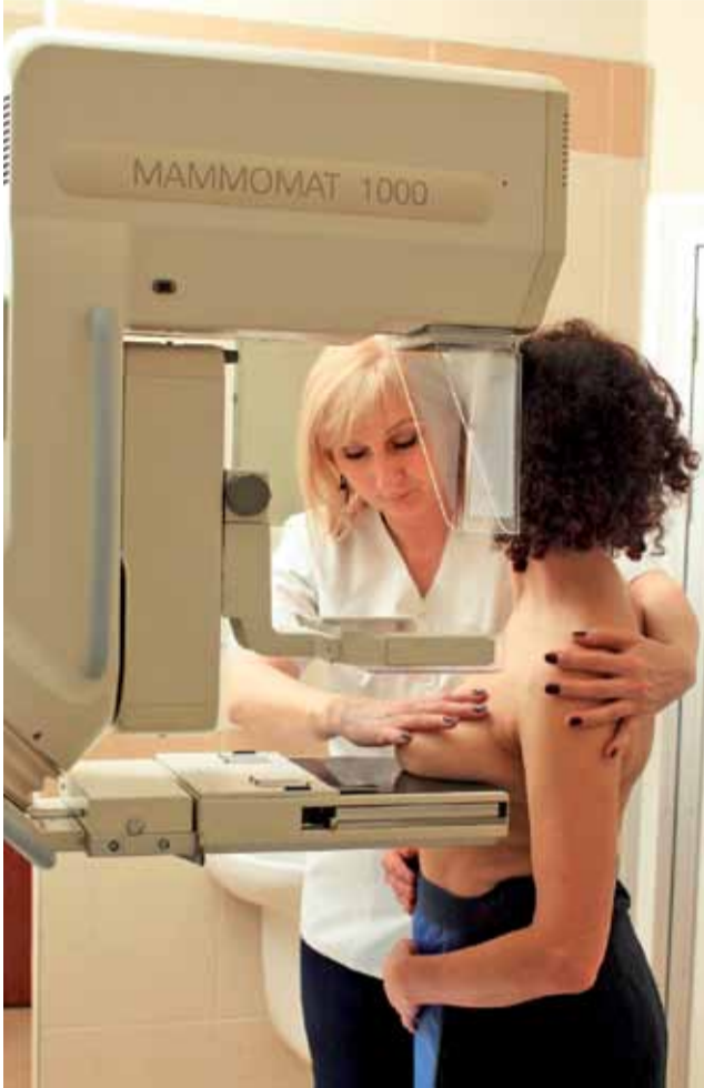
Badanie mammograficzne trwa zaledwie kilka minut.