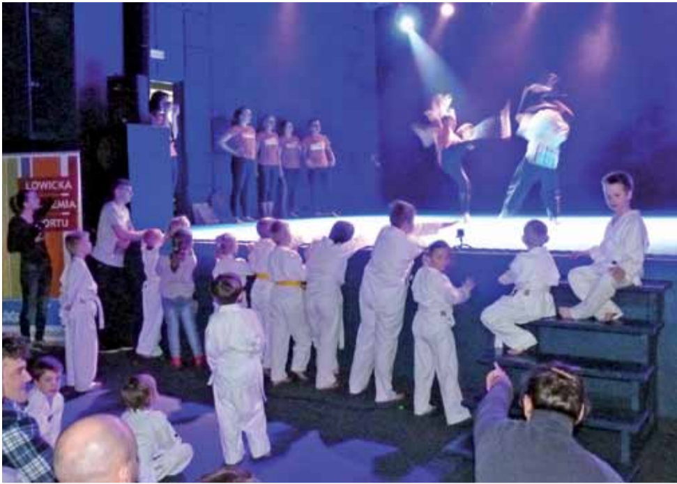
Rodzinna atmosfera: starsi ćwiczą, młodszy patrzą.