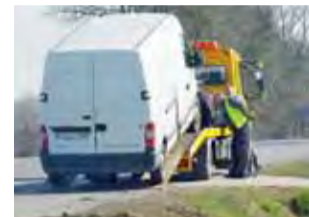
Samochód wyciągnięto z rowu.

Nieznany kierowca samochodu ciężarowego, jadąc w piątek, około godz. 6.40, w kierunku Sochaczewa drogą krajową nr 92, na wysokości Kompiny, zjechał na