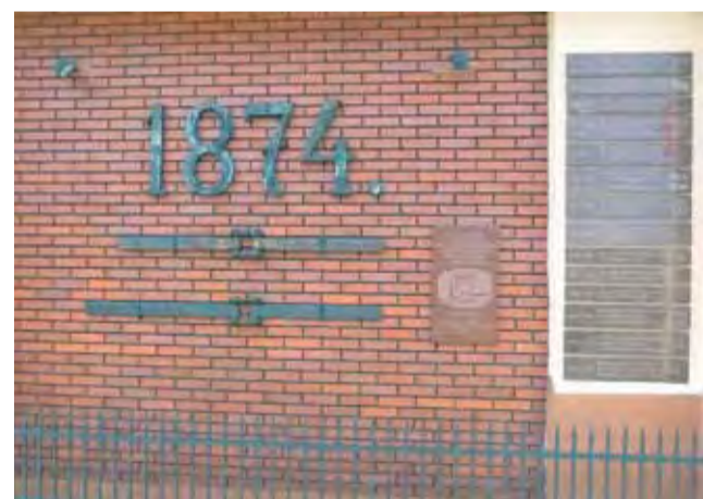
Ekspozycja na ścianie „Mydlarni”, wzbogacona o tablice z chronologią (w prawej części).