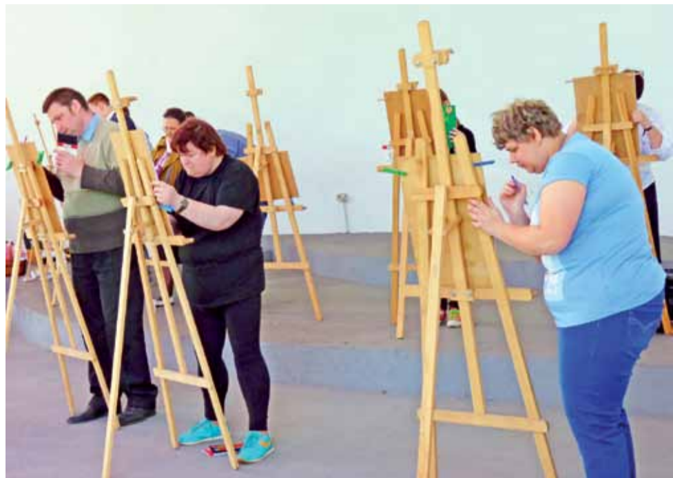
Chętnych do zaprezentowania swojego talentu plastycznego było wielu. Sztalugi na tyłach muszli zawsze były przez kogoś zajęte.

Łowicz | Piknik Europejski już po raz szósty