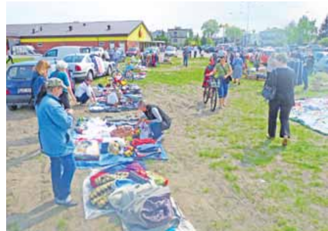
Po godzinie 10 wyprzedaż zaczęła się „rozkręcać”.