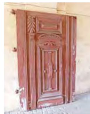
Grube drewniane drzwi w bramie to pamiątka dawnej świetności.