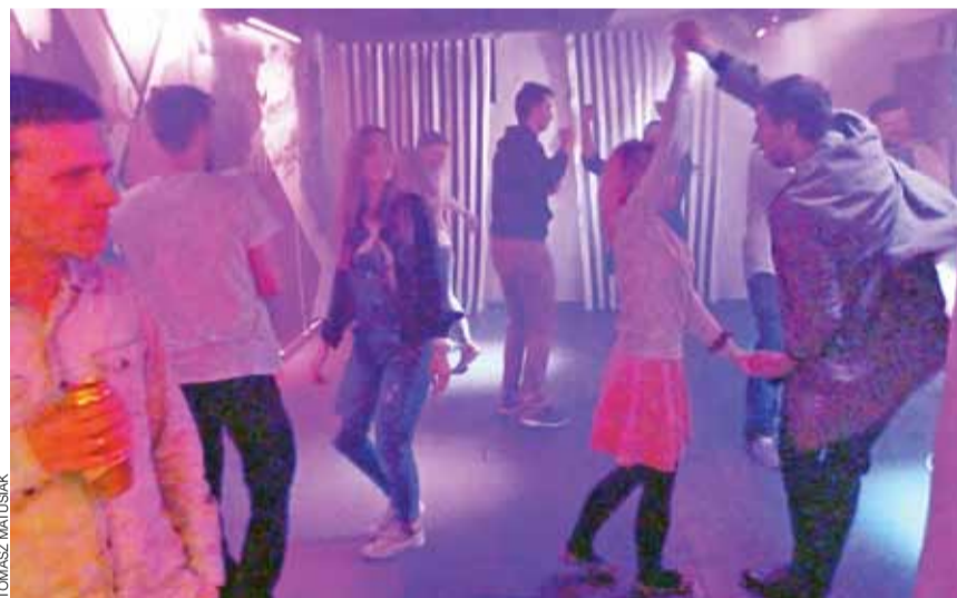
Koniecznym trzeba było zorganizować tę potańcówkę – przekonują pracownicy ŁOK.