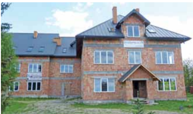
Dom Pogodnej Starości budowany przez Fundację „Czyń Dobro”.