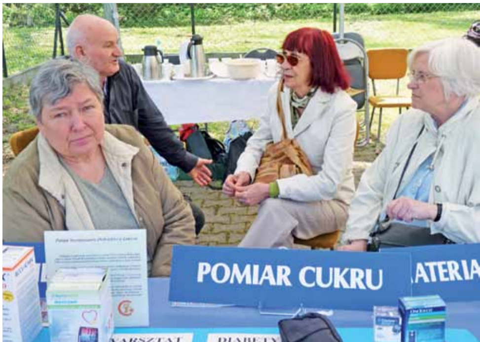
Miejsko-Powiatowe Koło Polskiego Stowarzyszenia Diabetyków w Łowiczu też miało swoje stoisko na pikniku.