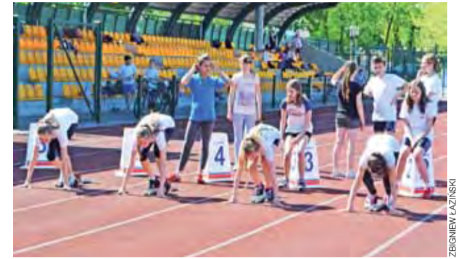
Jedną z konkurencji jest bieg na 60 metrów.