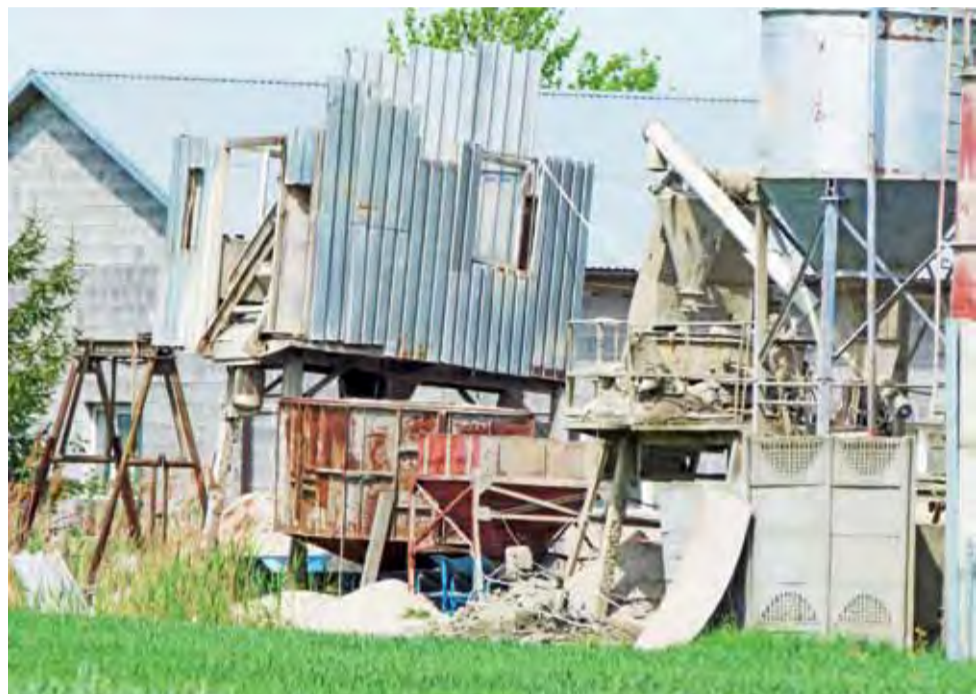
Do wypadku doszło w tym zakładzie, w urzędzeniu na lewo od wysokiego silosa po prawej stronie.

Niedźwiada | Jeden mężczyzna nie żyje, drugi ma połamane nogi