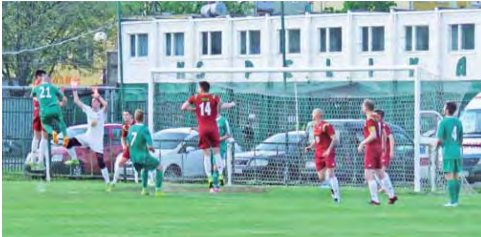
Mocną stron wszystkich czołowych zespołów III ligi są stałe fragmenty gry.