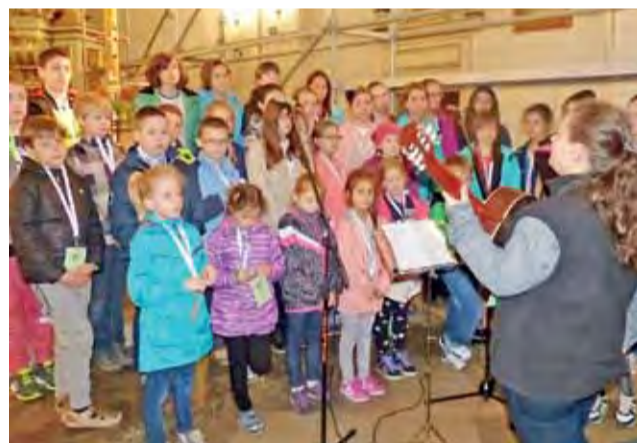
Przeгляд scholi rozpoczął się mszą św., podczas której na rozgrzewkę wystąpiła grupa z Bolesławca.