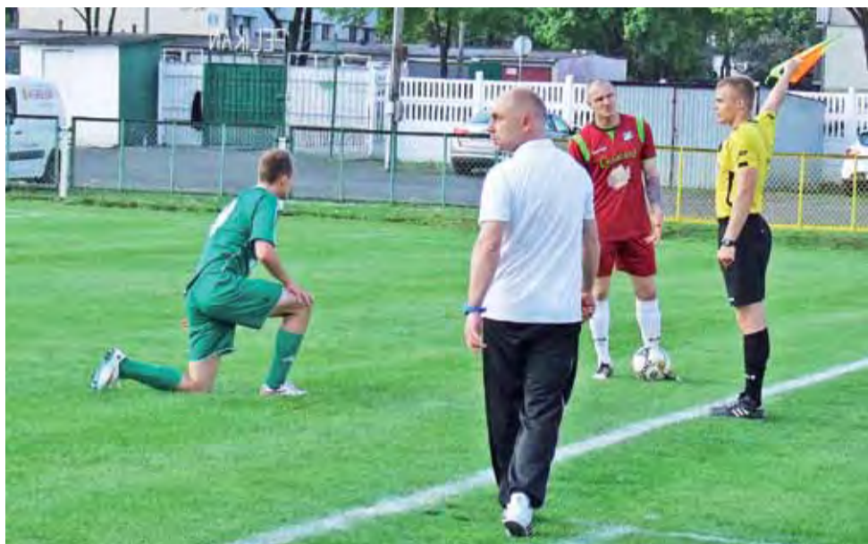
Antybohaterem meczu mógł zostać sędzia liniowy, jego decyzjom dziwili się piłkarze oraz kierownicy obu stron.