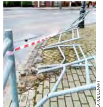
Tak wyglądały barierki po zdarzeniu.

Łowicz | Chuligańskie ekscesy na parkingu za ratuszem