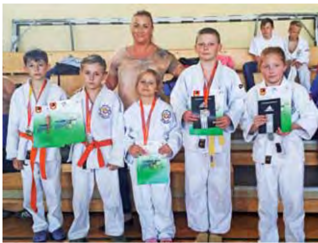
Łowiczanie byli zadowoleni z medali zdobytych w Bielsku.