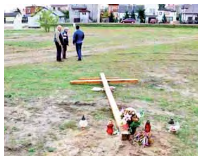
Teren na Górkach od dawna wzbudzał emocje, a szczególnie ustawiony na nim przed laty i później ścięty krzyż.

Chodzi cały czas o ten sam teren o pow. ponad 8 tys. m 2 , pomiędzy marketem Biedronka a ulicą Miodową na Górkach – teren, co do którego prowadzone były w 2012 roku konsultacje społeczne z inicjatywy zarządu osiedla Górki. W konsultacjach