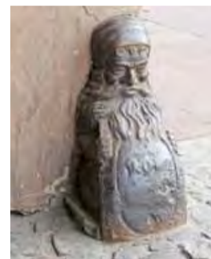
W bramie kamienicy zachowały się solidne, żeliwne krasnale, które chroniły naroże budynku przed powozami.