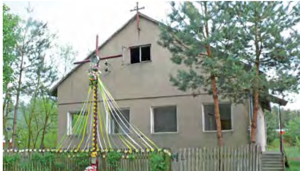
Dawny dom katechetyczny stoi obecnie niewykorzystany, możliwe, że w przyszłości zmieni się w świetlicę.