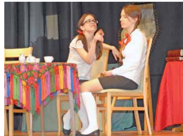
„Moralność pani Dulskiej” na scenie szkoły pijarskiej. Przedstawienia na zakończenie roku klas trzecich stają się tam tradycją.