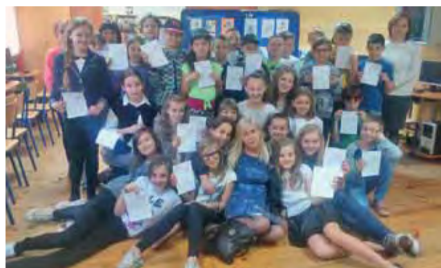
Uczniowie klasy V i III ze swoimi nauczycielkami zaraz po konferencji i warsztatach.

Minikonferencja połączona z wykładem, inscenizacja, konkursy i warsztaty odbyły się w ubiegłą środę w Szkole Podstawowej nr 4 w Łowiczu. Przedsięwzięcie rozgrywało się pod nazwą „Ortografia i gramatyka dla omnibusa i laika”.