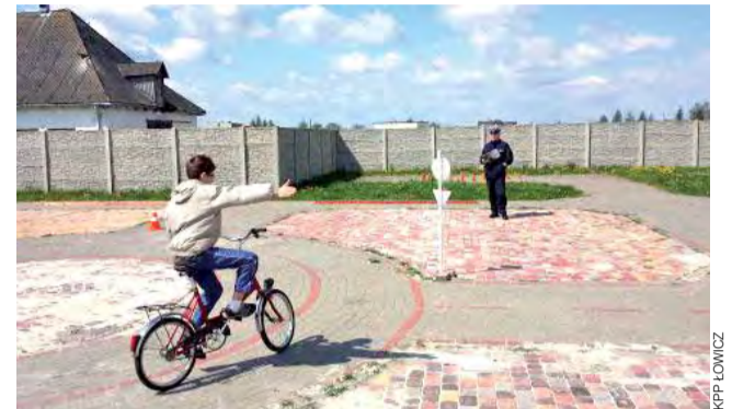
Ważnym elementem konkursu był przejazd rowerem po placu manewrowym.

9 szkół podstawowych i 8 gimnazjów rywalizowało 29 kwietnia w organizowanych na terenie ZSP nr 2 w Łowiczu powiatowych eliminacjach Turnieju Bezpieczeństwa w Ruchu Drogowym.