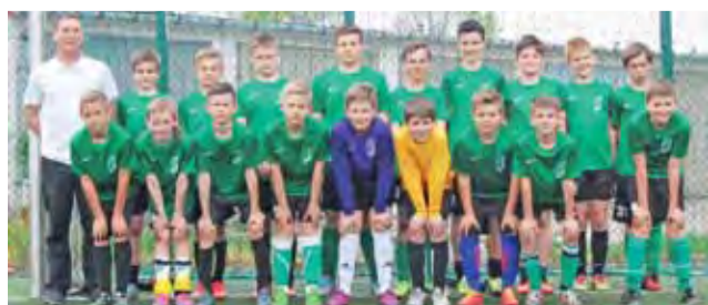
Gracze trenera Walczaka wygrali z Pogonią 6:3.