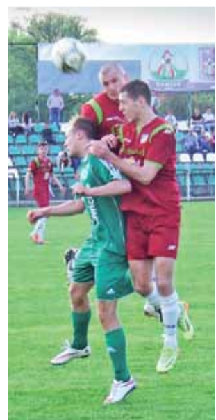
Piłkarze Ursusa walczyli bardzo twardo w sobotę, ale nie mają już szans na baraże o II ligę.

– Ta 12-15 punktowa przewaga kształtowała się od dłuższego czasu i można było powiedzieć, że to było wiadome już od jakiegoś czasu. Oczywiście, mówi się, że dopóki piłka jest w grze, to może