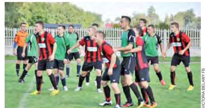
Gracze Victorii (czerwono-czarne stroje) wygrali ważny mecz ze Startem.