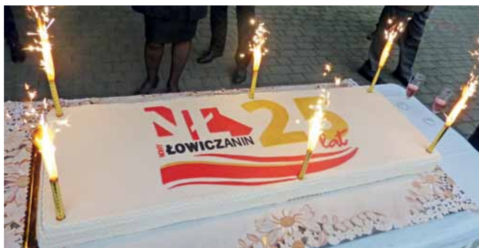
Jubileuszowy tort chwilę przed rozkrojeniem.

Zapytany o to, za co nas ceni, bez wahania odpowiada: – Za to, że tygodnik porusza bardzo ciekawe problemy dotyczące naszego regionu, a więc nie tylko samego Łowicza, ale także okolicznych gmin. Gdyby nie wy, te wiadomości gdzieś by ulatywały. Poza tym niezwykle cenię Kwar-