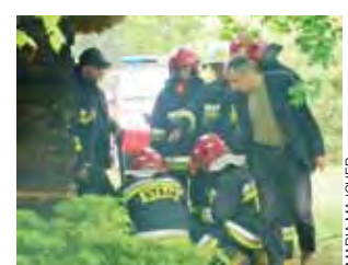
Strażacy wpuszczali w ziemię kamerę termowizyjną.

Na miejscu strażacy zastali tylko, a może aż, okopconą drewnianą ścianę zagrody. Miejsce zwarcia pracownicy skansenu, w obawie przed wybuchem pożaru, po odłączeniu prądu polali wodą. Później strażacy, przy użyciu ka-