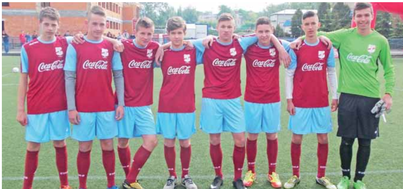
Piłkarze z Gimnazjum nr 1 Łowicz w pamiątkowych strojach.