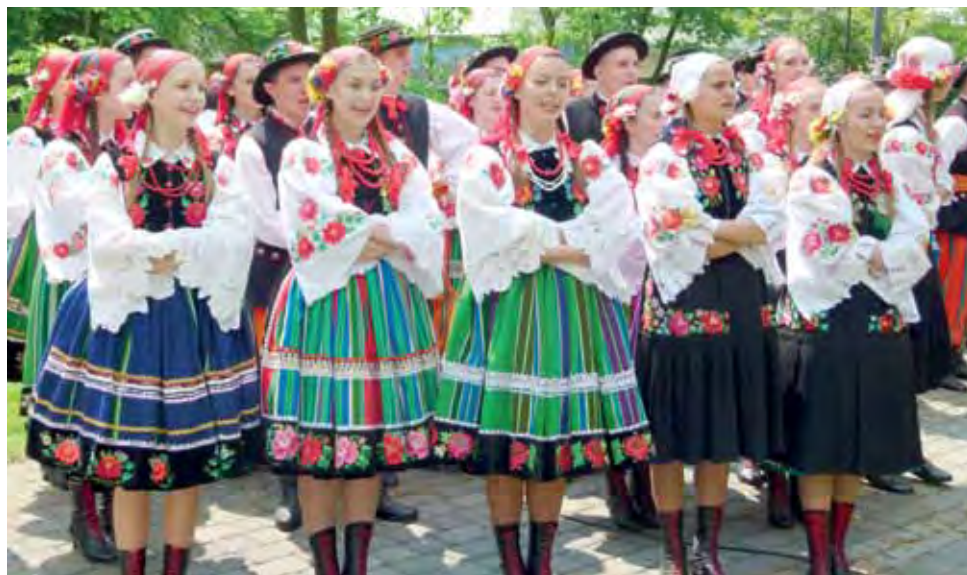
Na uroczystości nie mogło zabraknąć ludowych strojów.