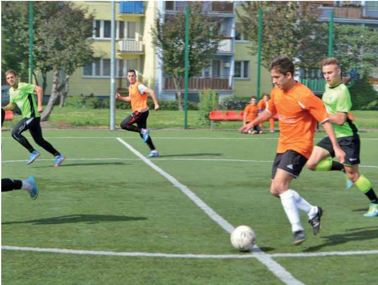
SMS (zielone stroje) tylko w pierwszej połowie przeciwstawił się Eko-Plastowi.