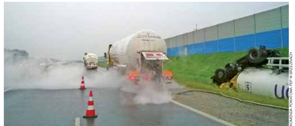
Groźne zdarzenie na A2. Przepompowywanie gazu z leżącej cysterny.

Zderzenie samochodów było silne, przody obu pojazdów uległy zniszczeniu. Dodatkowo Partner zjechał do rowu i przewrócił się na lewy bok. Jak powiedział nam sierż. Poborski, 29-letni kierowca i 24-letnia pasażerka osobówki, ze względu na odniesione obrażenia, trafili do szpitala w Łowiczu. tb