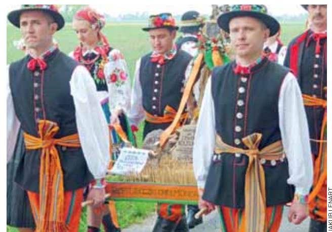
Członkowie zespołu niosą okazjonalny wieniec.