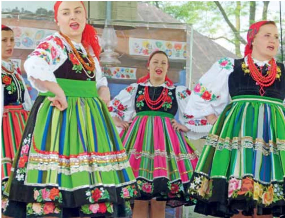
Zespół Boczki Chełmońskie na scenie.