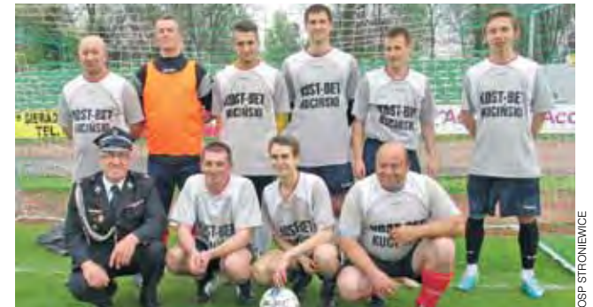
Zwycięska drużyna ze Stroniewic.

Radosław Kuciński nie wyklucza, że w przypadku zaproszeń na inne turnieje OSP Stroniewice również wystąpi. ki