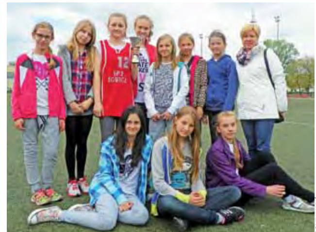
Dziewczyny z SP 2 zajmują 2. miejsce i powalczą w rejonie.

Drugie miejsce zajęły uczennice SP 2 Łowicz z wynikiem 1036 punktów i podopieczne Agaty Za-