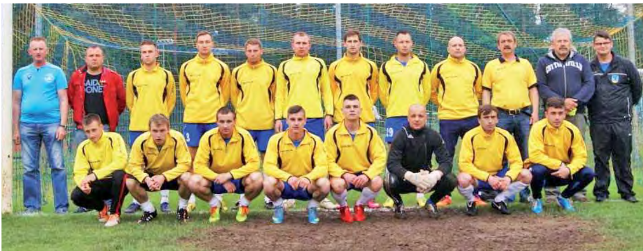
Gracze Orła Nieborów przed meczem z KS Paradyż.

Piłka nożna | 29. Kolejka IV ligi łódzkiej