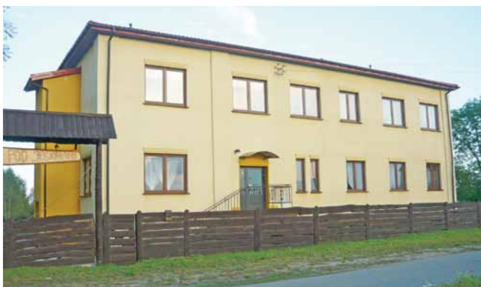
Budynek, w którym mieści się Dom Seniora „Pod Jesionami”.

Jak powiedział nam właściciel nowopowstałego obiektu, zainteresowanie zarówno pobytem stałym jak i czasowym było szczególnie duże na samym początku. Pierwsze reklamy w gazetach, bilbordy i broszury pozostawione w przychodniach sprawiły, że telefony posypały się lawinowo. Co jakiś czas dzwonili potencjalni klienci lub członkowie ich rodzin. Większość osób zainteresowanych ofertą placówki pochodziła z okolic Skierniewic, zaś z samego Łowicza nie było