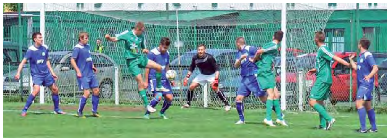
Łowiczanie znów jedną z bramek zdobyli po stałym fragmencie gry.

Cenne zwycięstwo odniosła Polonia Warszawa rozbijając bezpośrednio rywala w walce o utrzymanie z Otwocka. Jeżeli Czarne Koszule we wtorek wygrają zaległy mecz z WKS Wieluń, a będą