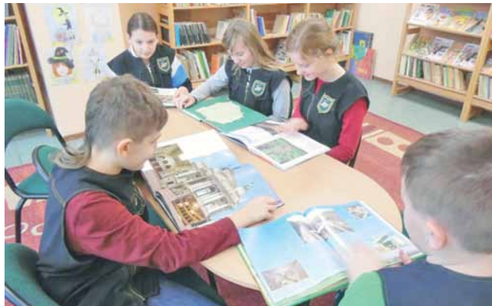
Uczniowie Szkoły Podstawowej w Mysłakowie w czasie zajęć dodatkowych w szkolnej bibliotece.

Głównym celem projektu, który realizowany jest od października 2014 roku do czerwca tego roku, jest wprowadzenie do czterech szkół na terenie gminy Nieborów programów rozwojowych, które wpłyną na wyrównanie szans w nauce wśród uczniów i zmniejszą różnice w osiągnięciach. – Po pierwszych miesiącach realizowanego projektu już dostrzegalne są efekty wśród uczniów objętych programem, chodzi m.in. o szybsze przyswa-