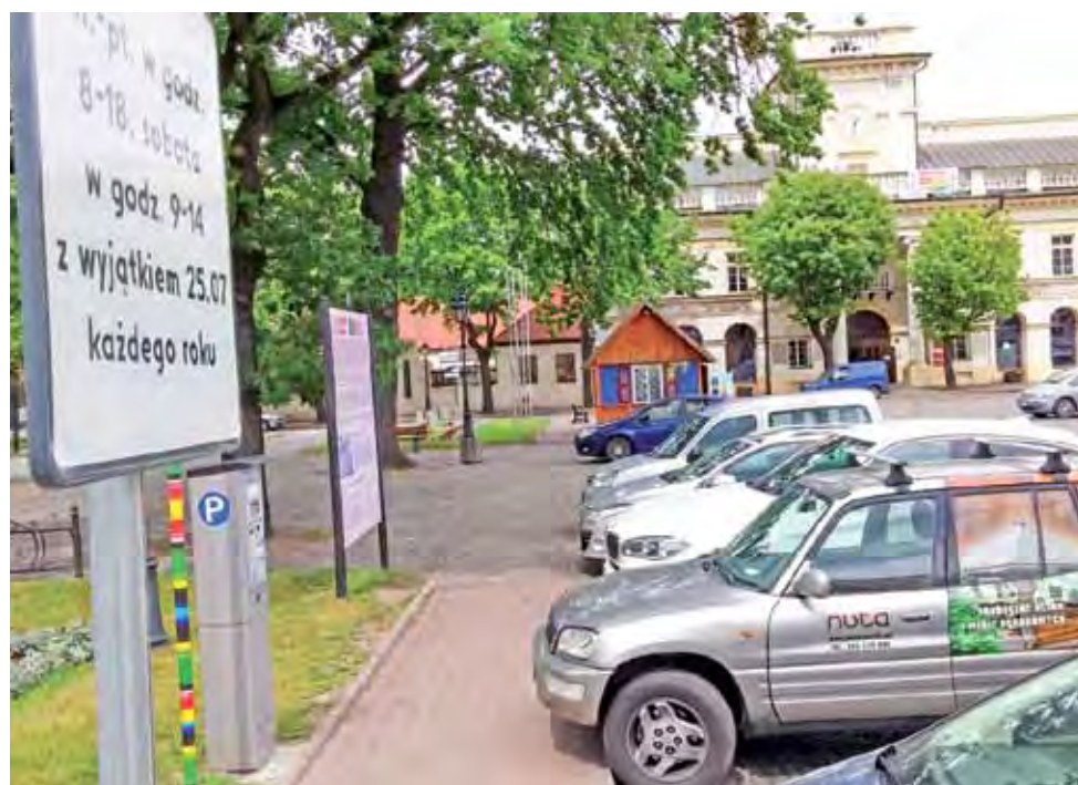
Obecnie nie ma zbyt wielu samochodów na parkingu przed ratuszem na Starym Rynku w Łowiczu, w przyszłości może ich nie być tam w ogóle.

Prawdziwy kłopot będzie jednak w niedzielę, gdy parkingi na Starym Rynku wypełniają się samochodami, którymi przyjeżdżają wierni na msze do katedry i kościoła pijarskiego. Naczelnik Gawroński powiedział nam, że kwestia ta wymaga jeszcze uściślenia i wypracowania spójnego