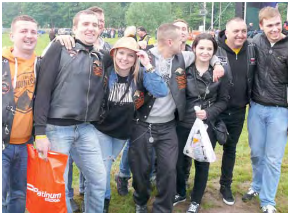
Zwycięzcy wyścigów rydwanów - każdy z nich otrzymał nagrodę.

Około godz. 16.00 motocykliści przejechali z Nowego Rynku przez miasto do Nieborowa, gdzie na terenie Zajazdu Rozdroże bawili się przy granej na żywo muzyce zespołów The Thrill, Vecordia oraz The King's Friends. Odbyły się także konkursy, np. rzucanie wałem korbowym do celu, rydwany – których rolę spełniały taczki. W każdej konkurencji zwycięzcy otrzymywali nagrody. Atrakcją sobotniego wieczoru był też lot balonem. tb