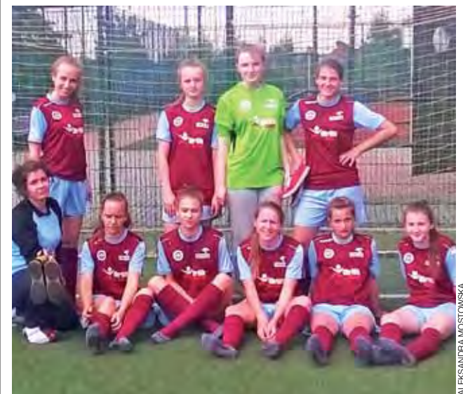
Dziewczyny z Nowych Zdun dostały szansę walki w finale wojewódzkim.