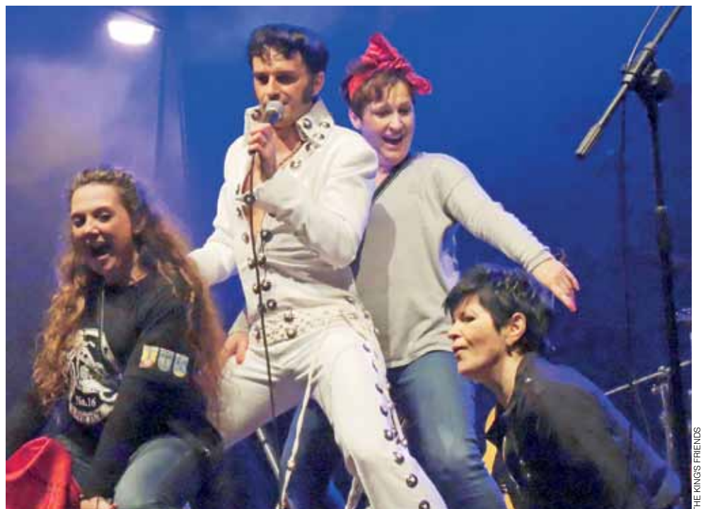
Uczestnicy motocyklowej majówki doskonale bawili się podczas koncertu The King's Friends