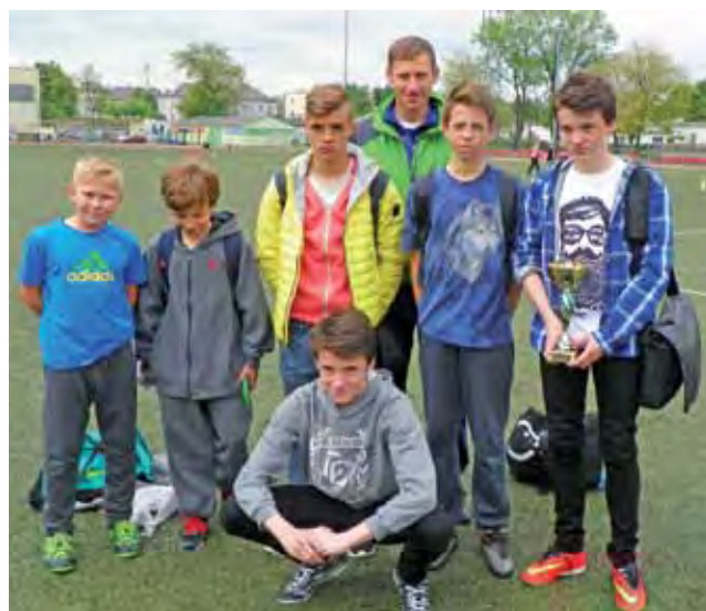
Lekkoatleci z SP 2 wygrali rywalizację w powiecie łowickim.

Po zaciętej walce mistrzami powiatu łowickiego została drużyna Szkoły Podstawowej nr 2 Łowicz. Podopieczni Przemysława Plichty zdobyli w sumie 917 pkt. Przypominamy, że w czwórboju lekkoatletycznym startuje się w czterech dyscyplinach (bieg na 60 m, skok w dal lub skok wzwyż, rzut piłeczką palantową i bieg na 1000 m). Drużyna składa się z sześciu zawodników. Punkty najsłabszego są odrzucane, a pozostałych pięciu są sumowane i decydują o końcowej klasyfikacji zawodów. Na drugim miejscu uplasowała się łowicka Jedynka. Podopieczni Roberta Graczyka uzyskali wynik 875 pkt