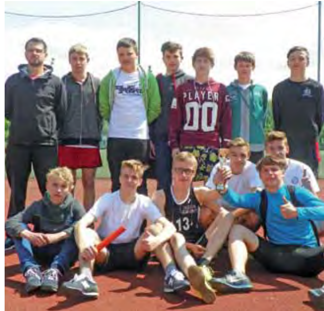
Chłopcy z Nowych Zdun tym razem z tytułem wicemistrzowskim.