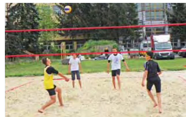
Gimnazjaliści z Łowicza zaczęli już „plażowanie”.