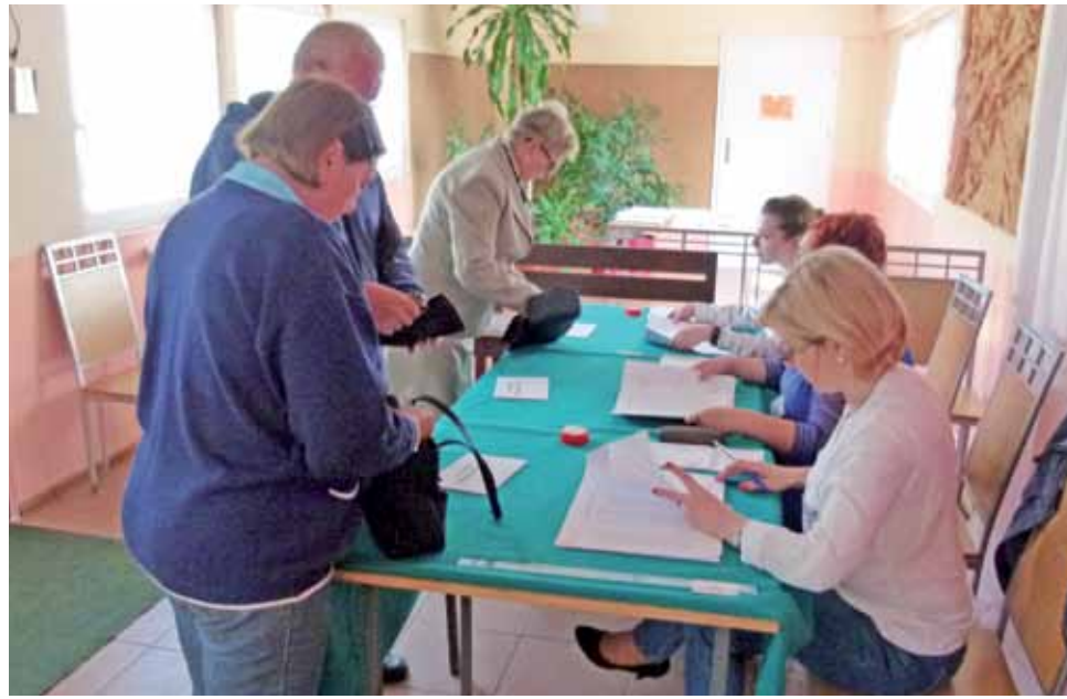
OKW w Miejskim Przedszkolu nr 2 w Łowiczu.

W OKW nr 16 w Przedszkolu Integracyjnym przy ul. Książac-