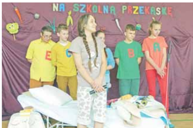
Scena z występu IC: Zosia wstała rano, a za nią Witaminki, które przyszyły do niej wraz z Aniołem.

Quiz był elementem podsumowania konkursu „Żyj smacznie i zdrowo”, który od 5 lat organizuje firma Winiary. Gimna-