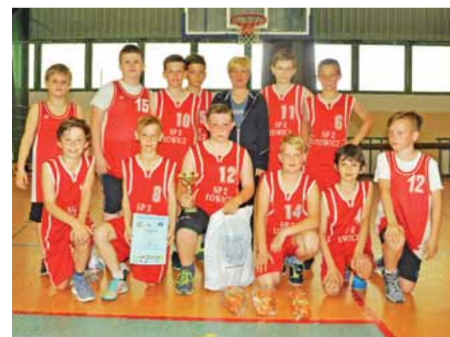
Mistrzowie Łowicza z klas IV SP 2 Łowicz.

Wyniki: SP 7 Łowicz – SP 1 Łowicz 6:8, SP 2 Łowicz – SP 4 Łowicz