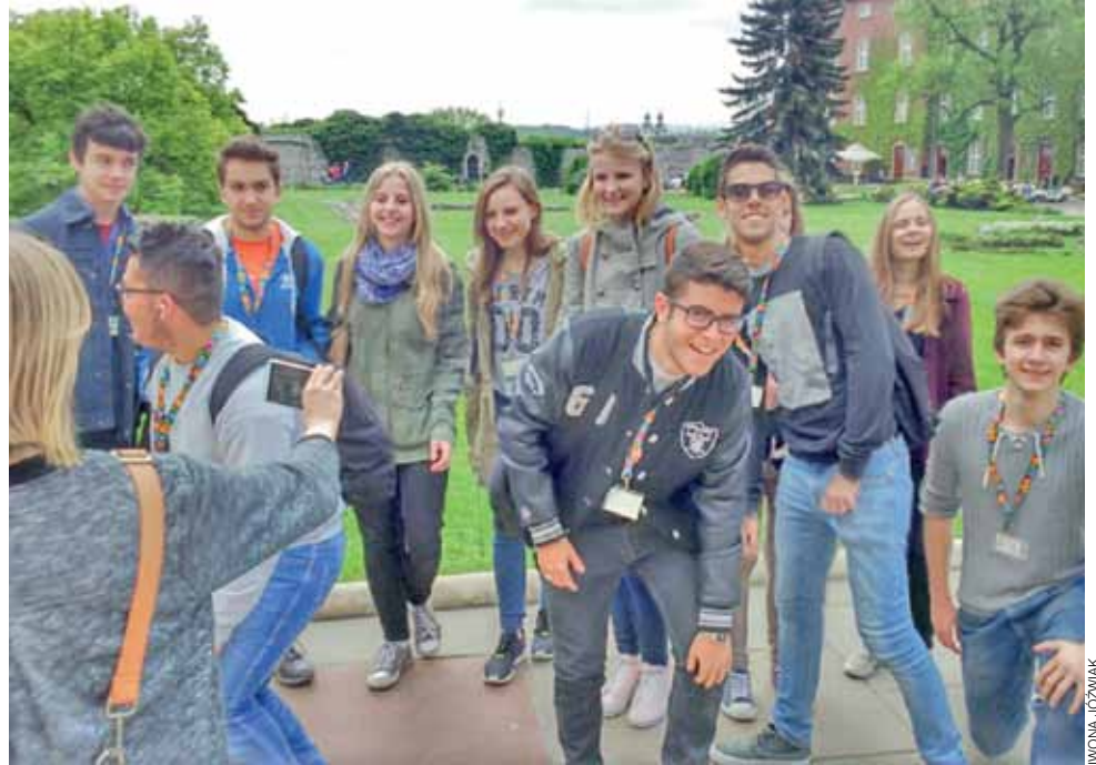
Uczniowie z Polski i Włoch w trakcie piątkowego zwiedzania Krakowa.

W poniedziałek nadszedł czas pożegnań. Uczniowie z Sardynii z samego rana wyjechali do Krakowa, mieszkańcy pozostałych grup do Warszawy. Przed wylotem ci, którzy pierwszego dnia przyjechali późno, mieli szansę jeszcze zwiedzić Warszawę. Niemcy natomiast udali się do Muzeum Powstania Warszawskiego. Po południu wszyscy spotkali się na wspólnym posiłku, podczas którego zjedli tradycyjny polski rosół, schabowego i szarlotkę. Później było zwiedzanie z przewodnikiem Łazienek, a na samym końcu jeszcze jeden posiłek w restauracji „Zapiecek”, w której goście z zagranicy mieli szansę spróbować wszystkich