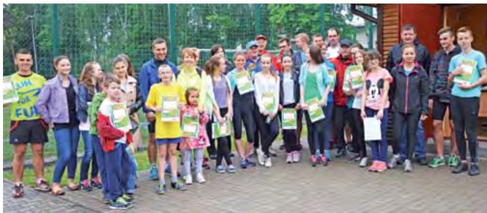
Uczestnicy akcji „Polska biega” na Korabce.