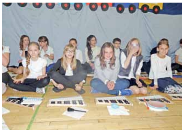
Dzwonki zabrały swoich kolegów ze szkoły w muzyczną podróż koleją.