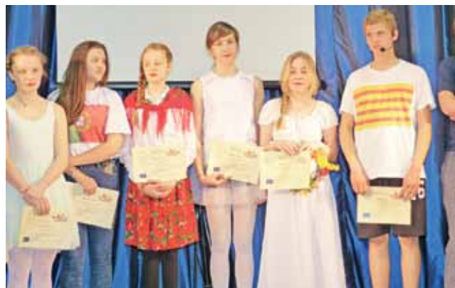
Gimnazjaliści z „Dwójki” w czasie uroczystego zakończenia Comeniusa otrzymali certyfikaty udziału w projekcie.