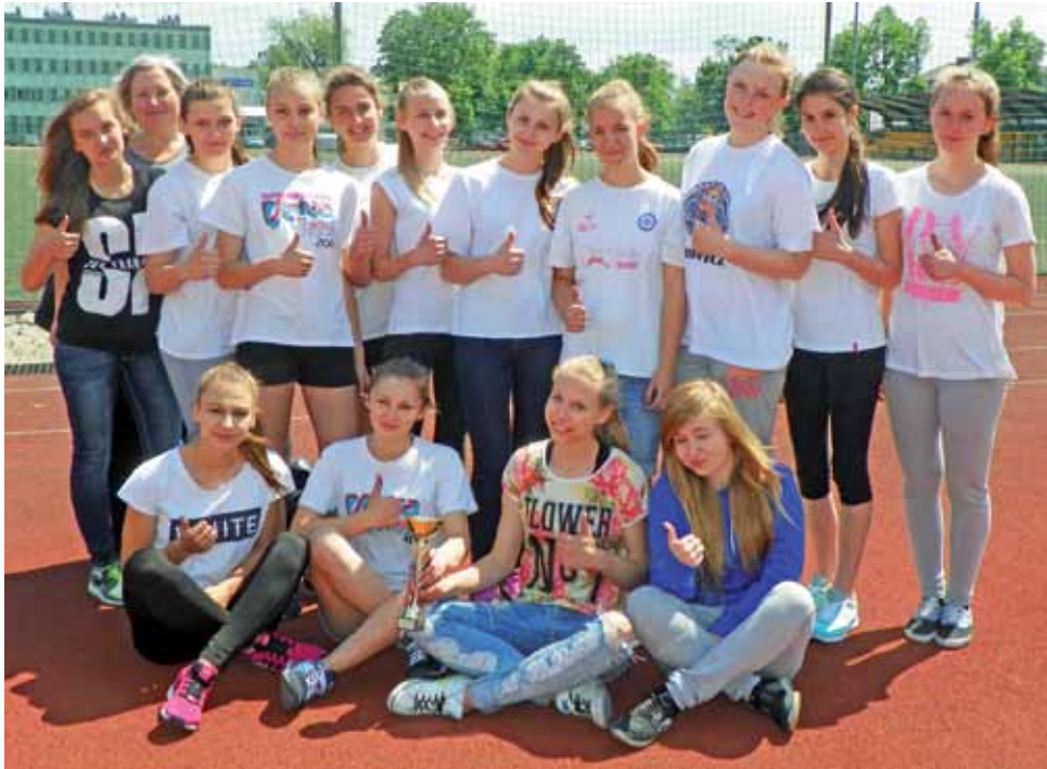
Gimnazjalistki z Nowych Zdun były bezkonkurencyjne w rywalizacji powiatowej.

Na zakończenie zawodów organizatorzy zawodów (Powiatowy Szkolny Związek Sportowy i OSiR Łowicz) zliczyli punkty i okazało się, że najwięcej zdobyły właśnie dziewczęta z Nowych Zdun – 1149, czyli dało się im obronić mistrzowski tytuł