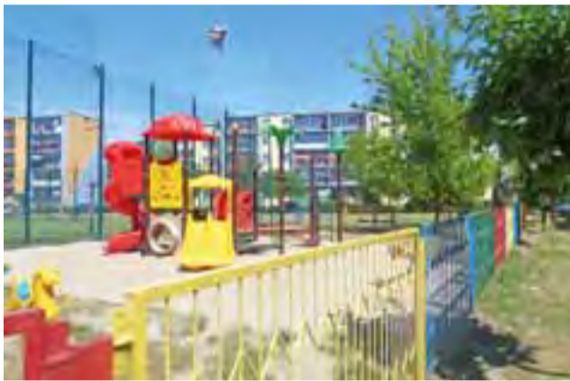
Orlik przy Bolimowskiej w sobotnie przedpołudnie był pusty. Niektórzy na osiedlu chcieliby, aby taki był jak najczęściej. Tylko czy to ma sens?

Nasza rozmówczyni mówi, że obserwuje fajne imprezy na Orliku, np. turniej dla całych rodzin,