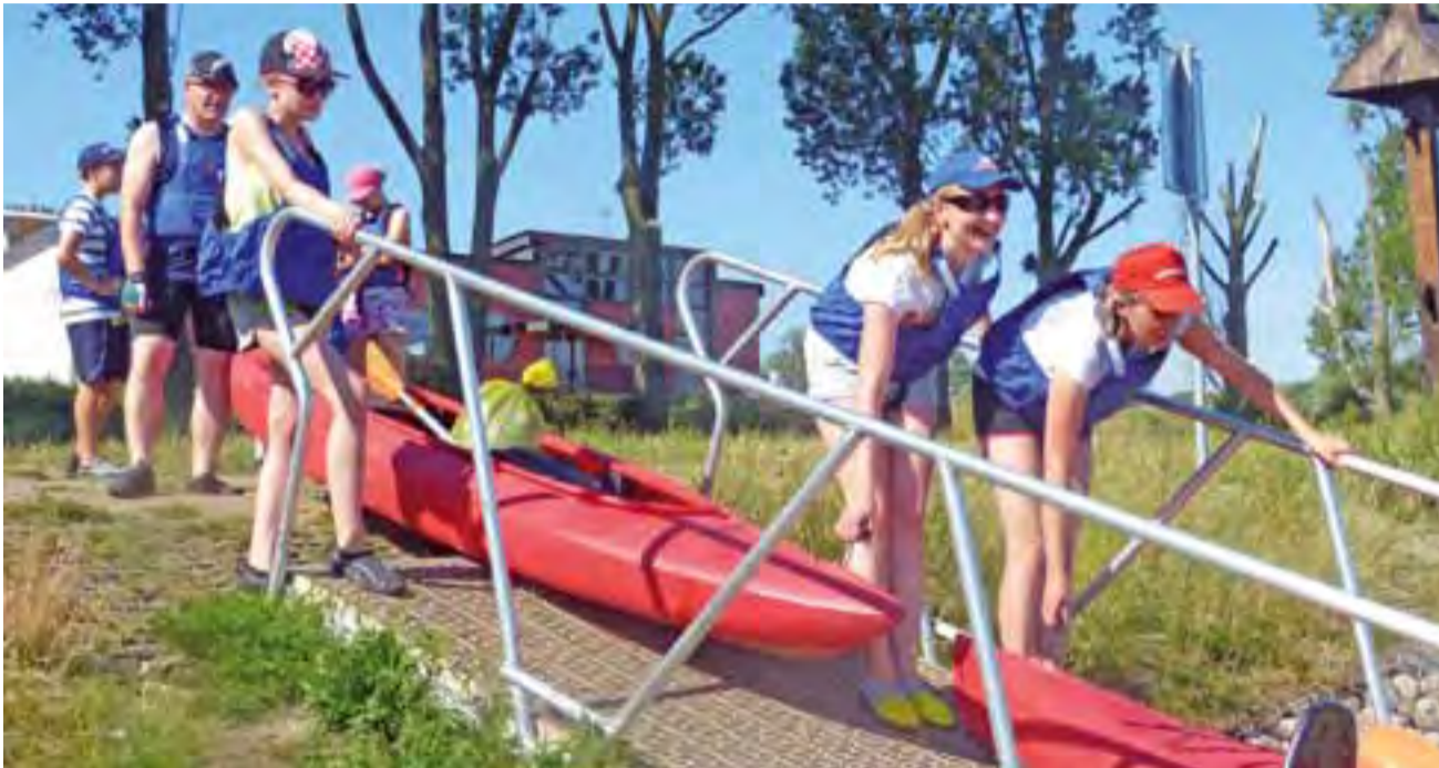
Kajaki zostały przewieszone nad rzekę i rozładowane z przyczep. Potem jednak trzeba było włożyć trochę wysiłku w to, aby je zwodować.