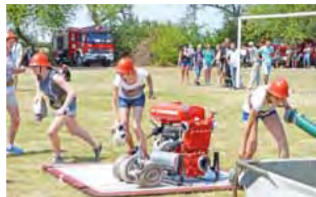
Zawodniczkom startującym w kategorii C jurorzy pozwolili startować w strojach dowolnych, musiały jednak koniecznie mieć strażackie pasy oraz hełmy.

cza m.in. inny sposób naliczania punktów niż w przypadku zawodów dla dorosłych (na starcie każda drużyna otrzymuje 1000 pkt. za udział, a potem wyniki przelicza się w zależności od wieku uczestników), inna jest dla MDP sztafeta i tzw. rozwinięcie bojowe, ponieważ nastolatki używają nalewa-