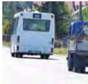
Autobus linii nr 5 na wylocie z Łowicza. Już wkrótce będzie też tędy jeździł autobus 5A.

Nowa linia będzie oznaczona jako 5A. Z Łowicza do Jamna będzie prowadziła drogą krajową nr 14, tak samo jak linia nr 5, ale przed zakretem przy szkole w Jamnie skręci w lewo, do Starych Grud. Dalej autobus będzie jechał przez Uchań Dolny, Kucz-