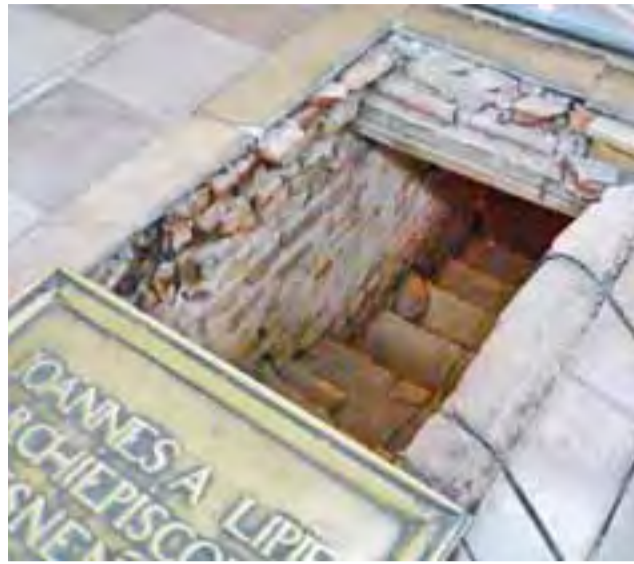
Odкрыte wejście do podziemi katedry, na co dzień zakryte tablicą pamiątkową Jana Lipskiego, prymasa Polski w latach 1638-41.

25 lipca o godz. 12 –kościół parafialny w Stachlewie. mwk