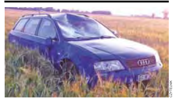
Audi biorące udział w wypadku zatrzymało się na pobliskim polu.

Będzie to średni samochód ratowniczo-gaśniczy z pełnym wyposażeniem. Samochody mają zostać sprowadzone do wytypowanych jednostek najpóźniej 18 listopada. tm