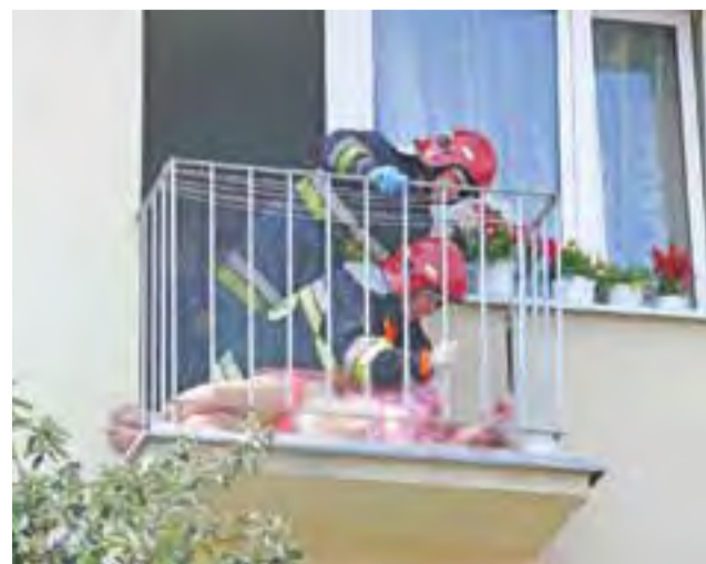
Strażacy, po kilkunastominutowej akcji zdecydowali się wciągnąć leżącą kobietę do wnętrza mieszkania, w którym przebywał syn.

Dobry zakup. Jednostka OSP Bielawy już cieszy się nowym wozem bojowym, zakupionym dzięki wsparciu z Łowickiej Grupy Rybackiej (550 tys. zł) oraz WFOŚiGW (300 tys. zł). Specjalistyczny samochód ratowniczo-gaśniczy z wyposażeniem do ratownictwaekologiczno-chemicznego dotarł do Bielaw 22 czerwca, a 24., w przerwie sesji Rady Gminy, został zaprezentowany radnym i sołtysom. Zakupiono go od wyłonionej w przetargu firmy Szczęśniak Pojazdy Specjalistyczne z Bielska-Białej za 997.920 zł, w tym udział gminy wyniósł około 140 tys. zł. ewr