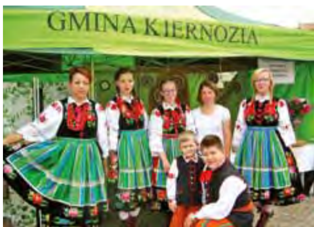
Kiernożanie występowali w Kutnie po raz pierwszy.