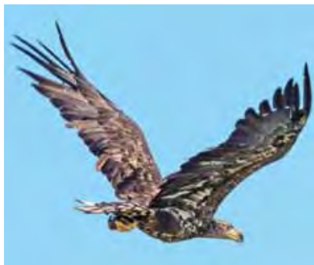
Młody bielik. Jego upierzenie z wiekiem zmieni kolor.