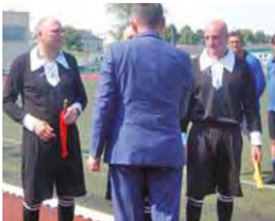
Niecodzienny mecz warto było obejrzeć. Sędziowie i zawodnicy wystąpili w ciekawych strojach, takich jak te z minionej epoki. Nawet piłka przez nich kopana była specjalnie szyta.

Piłka nożna | Historyczny mecz na stadionie im. 10 Pułku Piechoty