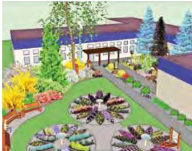
Wizualizacja projektu ogródka „Łowickie stokrotki na leśnej polanie”.

Ogródki to wydzielone miejsca na powietrzu, mogące służyć dzieciom zarówno do nauki, jak i zabawy. W przypadku ogródków, o których piszemy, będzie to przede wszystkim na-