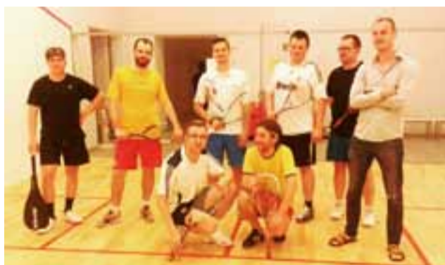
Uczestnicy 6. turnieju w squasha.

Siódmy turniej odbędzie się w piątek 31 lipca.