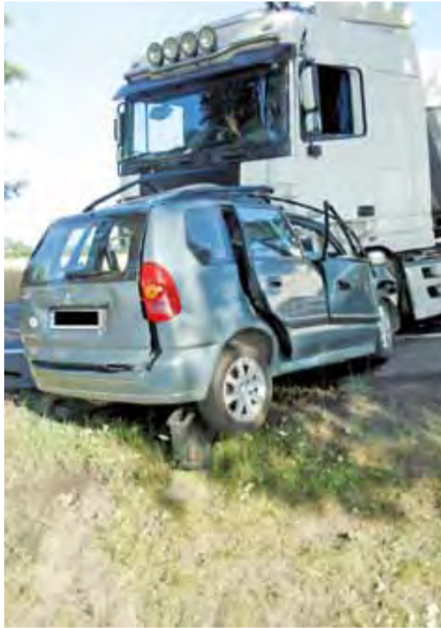
Ludzie jadący samochodem osobowym nie mieli szans na przeżycie. Siła uderzenia zmiażdżyła przód pojazdu.

Dlatego, jak przyznał, strażacy, z zachowaniem szacunku, nie spiesząc się, wydobyli ciała z pojazdów, wcześniej rozcinając karoserię. W miejscu wypadku ruch na drodze krajowej nr 14 był wstrzymany w obu kierunkach do godz. 22.00. tb