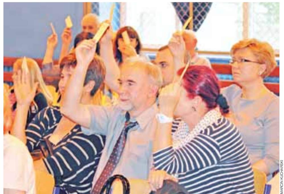
Głosowanie nad absolutorium dla członków zarządu ŁSM było jednomyślne.