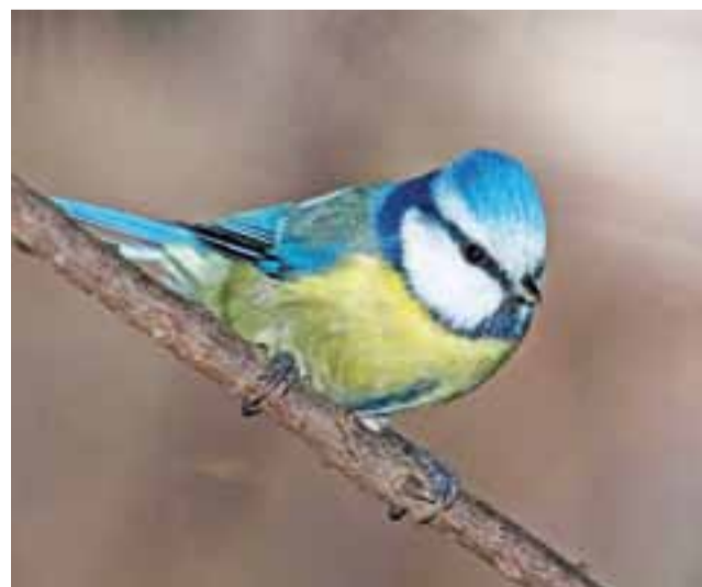
Uroczą jak jej nazwa. Modraszka – ptak z rodziny sikor.

Na razie wystawę można oglądać codziennie, choć drzwi do galerii nie są cały czas otwarte. Odwiedzający, którzy zastaną je zamknięte, proszeni są o telefoniczne poinformowanie Agnieszki Antczak (nr 693-422-684), która wystawę otworzy. Wstęp jest bezpłatny, natomiast w cenie 4 zł/szt. można na niej kupić pamiątkowe widokówki z fotografiami Sławomira Wasiaka.