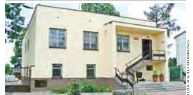
Posterunek przestał straszyć. Jeszcze w maju, na zlecenie władz gminy Bielawy, dokonano remontu budynku dawnego posterunku policji, który i dziś służy policjantom z KPP w Łowiczu, ale jest także udostępniany przez gminę terenowym pracownikom Łódzkiego Ośrodka Doradztwa Rolniczego. ewr

Łowicz | Ogródki dydaktyczne w kolejnych przedszkolach