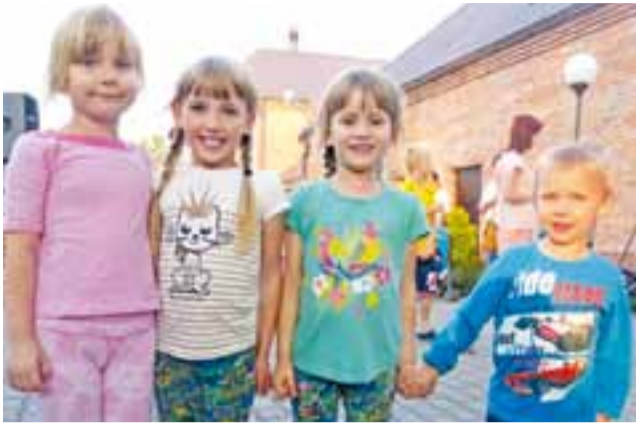
Biesiada to zabawa dla wszystkich, świetnie bawili się na niej także dzieci.