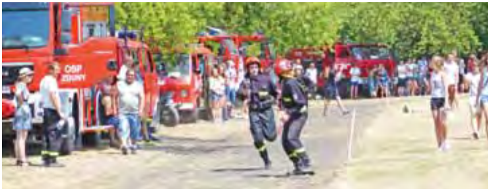
Sztafeta strażacka, podobnie jak i całe zawody, rozegrana była w upalnym słońcu, a zawodnicy startowali w pełnym umundurowaniu bojowym.

W kategorii A klasyfikacja końcowa była następująca: I miejsce zajęła OSP Złaków Kościelny I drużyna, II – Bąków Dolny, III – Wiskienica Dolna, IV – Łażniki, V – Bogoria Dolna, VI – Złaków Borowy, VII – Złaków Kościelny II drużyna, VIII – Zduny, IX – Retki, X – Rzaśno, XI – Urzecz, XII – Bąków Górny.