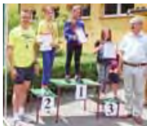
Podium biegu w kategorii dziewcząt kl. III-IV.

– Miło jest obserwować małych biegaczy podczas rywali-