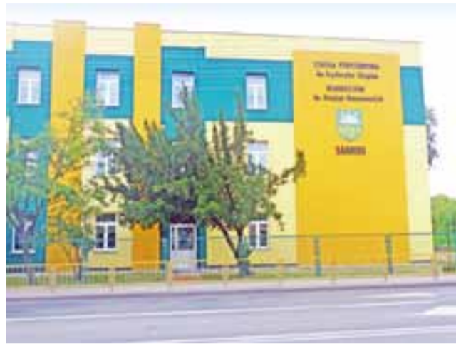
Budynek, w którym mieści się Szkoła Podstawowa i Gimnazjum w Sannikach jest za ciasny dla obu placówek.

– Mam nadzieję, że dla dobra naszych dzieci uda się tę działkę pozyskać, ale na pewno nie stanie się to w ciągu roku – mówił Ga-