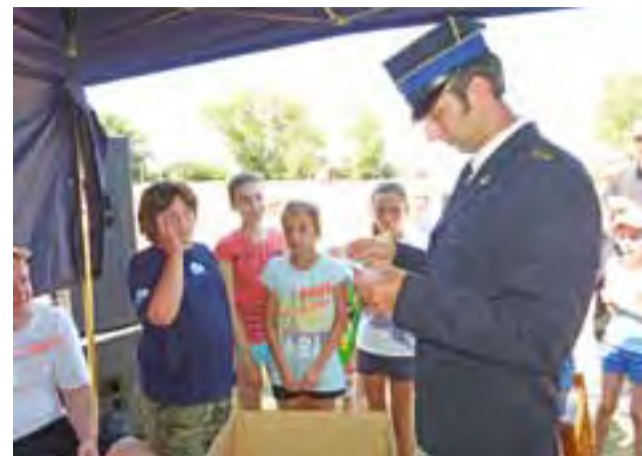
Losowanie czujek dymu, ufundowanych przez Państwową Straż Pożarną.

Dodać warto, że w gminie Zduny – jako jedynej gminie powiatu łowickiego – zawody MDP odbywają się według międzynarodowego regulaminu CTIF, co ozna-