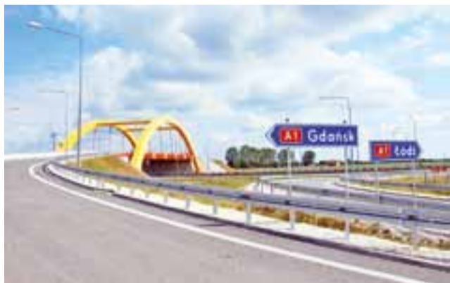
Węzeł drogowy został otwarty dla ruchu tuż przed wakacjami.

Oznacza to znaczną poprawę układu komunikacyjnego w rejonie Kutna, jak również w samym mieście. Zadowoleni powinni być zarówno kierowcy jadący drogą krajową nr 92 od strony Łowicza, jak i od Poznania. Nie będą bowiem zmuszeni przejeżdżać przez Kutno, aby dostać się na autostradę A1 w kierunku Gdańska. Wcześniej, aby do niej dojechać, kierowcy musieli drogą krajo-