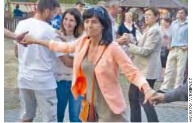
Pierwsze utwory wykonane przez zespół „Rytm” szybko wywołały na parkiet pierwszych tancerzy.

Łowicz – Korabka | W loterii fantowej można było wygrać rower i tablet