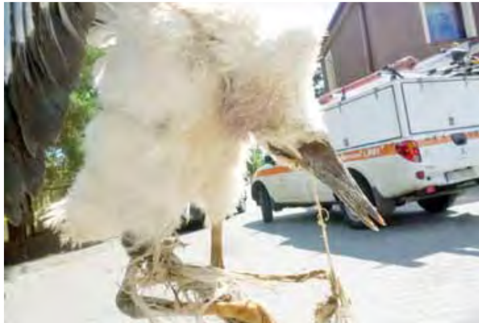
Młody bocian zaplątał się w sznurek do prasy, który dorosłe ptaki przyniosły do gniazda.