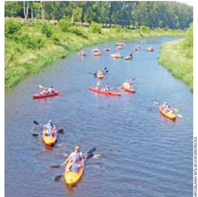
Zobaczyć w Łowiczu kajaki na Bzurze nie jest już czymś wyjątkowym. Tak duży spływ odbył się jednak chyba po raz pierwszy.

Łowicz – Patoki | 66 osób wsiadło do kajaków