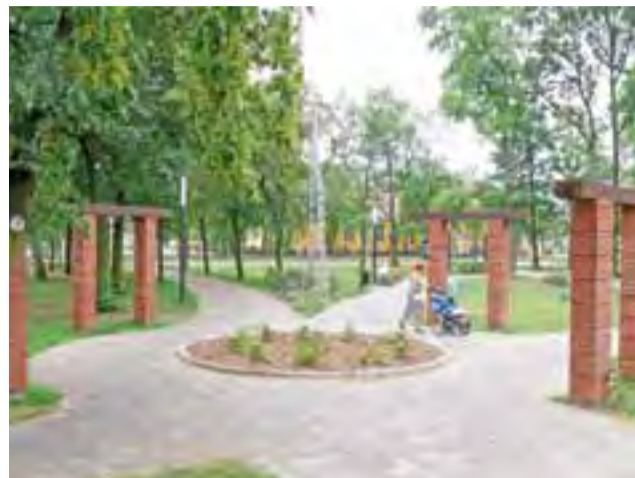
Park Mickiewicza, w swoim nowym kształcie, zachwyca mieszkańców, dla których stał się po prostu przyjazny i bezpieczny.

Jak zauważyła, ratusz czeka jeszcze na zasiedlenie przez rodzinę repatriantów mieszkania na os. Kostka, które zostało wyremontowane w 2014 roku. Obecnie stoi ono puste. MSW jednak decyzję o zasiedleniu podjęło na początku tego roku, czyli dość późno. – Rodzina informację o możliwości przyjazdu też otrzymała w tym czasie, więc sądzę, że jest w trakcie przygotowań do przeprowadzki – powiedziała nam. Wszystkie rodziny, które trafiłyby do Łowicza, pochodzą z Kazachstanu. tb