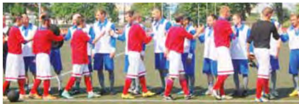
Pojedynki 10 Pułku Piechoty – Pogoń Lwów zakończył się zwycięstwem łowickiego zespołu.

Pierwsza drużyna regularnie rozgrywa mecze z polskimi drużynami na terenie RP, dotąd m.in. z Radomiakiem, Cracovią, Wartą Poznań i Siarką Tarnobrzeg. Ponadto klub nawiązał współpracę z Chrobrym Głogów, Polonią Przemyśl i Strugiem Tyczyn. Sezon 2011 Pogoń ukończyła na siódmym miejscu w tabeli Wyższej Ligi, lecz władze klubu postanowiły zgłosić drużynę do Premier Ligi lwowskiej (IV poziom). De-