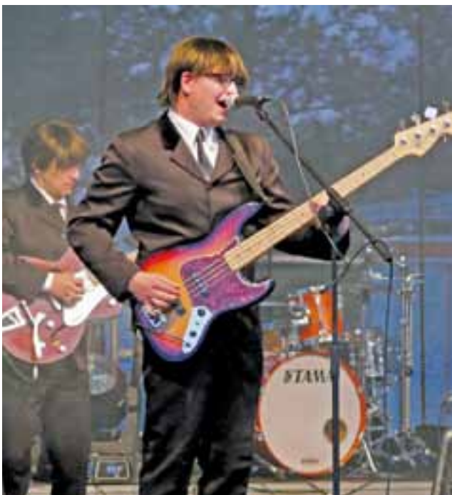
The Postman z Polkowic – jeden z najlepszych polskich zespołów grających przeboje The Beatles.

Doskonałą zabawę zapewnił też The King's Friends, jeden z najlepszych w Polsce zespołów specjalizujących się w graniu utworów Elvisa Presleya. Grupa, w której grają muzyki z łowic-