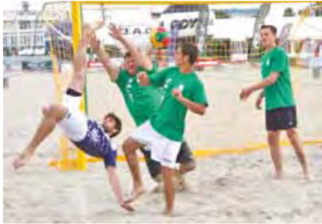
W półfinale łowiczanie byli pod ostrzałem graczy z Gdańska.

We wtorek graczom AZS przyszło rywalizować w półfinale z faworytami turnieju Uniwersytetem Gdańskim. Rywale naszpikowani gwiazdami oraz dwójką reprezentantów Polski nie dali szans łowicz-