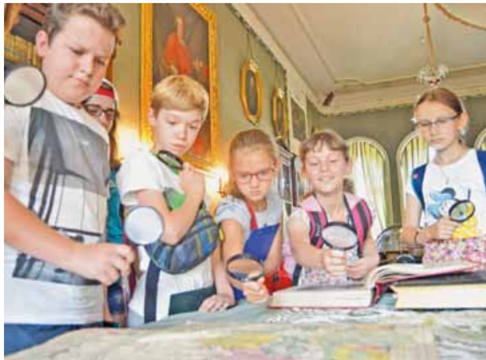
Uczestnicy warsztatów w bibliotece pałacowej, aby odczytać fragmenty starych tekstów, musieli posługiwać się lupami.

Dzieci dowiedziały się, w jaki sposób rozwijał się druk książek do czasów współczesnych, miały też do wykonania kilka zadań, w tym odczytać średniowieczne pismo, czy uzupełnić słowa w zdaniach będących wypisem tekstu ze starych ksiąg. W zajęciach udział wzięło 10 osób. Grupę najbardziej zainteresowały stare księgi z nieborowskiej biblioteki, wśród nich zaprezentowana została nie tylko Biblia Brzeska z XVI wieku, ale też np. Statuty Jana Łaskiego