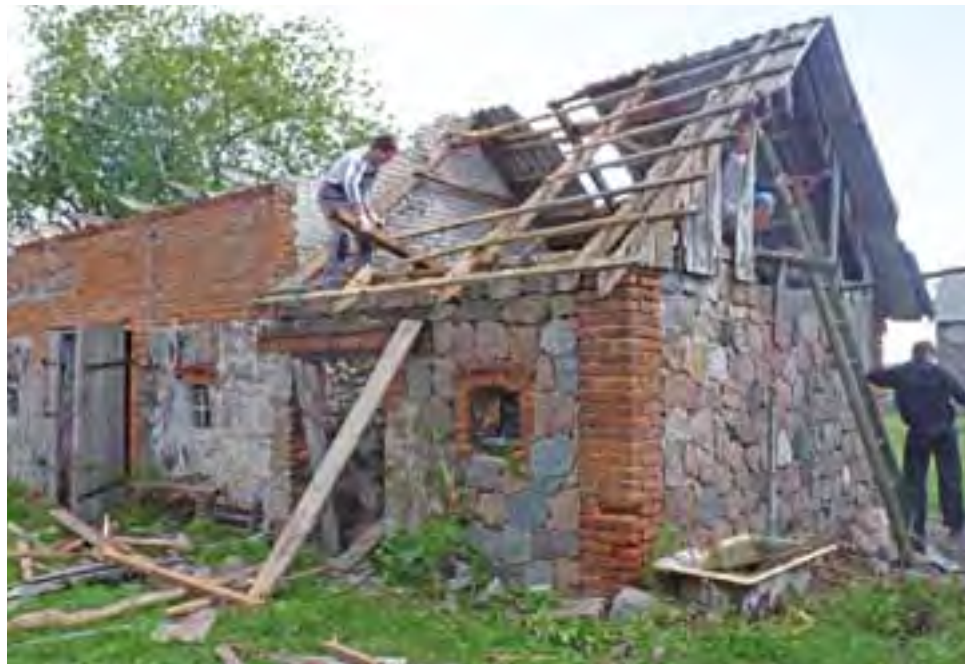
Do rozbioru. Mieszkańcy Borówka rozbierają zniszczony dach na niebezpiecznym budynku gospodarczym.

Po burzy z pomocą Brykom pospieszili przede wszystkim ich krewni ze Zgierza, pomagała też