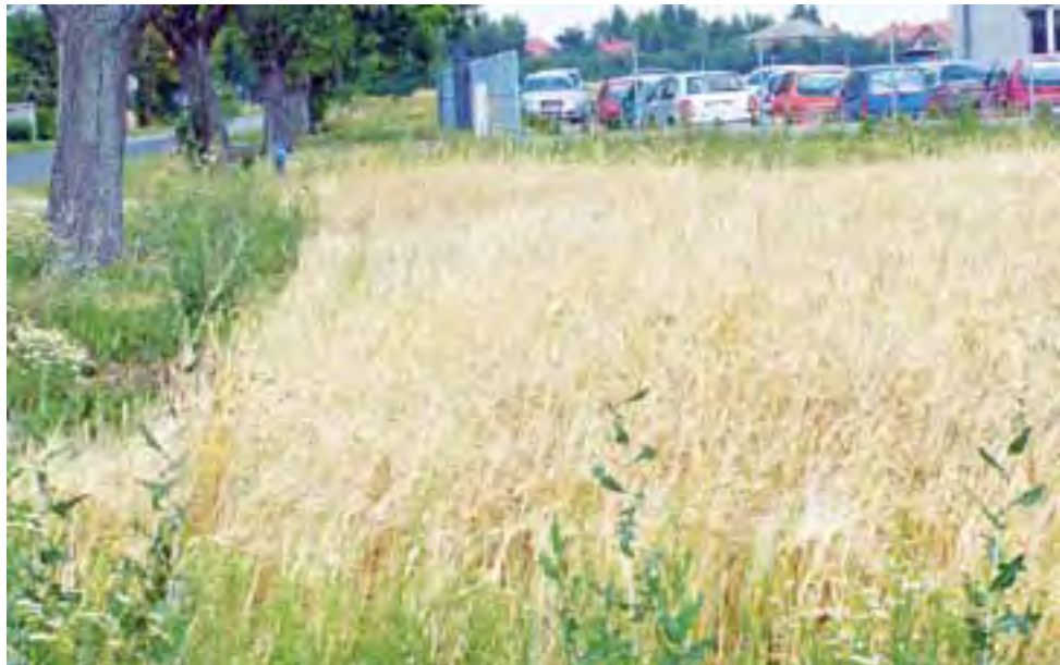
W wielu miejscach np. na polu w okolicach Strzelcewa, zboże jest dużo niższe i należy się spodziewać mniejszych plonów niż w ubiegłym roku.

Rolnictwo | Trwa nabór wniosków o szacowanie strat