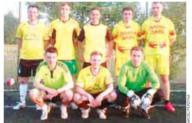
Ekipa Złakovi Złaków Kościelny w tym roku broni mistrzowskiego tytułu.