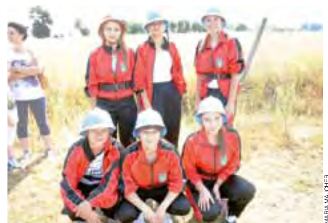
Dziewczyny z Wicia zajęły pierwsze miejsce w grupie C. Ich młodsze koleżanki też były najlepsze.

Wśród drużyn kobiecych na pierwszym miejscu znalazły się