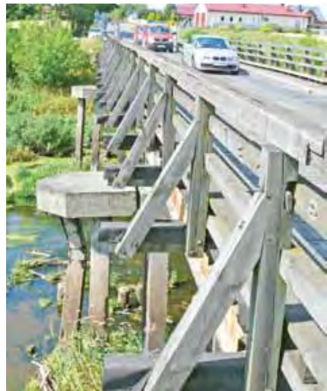
Nie tylko nawierzchnia mostu jest w fatalnym stanie, źle wyglądają także żelbetowe filary i izbyce służące do rozbijania płynącej kry.

Na pytanie innego radnego o czas realizacji inwestycji starosta odpowiedział, że most ma być udostępniony kierowcom przed rozpoczęciem roku szkolnego. Przejedźdza po nim autobus dowożący dzieci do szkół znajdujących się na terenie gminy Nieborów: w Kompinie i Bednarach. Dodał, że aby przyspieszyć realizację robot, na moście prowadzone będą prace w systemie dwuzmianowym od godz. 7 do 20. ■