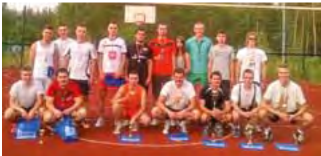
Uczestnicy Turnieju o Puchar Wójta gminy Nieborów.

Najlepiej w turnieju z przeciwnikami i z upałem poradziła sobie łowicka ekipa UKS Korabka Łowicz, która wygrała swoje wszystkie mecze. Na drugim miejscu uplasowali się siatkarze z Solidara