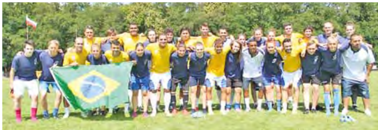
Dziewczyny Pelikana z piłkarzami z Brazylii.

Pod okiem nowego szkoleniowca trenowało w Gostyninie szesnastu zawodniczek. Dziewczyny