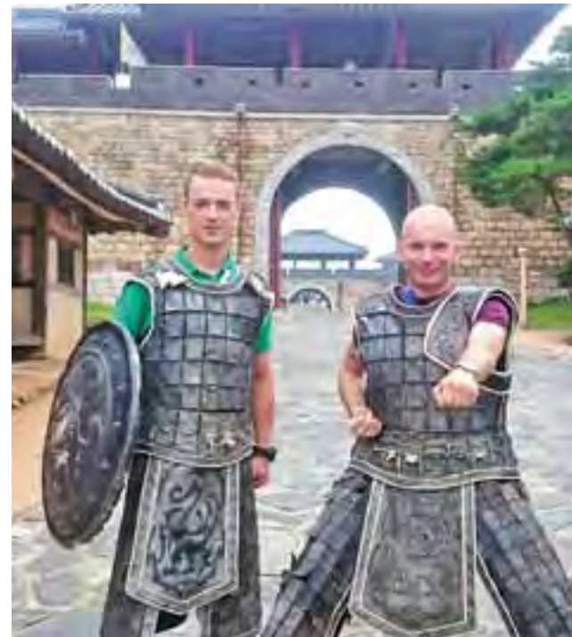
Na planie koreańskich filmów w strojach wojowników.

Korea to kraj bardzo prężnie rozwijający się, bo ludzie są pracowici. To patrioci gospodarczy. Wybierają produkty zrobione w Korei, dzięki czemu ich przemysł bardzo szybko i prężnie się rozwija. To ludzie, którzy szukają rozwiązań. Oni nie dopuszczają możliwości, żeby czegoś nie dało się zrobić. Każdy ma swój zakres obowiązków i na tym się skupia. Oni nie analizują nic ponadto, robią tylko to, co do nich należy. Chyba dzięki temu, że naród jest tak poukładany, praca przebiega w sposób efektywny. Pracownik jest wysoko wynagradzany, co go dowartościuje. Może korzystać z pieniędzy, które zarobi, kupując co chce i wy-