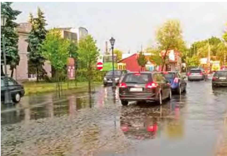
Po burzy na ul. 3 Maja powstała tak duża kałuża, że samochody omijały ją, jeżdżąc chodnikami.

Synoptycy zapowiadają, że takie sytuacje mogą się tego lata jeszcze powtórzyć. mm