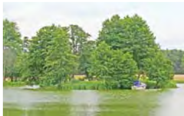
Staw w Uchaniu Dolnym to nieduży zbiornik o pow. 6,5 ha, ale bardzo malowniczy, jest na nim m.in. wyspa, na którą wędkarze będą mogli doплыć łodzią.