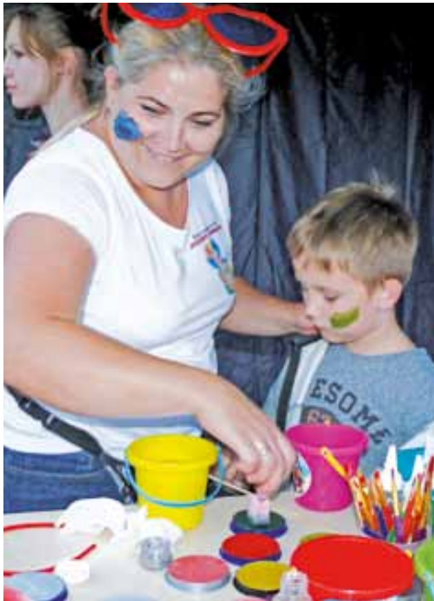
Oprócz koncertów było sporo atrakcji dla dzieci, np. dmuchańce, karuzele i stoisko, gdzie malowano twarze.

kim rodowodem, zagrała na koniec festynu. Piotr Skowroński „Skowik” wyśpiewał największe przeboje Króla Rock'nRolla, zmieniając dość często sceniczny image. Koncert zespołu zakończył się o godz. 1.00 w nocy.