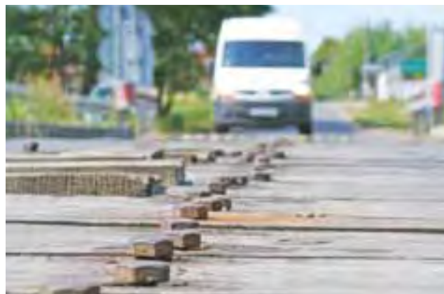
Zły stan mostu nie budzi wątpliwości – konieczny jest remont. Od ostatniej wymiany nawierzchni minęły trzy lata.

Starosta pytany przez nas o koszty prac na moście powiedział, że trudno je oszacować w tym