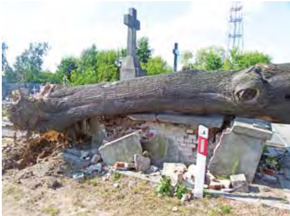
Na cmentarzu katedralnym ucierpiał kilkanaście grobów, w tym kilka zabytkowych.