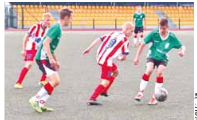
W końcówce sezonu w meczu ze Szczerbocem zabrakło skuteczności.