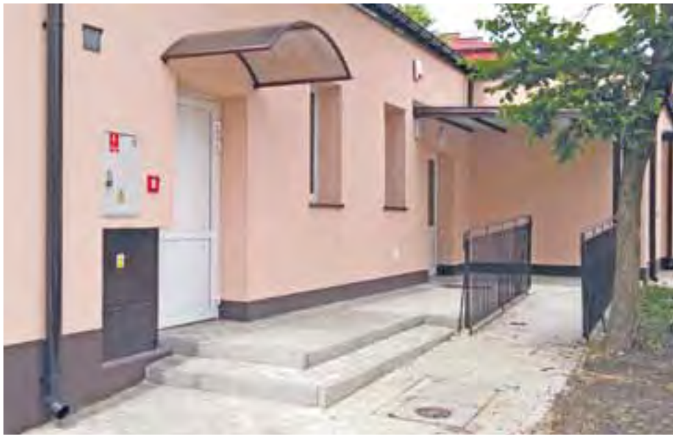
Budynek, będący dawną siedzibą MOPS, zmienił się nie tylko na zewnątrz, ale i w środku – zmieniło się także jego przeznaczenie – będzie służył bezdomnym i potrzebującym.

Dyrektor zdradził nam także plany MOPS, który chce na piętrze budynku stworzyć mieszkania chronione, dla osób, które znajdując się w trudnej sytuacji rokują nadzieję na powrót do normalnego funkcjonowania w społeczeństwie. Nad osobami tymi MOPS objąłby opiekę, pomagając im w funkcjonowaniu.