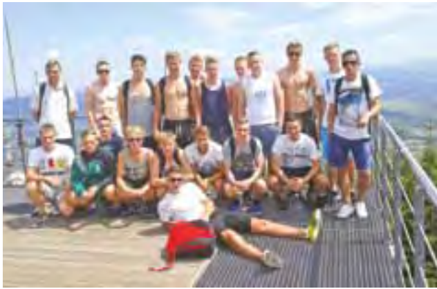
Gracze Pelikana zdobyli górę Skrzyczne.

Pelikan 1997/98 już po pierwszej rundzie sezonu będzie miał szansę na awans do I ligi wojewódzkiej, a wszystko przez nowe przepisy. Awanse i spadki w ligach wojewódzkich odbywać się będą teraz po rundach, a nie jak to miało miejsce w ostatnim czasie po zakończeniu rozgrywek. Taki system już rok temu wprowadził