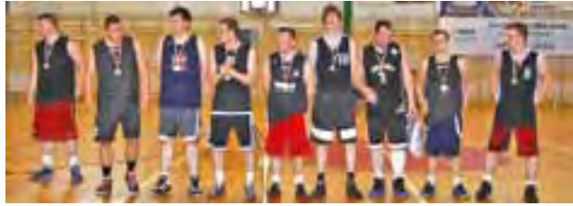
Łowicz Team wygrał ligę w Skierniewicach.

Ciekawy był finał SLK z udziałem łowickich koszykarzy, który odbył się w ostatni weekend czerwca 2015 roku. Ekipa Łowicz Team zmierzyła się z W.A.P. „Thunders” Skierniewice. Spotkanie było bardzo wyrównane, a o wyniku zdecydowała skuteczność w ostatniej minucie. Więcej koncentracji i sił zachowali zawodnicy z Łowicza, wygrywając to spotkanie 71:67. Zatem pu-