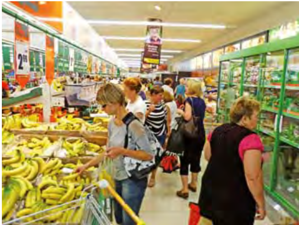
Pierwszy dzień zakupów w nowej Biedronce.