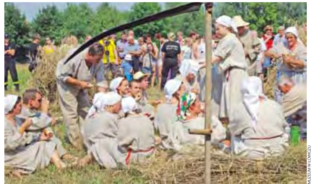
Takie sceny można było zobaczyć na Łowickich Żniwach w skansenie w ubiegłym roku.