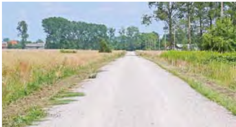
Droga łącząca Nieborów z Zygmuntem ma obecnie nawierzchnię z tłucznia.

W ramach zamówienia powstanie nawierzchnia asfaltowa o szerokości 4 m i długości 1200 m od Alei Legionów do Zygmunta. Asfalt zostanie położony na tłuczniu wysypanym już w ubiegłym roku na całej długości drogi. Dodatkowo wzdłuż drogi prze-