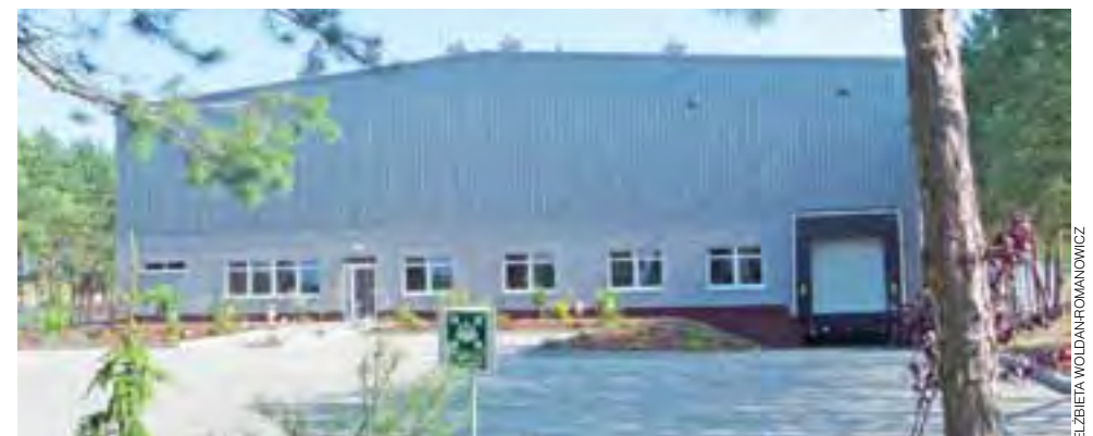
Nowa siedziba. 17 lipca, kiedy robiliśmy to foto, hala nie była jeszcze użytkowana i bez szyldu.