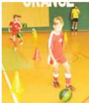
Gry i zabawy poprzedziły uroczystość w Dzierzgowku.

Oprócz tego wszystkie 100 klubów biorących udział w programie, poza wsparciem sprzętowym i technologicznym, uczestniczą również w międzyklubowej rywalizacji. Dzięki niej zespoły z poszczególnych miejscowości, mogą zmierzyć się w różnego typu wyzaniach sportowych i około sportowych. Ze względu na okres wakacyjny zostały przygotowane dwa specjalne wyzwania: Wakacje w Klubie Sportowym Orange i Pokażcie relację z wakacyjnych