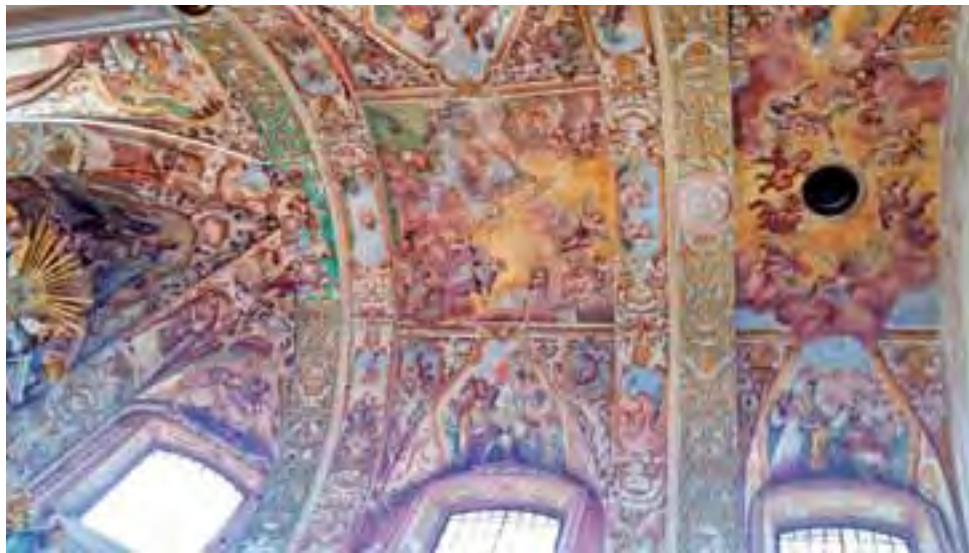
Fresk ze sklepienia prezbiterium kościoła pijarskiego zachwyca dziś barokową przestrzennością, dzięki wysiłkom konserwatorów włożonym w jego odnowienie.

Ciekawostką tegorocznych prac jest potwierdzenie obecności malowideł na łuku tęczowym (znajduje się pomiędzy ołtarzem a nawą główną), od strony prezbiterium. Najprawdopodobniej malowidło na poziomej ścianie było elementem kompozycji na skle-