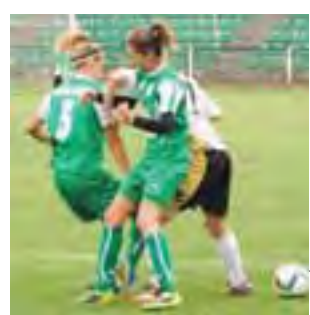
Dziewczyny przygotowania zaczęły od dwóch porażek.

W środę 29 lipca łowiczanki zagrały swój pierwszy mecz sparingowy pod wodzą nowego szkoleniowca w Łowiczu, na stadionie przy ulicy Starzyńskiej. Biało-zielone musiały na początek przygotowań pogodzić się z porażką 1:3. Lepszym rywalem okazały się zawodniczki z pierwszoligowej Sportowej Czwórki Radom. Nasza drużyna dobrze radziła sobie do przerwy, remisując 0:0. Niestety, druga połowa spotkania okazała się dużo gorsza. Rywalki zdobyły trzy bramki, a nasze dziewczyny dopiero w końcówce meczu strzeliły ho-