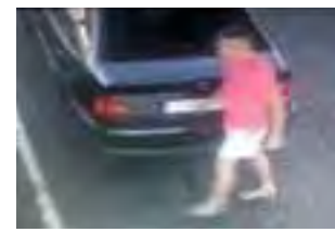
Zdjęcie z kamery monitoringu na stacji paliw przy ul. Poznańskiej.

Widząc, że sytuacja jest coraz bardziej niebezpieczna, zrezygnował z pościgu. – Żadne pieniądze nie są warte ludzkiego życia, dla-