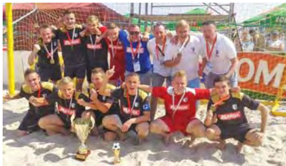
Radość zawodników Laktozy tuż po ceremonii.

Wtedy wiadomo było, że Hemako ma jeszcze kilka minut na odrobienie strat, ale mądrze grająca Laktoza dobrze wybiła rywali z rytmu i przewyższała rywali pod względem kondycyjnym. Komentatorzy NC+ nie mogli nachwalić się graczom Laktozy. Ostatecznie mecz zakończył się wygraną Laktozy 3:1 i wtedy gra-