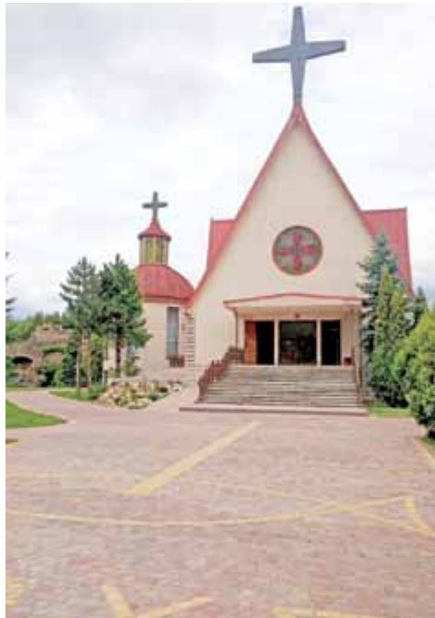
Kościół w Bobrownikach jest młody, jego historia zaczęła się bowiem w 1982 roku, ale wymaga potężnych remontów.

Oprócz tego krytycy proboszcza i Rady Parafialnej podają pod wątpliwość to, czy forma zbiórki pieniędzy przyjęta przez parafię jest zgodna z prawem. Przypominają, że parafia w Bełchowie stanęła przed sądem, któ-