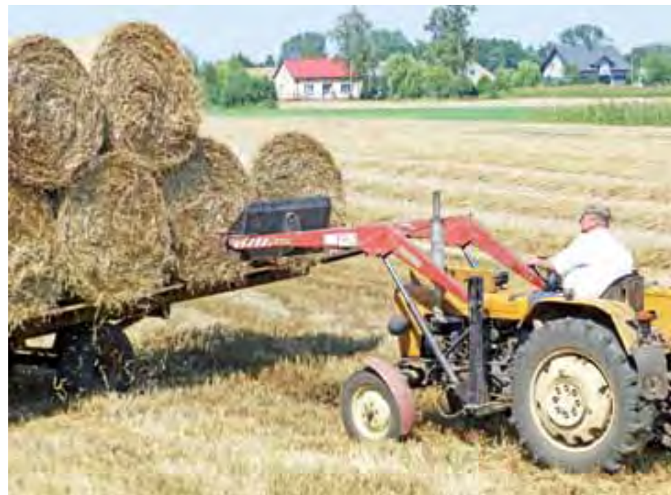
Ładowanie bel słomy na przyczepę na jednym z pól w pobliżu Soboty.

Zachęcamy do obejrzenia filmu z tegorocznych żniw na naszej stronie internetowej lowiczanie.info .