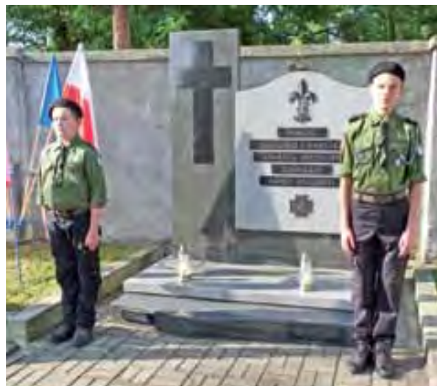
Warta pod pomnikiem. Podczas uroczystości na cmentarzu wartę pod pomnikiem Szarych Szeregów pełnili harcerze z łowickiego hufca ZHP.

Łowickie obchody 71. rocznicy wybuchu powstania warszawskiego rozpoczęły się oczywiście punktualnie o godz. 17.00, kiedy nad miastem, jak co roku o tej porze, rozległy się głosy syren alarmowych i dźwięki kościelnych dzwonów. Orkiestra odegrała hymn państwowy, po czym głos