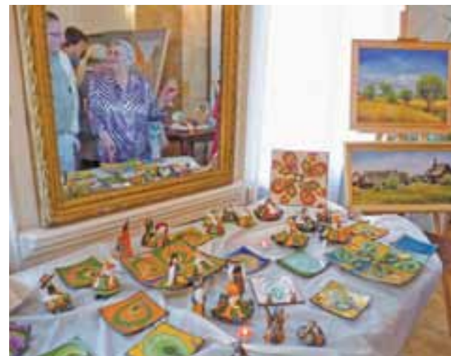
Sielsko – łowicko. Tutaj najbardziej folkowa część wystawy.

Już w szkołach zwracano mi uwagę, że być może coś potrafię, ale nie było sprzyjających okoliczności, bym kształciła się w tym kierunku.