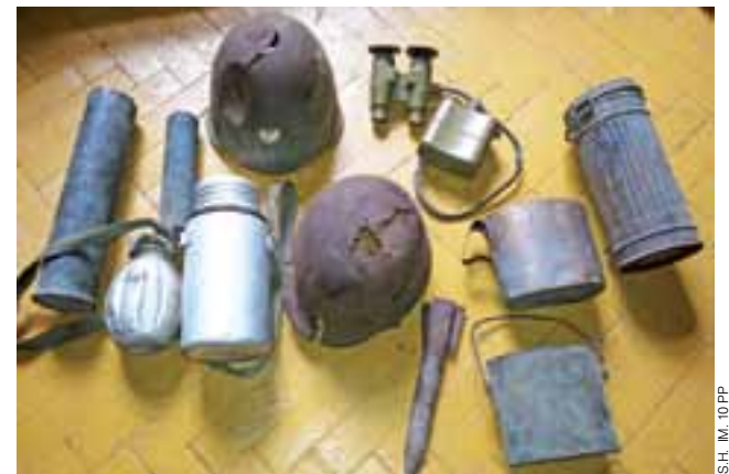
Przedmioty, które trafiły do Dziesiątaków od prywatnego przedsiębiorcy.