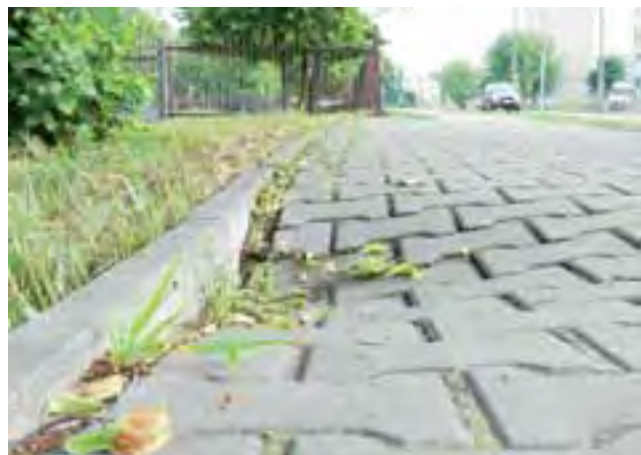
Tak pofalowany chodnik nie jest bezpieczny ani dla dorosłych, ani tym bardziej dzieci, które codziennie chodzą po nim do przedszkola.

Możliwe, że zadolenia pojawiły się w miejscu, gdzie kilkanaście lat wcześniej ułożono sieć ciepłowniczą, ale w trakcie prac w sposób niewystarczający zagęszczono ziemię. tb