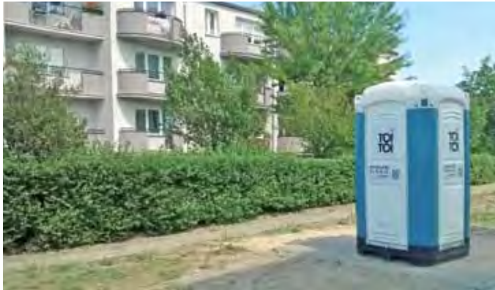
Widok z balkonu wprost na ubikację... Trudno się dziwić, że mieszkańcy tego bloku nie są zadowoleni z lokalizacji TOI TOI.

Według niektórych z nich postawienie jej pomiędzy drzewami rosnącymi pomiędzy blokiem numer 14 a siatką zmodernizowane-