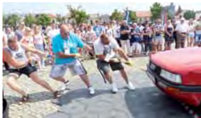
W konkurencji przeciągania VAG-a wystąpiło pięć drużyn, a wygrała 3-osobowa ekipa „Szwagrów” z Łowicza.

Nagrodami we wszystkich konkurencjach były pakiety gadżetów łowickich od Urzędu Miejskiego, kosmetyki samochodowe, kilka par skarpet firmy Steven oraz pamiątkowe tabliczki zlotowe.