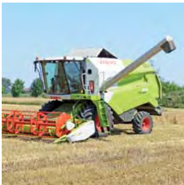
Claas Tucano 320 – jeden z popularnych obecnie modeli kombajnów.