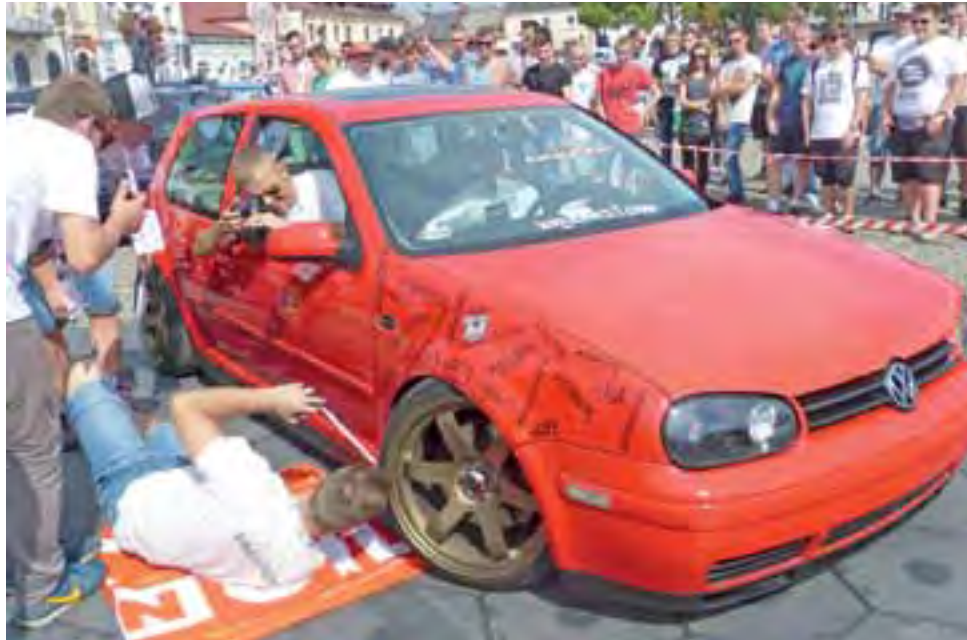
Do konkurencji zwanej „glebą” – czyli mierzenia jak najniższego zawieszenia, zgłosiło się kilkanaście samochodów, a wygrał kierowca z Głowna.

Konkurencja „Air Ride” była to rywalizacja na najszybsze zawieszenie pneumatyczne w aucie. Samochody ustawione naprzeciw siebie uruchamiane pilotem miały podniesiony i kolejno opuszczany przód auta, potem tył, następnie całość do góry i całość do dołu. Ustawione naprzeciw siebie pojazdy po prostu skakały w rytm muzyki lecącej z głośników. W finale zwycięzcę wyłoniła publiczność,