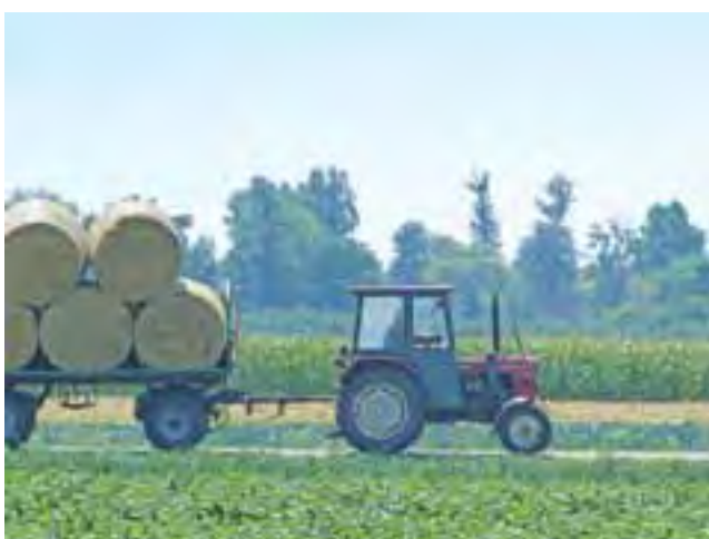
Zwożenie słomy – nieodłączna część każdego żniwa.