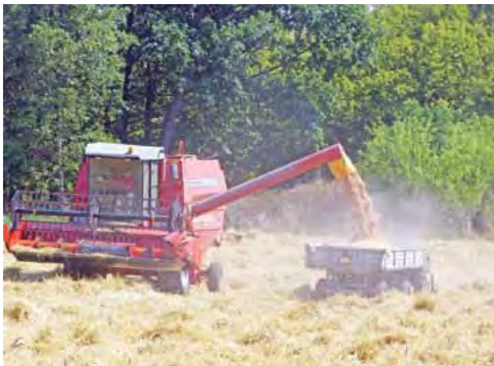
Przesypywanie ziarna z kombajnu na przyczepę.