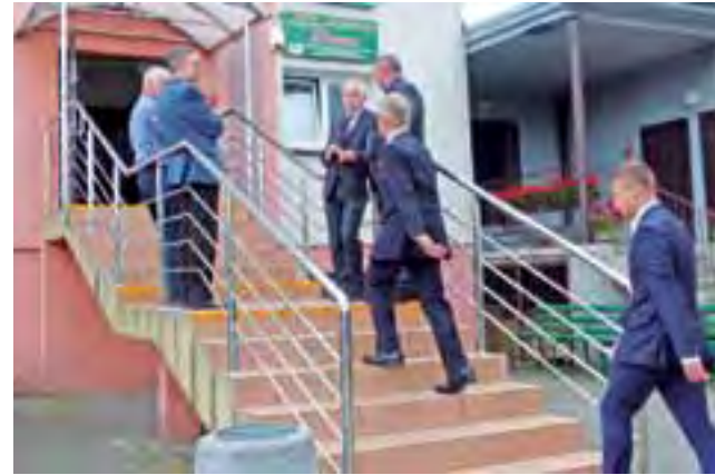
Kiedys przy Kaliskiej 5 mieścił się Ośrodek Szkoleniowo-Konferencyjny, teraz ma być Centrum Rozwoju Lokalnego.

Procedura wymaga najpierw zwrócenia się do organu, który podjął uchwałę – w tym przypadku Rady Miejskiej w Łowiczu –