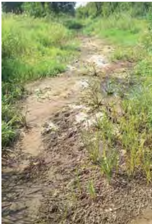
Jeśli ktoś by twierdził, że w Łowiczu i okolicznych wsiach susza nie jest groźna, oto rzeka na Otolicach – napisał do nas mieszkaniec Otolic i nadesłał zdjęcie czegoś, co było Otolanką.