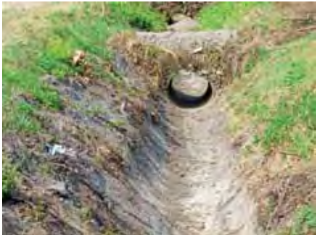
Całkowicie suchy rów melioracyjny na polu w gminie Zduny.