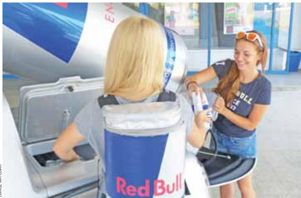
Dziewczeta z „Wings team” wyjmują zimne napoje z lodówki. Zdjęcie przed wejściem głównym do Syntexu.

Możliwości, które daje Program Rozwoju Obszarów Wiejskich będą tematem szkolenia dla rolników, na które zapraszają Agencja Restrukturyzacji i Modernizacji Rolnictwa oraz ODR w Bratoszewicach. Odbędzie się ono 18 sierpnia o godzinie 10.00 w sali konferencyjnej starostwa. Poruszone będą takie zagadnienia jak: premie dla młodych rolników, modernizacja, inwestycje w gospodarstwach położonych na obszarach OSN. Wstęp wolny. tm