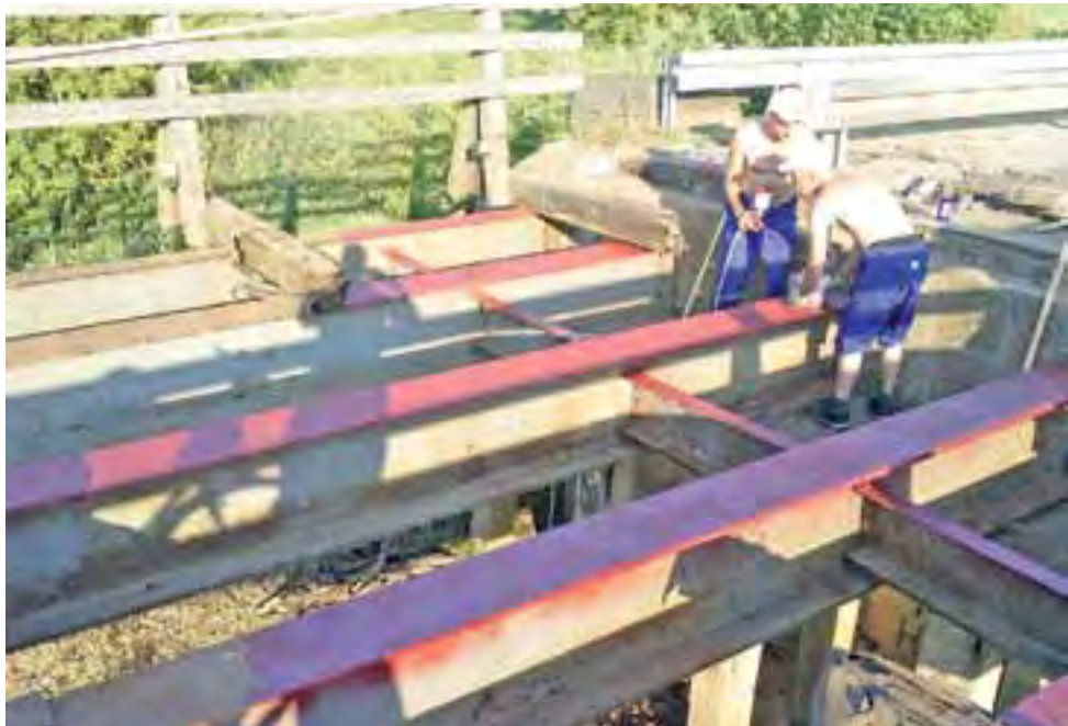
Przeście z rowerem po stalowych dźwigarach, które pozostają po rozebraniu nawierzchni, nie jest bezpieczne.