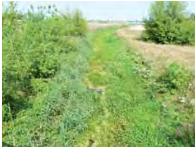
Ten pas zieleni to Studwia w okolicach Maurzyc.

Okolice Łowicza | Rekordowo niskie stany wody