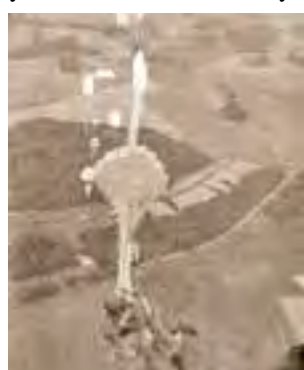
Desant spadochronowy z samolotu AN-26.

Klub stawia sobie za cel integrację środowiska byłych żołnierzy WPD w kraju i za granicą, objęcie troską miejsc pamięci narodowej związanych ze służbą oraz szkoleniem jednostek powietrznodesantowych WP, upowszechnianie i kultywowanie tradycji oraz obyczajów tych oddziałów, opracowywanie i wydawanie w formie