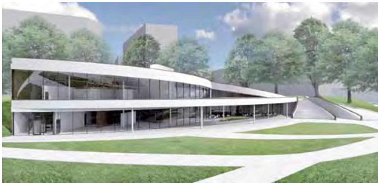
Projekt budynku w kształcie rozwijającej się lilii z zewnątrz, wizualizacja.

– Jest to naprawdę duże przedsięwzięcie, dlatego zaczęłam szu-