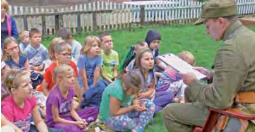
Jeden z dziesiątaków czytał uczestnikom warsztatów w Otolicach bajkę, w której odnaleźć mieli jak najwięcej wyrazów opisujących emocje.