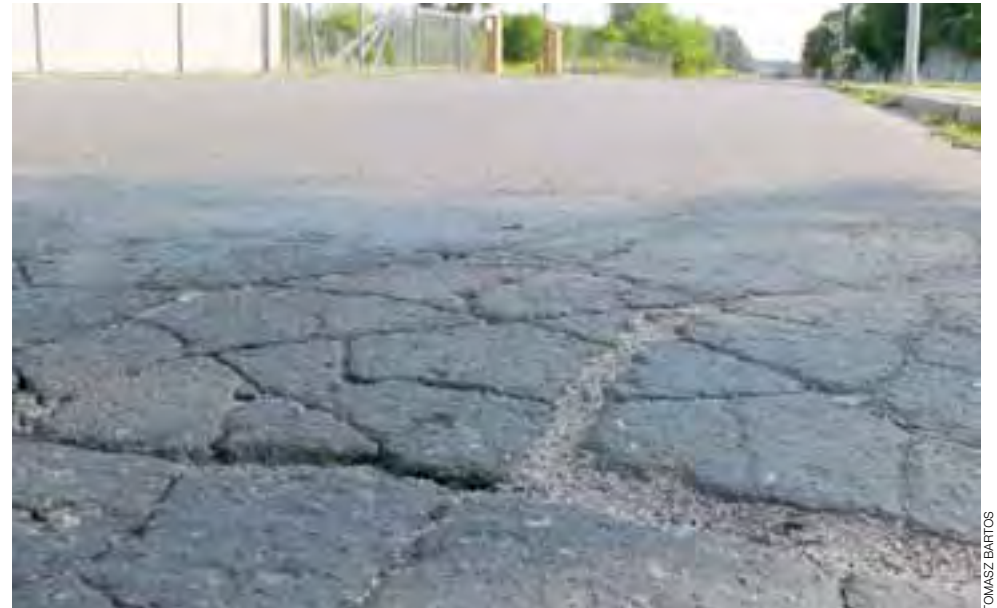
Spekany asfalt na fragmencie ul. Wiejskiej, po kolejnej zimie można się spodziewać w nim głębokich dziur.

z dotacji przekazywanej przez łowicki ratusz na bieżące utrzymanie dróg. W tym roku ZUK otrzymał z ratusza na ten cel 600 tys. zł. Pieniądze te są wydawane na łatanie dziur po okresie zimowym, naprawy chodników oraz odfekowanie. Ze względu na tegoroczną łagodną zimę udało się zaoszczędzić około 100 tys. zł. Jednak 600 tys. zł to zbyt mało, aby w pełni zadbać o około 100 kilometrów miejskich dróg. Część możliwych do wydania pieniędzy ZUK zain-