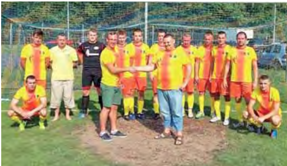
Drużyna Pogoni Belchów zajął drugie miejsce w turnieju.

W finale było bardzo ciekawie. Pogoń po pierwszych ośmiu