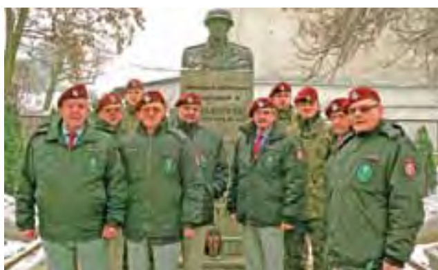
Członkowie Klubu przy pomniku Generała Sosabowskiego w Krakowie.

książkowej w ramach projektu „Biblioteczka ZPS” wspomnień żołnierskich z lat służby w WPD, wreszcie uczestniczenie w świętach jednostek Wojsk Powietrznodesantowych i Kawalerii Powietrznej oraz kolekcjonowanie,