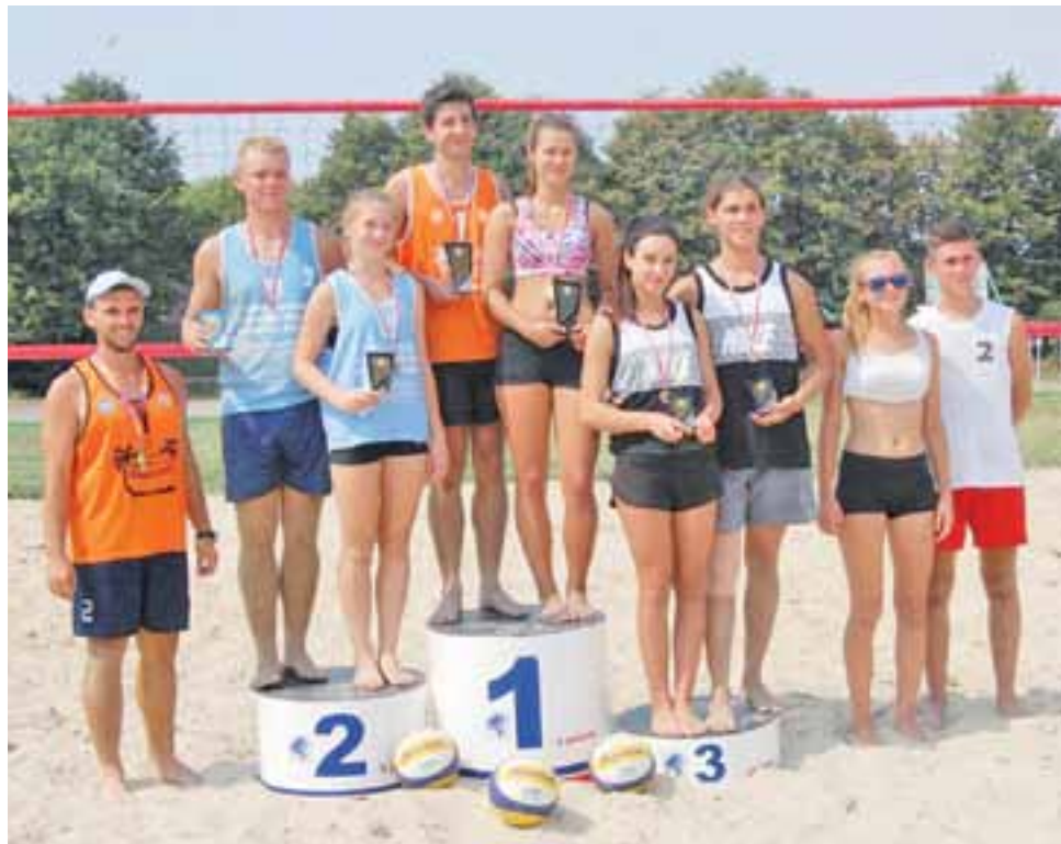
Nagrodzone pary niedzielnego upalnego turnieju.