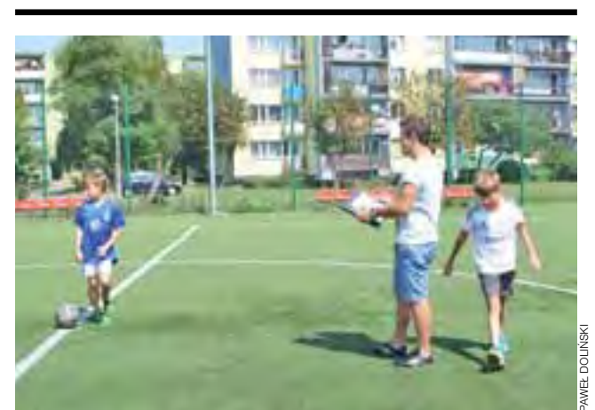
Dwójka odważnych spróbowała swoich sił w Turbo Kozaku.

Nasi sportowcy pokazali, że nie tylko są specjalistami od jazdy na łyżwach ale także i bardzo dobrymi kolarzami. W sezonie wiosenno-jesiennym trening na rowerze i rolkach zastępuje panczenistom jazdę na łyżwach.