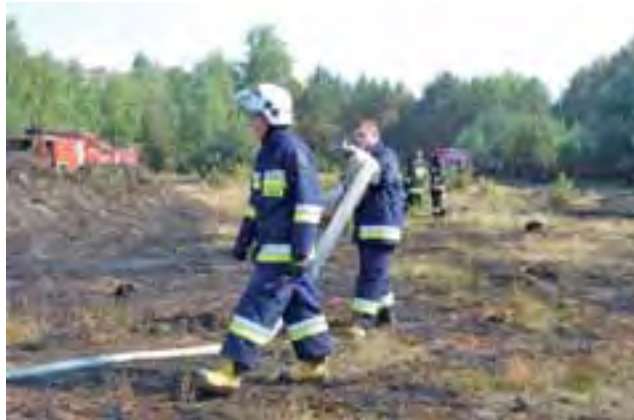
Strażacy tuż po zakończeniu interwencji.

Pożar osaczył teren z trzech stron i stanowił zagrożenie dla pobliskich gospodarstw. W pewnym momencie zaczął wdzierać się na teren ogrodzonych posesji. Dowódcy niezwłocznie podzielił teren na odcinki bojowe i przystąpili do gaszenia. Po dokładnym polaniu terenu wodą, nadzór nad pogorzeliem przejął przedstawiciel nadleśnictwa Skierniewice. Akcja trwała około 3 godziny.