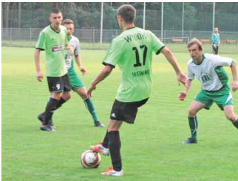
Orzeł grał nieskutecznie w starciu z Widokiem.