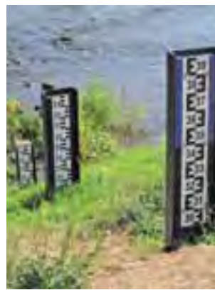
Najniższy z wodowskazów na Bzurze zwykle jest zakryty lustrem wody. Teraz stoi w błocie.

– Bzura ma niewiele źródeł, które mogą ją zasilić, a niektóre dopływy prawie wyschły – mówi.