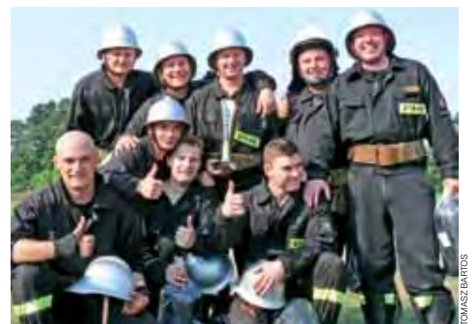
Radość z wygranej drużyn z OSP w Łasiecznikach była ogromna. Nie należą do dużej i bogatej jednostki, ale mają ambicje bycia najlepszymi w gminie, marzą teraz, by być na I miejscu w powiecie

„Ciężko pracowaliśmy” oznacza w ich przypadku konkretnie, że od kwietnia strażacy z Łasiecz-