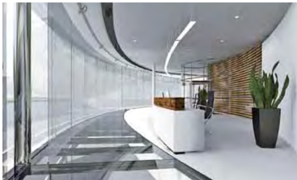
Hala wystawowa EXPO od środka. Oprócz pomieszczeń wystawowych, w budynku będzie też miejsce na kawiarnię i sale konferencyjne, wizualizacja.

Łódź, jako pretendent do zorganizowania Expo International 2022, konkurować będzie m.in. z Newcastle, Kopenhagą i Wyspami Kanaryjskimi. Międzynarodowe Biuro Wystaw Światowych podejmie decyzję, czy to właśnie Łódź zostanie gospodarzem tych targów najprawdopodobniej na początku 2017 roku. ■