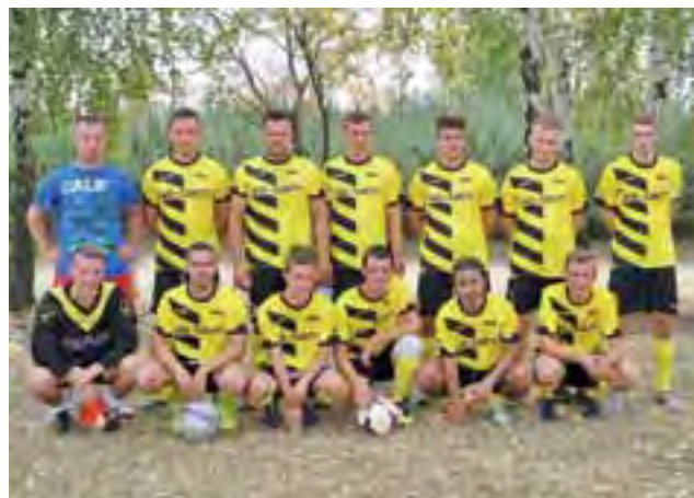
Gracze Meteoru przegrali z Sokółem Popów 0:1.