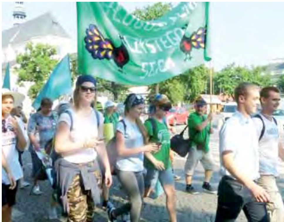
Zieloni z Łowicza na pielgrzymkę idą z 7 duchownymi.

Za nimi, w niewielkich odstępach, podążały kolejne grupy, w których idą w tym roku z 7 księżmi tradycyjnie Zieloni z Łowicza, Cytrynowi z Żychlina, Fioletowi ze Skierniewic, Czerwoni z Żyrardowa, Biało-Złoci z Kutna, Biali z Łęczycy i Brązowi z Rawy Mazowieckiej.