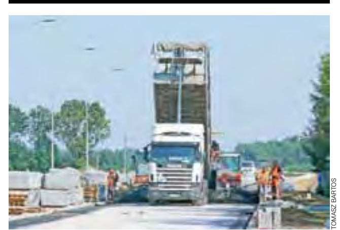
W środę układano pierwszą warstwę asfaltu na ul. Piłsudskiego.

Funkcjonariusze prowadzili czynności na miejscu zdarzenia. Rozmawiali z krewnymi zmarłego, pytali sąsiadów. Śledztwo jest w toku. aa