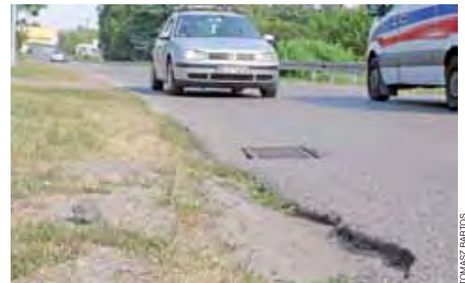
Takie kraty na łuku ul. Arkadyjskiej są dwie, rowerzysta aby je ominąć musi odjechać na metr od krawędzi jezdni, często ryzykując życiem.

Wówczas rowerzyści w ogóle nie wyjeżdżaliby na ul. Arkadyjską, można byłoby pozostawić studzienki w obecnym miejscu lub pokusić się o przesunięcie ich poza pas jezdni, tworząc przy nich utwardzone trapezowate zatoczki. To z pewnością poprawiłoby też komfort jazdy kierowcom samochodów, którzy często muszą na nie wjechać, zwłaszcza, gdy z naprzeciwka jedzie inny samochód. Naczelnik Gawroński w rozmo-