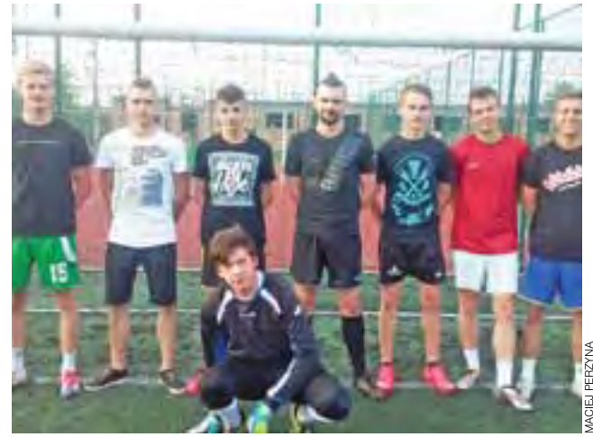
Czarny Koń może okazać się naprawdę czarnym koniem

■ Kolorowe Jarmarki – Czarny Koń tego wyścigu 3-5 (2-2); br.: