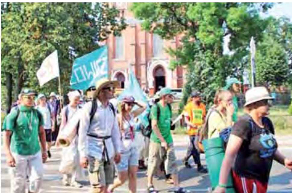
Łowiczanie akcentowali swoją obecność na szlaku transparentami i śpiewem na nutę łowicką.

Nasi rozmówcy jednogłośnie podkreślali, że żar lejący się z nieba nie przeszkadzał im w pielgrzymowaniu. Stało się wręcz przeciwnie – słońce nadało wędrówce kolorytu. ■