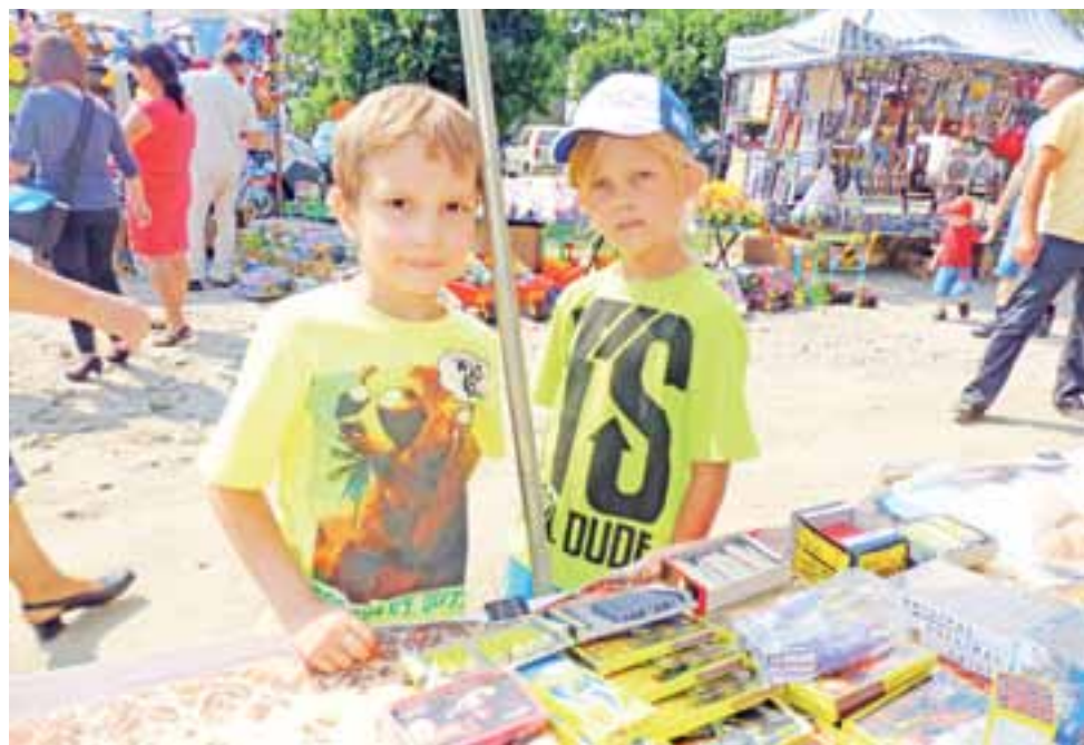
Atrakcją dla dzieci zawsze są odpustowe stragany.

Zapraszamy do obejrzenia galerii zdjęć na stronie www.lowiczanie.info