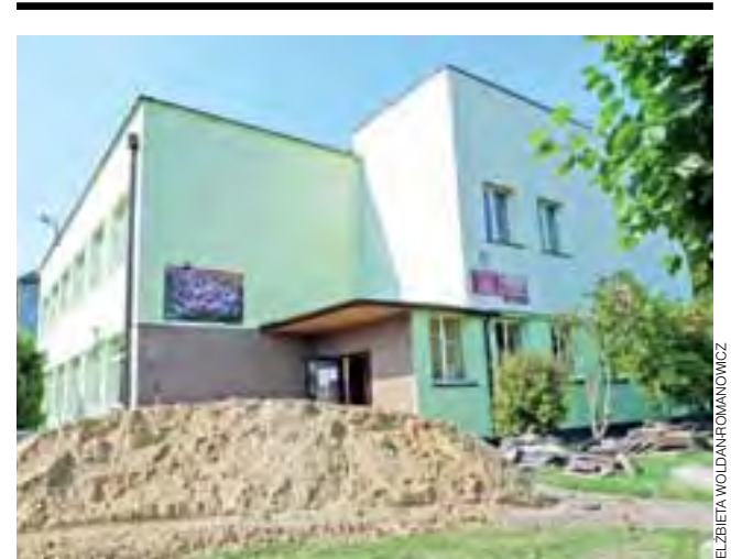
Będzie cieplej i równiej. W lipcu docieplono północną i południową ścianę szkoły w Sobocie, w sierpniu ułożona zostanie kostka brukowa.