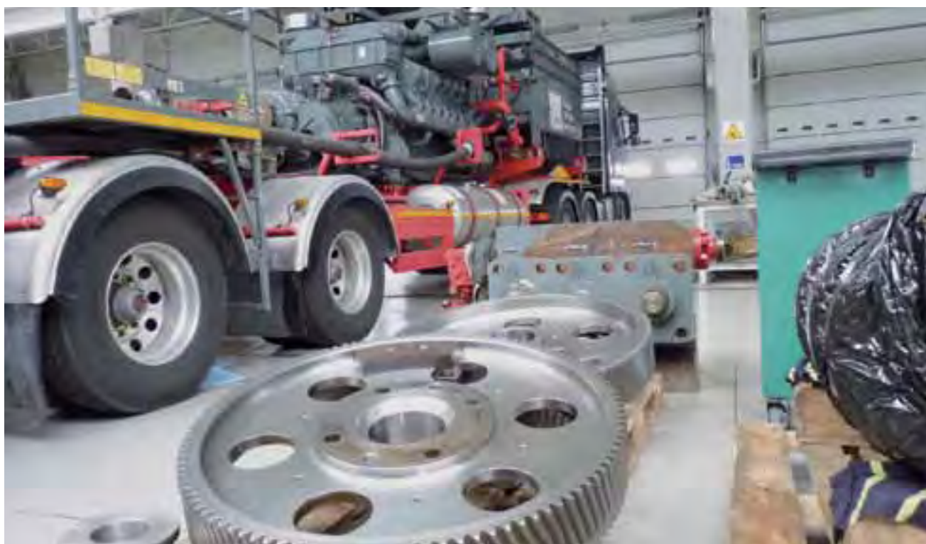
Takich prac, konserwacyjnych i naprawczych, miano w bazie w Łowiczu wykonywać sporo. Na razie nie ma czego naprawiać.

Bowiem usytuowanie bazy w Łowiczu nie ogranicza, zdaniem rzeczownika firmy, jej pola działania wyłącznie do Polski. Przeciwnie, jesienią udzielane być mają kolejne koncesje poszukiwawcze w Wielkiej Brytanii i UOS liczy na zlecenia stam-