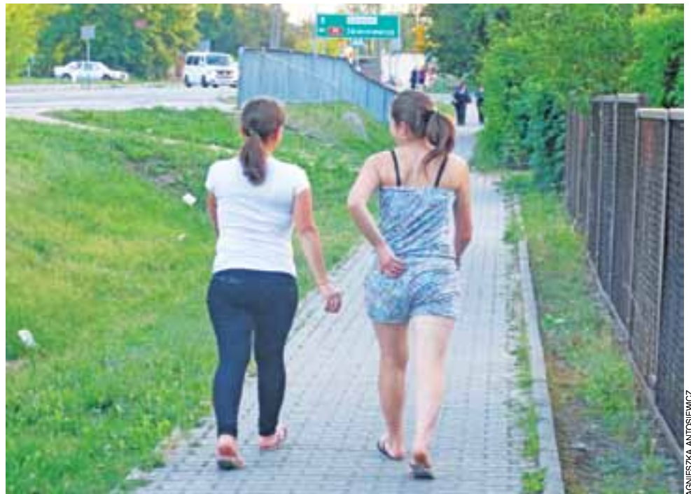
Codzienna trasa: z hotelu do Biedronki przy Warszawskiej. Tam robotnicy i robotnice zza Bugu są bardzo częstymi gośćmi.

Niestety i tam zabrakło mu szczęścia. Tokarka wciągnęła i zgmiotła mu rękę. Z zakładu został przetransportowany helikopterem do szpitala. Za operację musiał dużo zapłacić, gdyż nie posiadał ubezpieczenia. Długo trwało, zanim doszedł do siebie i odzyskał sprawność.