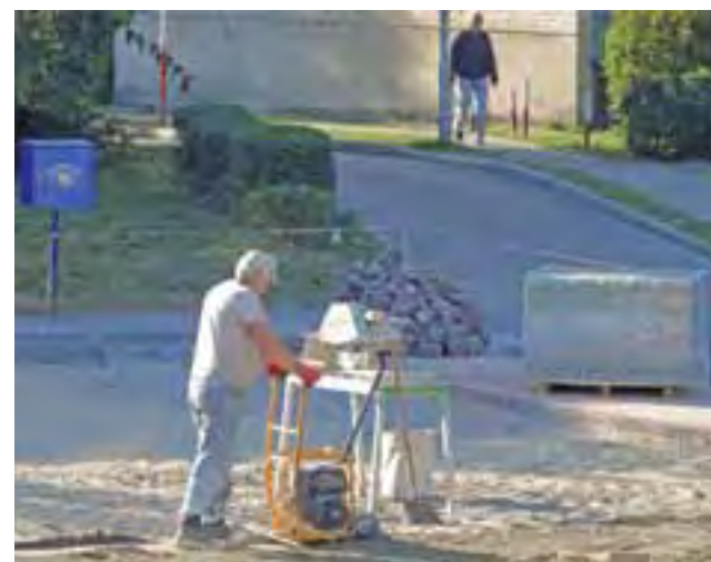
W tym roku na Dąbrowskiego powstaje nieduży parking, za rok przebudowana zostanie nawierzchnia sąsiadującej z nim drogi.

Ponadto spółdzielnia będzie rozważać wybudowanie na wolnym placu pomiędzy wspomnianą górką a istniejącym placem zabaw dla najmłodszych czegoś w rodzaju ścieżki zdrowia, czy też miejsca do rekreacji, z modnymi ostatnio urządzeniami do treningów na świeżym powietrzu. Decyzje w tej sprawie jeszcze jednak nie zapadły, a temat był jedynie poruszany podczas spotkania zarządu osiedlowego.