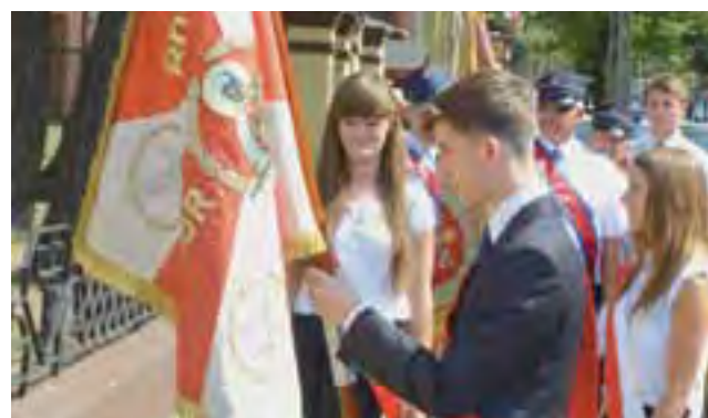
Cześć marszałkowi i wszystkim poległym oddała też młodzież. Na zdjęciu hołd oddaje reprezentacja Zespołu Szkół Ponadgimnazjalnych nr 1.

tych parafii, które noszą wezwanie Wniebowzięcia NMP.