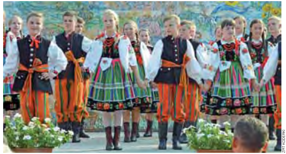
Koderki na Węgrzech dały trzy występy, każdy po 20 minut.

– Była to zasłużona nagroda dla członków zespołu. Ciężko pracowali przez 10 miesięcy i zasłużyli na wakacje i wypoczynek – podsumowała choreograf Katarzyna Polak. mm