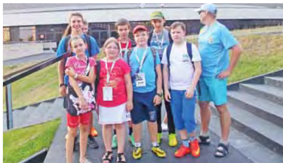
Ekipa „Pałac” przed katowickim Spodkiem.

Piłka nożna | Przed meczem Świt – Pelikan Spotkanie starych, dobrych (?) znajomych