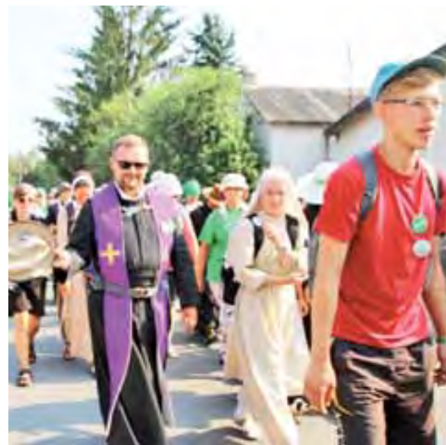
W grupie Zielonej szło aż 7 księży, 6 siostr zakonnych i kleryk.