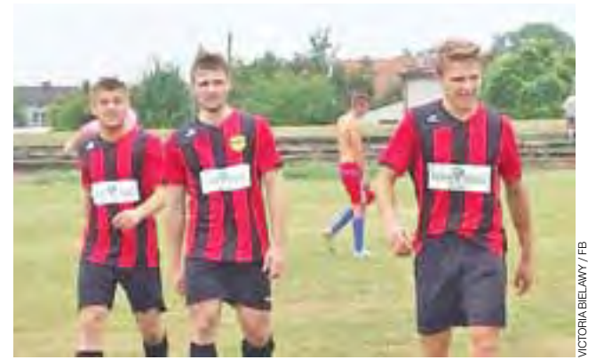
Gracze z Bielawy sprawili sporą niespodziankę.

■ Niedziela, 23 sierpnia: Rawka Bolimów – Czarni Bednary (11:00); Sierakowianka Sierakowice – Olimpia Niedźwiada (15:00); GLKS Wołuczka – Dar Placencja (16:00)