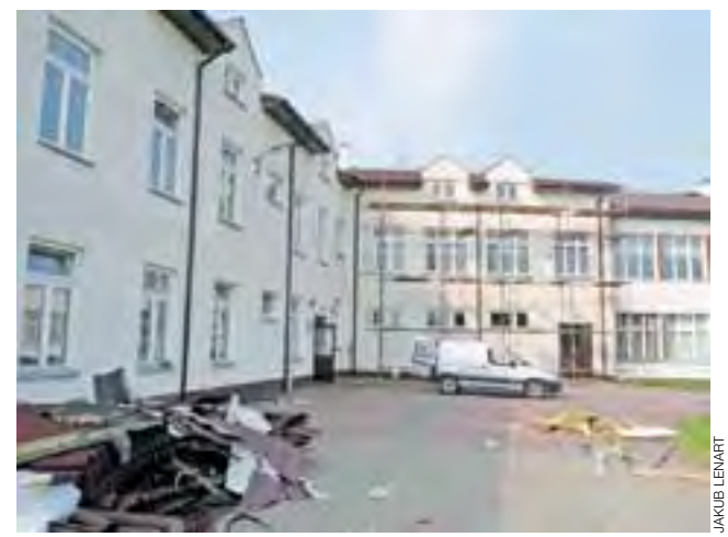
W domaniewickim gimnazjum trwa właśnie proces wymiany na nową blachy na dachu. Prace wykonuje domaniewicka firma Tom-bud. Powinny się one zakończyć najpóźniej do 27 sierpnia. Remont dachu kosztować będzie około 100 tys. zł. kl