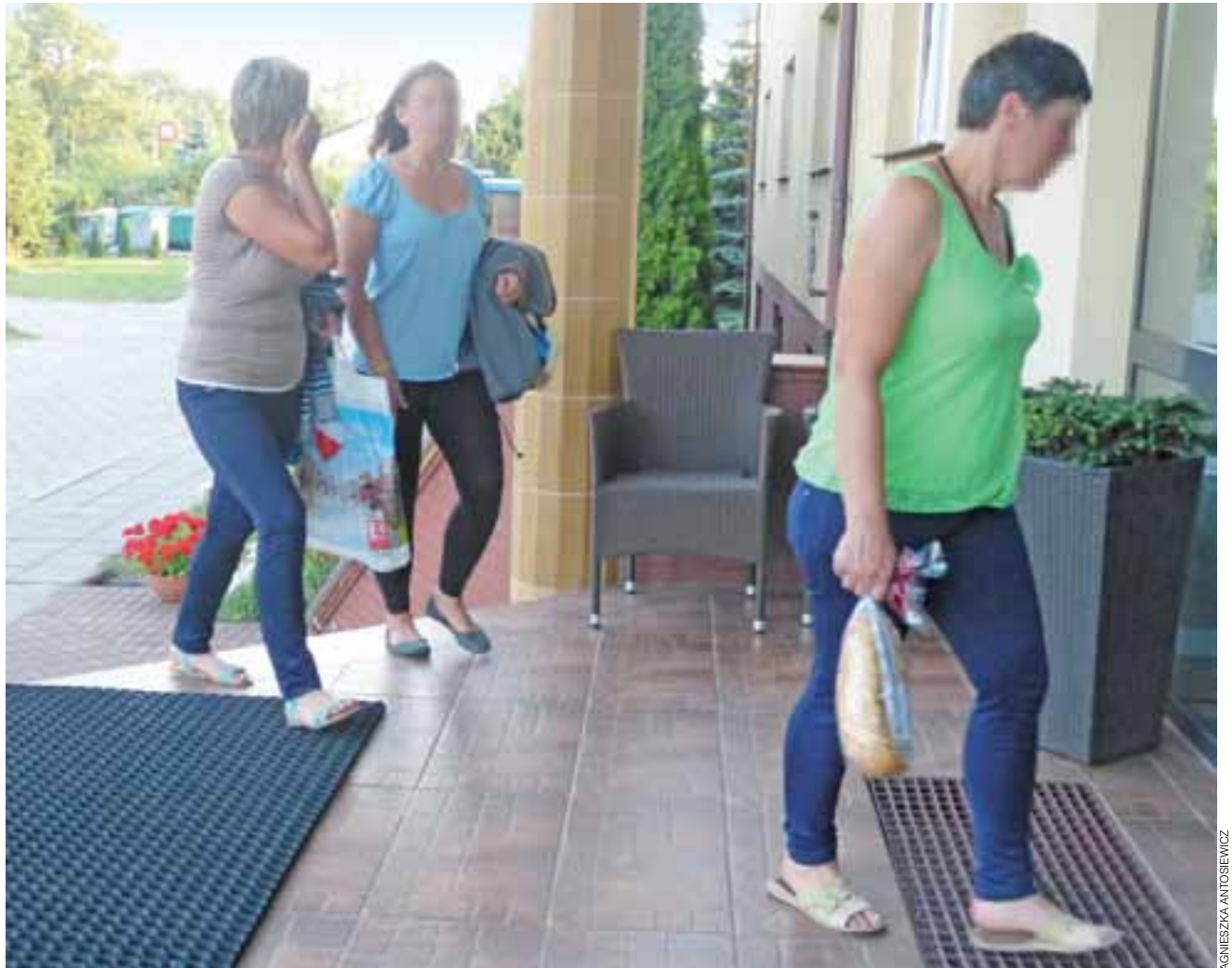
Już po pracy – i po zakupach. Ukraińki wracają do hotelu Łowicz.

Okolo 90 Ukraińców zatrudnia obecnie firma Bracia Urbanek. W większości są to kobiety, które w trakcie sezonu ogórkowego pracują na taśmie przy napełnianiu słoików. Ale nie brakuje też mężczyzn. Bywa, że są to małżeństwa, matki z córkami lub ojcowie z synami. Po pewnym czasie sprowadzają kolejne osoby z rodziny. – Kiedyś mieliśmy około 500-600 chętnych do pracy w sezonie, z czego jakieś 400 osób faktycznie zatrudnialiśmy. Teraz liczba chętnych do prac sezonowych spadła do 200, z czego do pracy przychodzi