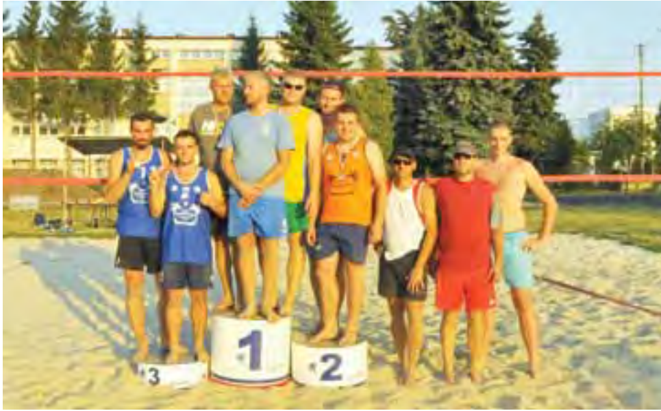
Siatkarze ŁAGS w dobrych nastrojach po zakończonym turnieju.

Turniej odbył się na dwóch boiskach ILO w Łowiczu przy ulicy Bonifraterskiej. Do rywalizacji przystąpiło 11 osób. Sam pomysł na przebieg tych wewnętrznych mistrzostw był ciekawy. Zawodnicy nie mogli dobrać się w pary sami, tylko zdani byli na dar losu. Po losowaniu par zagrano systemem „każdy z każdym”, czyli w sumie przeprowadzono 10 spotkań. Ciekawostką był fakt, że nie było sędziów w tej walce. Oczywiście nie obyło się bez drobnych sprzeczek, ale w sytuacjach trudnych decydowano się na powtórzenie akcji. Poziom rywalizacji był bardzo wyrównany i wię-