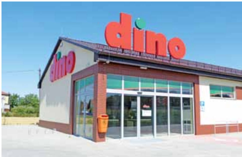
Budynek jest gotowy już od wiosny, inwestor czeka na pozwolenie na użytkowanie.

– Nic z tych rzeczy, ale sprawa nie jest prosta – zapewnia nas w urzędzie gminy.