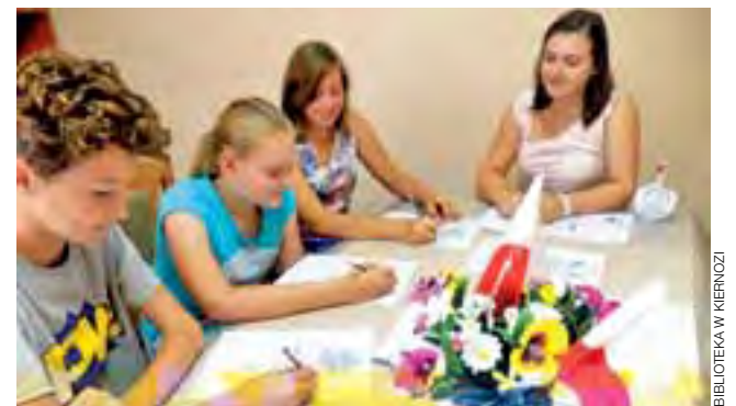
Podczas zajęć można było nauczyć się rysować np. róże, oczy, zwierzęta – według określonych etapów i zasad.

Dzieci i młodzież odwiedzające bibliotekę czynnie brały w nim udział, każdego dnia było po kilka osób. W ramach zajęć powstały prace, które uczestnicy mogli zabrać do domów, żeby pochwalić się swoimi dokonaniem. Rysowa-