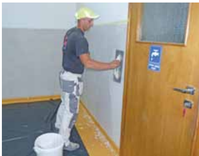
Obecnie trwają prace na korytarzach przedszkola.

Remont zrealizowany zostanie ze środków własnych przedszkola i organu prowadzącego, czyli diecezji łowickiej. W ubiegłym tygodniu trwały prace przygotowawcze, do końca wakacji ma zostać