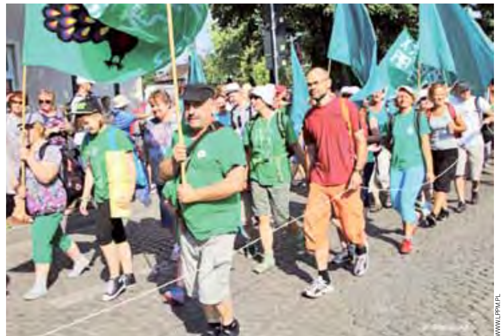
Mimo upałów pątnicy dzielnie pokonywali kolejne kilometry.

Połowa Grupy Zielonej jeszcze tego samego dnia powróciła autokarem do domów. Pozostali