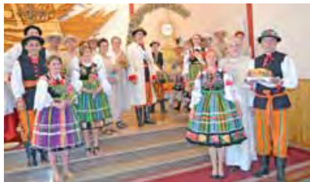
Na mszy świętej uczestnicy prezentowali się w tradycyjnych ludowych „pasiakach”, ale też w strojach żniwiarzy.

Po mszy, przy kościele, zorganizowano rodzinny piknik. Szczególnie dużo frajdy miały dzieci, których bawiło się ok. 300. Miały do dyspozycji dmuchane baseiny z kulami wodnymi, trampoliny i zjeżdżalnie, a także sztuczne