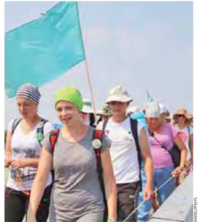
Nakrycie głowy było jednym z ważniejszych elementów stroju pątnika.

Łowicz | XX Łowicka Młodzieżowa Pielgrzymka na Jasną Górę