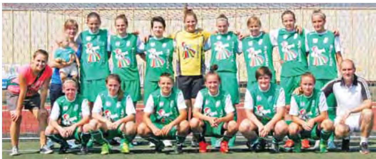
Ekipa Pelikana Łowicz w pełni gotowa do sezonu.

Pierwszy mecz w tym sezonie łowiczanki zagrają w Łodzi z drugim zespołem UKS SMS. Liczymy na udaną wyjazdową inaugurację i trzymamy mocno kciuku za nasze dziewczyny. zł