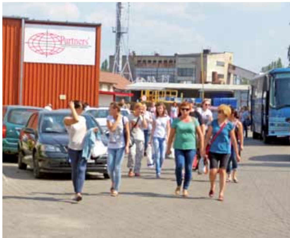
Kilka minut po godzinie 14. Pierwsza zmiana wychodzi z „Partnersa” – Polacy i Ukraińcy razem.

Imiona bohaterów tekstu zostały zmienione na ich prośbę. Wszystkie opisane historie są prawdziwe, zostały opowiedziane przez Ukraińców i ich bliskich współpracowników. Na ich prośbę nie wymieniam też zakładów pracy, w których są zatrudnieni.