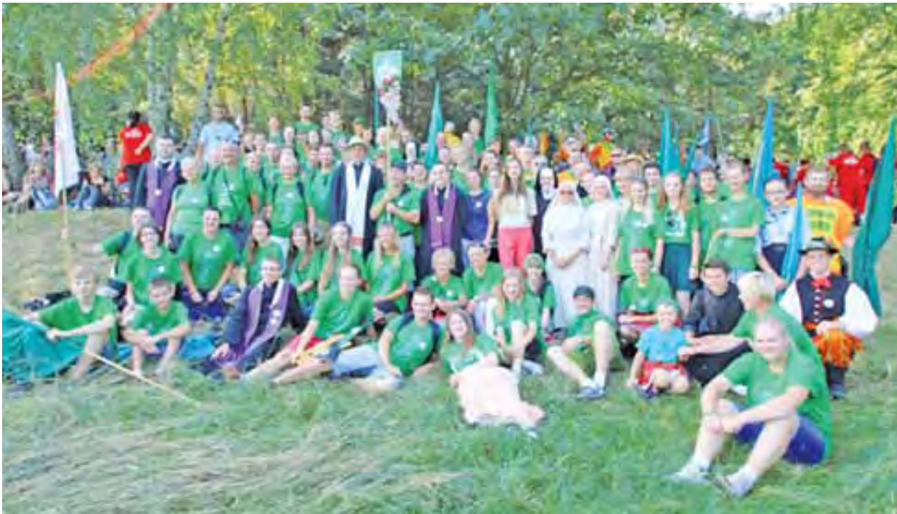
Łowicka Grupa Zielona w komplecie.