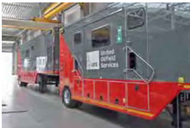
Mobile laboratoria do analizy wyników szczelinowań. Lakier nadal błyszczący.