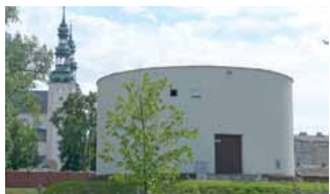
Przepompownia w Parku Błonie, po wykonanych kilka lat temu remontach, obecnie ma jednolity jasny kolor, ale niebawem to się zmieni.