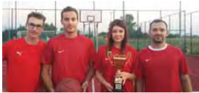
Ekipa Orlik Basket Team wygrała turniej koszykówki.

Wszystkie drużyny zapowiedziały, że chętnie wezmą udział w kolejnym turnieju, który planowa-