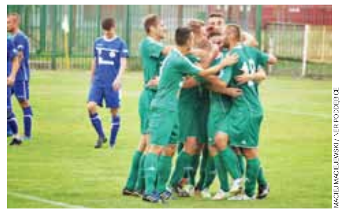
Czy w meczu ze Świtem łowiczanie też będą mieli powody do radości?

Poprzedni sezon Świt zakończył na 7. miejscu, gromadząc na koncie, gromadząc od łowiczanie o osiem punktów mniej. Starcie Pelikana ze Świtem będzie meczem otwierającym 3. kolejki. Odbędzie się w piątkowy wieczór, a pierwszy gwizdek przewidziano o godzinie 19:00. Mateusz Lis