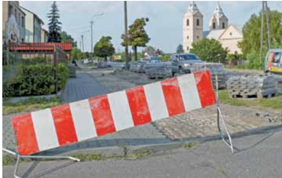
Zanim powstanie ścieżka, pieszym trudno będzie poruszać się po piachu, który pozostał po zdemontowanym chodniku.

rowerowe. Do czasu powstania ścieżki, piesi będą mieli kłopot w poruszaniu się po rozkopanej stronie ulicy.