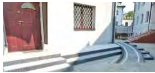
Przed bursą położono około 300 m 2 nowej kostki brukowej.

Bursę początkowo zamieszkiwały studentki kolegium nauczycielskiego i MWSH-P. Dziś, z powodu braku czynnie działających uczelni wyższych, pokoje zajmują obecnie wszystkim licealistki. Na chwilę obecną zapisanych jest na przyszły rok szkolny około 10, ale możliwość rejestracji istnieje także we wrześniu, październiku i listopadzie, więc prawdopodobnie ich liczba jeszcze nieco wzrośnie. mm