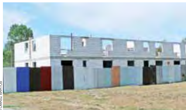
Budowa bloku komunalnego przy ul. gen. Krudowskiego trwa.

Pracownicy Zakładu Usług Komunalnych w Łowiczu, ze względu na upały zwolnili w sierpniu tempo budowy nawierzchni i chodników na ul. Cichej. Aby uchronić się od wysokich temperatur, zaczęli pracę o godz. 6.00. Odwiedzając w tym tygodniu ulicę możemy zobaczyć wyraźne postępy w pracach. Nawierzchnia z kostki została wykonana już od skrzyżowania z ul. Grunwaldzką do skrzyżowania z ul. Spółdzielczą, zaś chodnik jest już prawie gotowy na całej długości ul. Cichej. Nawierzchnia powstała także na części ul. Grunwaldzkiej. tb