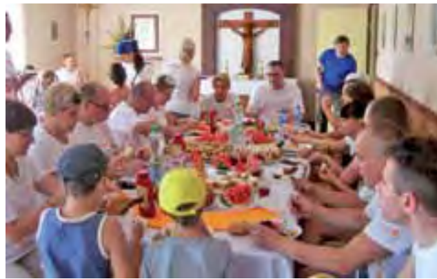
Grupa wolontariuszy z Orange Polska SA została ugoszczona przez parafian na posiłku, była to jedna z form podziękowania za pracę, inną była pamiątkowa łowicka wycinanka z dedykacją.