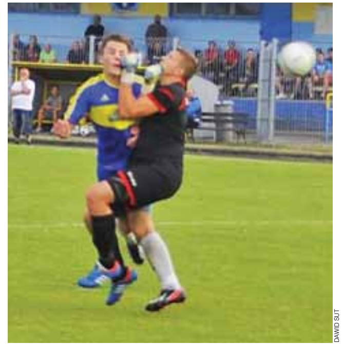
Pogoń prowadziła 2:0 i przegrała z Unią 3:2.

■ Olympic Słupia - Pelikan II Łowicz 0:2 ; br.: Kacper Rześny 60, 67