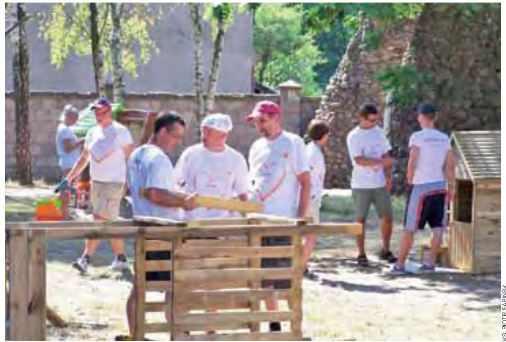
Wolontariusze w czasie budowy placu zabaw przy kościele w Bobrownikach własnoręcznie poskładali i zamontowali wszystkie jego elementy.

Przeważają wśród nich najmłodsi z pobliskiego osiedla, Traktu Łowickiego oraz części położonej „Za kolejną”, ale dojeżdżają też dzieciaki z bliżej położonej części Parmy i innych miejscowości położonych niedaleko. Proboszcz przypomina, że dotąd w tej części Bobrownik nie było miejsca zagospodarowanego pod kątem dzieci. Część osób jechało więc na plac zabaw do Szkoły Podstawowej w Bobrownikach czy do WTZ Parma. Obecnie cie-