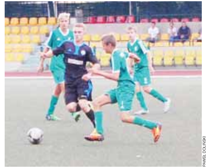
Młodzi zawodnicy z Pelikana 2000 czekają na walkę w najlepszych zespołach w woj. łódzkim.