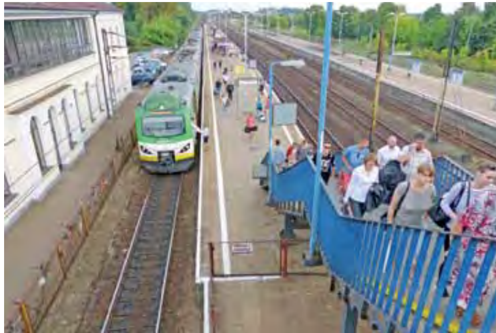
Przez dworzec PKP Łowicz Główny codziennie przewijają się rzesze pasażerów, głównie dojeżdżających do pracy. Choć większość z nich przywykła do kładki, to nie można zapomnieć, że jej pokonanie dla osób starszych, niepełnosprawnych, z rowerem, wózkami czy bagażem, jest bardzo trudne.