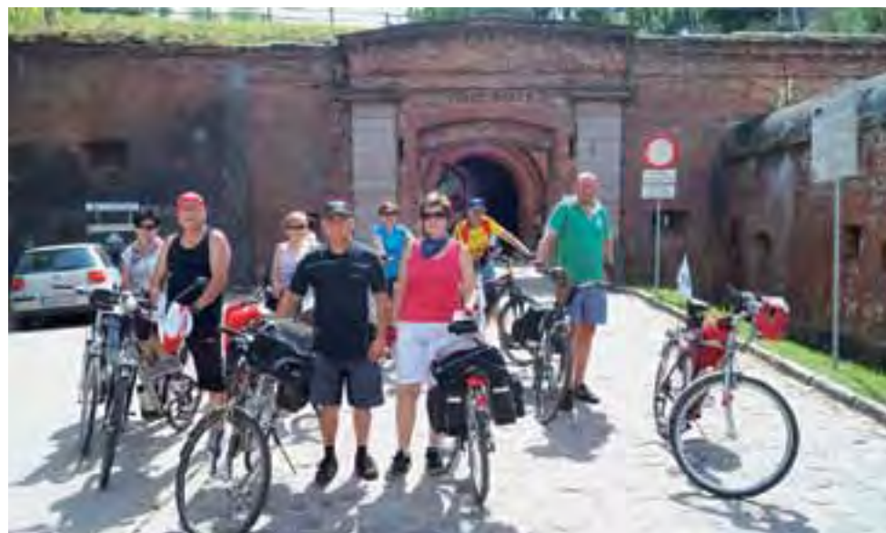
Odwiedzając Giżycko. grupa cyklistów z Łowicza odwiedziła także XIX-wieczną, pruską twierdzę Boyen.