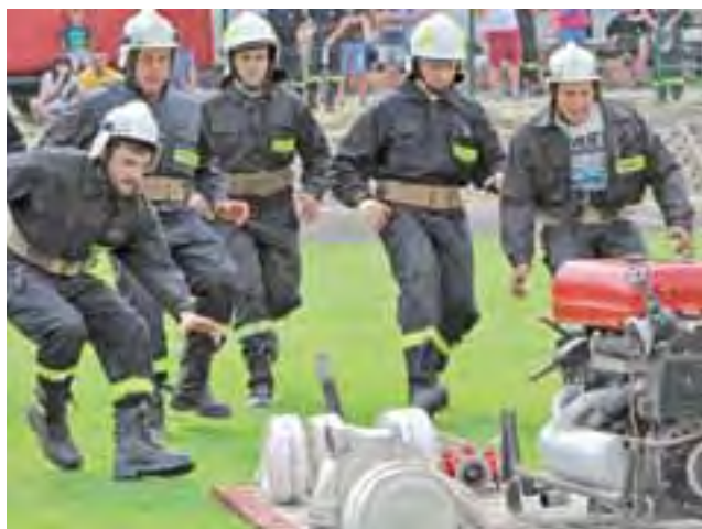
OSP Strzebieszew wystawiło do zawodów dwie drużyny, podobnie jak Stroniewice i Reczyce.

Do zawodów przystąpiło 10 drużyn męskich, 3 kobiece i 1 młodzieżowa drużyna pożarnicza. Zawody odbyły się na boisku w Domaniewicach. Mimo dużego wysiłku włożonego w przygotowania drużyna „B” ze Stroniewic zajęła trzecie miejsce. Na czwartym miejscu znalazła się natomiast drużyna „A” ze Stroniewic.