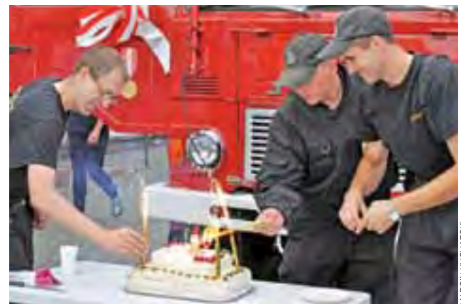
Na 40. urodziny Jelcza, będącego na wyposażeniu jednostki, OSP Domaniewice zaprosiło władze i innych druhowych.

Mural będzie przedstawiał podwodny świat, w którym pełno jest egzotycznych stworzeń i roślinności. Tłem będzie woda, na tle której pojawią się najpierw szkice ryb, pelikanów, ludzi płynących łódką, a nawet syreny - a potem powoli będą one nabierać kolorów. Na muralu zostanie też zobrazowana maszyna służąca do oczyszczania wody. Artysta ma do pomalowania około 300 m 2 powierzchni ścian, co zajmie mu około dwóch tygodni. Ozdobienie przepompowni kosztować będzie miasto 17 tys. zł. aa