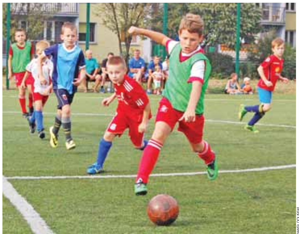
Springowy mecz między Pelikanem 2005, a Pelikanem 2006.