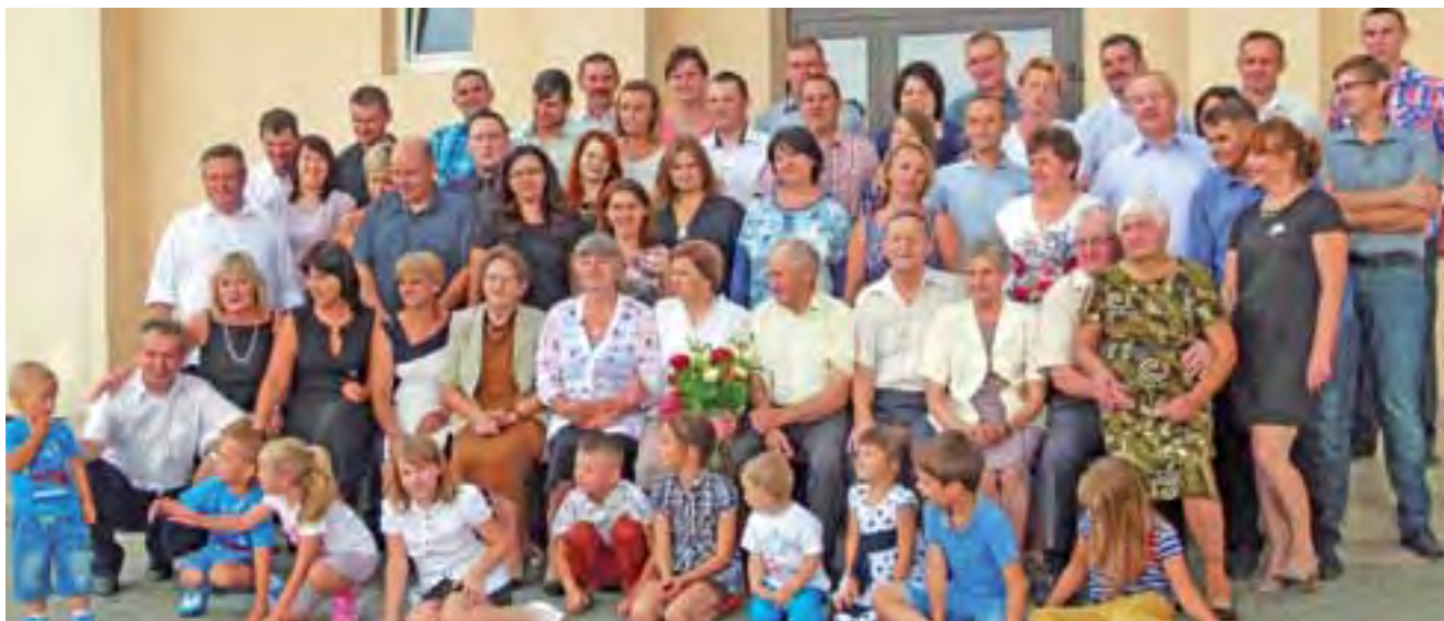
Rodzina Działaków w komplecie przed budynkiem, w którym zorganizowano spotkanie.