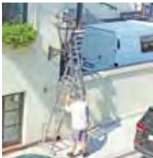
Montowanie kamery zewnętrznego monitoringu na budynku szkoły.

Trwa gruntowny remont pięciu pracowni, konserwacja fragmentu dachu i montaż zewnętrznego monitoringu. Pracownie będą wyposażone w meble i nowe środki dydaktyczne. Szkoła wzbogaci się też o trzy nowe projektory multimedialne. Część tych zmian jest podyktowana tym, że od września naukę rozpoczną dwie klasy pierwsze – dla jednej z nich trzeba było utworzyć pracownię. Ze względu na większą liczbę dzieci, w szkole powstaje też nowa świetlica na drugim piętrze. Odnowio-