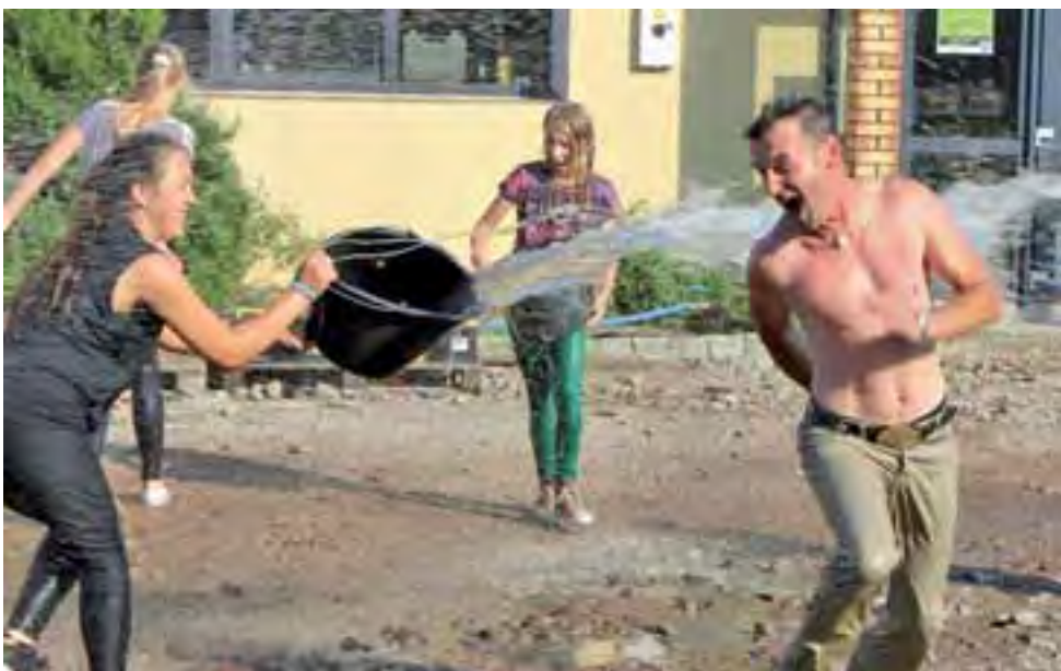
Podczas wspólnego mycia koni wywiązała się bitwa. Oblewaniu nie było końca.