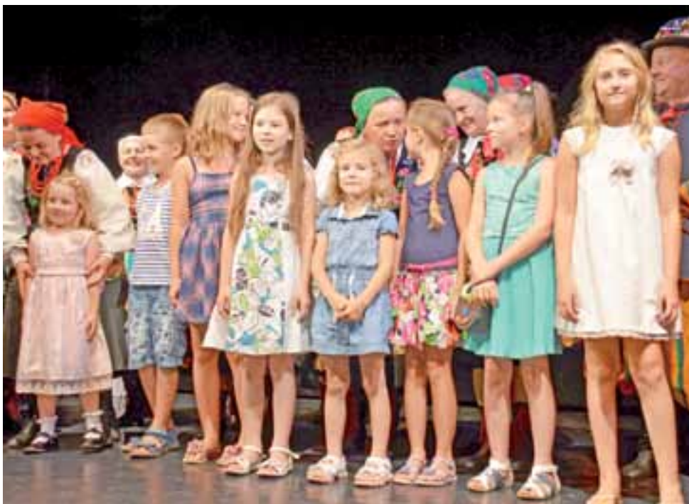
Warsztaty w Łomży organizowane były m.in. przez miejscową Szkołę Muzyczną I i II stopnia, a na zajęciach odbywających się w ramach imprezy nie zabrakło dzieci i młodzieży. Tak też było na spotkaniu z Ksiazkami.

Członkowie zespołu częstowali osoby, które przyszły na spotkanie z nimi, krówkami łowickimi i zaskoczyła ich reakcja kilku osób, które oglądając cukierki, mówiły: – O, taka sama łowiczanka, jak na mleku.