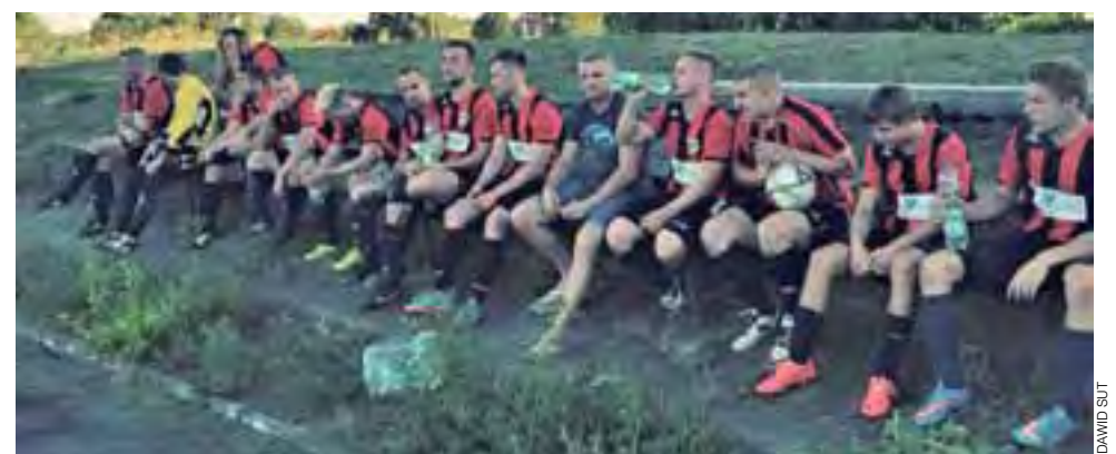
Gracze Victorii Bielawy świetnie zaczęli sezonu A klasy.