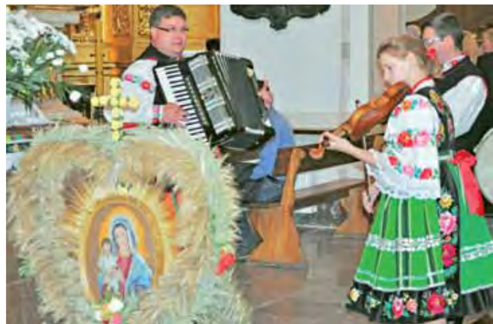
Podczas dożynek w katedrze przygrywała Kapela Jaśka. Na pierwszym planie wieńce wykonane przez mieszkańców Świerzyża Drugiego z gminy Łowicz.

18.15 rozpocznie wspólne tańczenie zumbi, o 18.45 przewidziano konkursy i zabawy dla dzieci i dorosłych. O godz. 20.00 rozpocznie się zabawa taneczna na świeżym powietrzu, wcześniej jednak przewidziano koncert zespołu wokalnego „Nieborowianki” z KGW w Nieborowie. Na terenie festynu na przybyłych gości czekać będzie sporo atrakcji, np. grill, popcorn, dzieci będą mogły skorzystać z usług kącików, gdzie będzie można pomalować buzie, rysować czy puszczać bańki. tb