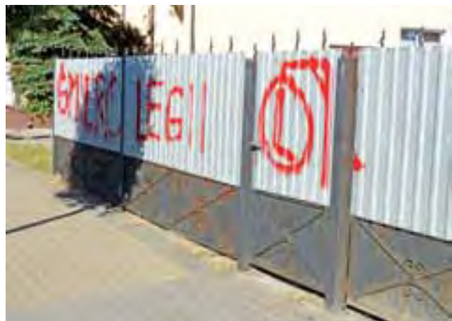
Ten napis pojawił się w Al. Sienkiewicza.