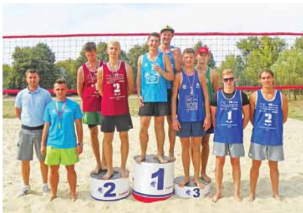
Najlepsze pary 3. turnieju eliminacyjnego.

Na podstawie punktacji zespoły które awansowały do wielkie-