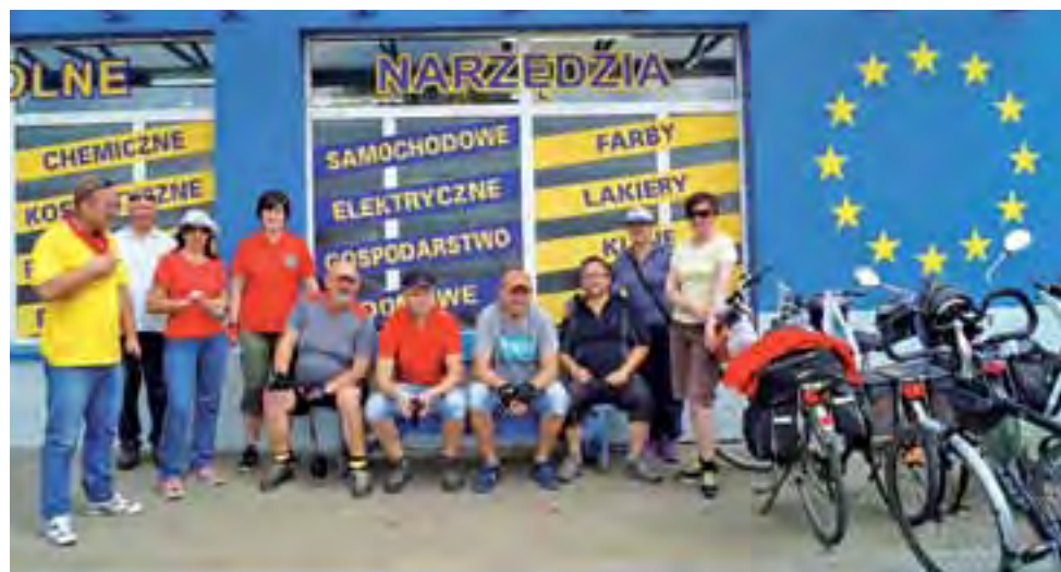
Uczestnicy wyprawy rowerowej mogli zasiąść na chwilę na ławeczce pod sklepem, gdzie w serialu panowie spożywają wino Mamrot, dzieląc się przy okazji swoimi przemyśleniami.

Oprócz tego, poruszając się w części leśnymi duktami, grupa już o zmroku nie miała pewności, gdzie się znajduje, ale dzięki towarzyszącemu szczęściu, przy świetle rowerowych lamp, odnalazła właściwą drogę. Choć niektórzy uczestnicy wyprawy najedli się strachu, że będą zmuszeni nocować w lesie.