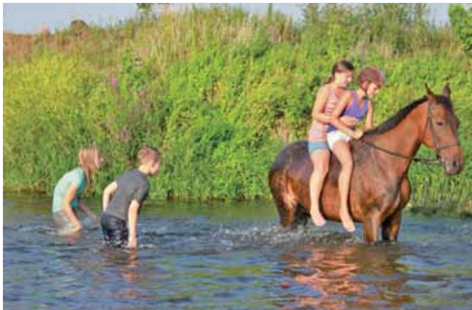
Kąpiel w Burze? Czemu nie. W końcu tegoroczne lato jest wyjątkowo upalne.