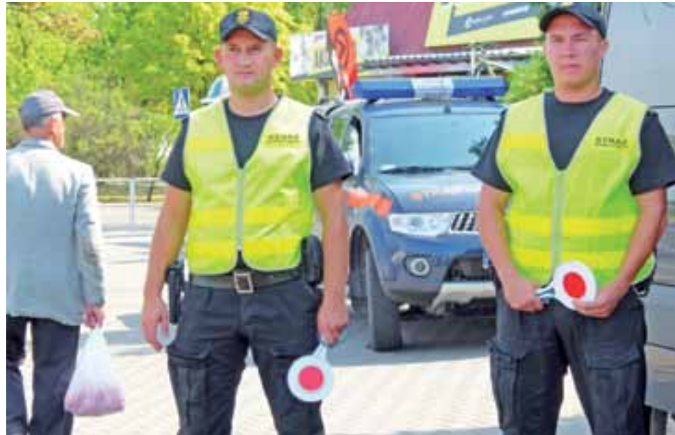
Nawet widok funkcjonariuszy Straży Ochrony Kolei w odblaskowych kamizelkach i z lizakami w rękach nie odstraszył niektórych kierowców przed wjechaniem na przejazd przy zamykających się rogatkach.

– Mobilne Centrum Monitoringu (MCM) – będący na wyposażeniu centrali SOK. W skali kraju jest zaledwie 9 takich pojazdów. Każdy z nich jest wyposażony w kilka kamer, które nagrywają to, co się dzieje z przodu, z tyłu oraz po bokach samochodu. Na wyposażeniu MCM są też takie kamery, które można ustawić na trójnogu nawet kilkudziesiąt metrów od samochodu. Tak też uczynili funkcjonariusze SOK w Łowiczu i przejazd na ul. 3 Maja był filmowany z obydwóch stron. Część wykroczeń popełnianych przez kierowców została więc zarejestrowana. Kierowcy na życzenie mogli je obejrzeć, chętnych jednak nie było. Wyjątkiem była pani, która jadąc od strony Starego Rynku w Łowiczu wjechała na przejazd już po załączeniu się sygnalizacji świetlnej i dźwiękowej. Kierująca próbowała tu-