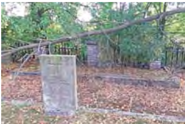
Na grobach żołnierzy, w poniedziałek 24 sierpnia, leżał jeszcze złamany konar rosnącego obok drzewa.

Obrazu opuszczenia dopełniają stare, sztuczne kwiaty, ustawione na mogiłach i poprzewracane zniszczone.