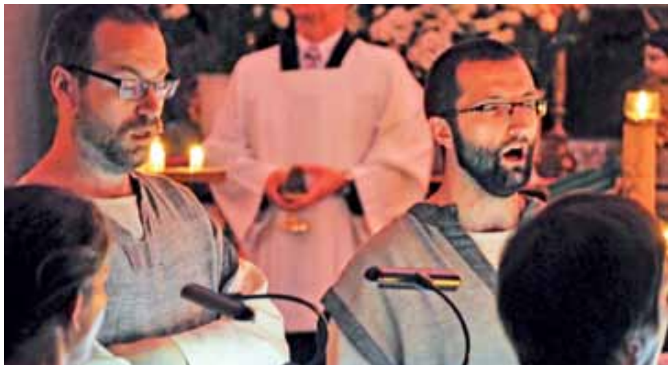
Akatyst, będący rodzajem hymnu liturgicznego, zawsze śpiewa się na stojąco, tak wypada go również słuchać. W łowickiej katedrze wykonała go Schola Węgajty.

Łowicz | Festiwal Kolory Polski – Akatyst ku czci Bogurodzicy