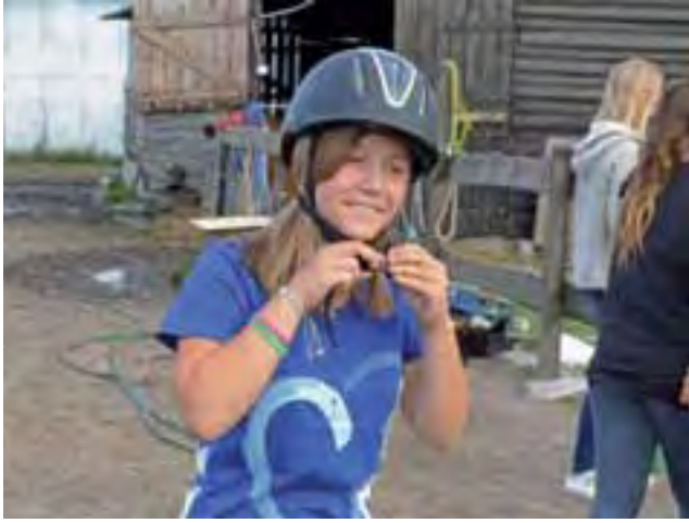
Przed rozpoczęciem lekcji trzeba założyć toczek