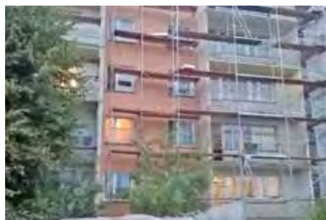
Ostatnie roboty dociepleniowe na bloku nr 24 na osiedlu Bratkowice..

no również szkolne szatnie i łazienki, a także korytarz przy hallu na parterze. Pod koniec lipca została na nowo pomalowana szkolna kaplica. tm