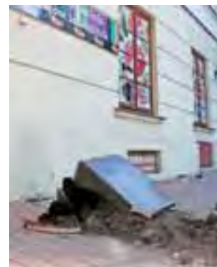
Na ulicy Podręcznej dali znać o sobie wandalii, tym razem policja złapała ich niemal na gorącym uczynku.

Jak się dowiedzieliśmy, to nie pierwszy przypadek, gdy w kamienicy nr 2 wybijane są szyby. Takie zdarzenia miały miejsce już