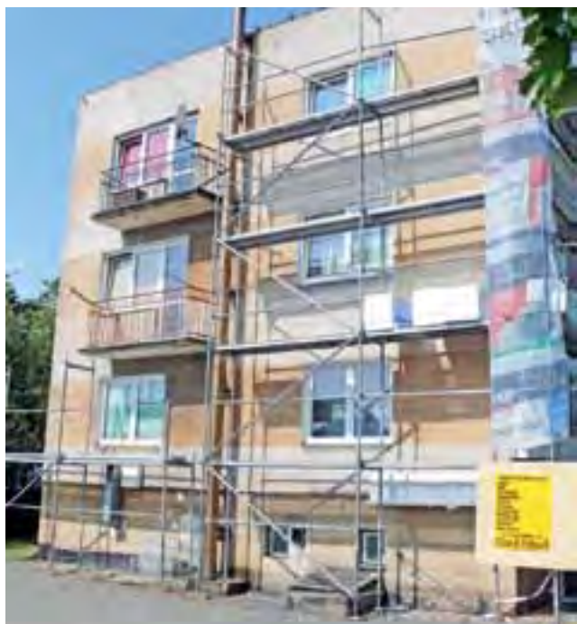
Trwa termomodernizacja komunalnego budynku przy ul. Jana Pawła II.