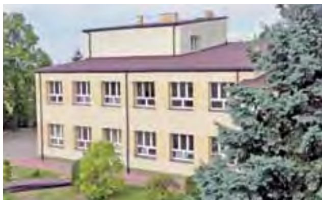
Gimnazjum w Bielawach z nowym dachem, stan na 24 sierpnia.

Teraz czas na remont sal, a ten, jak poinformował nas w poniedziałek, 24 sierpnia, wójt gmi-