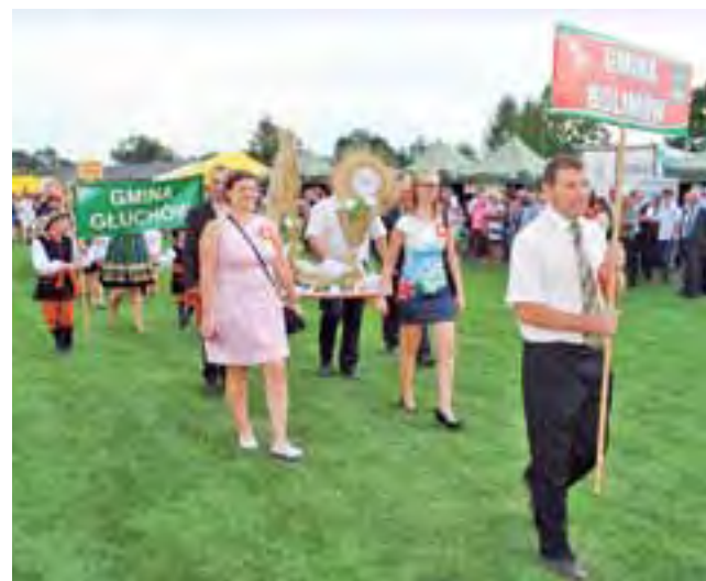
Delegacja gminy Bolimów na dożynkach powiatu skierniewickiego.

W tym roku wieniec na dożynki powiatowe z gminy Bolimów został przygotowany przez mieszkańców Woli Szydłowieckiej. Wójt przyznał, że jako mieszkaniec miejscowości był w grupie osób, która pracowała nad pomysłem jego wykonania. Zaznaczył, że w pracę zaangażowanych było kilkanaście osób, z których 6 pra-