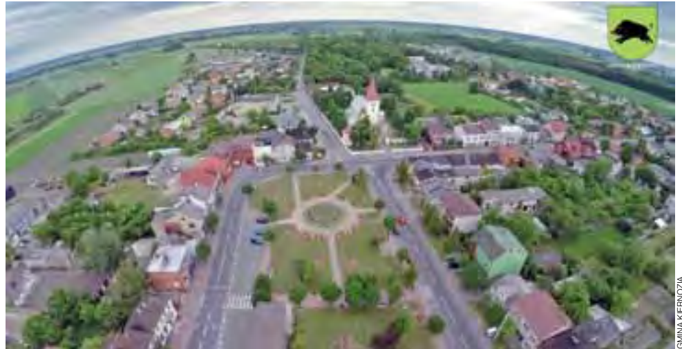
Czyż Kiernozia z lotu drona nie wygląda ładnie?