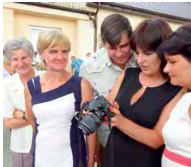
Podczas spotkania wykonanych zostało pewnie kilkaset pamiątkowych zdjęć.

Trzcianka | Wyjątkowe spotkanie rodziny Działaków