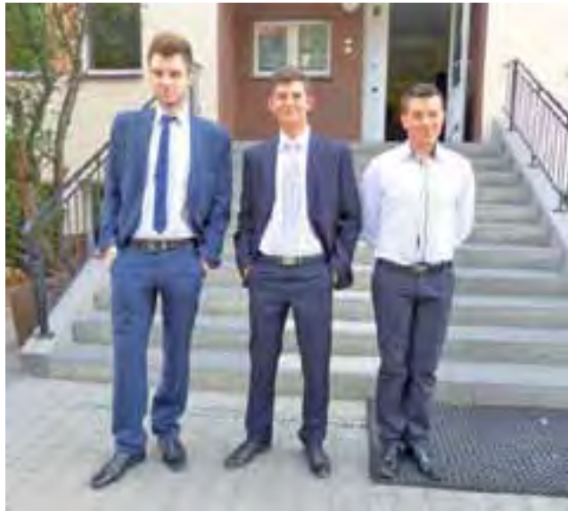
Już po egzaminie... Ci uczniowie szkoły na Blichu poprawiali matematykę.

W Zespole Szkół Ponadgimnazjalnych nr 1 poprawkową maturę mogło zaliczyć 13 osób, z czego 7 osób z matematyki, 1 z pisemnego niemieckiego, 1 z języka polskiego i 2 z języka angielskiego. 2 osoby nie przy-