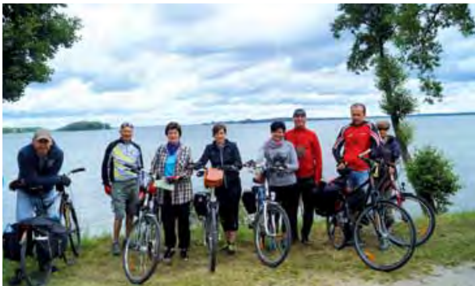
Wyprawa na Mazury to oczywiście jeziora. Turyści z Łowicza postanowili jednak nie pływać po nich, ale niektóre z nich objechać dookoła na rowerach.