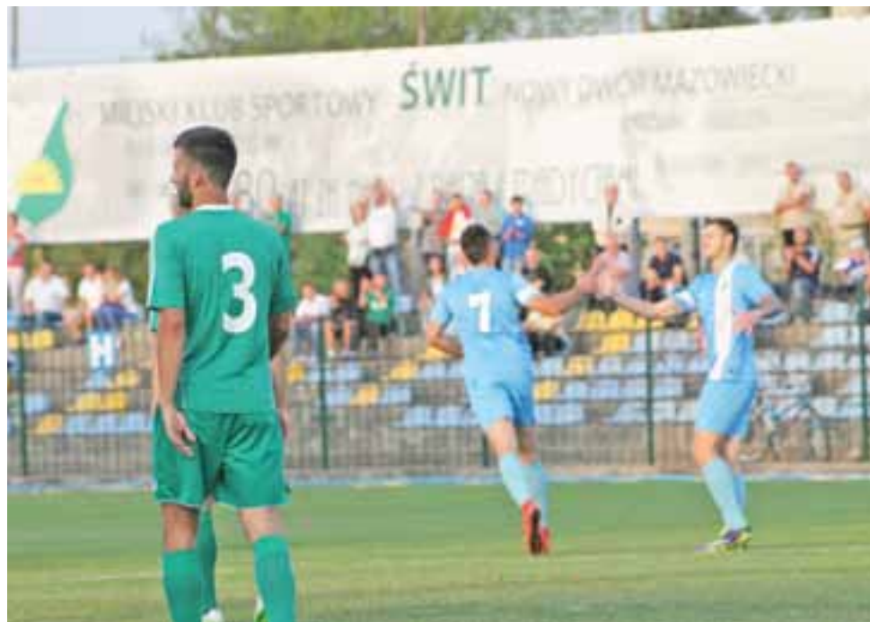
Nowodworzanie cieszą się ze zdobytego gola.