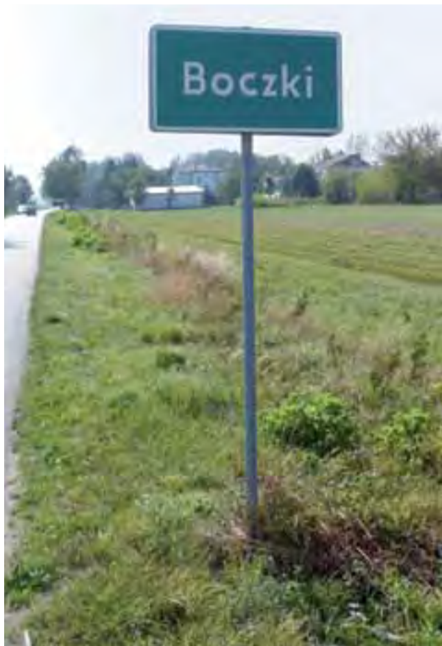
Tabliczka informująca o wjeździe do miejscowości Boczki. Czy zostanie wymieniona na Boczki Chełmońskie?

Za zmianą nazwy miejscowości opowiedziało się 48 osób, przeciw było pozostałe 10. Rada Gminy jest teraz w trakcie przygotowywania projektu uchwały.