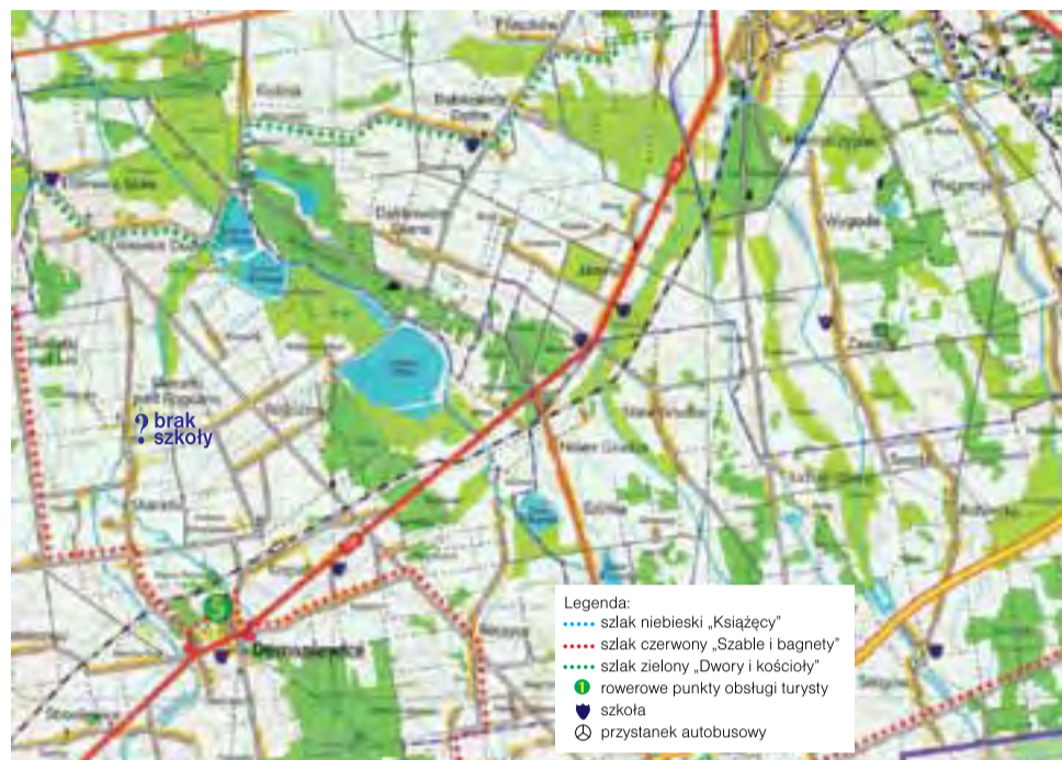
Fragment mapy: tylko jeden przystanek kolejowy w Domaniewicach, żadnego w Grudzach, za to dwie szkoły w Jamnie i jedna w Krepie.

– W opisie mapy, w ważnym, bo wstępnym fragmencie zachęcającym do zwiedzania, nie ma ani słowa o tym, że istniało coś takiego jak Księstwo Łowickie, a więc