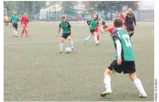
Pelikan 2001 wygrał u siebie z Widzewem.