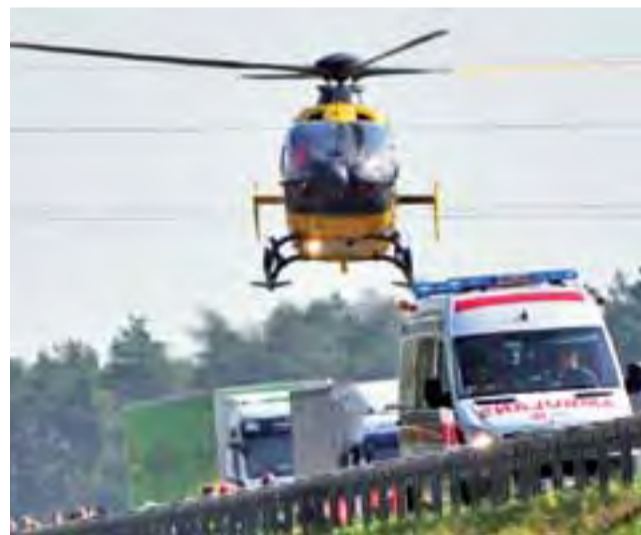
Kierowca Seata Cordoba został zabrany helikopterem Lotniczego Pogotowia Ratunkowego do szpitala w Warszawie.

Samochodem Punto kierował 53-letni mieszkaniec powiatu łowickiego. Obydwaj kierowcy byli trzeźwi. Litwin został ukarany mandatem. Przez kilkadziesiąt minut ruch na drodze odbywał się wahadłowo. mak