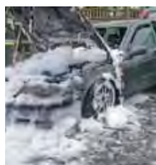
Pojazd udało się ugasić nim spłonął doszczętnie.