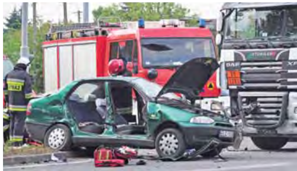
Fiat Siena podczas wypadku został całkowicie zniszczony.

dochodzenia. – To nie pierwszy już raz, a ludzie zdążyli się przyzwyczaić i jeżdżą trochę „na pamięć” – komentowali zdarzenie świadkowie, będący na miejscu.