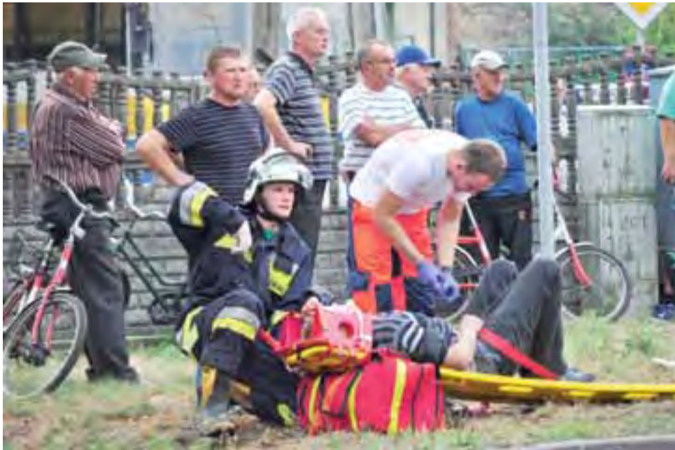
Ratownikom medycznym w zajmowaniu się osobami poszkodowanymi pomagali strażacy.

Z wypowiedzi świadków wynika, że w momencie wypadku na skrzyżowaniu nie działała istniejąca tam sygnalizacja świetlna. Czy faktycznie tak było, będzie przedmiotem policyjnego