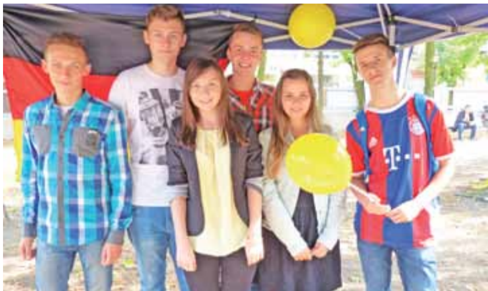
Uczniowie I LO w Łowiczu opowiadali o kulturze Niemiec.

W Ogrodzie Saskim powstała ścieżka edukacyjna z namiotami, które symbolizowały wybrane stolice Europy. Jednym z przy-