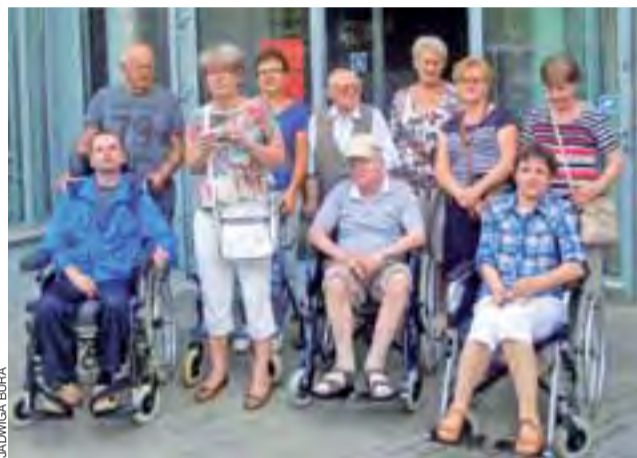
Uczestnicy wyjazdu przed wejściem do Muzeum Męczeństwa Bł. Ks. Jerzego Popiełuski.

Tegoroczny rajd, mimo iż pierwotnie miał się odbyć w trzech formach: pieszej, rowerowej i kajakowej – wyruszył tylko w dwóch pierwszych formach, w których udział wzięło ponad 100 cyklistów i około 30 piechurów. Spływ kajakowy został odwołany z uwagi na niski poziom Bzury.