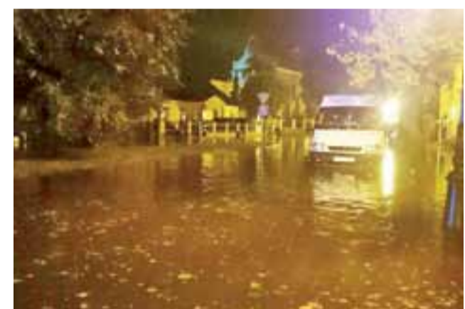
Zalany Plac Przyrynek w Łowiczu.