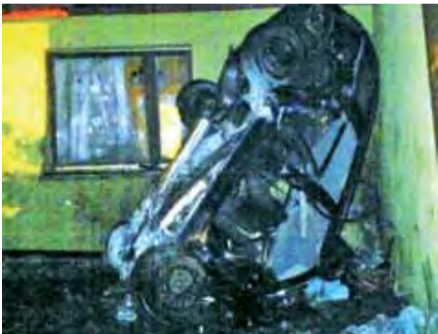
Siła uderzenia była tak duża, że samochód stanął pionowo, opierając się o resztki ściany.