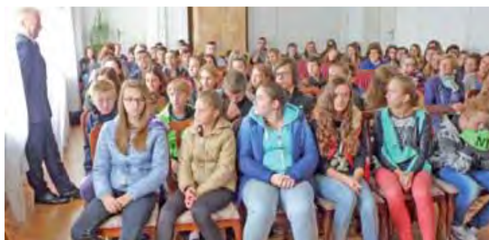
Młodzież zasłuchana w opowieści o walkach we wrześniu 1939.