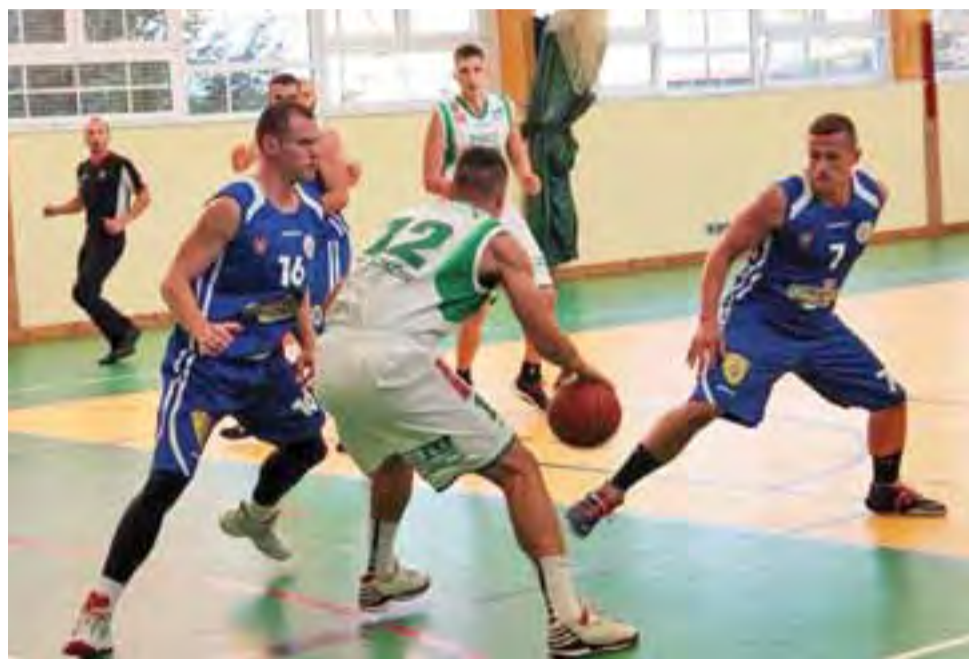
W Ożarowie Mazowieckim Książek minimalnie był słabszy od Znicza Pruszków.

Mecz z Ożarowie był bardzo wyrównany i nasz zespół miał nawet szansę wygrać te zawody, jednak w czwartej kwarcie pierwszoligowiec był skuteczniejszy i ostatecznie wygrał 75:68. Mecz ten był rewanżem za wcześniej-