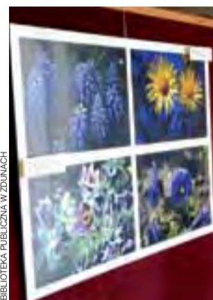
Wystawa eksponowana będzie do końca września.

Pisanie wierszy, które nazywa wierszyczkami, jest jego drugą pasją. Doczekał się ich wydania w tomiku pt. „Paprocki”, które prezentuje podczas wieczorów autorskich. mwk