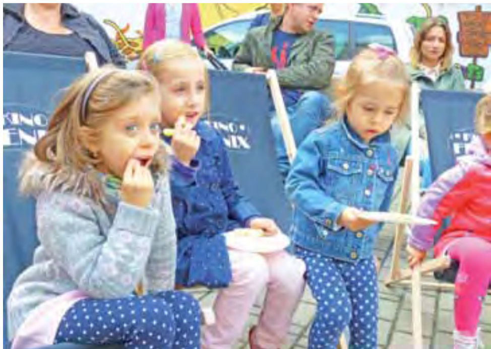
Dla wszystkich przybyłych na koncert gości przygotowano poczęstunek. Te dziewczynki, niczym prawdziwe damy częstują się chrupkami.