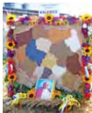
Mieszkańcy Kalenic mogą poszczycić się II miejscem.

W trakcie dożynek zaprezentowała swój program Grupa Wokal-