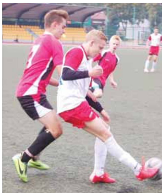
Pelikan 1999 (czerwone stroje) ograł Concordię 3:1.

W następnym meczu Pelikana zmierzy się w sobotę 19 września o godzinie 16:30 z Włóknarzem Konstantynów. Mecz odbędzie się w Łowiczu na stadionie OSiR.