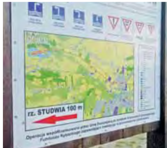
Niechlujstwo widać także w innych działaniach turystycznych sfinansowanych przez starostwo z tego samego programu co mapa. Na oznaczeniach szlaku kajakowego na brzegach Bzury pod Łowiczem zamiast Studwi mamy Studwie...

Na mapę wydano blisko 6 tys. zł. Oczywiście, to niewiele, pieniądze pozyskano z unijnego programu Ryby – więc podatek wielkiej straty nie poniósł. Ale czy to usprawiedliwia niechlujstwo? ■