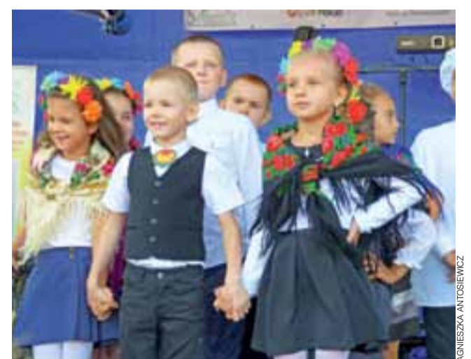
Na scenie wystąpili między innymi dzieci ze Szkoły Podstawowej w Stachlewie.

kowe, dary oraz kosze z owocami. Bywały też przypadki, że mniej liczne sołectwa łączyły się i powstawały wspólne wieńce. Wszystkie wzięły udział w konkursie z nagrodami. Miejsce pierwsze zajął w nim wieńiec przygotowany przez mieszkańców Uchania Dolnego. Dwa kolejne miejsca na podium należały do Kalenic i Czatonina.