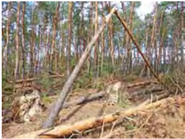
Skalę zniszczeń najlepiej widać w środku lasu. Niektóre drzewa łamały się jak zapałki, inne wiatr powyrwał z korzeniami.

Plany te na zlecenie urzędu sporządziła firma specjalizująca się w zagadnieniach z zakresu leśnictwa, wyłoniona w przetargu w 2006 roku. W uproszczonych planach zawarte są wszystkie zadania, które właściciel lasu powinien w nim wykonać w ciągu 10 lat tj. zabiegi pielęgnacyjne, odnowienia, nasadzenia. Jest tam też opisana ilość dreb-