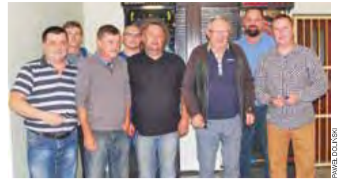
Uczestnicy Otwartych Mistrzostw Łowicza w dartsie 501.

W tę niedzielę na łowickich kortach odbędzie się rywalizacja par deblowych.