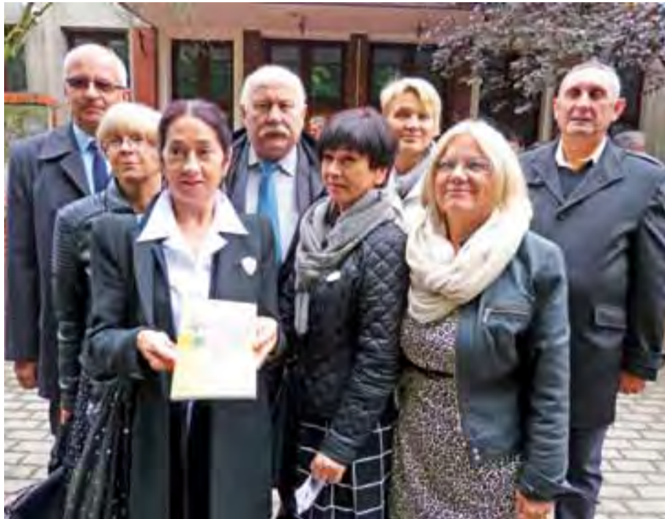
Grupa absolwentów widoczna na zdjęciu spotyka się systematycznie. Nie zabrakło ich także na szkolnej uroczystości.

– Jubileusz 70-lecia Liceum Ogólnokształcącego im. Krystyny Idzikowskiej w Zdunach zbiegł się z czasem likwidacji szkoły, co jest dla nas – absolwentów i byłych nauczycieli – przykrą okolicznością. Mimo wielu zmian i przemian w kraju oraz w samej oświacie, szkoła ta zachowała w naszej pamięci, pamięci jej absolwentów, swoją tożsamość, swoje oblicze i swoją osobowość. Z okazji jubileuszu 70-lecia naszej szkoły, dzisiejsze