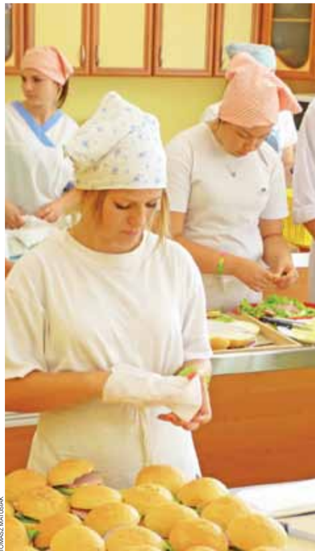
Uczniowie Zespołu Szkół Ponadgimnazjalnych nr 3 w Łowiczu bardzo pomogli w organizowaniu Ogólnopolskiej Pielgrzymki Osób Niewidomych. 11 września od samego rana przygotowywali zestawy, z których każdy składał się z dwóch kanapek, batonika, jabłka, śmietanki, wody i innych smakołyków. W sumie przygotowano 1600 takich zestawów, trzeba więc było zrobić 3200 kanapek. Robili je uczniowie Technikum Żywności, zaś pakowaniem zestawów zajęły się klasy Technikum Hotelarskiego. tm

Łowicz | Niewidomi i niedowidzący przybyli z pielgrzymką