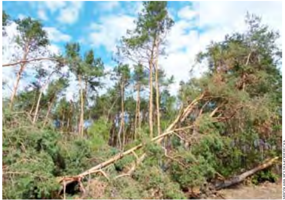
Powalone przez wichurę drzewa wciąż jeszcze są zielone, chociaż od nawałnicy minęły już dwa miesiące.

na przewidziana do pozyskania. W powiecie łowickim obecne opracowania obowiązują od 1 stycznia 2007 roku do 31 grudnia 2016 roku