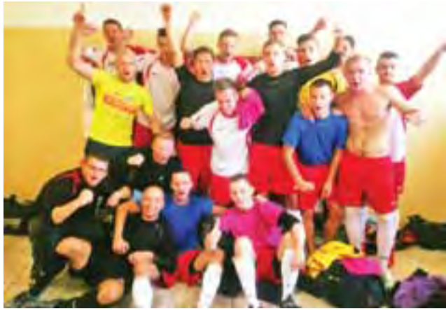
Orzeł świętował w Zgierzu wygraną.

W drugiej części gry obie drużyny zdawały sobie sprawę, że można przechręcić szalę zwycięstwa na swoją korzyść. Po pierwszej wyrównanej połowie znowu lepiej w spotkaniu weszli gracze trenera Ługowskiego, którzy przenieśli ciężar gry na połowę rywali. W pierwszych minutach drugiej połowy kibice nie oglądali zbyt wielu akcji podbramkowych, tych bowiem było jak na lekarstwo. W końcu przyszła 60. minuta, która jak później się okazało zaważy-