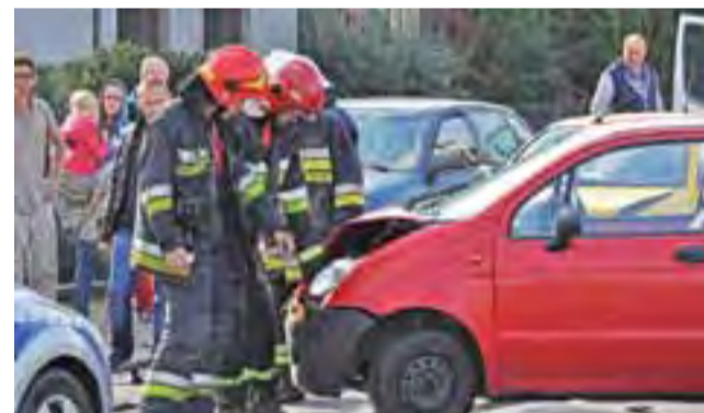
Kierująca Matizem zjechała na przeciwny pas, doprowadzając do kolizji.

w wyniku czego doprowadziła do kolizji z nadjeżdżającym z przeciwnika Seatem Ibiza, który również prowadziła mieszkanka Łowicza. Na miejscu pracowały dwa zastępy strażaków z JRG PSP Łowicz i OSP Karsznice. Działania trwały ponad dwie godziny. Samochody odholowała laweta. aa