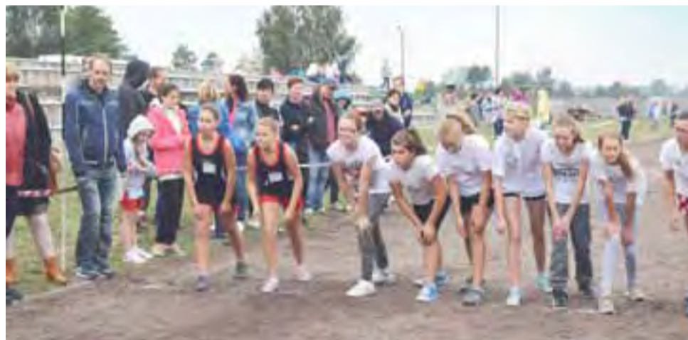
Na starcie. Dziewczeta z klas VI szkoły podstawowej gotowe do biegu.

12 września goście wzięli udział w biegach i innych atrakcjach Dnia Patrona, po południu zwiedzili Nieborów, noc spędzili w placówce, a w niedzielę uczestniczyli w uroczystościach patriotycznych w Walewicach.