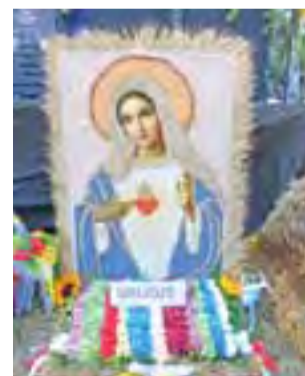
Ten wieńiec przygotowali mieszkańcy wsi Grudze.

Większość sołectw samodzielnie przygotowało wieńce doży-