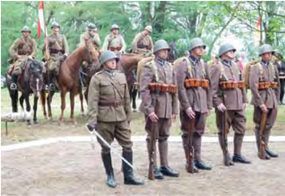
Ułani i piechota. Na uroczystości pod pomnikiem w Walewicach jak co roku spotkali się ci, którzy z sympatii dla polskiej armii i żołnierskiego etosu z wielkim zaangażowaniem zajmują się rekonstrukcją historyczną.