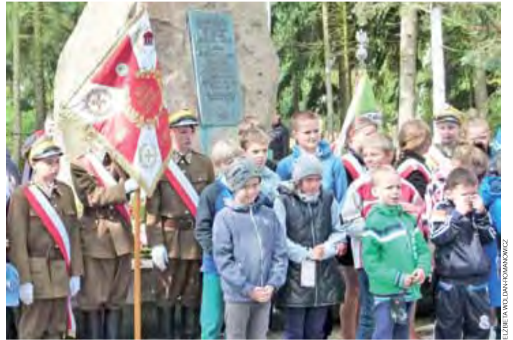
Pamiątkowa fotografia na koniec uroczystości. Po lewo stoi poczet sztandarowy SP im. 17 Pułku Ułanów Wilkp. w Bielawach.

Walewice | 76. rocznica bitwy nad Bzurą.