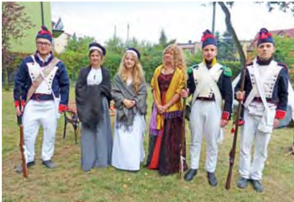
Harcerska Grupa Rekonstrukcji Historycznej „Baszta” z Hufca Warszawa-Ochota przeniosła wszystkich w czasy Królestwa Polskiego.

W uroczystym przecięciu wstęgi udział miało kilka osób. Milimetr po milimetrze w wielkim napięciu wstęgę przecinali m.in.