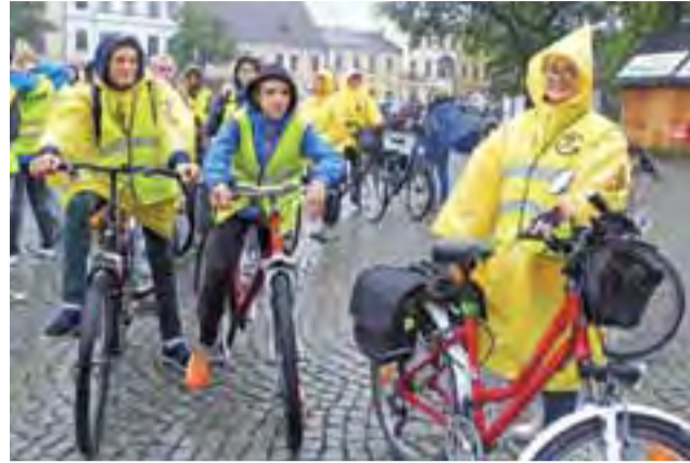
Mimo deszczowej aury, gimnazjaliści z "Dwójki" wraz z nauczycielami sygnalizują gotowość do rajdu.

Pół godziny później na Starym Rynku spotkali się cykliści. Rowerzyści wyposażeni w peleryny