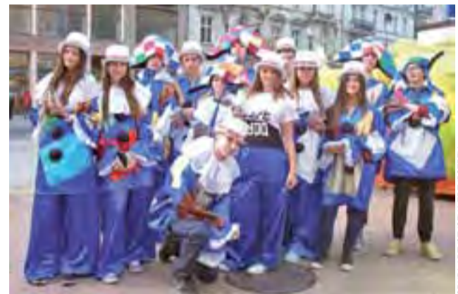
Łodzianie przechadzający się po Piotrkowskiej otrzymywali od przebranych w kolorowe stroje gimnazjalistów program festiwalu.

Pierwsza edycja festiwalu AnimArt będzie odbywać się