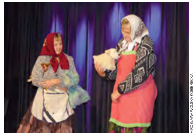
Bogoria Górna przerobiła piosenkę biesiadną „Miała baba koguta”.