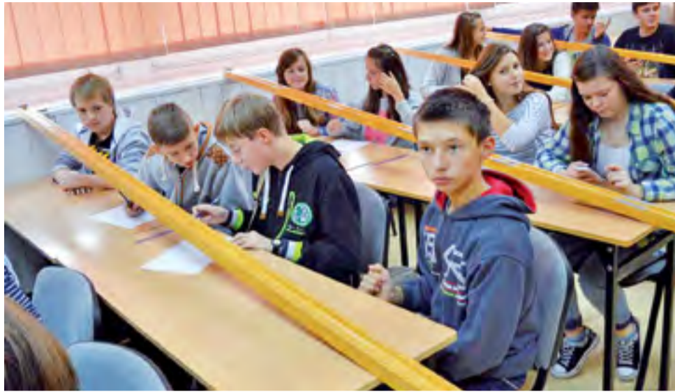
Uczniowie Gimnazjum w Popowie mogli poczuć się jak prawdziwi studenci.