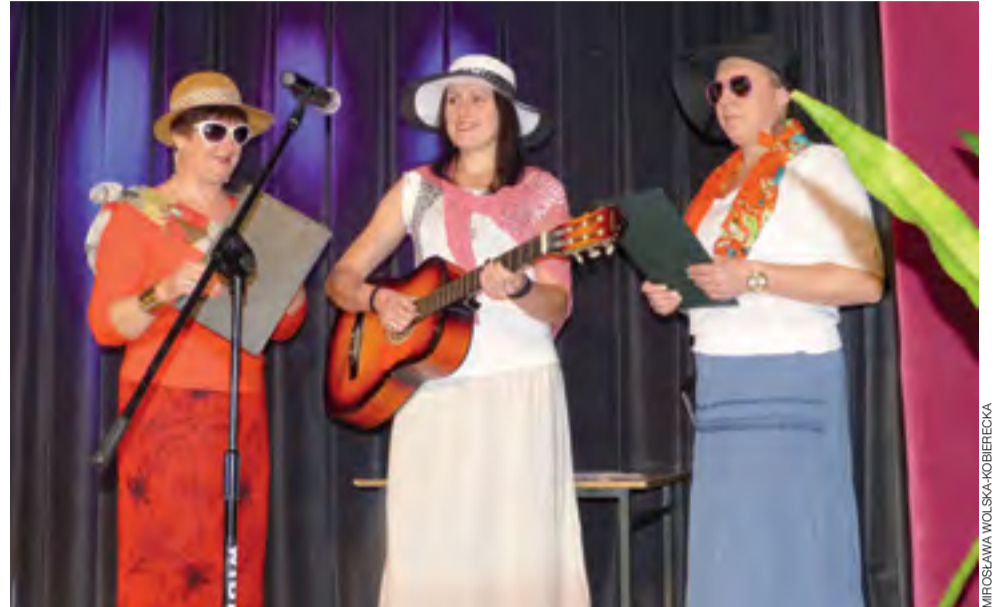
Gospodynie z Urzecza odegrały teledysk do piosenki Maryli Rodowicz „Ech, mała”.