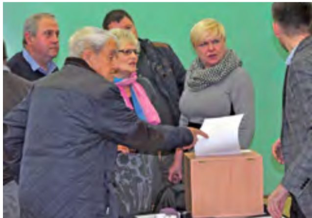
Mieszkańcy dzielnicy Kostka wybrali trzy inwestycje do drugiej tury głosowania w ramach budżetu obywatelskiego.

Najwięcej głosów (16) zebrała przebudowa chodnika i wydzielanie ukośnych miejsc parkingowych wzdłuż ul. Jana Pawła II – po stronie bloków. Nieco mniej, bo 12 głosów zebrał pomysł budowy bądź też wydzielania miejsca spotkań dla mieszkańców ul. Łódzkiej . Takie miejsce – bez określania co to miałyby być – mogłoby, według mieszkańców, powstać np. na terenie ogródków działkowych, o ile miasto dojdzie w tej sprawie do porozumienia z zarzą-