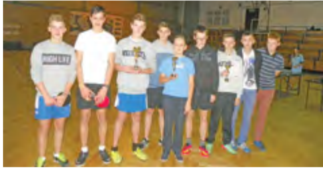
Nagrodzeni zawodnicy w mistrzostwach powiatu łowickiego.

Uczniowie gimnazjów z powiatu łowickiego walczyli w mistrzostwach powiatu w tenisie stołowym, które odbyły się w czwartek 22 października w hali OSiR nr 1 w Łowiczu. W zwozach, które organizuje Powiatowy Szkolny Związek Sportowy w rywalizacji chłopców z gimnazjów wystartowało tylko 10 zawodników z 4 szkół z powiatu łowickiego.