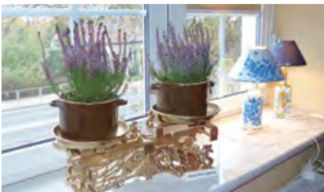
„Stare po nowemu”, czyli waga i garnki gliniane jako kwietnik.