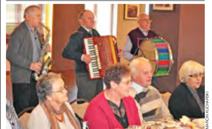
Na Klubowym Dniu Seniora spotkali się 22 października w sali bankietowej w Kiernozianie seniorzy z gminy Kiernozia. Spotkanie uświetniła Kapela Ludowa zespołu Kiernozianie. mak