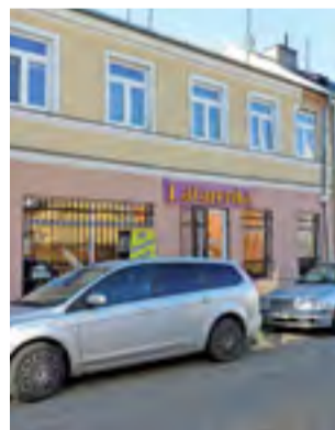
Kamienica przy ulicy Bielawskiej 7.

Właściciel przejmie kamienicę razem z najemcami. W tym czasie Zakład Gospodarki Mieszka-