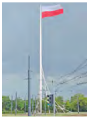
Maszt Wolności w Warszawie 2015.

Wiadomo jednak, że Rondo Niepodległości, znajdujące się w ul. Kaliskiej, nie ma jeszcze ostatecznego wyglądu. W ostatnim czasie burmistrz Krzysztof Kaliński wysunął propozycję, aby na środku tego ronda stanął wysoki na 20 lub więcej metrów maszt, na którym powiewać będzie olbrzymia flaga Polski, możliwe, że o wymiarach 3 na 5 m lub większa. – Musimy przeanalizować tę inwestycję, stworzyć wizualizację, rozwiązać sprawy techniczne, jej koszt wstępnie oceniamy na mniej niż 50 tys. zł – powiedział nam burmistrz. Krzysztof Kaliń-