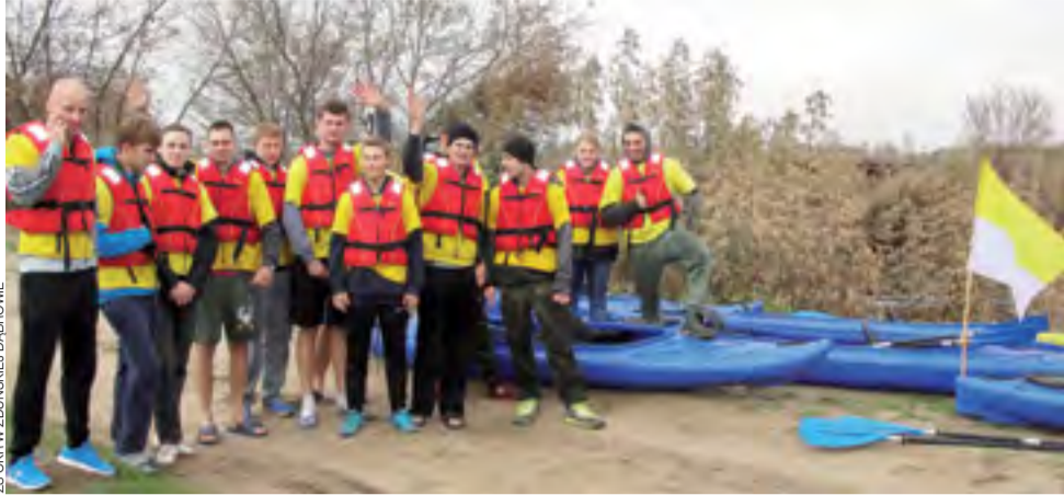
Splyw kajakowy w październiku , młodzież w krótkich spodenkach i klapkach? – jak widać można. Niektórzy wprawdzie ubrali się cieplej, ale odwagi w tej grupie chyba nie zabrakło.