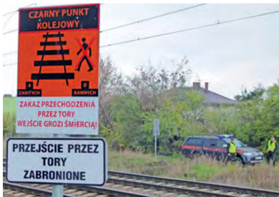
Tablice ostrzegawcze są, SOK-iści będą bywać tu częściej niż do tej pory.