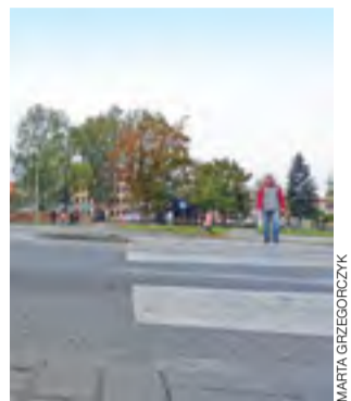
Pofałdowane przejście dla pieszych przy ul. Tkaczew.

Trzeba przy tym podkreślić, że jest to jedno z najruchliwszych skrzyżowań w mieście, więc nale-