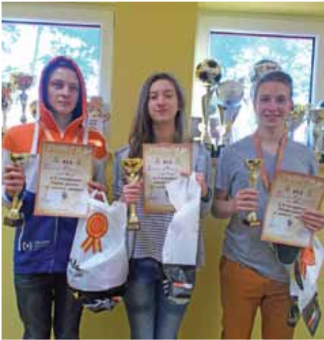
Podium turnieju szachowego w Nieborowie.