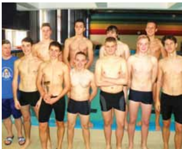
Wśród chłopców wygrali pływacy z Pijarskiego LO.