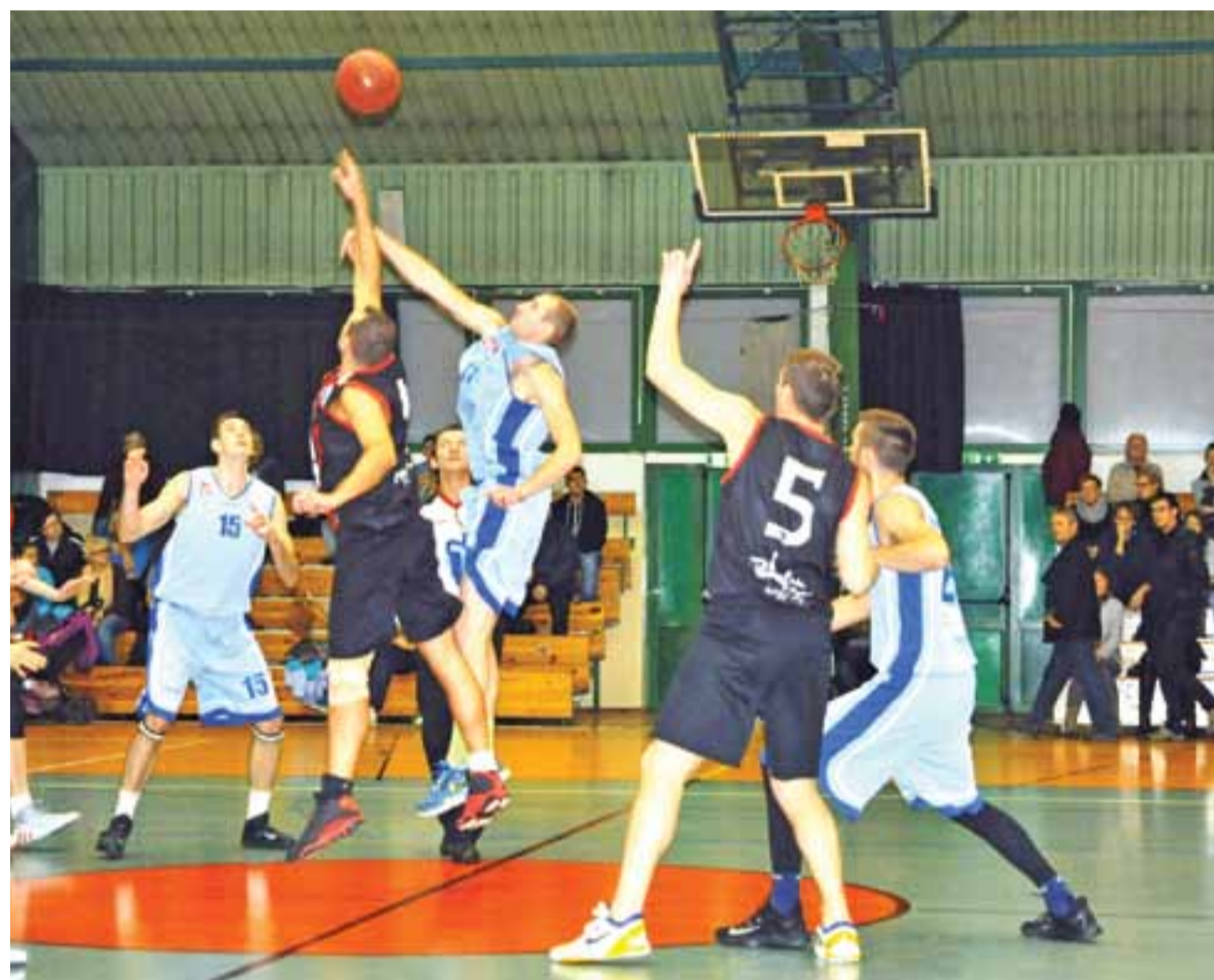
Księżak pewnie i wysoko pokonał w sobotę Tura Bielsk Podlaski.

W przerwie meczu odbywały się konkursy, a do wygrania były gadzety ufundowane przez sponsora Bank Spółdzielczy Ziemi Łowickiej. Przypomnijmy, że do wygrania na każdym meczu w Łowiczu jest nagroda za celny rzut z połowy. W tam-