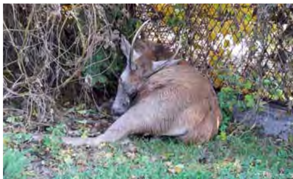
Jeleń po uwolnieniu go z ogrodzenia, na które się nadział, leżał w cieniu krzaków, zanim został uśpiony.

Jak zawsze odprawia ją: burmistrz Łowicza, biskup ordynariusz i starosta łowicki. Potem procesja przejdzie do katedry na mszę św., którą oprawi gość z archidiecezji katowickiej. mwk