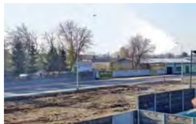
Teren, na którym powstanie nowy zakład położony jest przy nowo powstałej ulicy Piłsudskiego. Tak to wygląda od strony stadionu KS Pelikan.