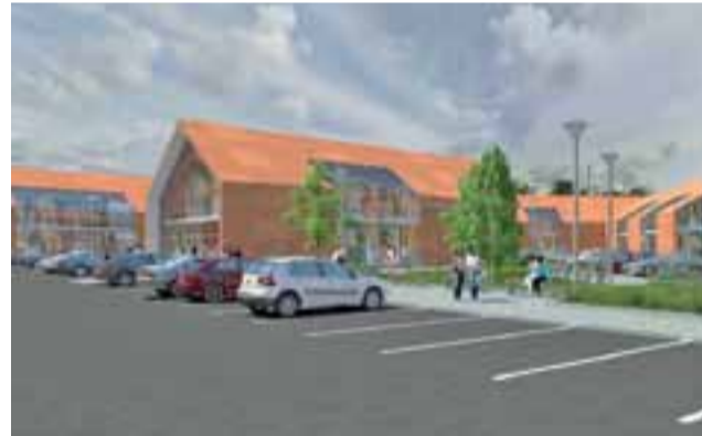
Wizualizacja. Tak może wyglądać teren przy ul. 3 Maja w Łowiczu.

O pomysły na wybudowanie nowego centrum handlowego przy ul. 3 Maja pisaliśmy w NŁ na początku października. Wstępne założenia zakładały wybudowanie tam nawet 5 budynków