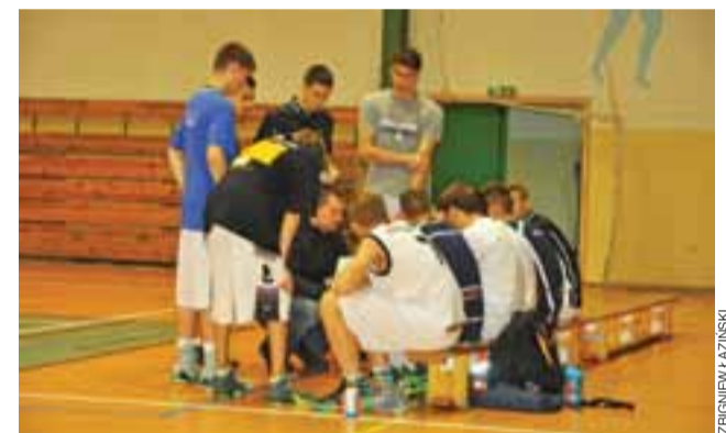
Juniorzy starsi UMKS Książek nie mieli powodów do radości.

W 5.kolejce juniorzy starsi UMKS Książek grają w piątek 6 listopada w Łowiczu z ekipą