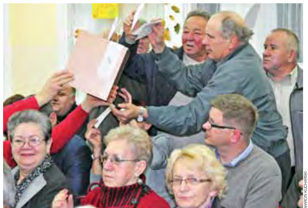
Spotkanie na Bratkowicach cieszyło się dużym zainteresowaniem mieszkańców. Na zdjęciu moment głosowania na przewodniczącego zarządu dzielnicy.

Pomysł poszerzenia ulicy Młodzieżowej oraz wybudowania