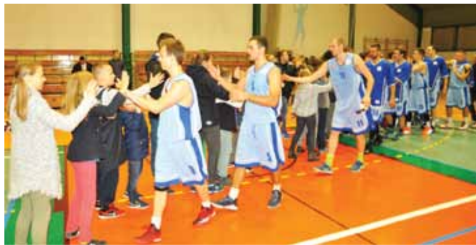
Po meczu koszykarze Księżaka podziękowali kibicom.

Koszykówka | zapowiedź 5. kolejki II ligi koszykówki