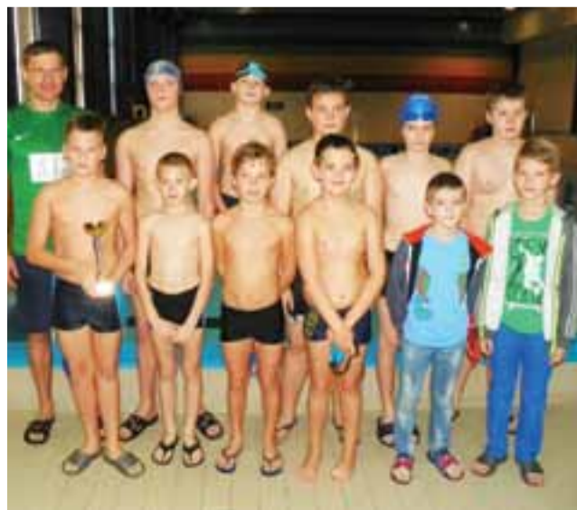
Mistrzowie powiatu łowickiego z SP 2 Łowicz.