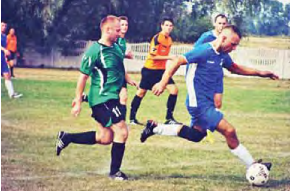
Korona II Wejście pokonała Zjednoczenie w zaległym meczu B klasy.