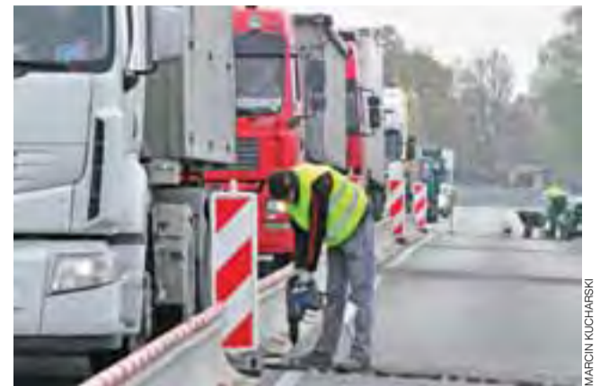
Prace na moście odbywają się przy wyłączonym jednym pasie ruchu.

– Nie jest praktykowane, aby miasto miało dwóch patronów – wyjaśniał burmistrz. Warto dodać, że imię błogosławionej nosi skwer, ulica oraz Przedszkole Diecezjalne przy ul. Seminaryjnej. Jej imię funkcjonuje w tzw. przestrzeni publicznej. mwk