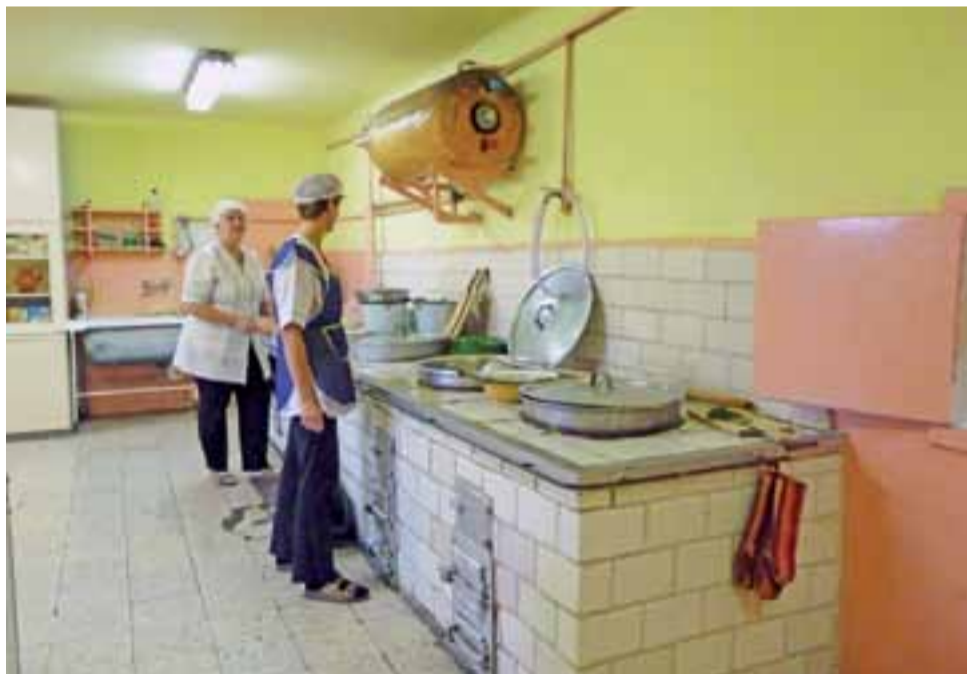
Kucharki z SP nr 1 podczas pracy przy kuchni węglowej.