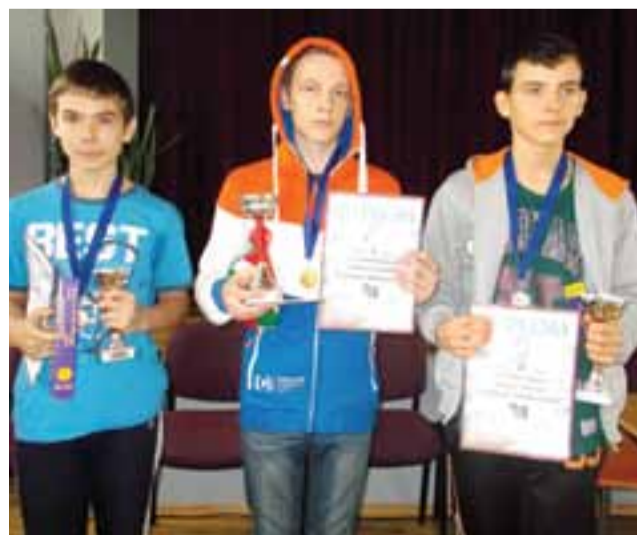
Najlepsza trójka szachistów turnieju w Zdunach.

go Klubu Sportowego-Wiking TKKT (Taekwondo, Karate, Kultura, Tradycja) uważamy za udany zważając na liczbę 7 medali wracających z Pionków. pb