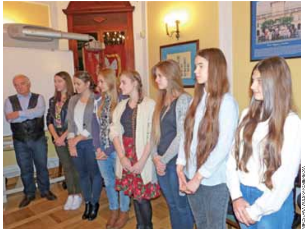
Uroczyste podziękowanie dla najstarszych tancerek zespołu.