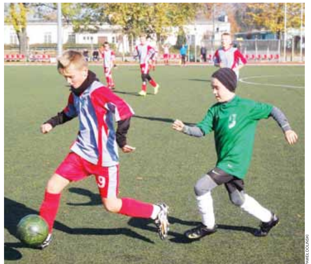
Pelikan 2003 ograł Mazovię aż 5:0!