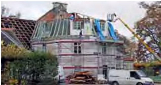
Prace obejmują wymianę poszycia i części konstrukcji dachu.