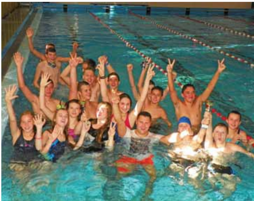
Ekipa Gimnazjum nr 2 była najlepsza wśród dziewcząt i chłopców.