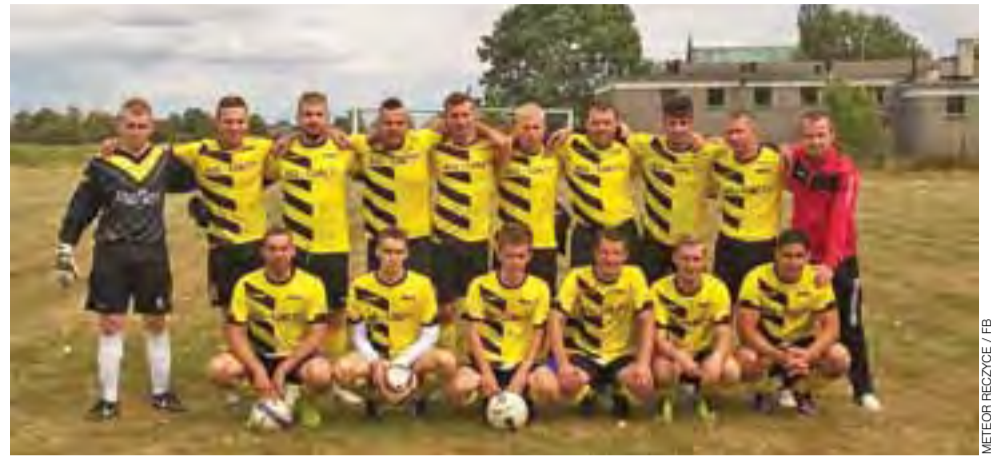
Meteor Reczyce zagra w niedzielę z Fenixem Boczeki.

7 listopada (sobota), godzina 14:00: Laktoza Łyszkowice – Orleża Cielądz: Laktoza po porażce w Łowiczu będzie chciała się odegrać. W Łowiczu grające trenera Artura Dziuby