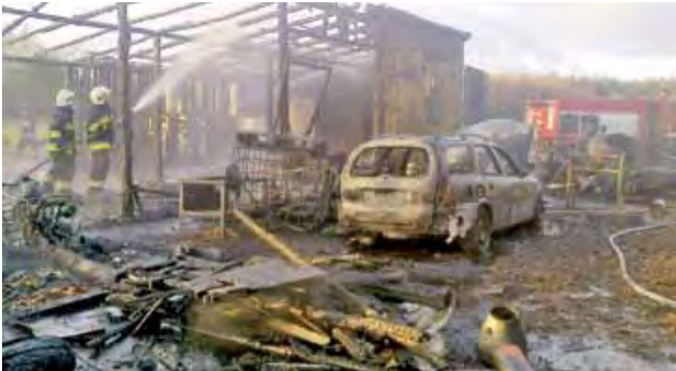
Pogorzelisko w Skarżysku pod Lasem. Magazyn spłonął całkowicie wraz z wyposażeniem i samochodem, który widać w centrum zdjęcia.

NASI DZIENNIKARZE DO WASZEJ DYSPOZYCJI OD 8.30 DO 15.30 Telefon redakcyjny 535 455 336 e-mail: agnieszka.antosiewicz@lowiczanie.info AGNIESZKA ANTOSIEWICZ