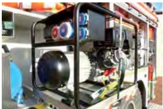
Wyposażenie samochodu nabytego przez PSP jest sprzętem najnowocześniejszym spośród dostępnych na rynku.

Z kolei charakterystyczny, zielony Star 200 (pojazd kwatermistrzowski) zostanie przekazany Powiatowemu Zarządowi Dróg w Łowiczu. tm