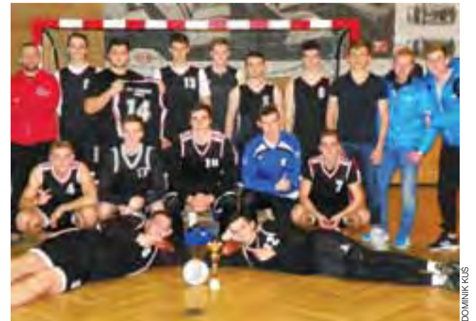
Reprezentacja szczypiornistów z Ekonomika zdobyła mistrzostwo powiatu łowickiego i awansowała również na finały wojewódzkie w Wieluniu