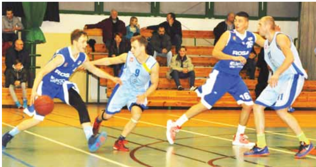
Łowiczanie we własnej hali nie pozwolili rywalowi na zbyt wiele.