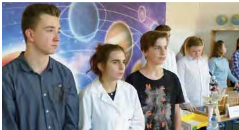
Gimnazjaliści, którzy wzięli udział w pokazowej lekcji w nowej ekopracowni.