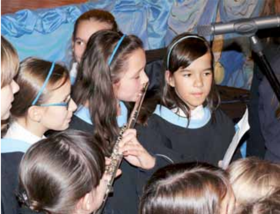
„Kalasancjuszu prowadź nas, aż do nieba, pośród gwiazd” – śpiewały dzieci ze scholi szkoły pijarskiej.