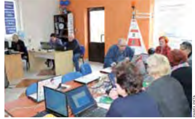
Latarnicy Polski Cyfrowej poza Łowiczem prowadzili już zajęcia w Chańsku, Zdunach, Łyszkowicach, Domaniewicach, Arkadii, Bełchowie i Bednarach. Na zdjęciu jedna z grup w biurze Platformy Obywatelskiej na os. Kostka w Łowiczu.