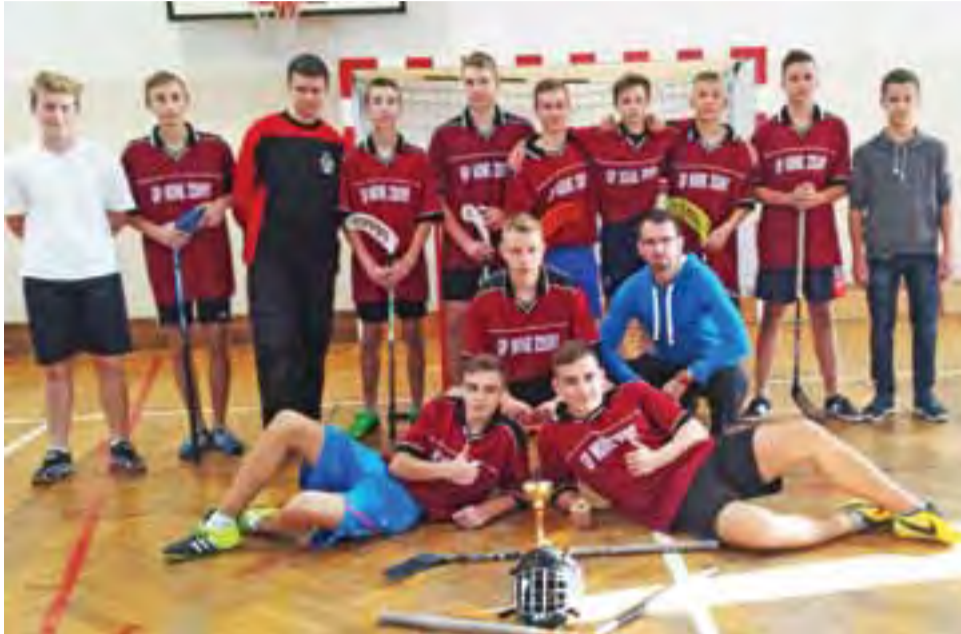
Reprezentacja mistrzów powiatu łowickiego w unihokeju z Nowych Zdun.

Mistrzowie powiatu zagrają oczywiście w zawodach rejonowych, gdzie zwycięstwo daje