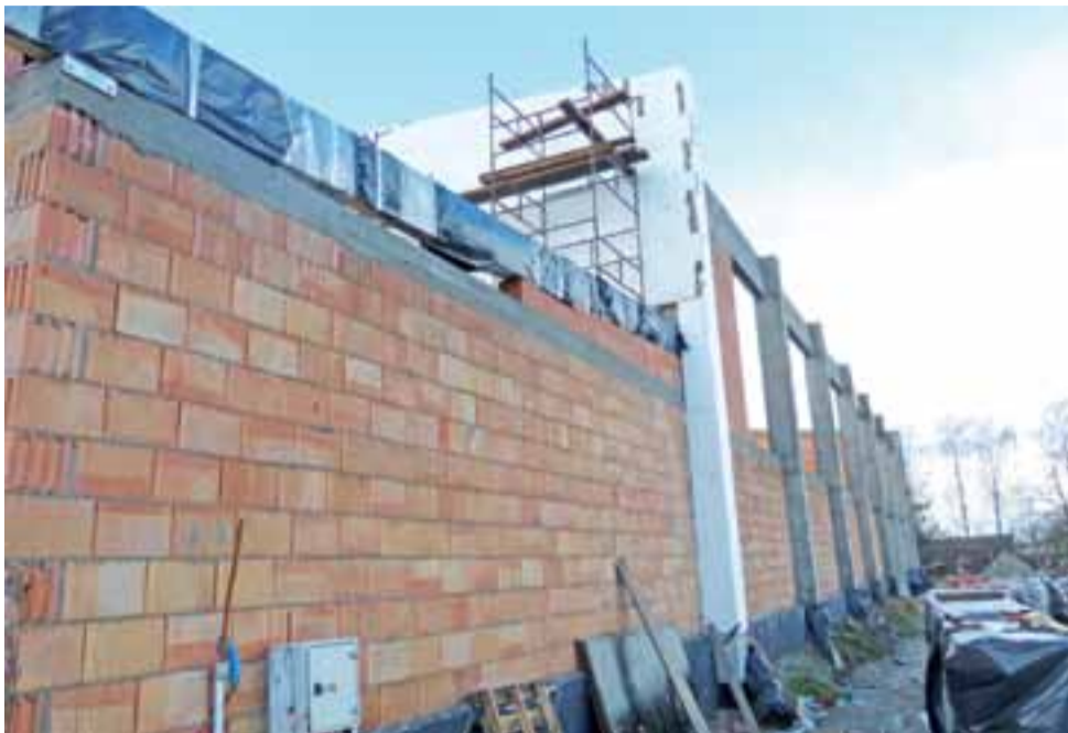
Wykonawca zapewnia, że poradzi sobie z wykonaniem inwestycji w ciągu 7 miesięcy, pomimo powstałych opóźnień przy budowie dachu.

Zdaniem urzędnika w projekcie nie było błędów i raczej nie można było go podważać na etapie prowadzonych prac. Zainteresowane wykonawstwem inwestycji firmy mogły zgłaszać to w czasie trwania przetargu. – Obu stronom zależy, aby halę pobudować i oddać do użytku – mówi urzędnik