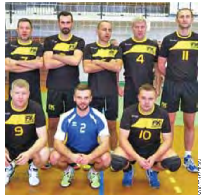
Nauczyciele w-f z powiatu łowickiego w Supraślu zdobyli wicemistrzowski tytuł.

2. kolejka XVII edycji SAM (4.12.2015 roku, godz. 17:30): OSP Seligów – Volleyball Głowno (sektor A); LKS Retki – UKS Korabka Łowicz (sektor B); UKS Piąrkowska Łowicz – Chelmoński Łowicz (sektor C)