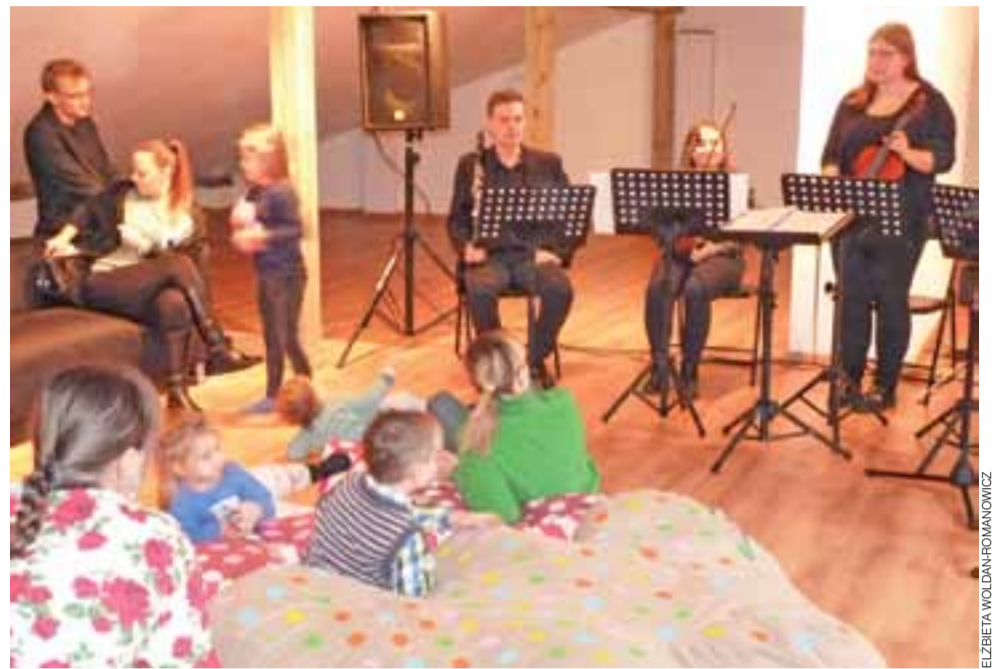
Najmłodszy mieli okazję zapoznać się z instrumentami muzyków orkiestry Sonus.