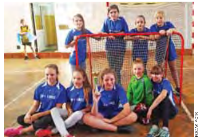
Reprezentacja dziewczyn z SP 1 Łowicz była najlepsza.