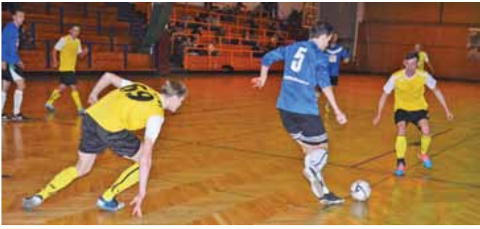
Bez Nazwy wygrało w końcówce z Projectem GT.