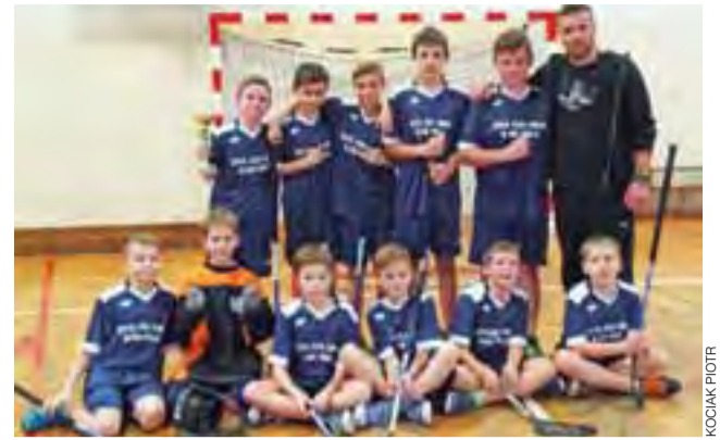
Chłopcy z SP Stary Waliszew sprawili niespodziankę.