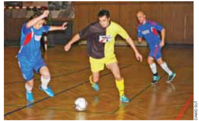
Blekiersi zremisowali z Dach-Luxem 2:2.

■ CHIŃSKA PRULUX BIS Haczykowszczyk Łowicz – SMS Dąbkowice