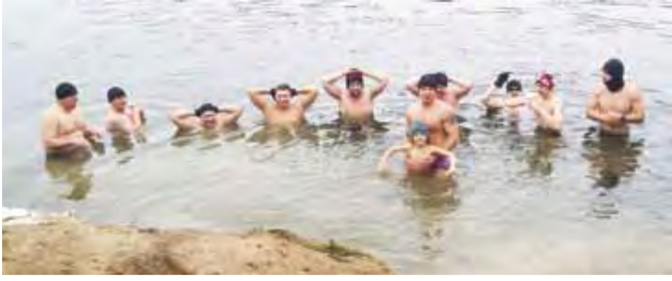
Kąpiel w wodzie, która ma 5 stopni ma wiele zalet.