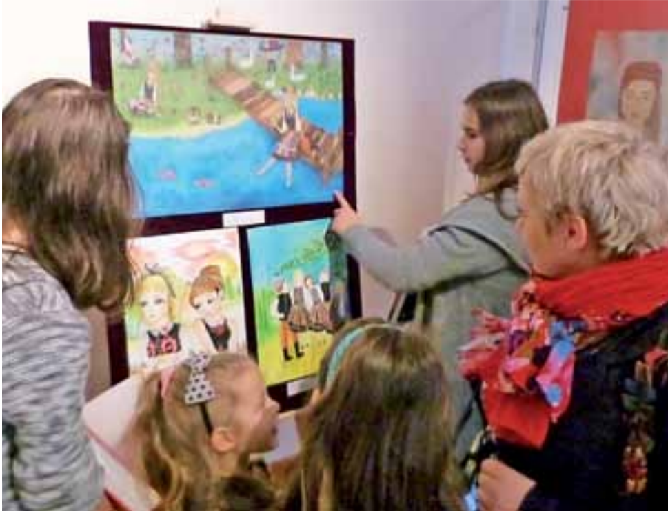
Dużym zainteresowaniem cieszył się wernisaż wystawy pokonkursowej.