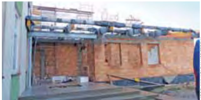
Wstrzymane na 2 miesiące prace wykonawca rozpoczął od widocznego na zdjęciu dachu nad wejściem do hali od strony wschodniej.

Kierownik budowy też wyjaśnia powstały problem błędami w projekcie ustawą o zamówieniach publicznych, która utrudnia, a czasami wręcz uniemożliwia wykonanie projektu zastępczego, gdy jest taka potrzeba. Jak zapewnia – wcale nie jest to rzadkością, że podczas realizacji okazuje się, że w dokumentacji są poważne błędy. Czasem są na niekorzyść wykonawcy, czasem inwestora. Nie widzi nic złego w tym, że wykonawca chciał poprawić błędy. mwk