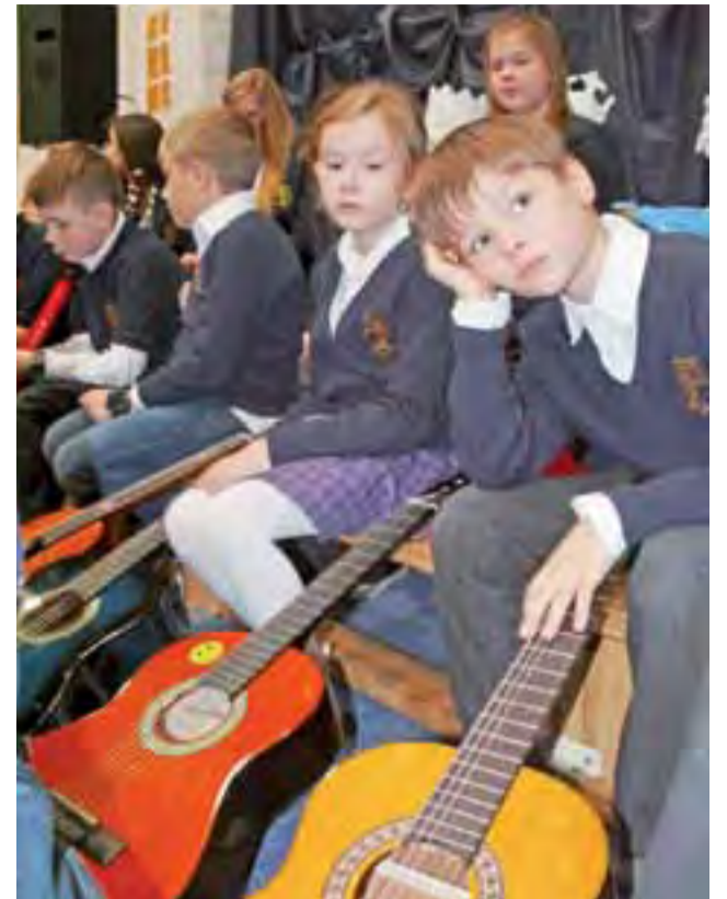
Młodsza grupa gitarzystów, którzy wspierali scholę, gdy nie grała, w skupieniu oglądała przedstawienie.

Warto podkreślić, że na koniec spotkania na sali głos oddano uczniom szkoły, którzy wystąpili w przedstawieniu pt. „Boży Szaleńcy”. Scenariuszem i reżyserią zajęła się polonistka Beata Jeziorowska, która już w przeszłości dała się poznać z przygotowywania innych przedstawień.