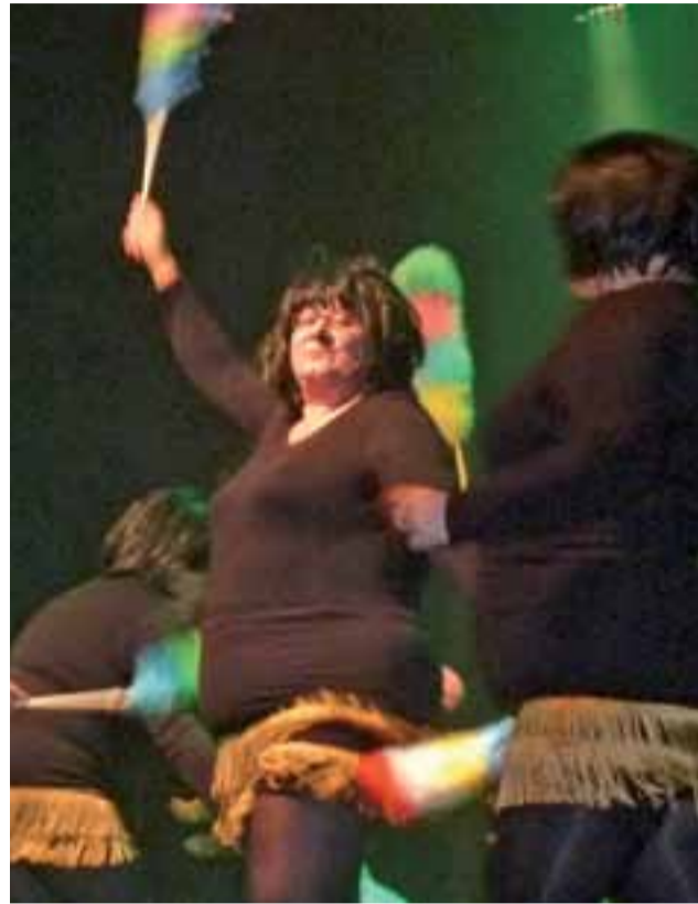
Wirujące seniorki. Premierowa prezentacja spektaklu tanecznego na scenie Łowickiego Ośrodka Kultury.

Celem realizowanego do września br. projektu „Wirujący senior” było pobudzenie do aktywnego działania przez taniec i ruch, poznawanie różnych form artystycznego wyrazu, rozwijanie zainteresowań i integracja łowickich seniorów. Była to już trzecia artystyczna inicjatywa AleBabek!, które jako nieformalna grupa artystyczna zawiązały się dwa lata temu (gdy pierwszy sceniczny projekt realizował Zarząd Osiedla Przedmieście wspólnie z klubem amatek). Wystawiły wówczas „Szafę”, następny był „Kopciuszek”, a teraz przyszedł czas na „Wirującego seniora”.