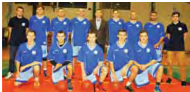
Ekipa Księżaka w nowym składzie nadal pewnym liderem w grupie B.

Nadal blisko czołówki są koszykarze z AZS-u Lublin, którzy w minionej kolejce pokonali