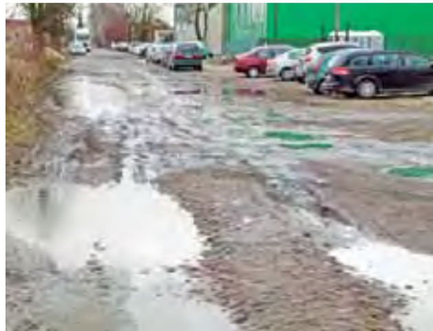
Tonący w błocie fragment ulicy Strzelczewskiej w okolicach Lameli w Łowiczu.

Ulica Sochaczewska będzie miała długość 611,5 m, szerokość 7 m oraz 2-metrowy chodnik od strony północnej. Zostanie na niej przebudowane oświetlenie uliczne. Strzelczewska na odcinku o długości 583 m od Poznańskiej będzie drogą 7-metrowej szerokości, dalszy jej odcinek, w stronę ul. Chelmońskiego, będzie miał szerokość 6 m. Tu też powstanie