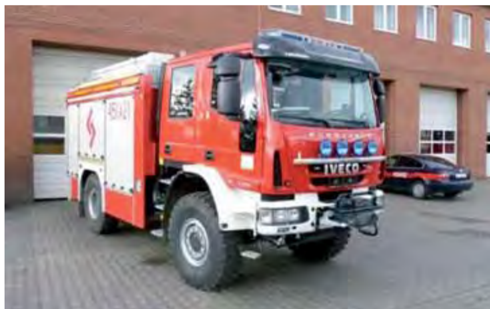
Nowy nabytek KP PSP Łowicz przed garażem.

Wartość tego samochodu to 895.860 zł. Zamówienie jest częścią szerszego programu Komendy Głównej PSP w porozumieniu z komendami wojewódzkimi. Został zrealizowany z funduszy europejskich, w ramach projektu