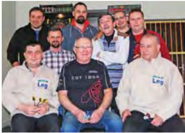
Humory dopisują przed kolejnym turniejem darta.