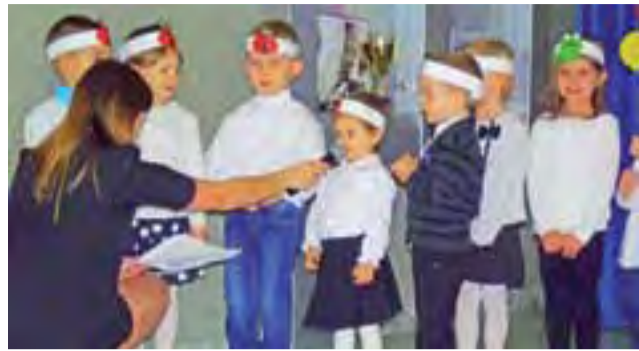
Przedшкоlaki przygotowały na tę okazję wiersze.