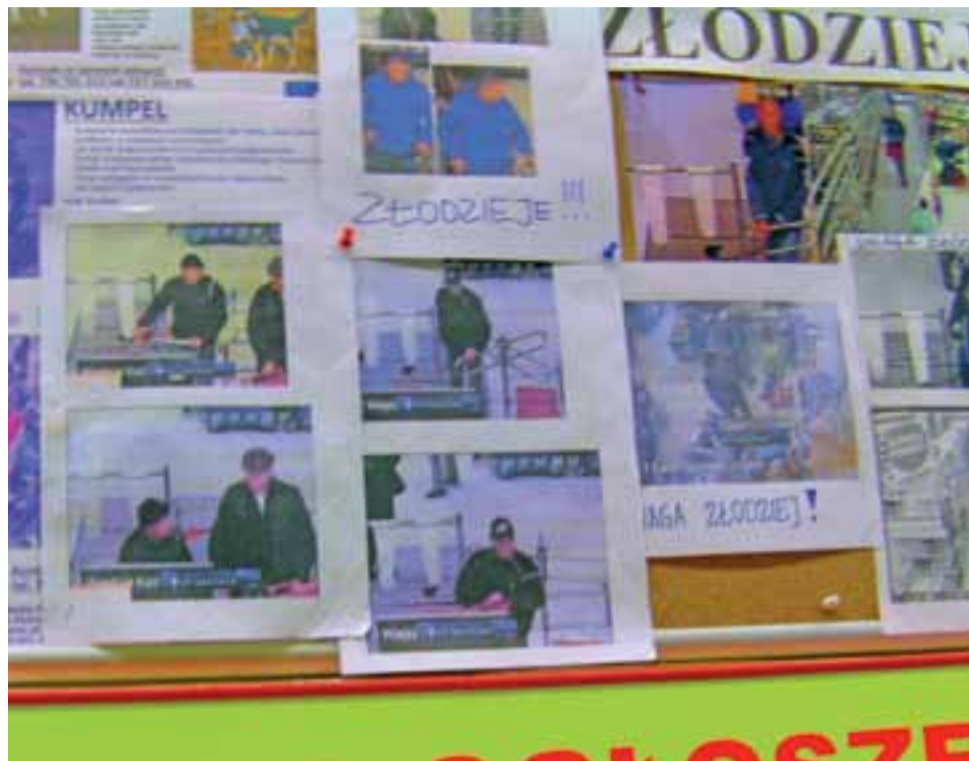
Kadry z monitoringu były wywieszane na tablicy ogłoszeń.

„To, że ktoś nie został zatrzymany na linii kas, nie oznacza, że nie poniesie konsekwencji. Nagrania są analizowane i przekazywane do prawników.”