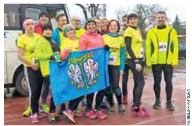
Reprezentacja rozbieganego osiedla Starzyńskiego.

Po biegu w Bełchatowie podsumowano Cykl 9 biegów o Puchar Marszałka Województwa Łódz-