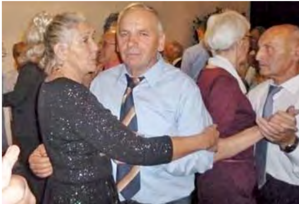
Andrzejki były dobrą okazją do pierwszej po dłuższej przerwie zabawy tanecznej.

Jedną z atrakcji tej zabawy był walczyk z różami, w którym panowie wręczali swoim tancerkom róże. 50 kwiatów zostało zakupionych przed imprezą i panowie mogli je nabyć (po cenie zakupu). Jeden z nich był wyjątkowo szczodry, ponieważ kupił i podarował swojej tancerce aż 9 kwiatów.