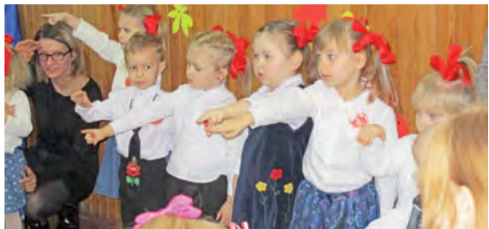
Wszystkie dzieci złożyły uroczystą przysięgę.