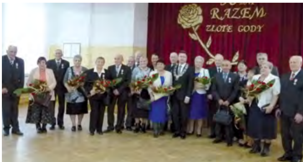
Pamiątkowe zdjęcie po wręczeniu medali.