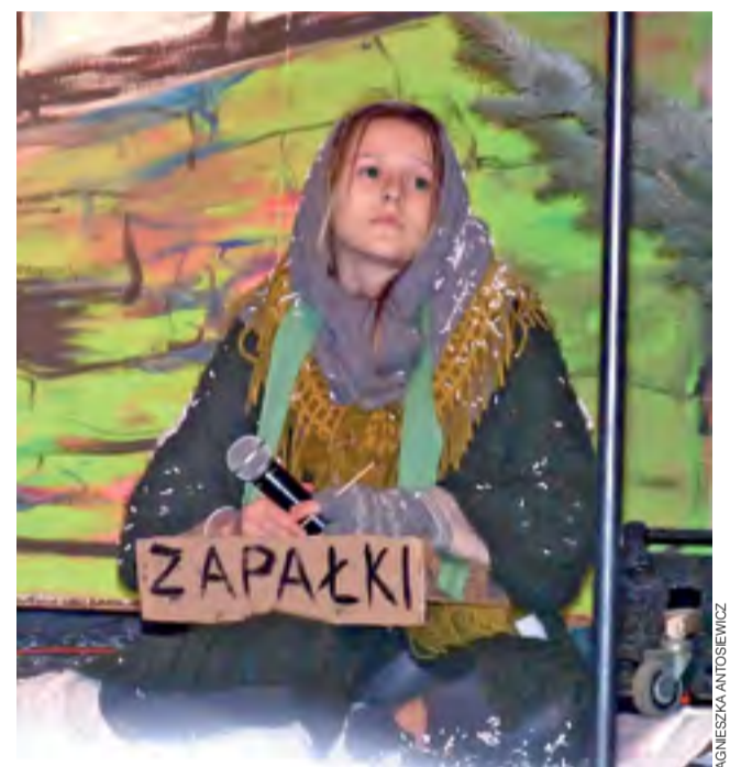
A tu już tytułowa „dziewczynka z zapalnikami” – zziębnięta, samotna i głodna.

Strażacy przygotowali niezwykle ciekawy program. Zaba-