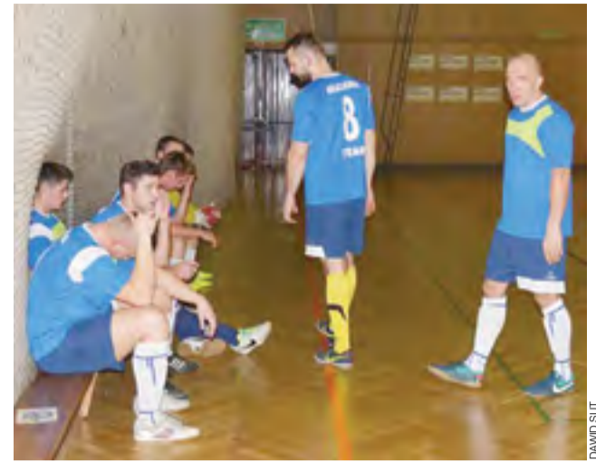
Akacja Team w niedzielę przegrała z Zatorzem II 3:1.