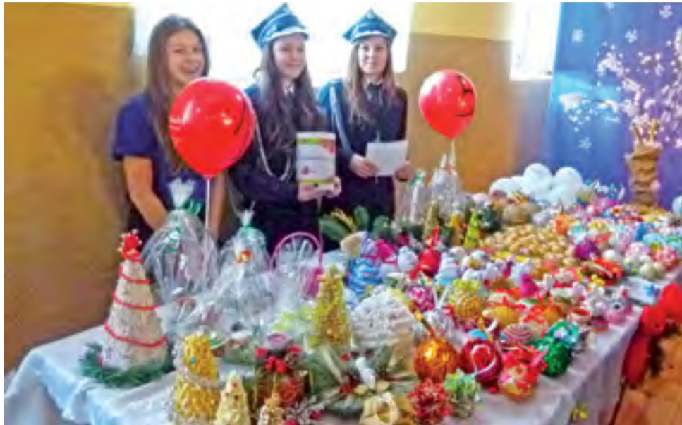
W czasie imprezy organizatorom udało się sprzedać wszystkie ozdoby na kiermaszu.

Co do samego zbierania funduszy, organizatorzy nie ograniczyli się jedynie do postania wolontariuszy z puszkami. Wielką atrakcją był m.in. kiermasz, na którym można było nabyć,