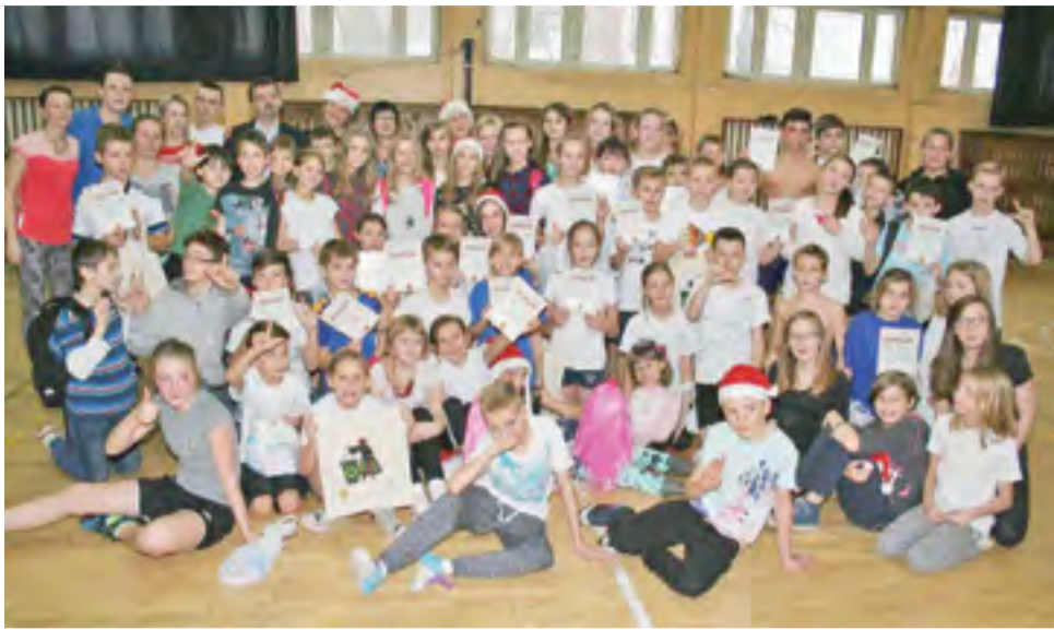
Młodzi uczestnicy Turnieju Mikołajkowego w koszykówce.

Goście pomagali organizatorom, sędziując na zmianę poszczególne mecze, a kibicujący uczniowie dopingowali swoje drużyny transparentami i okrzykami. W rywalizacji najlepszą wśród dziewcząt okazała się drużyna Tę-