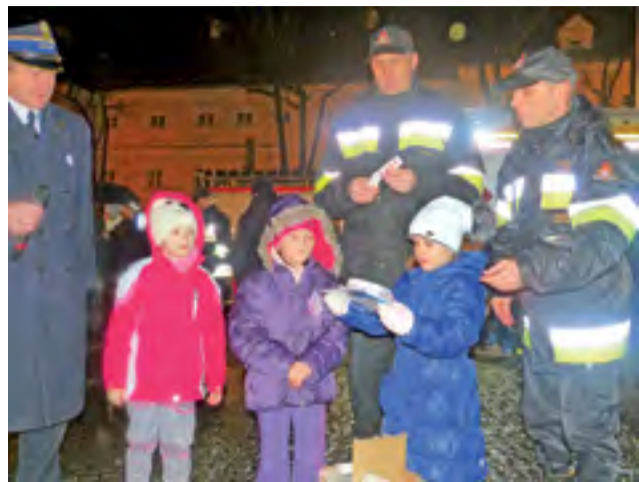
W losowaniu czujników czadu dzielnie pomagali dzieci wybrane spośród publiczności.

wy edukacyjne, pokazy udzielania pierwszej pomocy, gaszenie kontrolowanych pożarów i pokazy ratownictwa – to tylko niektóre z zaproponowanych atrakcji. W specjalnie wydzielonej strefie Starego Rynku ratownicy z KP PSP w Kutnie, którzy współpracują z łowicką komendą, zaprezentowali pokaz ratownictwa chemiczno-ekologicznego. Zademonstrowali, jak wygląda standardowe postępowanie w przypadku, gdy wycieka toksyczna substancja.