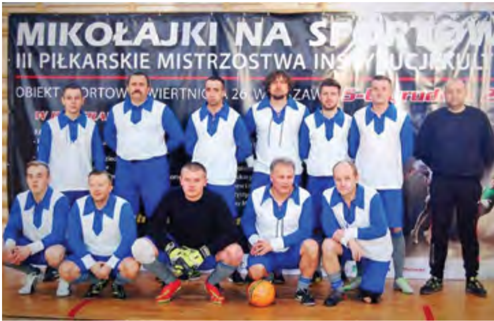
Drużyna z Łowicza nie wyszła z grupy.

Łowicka drużyna miała przydomkę „Biało-Niebiescy”, występowała w trykotach w takich kolorach na styl retro. Drużyna 10 Pułku Piechoty w pierwszym meczu przegrała wysoko bo aż 4:1 z Galerią „Brama Bielańska”. W drugim meczu łowiczanie prowadzili na dwie minuty przed końcem meczu 1:0 z Fundacją Orkana, ale wtedy do roli głównej wskoczył sędzia który podyktował rzut karny z „kapelu-