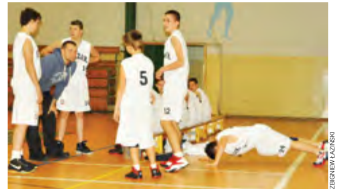
Młodzicy Księżaka mają na koncie komplet 6 zwycięstw.