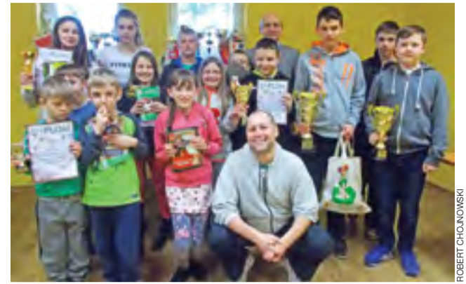
Zawodnicy i organizatorzy wspólnie po turnieju w Nieborowie.

Obecnie Bródka zajmuje 25 miejsce w klasyfikacji generalnej Pucharu Świata na dystansie 1500 metrów. Nie może być jeszcze pewien startu na tym dystansie podczas najważniejszej imprezy sezonu – Mistrzostw Świata w Kolonii. Na tą imprezę kwalifikuje się 14 najlepszych zawodników z Pucharu Świata + 10-ciu z najlepszymi czasami w tym sezonie. O poprawę czasu będzie już ciężko (tury w Europie są sporo wolniejsze niż te w Ameryce Północnej), pozostaje więc raczej walka o punkty. Do osiągnięcia celu wystarczy zwycięstwo lub drugie miejsce w grupie B w Heerenveen. Radosław Tafliński