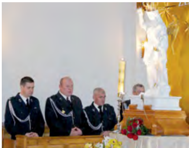
Figura św. Michała Archanioła stojąca przed ołtarzem w kościele w Bobrownikach. W uroczystościach wzięły udział także delegacje jednostek Ochotniczych Straży Pożarnych z Bobrownik i okolicy.

Figura przybyła do Bobrownik wprost z Częstochowy we wtorek, przed godz. 12.00. Czekano na nią kilkuset wiernych zgromadzonych przed kościołem, po powitaniu została ona procesyjnie wprowadzona do świątyni. Zanim rozpoczęła