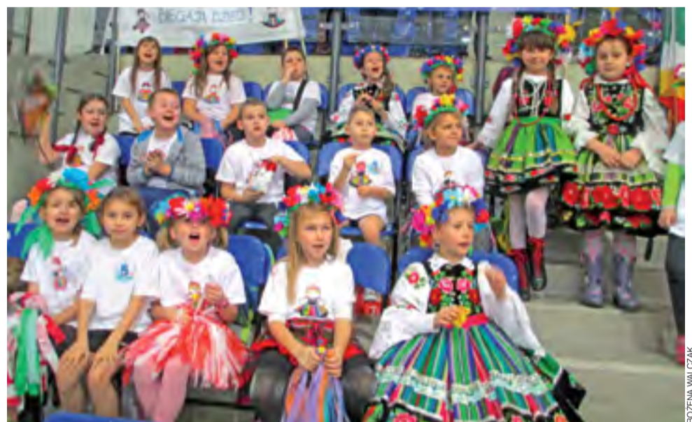
Kibice z klasy II b Szkoły Podstawowej w Łyszkowicach dopingujący reprezentację szkoły.

Dwójka zawodników z Łyszkowic podczas wyjazdu do Łodzi