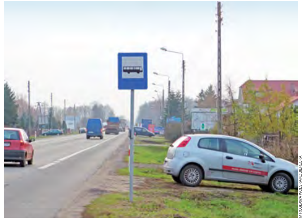
Jedyny przystanek na ul. Łódzkiej, który obecnie funkcjonuje między rondem a pętlą autobusową, położony jest na wysokości posesji nr 82.

Dlatego wielu mieszkańcom zależy o tym, aby zmniejszyć ten dystans choćby o 200-250 m. – Dla młodej, zdrowej osoby to może nie jest dużo, ale dla osób starszych, wracających z miasta z zakupami czy odbierających wnuki ze szkoły, to jest naprawdę duża odległość – mówi nasz rozmówca. – To są takie przepychanki pomiędzy miastem a GDDiA, na których cierpią ludzie. Mam nadzieję, że miasto nie odpuści tematu, abyśmy tego przystanku nie stracili. Jesteśmy rozżaleni, ponieważ prosząc czy o chodnik, czy o przystanek dostajemy odpowiedź, że ul. Łódzka to droga krajowa, że powinniśmy zwracać się do GDDiA. Ale przecież jako mieszkańcy nie jesteśmy tam stroną. Tym muszą się zająć urzędnicy i będziemy na to nalegać!