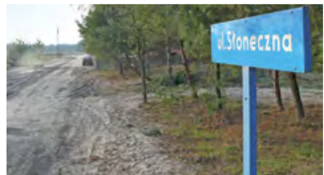
Ulica Słoneczna jest jeszcze ulicą gruntową.