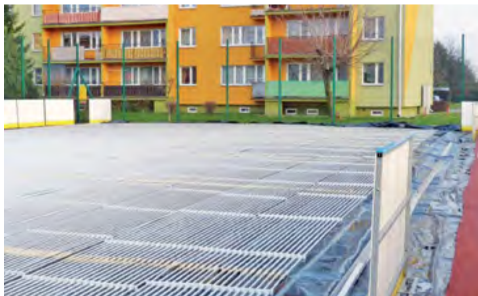
Na mniejszym boisku Orlika przy ul. Bolimowskiej ułożono już orurowanie.