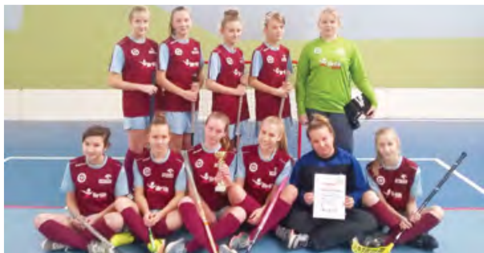
Jaki kolor medalu zdobędą dziewczyny z Nowych Zdun?