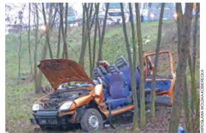
W wypadku najbardziej ucierpiała kobieta kierująca Fiatem Seicento, który spadł z nasypu. Strażacy rozcinali karoserię, aby ją wydobyć z auta.

Uszkodzeniu uległ też lewy bok Citroena, którym kierował 46-letni mieszkaniec powiatu kutnowskiego oraz tył Hyundai, którym z kolei kierował 48-latek z powiatu łęczyckiego. Poza kierującą Fiatem Seicento jeszcze trzy osoby doznały urazów w czasie wypadku, ale nie wymagały hospitalizacji. Pomocy udzielono im na miejscu. mwk