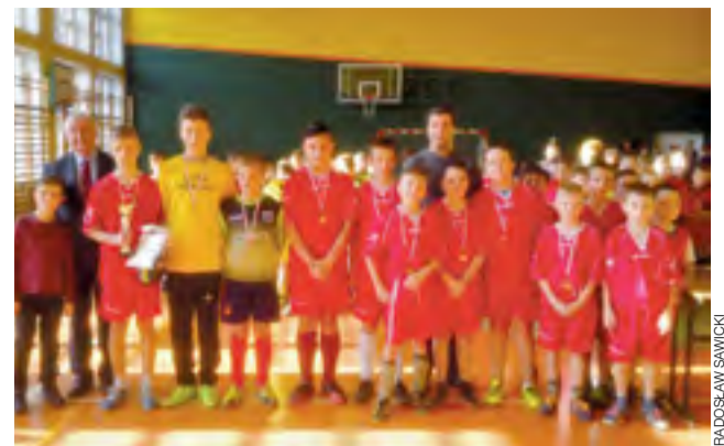
Ministranci z Domaniewic zajęli I miejsce w eliminacjach, pokonując m.in. faworytów z Belchowa. Na zdjęciu z pucharem dla zwycięzców.

Pytany o to, jak sport wpływa na ich służbę w kościele i formację, nasz rozmówca przyznaje, że pomaga budować wspólnotę,