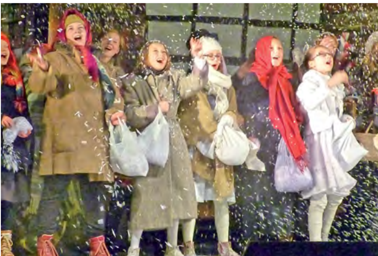
Dzieci ze Szkoły Podstawowej nr 1 wystawiły spektakl pt. „Dziewczynka z zapalnikami”, w trakcie którego sypały sztucznym śniegiem.