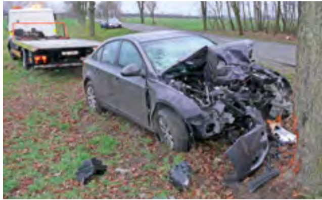
Rozpędzony Chevrolet Cruze uderzył centralnie w drzewo na prostym odcinku drogi tuż za Marianką.

Policjanci z Łowicza pod nadzorem Prokuratury Rejonowej w Łowiczu prowadzą postępowanie mające na celu wyjaśnienie okoliczności i przyczyn, które doprowadziły do wypadku. Rzecznik prasowy Komendy Powiatowej Policji w Łowiczu, podkom. Urszula Szymczak, informuje, że ze wstępnych ustaleń wynika, iż kierujący samochodem Chevrolet Cruze 56-letni mieszkaniec stolicy jadąc od Łowicza w kierunku Kierozia z nieustalonych przyczyn zjechał z drogi i uderzył w drzewo.