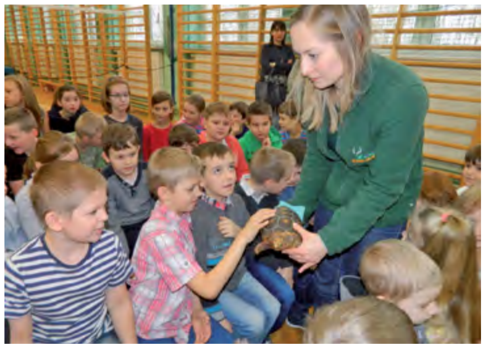
Ten żółw był jednym z gadów, które „złożyły wizytę” dzieciom ze szkoły w Mastkach.

Mieszkańcy Domaniewic często korzystają z przejścia/skrótu pomiędzy ulicami Sosnową a Kolejową. Gmina postanowiła wyjść im naprzeciw i poprawić warunki w tym miejscu. Dotychczas piaszczysta ścieżka zmieniła się w chodnik z prawdziwego zdarzenia, wyłożony kostką brukową. Zbudowano chodnik na długości 95 m, schodki oraz zjazd. Wartość 25.965,30 zł brutto prace wykonała firma Stefbuk ze Skaratek. kl