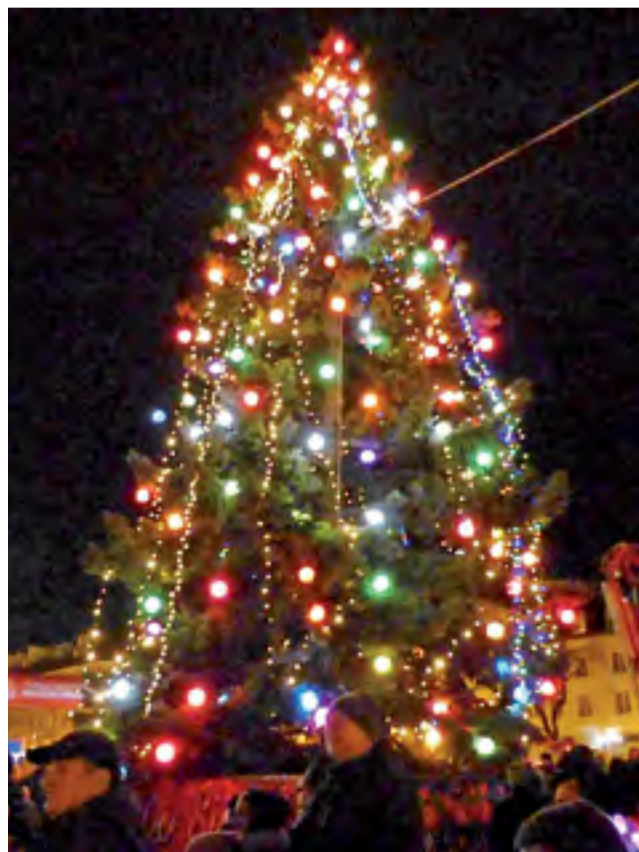
W czasie miejskiej imprezy oficjalnie zapalono lampki na świątecznym drzewku w sercu Starego Rynku.

Zapraszamy do oglądania galerii zdjęć na naszej stronie Lowiczanie.info