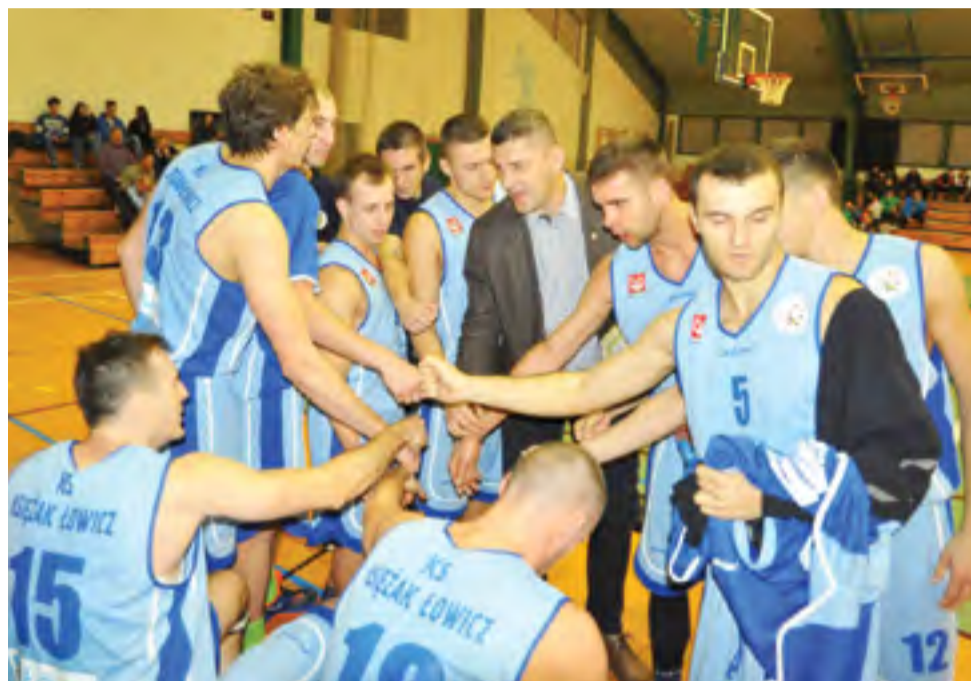
W niedzielę koszykarze Księżaka powalczą o dziesiąte zwycięstwo w Łowiczu.