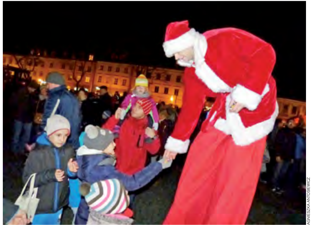
Mikołaje na szczudłach rozdawali cukierki wszystkim dzieciom.