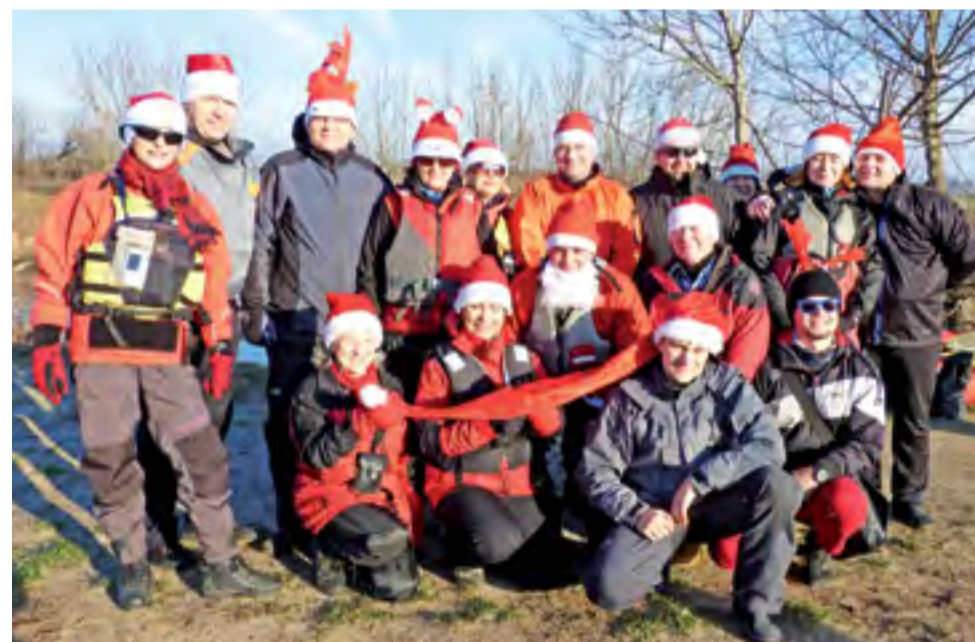
Kajakarze z „Albatrosa” i „Tratwy” chętnie pozowali do pamiątkowego zdjęcia.

Kajakarze przepłynęli trasę liczącą około 12 kilometrów, co zajęło im około 2 godzin. Po zakończonym spływie członkowie obu klubów wzięli udział w spotkaniu integracyjnym w lasku miejskim. aa