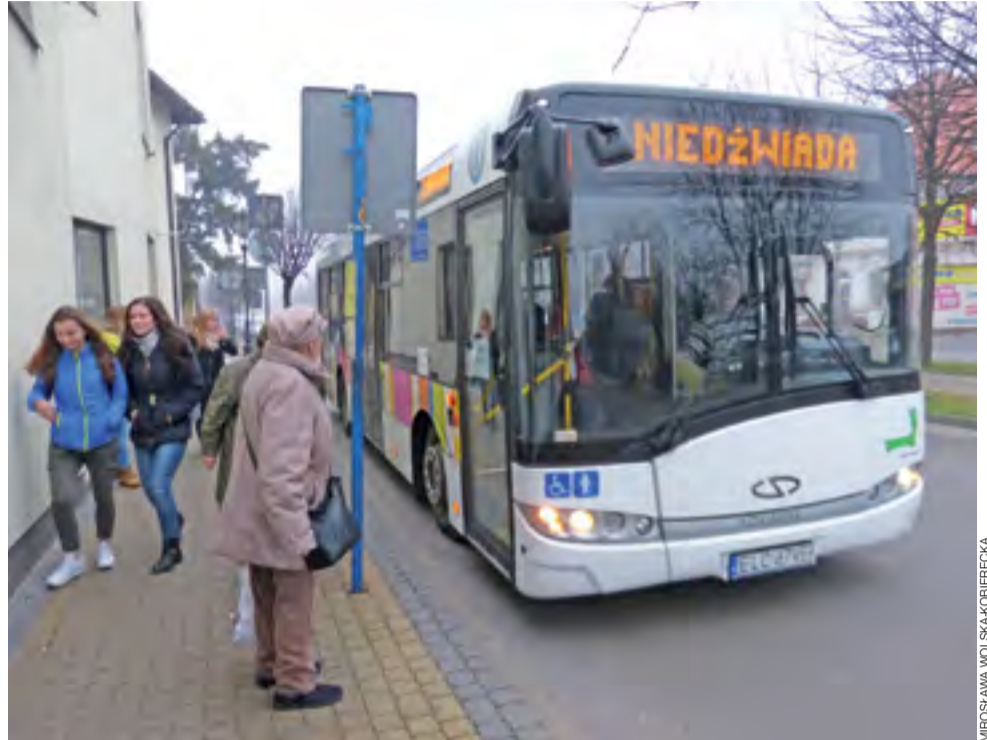
Z autobusów MZK Łowicz najczęściej korzystają uczniowie oraz osoby starsze. W ich ocenie największą bolączką komunikacji jest zbyt mała ilość kursów.

Osoby, które rzadko korzystają z MZK, najczęściej wymieniały zbyt rzadkie połączenia i rozkład niedostosowany do ich potrzeb.