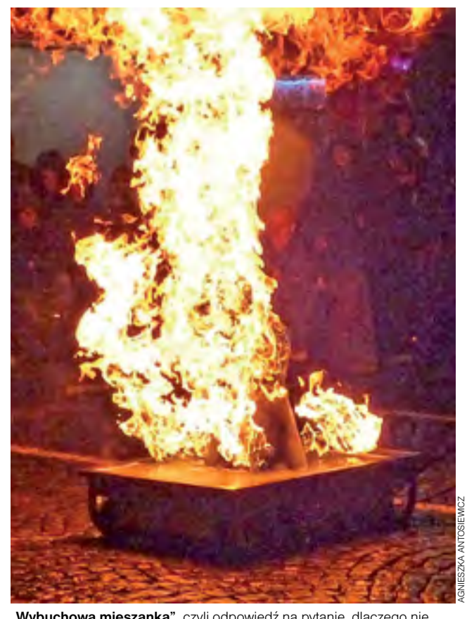
„Wybuchowa mieszanka”, czyli odpowiedź na pytanie, dlaczego nie wolno wrzucać puszek z aerozolami do ognia.