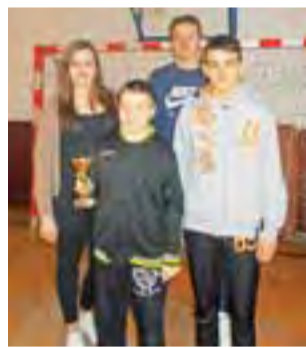
Drużyna z Gimnazjum nr 2 Łowicz została mistrzem powiatu łowickiego.

Po ciekawej walce okazało się, że najlepiej w tej rywalizacji poradzili sobie uczniowie z Gimna-