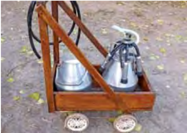
Konkursowe zdjęcie Michała Budzenia przedstawiające wózek do przewożenia baniek z mlekiem.