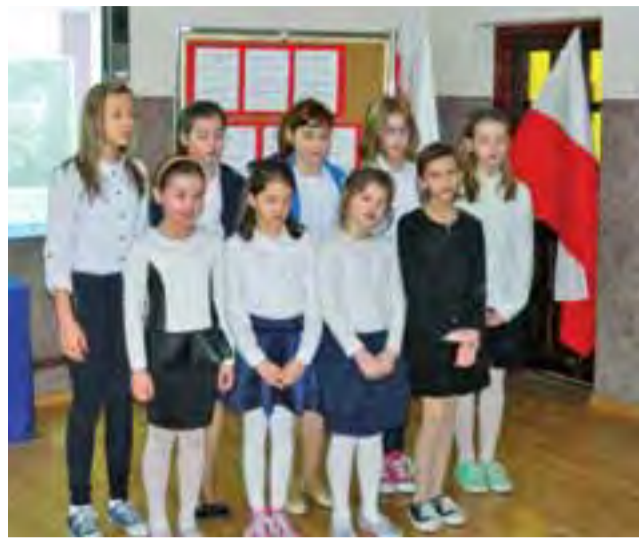
Uczniowie z Mastek jak co roku oddali hołd patronowi, który w tej miejscowości został rozstrzelany przez hitlerowców za walkę o wyzwolenie ojczyzny.