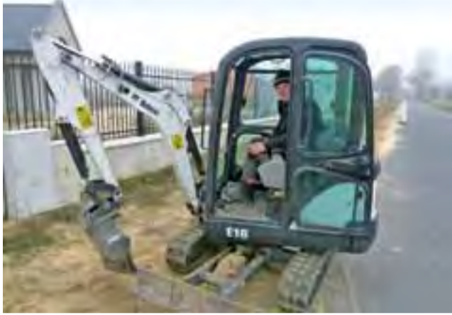
Prace nad położeniem światłowodu. Zdjęcie z listopada tego roku.

Oferuje podłączenie do Internetu o szybkości łącza od 20 do 300 Mb/s, telewizji kablowej w technice HD oraz telefonu stacjonarnego. W każdej lokalizacji możliwe jest osiągnięcie prędkości łącza 300 Mb/s. Prędkość zależy od wybranej przez abonenta