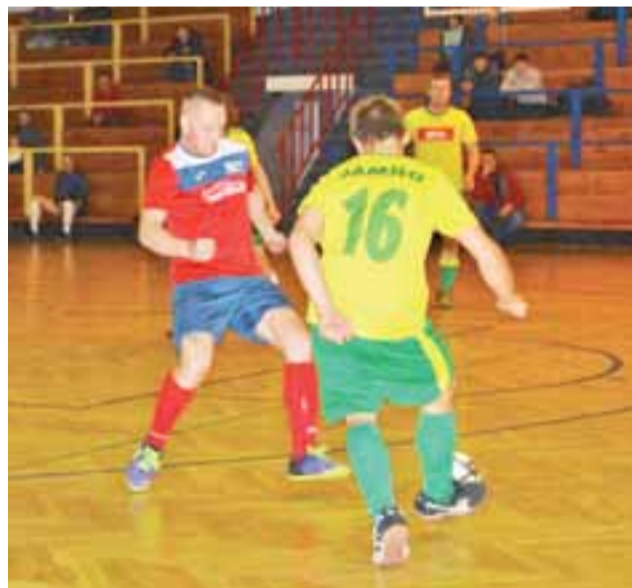
Auto-Strefa okazała się lepsza od Naprzodu Jamno.

■ Est To Ma Działac Łowicz – PP OSP Chruslin 1:6 (1:3); br.: Nor-