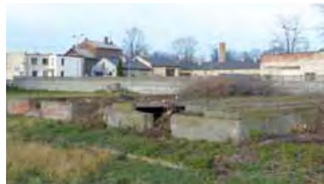
Nowy wjazd do zajezdni MZK planowany jest od strony ul. Nadburzańskiej, gdzie widoczne są jeszcze (na gruncie prywatnym) pozostałości zakładu zieleni miejskiej.

Kolejną częścią projektu – o czym pisaliśmy już na łamach NŁ – będzie szacowana na ponad 1 mln zł, planowana początkowo już na ten rok, budowa dużego parkingu przy dworcu PKP Łowicz Główny.