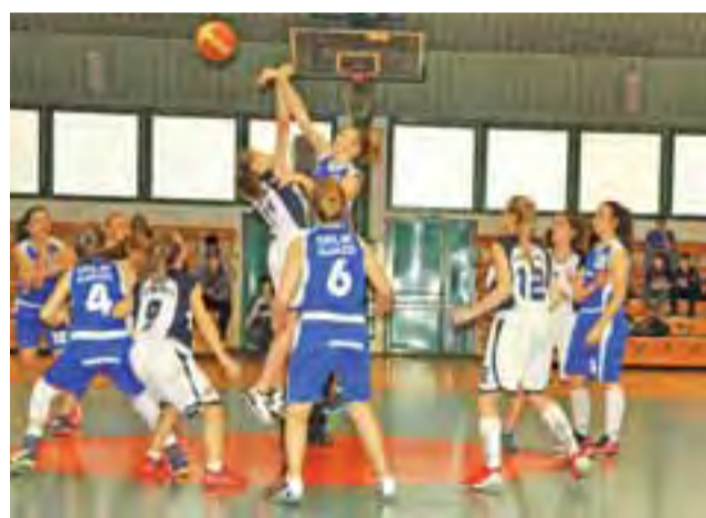
W starciu z UKS Orlik Ujazd nasze dziewczyny były bez szans.