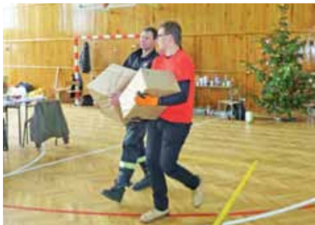
Każdą z ponad 600 paczek (z wyjątkiem np. węgla) trzeba było przenieść kilkakrotnie: do magazynu, do samochodu, do rodziny.

Wszystko udało się „spiąć” i jestem bardzo, bardzo zadowolona. Chciałabym podziękować wszystkim, którzy przy mnie stali: wolontariuszom, darczyńcom i innym osobom, które akcję wspierały – również kierowcom. Bardzo zadowolona jestem z tego, że wszystko, co zaplanowaliśmy, udało się zrealizować. Wolontariusze spisali się na medal i – co ciekawe – mam od nich sygnały, że są rozczarowani, że już akcja się zakończyła.