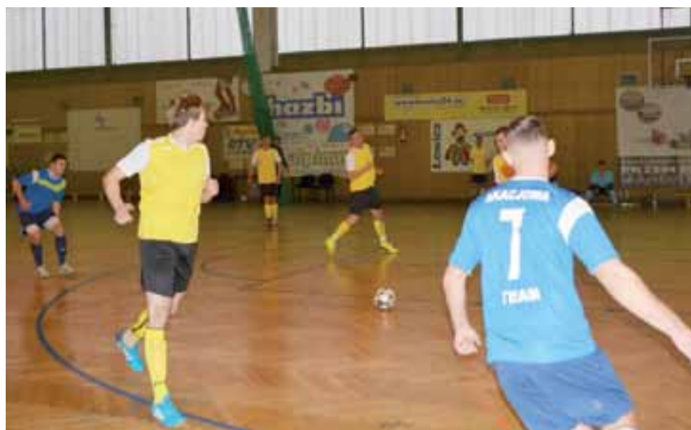
Akacja Team w niedzielę przegrała z Zatorzem II 3:1.