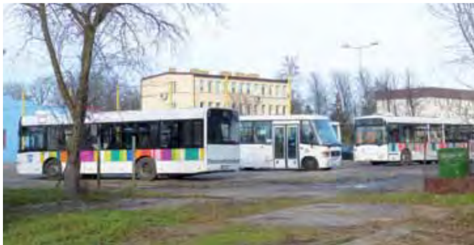
Autobusy MZK obecnie nie mają zadanej wiaty, a na widoczny na zdjęciu teren zakładu wjeżdżają korzystając z bramy ZUK, mieszczącego się po sąsiedzku.

Do autobusów (4 nowych i 7 będących już na stanie MZK) zakupione zostałyby mobilne biletomaty. Jedno takie urządzenie to wydatek rzędu 30 tys. zł. Oprócz tego stacjonarne biletomaty miałyby stanąć w 3 newralgicznych z punktu widzenia miejskiej komunikacji miejscach, a więc: przy