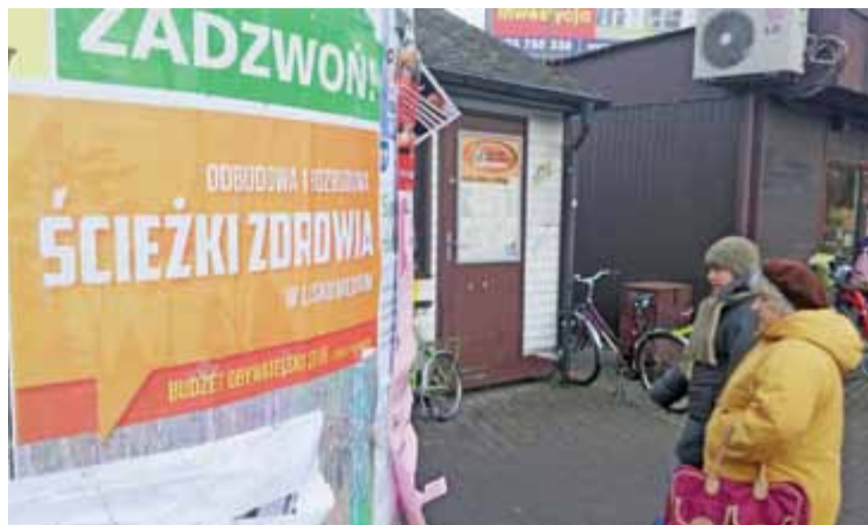
Odbudowa i rozbudowa ścieżki zdrowia w parku miejskim jako propozycja do budżetu obywatelskiego była reklamowana np. na słupach ogłoszeniowych przy miejskim targu.

■ Osiedle Bratkowice: Najwięcej głosów oddano na „Tartanowy kompleks sportowy” – remont nawierzchni boiska sportowego przy Zespole Szkół z Oddziałami Integracyjnymi w Łowiczu poprzez położenie tartanu oraz rozbudowa siłowni plenerowej o wyposażenie streetworkout – 97 głosów. Przegrały dwie inwestycje: poszerzenie ul. Młodziejowej – 42 głosy, budowa parkingu na odcinku od ul. Topolowej