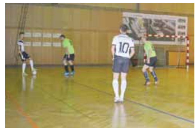
Toreliusz (białe stroje) pokonał Dąbro 4:1.