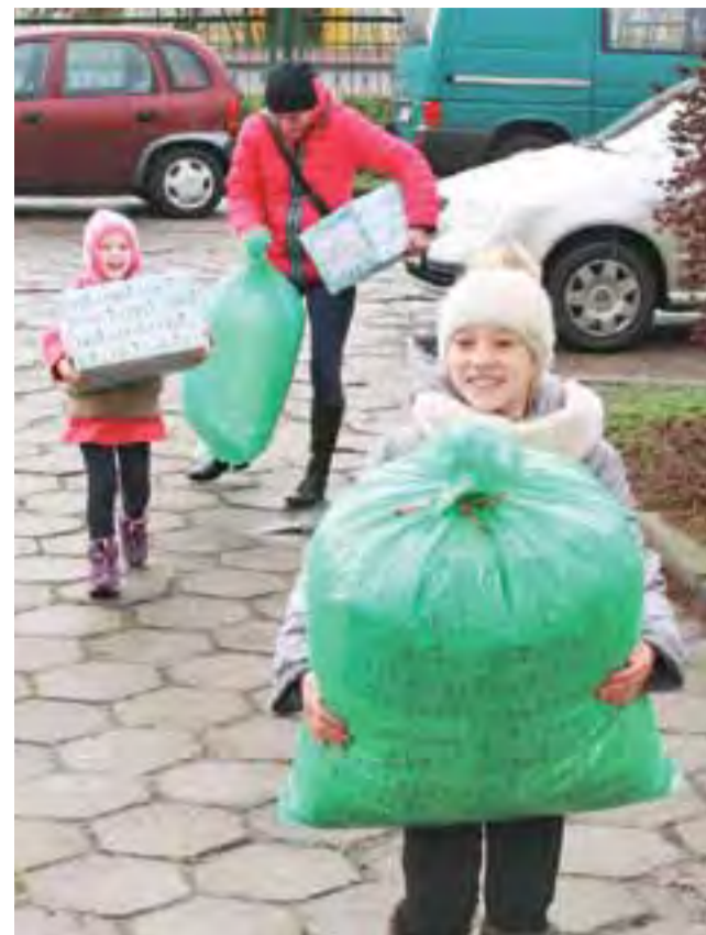
Uśmiech darczyńców nie jest pozowany. Każdy z nich mówi, że fajnie jest pomagać, a dobro wraca do tych, którzy dają go innym.