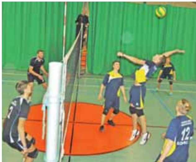
Siatkarze z Pijarskiej (po prawej) postawili wysoko poprzeczkę liderowi

Kolejne zmagania siatkarzy amatorów już w ten piątek o godzinie 17:30. W 4. kolejce XVII edycji SAM (18.12.2015 roku, godz. 17:30) zagrają: OSP Seligów – LKS Retki (sektor A), UKS Pijarska Łowicz – Volleyball Głowno (sektor B), Chelmoński