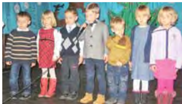
Każda z grup przedszkolnych, które wystąpiły w niedzielę, zaprezentowała program świąteczny.