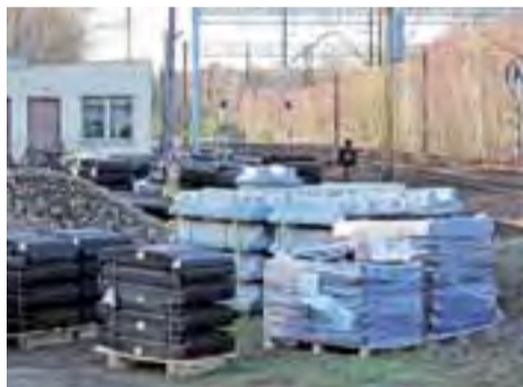
Wykonawca remontu przejazdu kolejowego już zwozi materiały oraz ustala okres wyłączenia przejazdu z ruchu i objazdy z zarządcą drogi krajowej.

Pałac w Sannikach zaprasza mieszkańców w niedzielę, 20 grudnia, na spotkanie wigilijne połączone z występami dzieci z pałacowego Ogniska Muzycznego oraz spektaklem o Bożym Narodzeniu w wykonaniu warszawskiej grupy artystycznej. Początek o godz. 17.00. Spotkanie jest otwarte dla wszystkich mieszkańców gminy Sanniki. Tradycją w gminie Sanniki jest to, że co roku spotkanie przygotowuje inna instytucja gminna, w tym roku pałac. Oprócz występów planowany jest poczęstunek wigilijny oraz spotkanie z Mikołajem, przy muzyce sannickiej, w wykonaniu działającej przy OSP orkiestry dętej. mak