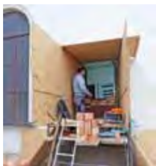
Rekonstrukcja fragmentu muru na południowej ścianie bazyliki.