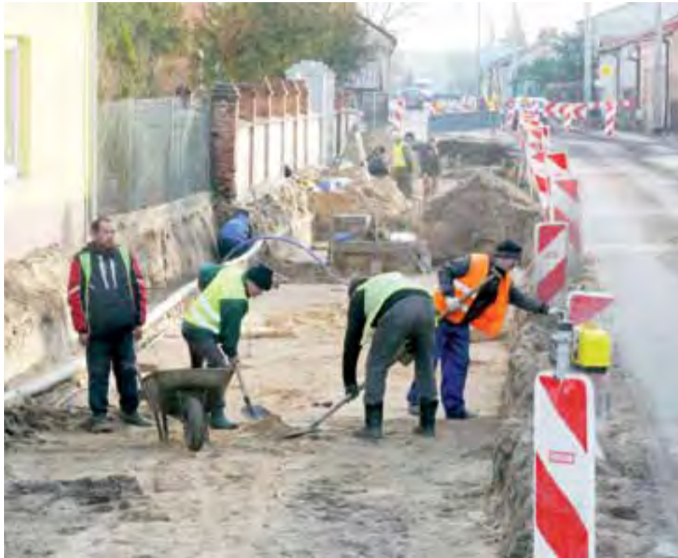
Prace archeologiczne prowadzone na ul. Skierniewickiej w Bolimowie doszły już do rynku. Badacze zajęli jeden pas ruchu, dlatego przejazd przez ten odcinek ulicy sterowany jest przez sygnalizację świetlną.

Tak jak pisaliśmy trzy tygodnie temu, mimo braku spektakularnych znalezisk – z ziemi udało się wydobyć zaledwie kilka monet,