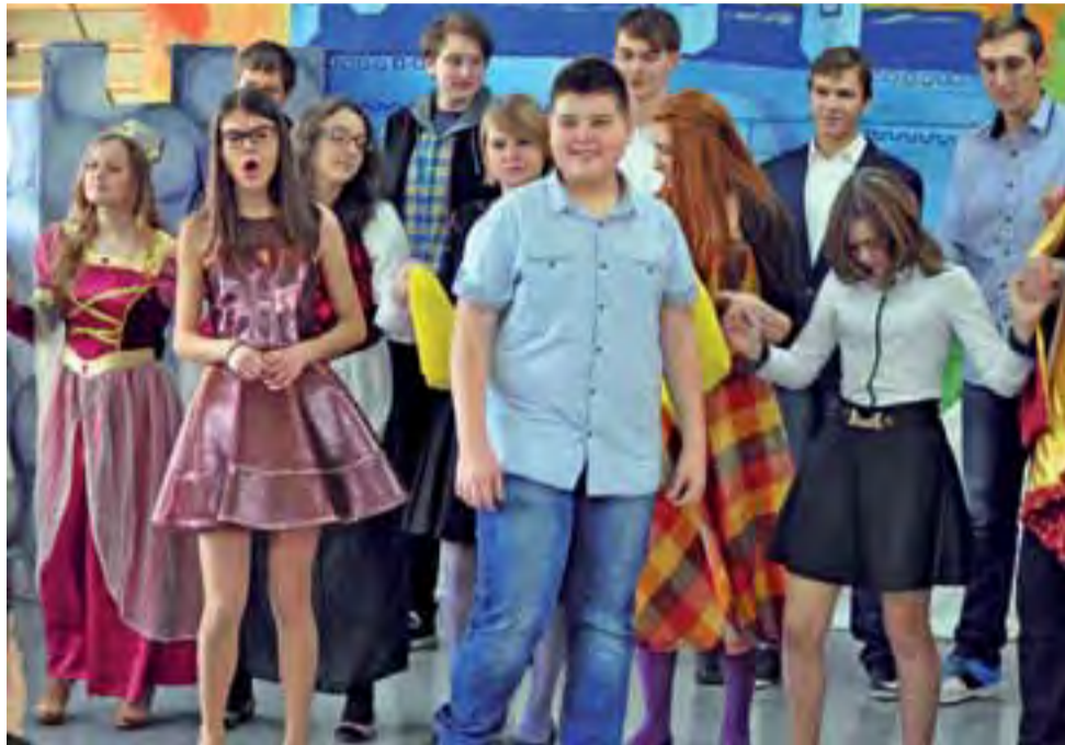
Uczniowie klasy III A z Kiernozi przygotowali świetne przedstawienie.