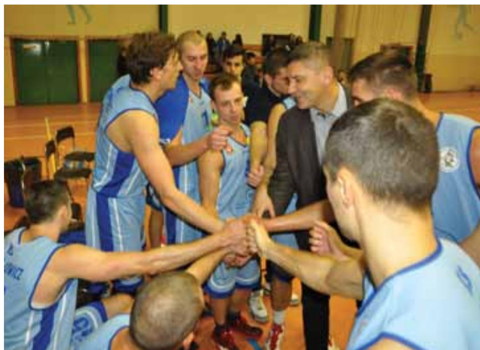
W styczniu Księżak zagra w Łowiczu aż cztery spotkania.

Warto napisać kilka słów o systemie rozgrywek, jaki obo-