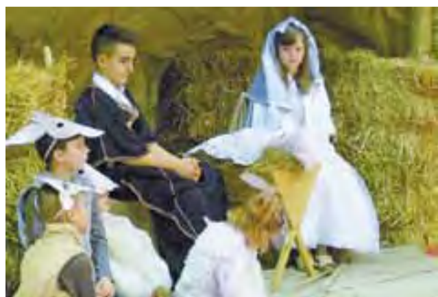
Pastuszkowie czuwają przy grobie Jezusa.

Po przedstawieniu jasełkowym wystąpił również miejscowy zespół Kuzyny, który zaprezentował krótki koncert kolęd. tm