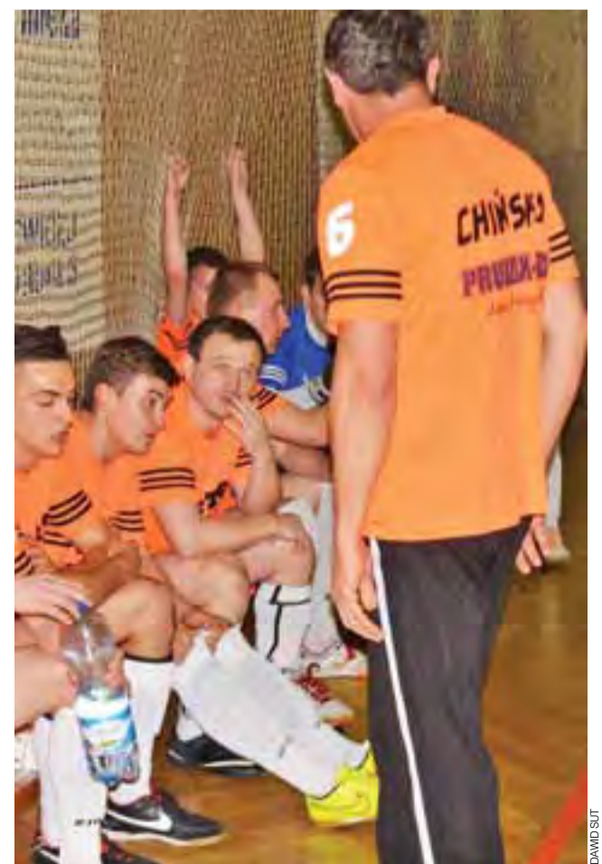
„Chińscy” zagrają w niedzielę z nieobliczalnymi Blokeraami.