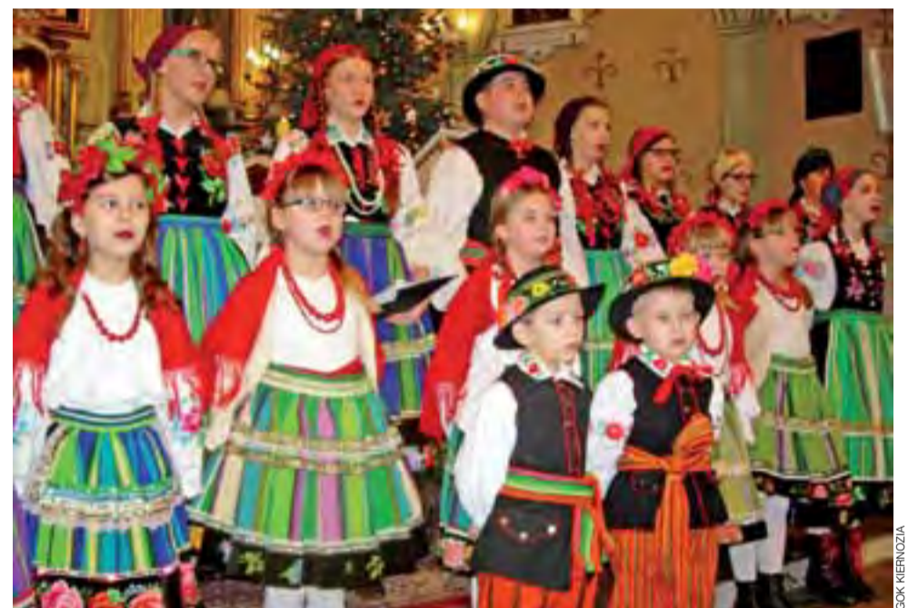
Zespół Kiernożanie zapewnił oprawę muzyczną mszy świętej w kościele w Kiernozi w Boże Narodzenie.

Mniejsze inwestycje nie spełniają warunków RPO, w ramach którego dotacje przyznawane są na drogi regionalne, a nie lokalne. Nawet gdyby za lokalne można było otrzymać punkty, to i tak Łowicz nie miałby szans na dotację na nie, gdyż prace to prowadzi zwykle ZUK, a więc nie jest przeprowadzana procedura przetargowa, wymagana przy wszystkich przedsięwzięciach z wykorzystaniem zewnętrznych funduszy. mwk