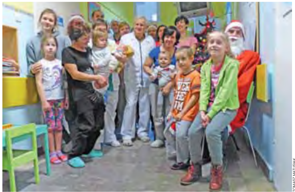
Wizyta Mikołaja zawsze jest radosna, nawet jeżeli odwiedza on dzieci zmagające się z chorobami.