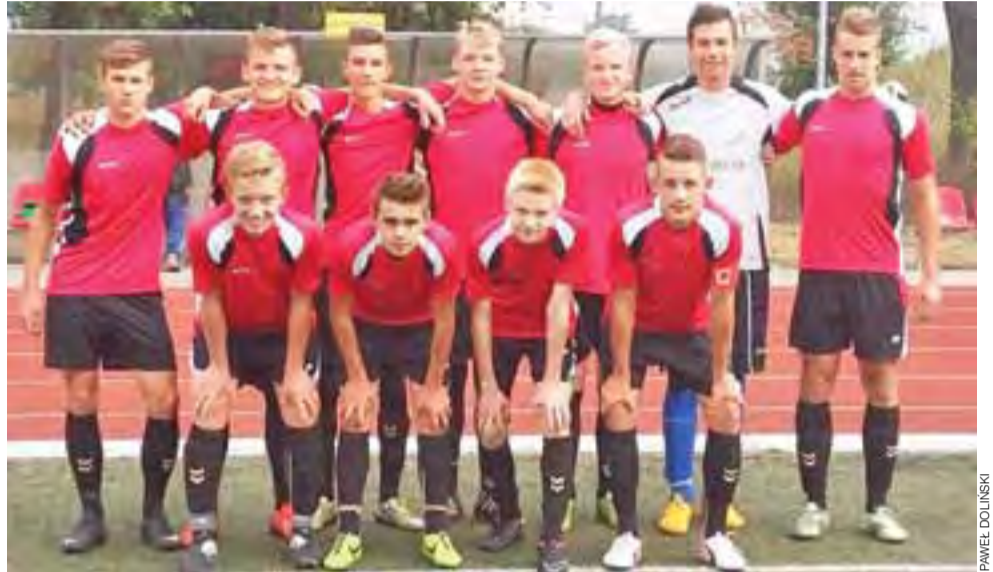
Pelikan 1999 zagra w I lidze wojewódzkiej.

Pelikan 1999 w kolejnej rundzie rywalizował będzie w I lidze wojewódzkiej z takimi zespołami jak wspomniana Omega czy też ŁKS Łódź, Ceramika Opoczno, GKS Belchatów, Widzew Łódź.