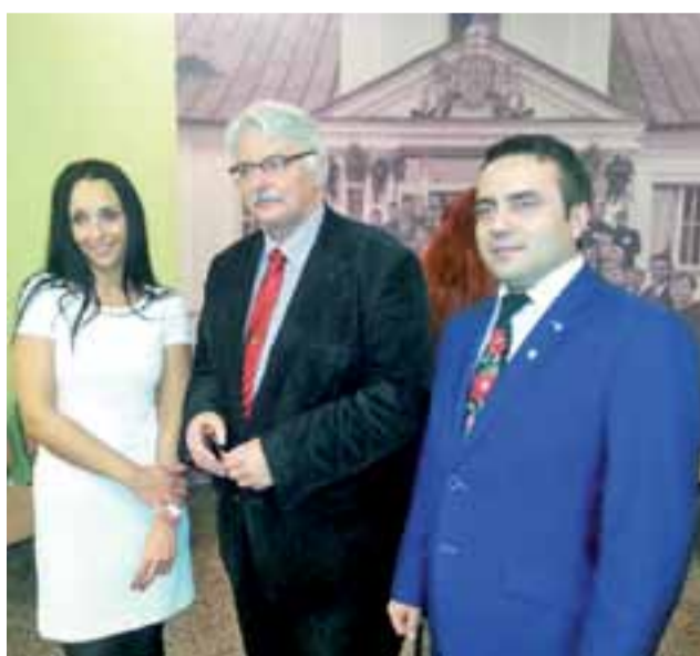
Minister Spraw Zagranicznych Witold Waszczykowski w towarzystwie lokalnych działaczy PiS - Moniki Wojciechowskiej i Krzysztofa Igielskiego.

Spotkanie trwało ok. 1,5 godziny, uczestniczyło w nim przeszło 80 osób. tm