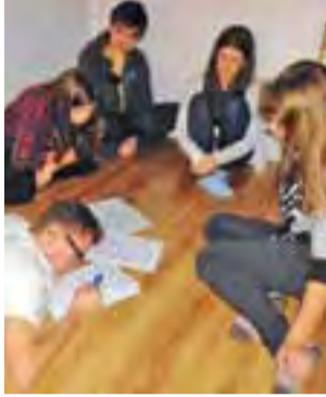
Gimnazjaliści podczas warsztatów w Teatrze Powszechnym.

Jak wyglądały warsztaty przygotowujące do obejrzenia spektaklu, w których uczestniczy-