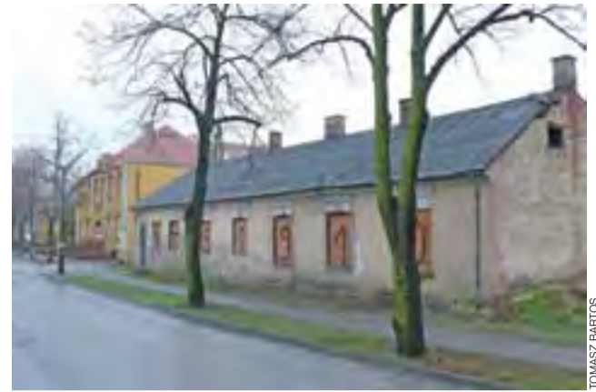
Budynki przy ul. Mickiewicza od dłuższego czasu są niezamieszkałe i popadają w ruinę. Teraz działka zostanie zabudowana, a wcześniej – rudery wyburzone.

Wach pytany, dlaczego zdecydował się walczyć o lokalizację przy Mickiewicza w tak zacięty