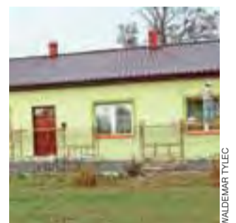
Budynek został ocieplony i pomalowany na oliwkowy kolor.

Jak nam wyjaśnił, to jeszcze nie koniec remontu. Około 14.000 zł z funduszu sołeckiego zostało zabezpieczone przez Radę So-