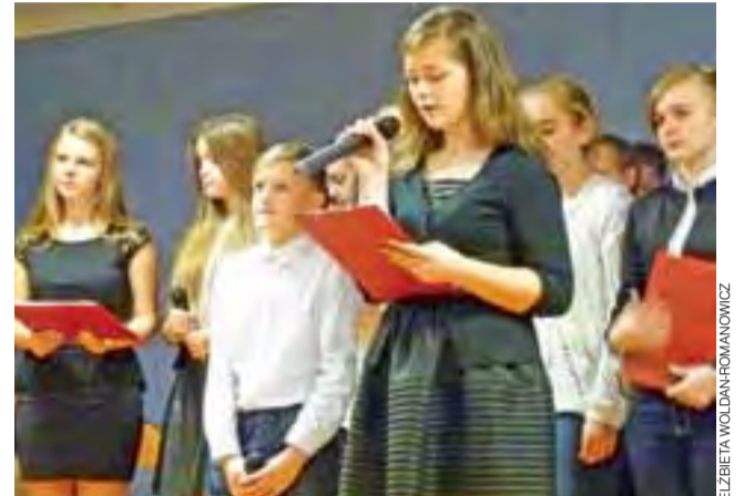
Samorządowy opłatek w Bielawach. Na scenie gimnazjaliści z Soboty.