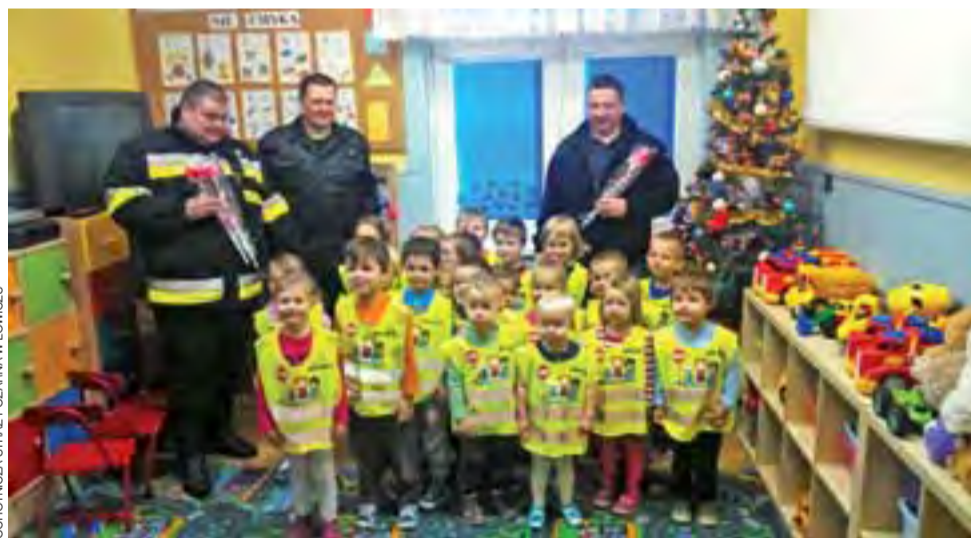
OCHOTNICZA STRAŻ POŻARNA W ŁOWICZU

Członkowie Ochotniczej Straży Pożarnej w Łowiczu przekazali kolejne kamizelki odbłaskowe dla dzieci z łowickich przedszkoli. Tym razem kilkadziesiąt kamizelek trafiło do dzieci z trzech przedszkoli: Wiosenka na Górkach, Pod Tęczą na Starzyńskiego oraz Stokrotka przy ul. Ułańskiej. To już kolejne placówki w Łowiczu obdarowane przez jednostkę straży z Łowicza. Wcześniej strażacy ochotnicy z Łowicza obdarowali m.in. dzieci z przedszkola Słoneczko przy ul. Sikorskiego oraz Pszczółka Maja z ul. 3 Maja w Łowiczu. Kamizelki są zakładane przez dzieci podczas spacerów po mieście. mak