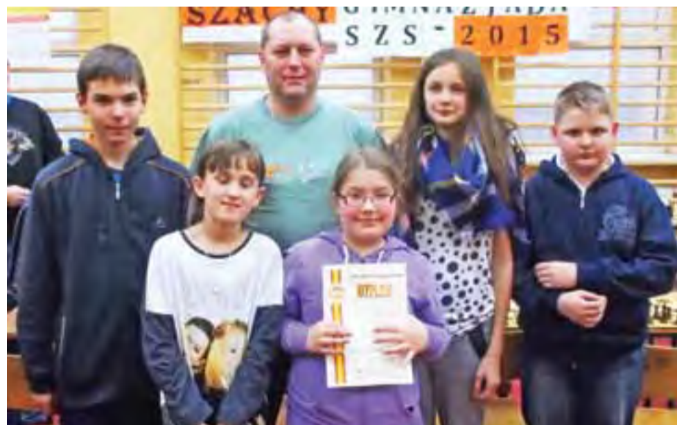
Szachiści z SP Nieborów byli blisko srebrnych medali, ale ostatecznie zajęli 4. miejsce.

Nowy Łowiczanie Tygodnik Ziemi Łowickiej członek Stowarzyszenia Gazet Lokalnych