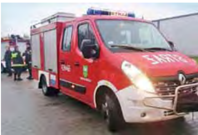
Nowy samochód OSP Brzezia był już wykorzystywany podczas ćwiczeń w Gostyninie.

Na zakup hydroforu zabezpieczono w gminnym budżecie kwotę 15.000 zł. aa