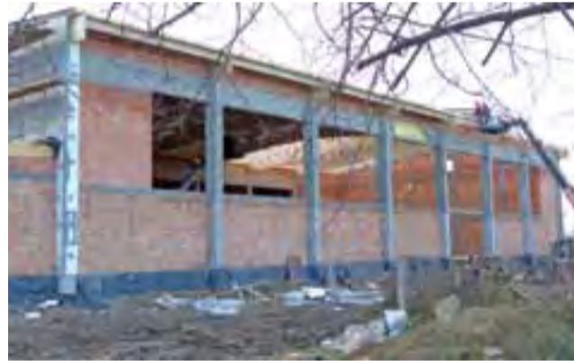
W przedświątecznym tygodniu trwały prace na budowie hali w Zdunach. Dachem pokryta była już duża część hali sportowej.

ustawiona w łowickiej katedrze, w obecnym roku liturgicznym i spełnienia warunków potrzebnych do uzyskania odpustu zupełnego dla siebie lub osoby zmarłej.