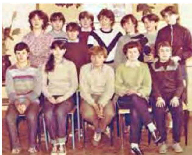
Zdjęcie klasowe ze Szkoły Podstawowej w Zielkowicach.