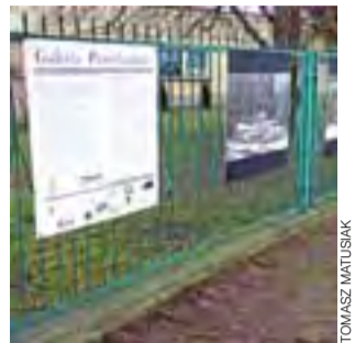
Pierwsze zdjęcia na ogrodzeniu Przedszkola nr 10 pojawiły się w Wigilię Bożego Narodzenia.