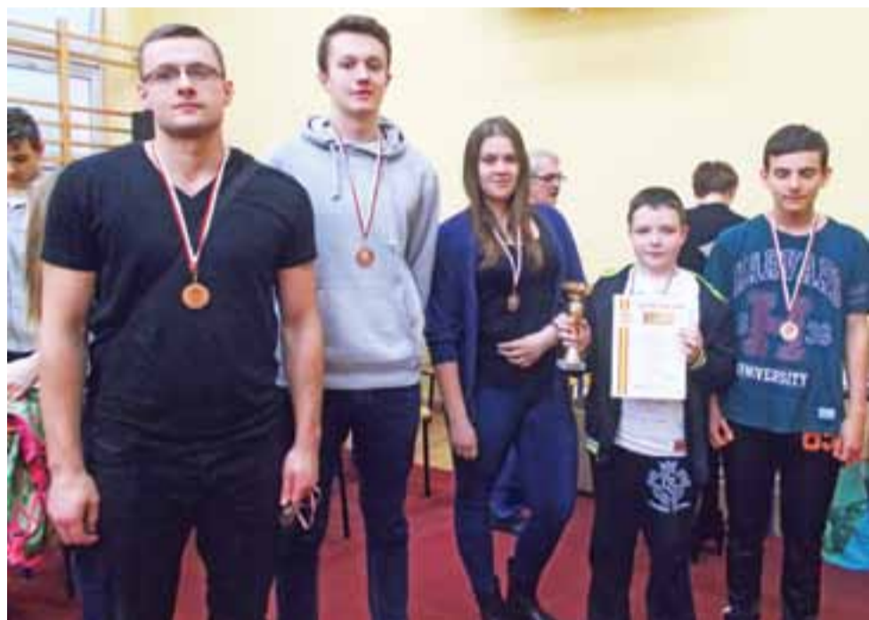
Drużyna szachistów z Gimnazjum nr 2 Łowicz z brązowymi medalami Finału Wojewódzkiego.

Sport szkolny | Wojewódzka Gimnazjada Szkolna