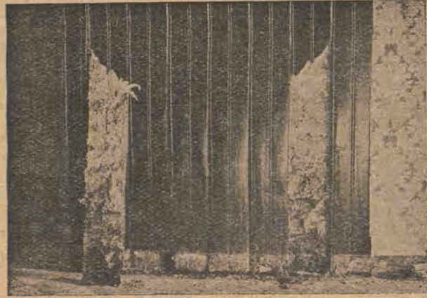
Oszalowanie drewniane zniszczone przez grzyb domowy.

1. W jednym z budynków państwowych na naszych kresach zachodnich zostały zupełnie zniszczone stropy drewniane na przestrzeni około 1500 m. kw. przez grzyby Poliporus vaporarius i Coniophora cerebella . Budynek był zbudowany w 1929 roku. Przy oględzinach nie wykazywał żadnych poważniejszych zawilgoceń. Przypuszczalnym powodem zagrzybienia: budowa stropów w zimie z niedosta-