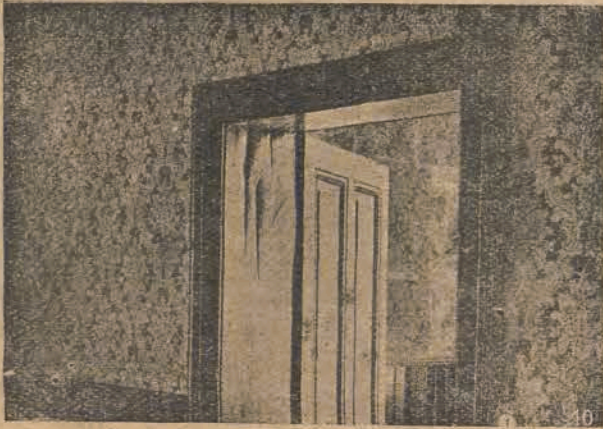
Charakterystyczne zniszczenie futryn drzwiowych przez grzyb „ merulius lacrymans ”.

Grzyb raz powstawszy przy współdziałaniu pewnej ilości wilgoci, np. w piwnicy, rozwija się szybko i niszczywszy pierwotną pożywkę, wędruje jakgdyby w poszukiwaniu nowej pożywki, nieraz na dużą wysokość i odległość, przenikając i przerastając mury, tak w fugach między warstwami cegieł, jak i same cegły. Grzybnia jego tworzy sznury, przy pomocy których czerpie on i przeprowadza wodę z wilgotnych miejsc budynku, gdy ona znajduje się tam w nadmiarze, i tą drogą umożliwia sobie dalszy wzrost w suchych miejscach budynku. Po jakimś czasie części murów, opanowane przez grzybnie, o ile wilgoć może być doprowadzona przez sznury grzybni w dostatecznej ilości, zostają nawilgocone i budynek, przedtem suchy, staje się po pewnym czasie wilgotny. Charakterystyczne są dla grzybów wilgotne plamy występujące na wyższych piętrach budynku, gdzie wilgoć nie może być