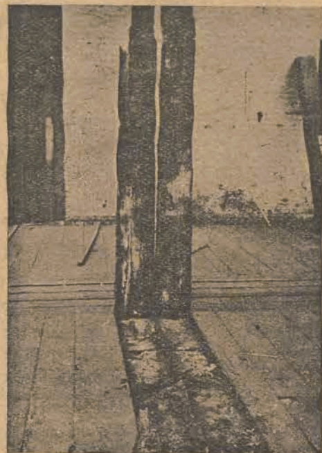
Podłoga drewniana w jednej z fabryk w Polsce, zniszczona przez grzyb.

Sam osobiście nieraz miałem możność stwierdzić doskonale rozrost grzybni Merulius lacrymans w środowisku zupełnie suchym od kilku lat, np. w stropach drewnianych II, lub III piętra kamienic warszawskich, gdzie piwnice, niższe i wyższe piętra były zupełnie wolne od grzyba i wilgotności, gdzie w lecie, a nawet w zimie, mieszkania opanowane przez grzyb były wietrzane, zaś całą zimę opalane i gdzie trudno było nawet przypuszczać możliwość