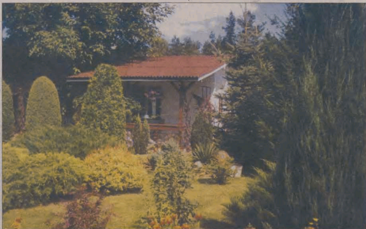
Tak wygląda „Najpiękniejsza działka 2003” w sezonie letnim.

Państwo Gawrychowie prowadzą swoje 2 sklepiki z prasą i drobiazgami na osiedlu Kopernika w Głównie. Oboje więc przez 12 godzin dziennie są pochłonięci pracą w swoich sklepikach i prawie zamknięci w nich. Dlatego tak dużą satysfakcję sprawia im pobyt na powietrzu i otwartej przestrzeni. Zwłaszcza wczesną wiosną i latem, zaraz po zamknięciu sklepów „pędzą” na swoją działkę, pielęgnują i podglądają jak rosną ich rośliny. Często korzystają z rad zamieszczonych