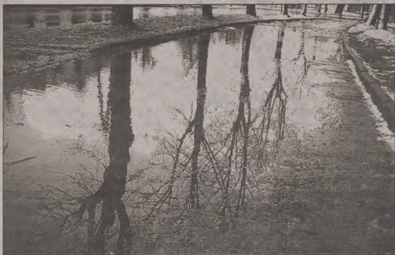
To nie rzeczka, ale chodnik przy ulicy Swoboda, który na skutek poniedziałkowych opadów był raczej nie do przejścia suchą nogą. Przechodnie, by nie wpaść do wody po kostki omijali zgrabnie chodnik idąc ulicą.