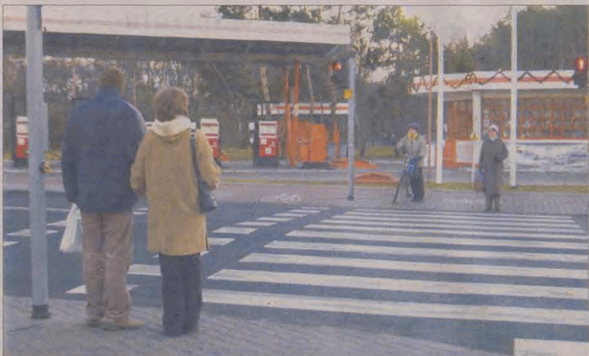
Żeby przejść trzeba nacisnąć.