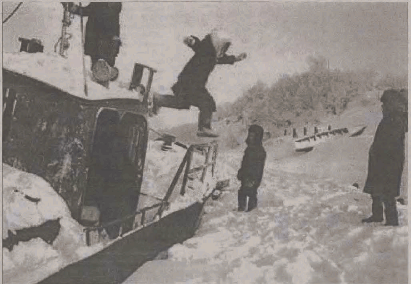
Ten statek utknął w lodach zamarzniętej przez 10 miesięcy w roku rzeki Ob. Dzieci, które się na nim bawią to mali Chantowie.