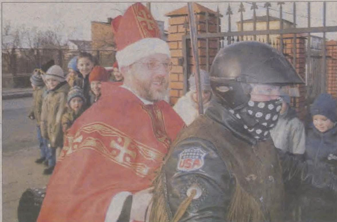
Nie było śniegu, więc Mikołaj przyjechał na motorze. O tym jak w Osinach przekonywano dzieci kim był naprawdę, że wyglądał inaczej niż pajac z Laponii i czego możemy się od niego uczyć - piszemy na str. 2.