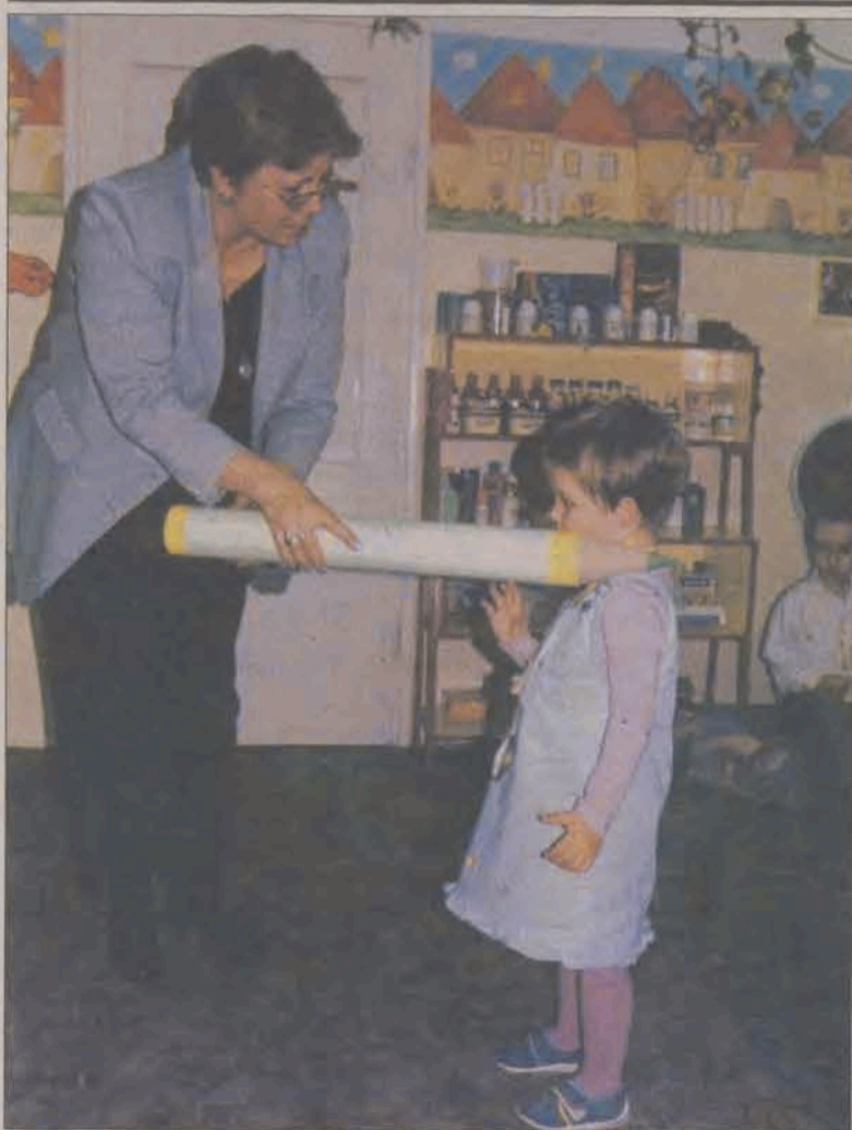
A o to ta wielka kredka, którą pani dyrektor pasowała przedszkolaków.

czego, odciskały rączkami i wałkowały. Po wysuszeniu wyprodukowany papier nabrał ciekawej faktury i kolorytu. Dzieła przedszkolaków posłużą do dekoracji przedszkola i tworzenia różnorodnych kart świątecznych. Dla przedszkolaków było to ciekawe doświadczenie. Większość z nich podejmowała prace związane z produkcją papieru czerpanego wielokrotnie. (kz)