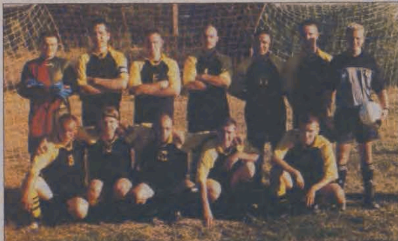
Piłkarze Sokola Popów byli rewelacją w pierwszej części rozgrywek sezonu 2003/2004.

Niestety poniżej oczekiwań wypadły ekipy z Dmosina i Wrzasku. Błękitni nadal są drużyną, która nie budzi respektu przed swoimi rywalami. W dziewięciu meczach dmosinianie zdołali uzbierać jedynie 9 punktów, co niestety nie jest wielkim osiągnięciem. Zatem kryzys jaki dopadł klub z Dmosina jeszcze w ubiegłym sezonie (zaledwie 15 zdobytych punktów i ósme miejsce w końcowej klasyfikacji), trwa nadal i sądząc z uzyskanych wyników, chyba raczej nie prędko opuści Błękitnych. Postępów nie uczynili także piłkarze LKS-u Wrzask. Za-