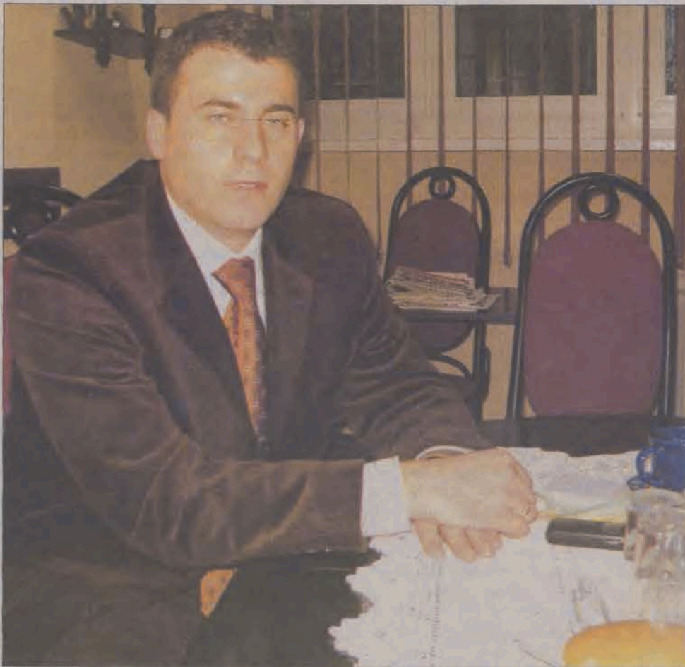
Minister i poseł Wojciech Olejniczak w swym biurze poselskim na ul. Mostowej w Łowiczu.

Przyspieszenie prac w samym ministerstwie udało się, zdaniem ministra, osiągnąć w dużej mierze