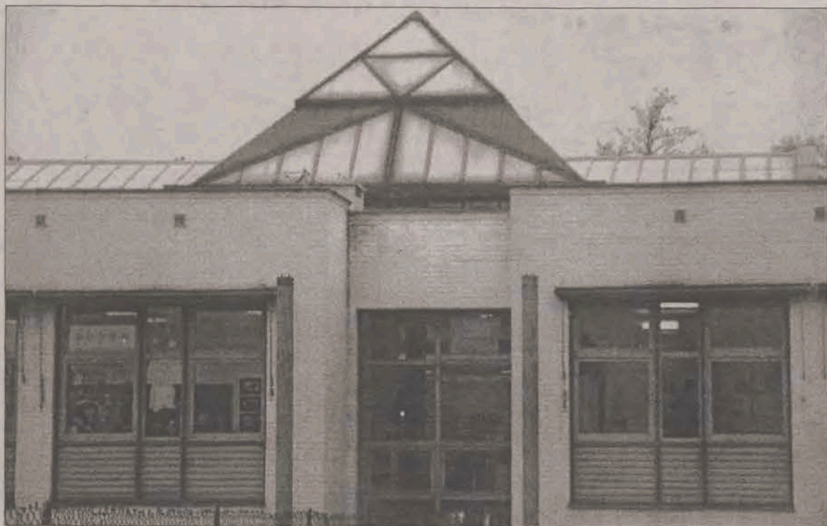
Nowa konstrukcja i już do poprawki.