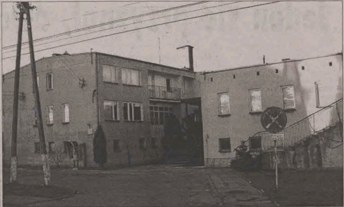
Ośrodek zdrowia w Kiernozi to duży budynek, który wymaga już remontów. Byłoby łatwiej je przeprowadzać, gdyby właścicielem była gmina.

Oto, żeby jednak nie było za różowo, postarał się w minionym tygodniu inny przedstawiciel SLD - Andrzej Piłat rodem z Płocka, były działacz wysokiego szczebla ZMS i PZPR, a teraz wiceminister infrastruktury. Pan minister był uprzejmy otworzyć uroczystość obwodnicę Sochaczewa, która to droga cieszy z pewnością także czytelników Nowego Łowicza, bowiem podróż samochodem do Warszawy (czy też w stronę odwrotną) jest teraz zdecydowanie mniej uciążliwa. Pan minister był jednak także uprzejmy... spóźnić się na tę uroczystość o jakieś drobne 40 minut, a pozostałym gościom, nie wspominając już o gospodarzach, nie pozostawiało nic innego, jak cierpliwie czekać. Czekał też biskup łowicki, Alojzy Orszulik, o czym z pewnością przedstawiciel rządu dobrze wiedział. Być może pana ministra zatrzymały w stolicy jakieś ważne względy, może był wezwany przed majestat swego szefa, największego w Polsce fachowca od dróg, mostów, obwodnic i ciągle pozostających w sferze naszych marzeń autostrad, Marka Pola, a może zwyczajnie chciał pokazać... kto tu rządził. Ja myślę jednak, że to przede wszystkim kwestia dobrego wychowania. Kindersztuby tak samo trudno czasem się nauczyć, jak odzwyczaić od wielkopańskich nawyków z czasów realnego socjalizmu. Choć Opatrzność dała ugrupowaniu pana ministra wyjątkową szansę naprawy, tego, co jego (tzn. ugrupowania) ludzie, na ogół ci sami, co kiedyś, wcześniej nabroili.