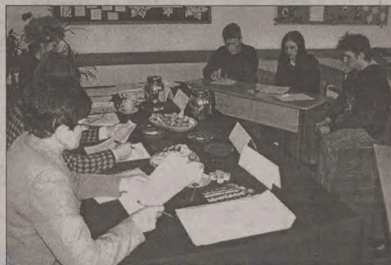
Ustny finał konkursu o Władysławie Grabskim.