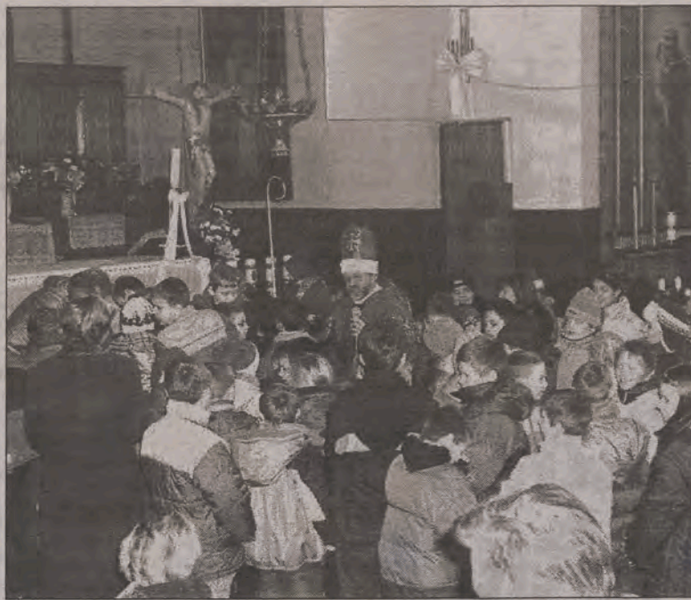
Święty Mikołaj nie tylko rozdawał prezenty, ale również nauczał.

Msza zaczęła się inaczej niż zwykle, bo dzieci zgromadzone przed kościołem czekały na swojego niezwykłego gościa. Może wiosenna, a nie zimowa aura, jaka powinna już do nas zawitać sprawiła, że Mikołaj przybył nie tak jak tradycja nakazuje w saniach, ciągniętych przez renifery, tylko na motorze. Wszystkich tym bardzo zaskoczył. Dzieci wiedziały wprawdzie, że przybędzie do nich Mikołaj, ale chyba nie wszystkie wiedziały, że będzie to jednocześnie zakonnik, który opowie im o życiu Św. Mikołaja i o tym jak należy czynić dobro i otwierać serca dla innych potrzebujących. Dzieci dowiedziały się, że Święty Mikołaj był biskupem o wielkim sercu, który całe swoje życie służył innym. Rozdał majątek ubogim, a za swoją dobroć i miłosierdzie został wzięty do nieba. Dlatego właśnie współcześni Mi-