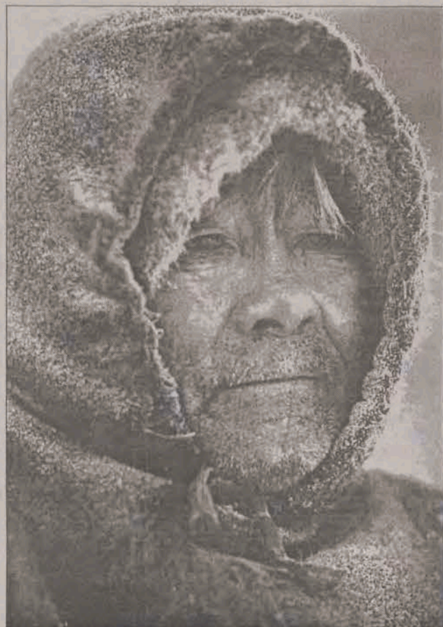
Stary Chant. Chantowie to drugi obok Nieńców lud północno-zachodniej Syberii.

Wcześniej Maciej Fiszer zrobił pierwsze zdjęcie dokładnie w miejscu, w którym pociąg przekroczył koło podbiegunowe. Potem były kolejne. Szlak kolejowy wiodący do Workuty to słynna Krwawa Droga, krwawa bo okupiona tysiącami istnień ludzkich, które ją budowały, wśród bagien syberyjskiej tundry - w tym także i polskich zesłańców, którzy trafili tam po 1939 roku. W Workucie, z czego autor prac jest bardzo zadowolony, udało mu się odnaleźć także polskie ślady, odwiedził ponad 90-letnią kobietę zesłaną tam przed laty. Przyznał, że wszędzie dookoła, nawet w czasie podróży pociągiem, natrafiał na pamiątki obecności na Syberii Polaków i innych zesłańców - były to setki bezimiennych krzyży wystające ze śniegu.