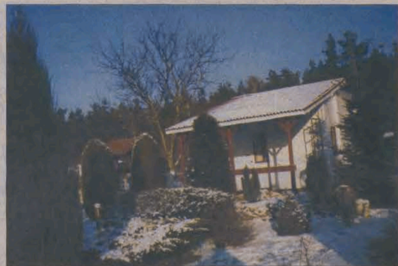
A taka jest sceneria zimowa na działce.