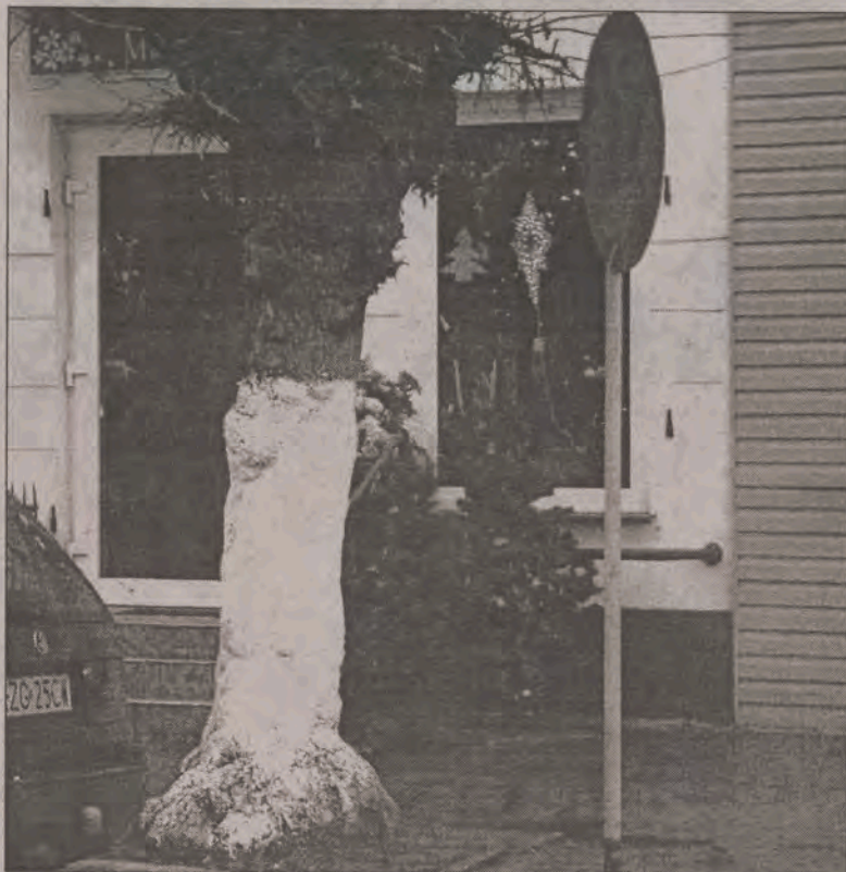
Znak jak stał tak stoi.