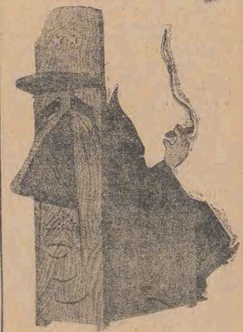
Co kryje się za de Gaulle'm? Najczarniejsza reakcja — faszyzm

zamknięte, pracują jedynie zakłady użyteczności publicznej. W Livorno trwa strajk pracowników bankowych. W prowincji Bari zaznacza się coraz większe wrzenie wśród robotników rolnych, którzy domagają się zawarcia umowy zbiorowej.