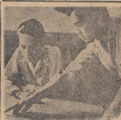
GEN. SOEDIRMAN — głównodowodzący batalerskich wojsk indonezyjskich — kieruje obroną Jogjakarty — stolicy Indonezji przed atakiem Holendrów.

Jak donoszą konsulowie 5 państw w Batawii pod przewodnictwem konsula amerykańskiego Waltera Foota odbyli już wstępne posiedzenie.