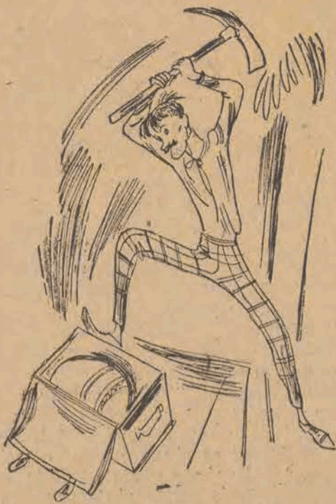
127. Lecz nie zdążył włożyć kłosa,