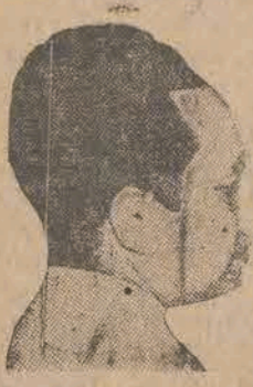
Sjarifudin premier Indonezyji

Komisja konsulów zbiera dane o konflikcie dla przedłożenia ich Radzie Bezpieczeństwa