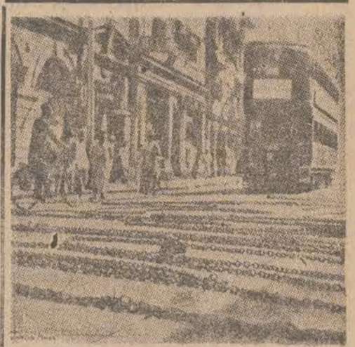
W Kalkucie doszło w ostatnich dniach do ostrych starć z policją brytyjską. W walkach ulicznych zginęło kilkadziesiąt osób. Szpital są przepelnione rannymi.

Na ilustracji widzimy łańcuchy stalowe — rozciągnięte na ulicach Kalkuty — celem uniemożliwienia ruchu wszelkich pojazdów.