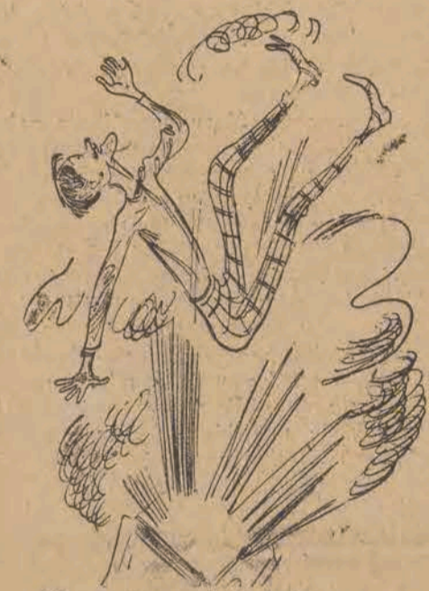
Gdy potworna katastrofa Wyspę wysadzała w górę. (To prawdziwe, choć ponure).