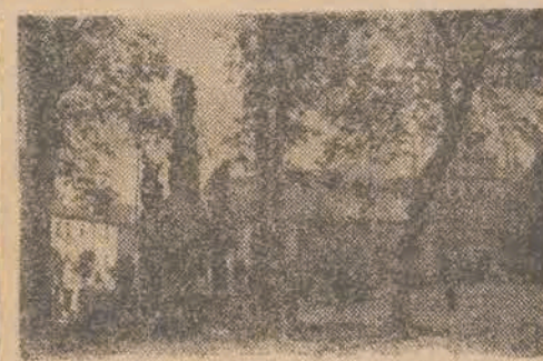
RYNEK W DUSZNIKACH