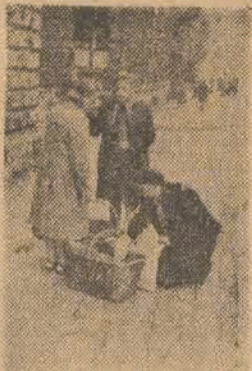
Grzyby — nie zło rzecz

Chodniki śródmieścia roją się od przekupniów