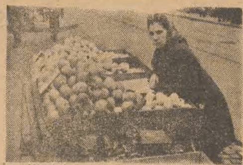
„Nie tańsze, niż w sklepie, ale tutaj lepiej „Idą”...

Czasami zaciera się granica między pieniądzem zarobionym a wyżebranym na ulicy, zaś zawsze niemal zarobek ten stoi w kółku z prawem. Wystarczy się przejść wzdłuż ulicy Piotrkowskiej, by stwierdzić, że nielegalny handel uliczny lub prowadzony na niedozwolonych miejscach, jest w naszym mieście zjawiskiem powszechnym i odrywa setki ludzi od produktywnych prac, a dzieci od nauki.