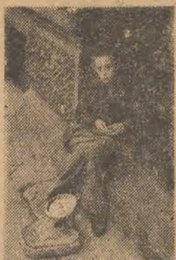
Waży innych — choć sam nie wiele waży