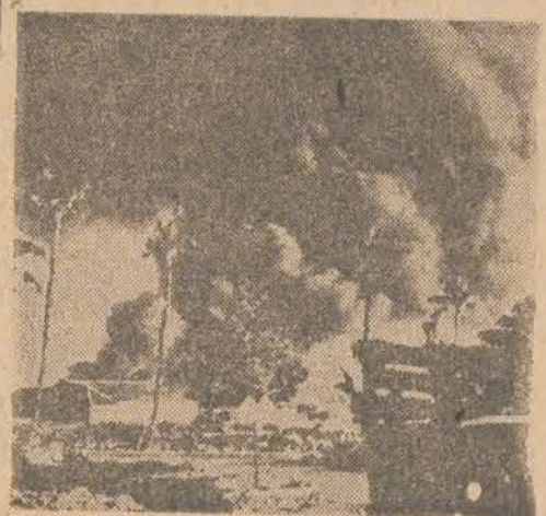
Port w Palembang — w ogniu bomb holenderskich — na dzień przed wysadzeniem desantu.