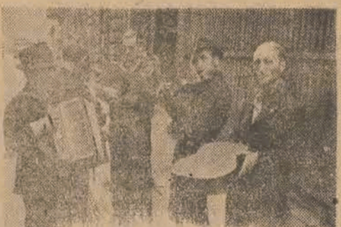
„Zaledwie jeden z nich — to zawodowy muzyk”...

Smutne rozmyślenia na temat opuszczonej młodzieży przerywają nam dźwięki orkiestry ulicznej. „Czy pamiętasz tę noc w Zakopanem...” Popularna melodia, uliczny grajko-