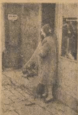
Piłki — najrozmaitszych wielkości