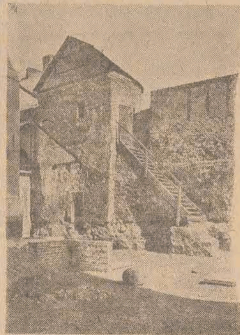
Zabytkowa baszta „Dorotka”