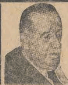
Leon Jouhaux przybywa do Polski

NOWY JORK PAP. — Prasa nowojorska zamieszcza korespondencję z Berlina, donoszącą, że opublikowano tam cyfry dotychczasowej pomocy USA i Wielkiej Brytanii dla Niemiec. Według tych cyfr, koszt żywności, wysłanej do Niemiec od końca wojny, wynosił około miliarda dolarów. Wysłano ogółem około 7 milionów ton żywności.