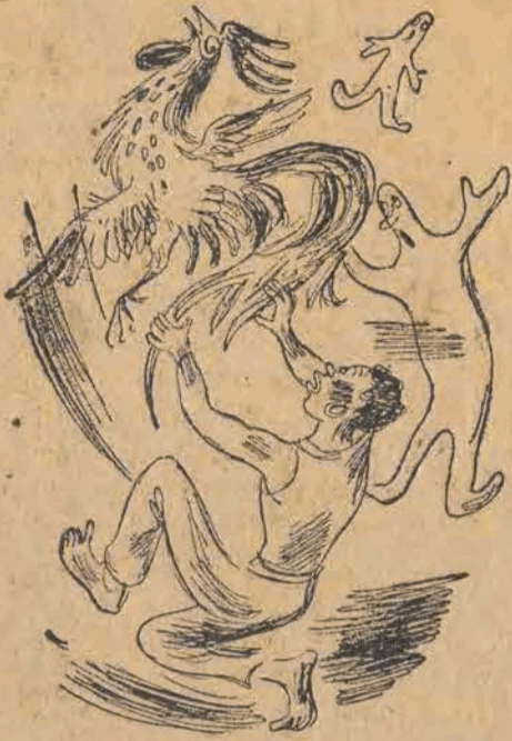
142. Kogutowi urwał ogon. Twardowski kopnął nogą, Lunatyków poprzetrcał. Ze już mieli dość miesiąca.