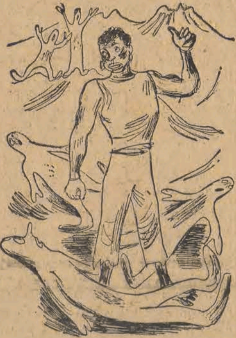
143. Nie napróżno Jimmy rok się ćwiczył i zaprawiał w boksie. Nie pomogły krzyki, gwałty. W pierwszej rundzie trzy knock-outy