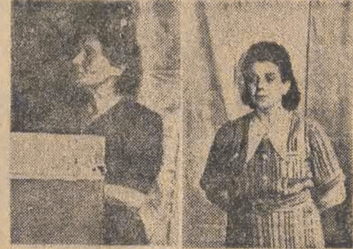
Tow. Drajwicka tkaczka