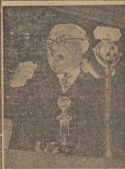
Bevin się gniewa — że dolary amerykańskie nie chcą napływać do Anglii.