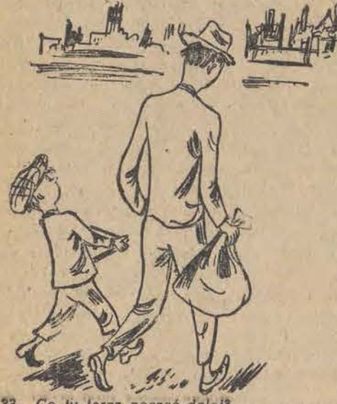
33. Co tu teraz począć dalej? Dalej razem wędrowali...