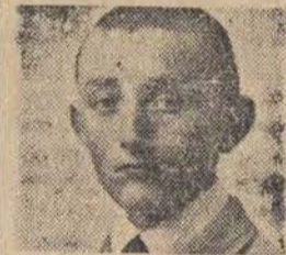
Urodził nas Czynn!

1. Uzgadniać wspólne stanowisko wobec wszystkich ważnych zagadnień, obchodzących młodzież. 2. Dla uzgodnienia i koordynacji prac odbywać regularnie wspólne zebrania kierownicze i aktywnych na wszystkich szczeblach organizacyjnych.