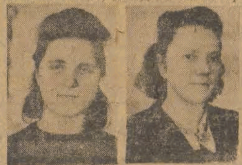
ob. Smigiel — wyrabia dziennie 222 tys. biletów.

wzrastała powoli, ale tak „na całego” ruszyliśmy dopiero w październiku. Zorganizowaliśmy współzawodnictwo przez wprowadzenie premii dla najlepiej pracujących. Odnosiły