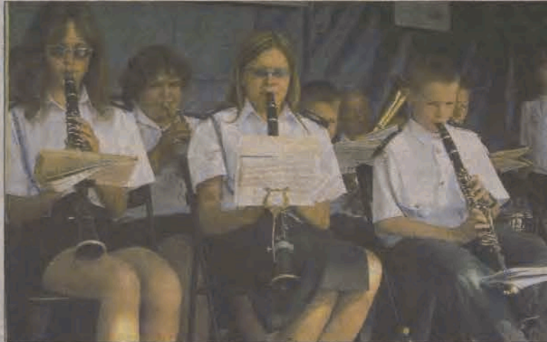
Niedzielne muzykowanie rozpoczęło się od występu dętej orkiestry strażackiej z Bolimowa, w której, jak widać, jest dużo młodych - kilkunastoletnich wykonawców.