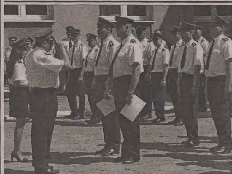
Najlepsi policjanci odebrali odznaczenia i awanse.

czenie wieńców zaproszonym gościom - potrwa ona około dwóch godzin. Następnie scenę przejmą kapele i zespoły ludowe z terenu powiatu zgierskiego - na razie jeszcze nie ma listy konkretnych zespołów. Będą one przeplatane występami zespołów dziecięcych i młodzieżowych działających przy strykowskim domu kultury, tj. „Agat” i „Twist”. Około godziny 19.00 wystąpi gwiazda zespołu - kto to będzie organizatorzy na razie nie chcą zdradzać. Od godziny 20.00 przygrywał będzie do tańca uczestnikom imprezy zespół muzyczny, którego nazwę poznamy niebawem. (eb)