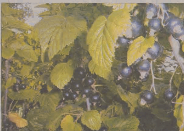
Na urodzaj plantatorzy porzeczki nie mogą narzekać, niska cena skupu tego owocu powoduje, że większość z nich postanowiła pozostawić owoce na krzakach.

Na popowskim skupie przyjmowanie porzeczki czarnej zakończono w niedzielę, 18 lipca. Przy obecnej cenie 30 groszy za kilogram nie będzie on kontynuowany. Podobnie rzecz ma się na skupie w Ostrołęce, a ten w Ziewanicach - również pod Głownem - nie prowadził skupu tegoż owocu w tym roku w ogóle, bo jak usłyszeliśmy, czarna porzeczka nie interesuje zachodnich klientów. Ziewanice skupują natomiast porzeczka czerwona, wiśnie i malinę, choć w porównaniu z latami poprzednimi, dyktowane przez rynek ceny tych owoców, są również niższe. Punkt skupu w Ostrowcu