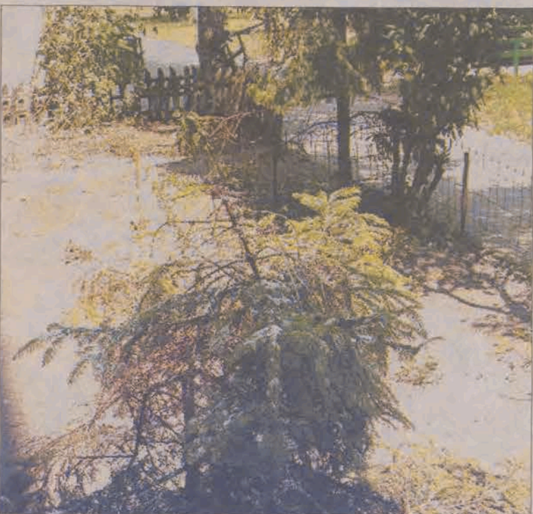
Na remoncie elewacji bloku nr 2 najbardziej ucierpiały rośliny w przyklatkowych ogródkach.