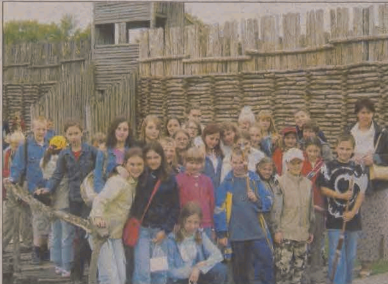
W Biskupinie nie obyło się bez wizyty w prasłowiańskiej osadzie.

Po niezwykle obfitym w wycieczki lipcu, Miejski Ośrodek Kultury przygotowuje się do wakacyjnej przerwy. Od 1 sierpnia będzie on nieczynny z uwagi na sezon urlopowy. Działalność swą placówka wznowi dopiero z nowym rokiem szkolnym, kiedy to pracę rozpoczną poszczególne sekcje i zespoły.