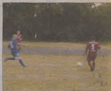
Rezerwy GOSSO Stali Głowno (czerwone stroje) okazały się lepsze od piątoliigowej Astry Zduny, wygrywając ze swoimi sparingowymi rywalami 2:1.