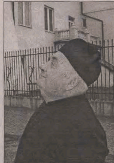
Tak, przed laty patrzył na wieże katedry. Zdjęcie wykorzystano na okładce jednej z jego książeczek.

Odkrył on również inny Łowicz - taki, który nie kojarzył się tylko z pasiakami i wycinankami. Przedstawiał jego bogatą historię i ciągle dowiadywał się czegoś no-