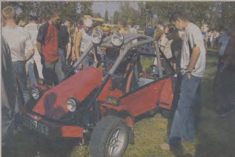
Ten wehikuł z silnikiem malucha, był jednym z ciekawszych pojazdów startujących w łyszkowickim rajdzie.