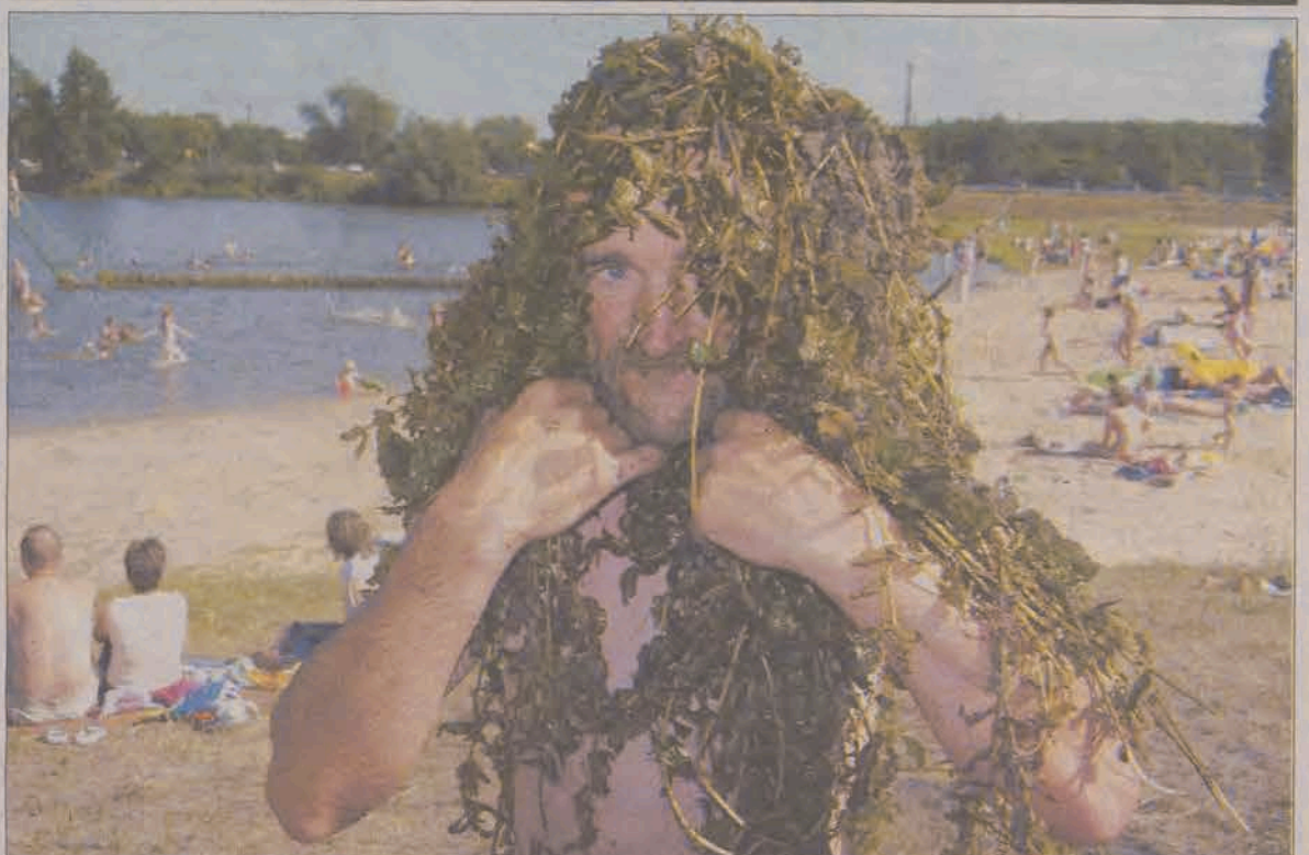
Ochłoda a'la Wodnik Szuwarek. W okresie ubiegłotygodniowych upałów, niektórzy mieszkańcy Głowna odznaczyli się wyjątkową pomysłowością w wymyślaniu sposobów na ochłodę. Ten - uwieczniony w minionej niedzielę, 25 lipca przez jednego z naszych czytelników - głownianin korzystający z uroków „Mroźyczki”, ochłody szukał w obfitej wodnej roślinności - niczym Wodnik Szuwarek.