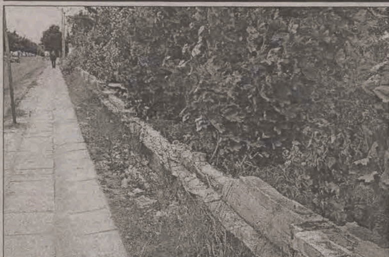
ZAROŚLA NICZYM MUR. Stosunkowo niedawno ubolewaliśmy nad stanem pozostałości muru dawnego WZMot od ul. Sikorskiego w Głownie. Sypiące się cegły, porzucone worki ze śmieciami - ten widok raził. Ostatnimi czasy zdewastowany mur porosły krzaki. Zielony tym razem mur skutecznie zasłonił widok na dawny zakład. Czyżby wobec objętości człowieka, postanowiła zadziałać natura? (rpm)