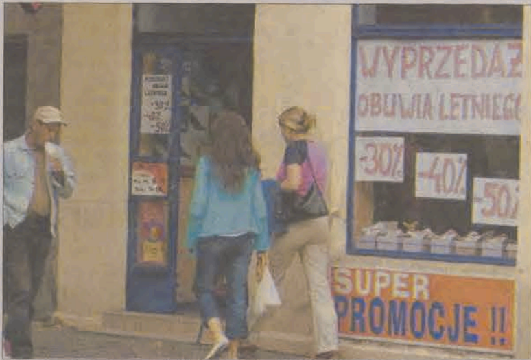
W tym roku wcześniej niż to zwykle bywało, rozpoczęły się wyprzedaże letnich kolekcji.

Z okazji zakupu tańszych butów, spodni czy letniej sukienki głownianie korzystają w sposób umiarkowany, bez szaleństwa i szturmów na sklepy z obniżkami.