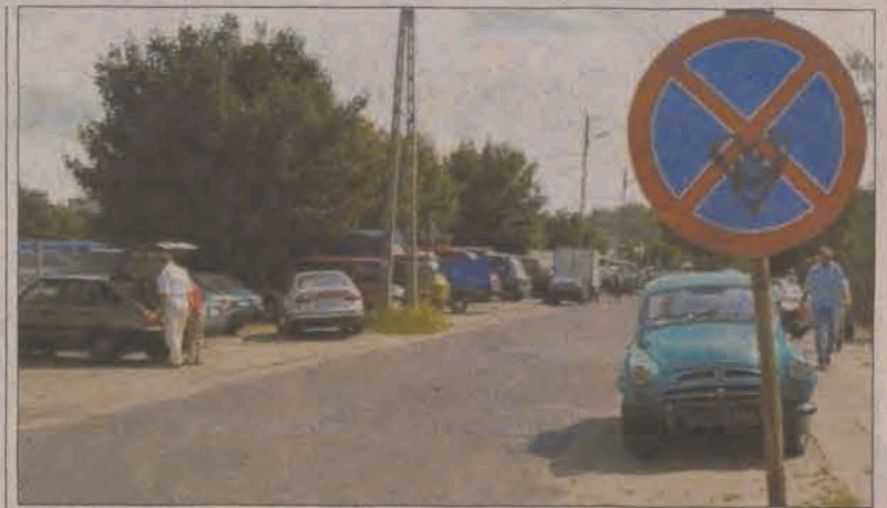
Kierowcy łamiący zakaz tłumaczą, że w okolicy targowiska brak wystarczającej liczby miejsc parkingowych.