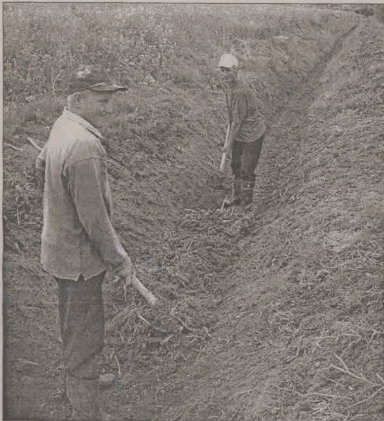
Pracownicy zatrudnieni w ramach programu „Woda” czyszczą obecnie rowy melioracyjne w rejonie Szczecina.