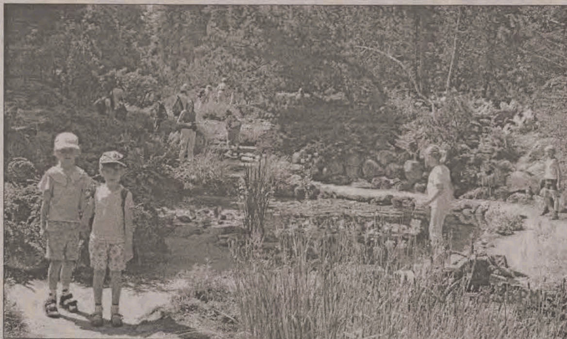
GŁOWNIANIE ZACHWYCIŁI SIĘ ROGOWEM. Spacer po rogowskim arboretum i alpinarium, do którego ponad czterdziestoosobowa grupa dzieci i młodzieży z Głowna wybrała się wraz z Miejskim Ośrodkiem Kultury 19 lipca, przypominając wprost baśniową wędrówkę. Słoneczna aura uczyniła tę wyprawę do skarbnicy botanicznej wyjątkowo barwną i przyjemną. Zwieńczeniem pobytu w Rogowie było ognisko z kiełbaskami. W drodze powrotnej głownianie wybrali się dla relaksu na basen do Brzezin. (rpm)