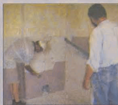
W pomieszczeniach szykowanych na świetlicę w Szczecinie nie obezšlo się bez skrobania ścian.