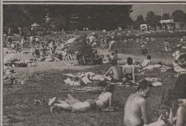
Tłumy na głowieńskiej plaży. Po lipcowej huśtawce pogody, w sierpniu sytuacja na głowieńskiej plaży wraca do normy. W miniony weekend było tu wielu wypoczywających. Dwa nowe parkingi, a nawet osiedlowe uliczki na Swobodzie były zakorkowane samochodami. Z kąpieli, sprzętu wodnego albo tylko opalania korzystali nie tylko mieszkańcy Głowna, ale i sąsiednich miejscowości. (ljs)