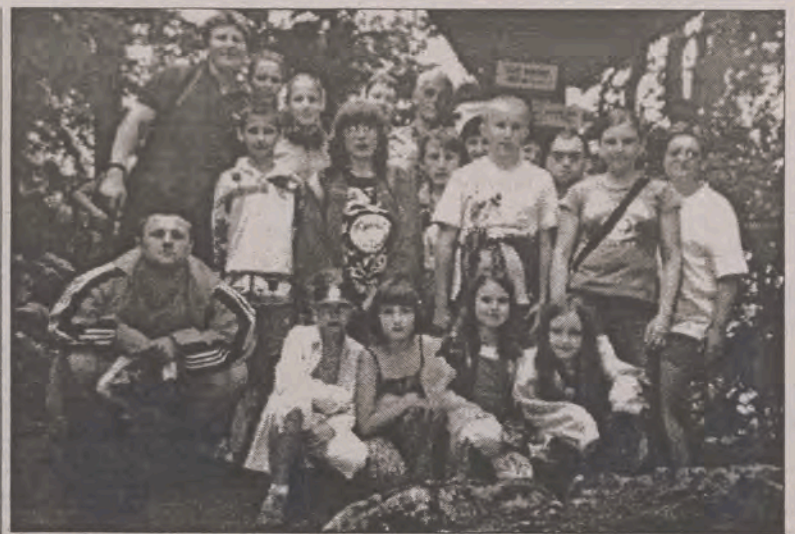
Jedno z pamiątkowych zdjęć uczestników wycieczki.

Na szczęście w Oddziale Regionalnym KRUS w Łodzi, w okresie ubiegłorocznych żniw nie odnotowaliśmy wypadków z udziałem dzieci i wypadków śmiertelnych. Żałujemy, aby również tegoroczne żniwa nie zawoczyły żadną ludzką tragedią - apeluje rzecznik Lamenta. (rpm)