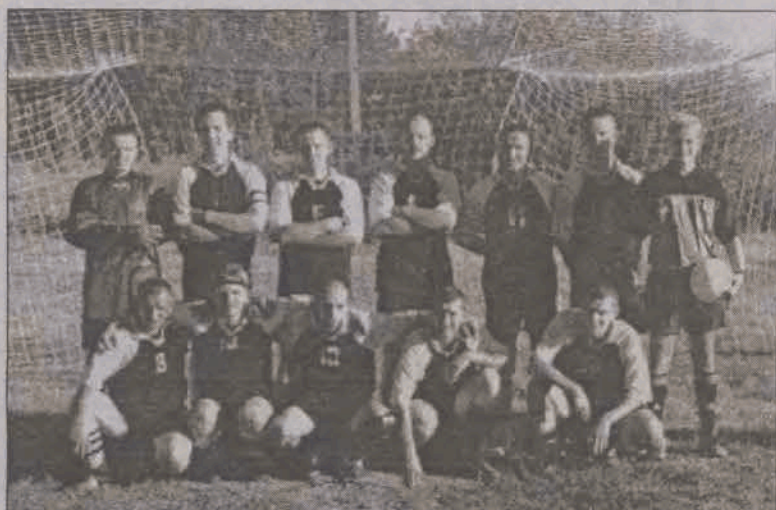
Piłkarze Sokoła (na zdjęciu sprzed dwóch sezonów) w bieżących rozgrywkach postarają się sprawić niespodziankę i awansować do rozgrywek klasy „A”.