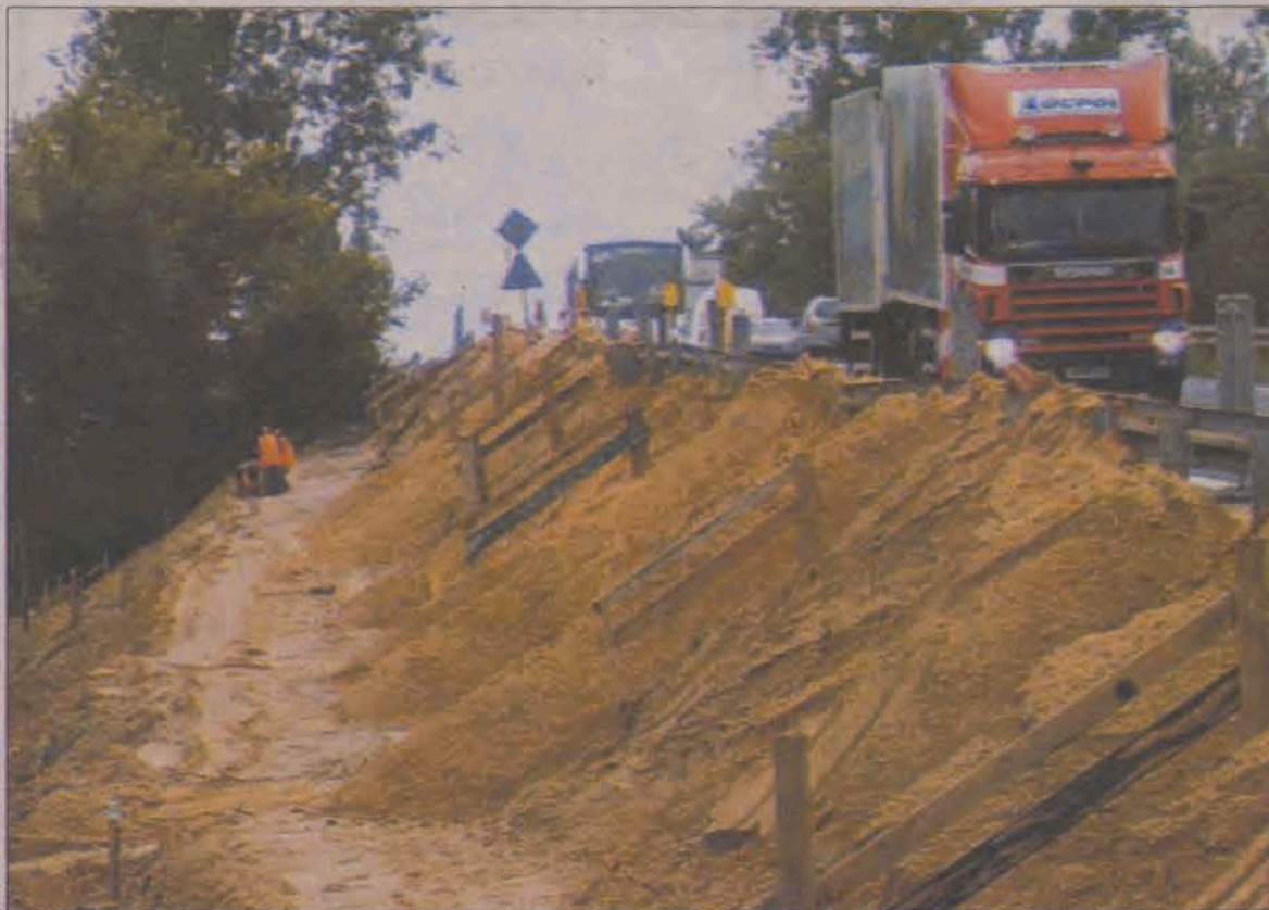
Prace przy poszerzaniu nasypu wiaduktu już trwają. Czy staną tu bariery dziękiochłonne, dowiemy się po badaniach natężenia hałasu w październiku.