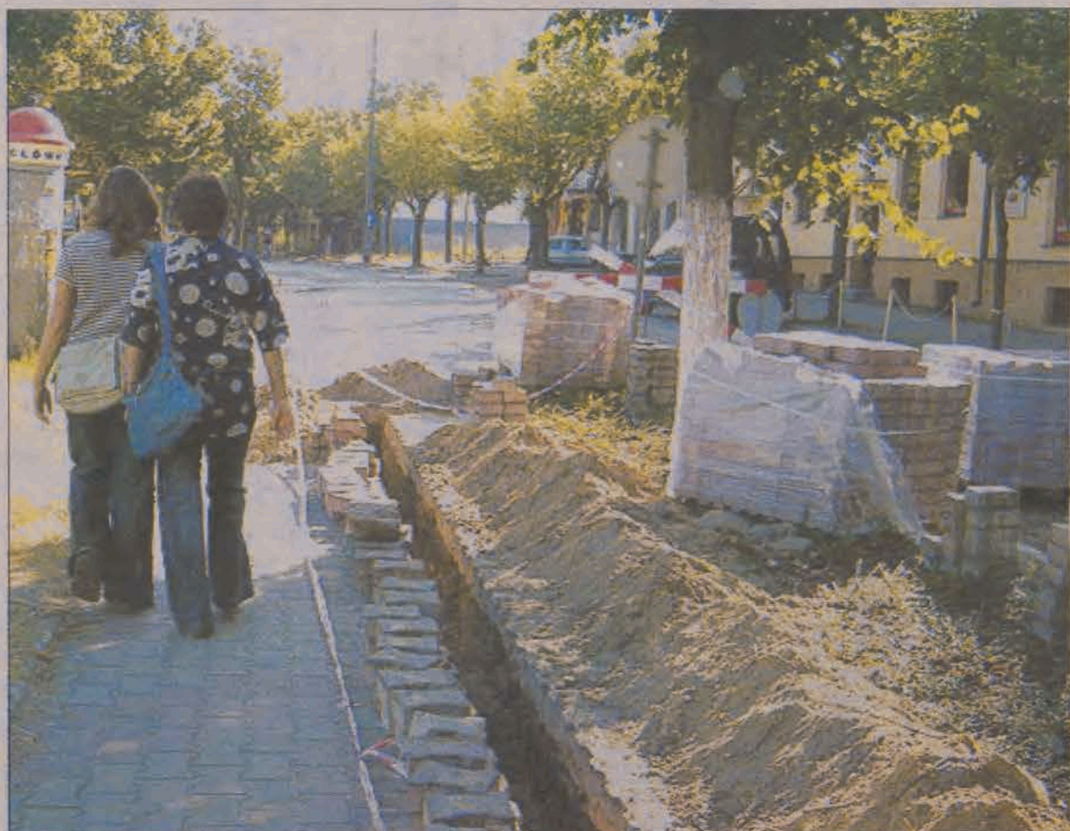
O ile do siedziby Banku Spółdzielczego przy ul. Młynarskiej dostać się jest stosunkowo łatwo, bo wystarczy przejść po pozostawionym wąskim pasie kostki brukowej, o tyle pokonanie kilkumetrowego odcinka od BS do Urzędu Miejskiego graniczy wprost z ekwilibrystyką.