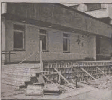
Wizerunek zmienia się z dnia na dzień.

Trwają prace modernizacyjne przed Urzędem Skarbowym w Głownie. Prace polegające na wzmocnieniu schodów oraz wymianie barierki schodowej prowadzi jedna z głowieńskich firm remontowo-budowlanych, która wygrała ogłoszony przetarg. Konstrukcja betonowa schodów zostanie wzmocniona, a drewniana barierka wymieniona na metalową. Prace potrwają do końca sierpnia. Potenci Urzędu Skarbowego będą musieli korzystać z wejścia drugą częścią schodów od strony byłego hotelu albo podjazdem dla osób niepełnosprawnych. (ljs)