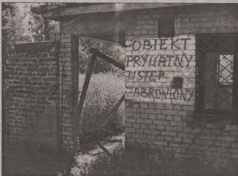
Oto zabezpieczenie i informacja o tym, że teren jest prywatny.

Czyżby właściciel „Strykowiarki” potraktował jej zakup tylko i wyłącznie jako lokatę kapitału, a teraz nie bardzo wie jak ją zagospodarować? Im dłużej trwa będzie takie niezdeterminowanie, tym gorzej dla wizerunku Strykowa. To, że obiekt nie grozi katastrofą budowlaną - bo jak tłumaczy burmistrz Zaborowski, już jakiś czas temu rozpadające się i grożące niebezpieczeństwem elementy zostały rozebrane w drodze decyzji administracyjnej, a teren zamknięty, nie przeszkadza fakt, iż „Strykowianka” starszy swoim wyglądem. (ljs)