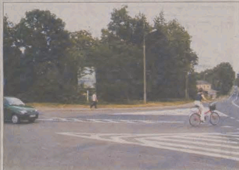
Na tej zadrzewionej działce na rogu ulicy Łódzkiej i Dąbrowskiego miałby stanąć blok mieszkalny zgierskiego TBS.

Przystąpienie do procesu inwestycyjnego warunkowane jest jednak decyzją Rady Miejskiej w Głownie, która musi wypowiedzieć się: po pierwsze w sprawie przystąpienia do zgierskiego TBS oraz wniesienia przez miasto do spółki - w ramach aportu - terenu pod budowę bloku i po drugie w sprawie ustalenia wysokości czynszu za wynajem lokali w wysokości 6,88 zł/m 2 . Jeżeli uchwała w sprawie przekazania działki pod budowę bloku w Głownie zostanie podjęta na pierwszej powakacyjnej sesji Rady, to budowa bloku ruszy jeszcze jesienią. Biorąc pod uwagę doświadczenia strykowskie, gdzie prace budowlane idą szybciej niż przewidywano, w Głownie blok ma szansę powstać już w przyszłym roku. (rpm,eb)