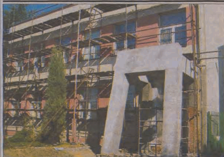
Widać już nie tylko bryłę nowej wiaty wejściowej, ale również kolorystykę.