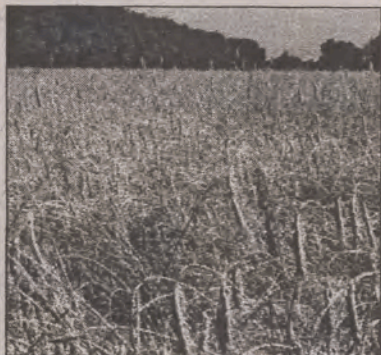
Zboże czeka na dobrą cenę.