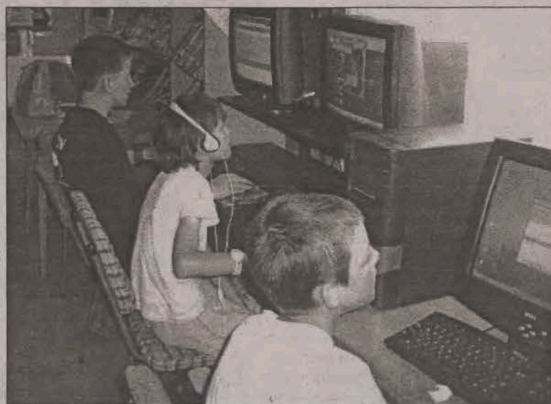
Już od 9.00 wszystkie miejsca są zajęte.

Uruchomiona niemalże przed wakacjami w strykowskijskiej Bibliotece Miejskiej „Ikonka”, czyli dostęp do Internetu w ramach programu realizowanego przez Ministerstwo Nauki i Informatyzacji, cieszy się od początku niesłabnącym zainteresowaniem. W okresie wakacyjnym przy komputerach przesiadują przeważnie dzieci i młodzież, ale wcześniej - jak dowiadujemy się od pracowników biblioteki - bywało tu również wiele osób dorosłych i to nie tylko ze Strykowa, ale będących tu przejazdem. Prawdziwe obłędzenie odbywa się jednak dopiero teraz. Zainteresowanie jest tak duże, że trzeba prowadzić zapisy, a dziennie przez bibliotekę przewija się nawet kilkadziesiąt osób. Do dyspozycji są trzy stanowiska komputerowe. Zapisy odbywają się codziennie w godzinach od 9.00 do 10.00 osobiście albo telefonicznie pod numerem 719-80-94. W ciągu tej godziny bibliotekarki zazwyczaj zapełniają listę na cały dzień pracy, czyli najczęściej od godz. 10.00 do 20.00. Korzystanie z Internetu jest bezpłatne. Nie ma obawy, że dzieci, czy młodzież korzystając będą ze stron, które nie powinny być przez nich oglądane. Strony płatne są zablokowane, a oglądanie innych odbywa się pod ścisłą kontrolą pracowników biblioteki. Czego w Internecie szukają