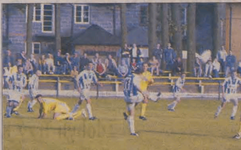
Już niebawem głoŹniacy kibice będą przeżywać emocje związane z trzecioligowymi meczami GOSSO Stali Głowno.