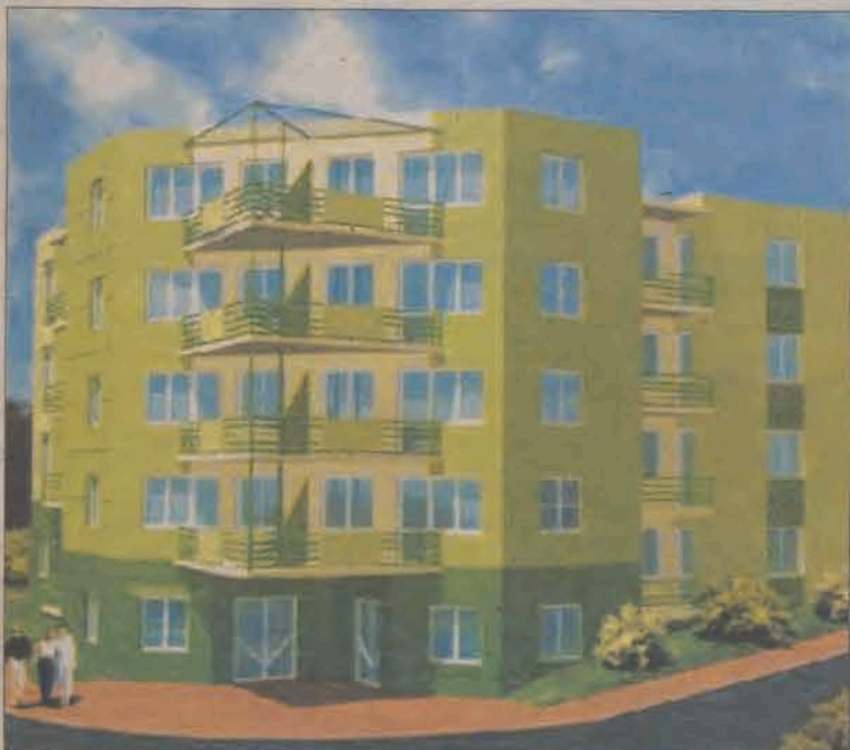
Tak ma wyglądać budynek TBS w Głownie.