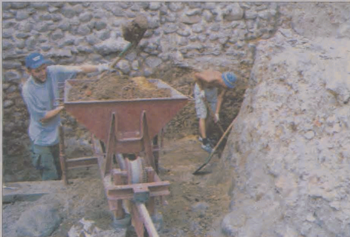
Klimat prac przypominał trochę sceny z filmów „Indiana Jones”, dr Pietrzak uspokoił nas jednak: „Więcej mamy ciężkiej fizycznej pracy niż niesamowitych przygód i znalezisk”.

pełniona ceglami i tak ściana muru została wyrównana. Dlaczego tak postąpiono? Doktor Pietrzak pokazał nam miejsca, w których wyraźnie było widać, że średniowieczny mur zaczął się bardzo mocno odchylać od pionu. Od strony północnej widać było nawet miejsca, gdzie odchylenia powstawały nawet w trakcie murowania i trzeba było je kontrolować.