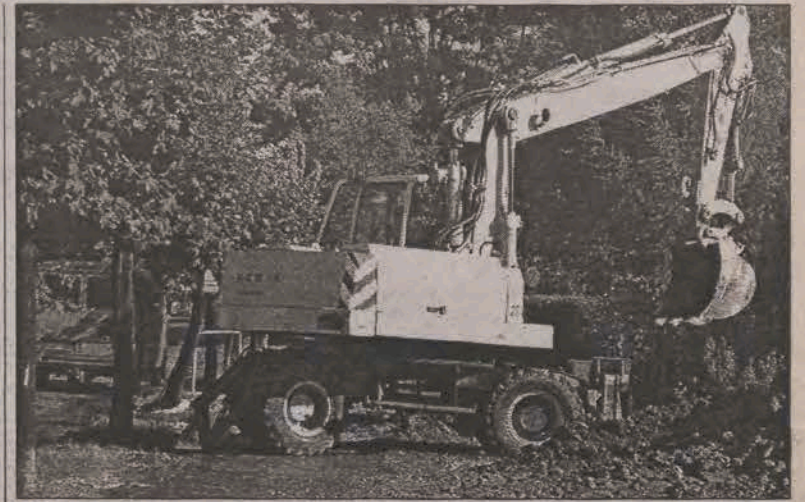
Ekipa wodociągowców z MZWik pracowała nad usuwaniem awarii na Kopernika od godziny 2. w nocy do godzin okołopołudniowych.