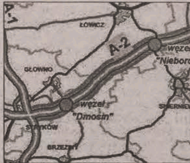
To już kolejny odcinek A-2.

Wstępny projekt autostrady na odcinku Stryków - granica województwa o długości 48 km został już pozytywnie zaopiniowany przez zarząd województwa. Projekt wykonał Transprojekt Gdański działający w imieniu GDDKiA. Nie obyło się jednak bez poprawek. Zarząd Województwa zaproponował uwzględnienie węzła „Dmosin - Głowno” w zastępstwie węzła „Łyszkowice”. Podyktowane było to analizami przeprowadzonymi w trakcie przygotowania projektu zagospodarowania prze-