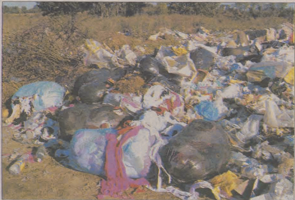
Stery worków z odpadami tekstyliów.