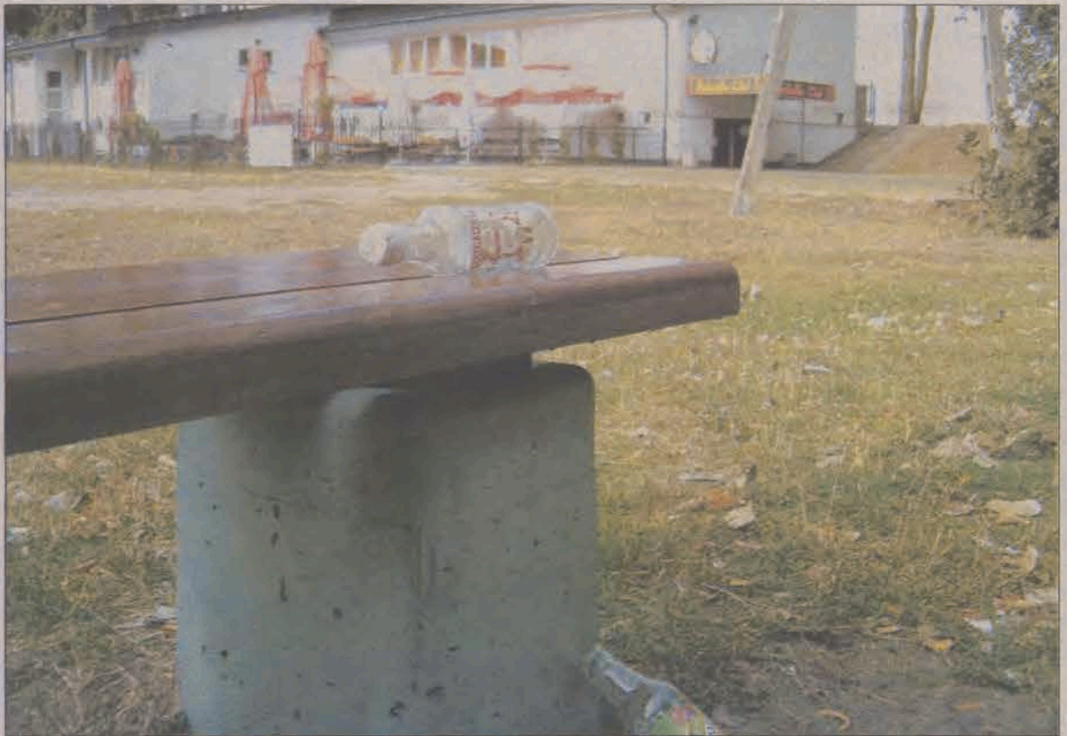
Ślady urządzonych na Błoniach, pod gołym niebem, libacji można codziennie znaleźć w okolicy „Szkielek” i sklepu monopolowego na ul. Floriana.