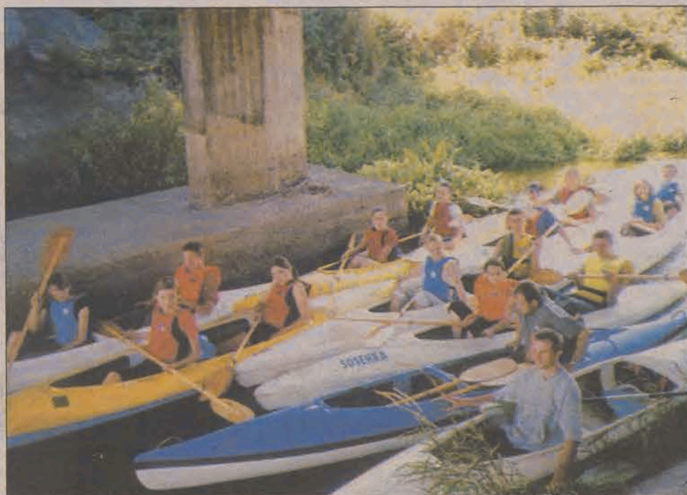
Płynące Bzurą barwne kajaki robiły duże wrażenie, tym bardziej kiedy obserwowano się przeprawę pod mostem.