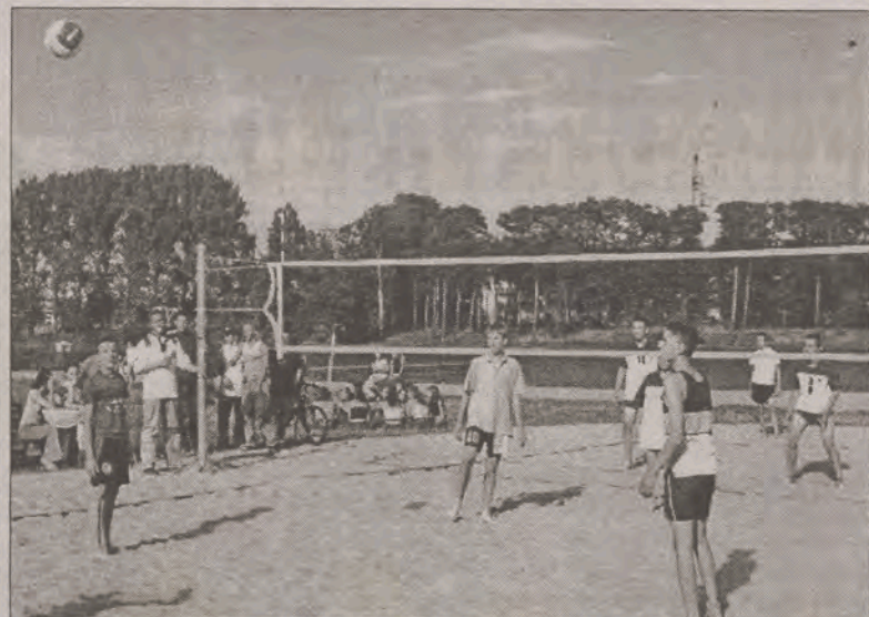
ZAKOŃCZYLI LATO NA SPORTOWO. W sobotę 11 września na plaży nad zalewem odbyła się impreza sportowa na zakończenia lata w której wzięli udział dzieci i młodzież ze Strykowa. Puchar burmistrza w szkolnym turnieju miniatkówki plażowej zdobyła Szkoła Podstawowa nr 1 ze Strykowa, a puchar Przewodniczącego Rady Miejskiej drużyna młodzieży gminnej, która rozegrała mecz przeciwko gimnazjalistom. Zwycięskie drużyny otrzymały też akcesoria sportowe, a pozostali gracze nagrody pocieszenia. Rozegrano również konkurs slalomu z jajkiem na łyżce, ogrzania jabłka zawieszono na nitce i rzutu piłeczką tenisową do wiaderka. Imprezę uświetnił zespół Agat. (ljs)