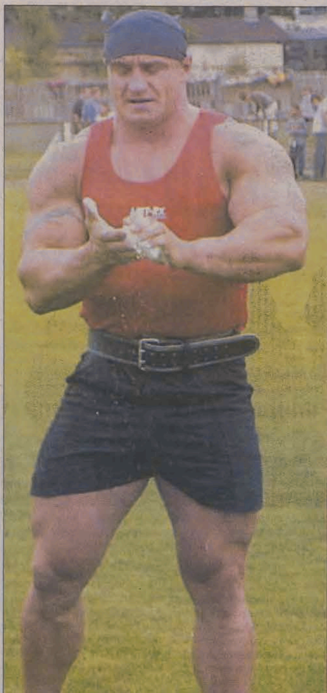
Chwilami nad stadionem nieco siąpiło, wtedy mistrz musiał szczególnie dbać, by ciężary nie wyslizgiwały mu się z rąk.