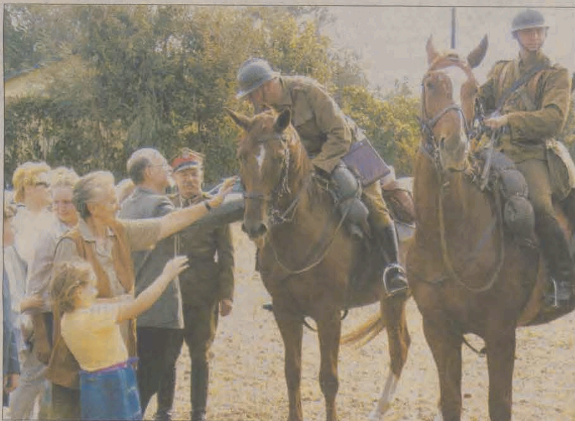
Wielkim zainteresowaniem mieszkańców Boczek Domaradzkich cieszyli się ułani, którzy przybyli do tej miejscowości w niedzielę. Skąd przybyli i kim są - czytaj na stronie 3.