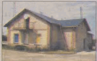
Już niebawem w tym budynku - tuż przy kościele św. Andrzeja - popołudnia spędzać będą dmosińskie dzieci.

Zarówno parafii w Dmosinie, jak i gminie zależało na tym, aby planowana do stworzenia wspólnymi siłami świątlica ruszyła jeszcze w wakacje, okazało się to jednak niemożliwe. Na razie prace remontowe zostały przerwane z uwagi na ograniczenia finansowe dmosińskiej parafii. Wyremontowano już dach, wymieniono drzwi i okna. Obecnie powstaje łazienka, a konieczne jest jeszcze położenie podłogi i wyremontowanie ścian budynku.