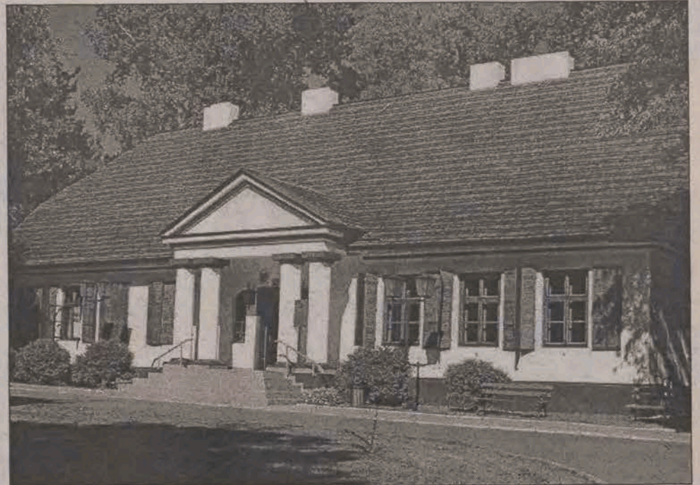
Na ścianie frontowej Dworku 19 września odsłonięta zostanie tablica pamiątkowa poświęcona generałowi Komorowskiemu ufundowana przez głownian.

Okolo godziny 15.30 uczestnicy uroczystości odwiedzą w Muzeum Miasta Głowna wystawę, poświęconą 65. rocznicy wybuchu II wojny światowej oraz 60. rocznicy Po-