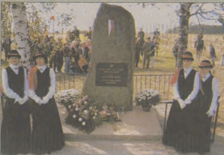
Amazonki przy obelisku w Boczkach Domaradzkich.