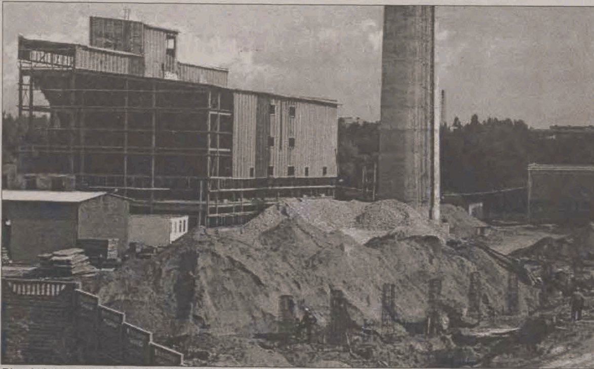
Plac byłej ciepłowni zmienia się z dnia na dzień.