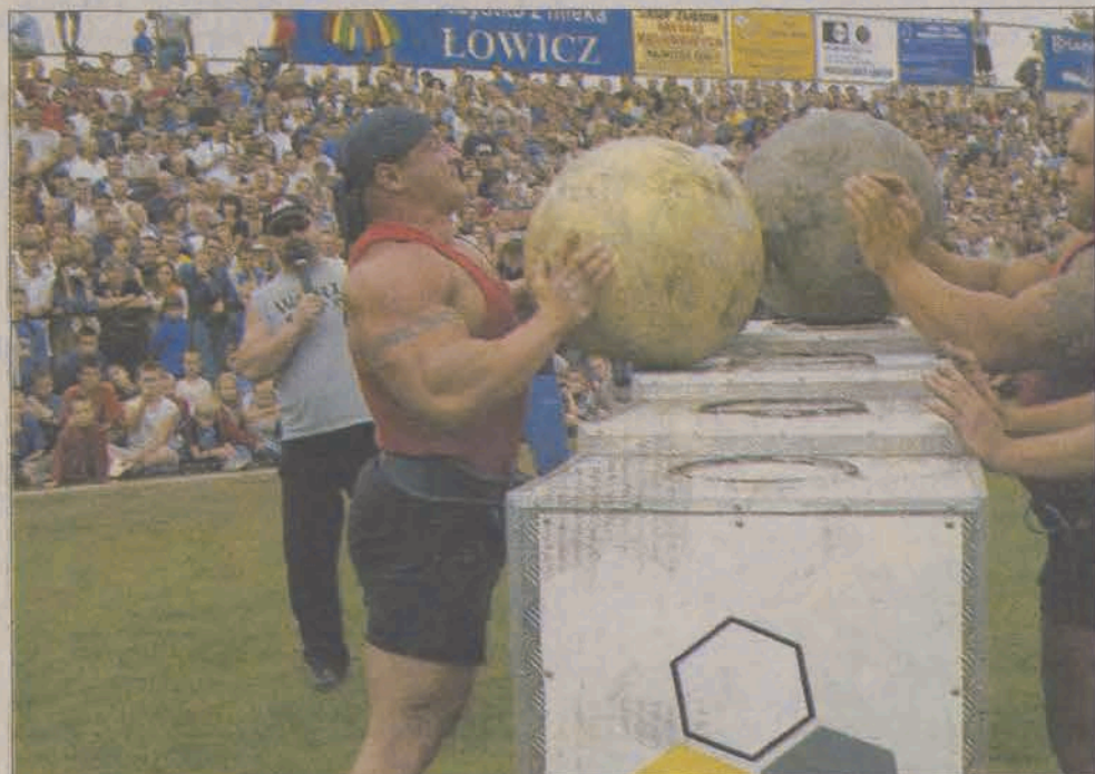
120 kilogramów waży kamienna kula, którą Pudzianowski wtacza właśnie na półkę. W głębi kula 90-kilogramowa, z którą uporał się wcześniej. Z najcięższą, 150-kilogramową też za chwilę sobie poradzi...

mentowaniem wyczynów. Widać zresztą było, iż fakt, że spotkanie prowadzi sam Pudzianowski podoba się widowni. Przyznać trzeba, że mistrz ma już duże doświadczenie w prowadzeniu tego typu pokazów: wykazał się dowcipem, cierpliwością i umiejętnością perswazji, kiedy delikatnie sugerował niektórym z osób, które źle oceniły swoje możliwości, aby jednak na dany ciężar się nie porywały. Okazał się zresztą człowiekiem miłym i komunikatywnym, a i tak wszyscy odruchowo robili dwa kroki w tył kiedy zbliżał się do nich. Postura siłacza budziła niekłamany respekt.