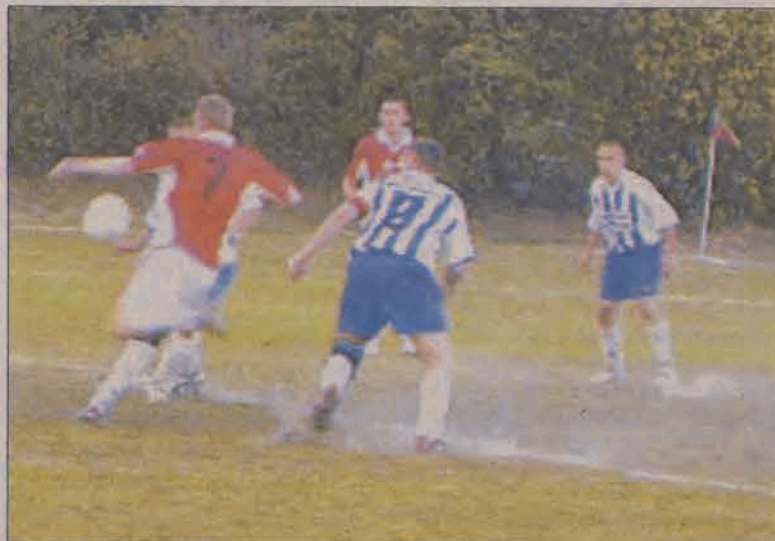
Zjednoczeni (od lewej) w kolejnym ataku na bramkę Wartkowic. Niestety, i tym razem goście wyszli z opresji obronną ręką.