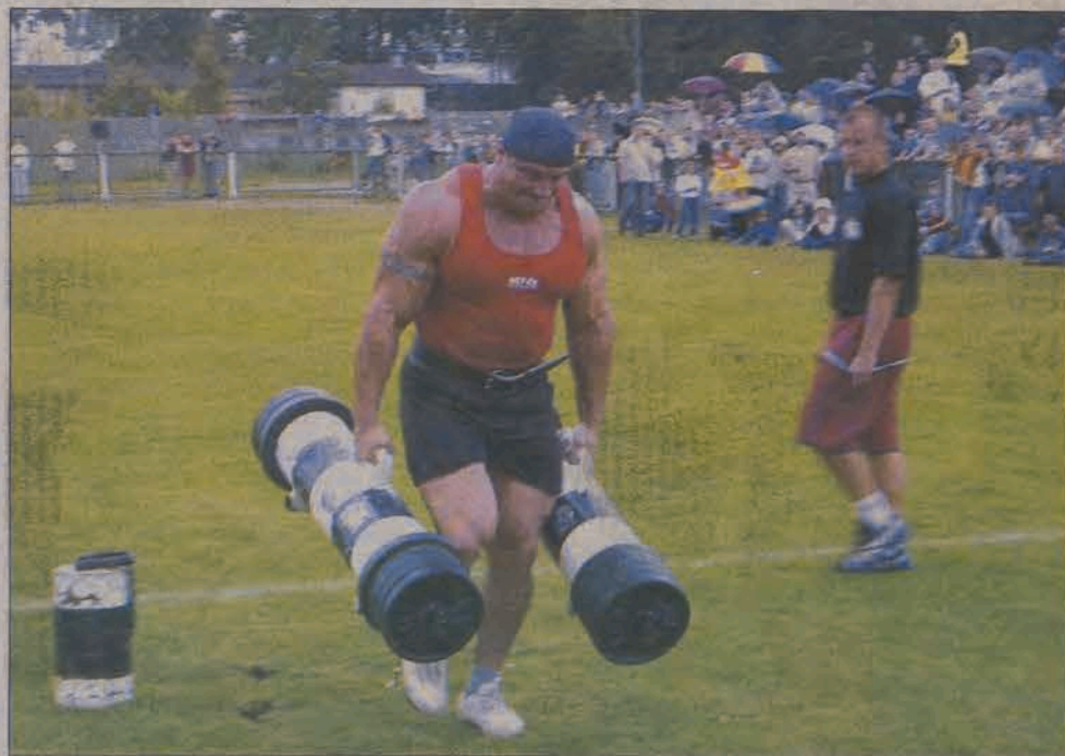
Standardowy bagaż lotniczy nie może być cięższy niż 20 kilogramów, a i tak niektórzy nie dają mu rady i wożą tobołki na wózkach. Mariusz Pudzianowski nosił w Łowiczu dwie „walizki” 140-kilogramowe.

Korzystając z okazji wyraziliśmy swój podziw dla olbrzymiej masy Pudzianowskiego. Ten podziękował grzecznie, skromnie odpowiadając, iż się stara. Spytaaliśmy, czy istotnie obwód jego bicepsu wynosi 56 centymetrów - czyli dokładnie tyle ile mierzył biceps Arnolda Schwarzeneggera, w czasach gdy wygrywał prestiżowe zawody Mister Olympia. Pudzianowski potwierdził, a na naszą sugestię, że istnieją jednak pewne różnice w budowie obydwu panów odparł, iż on waży 130 kilogramów. Dla niewtajemniczonych podajemy, że w swojej szczytowej formie Schwarzenegger ważył 113 kilogramów. Dłużej z mistrzem rozmawiać na płycie boiska nie mogliśmy, niemal cały czas zajęty był konferansjerką, zabawianiem publiczności, ko-