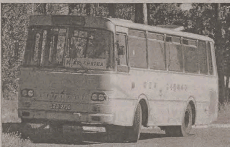
Jak długo jeszcze pojeździ?