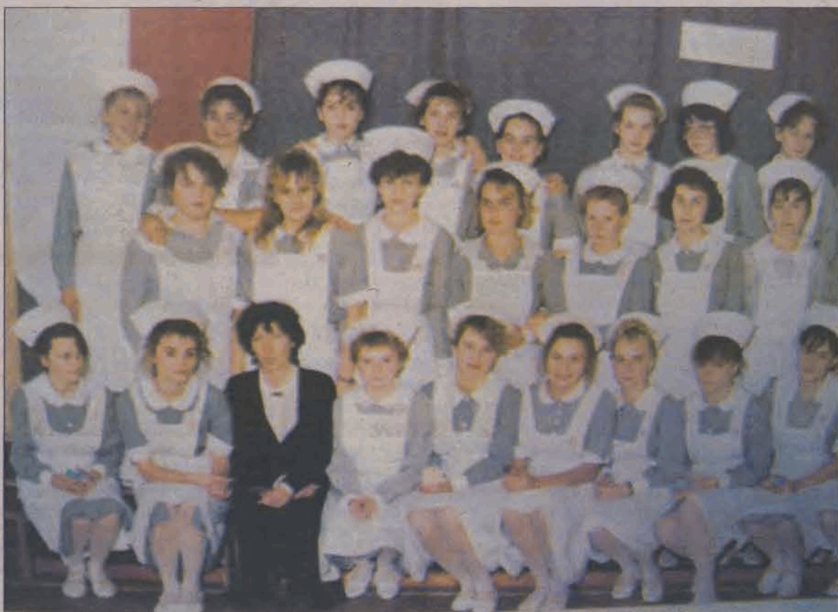
Ostatnie czepkowanie klas II w „Medyku” w roku szkolnym 1993/1994.