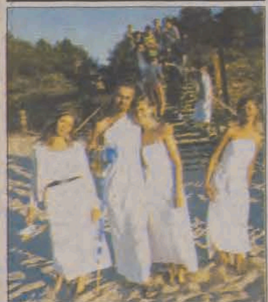
To było tak niedawno...

Łowicz, ul. Długa 2, e-mail: łowiczbs@britishschool.pl, tel.: 046 839 28 79