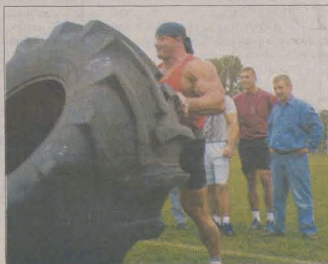
Podniesienie takiej opony zdawało się nie sprawiać człowiekowi z czarną chustką na głowie żadnego kłopotu.

słowem: idol. Chcąc być jak najbliżej siłaczy publiczność wyległa zza barierki na płytę stadionu, dostarczając (głównie małe dzieci) dodatkowych napięć ochronie. Co ciekawe, większość osób w milczeniu chłonęła widowisko,