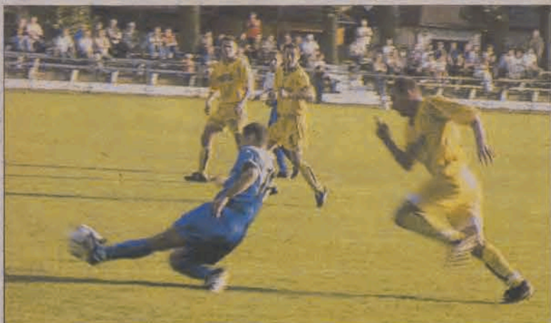
Po słabym meczu piłkarze GOSSO ulegli Drwęcej 0:2. W ataku na bramkę GOSSO, przy piłce, zawodnik Drwęcy.

Główno, 11 września. Mecz z Drwęcą miał przynieść ekipie GOSSO kolejne trzy punkty i zapewnienie miejsca w czołówce trzecioligowych rozgrywek. Było jednak wiadomo, że ekipa z Nowego Miasta Lubawskiego przyjedzie do Głowna przede wszystkim po to, by nie przegrać, a jeśli na to pozwoli sytuacja na boisku, to nawet