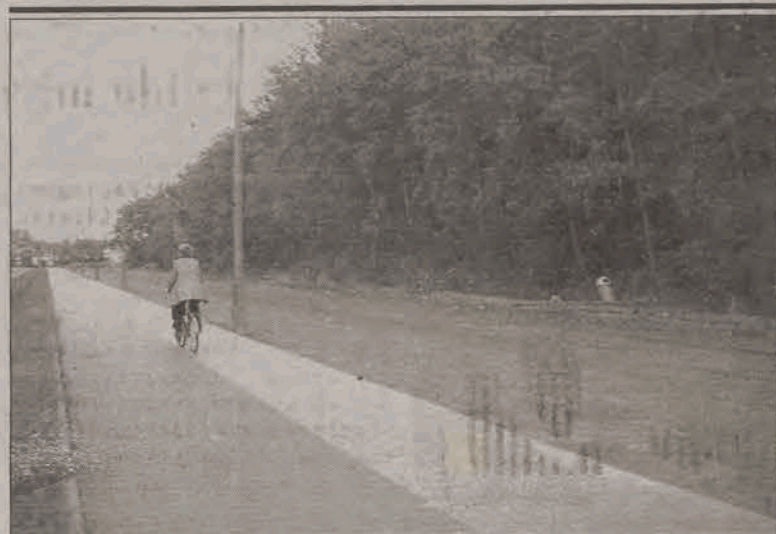
Do nowego chodnika i ścieżki rowerowej zmodernizowany parking widoczny w głębi pasowałby jak ulał.

Oba pojazdy, tj. zarówno motor Yamaha jak i Fiat Seicento zabezpieczone zostały do badań, które określić mają okoliczności zdarzenia, a także to, z jaką prędkością poruszał się motocyklista. Jak ustaliła policja, w chwili wypadku kobieta była trzeźwa. Za spowodowanie (choćby nieumyślnie) wypadku drogowego, którego następstwem jest śmierć lub ciężkie kalectwo któregoś z jego uczestników, grozi od 6 miesięcy do 8 lat pozbawienia wolności. (rpm)