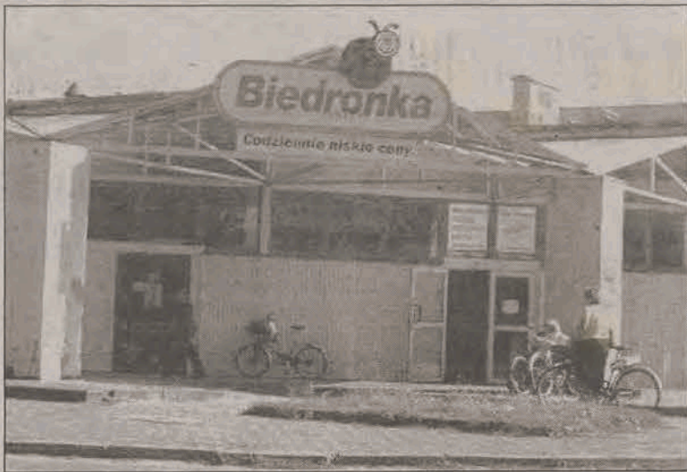
BIEDRONKA PRZESTANIE STRASZYĆ. Pawilon handlowy „Biedronka” przy ul. Kopernika przestanie straszyć zniszczoną i pomazaną przez pseudograficarzy elewacją. Ściany zyskują świeżą, żółtą barwę. Na razie pomalowana została elewacja od strony ul. Kopernika, a na dachu i nad wejściem głównym do pawilonu pojawiły się nowe znaki firmowe dyskontu.