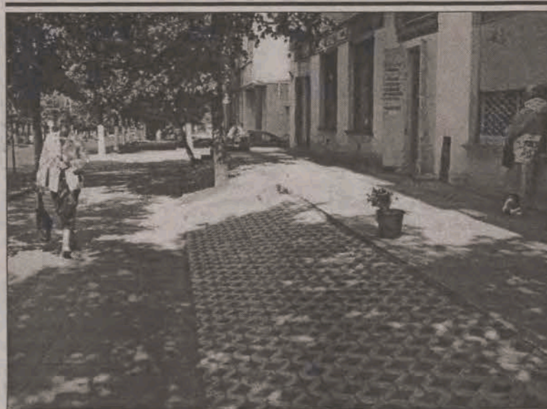
UTWARDZONO SKARPE. Pod koniec sierpnia głowieńska Spółdzielnia Mieszkaniowa utwardziła skarpe podtrzymującą chodnik wzdłuż ciągu sklepów przy ul. Swoboda. Ażurowe płyty zapobiegają osuwaniu się ziemi i poprawiają estetykę jednej z głównych ulic miasta.