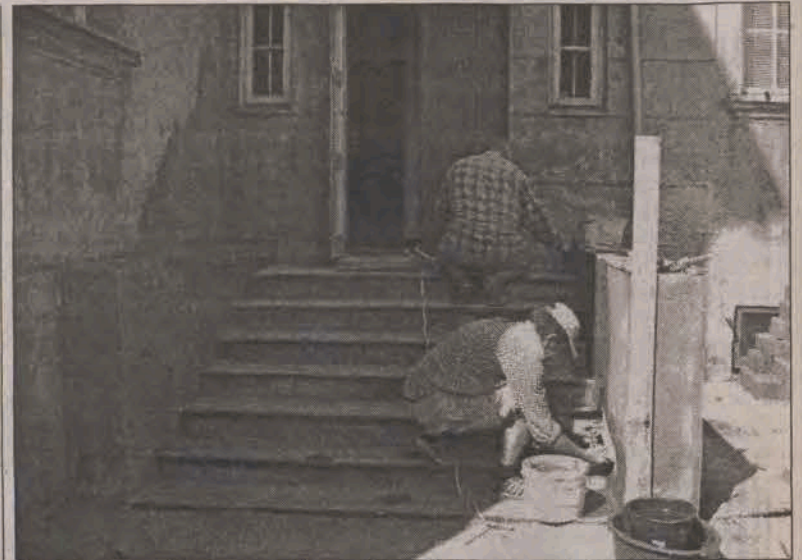
Jeszcze przed rozpoczęciem roku szkolnego w „Jedynce” poprawiono schody wejściowe od strony kuchni.