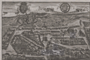
WIDOK ŁOWICZA, 1617, Georg Braun, Frans Hogenberg (1535-1590), LOVICENSIS CIVITAS QUAE EST... z Civitates Orbis Terrarum, Kolonia 1617, tom VI, 33 x 49 cm.

Po konsultacjach Łowicki Ośrodek Kultury przystąpił jednak, wbrew wcześniejszym zamierzeniom, do licytacji grafiki - widoku Łowicza z 1617 roku autorstwa G. Brauna i F. Hogenberga.