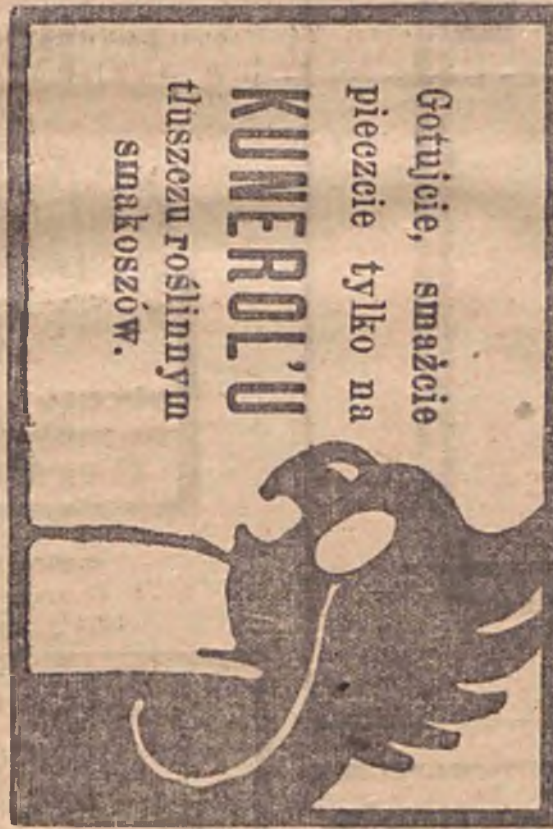
Przedstawicielstwo: Sp. Akc. Lambert i Krzyżak, Warszawa, Niemiańska 8.

prowadzonych od 1870 r. w Łęczycy i w Łodzi ul. Andrzeja № 10.